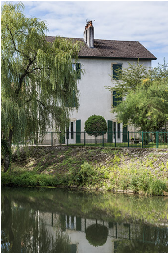
La maison Zimmerman.