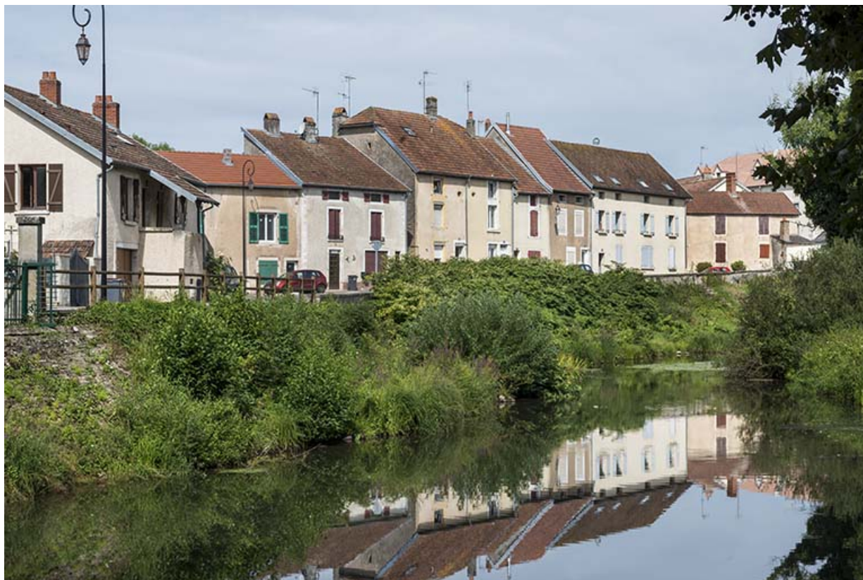
Rue de la Rezelle.