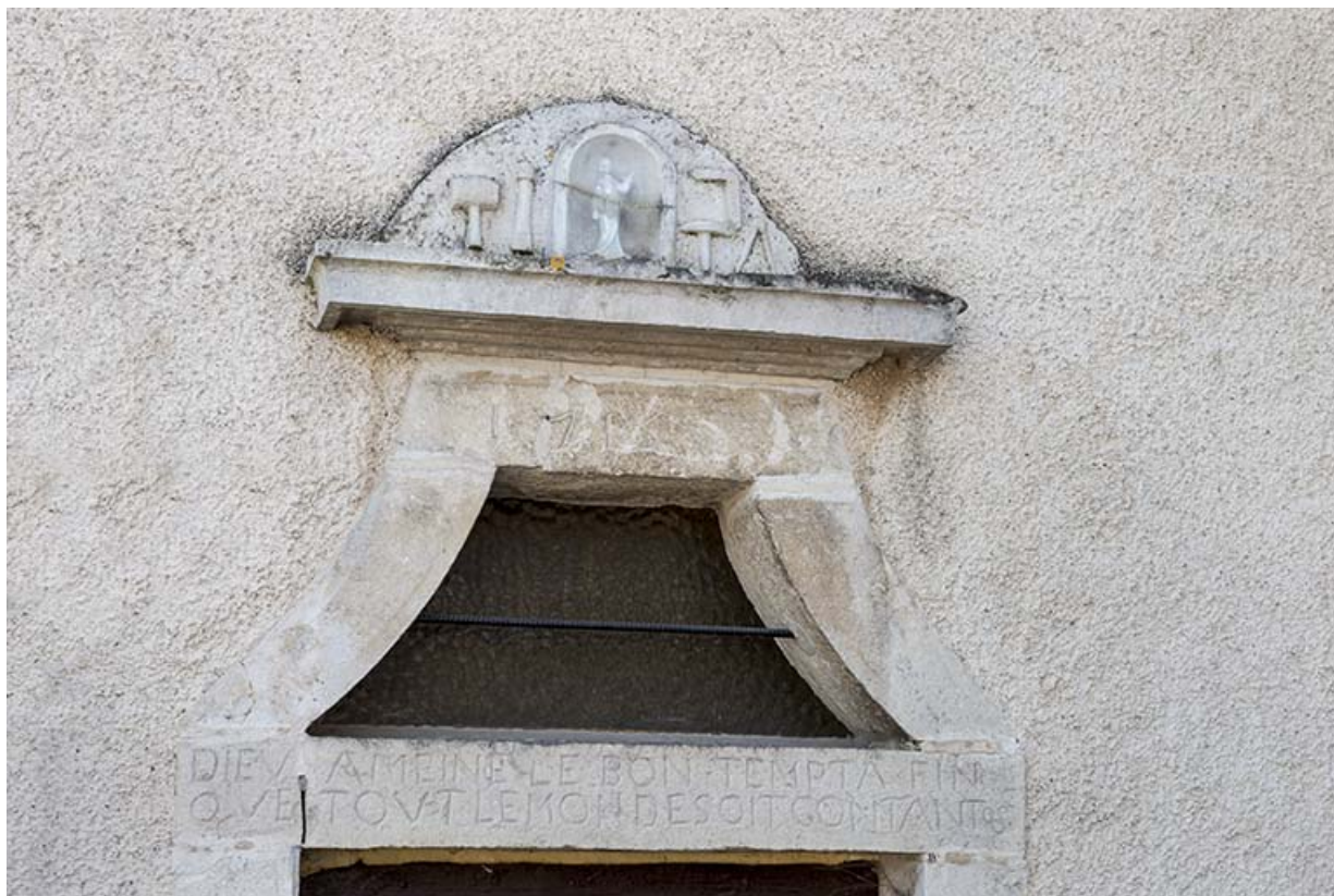
Détail du linteau avec ses inscriptions.