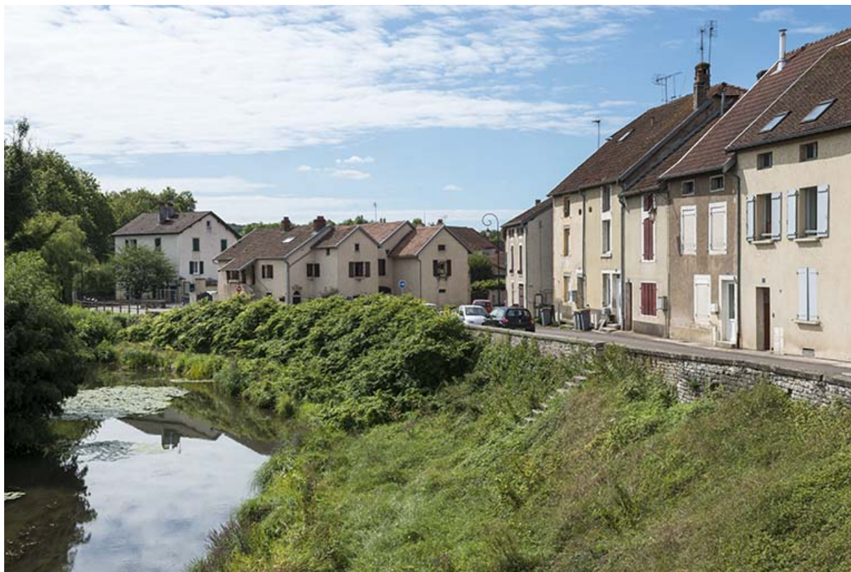
Vue d'ensemble de l'habitat depuis la route nationale. 70, Port-sur-Saône