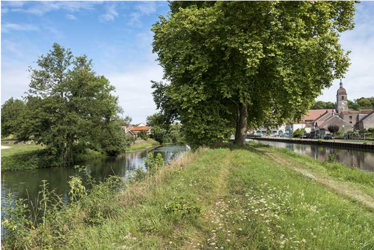
La digue avec l'île de la Rezelle sur la gauche.