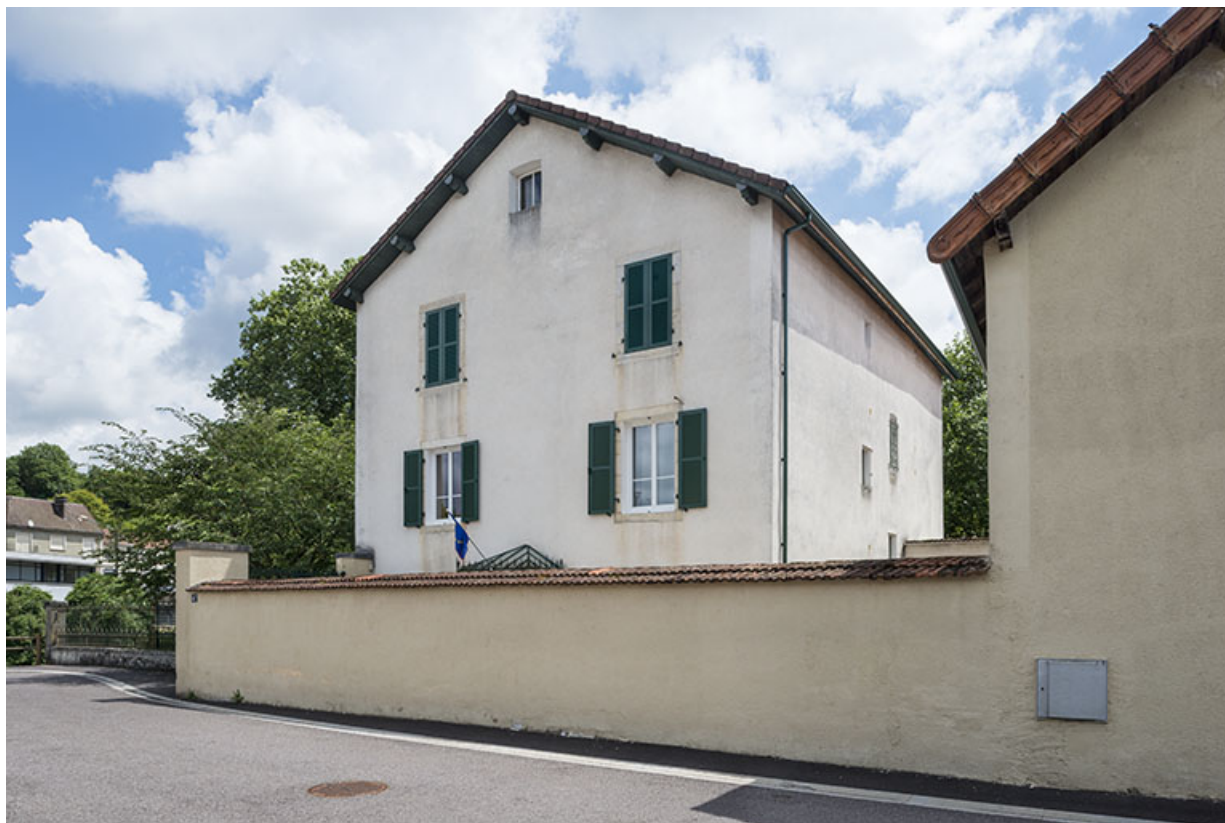
La maison Zimmerman depuis la rue de la Rezelle. 70, Port-sur-Saône