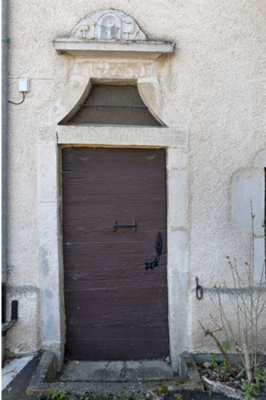
Porte, n°8 rue de la Rezelle.