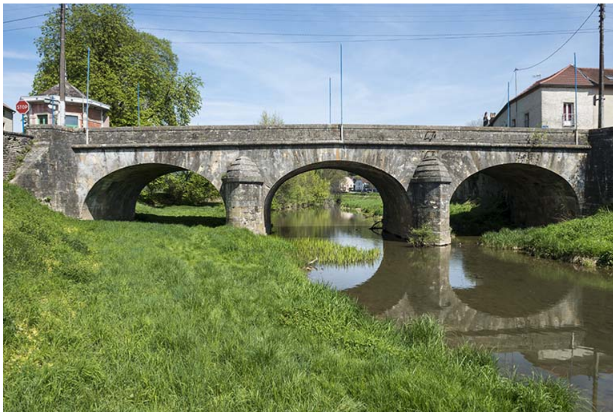
Le pont entre l'île du château et le quartier du Rezelle.