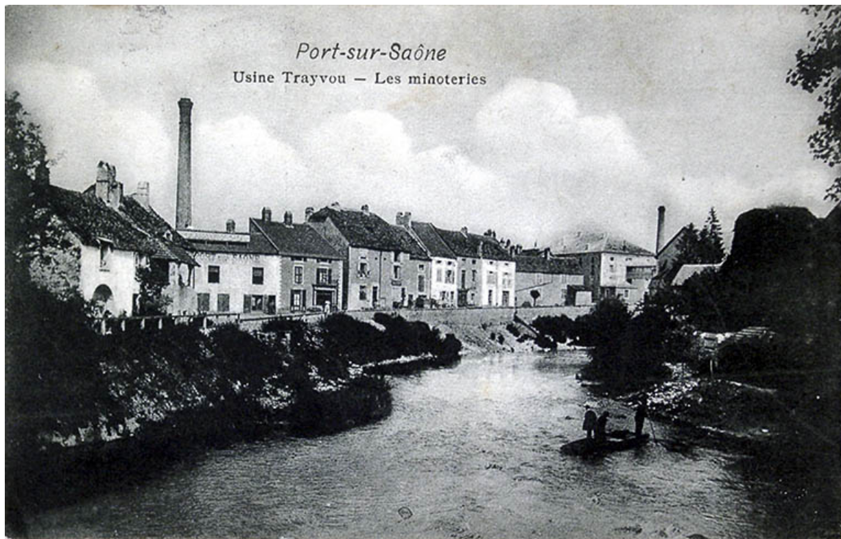
Le quartier de la Rezelle, vue générale, carte postale. 70, Port-sur-Saône