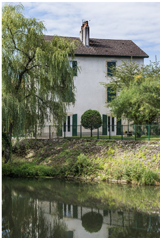
La maison Zimmerman.