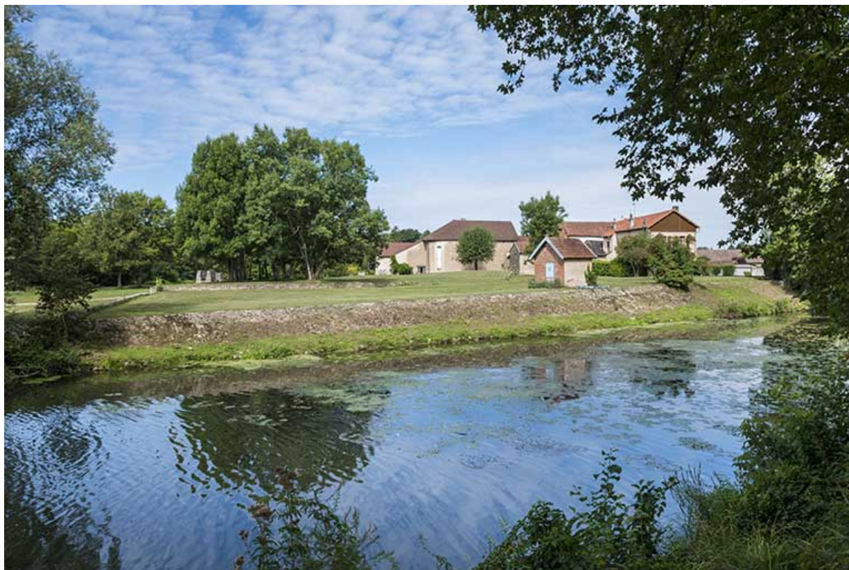
Sud de l'île, vue depuis la digue.