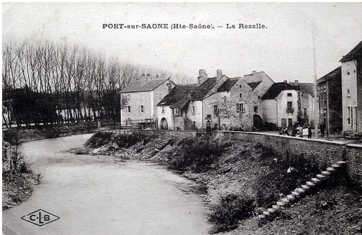
Vue sur l'île depuis le pont.