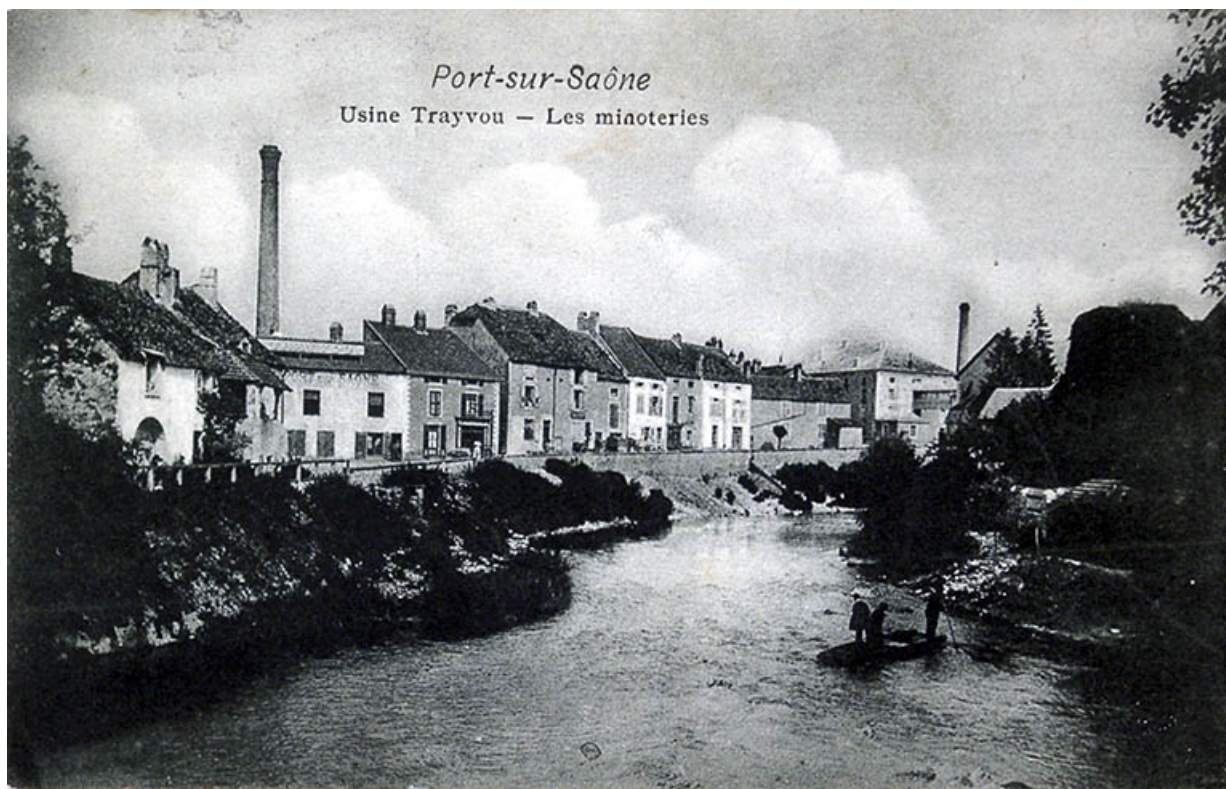
Le quartier de la Rezelle, vue générale, carte postale. 70, Port-sur-Saône