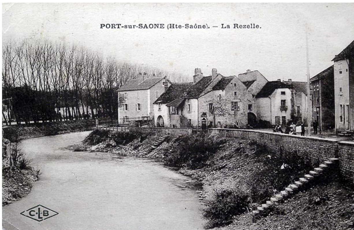
Vue sur l'île depuis le pont.