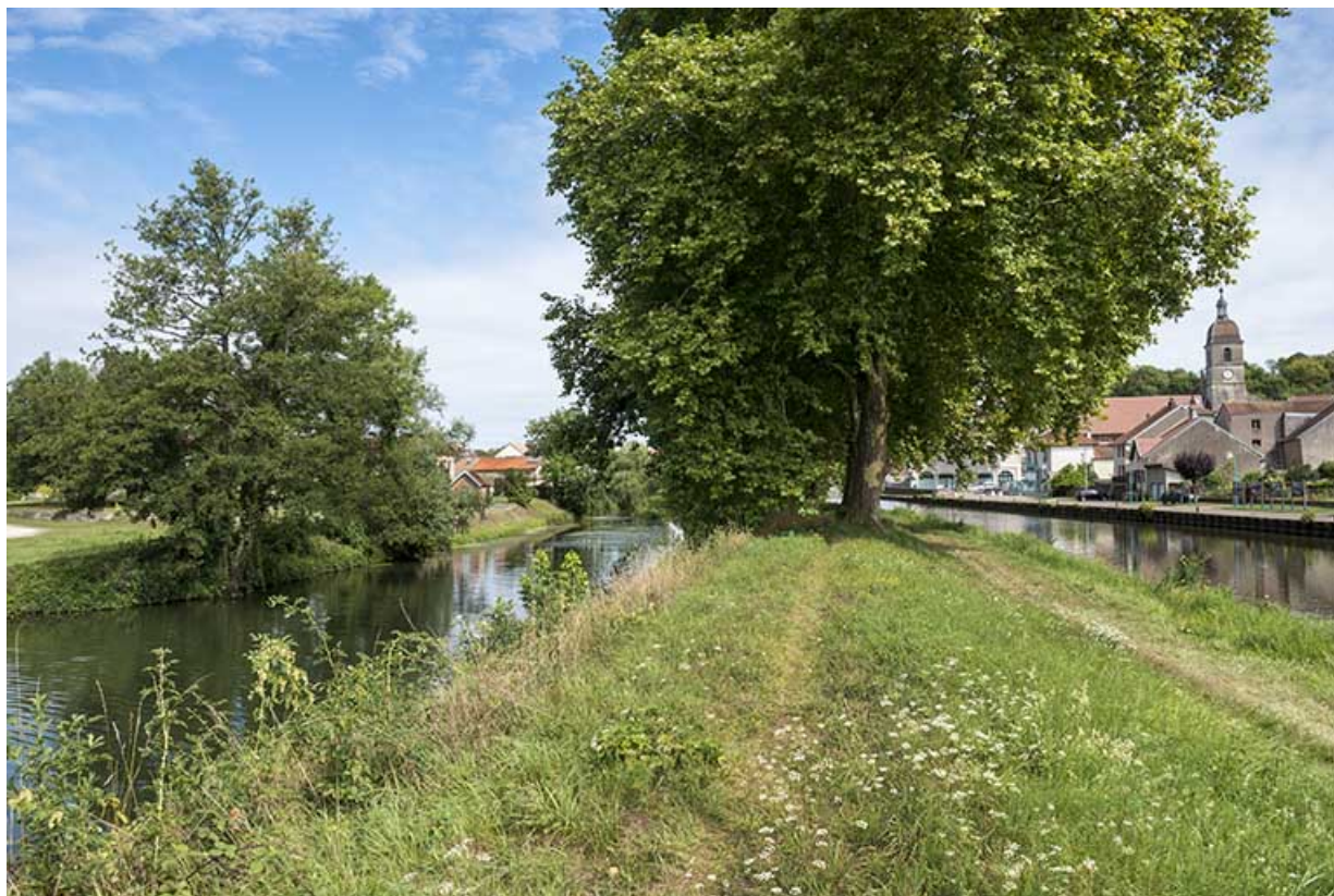
La digue avec l'île de la Rezelle sur la gauche. 70, Port-sur-Saône