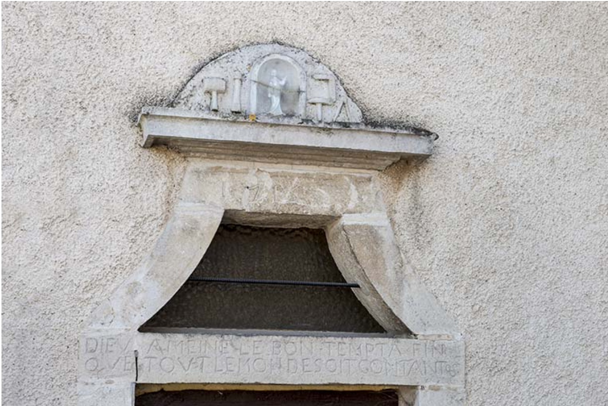
Détail du linteau avec ses inscriptions.