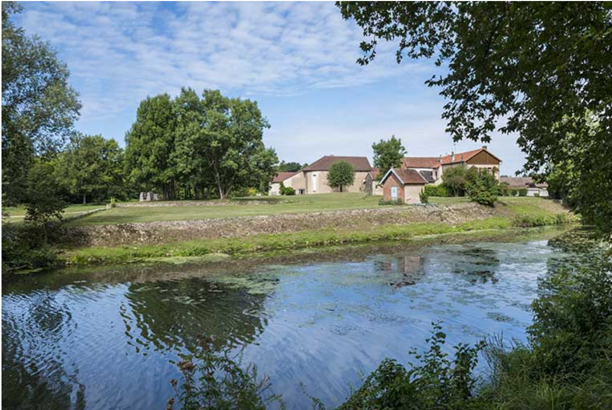
Sud de l'île, vue depuis la digue.