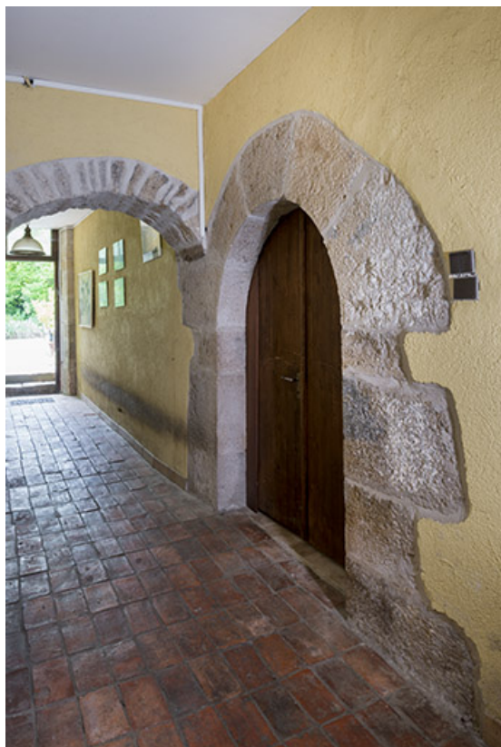
Porte encadrée de pierre de taille, rez-de-jardin. 70, Port-sur-Saône, 14 rue de l' Église