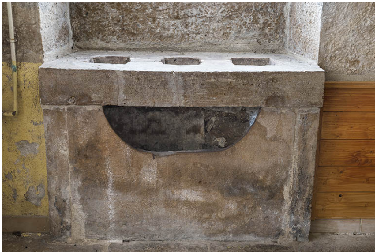
Le potager, placé sous la fenêtre.