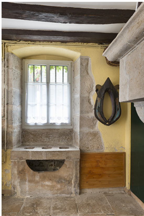
Fenêtre de la cuisine, façade sur rue de l'Eglise.