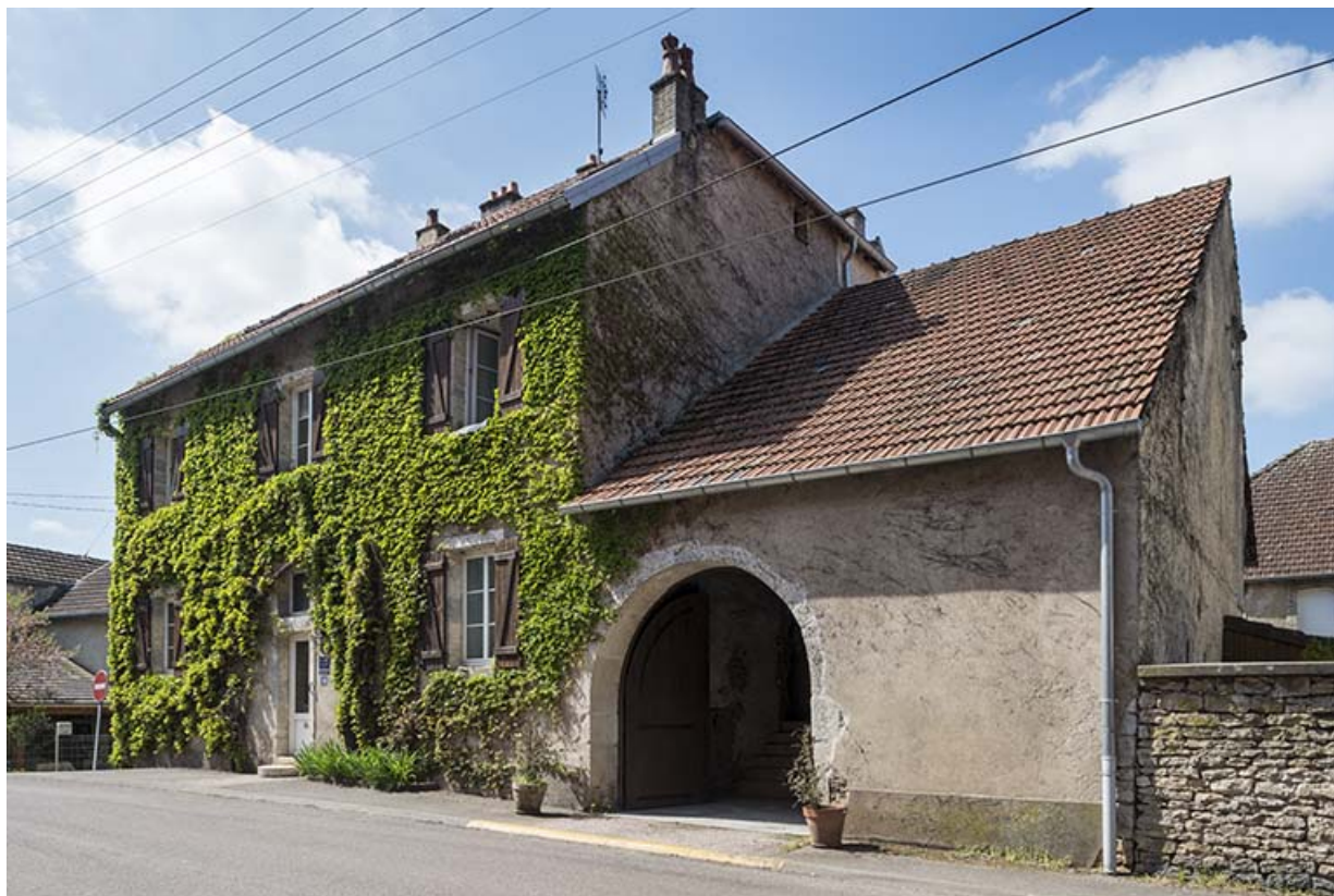
La grange, adossée au mur pignon Nord.