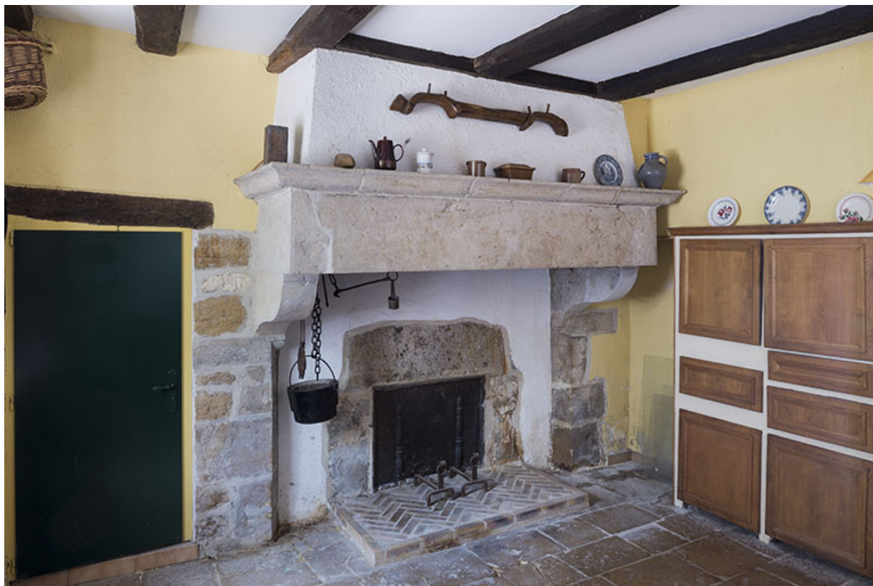
Cheminée de la cuisine, rez-de-jardin.