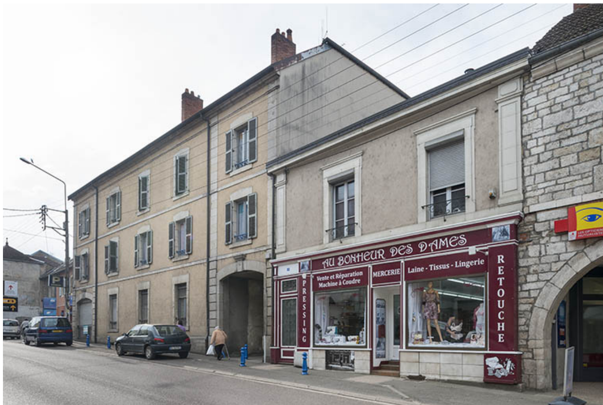
Commerces et anciens entrepôts "Madiot". 70, Port-sur-Saône rue François Mitterrand