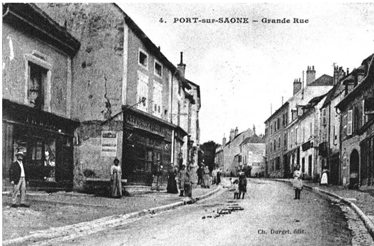
Devantures de commerces de la Grande Rue, carte postale.

70, Port-sur-Saône rue François Mitterrand