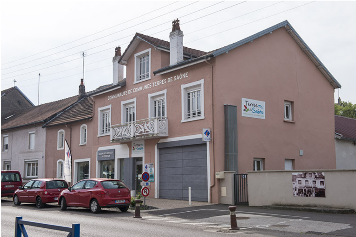
Ancienne station essence, actuellement bureaux de la communauté de communes. 70, Port-sur-Saône