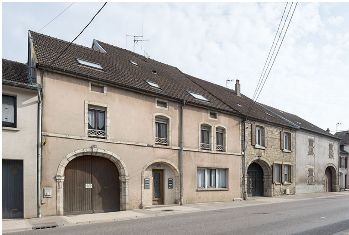
Anciennes fermes ayant conservées la travée d'accès (porte cochère).

70, Port-sur-Saône rue François Mitterrand