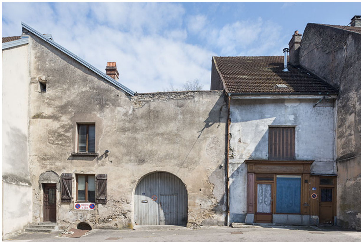
Cohabitation d'une ferme et d'une boutique, bas de la rue.

70, Port-sur-Saône rue François Mitterrand