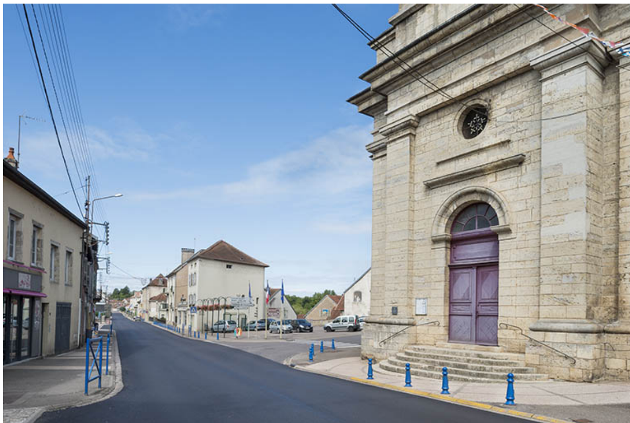
Le bas de la rue avec le portail de l'église Saint-Etienne.

70, Port-sur-Saône rue François Mitterrand