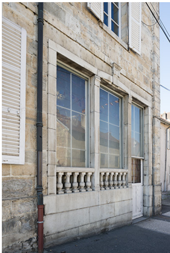
La façade réaménagée de la maison "Petit". 70, Port-sur-Saône rue François Mitterrand