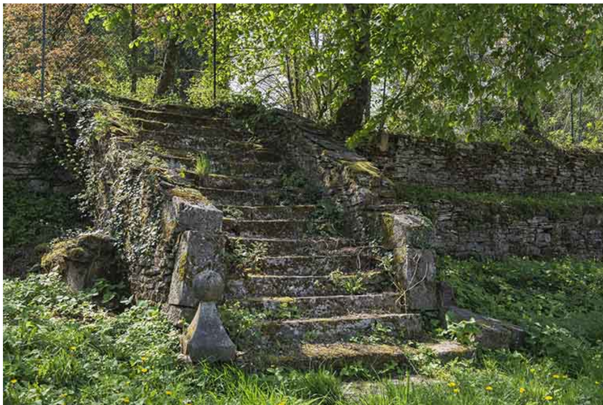
Escalier qui permettait de descendre du Tertre vers la rue principale.

70, Port-sur-Saône rue François Mitterrand