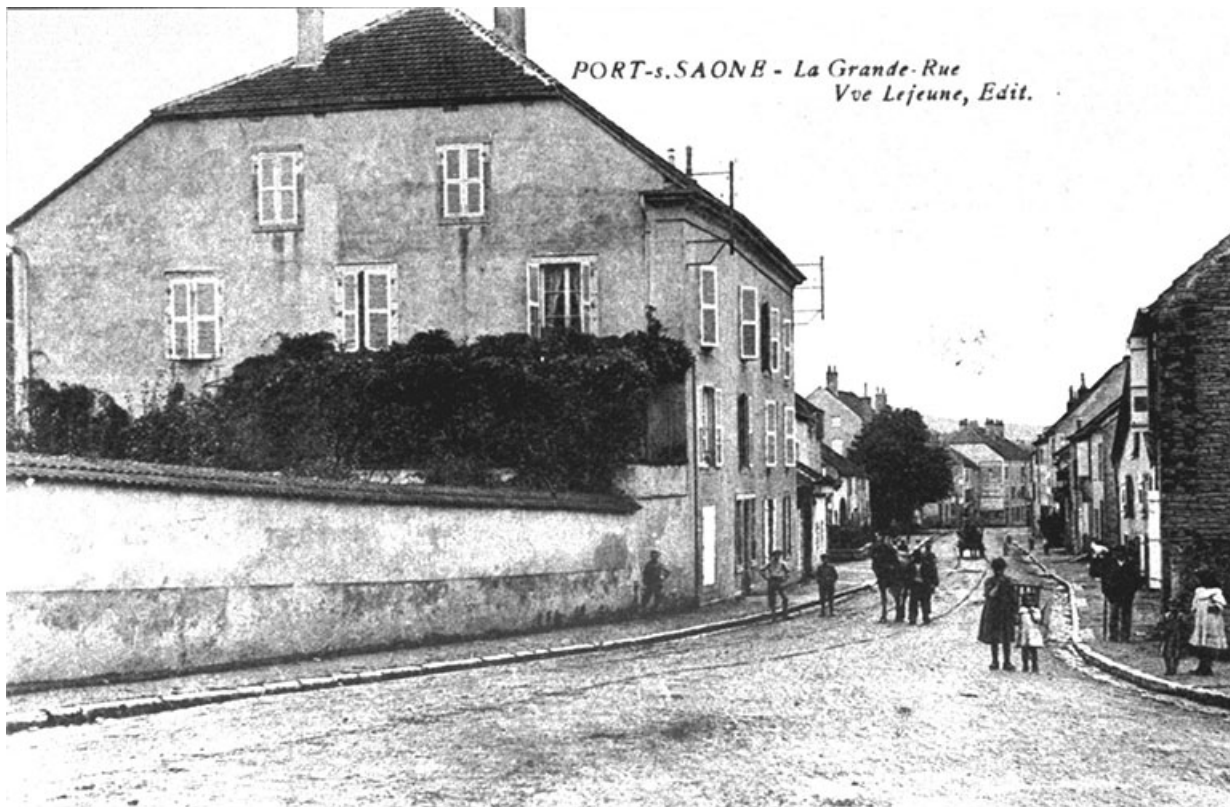
La Grande rue, carte postale.

70, Port-sur-Saône rue François Mitterrand