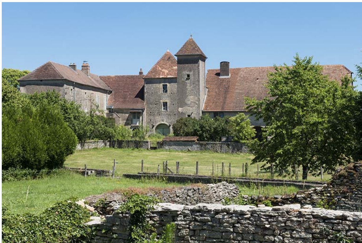
Vue générale de la maison forte.