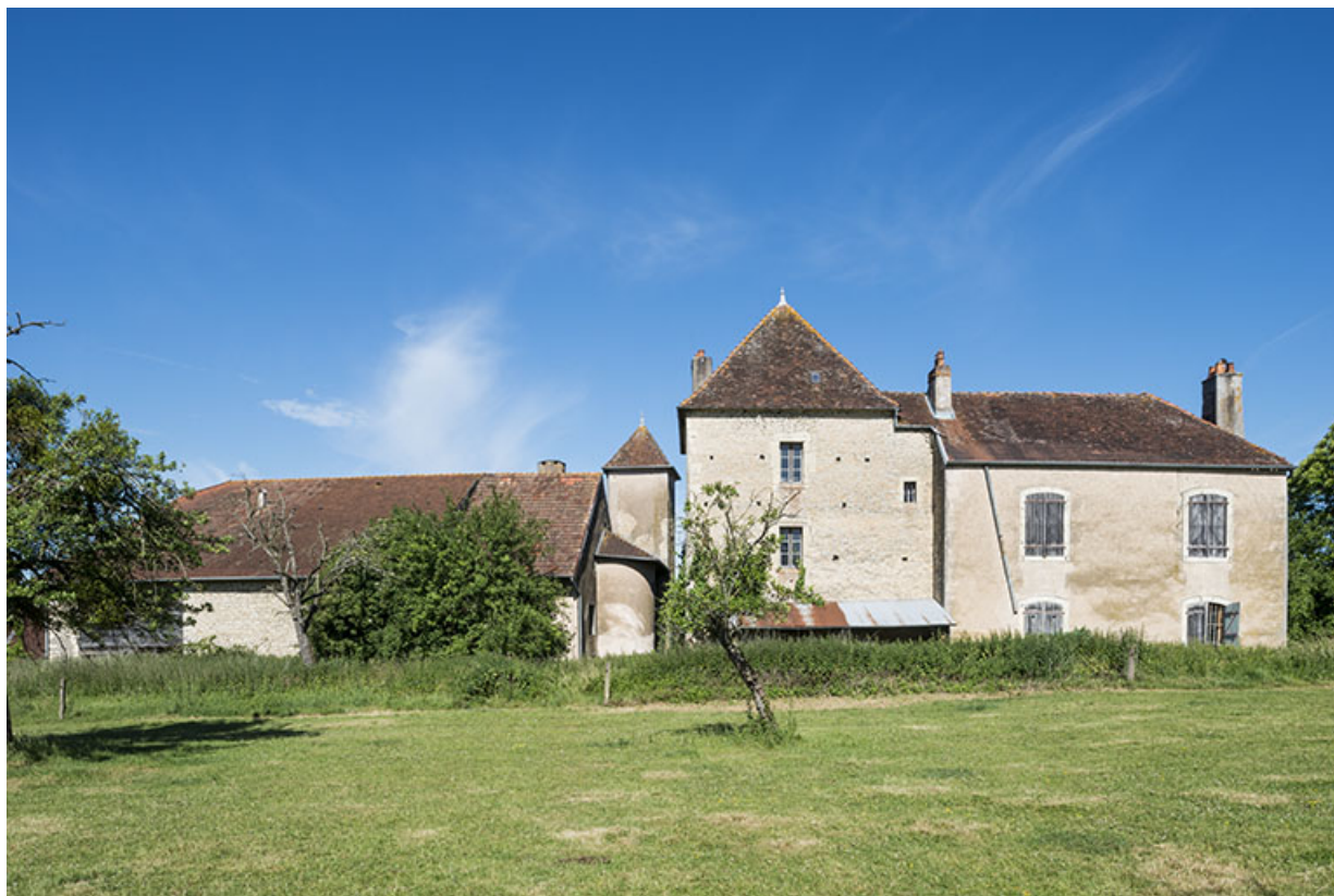
Vue d'ensemble de la façade postérieure.