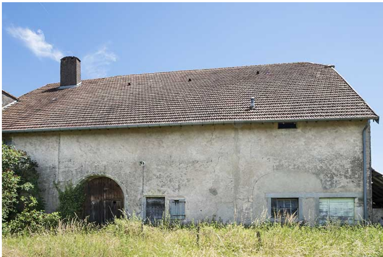
La grange et les écuries adossées au corps de bâtiment XVIe.