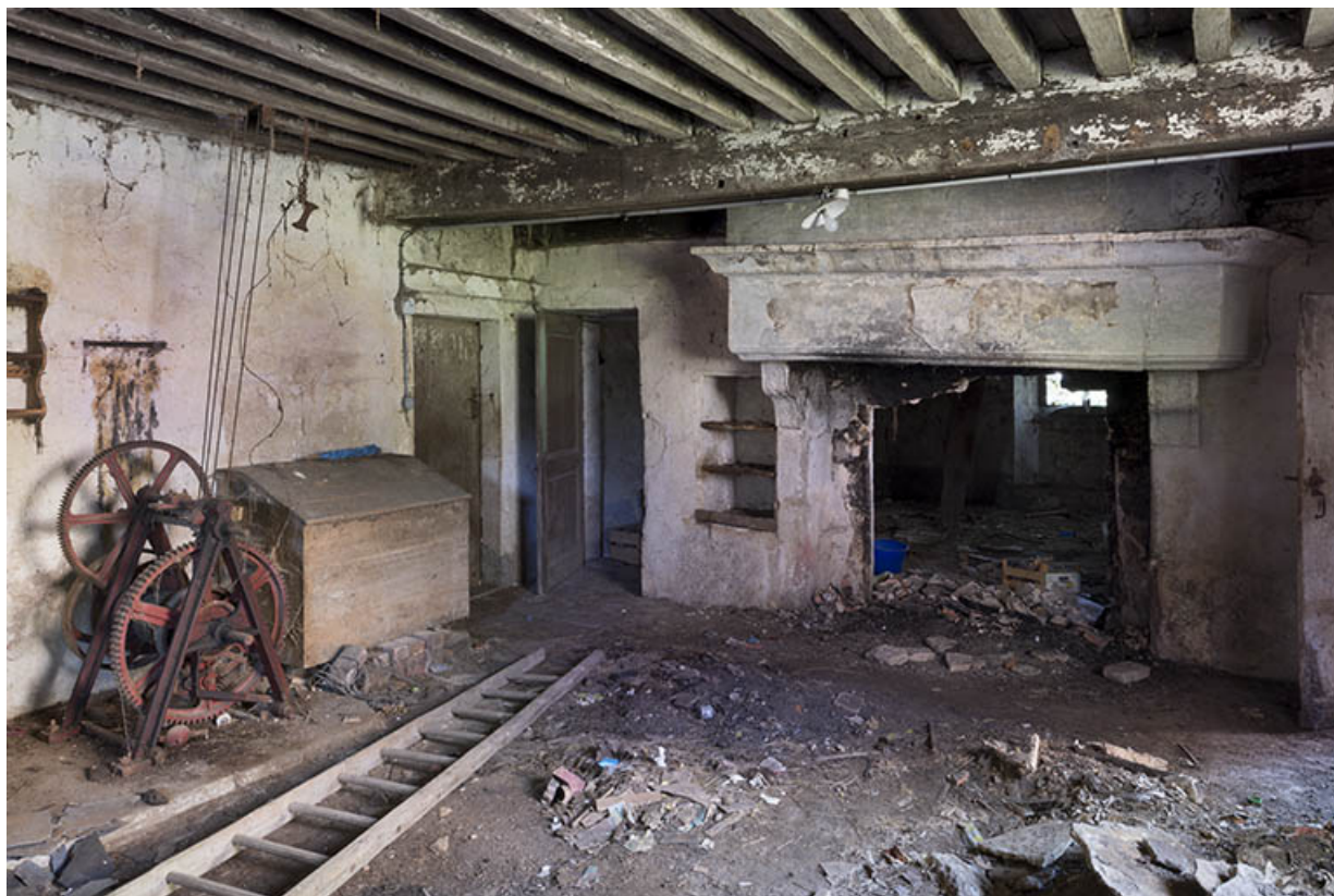
Rez-de-chaussée, logis 16e siècle.