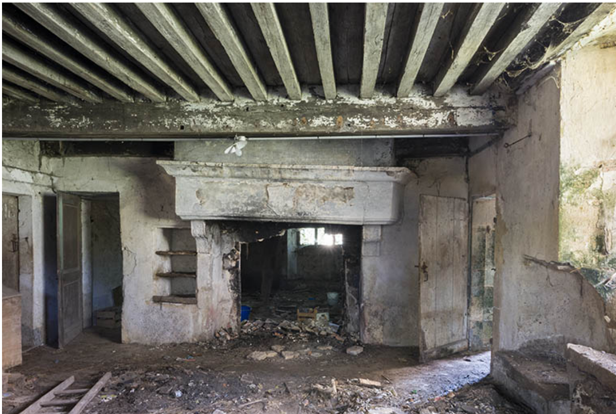
La cheminée, logis 16e siècle.