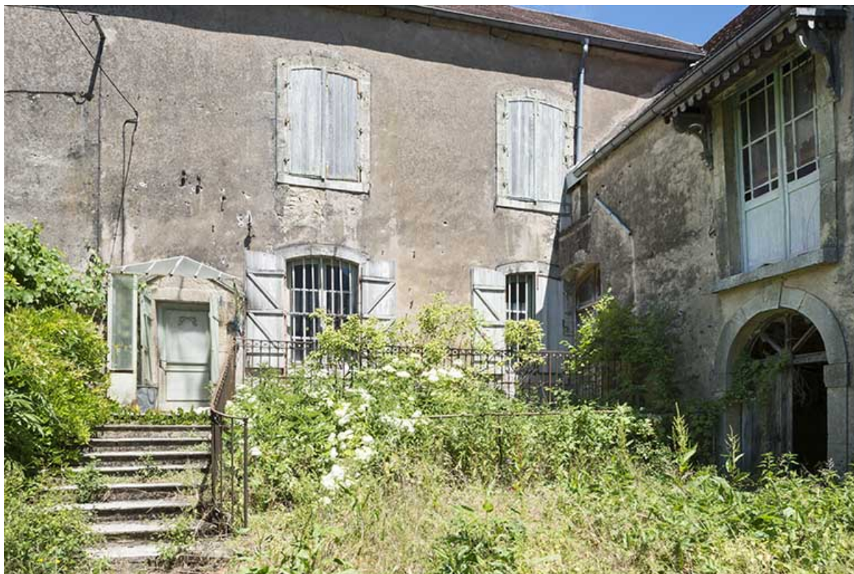
Vue de la façade sud du bâtiment XVIIIe.