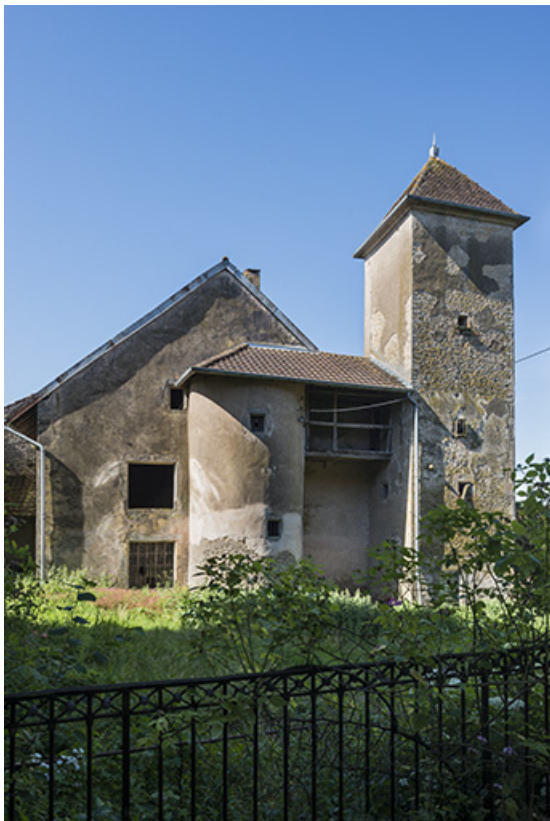
L'ensemble architectural datant du XVI e siècle : le corps de logis, la tour circulaire renfermant les escaliers et le colombier. 70, Ferrières-lès-Scey