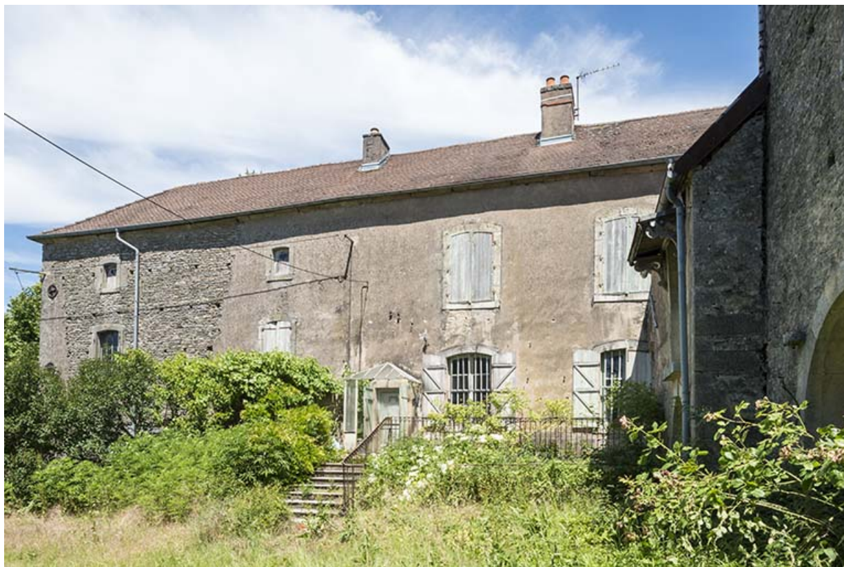
Vue de la façade sud du bâtiment XVIIIe.