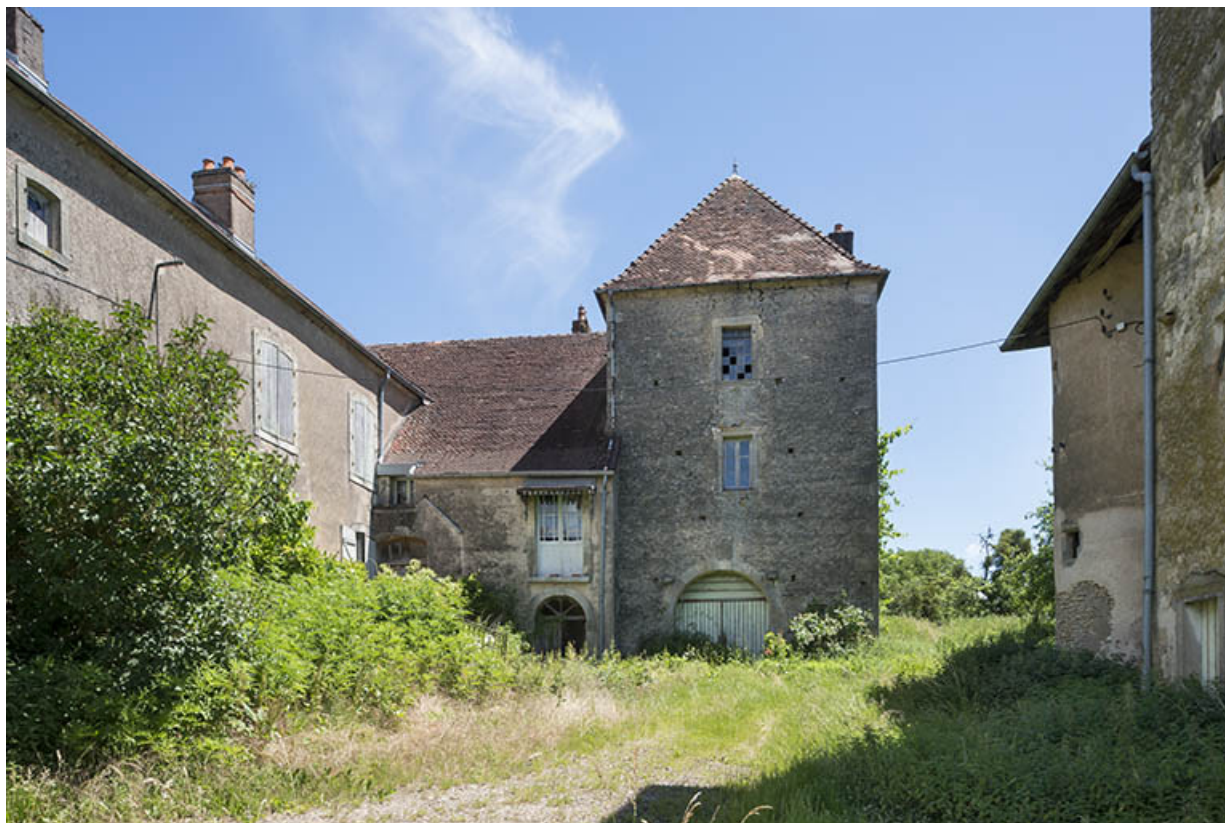
La cour intérieure de la maison forte.