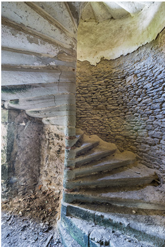
Escalier à vis, rez-de-chaussée du logis 16e siècle. 70, Ferrières-lès-Scey