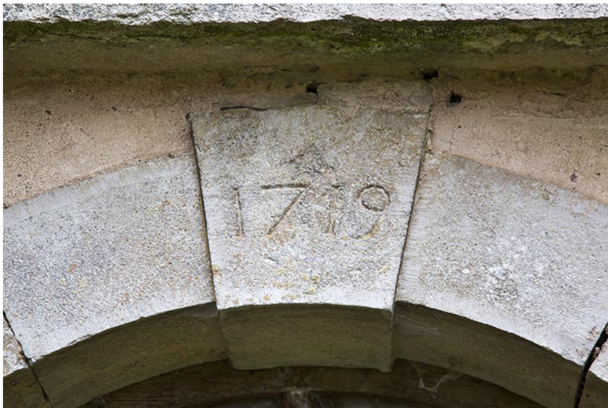
Date (1719) inscrite sur le linteau de la porte donnant accès à la cave.