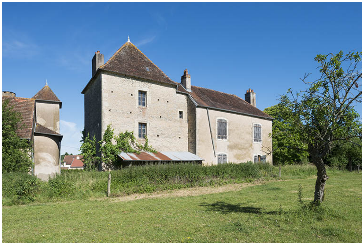
La façade postérieure du bâtiment XVIIIe.