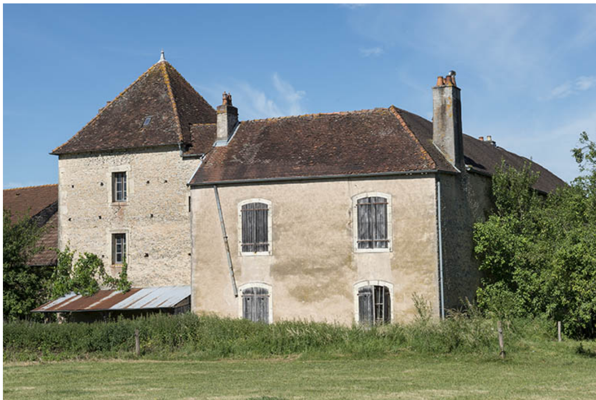
La façade postérieure du bâtiment XVIIIe.