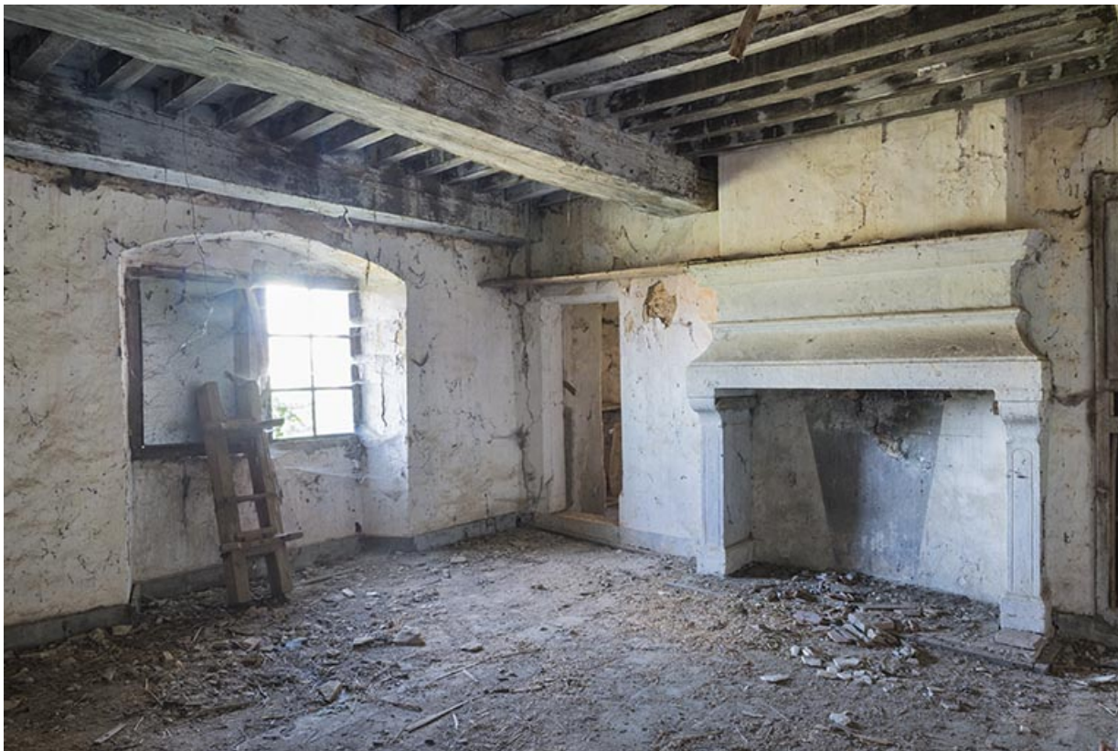
Chambre au premier étage, logis 16e siècle.