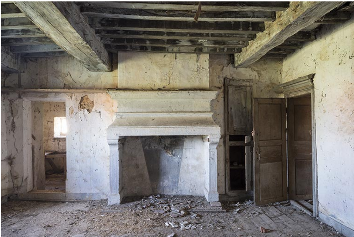
Cheminée de la chambre, logis 16e siècle.