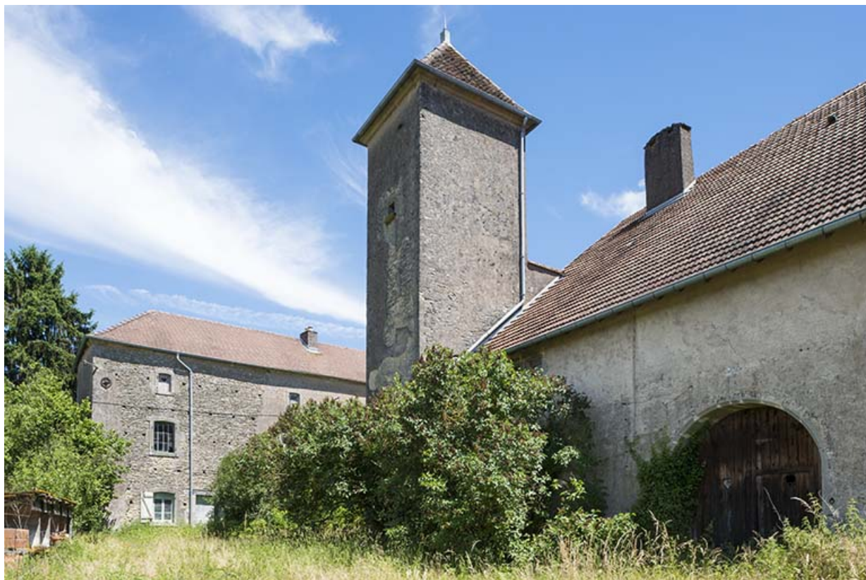
Vue générale sud-ouest du corps de bâtiment.