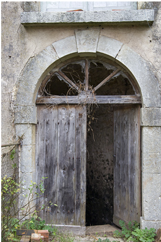
Porte donnant accès à la cave sous le bâtiment du XVIIIe siècle. 70, Ferrières-lès-Scey