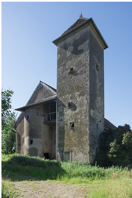
Le colombier et la tour d'escalier datant du XVI e siècle.