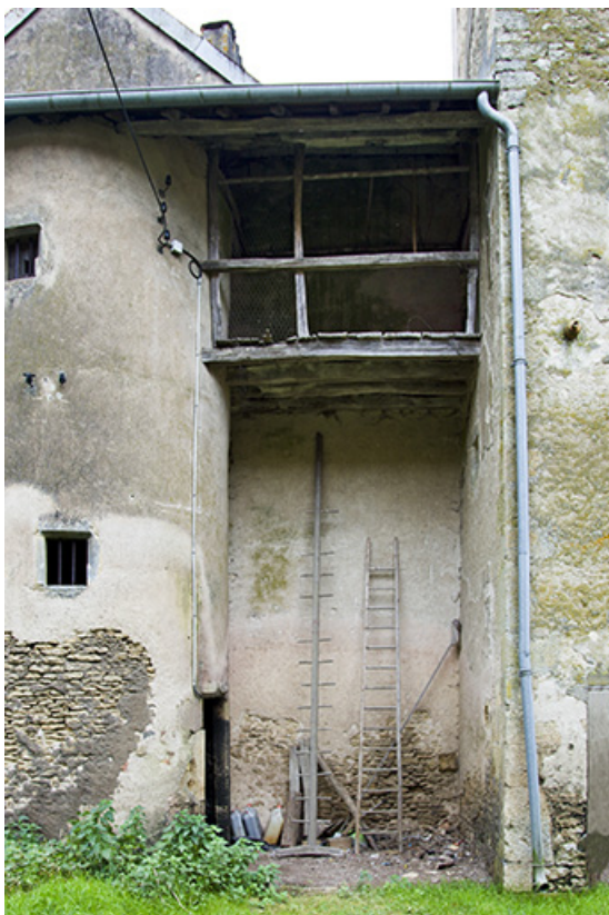
La galerie couverte reliant la tour circulaire abritant les escaliers et le colombier. 70, Ferrières-lès-Scey