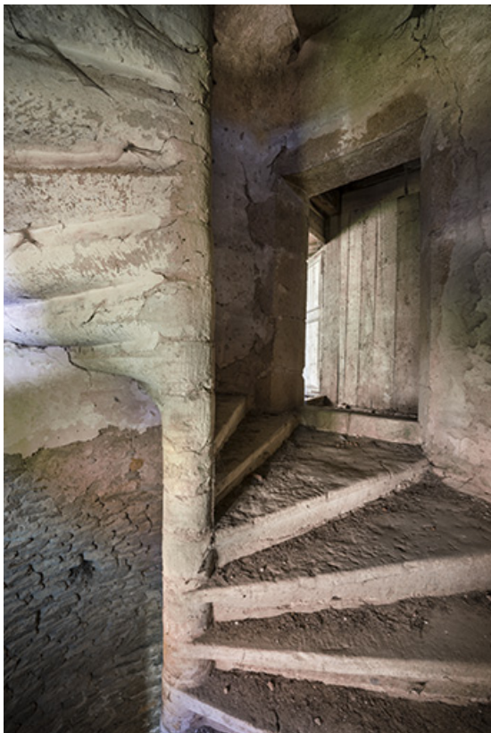
Escalier à vis, premier étage du logis 16e siècle. 70, Ferrières-lès-Scey