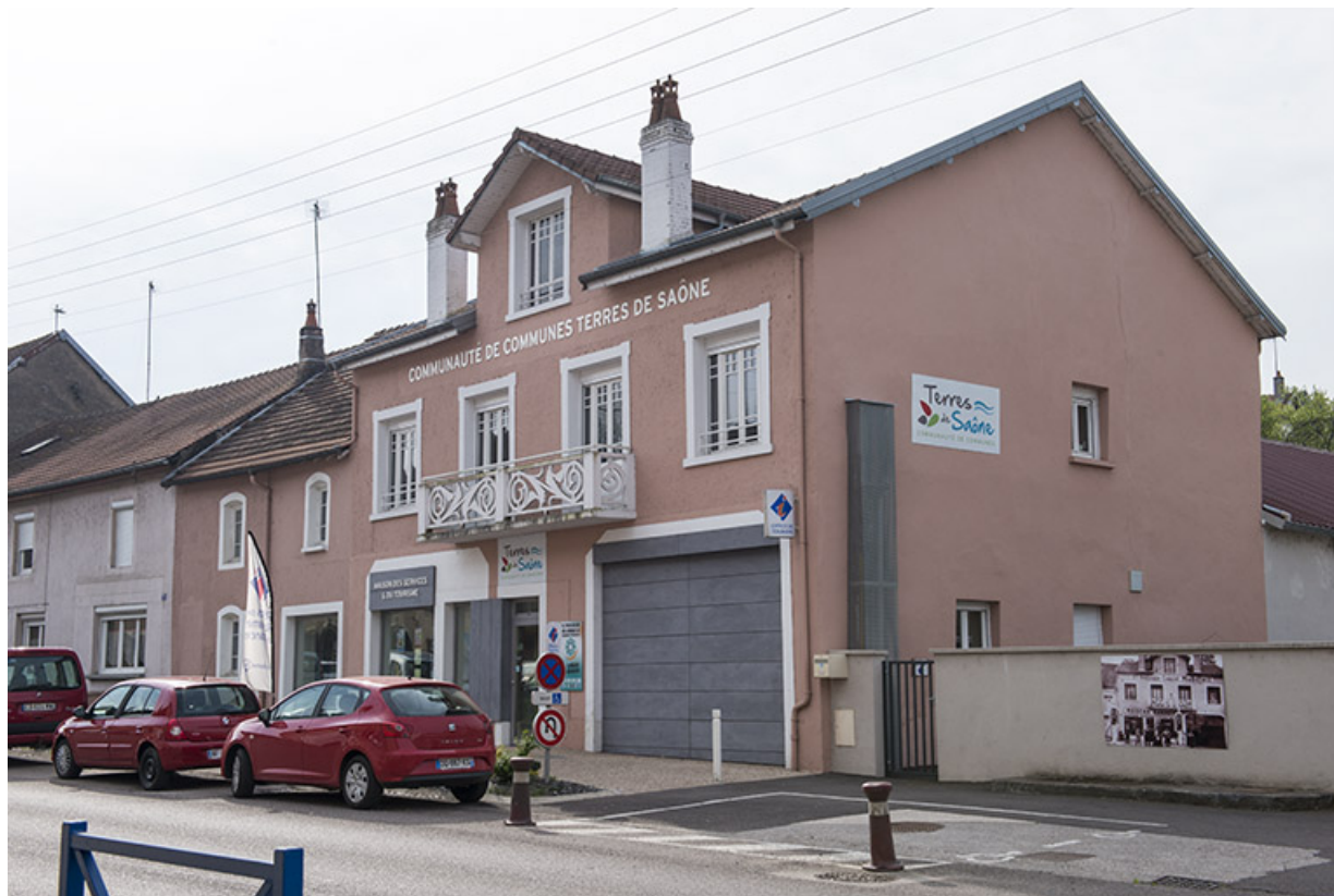
Ancienne station essence, actuellement bureaux de la communauté de communes. 70, Port-sur-Saône