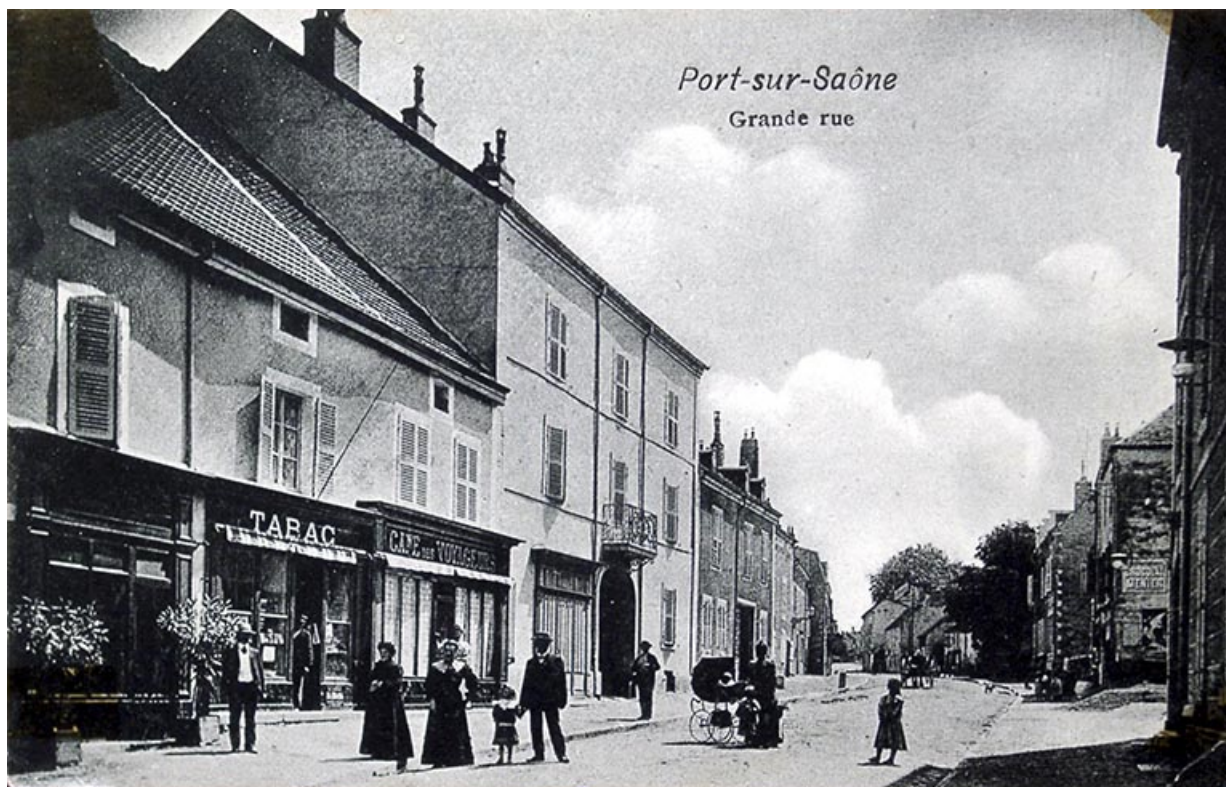
Boutiques le long de la Grande rue, carte postale.