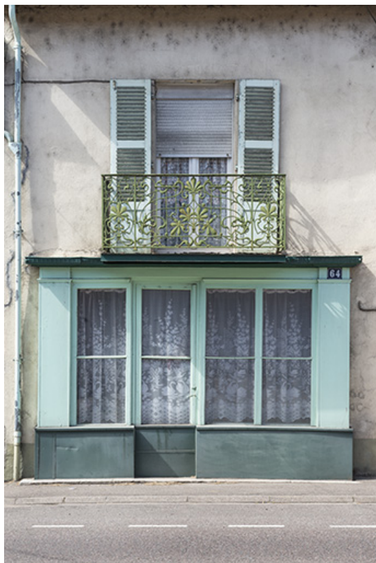
La devanture en bois.