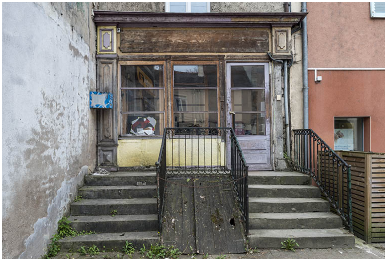
Ancienne boutique, rue F. Mitterrand. 70, Port-sur-Saône