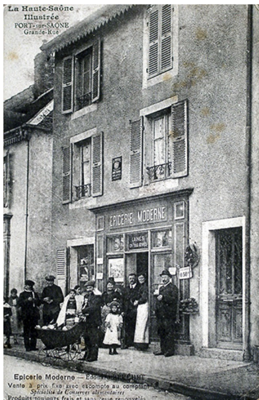
Épicerie dans la Grande rue carte postale. 70, Port-sur-Saône