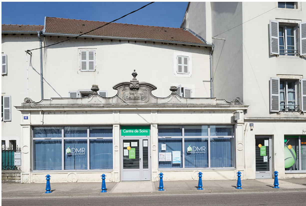
ancien commerce " le Progrès", situé en face de l'hôtel de ville. 70, Port-sur-Saône