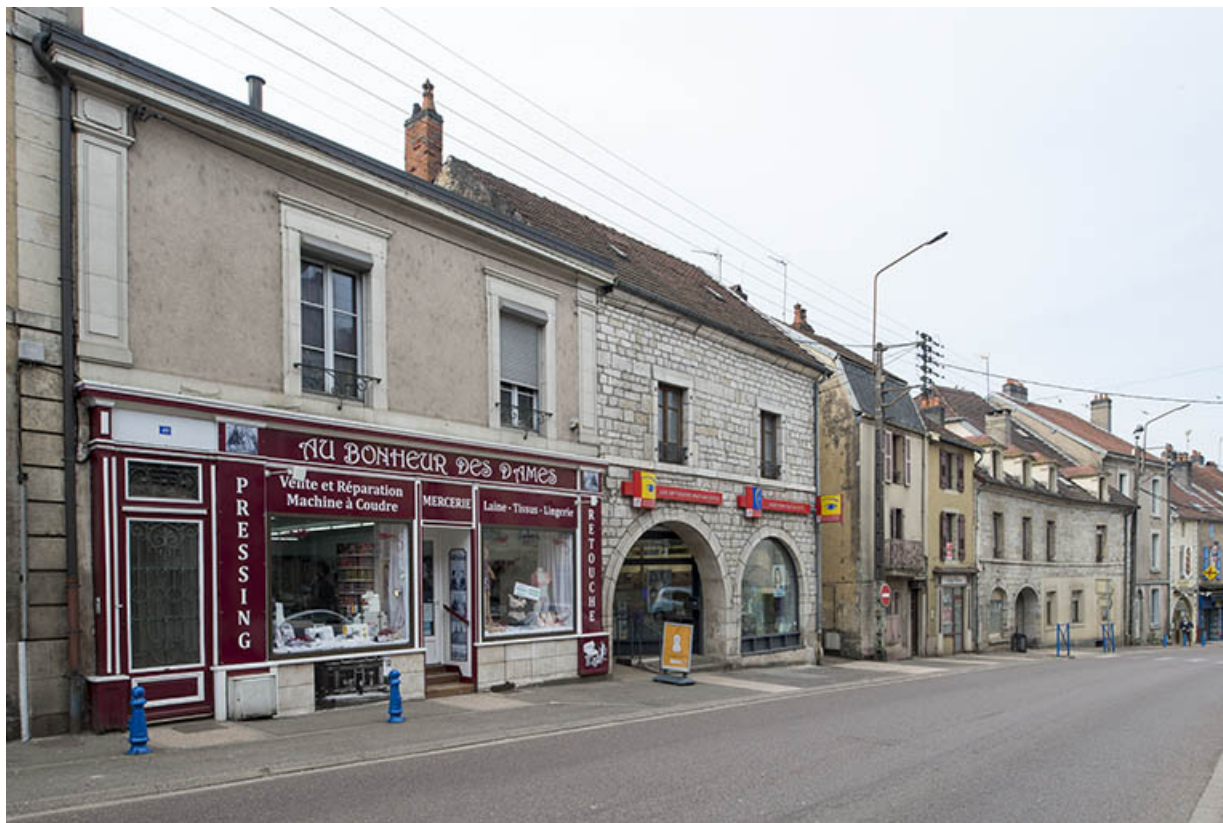
Vue actuelle du bas de la rue principale.