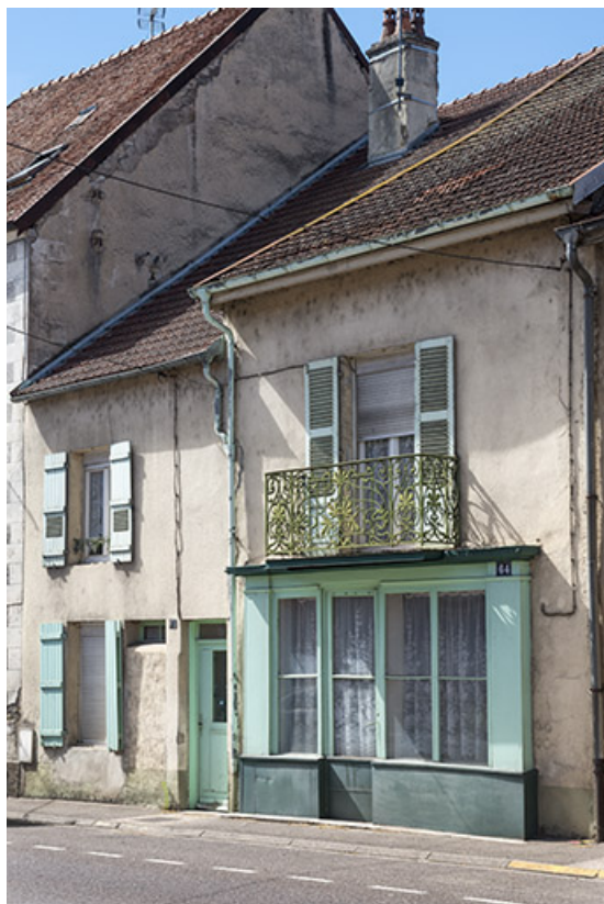
Ancienne boutique. 70, Port-sur-Saône