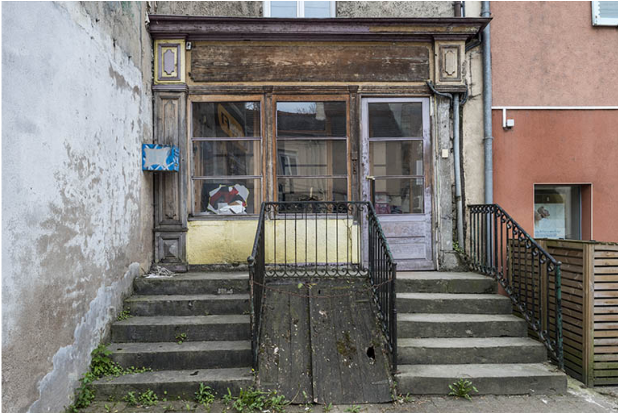
Ancienne boutique, rue F. Mitterrand. 70, Port-sur-Saône