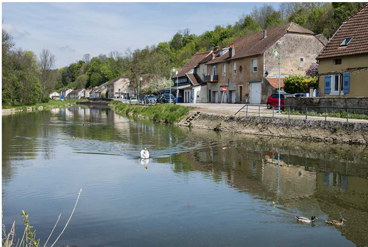
Le canal longeant la rue de la Fontaine. 70, Port-sur-Saône