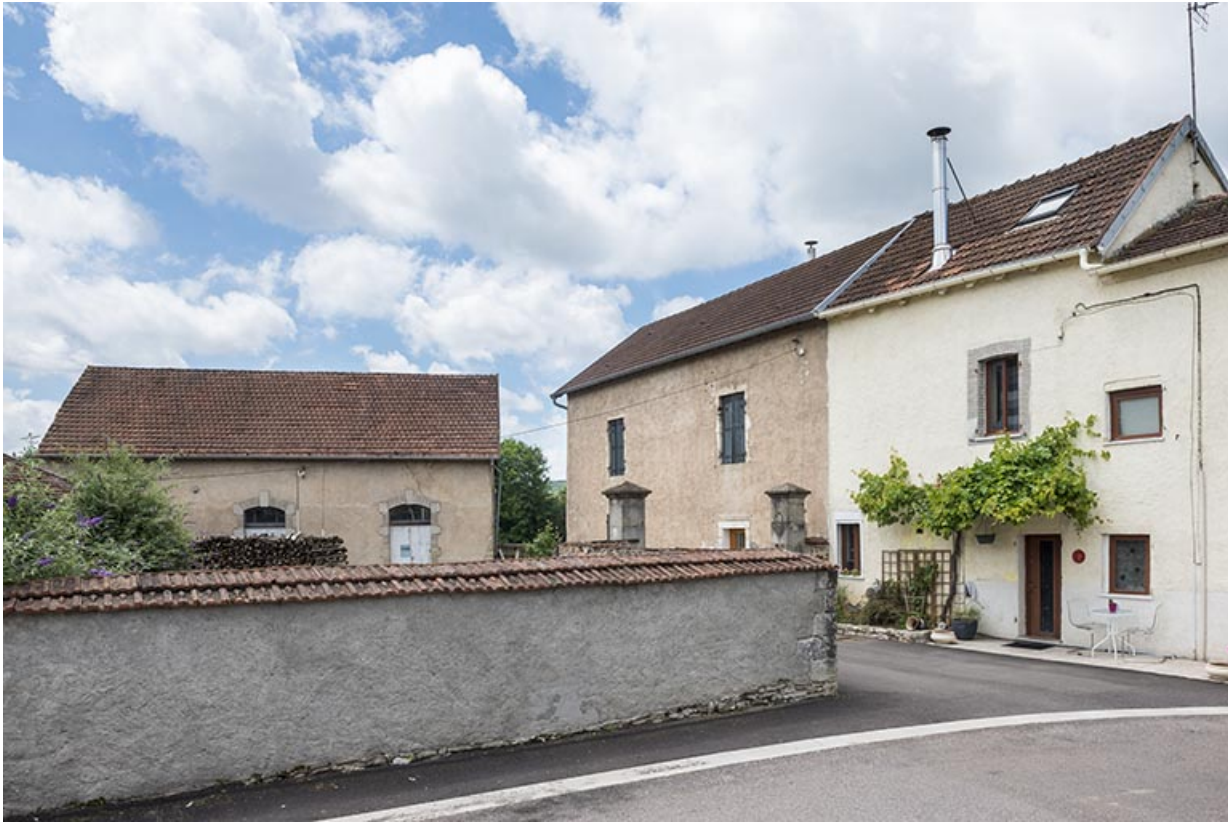
Les anciens abattoirs.