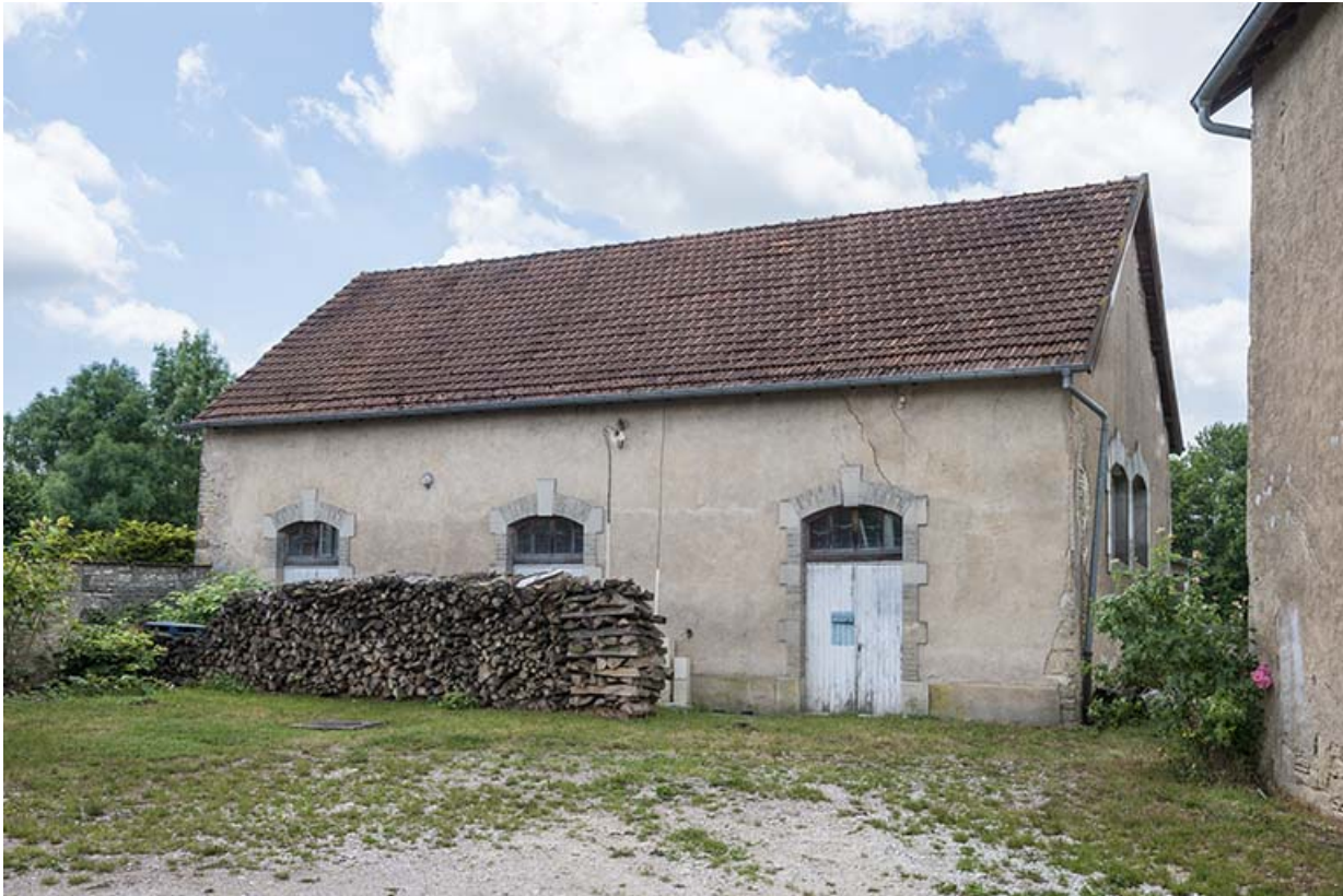
Le bâtiments servant d'abattoir.