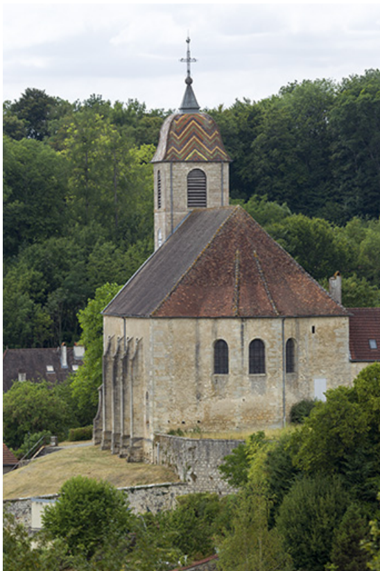
Vue de l'abside depuis la colline du couvent de minimes. 70, Rupt-sur-Saône