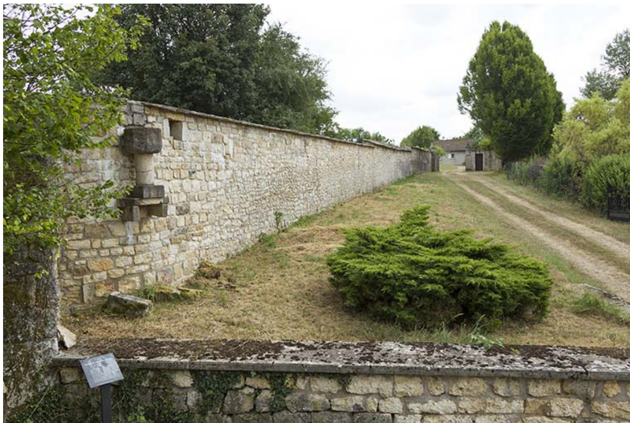
Le mur d'enclos du couvent.