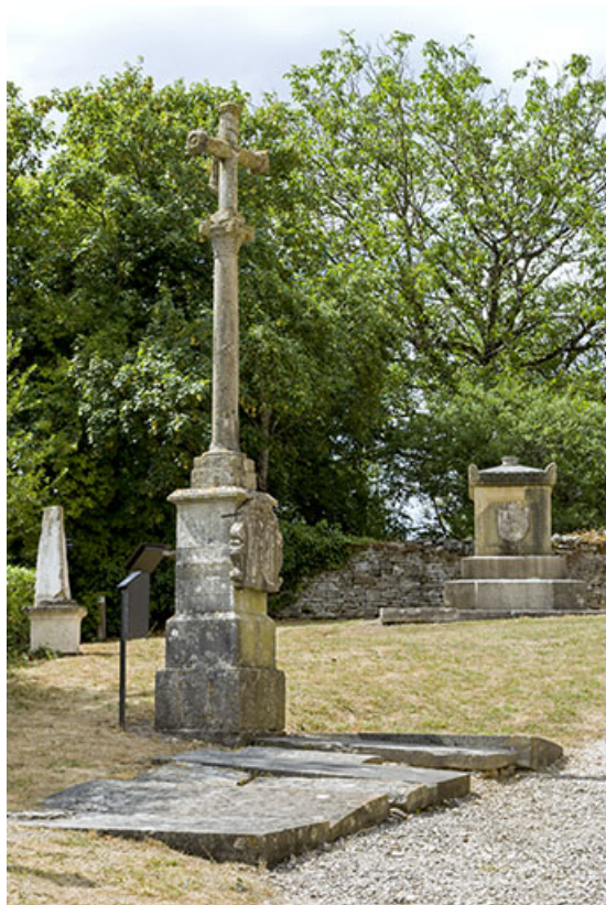
La croix, avec le tombeau du comte d'Orsay à l'arrière-plan, près de l'église. 70, Rupt-sur-Saône