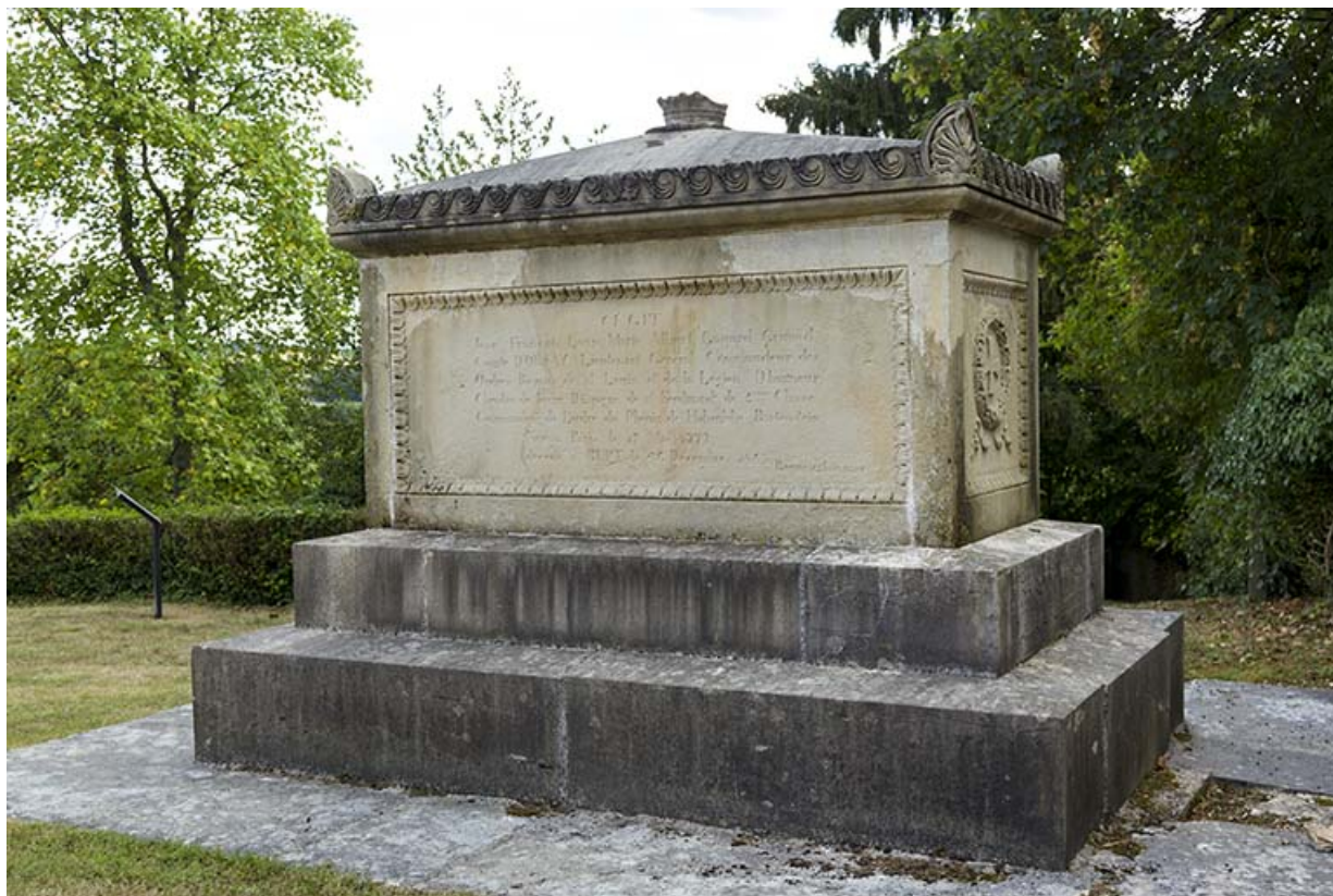
Faces latérale droite (est) et postérieure (nord). 70, Rupt-sur-Saône