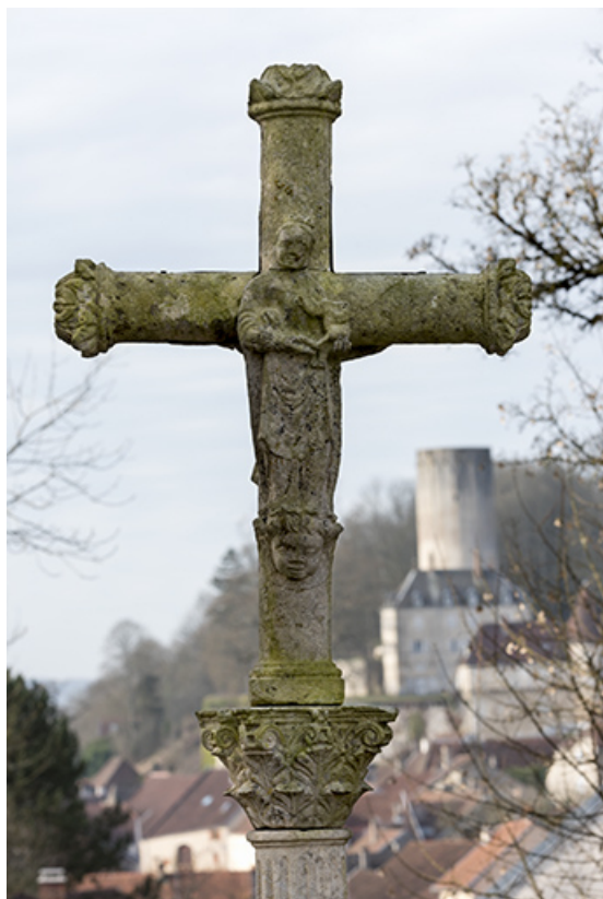
Croix dite du calvaire, au lieu-dit Sur la Croix du Calvaire : Vierge à l'Enfant. 70, Rupt-sur-Saône