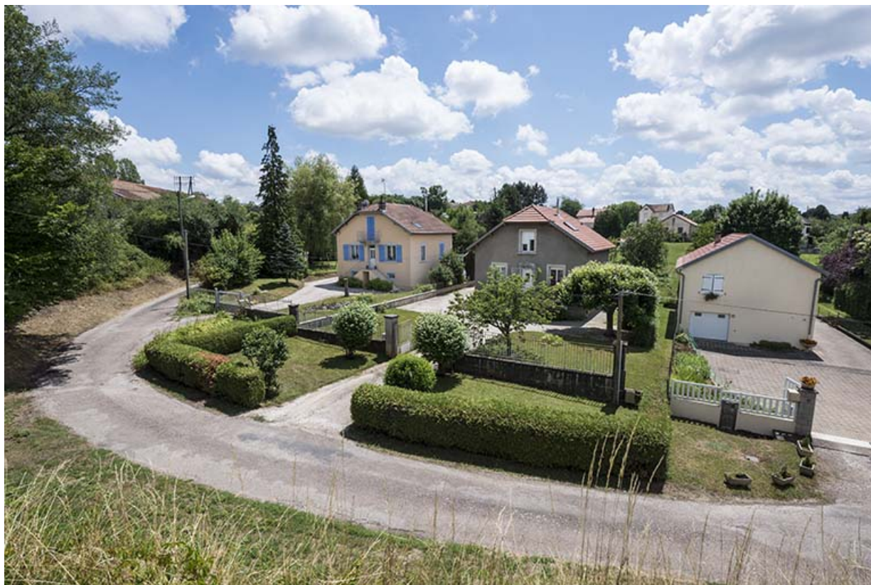
Pavillons construits en contre-bas de la gare. 70, Port-sur-Saône