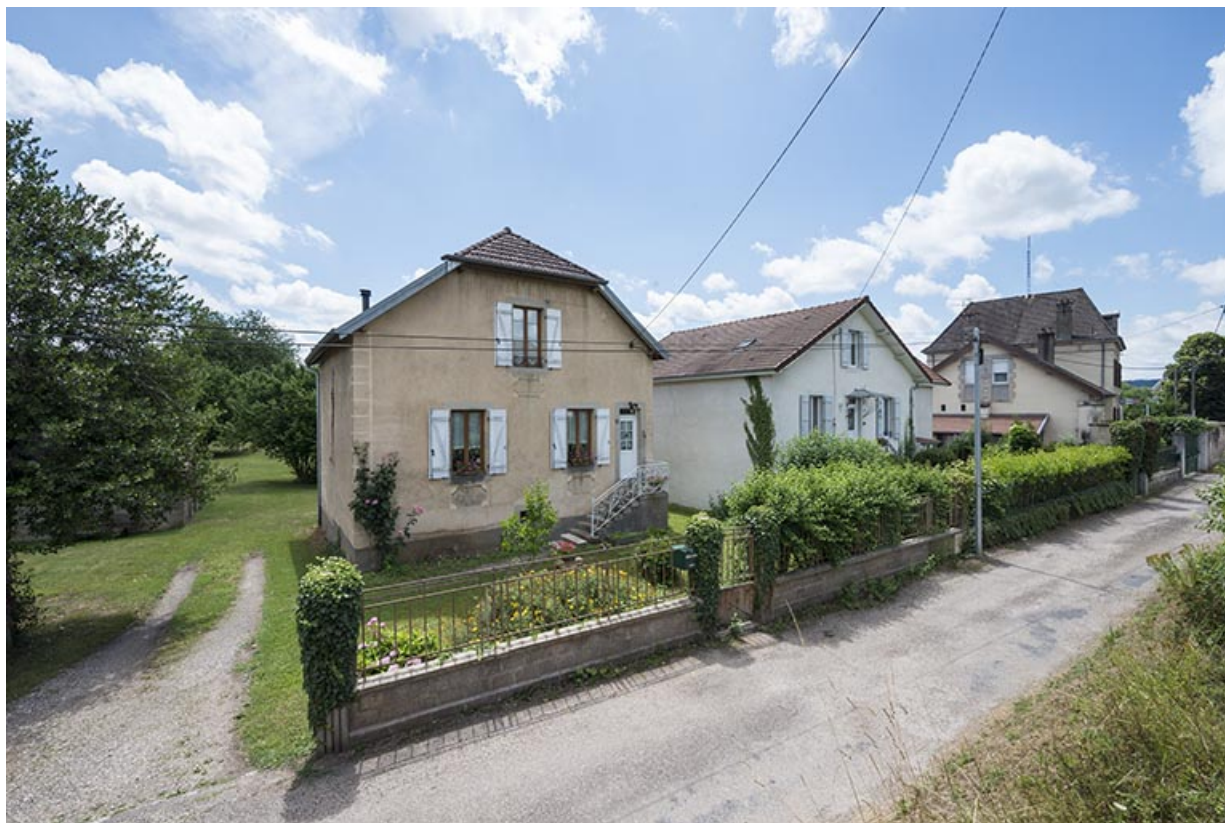
Pavillons construits latéralement à l'avenue de la Gare. 70, Port-sur-Saône