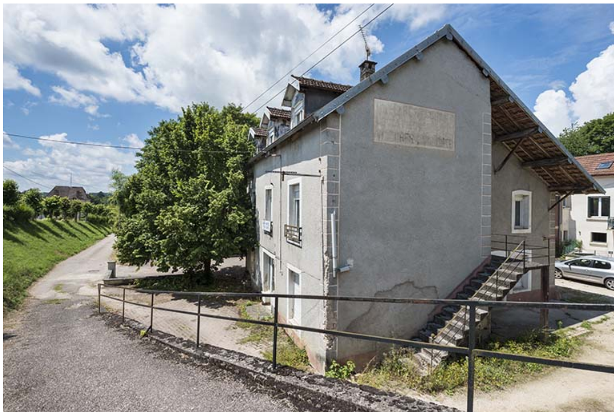
Ancien café-hôtel de la gare.