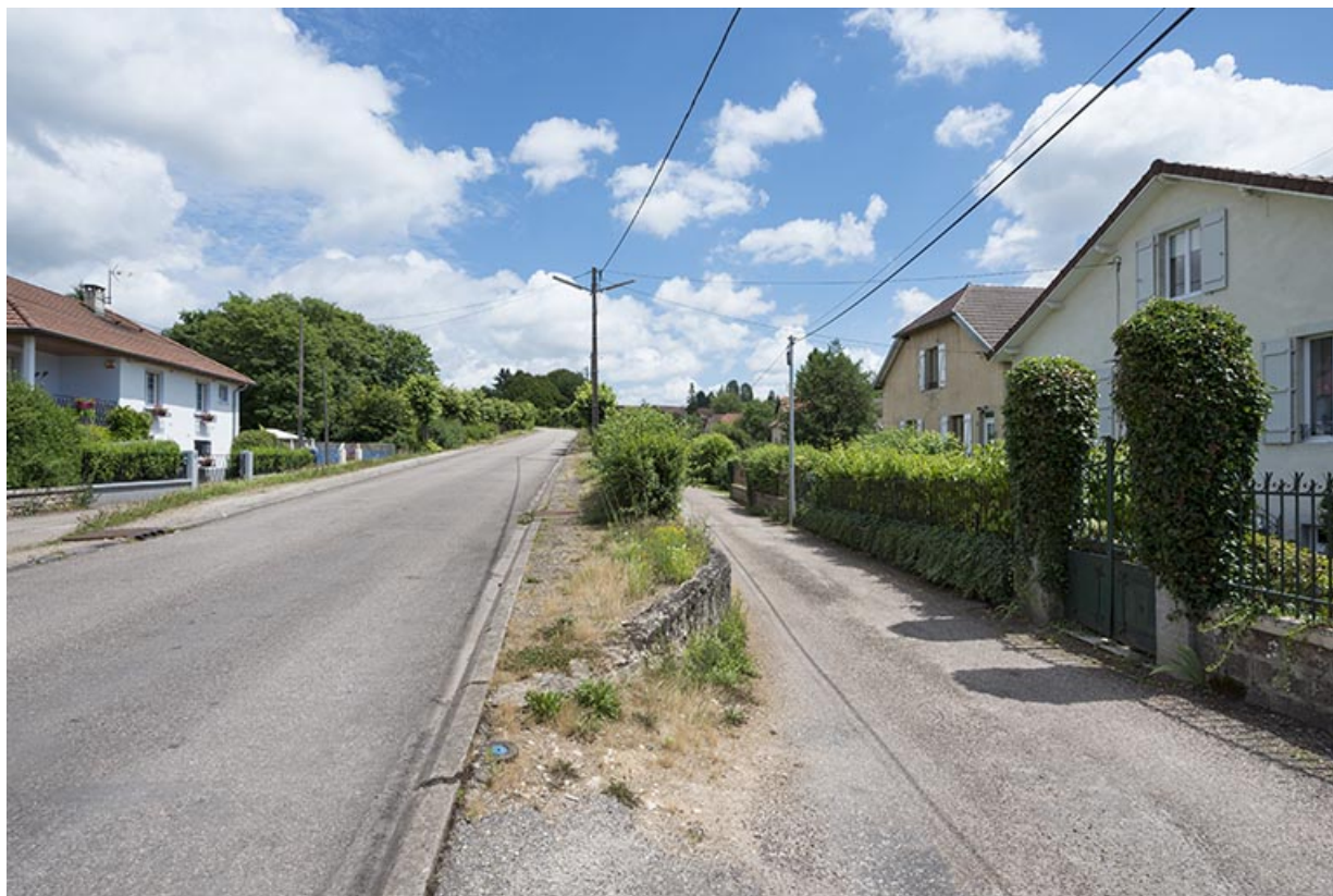
L'avenue de la Gare.