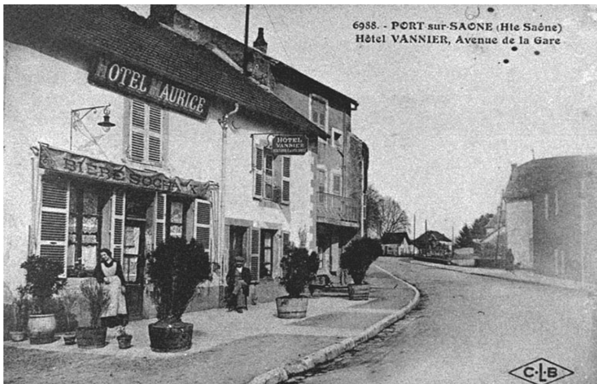
Hôtel, avenue de la Gare, carte postale. 70, Port-sur-Saône