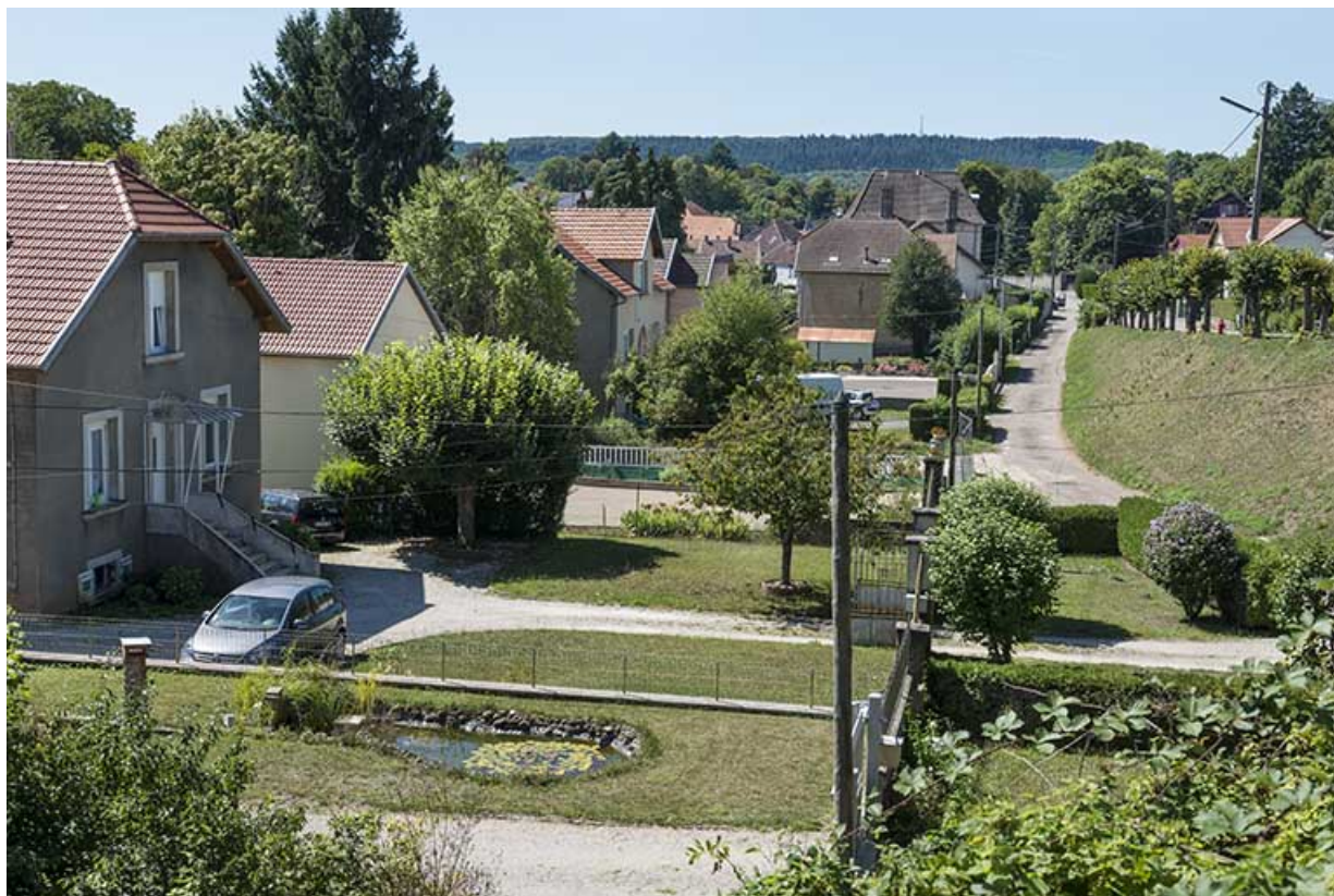
L'allée des Lilas, voie parallèle à l'avenue de la Gare. 70, Port-sur-Saône