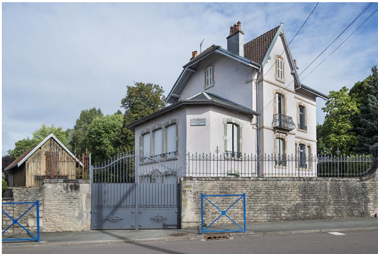
La Villa Alsace-Lorraine.