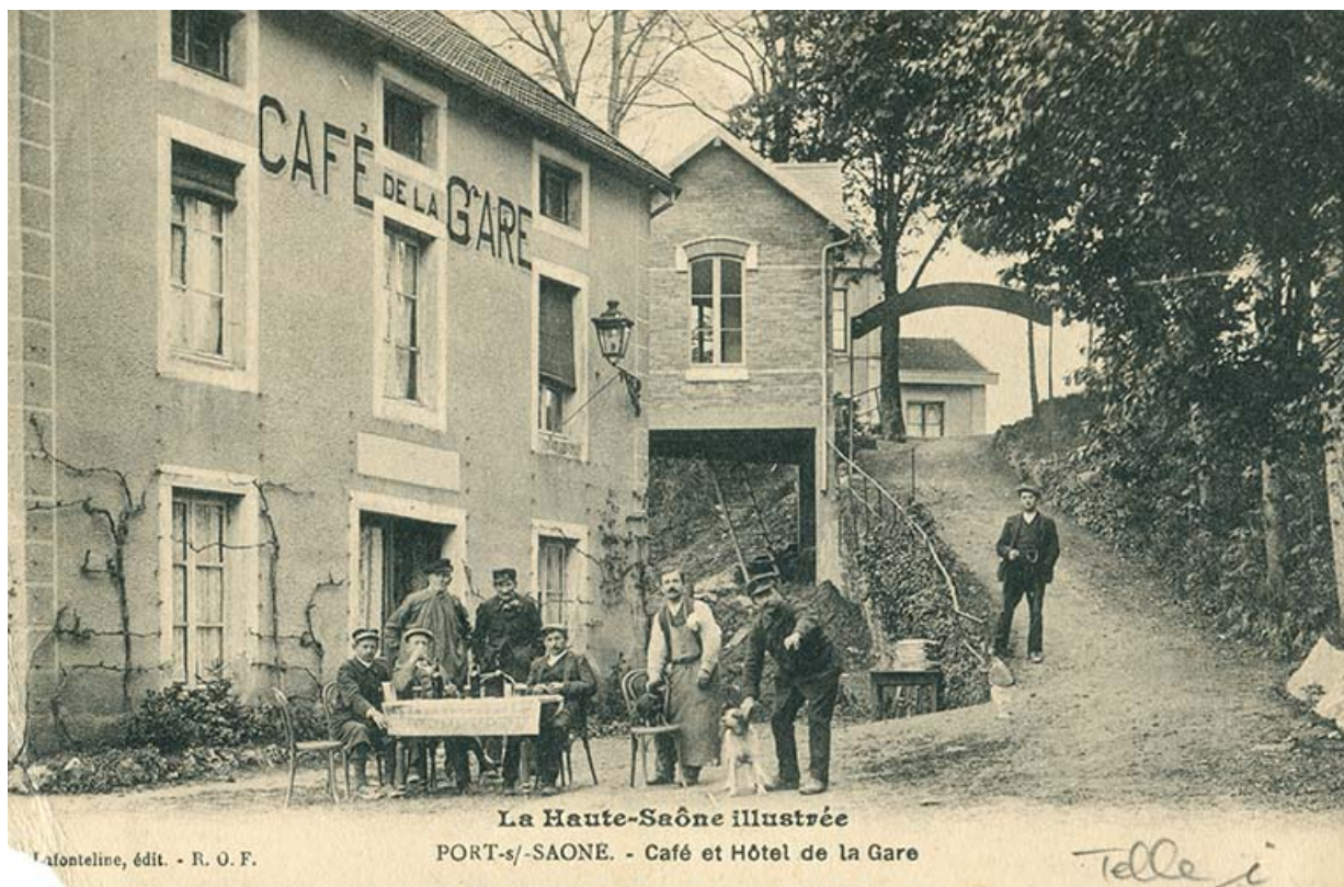
Hôtel et café de la gare, carte postale. 70, Port-sur-Saône