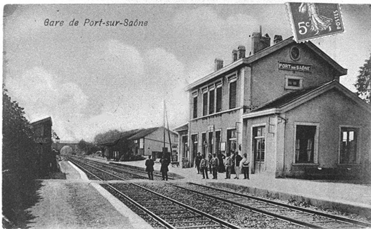
La gare, carte postale.