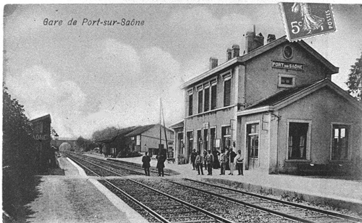
La gare, carte postale.