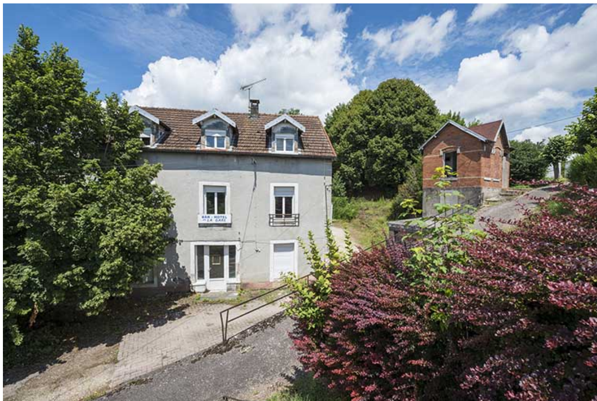
La rue montant vers la gare avec l'ancien café-hôtel en arrière plan. 70, Port-sur-Saône