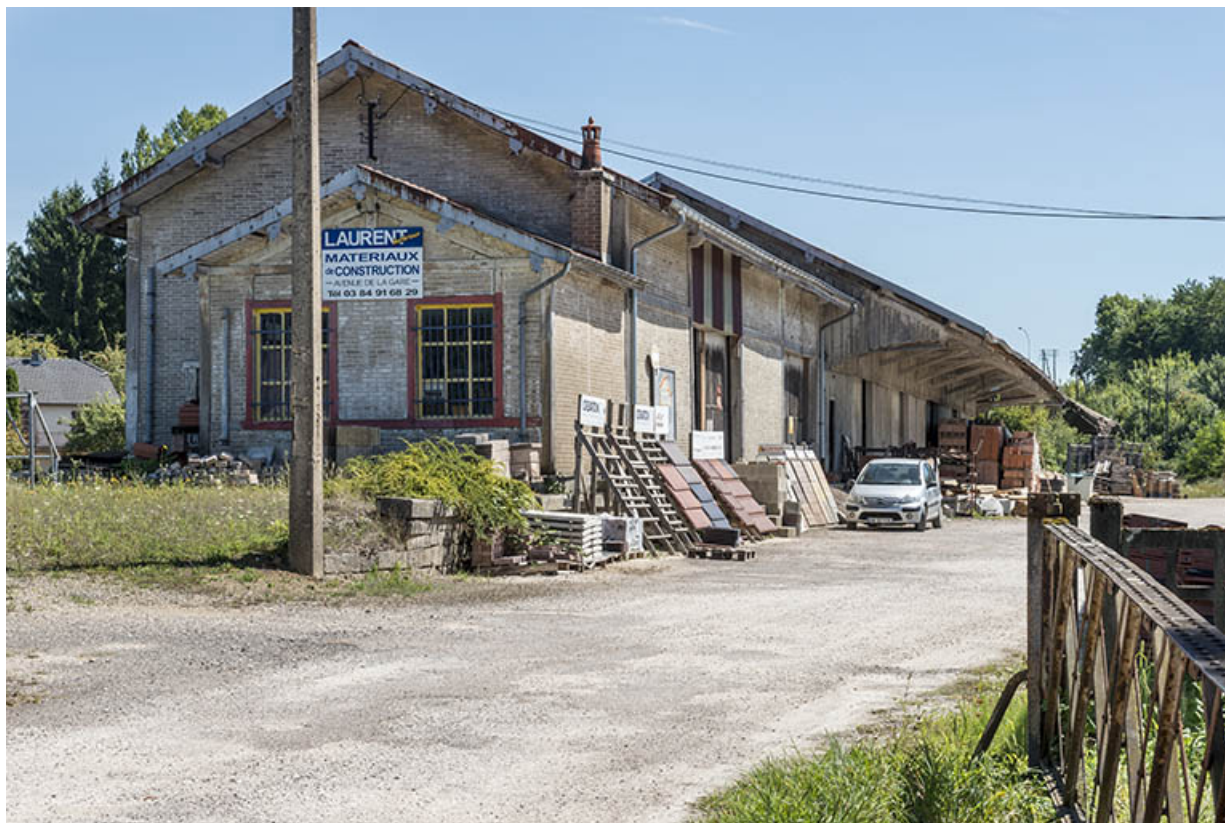
Vue depuis l'ancienne cour de la gare. 70, Port-sur-Saône avenue de la gare