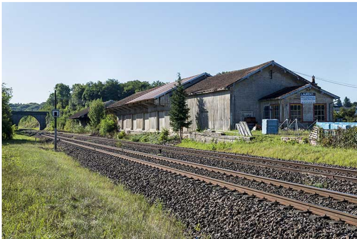
La voie ferrée et l'ancienne halle à marchandises.