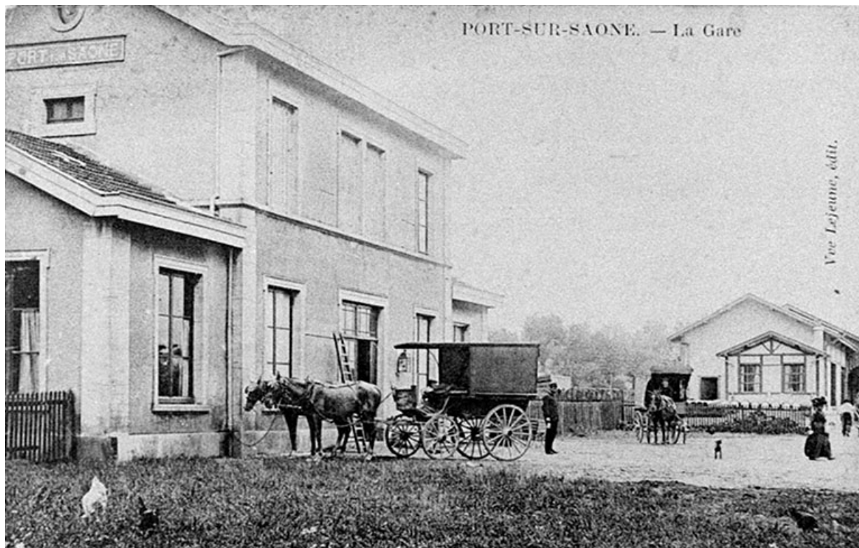
La gare, carte postale. 70, Port-sur-Saône avenue de la gare