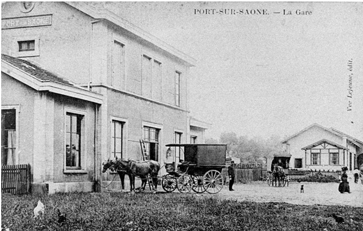
La gare, carte postale. 70, Port-sur-Saône avenue de la gare