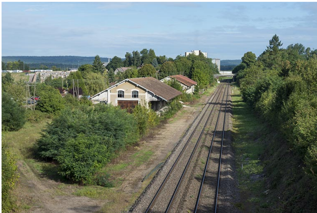
Vue générale depuis le pont de la route nationale 19.