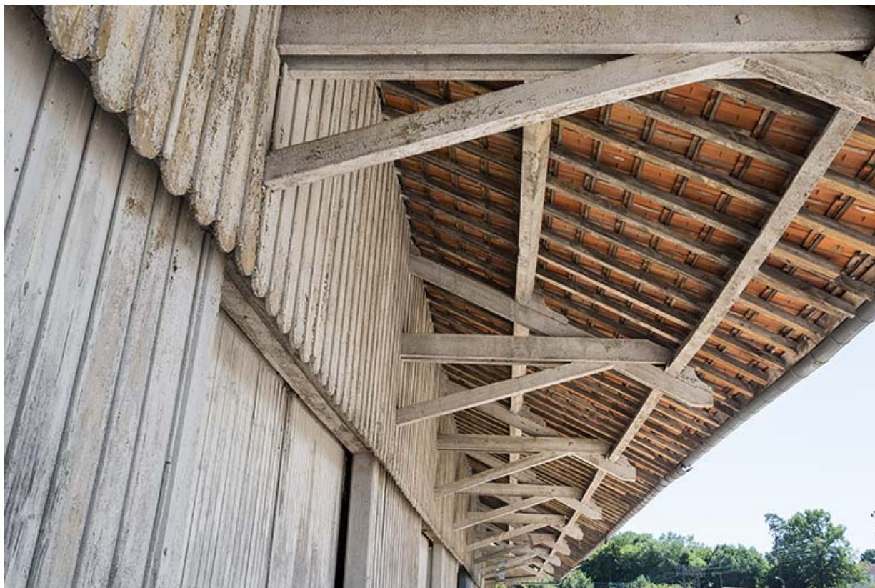
Détail de l'avant-toit de l'ancienne halle.