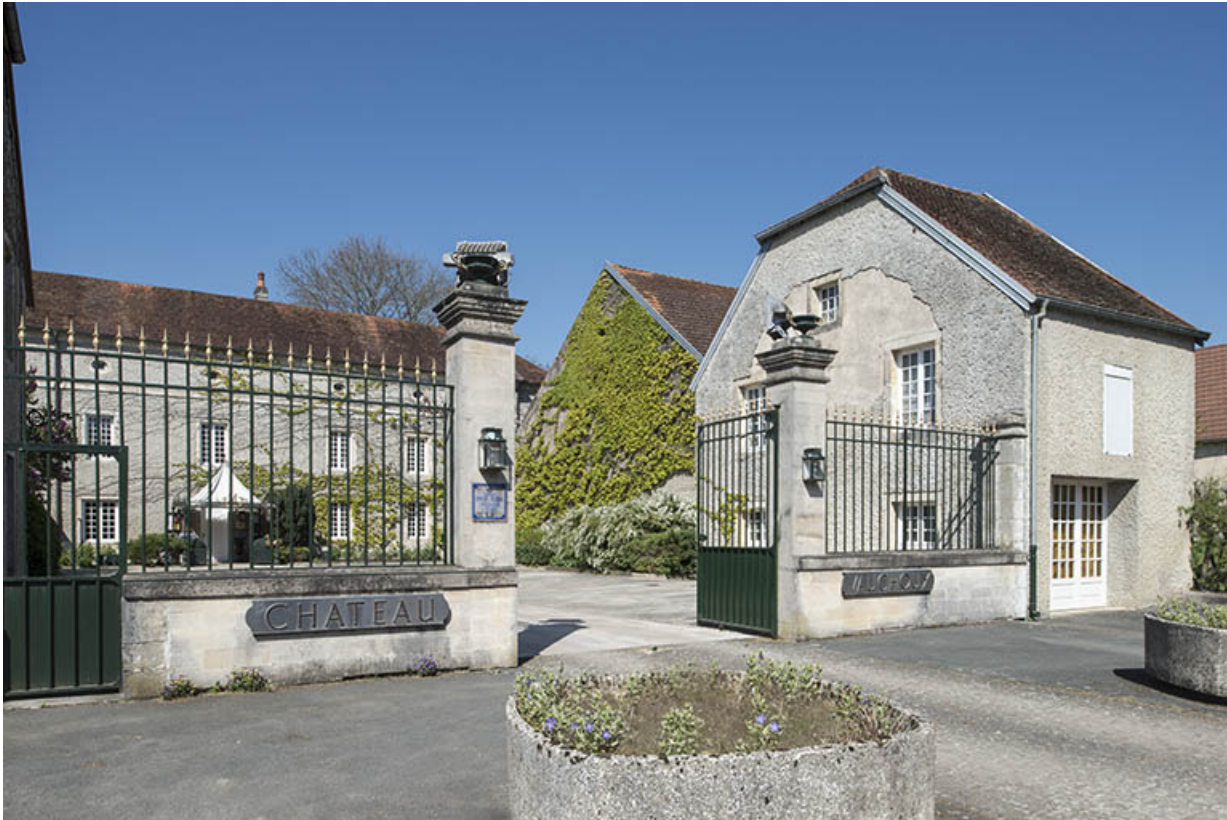
Vue de trois-quart avec la maison du gardien en arrière plan.