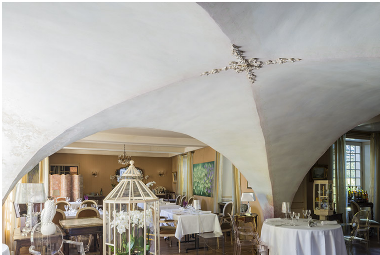
Vue depuis l'extrémité Nord.