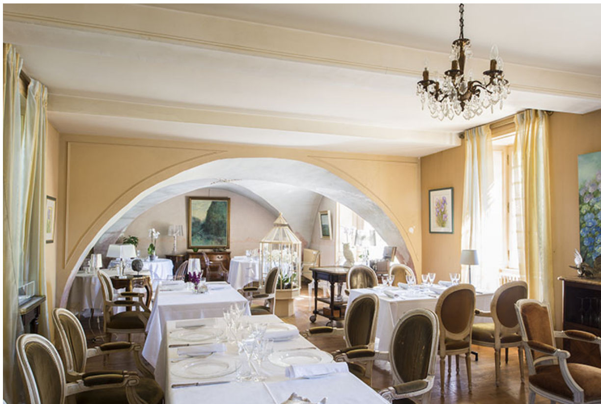
La salle à manger, vue générale.