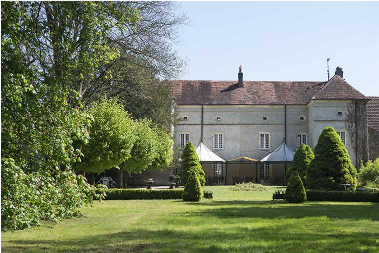
Le château depuis le parc.