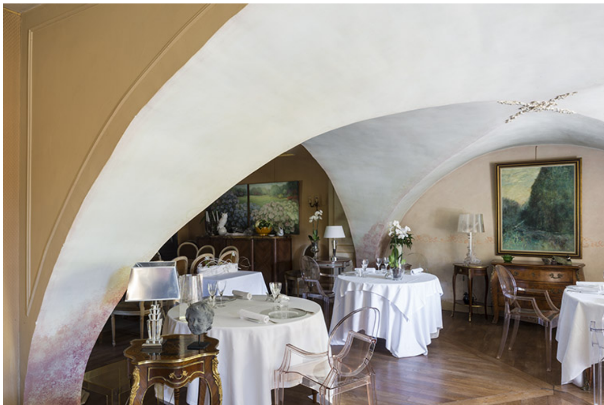
Détail d'une des voûtes.