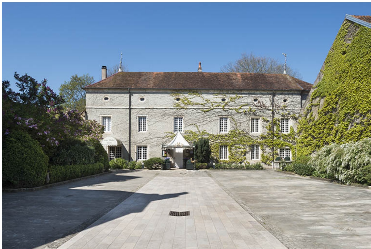
La cour et vue sur la façade principale.