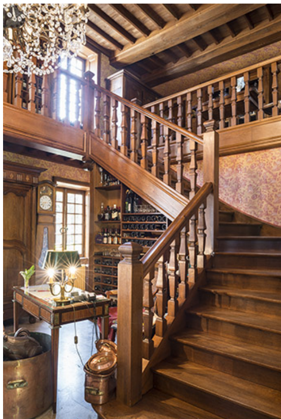
L'escalier et sa balustrade.