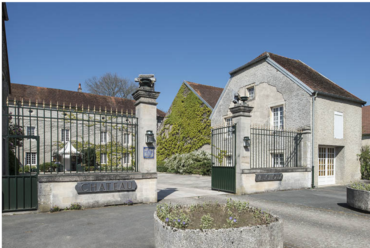
Vue de trois-quart avec la maison du gardien en arrière plan.