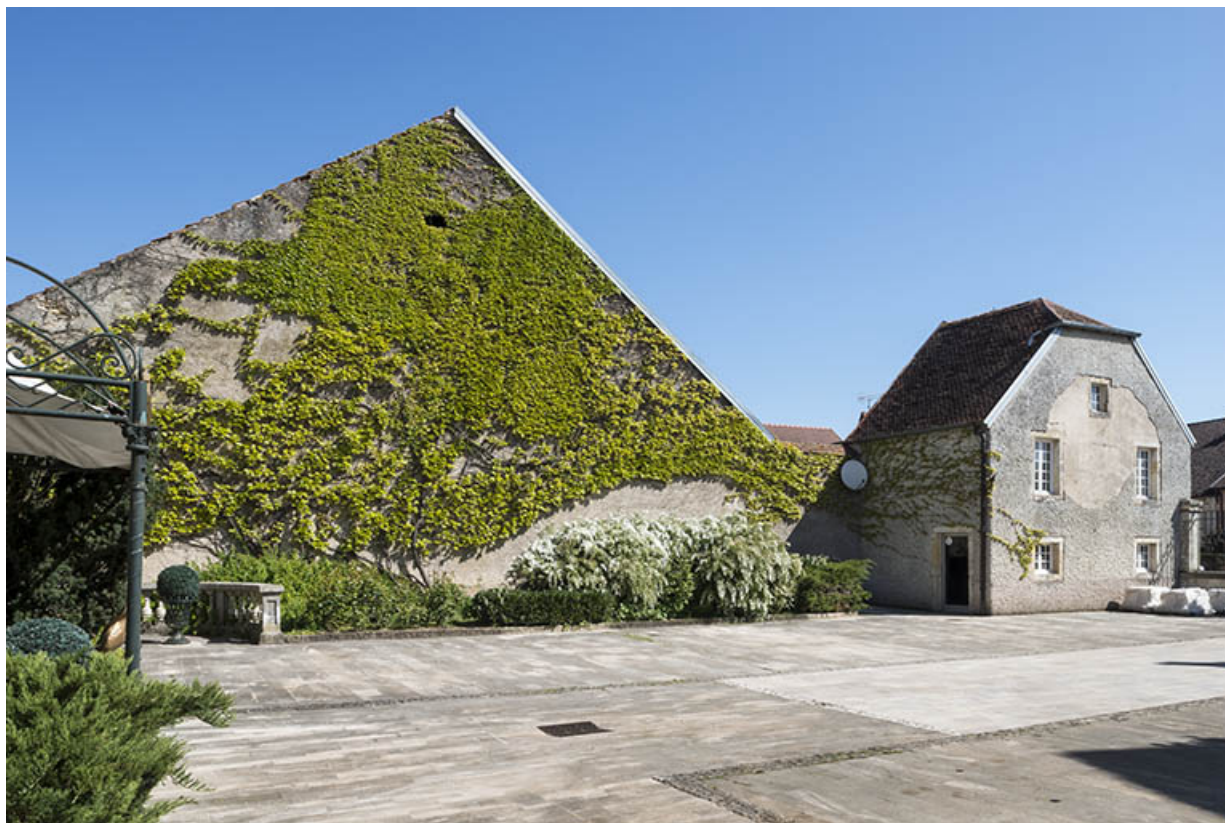
La maison du gardien et le mur pignon de la grange mitoyenne.