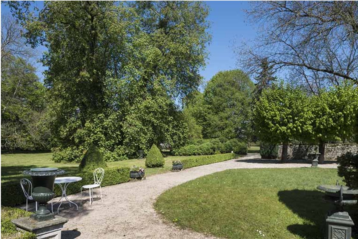
Le parc et son chemin de promenade.