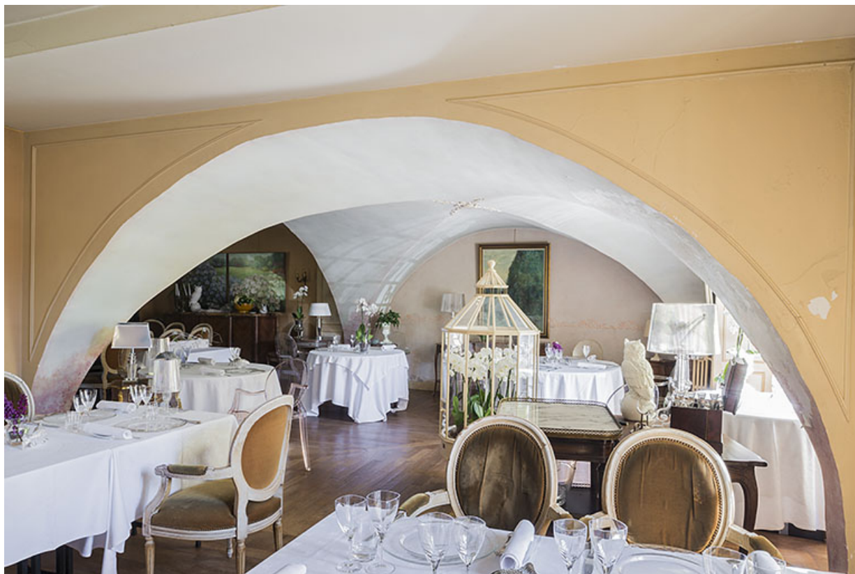
La salle à manger, partie voûtée. 70, Vauchoux Grande Rue