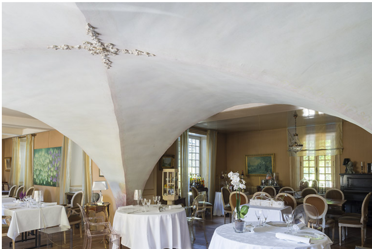
Détail au niveau de la croisée.