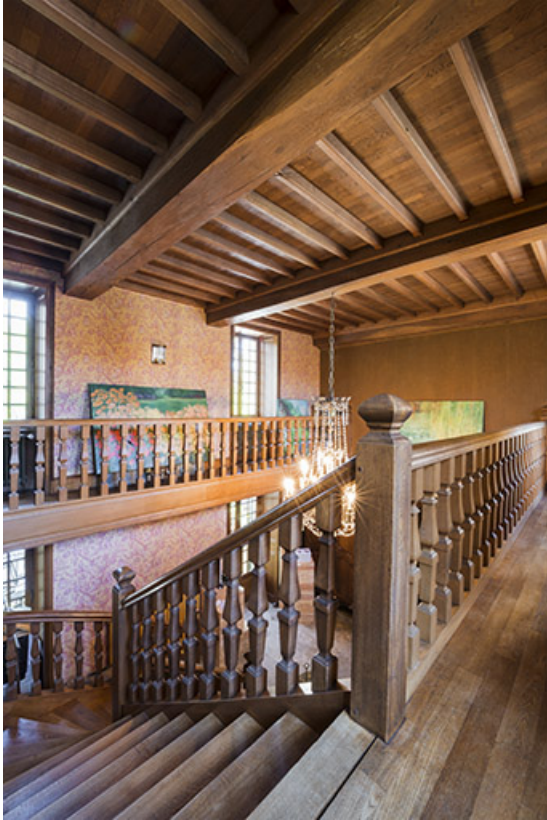
Le plafond à la française, hall d'entrée.