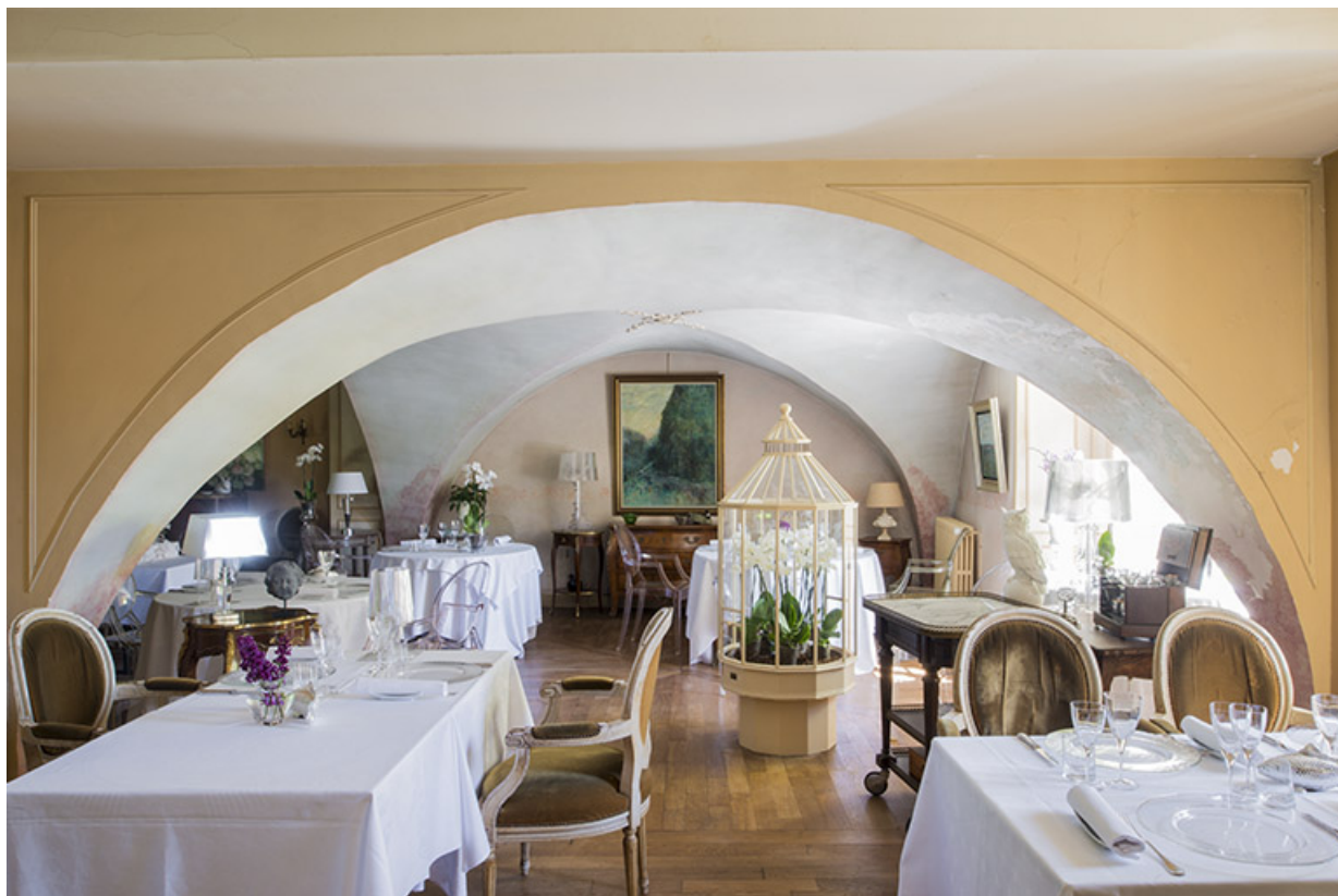
La partie voûtée, ancien cellier du château. 70, Vauchoux Grande Rue