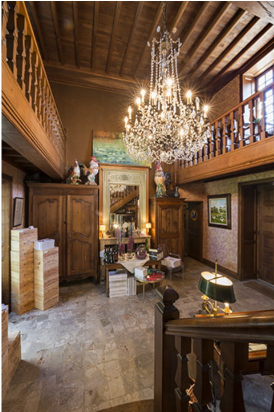
Le hall d'entrée.