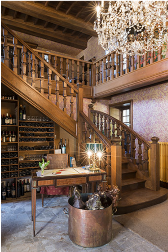
L'escalier, hall d'entrée.