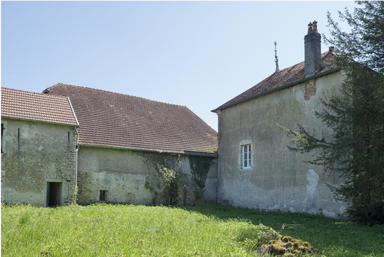
Le mur pignon du pavillon nord du château.