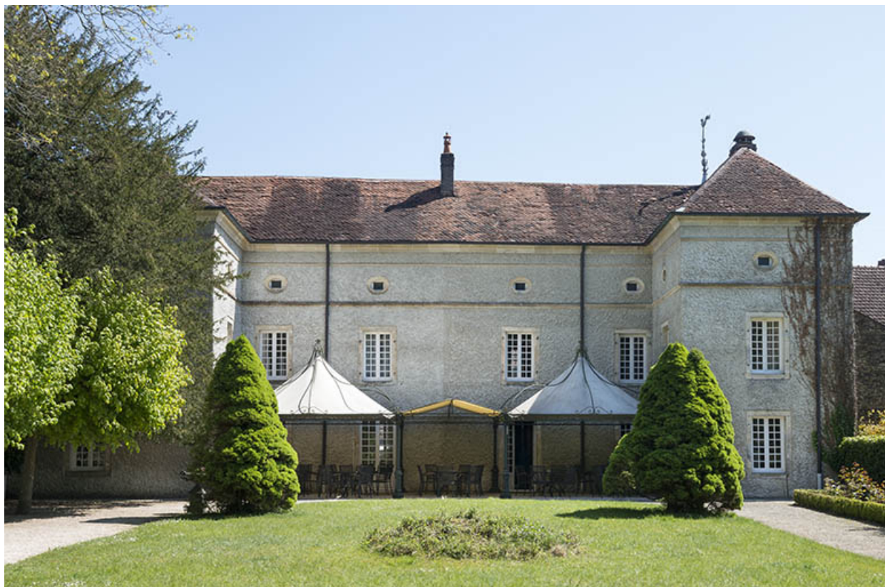
La façade postérieure.