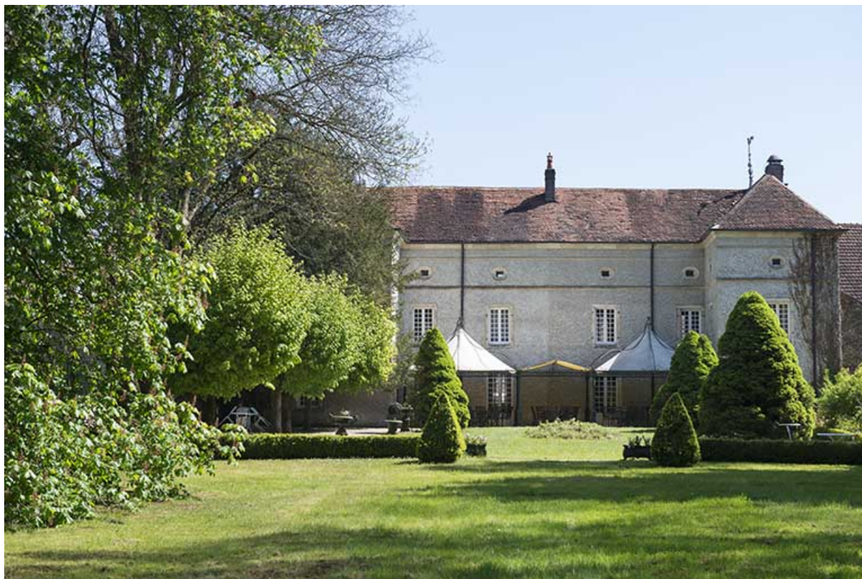
Le château depuis le parc.