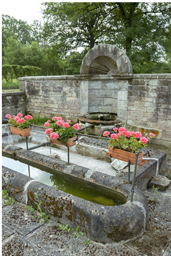
Fontaine des Carelles, chemin de la patouillette. Vue de trois-quart.