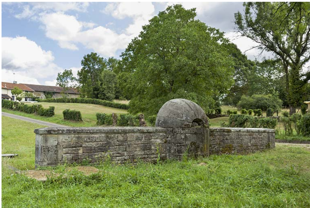
Fontaine des Carelles, chemin de la patouillette. Vue d'ensemble de la face postérieure.