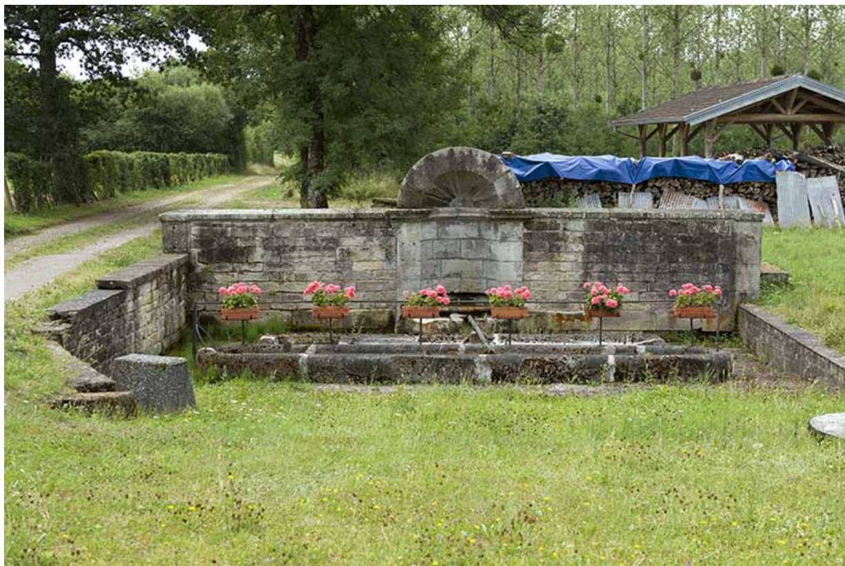
Fontaine des Carelles, chemin de la patouillette. Vue rapprochée de face.