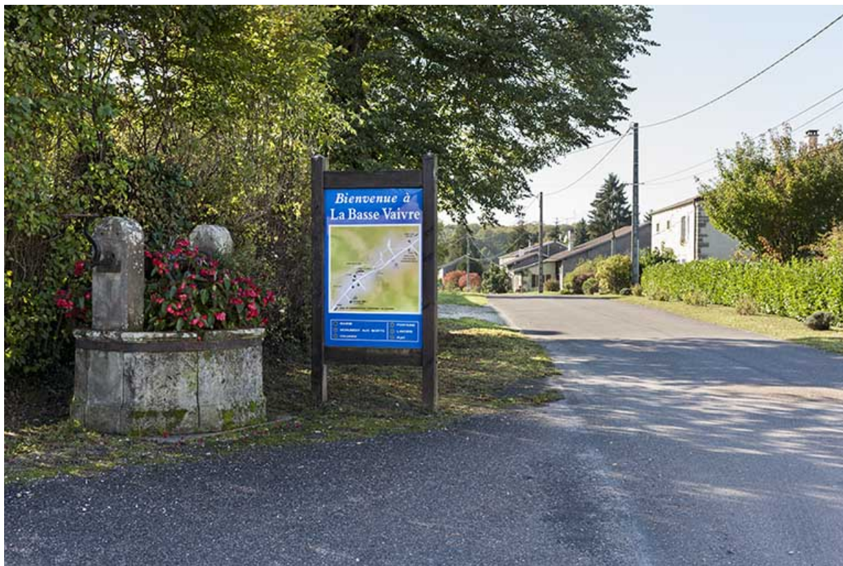
Rue principale et ancien puits devant la mairie.