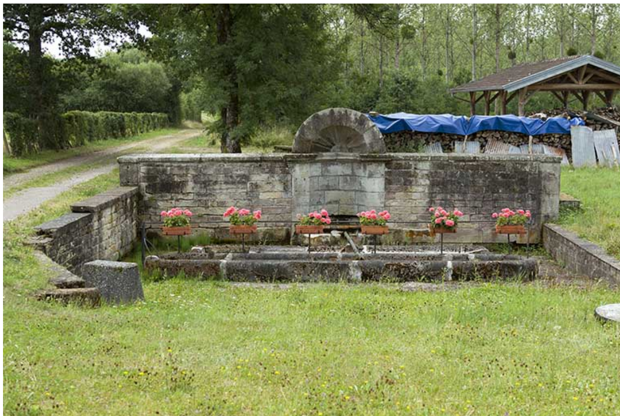
Fontaine des Carelles, chemin de la patouillette. Vue rapprochée de face.