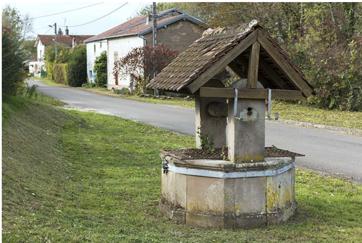
Puits, situé au carrefour avec la route de Seilles.