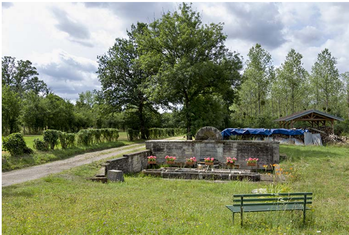
Fontaine des Carelles chemin de la patouillette. Vue d'ensemble de face.