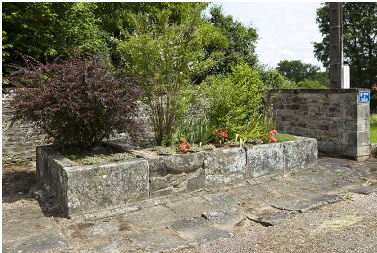
Ancien lavoir au carrefour de la route principale et de la route de Seilles. Vue de trois quart ouest.