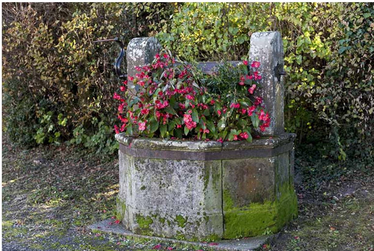
Ancien puits devant la mairie : vue rapprochée.