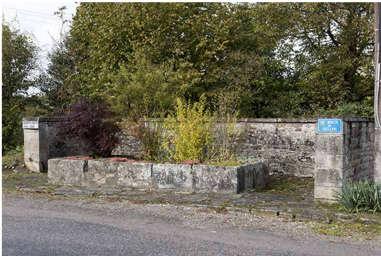
Ancien lavoir au carrefour de la route principale et de la route de Seilles. Vue de trois quart est.