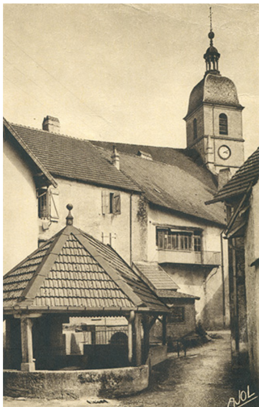
11Fi421-9 Le vieux Port-sur-Saône. 70, Port-sur-Saône rue de la fontaine