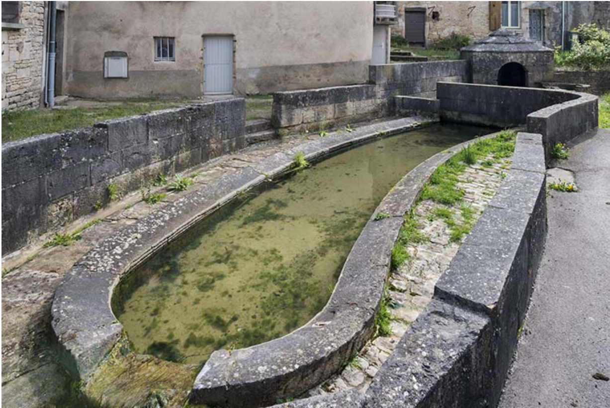
Vue sur le bassin central.