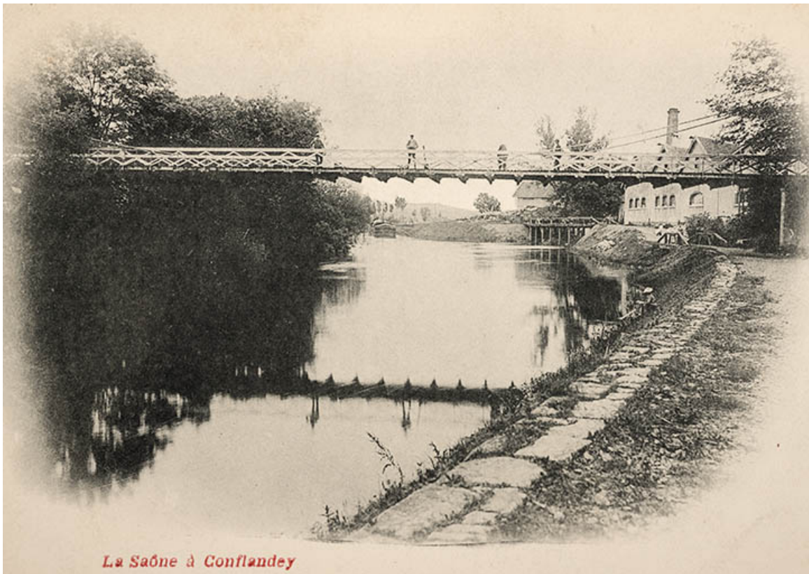
La Saône à Conflandey, carte postale. 70, Conflandey