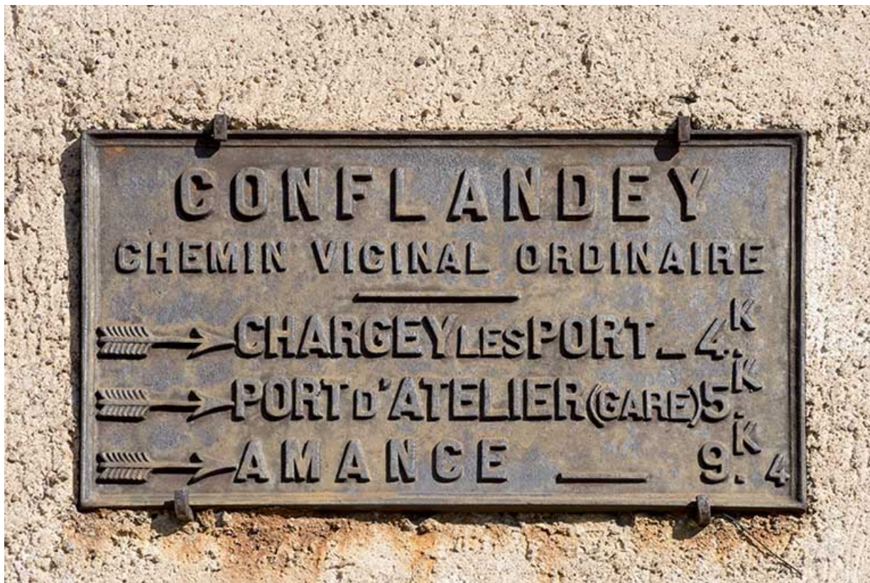
plaque de rue. 70, Conflandey