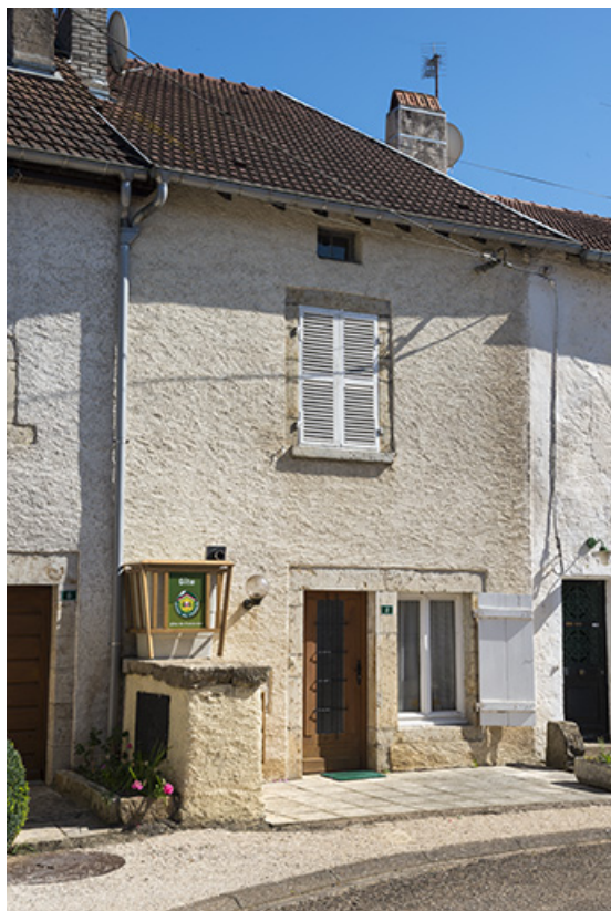
Une des plus anciennes maisons du village. 70, Conflandey