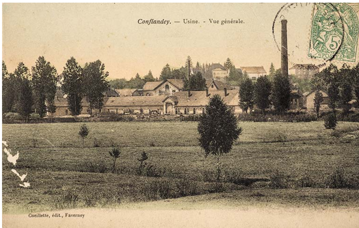
Vue générale de l'usine, Conflandey. 70, Conflandey