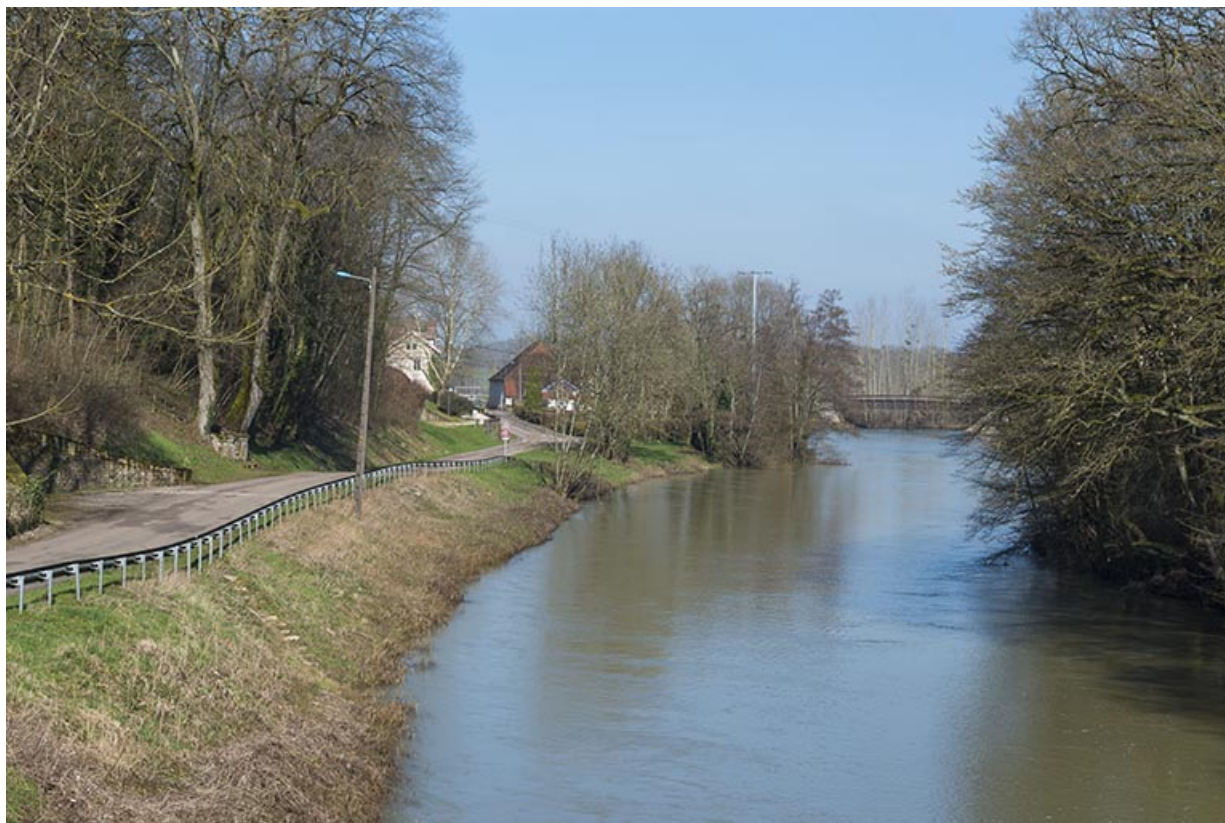
La Saône, vue vers l'amont.