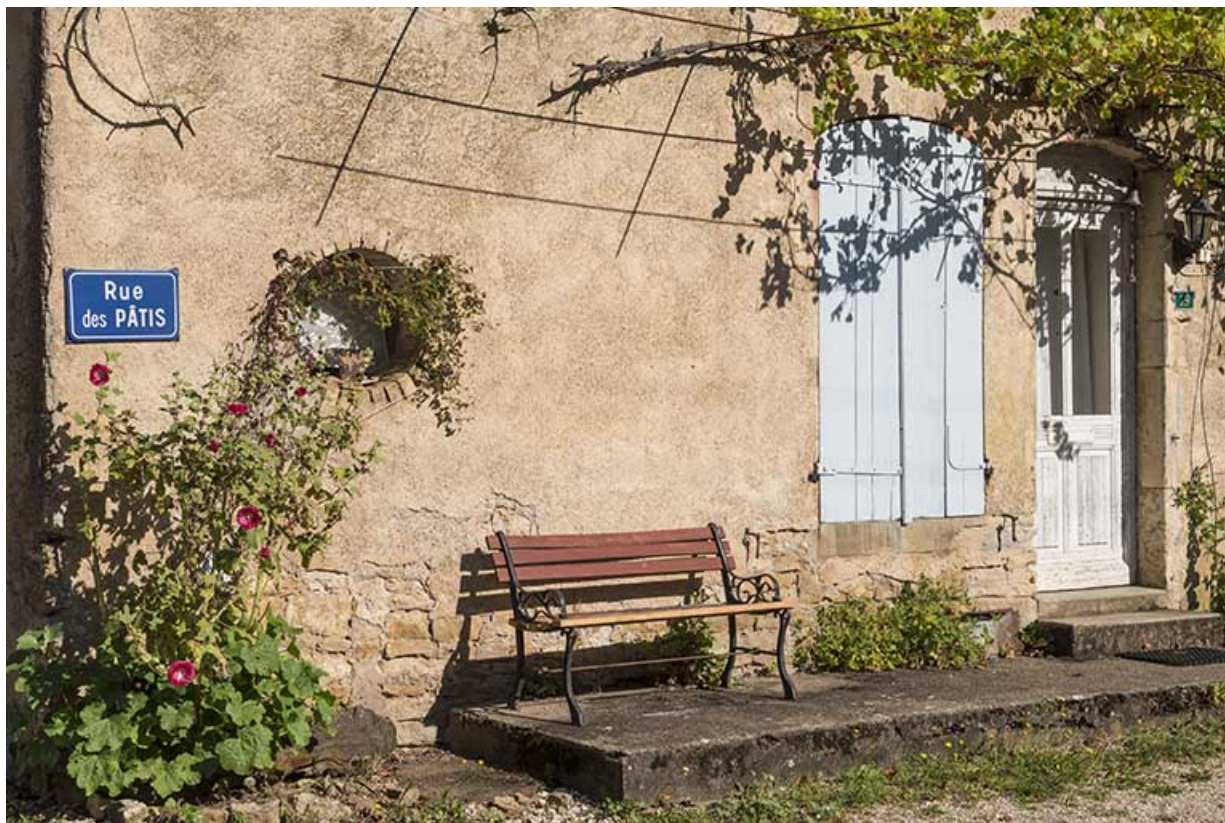
Ferme rue du Pâtis. 70, Conflandey