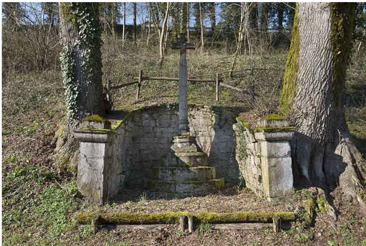
Croix située en contrebas du village.