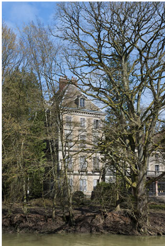
Le pavillon ouest du château.