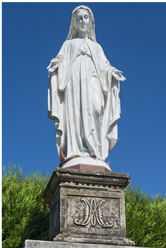
Statue représentant la Vierge.