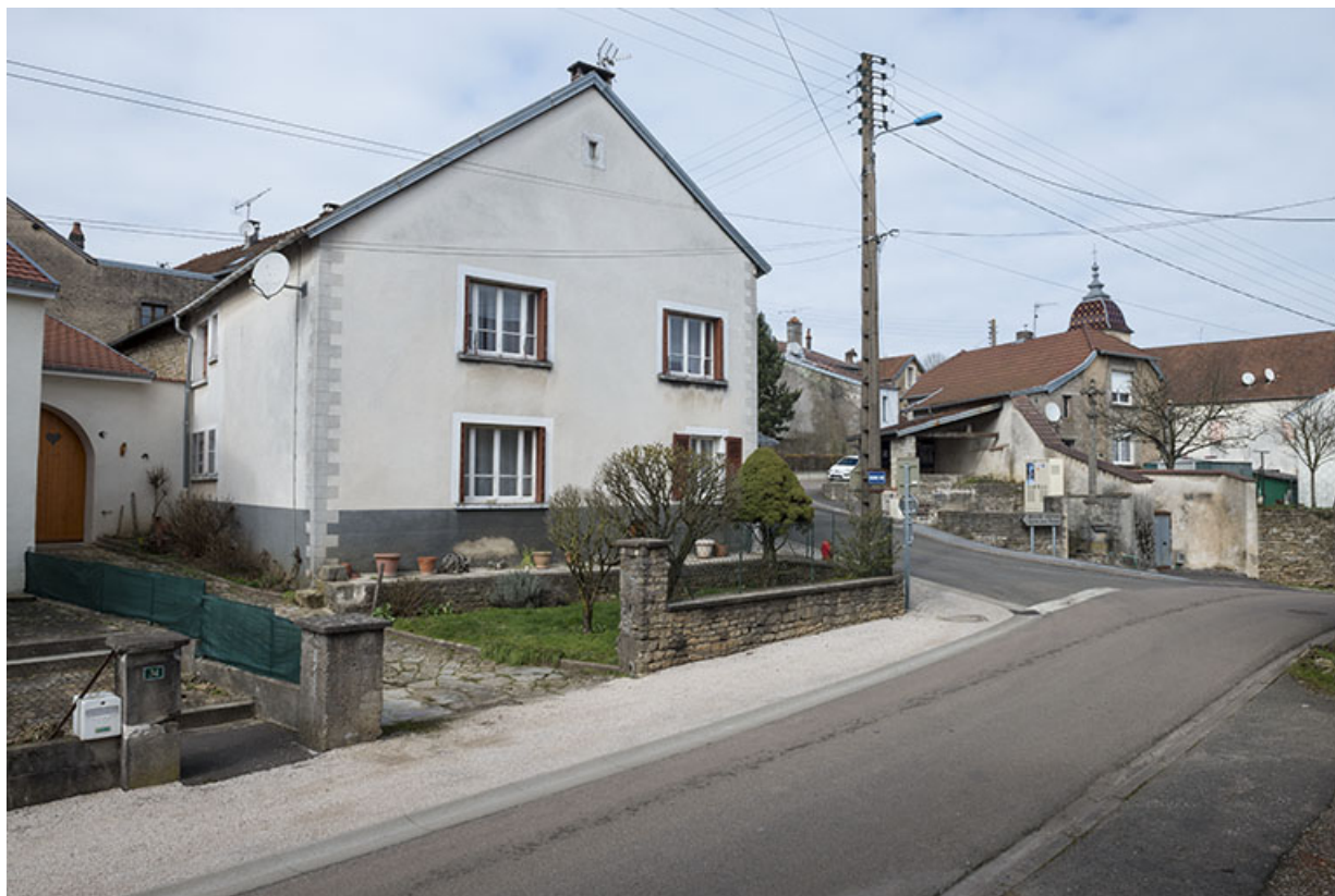
Carrefour au centre du village.