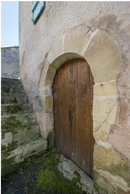
Entrée de cave. 70, Conflandey