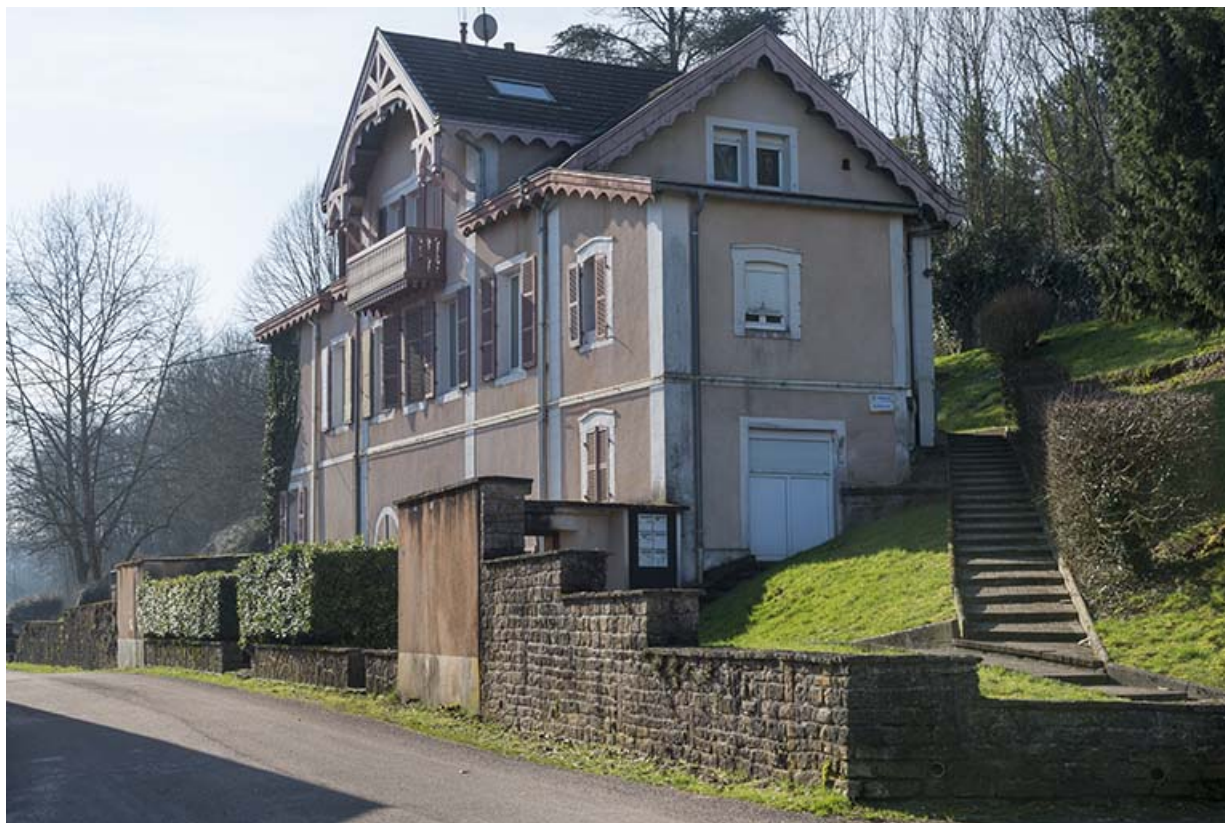
Maison en bordure de rivière.