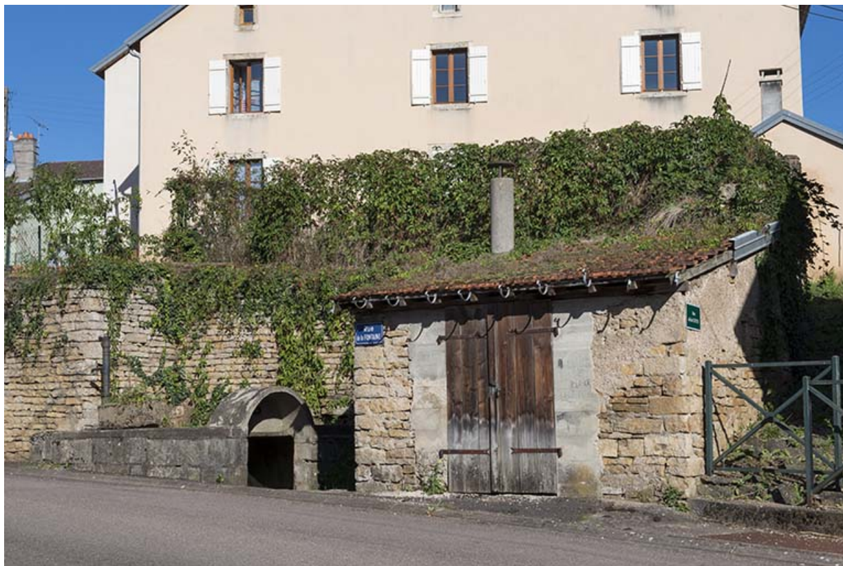
La fontaine, Grande rue. 70, Conflandey