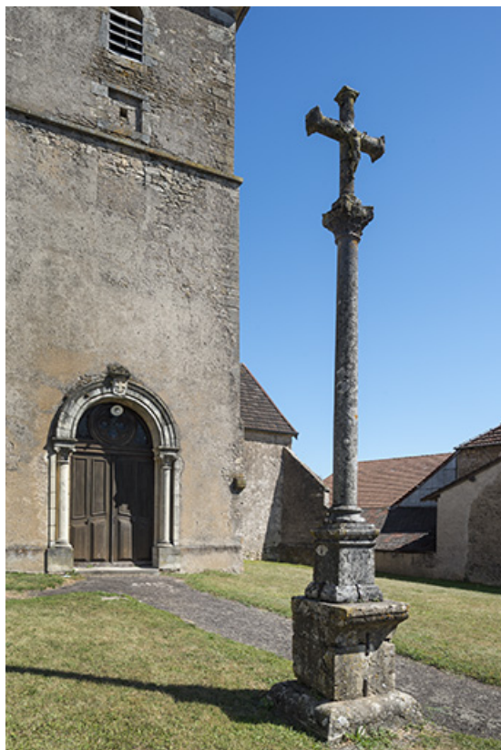
L'église Saint-Pierre. 70, Conflandey