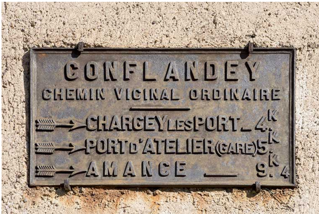
plaque de rue. 70, Conflandey