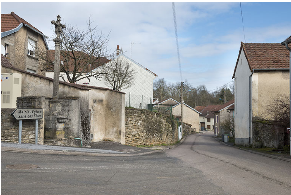
Vue sur une portion de la Grande rue. 70, Conflandey