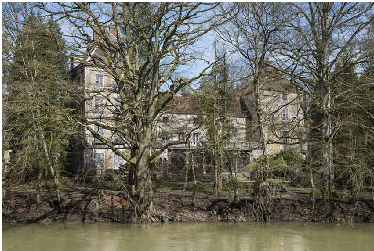
Le château depuis la rive opposée.