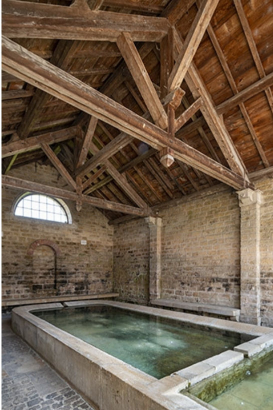
L'intérieur du lavoir, depuis l'entrée.