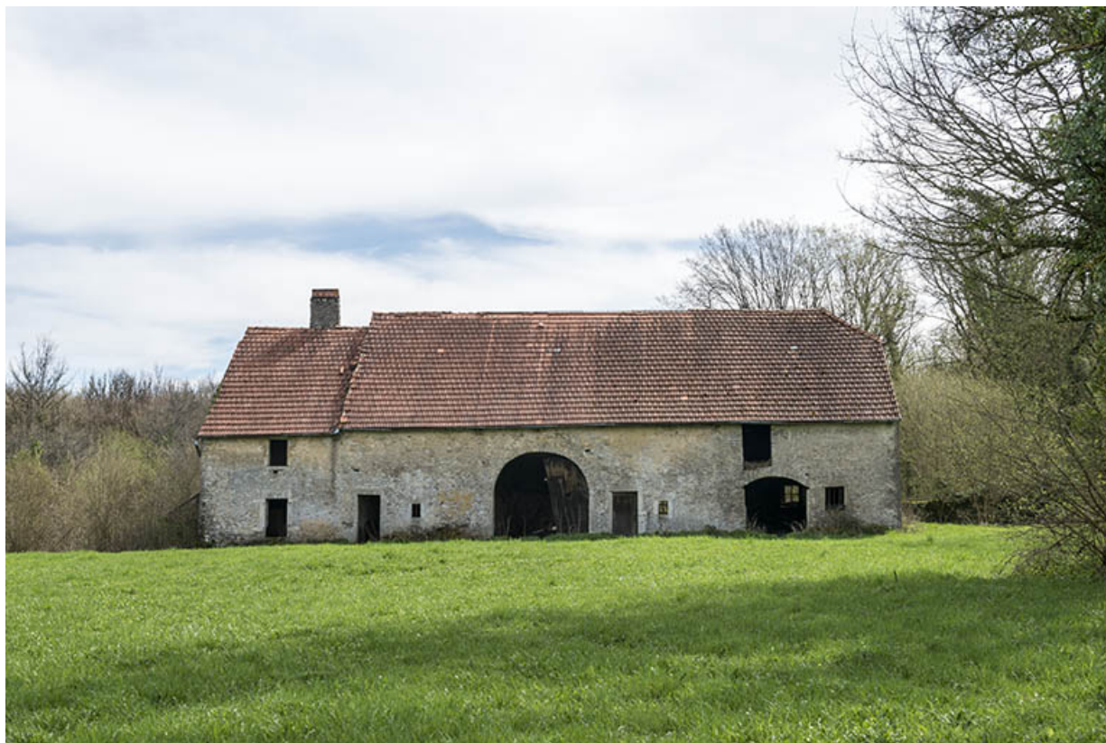
La ferme Saint-Jean.