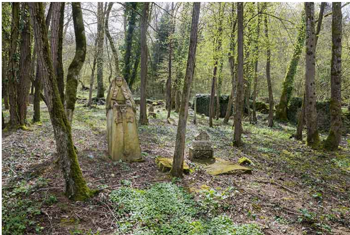
L'ancien cimetière et la statue de Philomène. 70, Purgerot