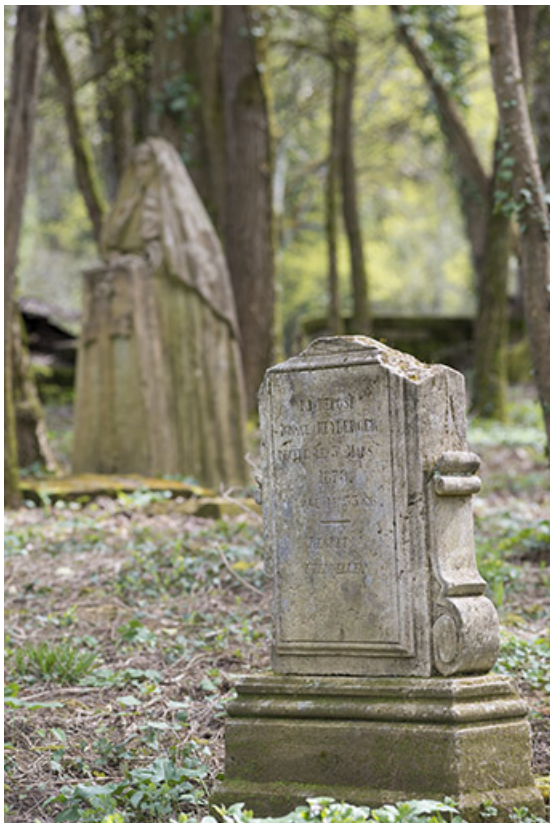
L'ancien cimetière, rue des Bourneaux. 70, Purgerot