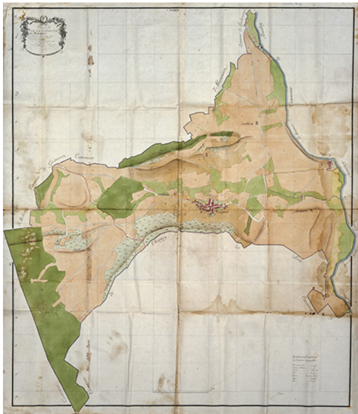
Plan de la commune de Purgerot, 8 germinal de l 'an XIII (29 mars 1805). 70, Purgerot