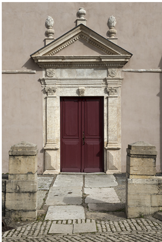
Le portail style Renaissance de l'église. 70, Purgerot