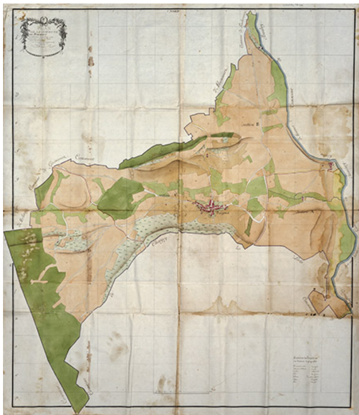
Plan de la commune de Purgerot, 8 germinal de l 'an XIII (29 mars 1805). 70, Purgerot