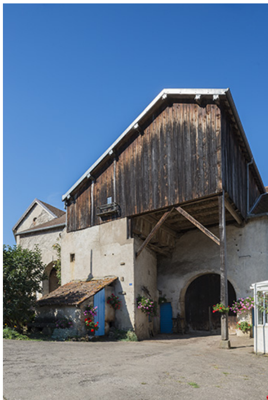
Entrée de grange, rue du Vaux. 70, Purgerot