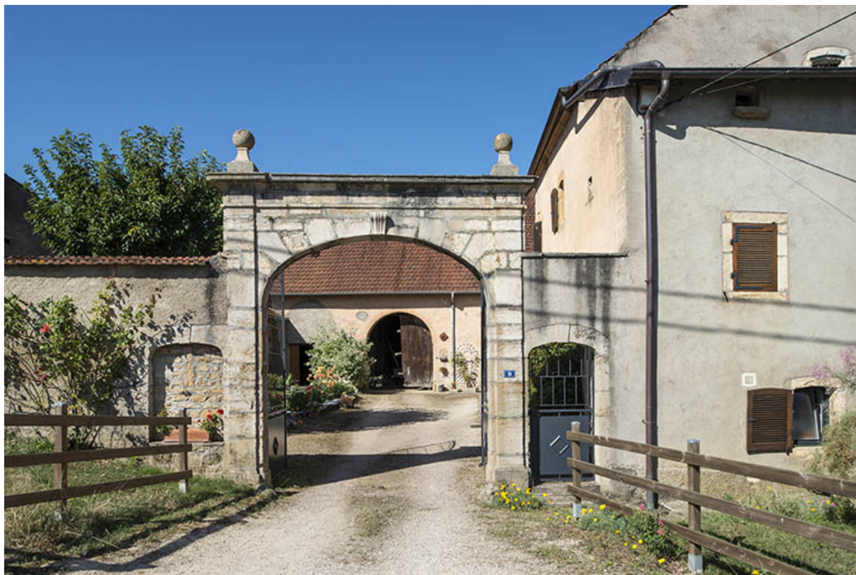
Portail d'une ferme, rue du Vaux. 70, Purgerot