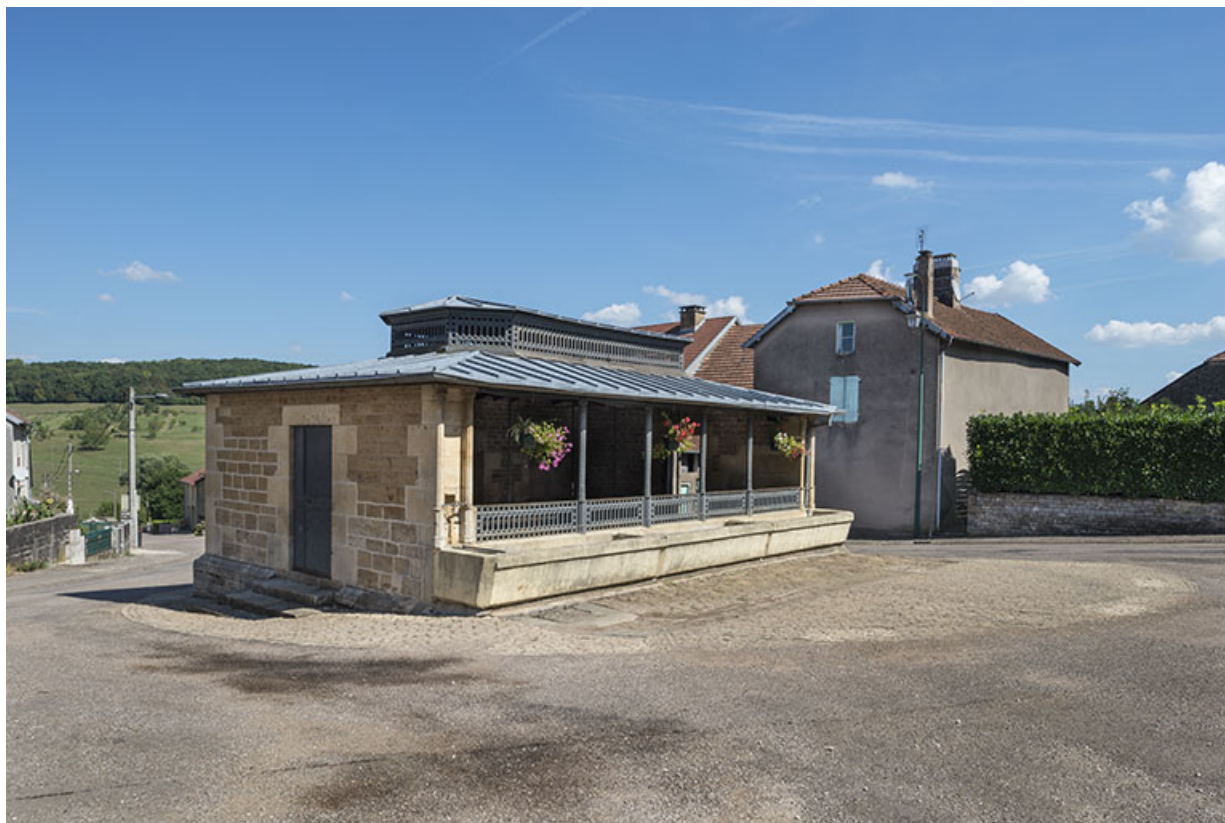
Le lavoir, rue du Vaux. 70, Purgerot