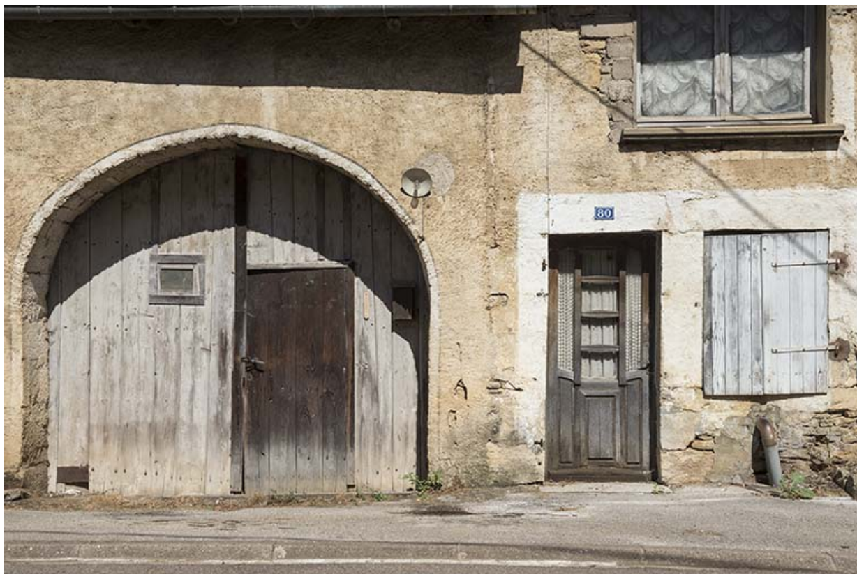
Ferme à deux travées, Grande rue. 70, Purgerot