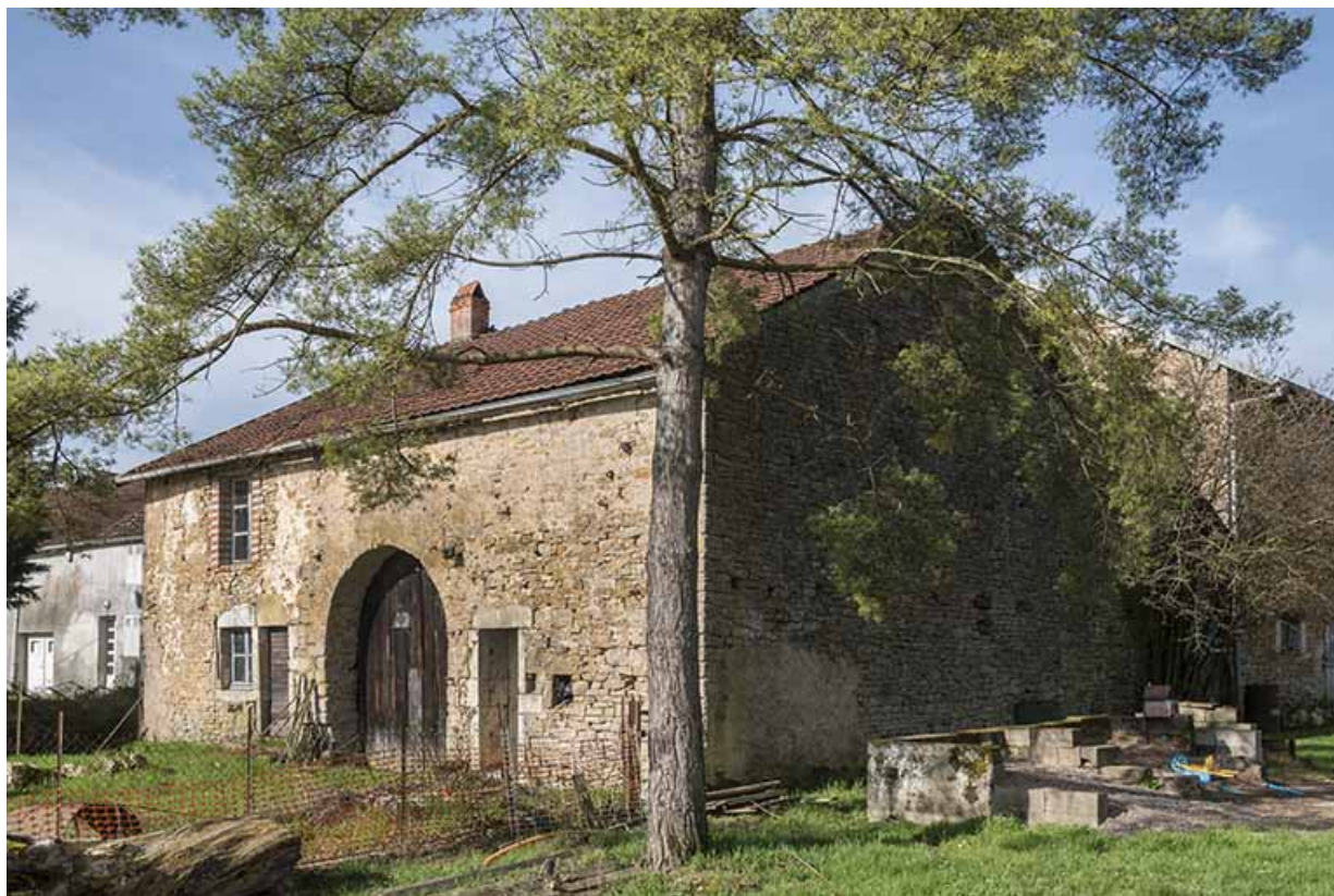
ferme, rue du Bac à Port-d'Atelier. 70, Purgerot