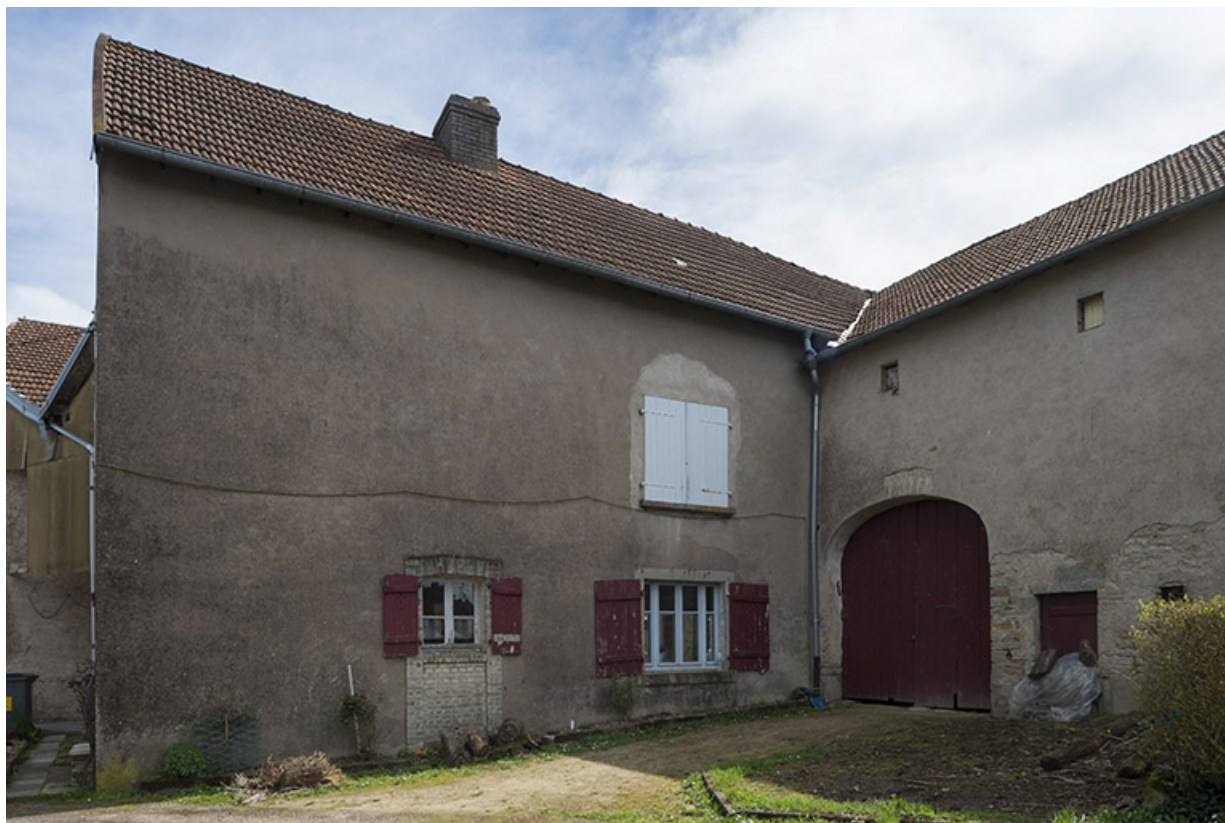
ferme, Port-d'Atelier. 70, Purgerot