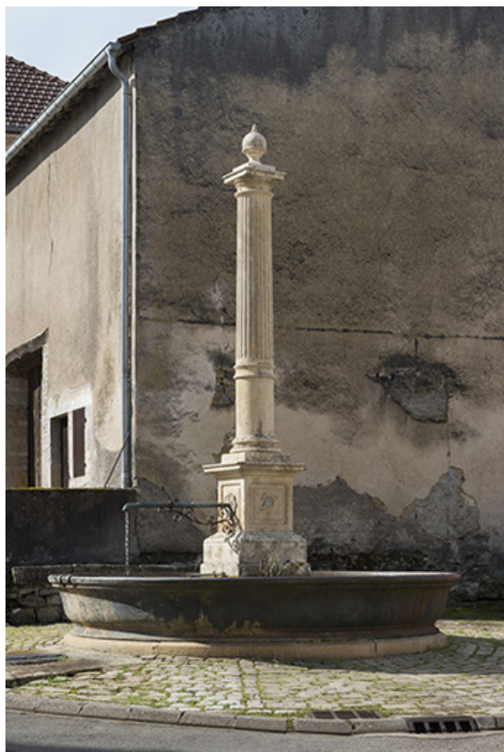
La fontaine face à la mairie.