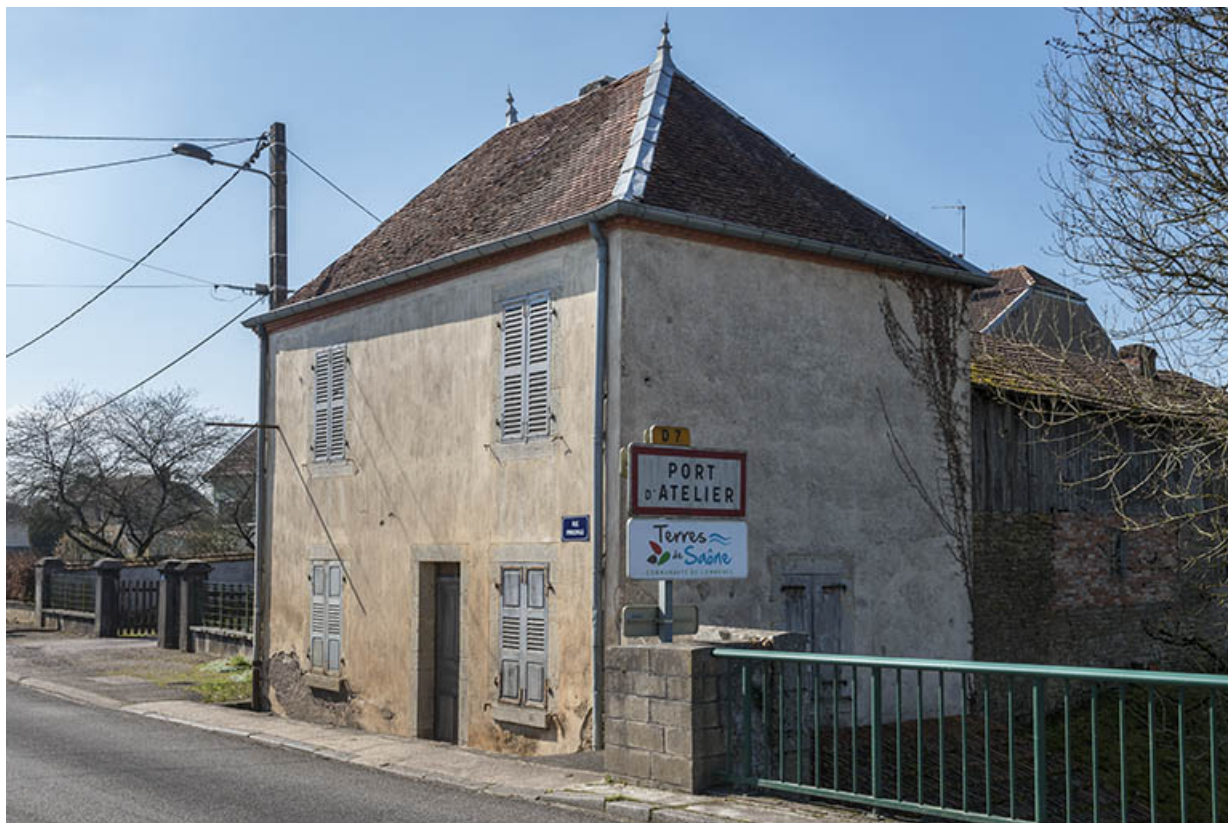
La maison du péagiste à Port-d'Atelier. 70, Purgerot