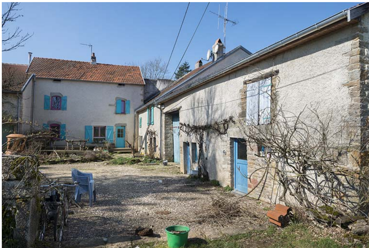
Les façades antérieures du moulin.