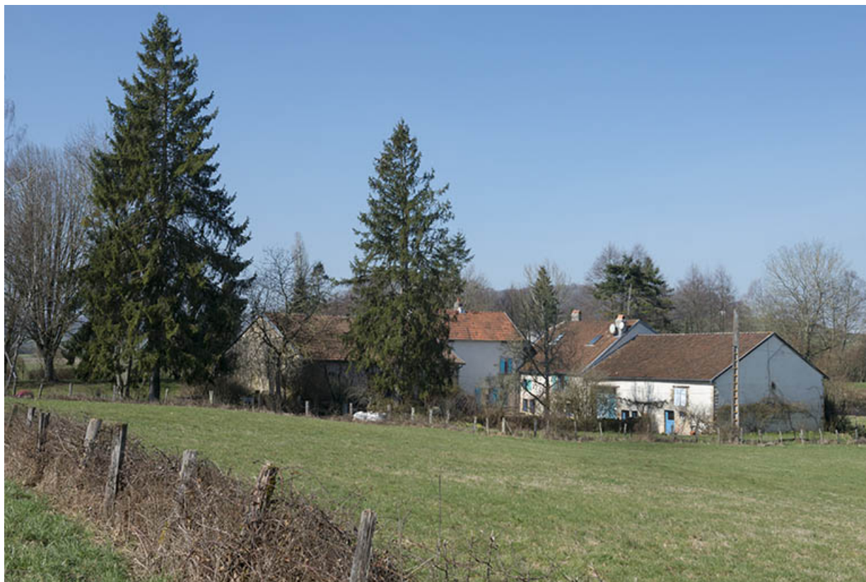
Le moulin Guyot.