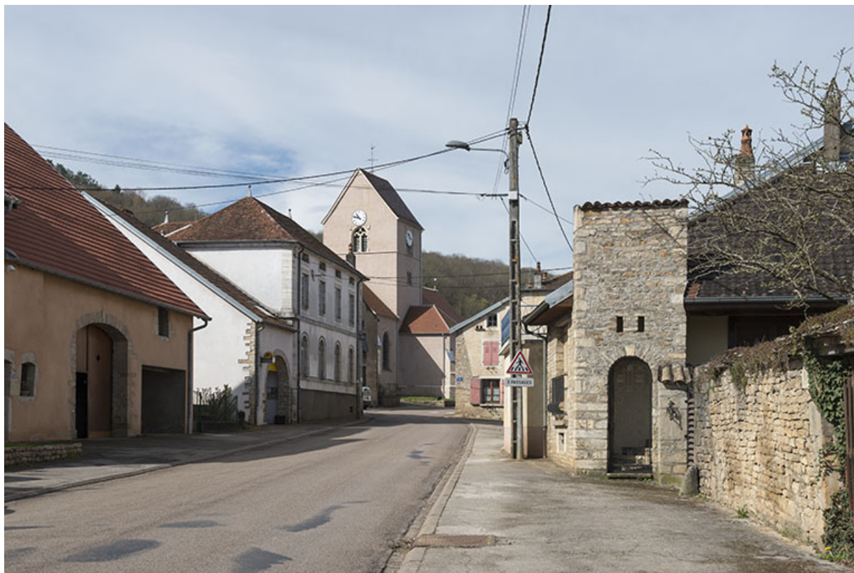
Grande rue. 70, Purgerot