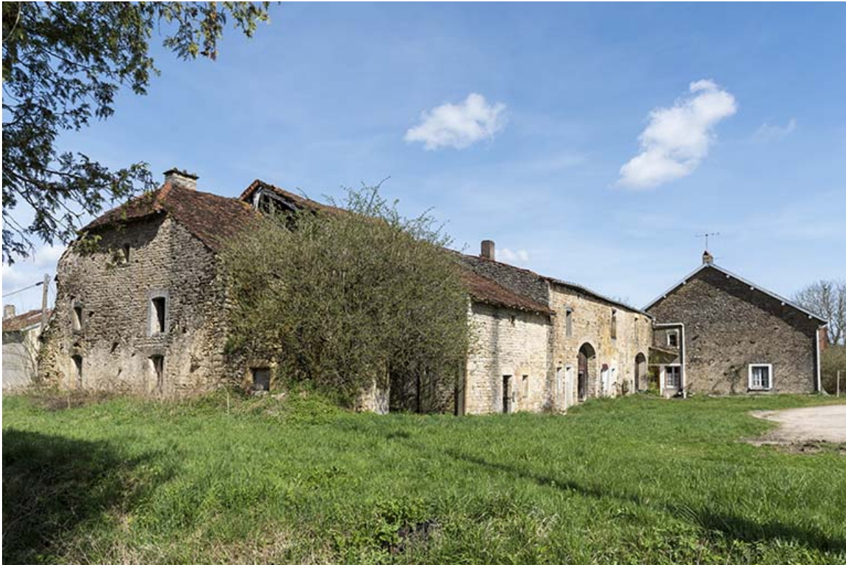
Alignement de maison-fermes au bas du village, le long de la route de Vittel. 70, Betaucourt