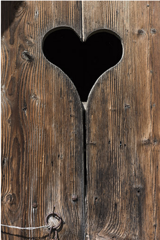
Détail de décor d'une des deux portes de grange : (25 route de Vittel. ) 70, Betaucourt