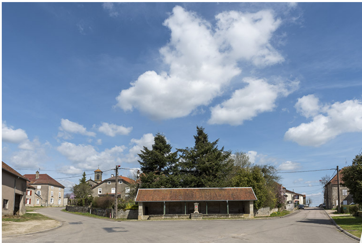
La fontaine-lavoir du bas du village vue de face. 70, Betaucourt