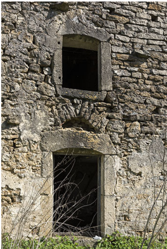
Détail de baies du pignon sud-ouest. (25 route de Vittel.) 70, Betaucourt