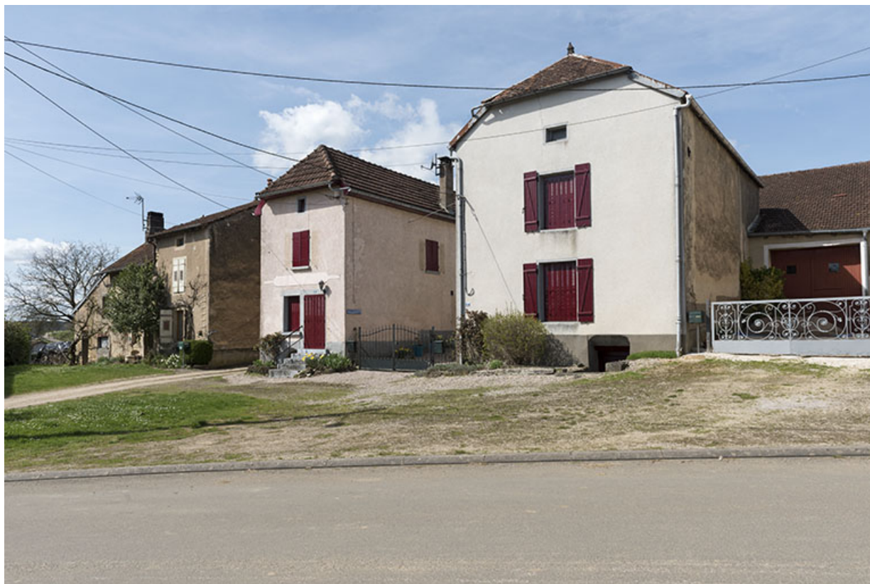
Vue de trois quart est : groupe de maisons-fermes en L avec entrées de cave : 13, 15, 17 Grande rue. 70, Betaucourt