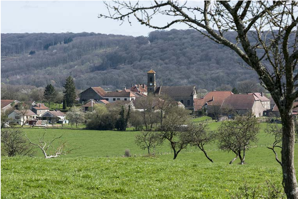
Le Grand-Magny depuis l'ouest du village.