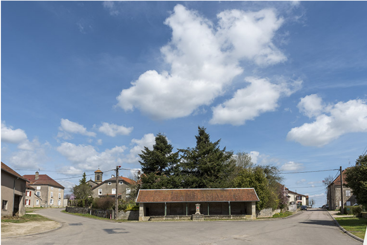
La fontaine-lavoir du bas du village vue de face.