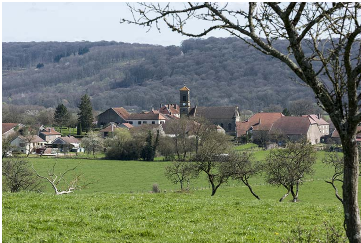
Le Grand-Magny depuis l'ouest du village. 70, Betaucourt