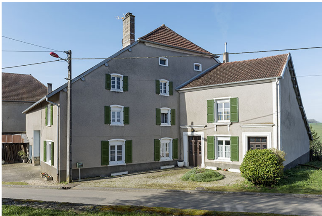
Maison ferme 23 Grande rue. 70, Betaucourt