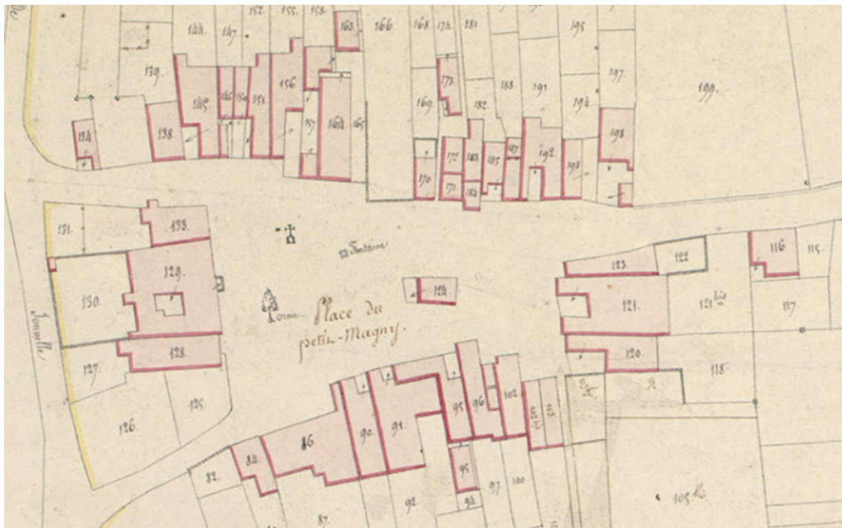
Extrait du cadastre napoléonien terminé le 29 mai 1819 : autour de la place du petit Magny. Section C feuille unique. 70, Betaucourt