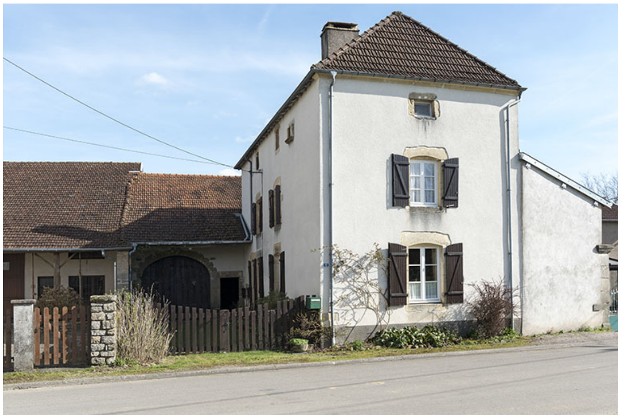
Maison en L, 6 Grande rue. 70, Betaucourt