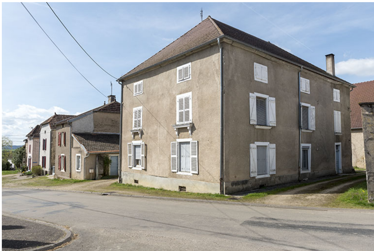
Alignement de façades Grande rue. 70, Betaucourt