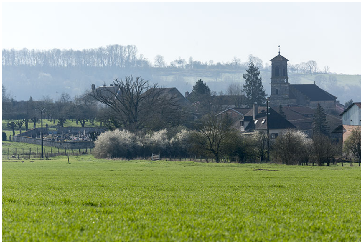
Vue du Grand-Magny depuis le nord-ouest. 70, Betaucourt