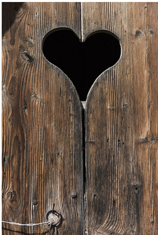
Détail de décor d'une des deux portes de grange : (25 route de Vittel. ) 70, Betaucourt