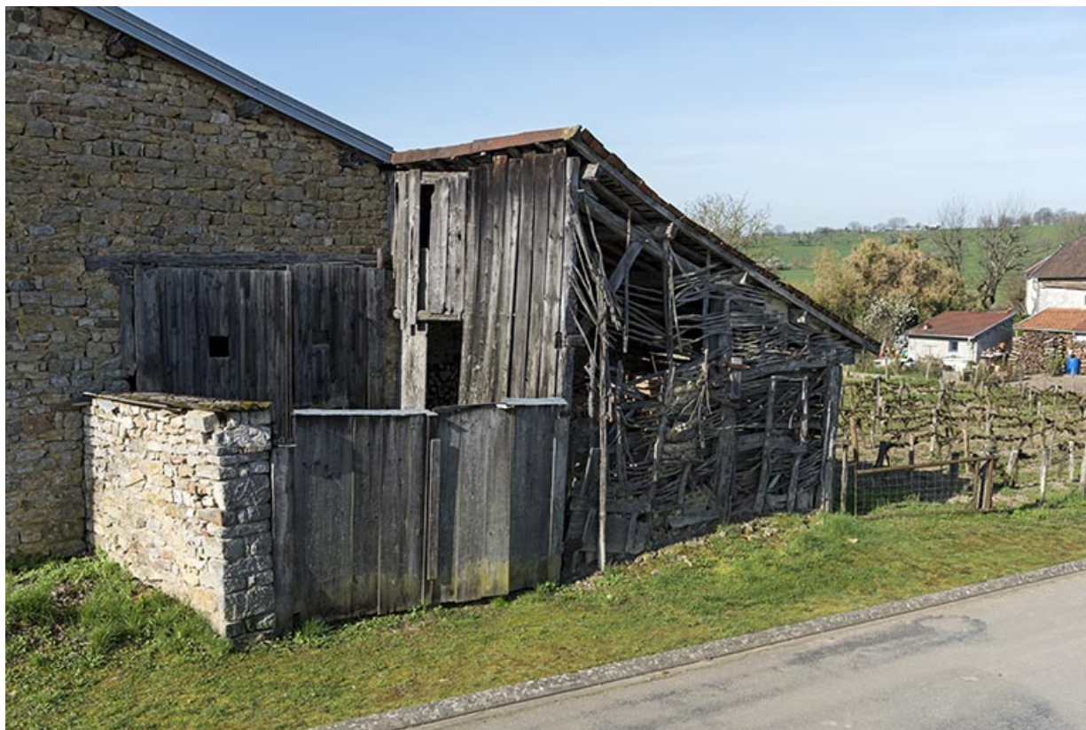
Détail d'un apprentis couvert en tuiles canal, paroi en treillage, à l'angle de la Grande rue et de la rue de Jonvelle. 70, Betaucourt