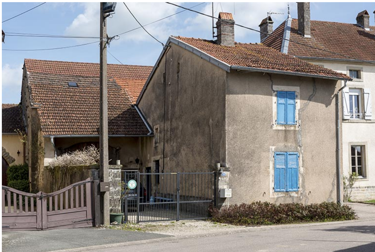
Maison-ferme en L, 18 rue saint-Antoine. 70, Betaucourt