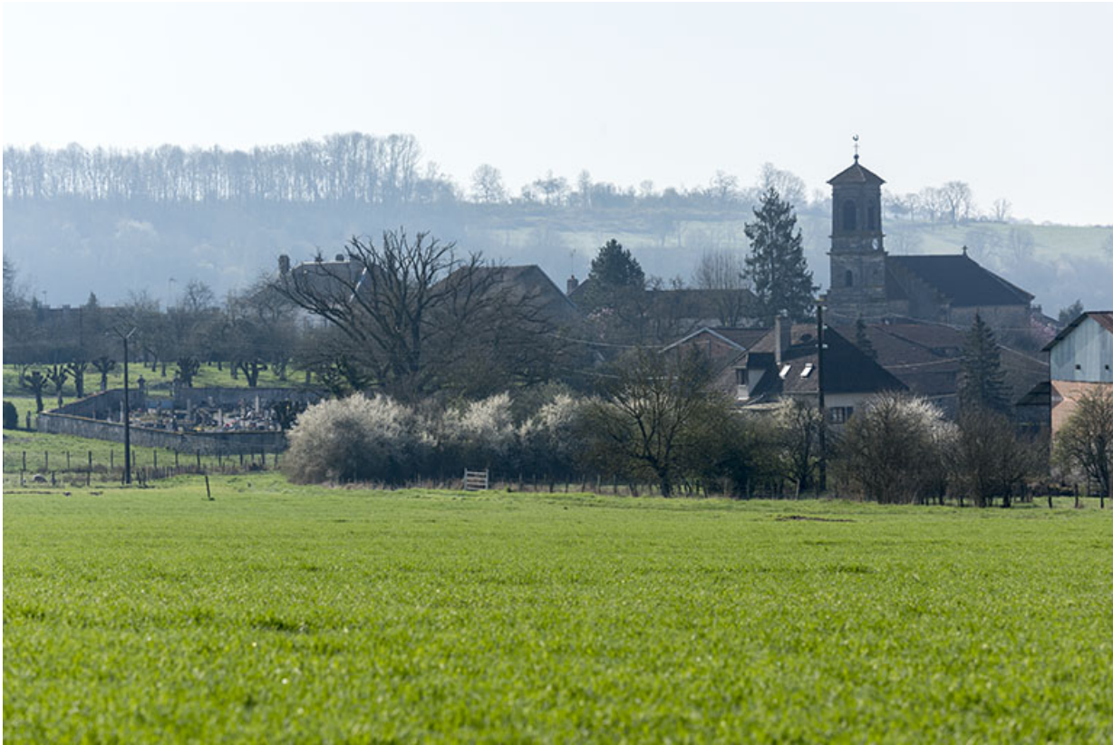
Vue du Grand-Magny depuis le nord-ouest. 70, Betaucourt