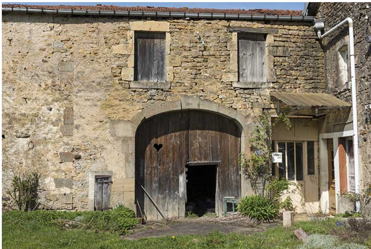
Détail d'une des deux portes de grange avec date portée : 1844. (25 route de Vittel. ) 70, Betaucourt