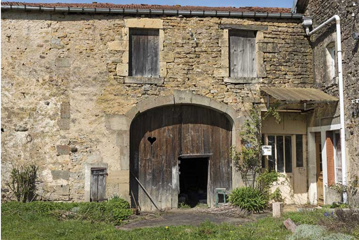
Détail d'une des deux portes de grange avec date portée : 1844. (25 route de Vittel. ) 70, Betaucourt