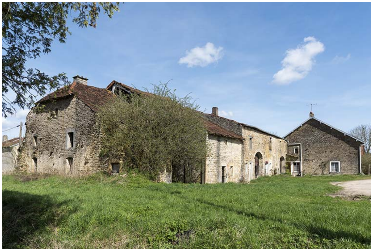
Alignement de maison-fermes au bas du village, le long de la route de Vittel. 70, Betaucourt