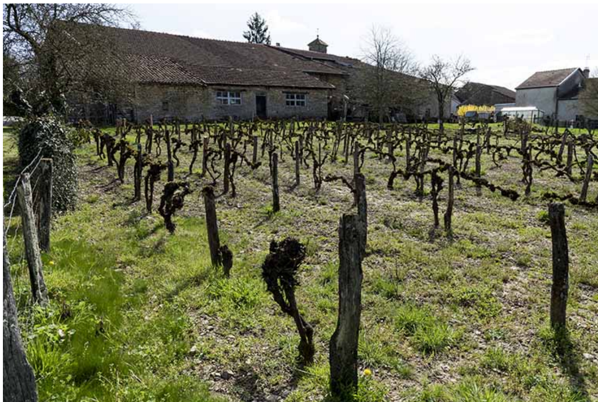
Vigne au coeur du village.