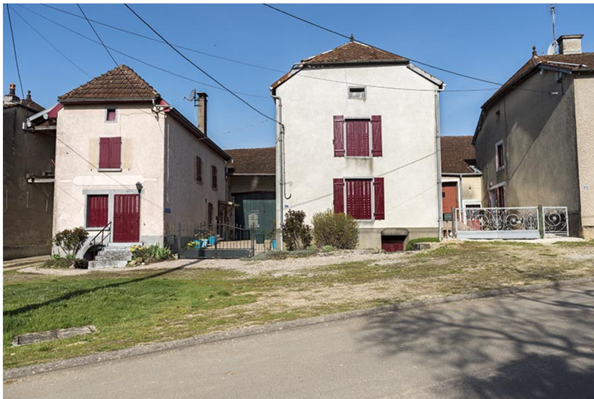
Vue de face du groupe de maisons-fermes en L avec entrées de cave : 13, 15, 17 Grande rue. 70, Betaucourt