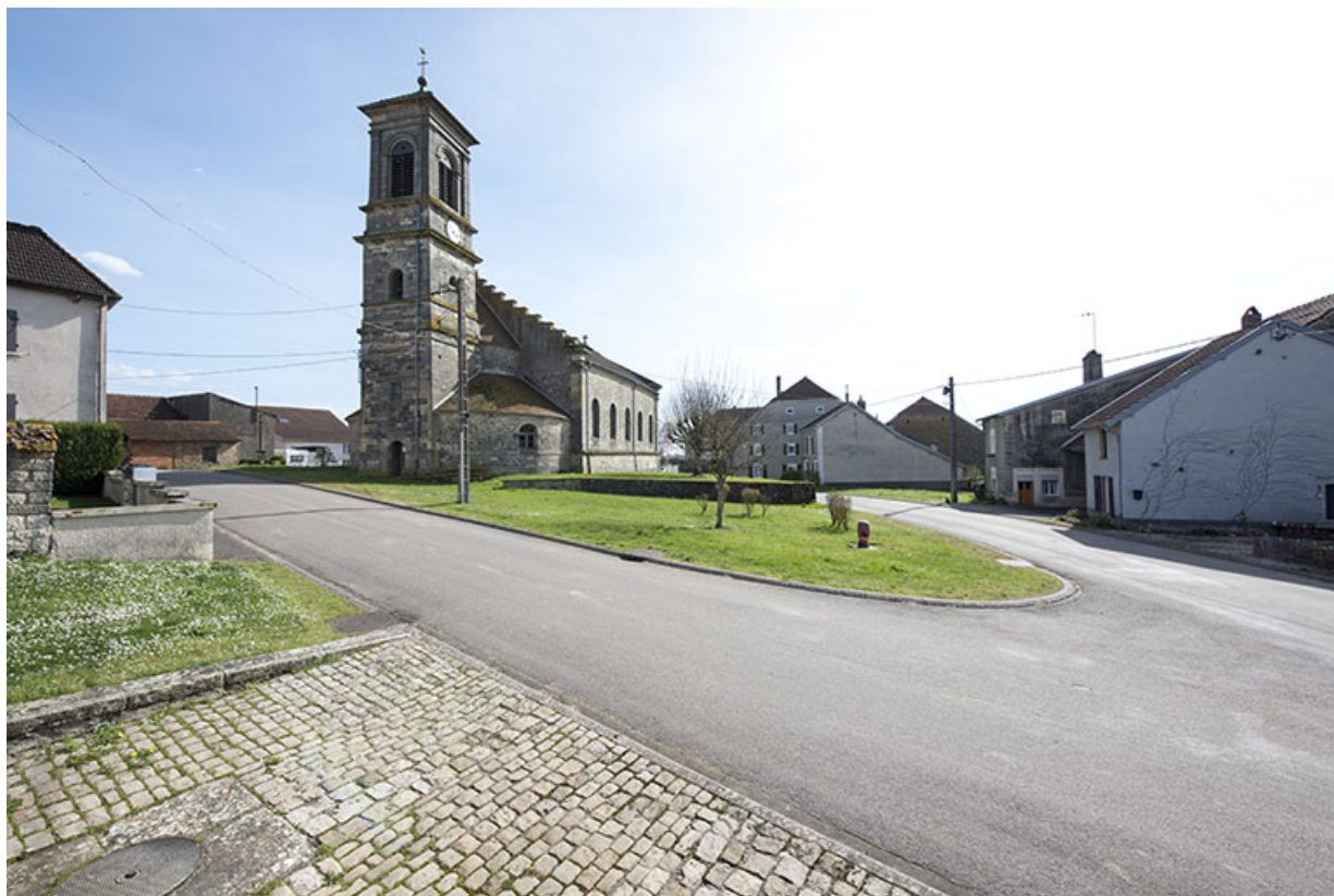
Place et église vues du nord-ouest.