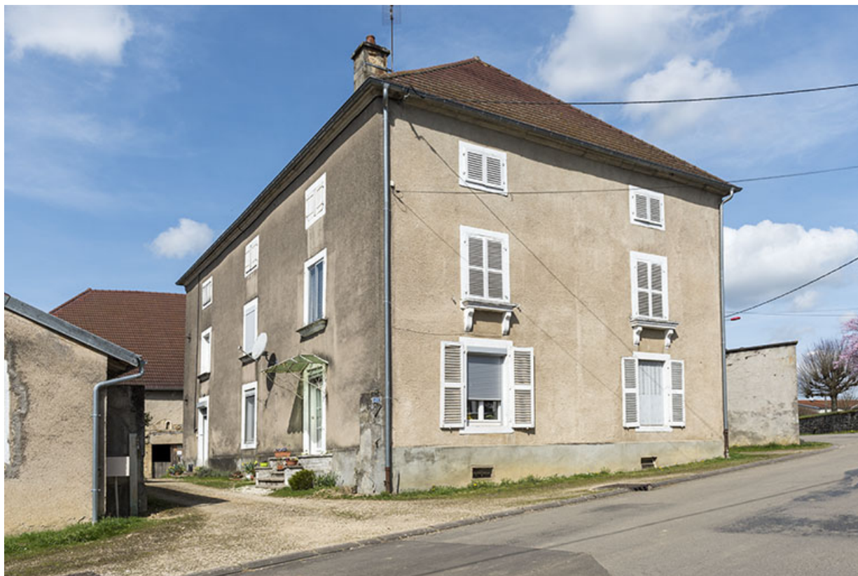
Vue de trois-quart de la maison 21 Grande rue. 70, Betaucourt