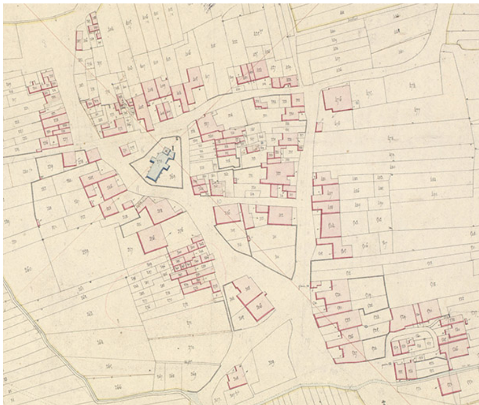
Extrait du cadastre napoléonien terminé le 29 mai 1819 : le centre du village. Section C feuille unique. 70, Betaucourt