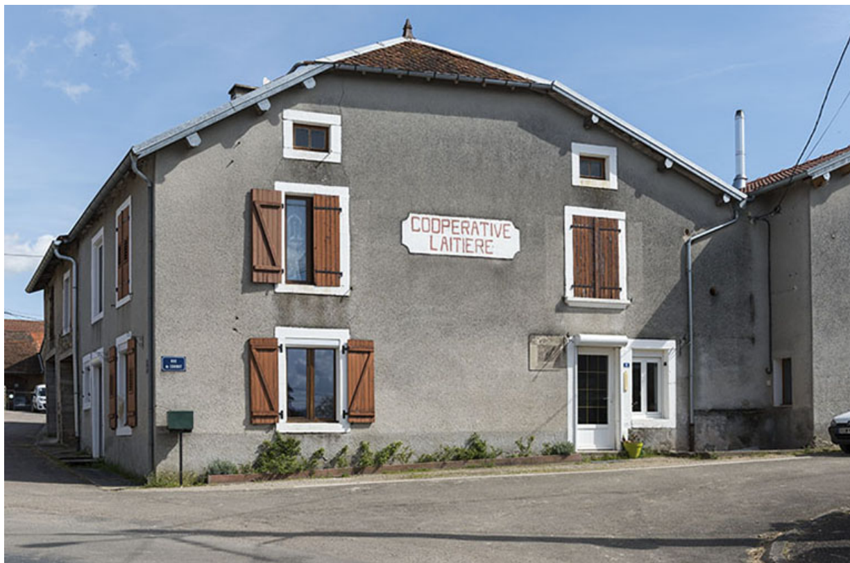
Ancienne coopérative laitière.