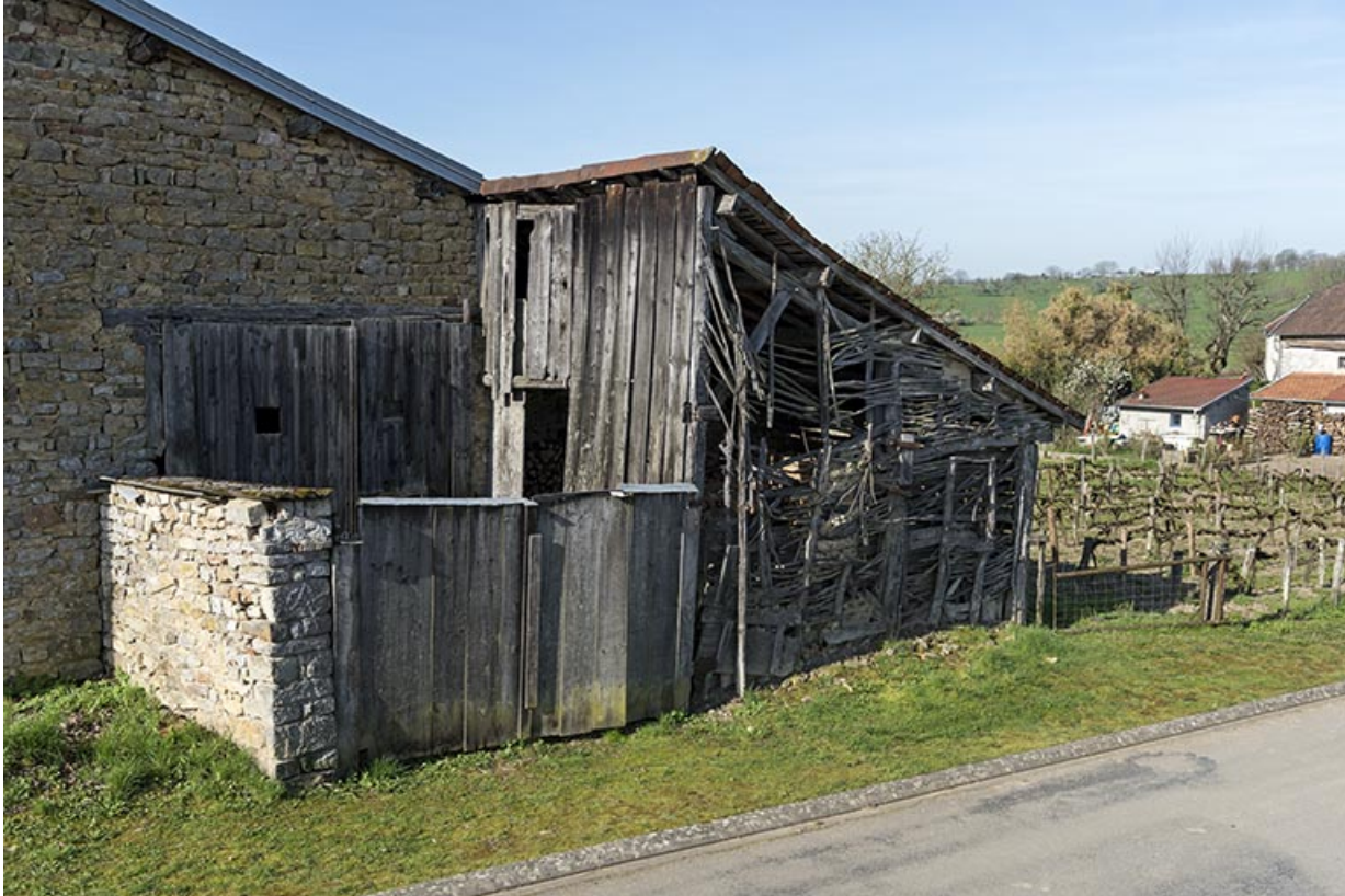
Détail d'un appentis couvert en tuiles canal, paroi en treillage, à l'angle de la Grande rue et de la rue de Jonvelle. 70, Betaucourt