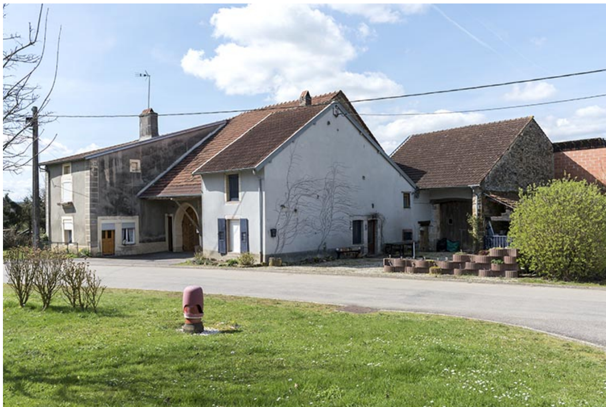
Groupe de maisons-fermes en L : 27, 29 grande rue. 70, Betaucourt