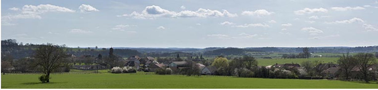
Vue du village depuis le nord.