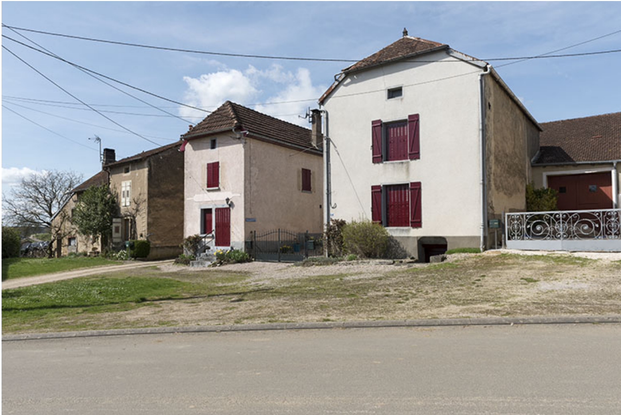
Vue de trois quart est : groupe de maisons-fermes en L avec entrées de cave : 13, 15, 17 Grande rue. 70, Betaucourt