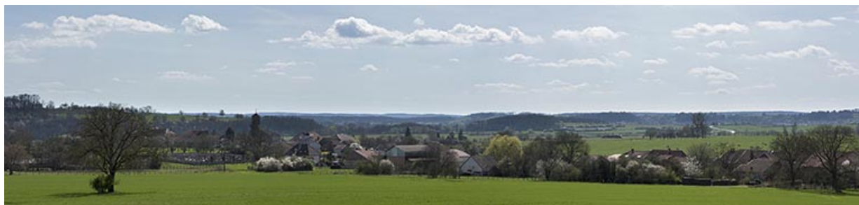
Vue du village depuis le nord.