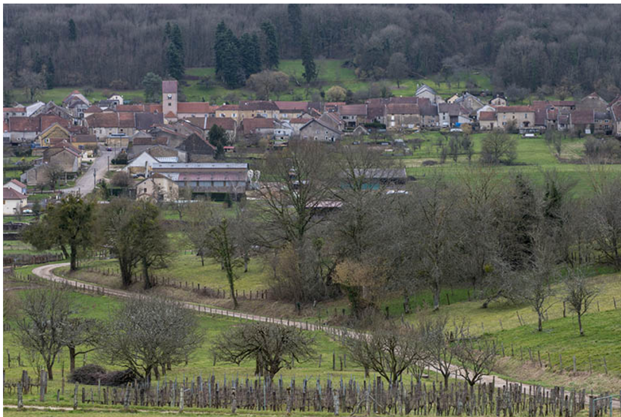
Le village de Purgerot depuis la ferme de la Grande vigne. 70, Purgerot