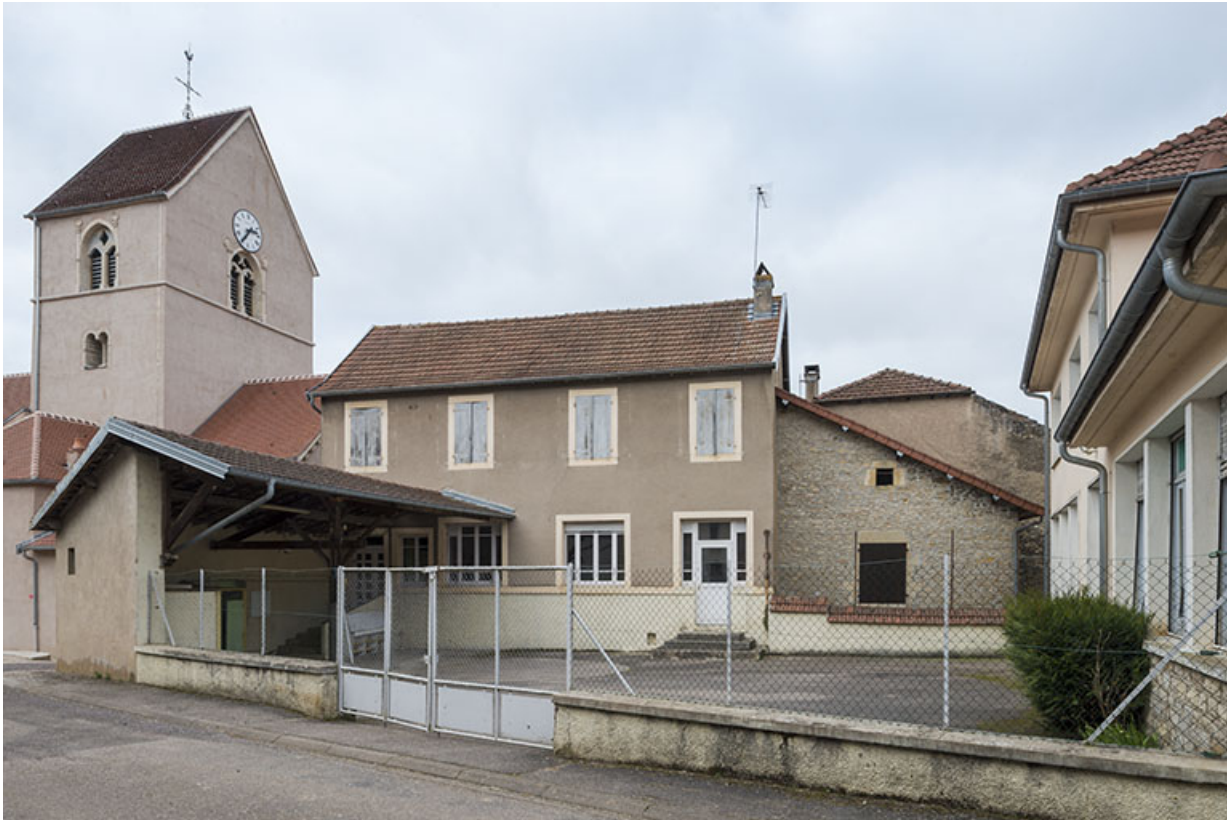
L'ancienne maison d'école des filles.