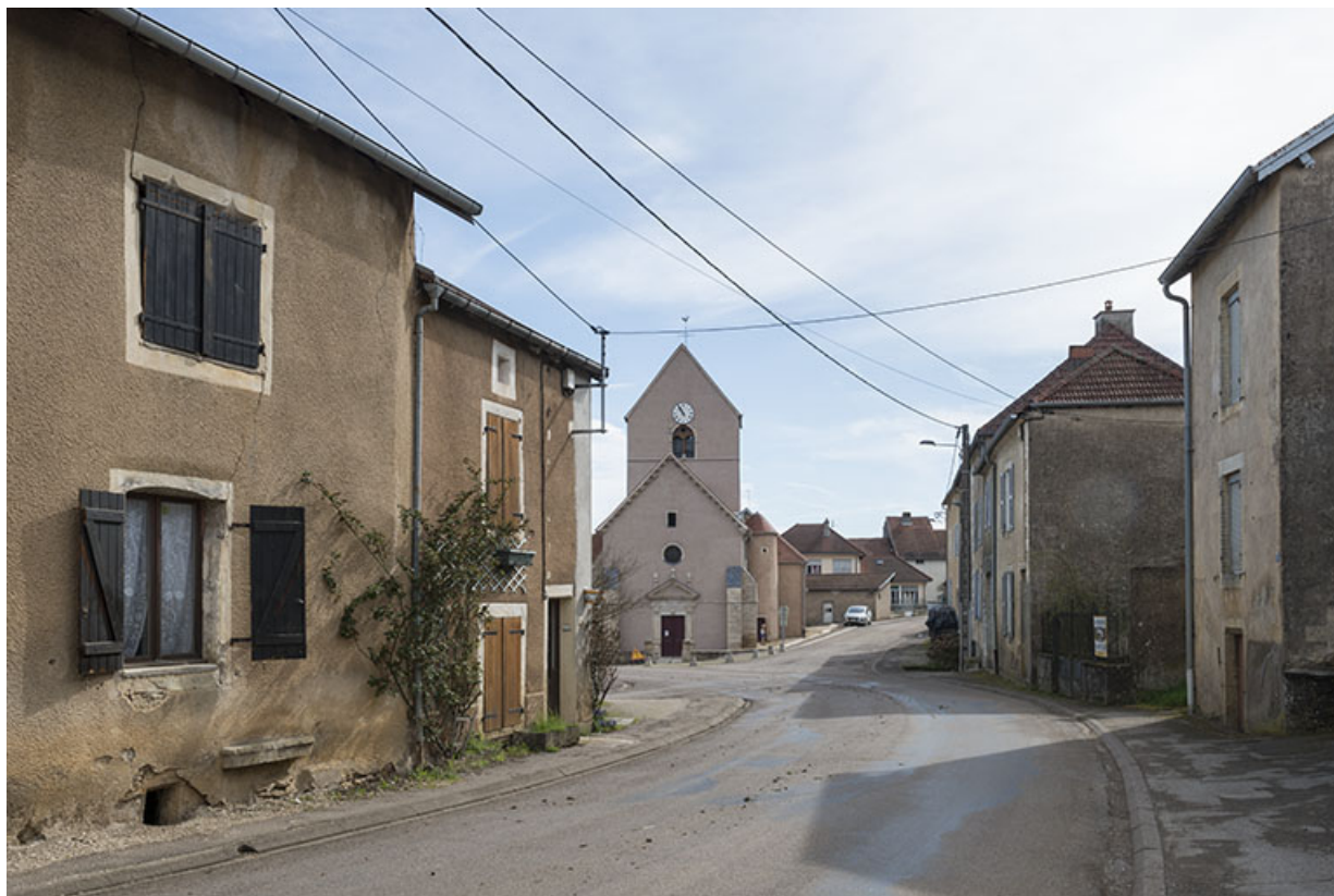
L'église et la rue des Ecoles.