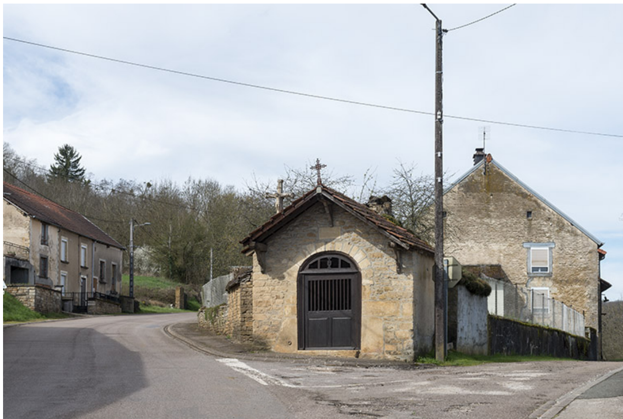
La chapelle à la sortie du village en direction d'Arbecy. 70, Purgerot