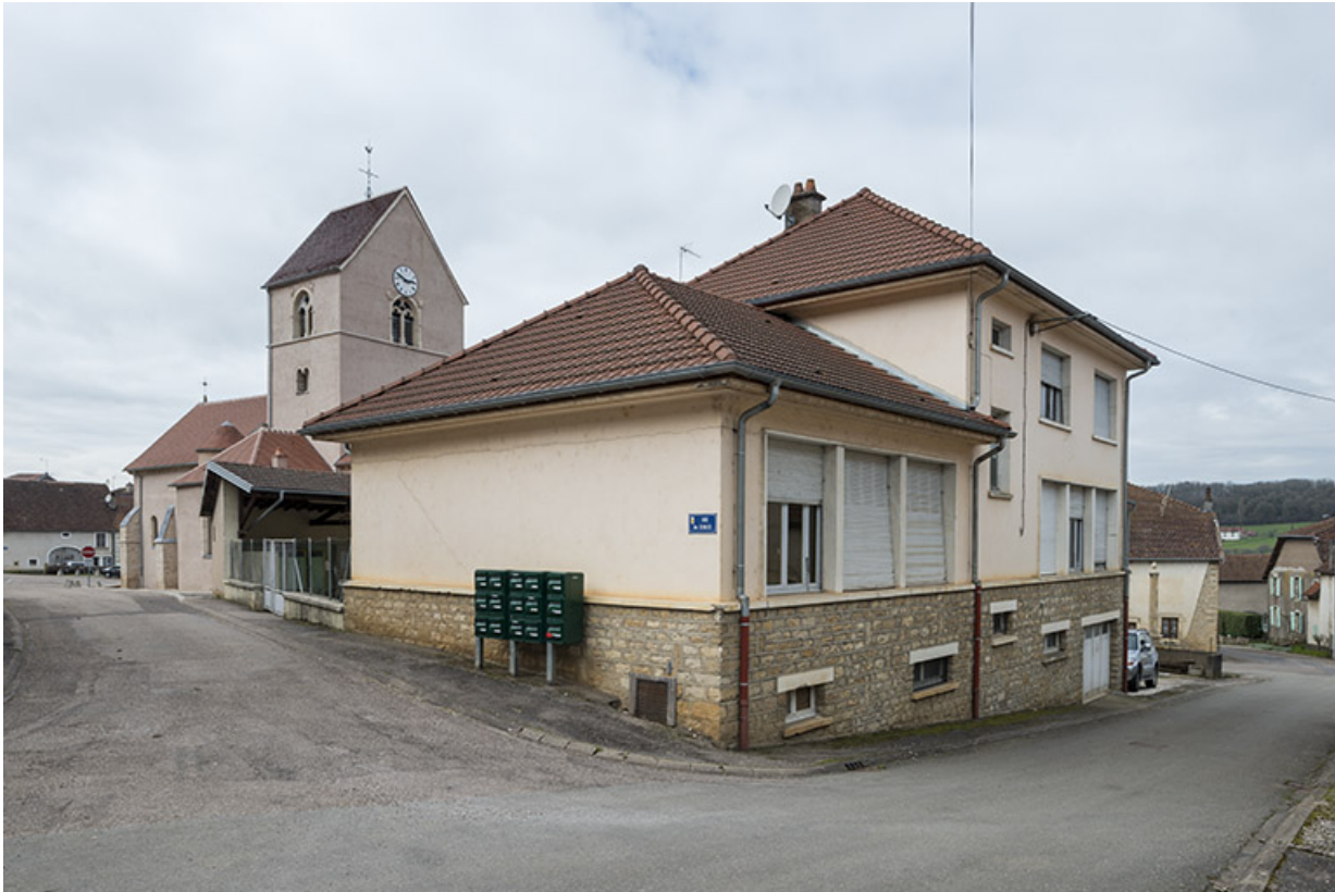
Le groupe scolaire et le clocher de l'église en arrière-plan. 70, Purgerot