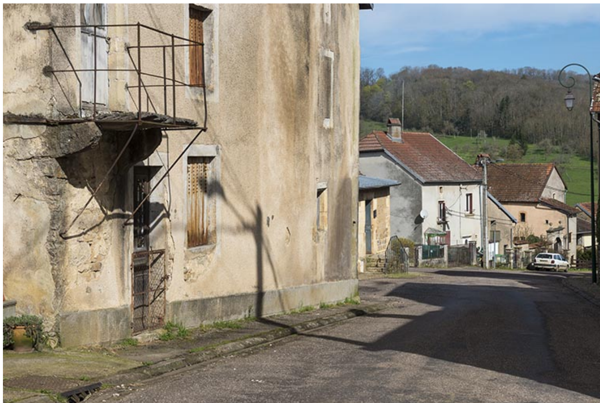
Rue du Vaux. 70, Purgerot