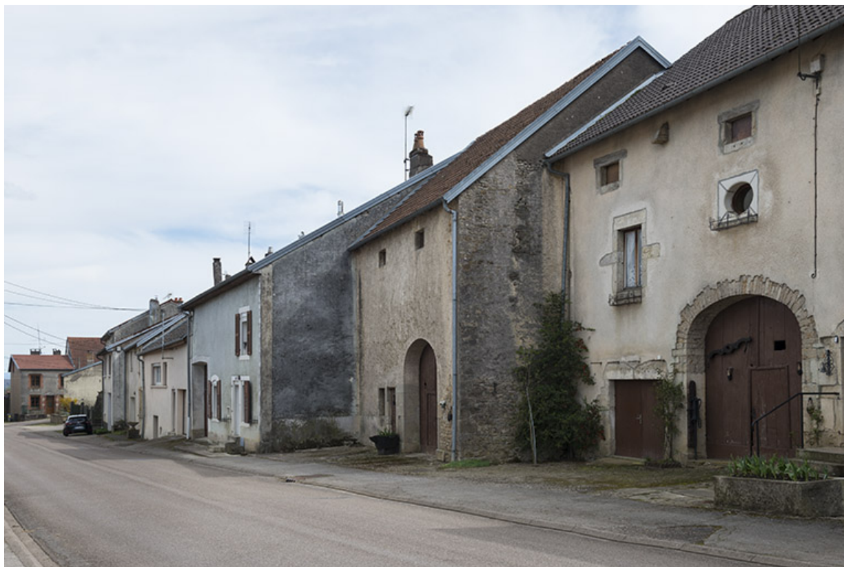
Alignement de fermes, Grande rue. 70, Purgerot