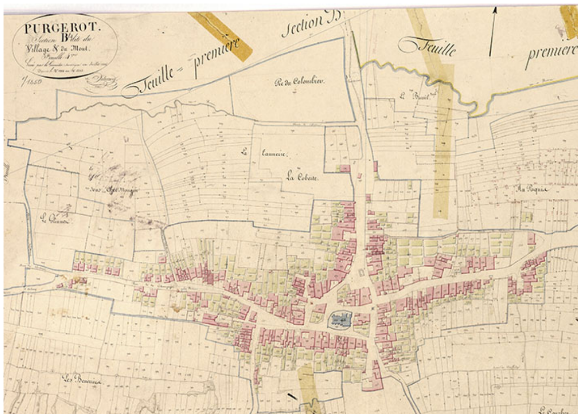
Plan du village extrait du plan cadastral, 1826. 70, Purgerot

Plan du village extrait du plan cadastral de la commune de Purgerot, section B, dessin plume-lavis, dressé par le géomètre Delorme, 1826, échelle 1/1250.