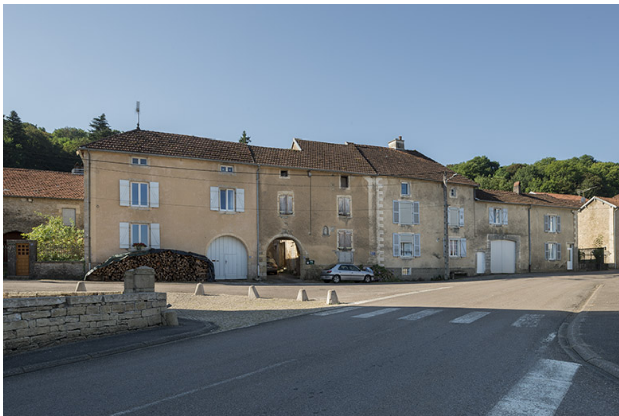
Rue des Ecoles avec l'ancienne laiterie au centre. 70, Purgerot