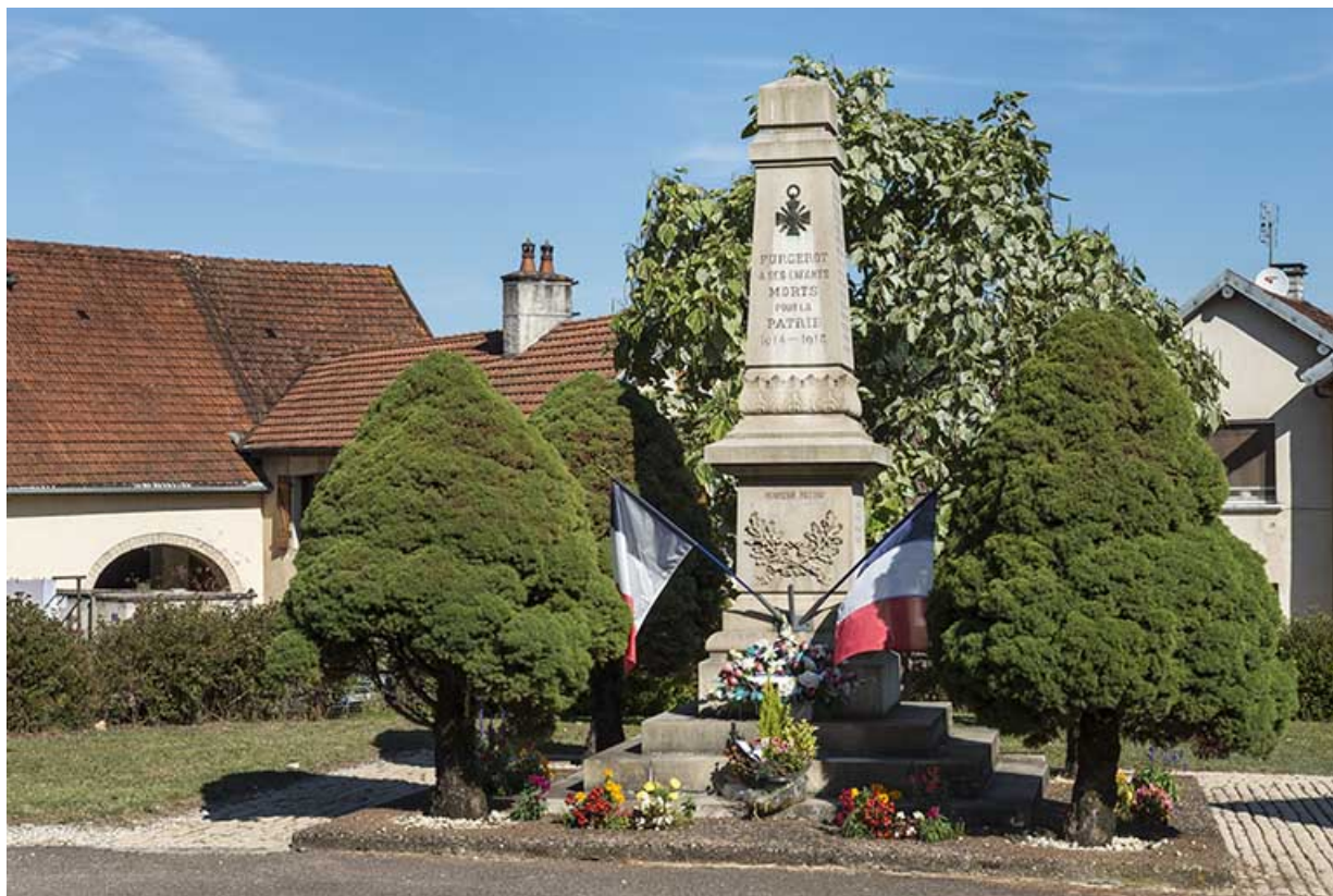
Le monument aux morts sur la place publique. 70, Purgerot