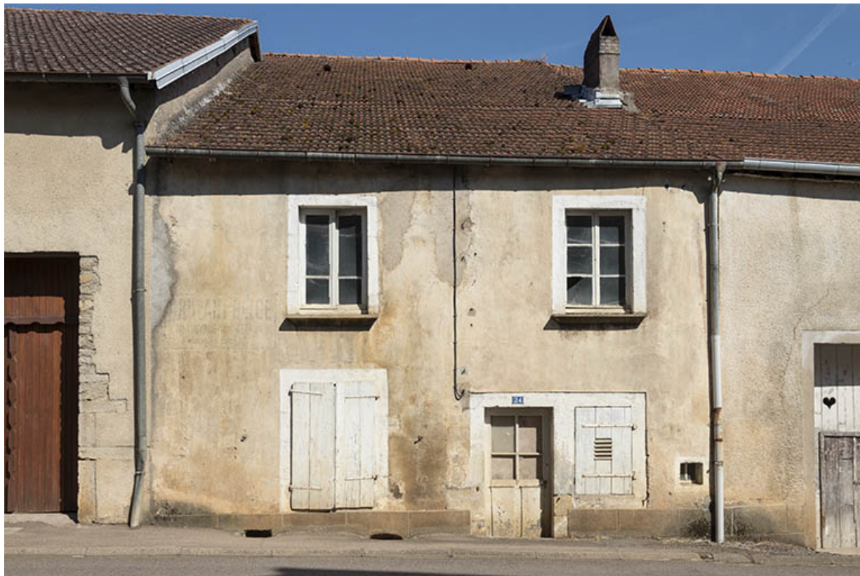
Maison mitoyenne, Grande rue. 70, Purgerot