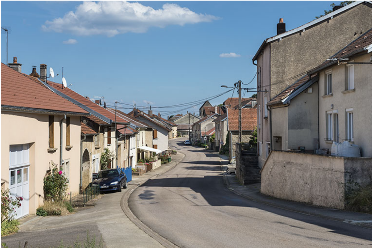
Grande rue. 70, Purgerot