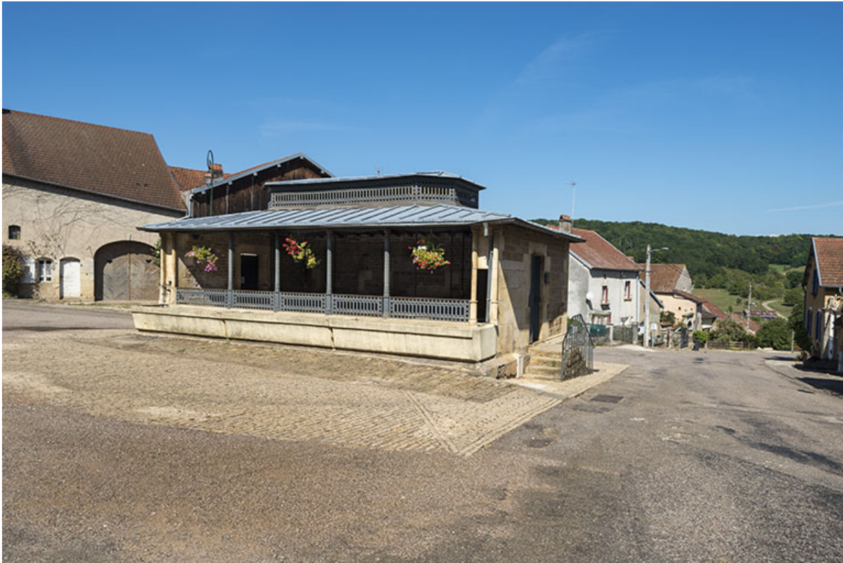
Le lavoir, rue du Vaux.