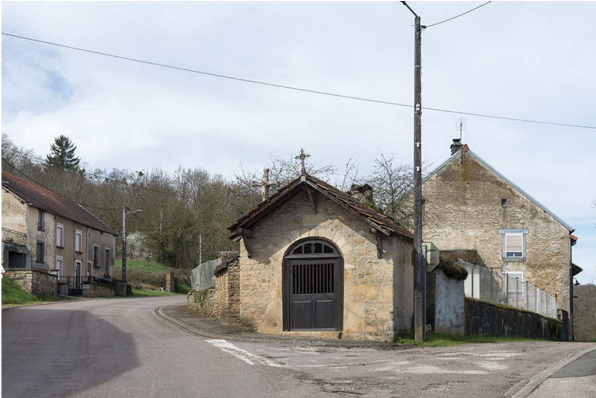
La chapelle à la sortie du village en direction d'Arbecsey. 70, Purgerot