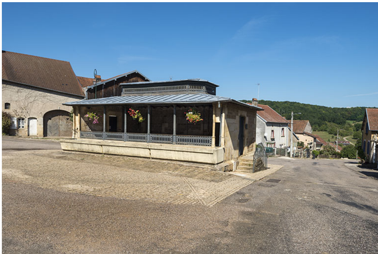
Le lavoir, rue du Vaux. 70, Purgerot