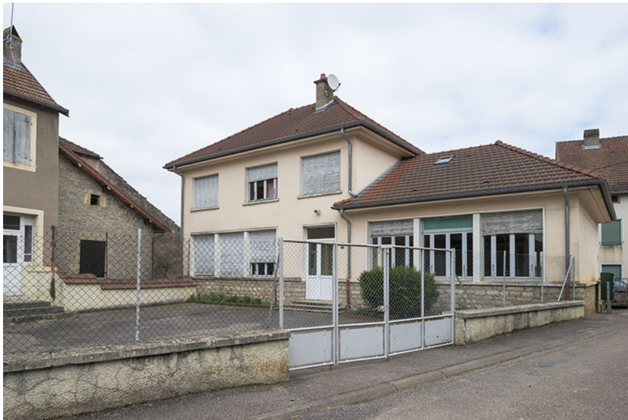
Le groupe scolaire, rue des Ecoles. 70, Purgerot