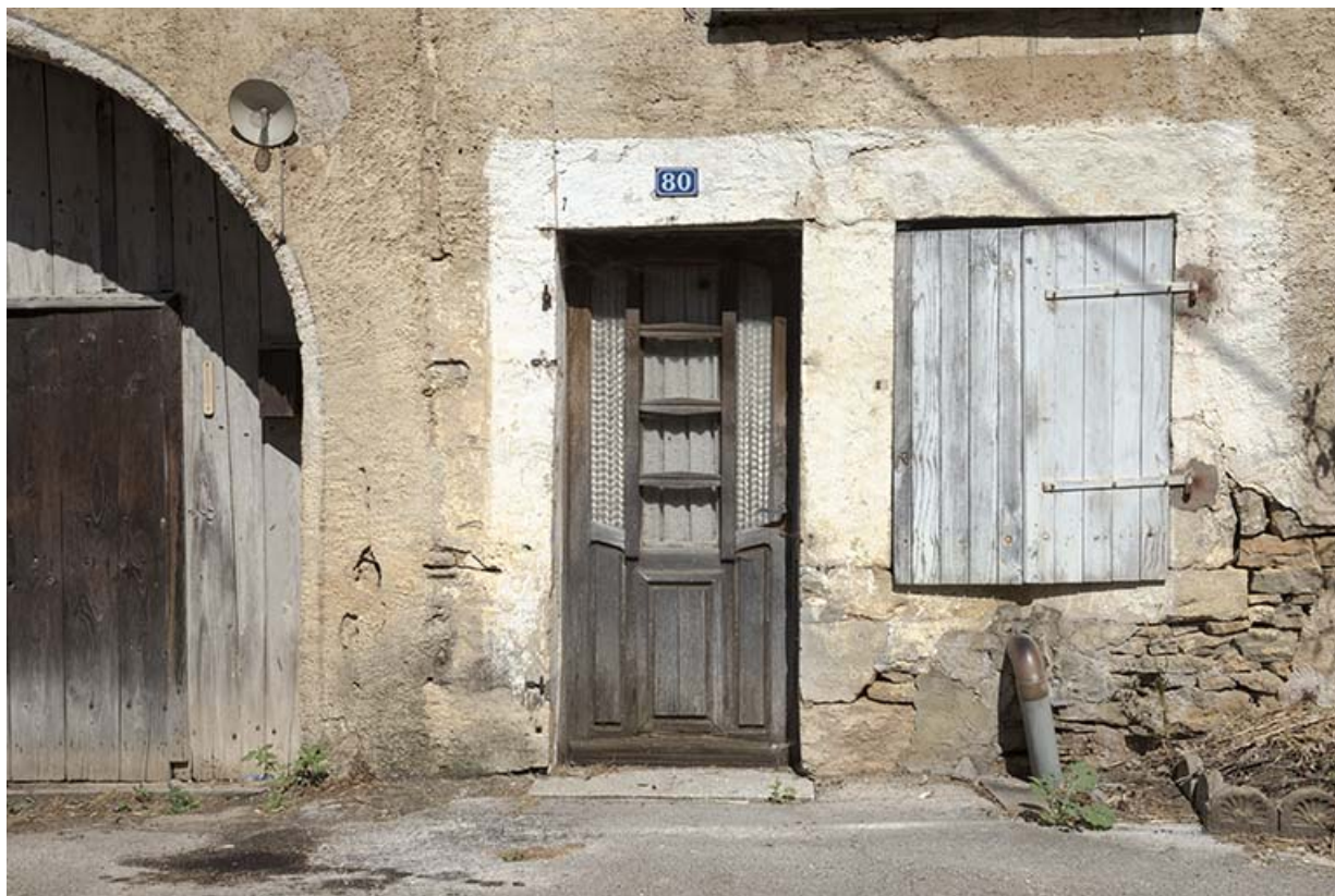
La porte donnant accès au logement de la ferme. 70, Purgerot