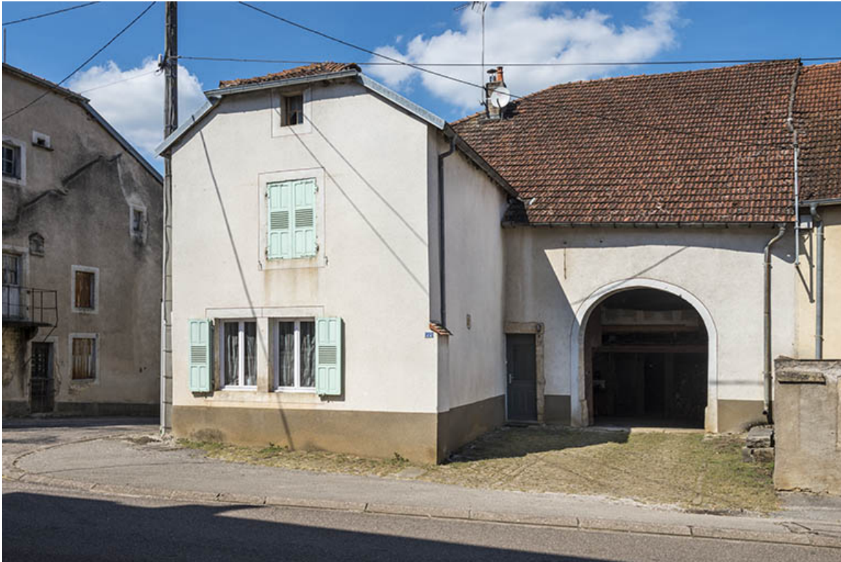
Ferme située à l'angle de rue du Vaux et de la Grande rue. 70, Purgerot