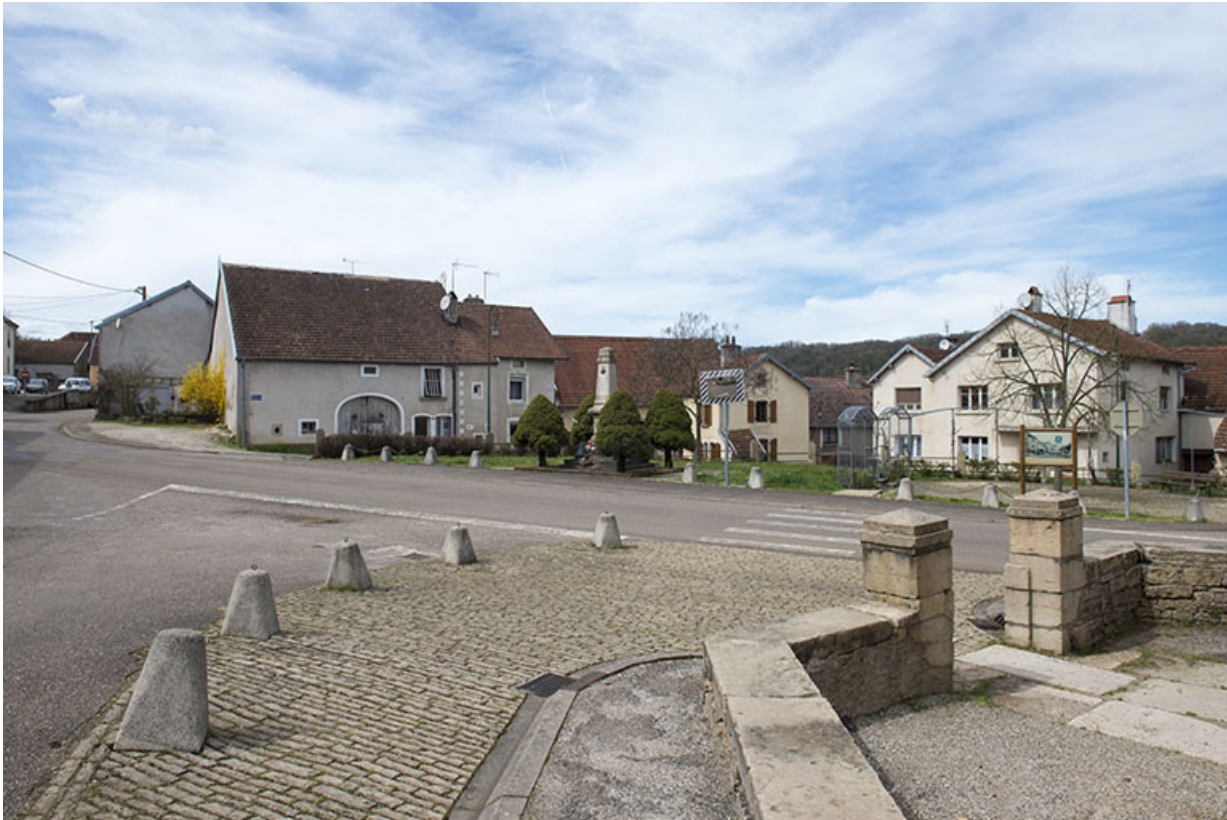
Vue générale depuis le parvis de l'église.