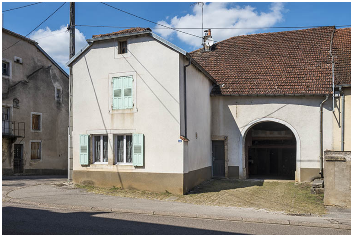
Ferme située à l'angle de rue du Vaux et de la Grande rue. 70, Purgerot