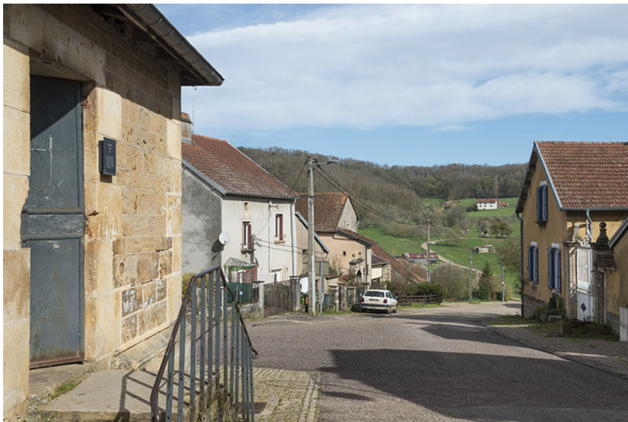
La rue du Vaux et la ferme de la Grande vigne en arrière-plan. 70, Purgerot