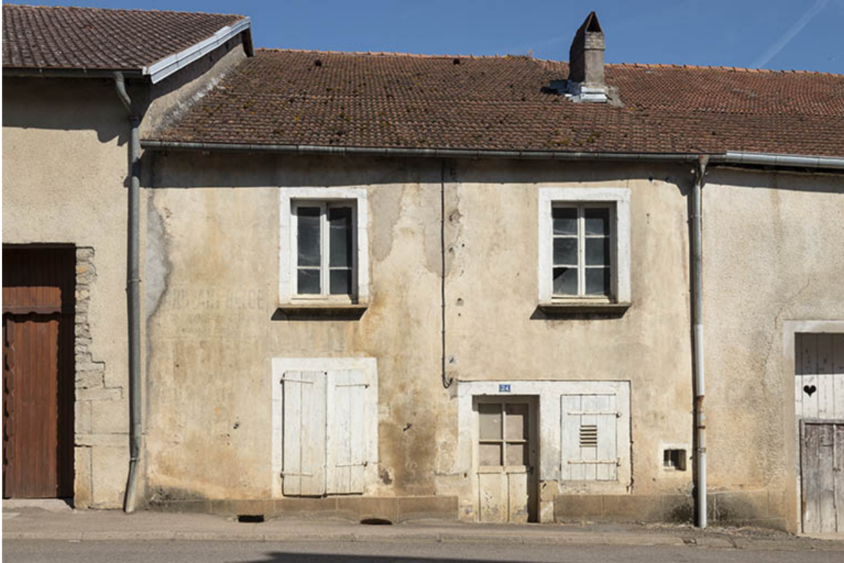
Maison mitoyenne, Grande rue.