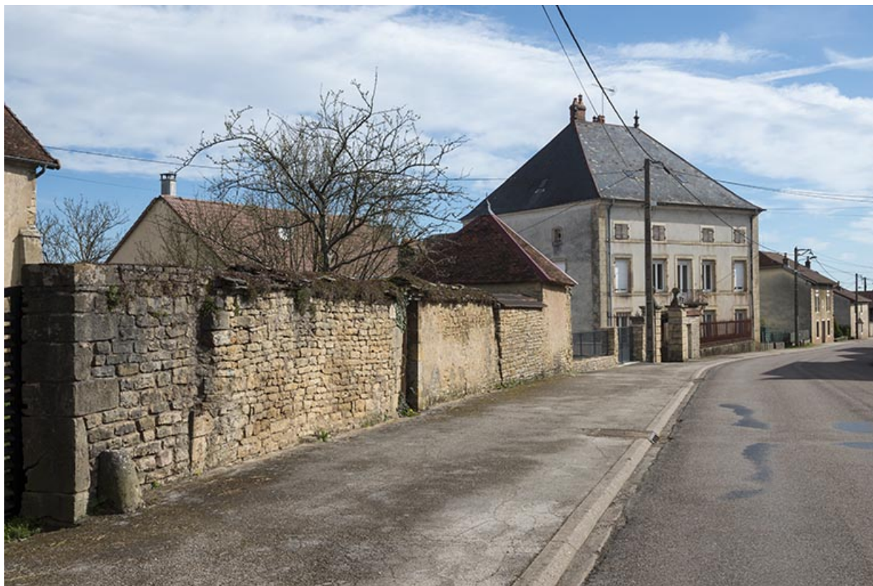
La Grande rue en direction de la Saône. 70, Purgerot