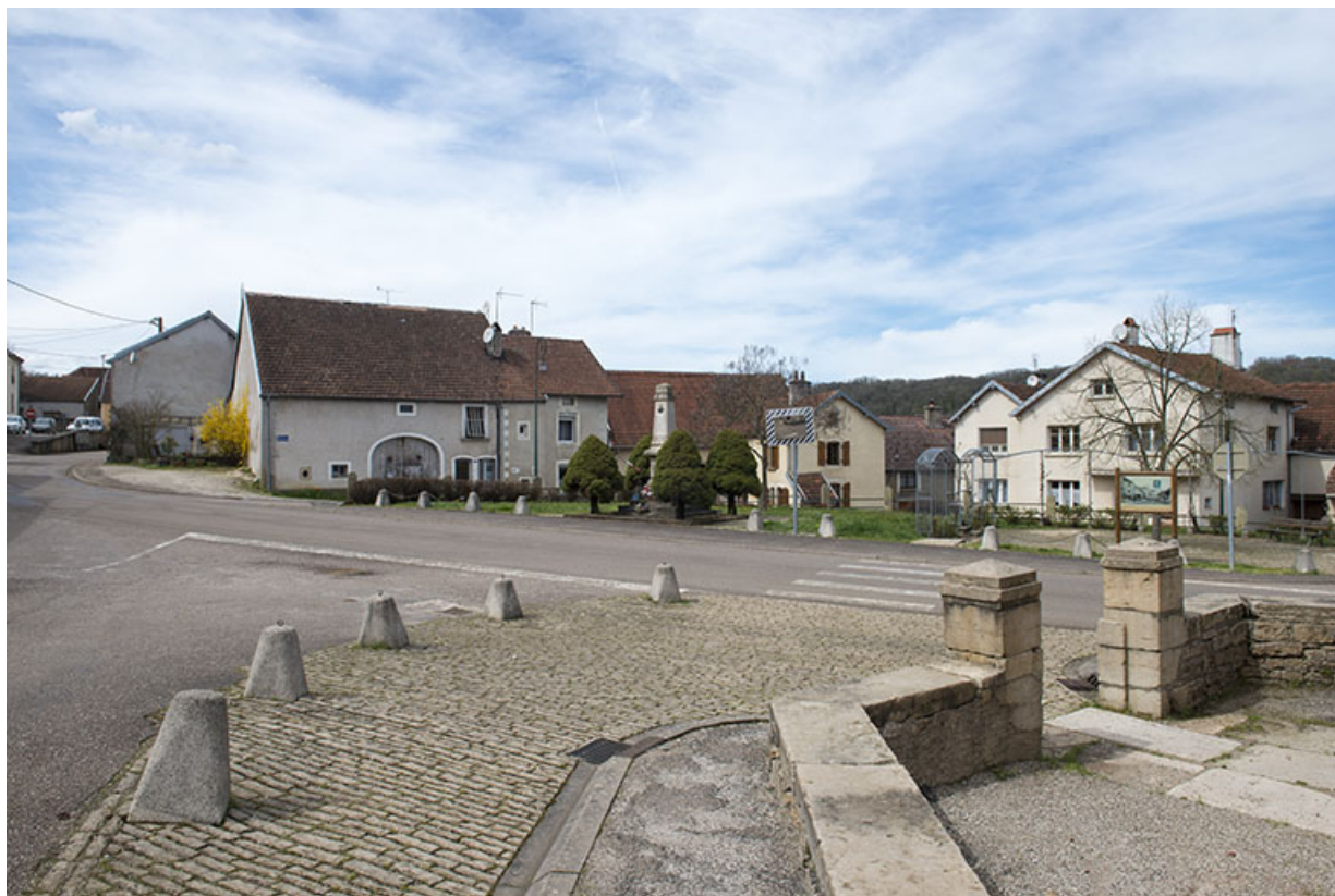
Vue générale depuis le parvis de l'église. 70, Purgerot