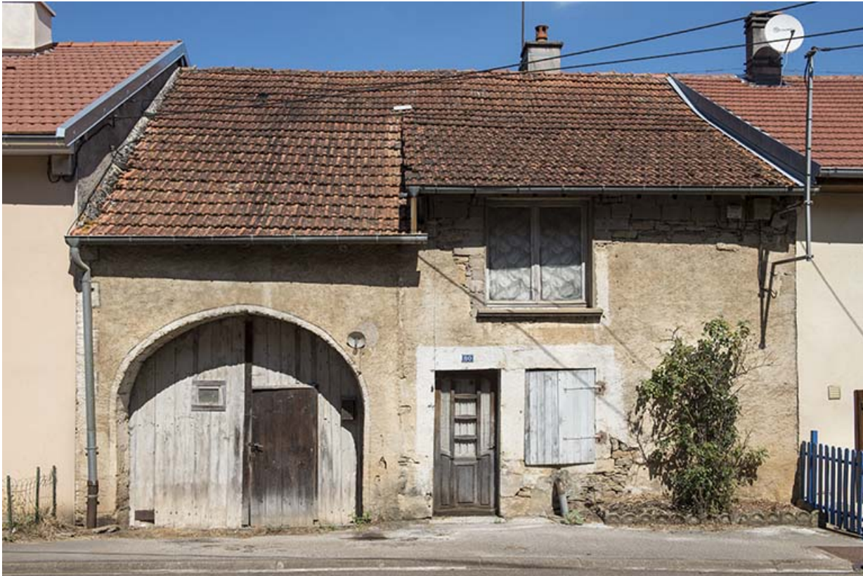
Ferme-bloc à deux travées.