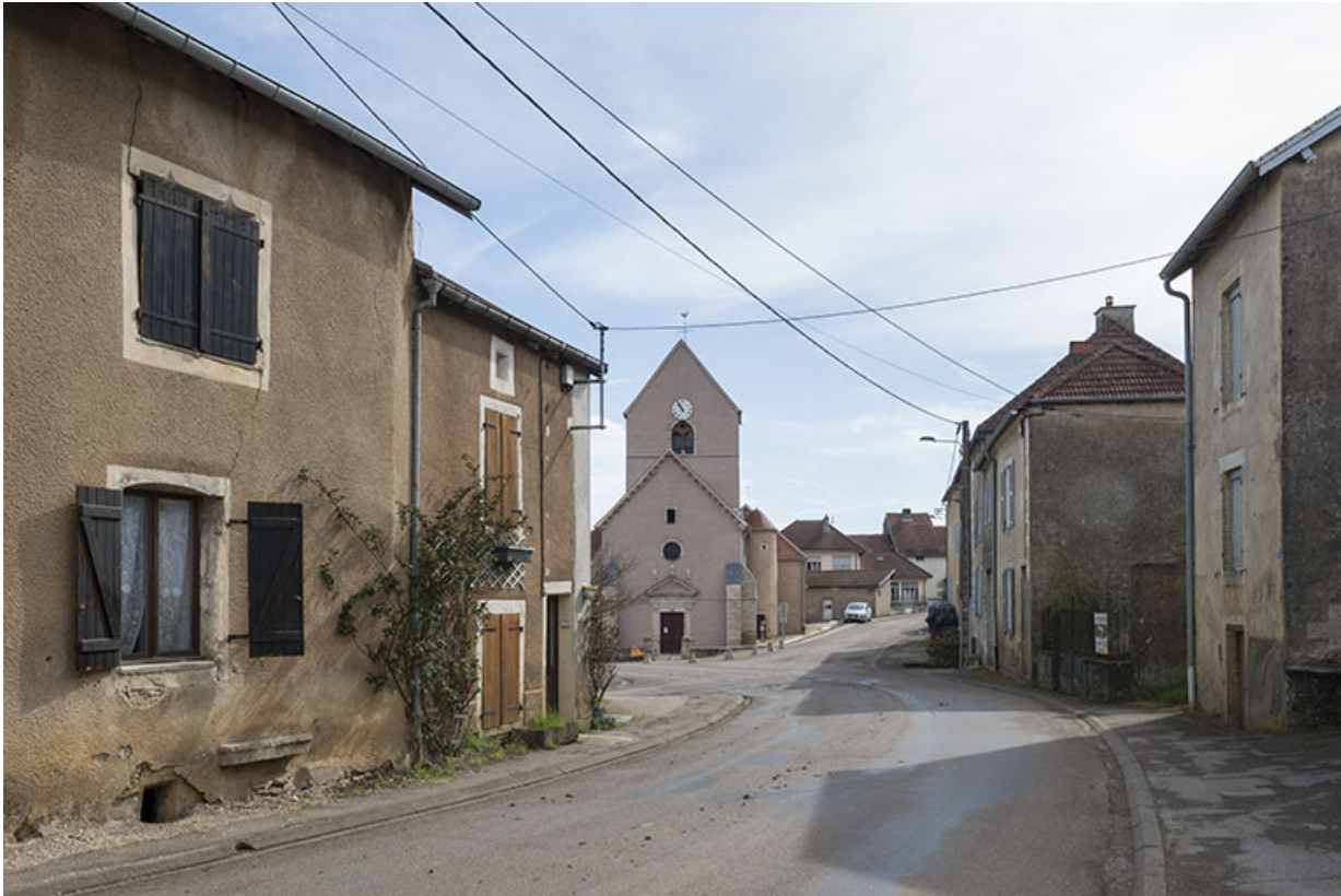
L'église et la rue des Ecoles.