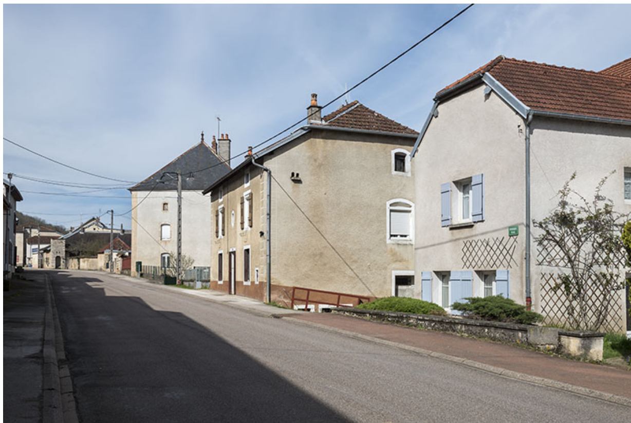
La Grande rue en direction de l'église. 70, Purgerot