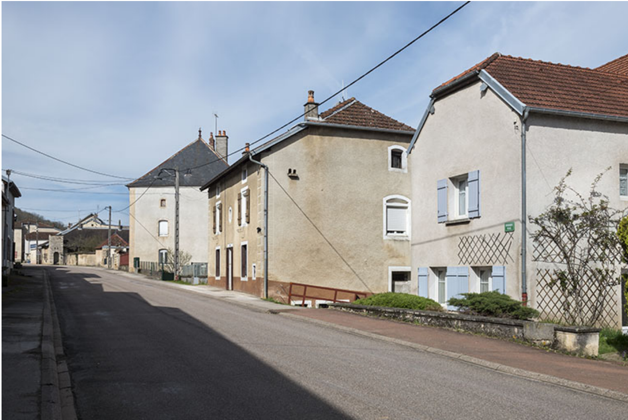
La Grande rue en direction de l'église.