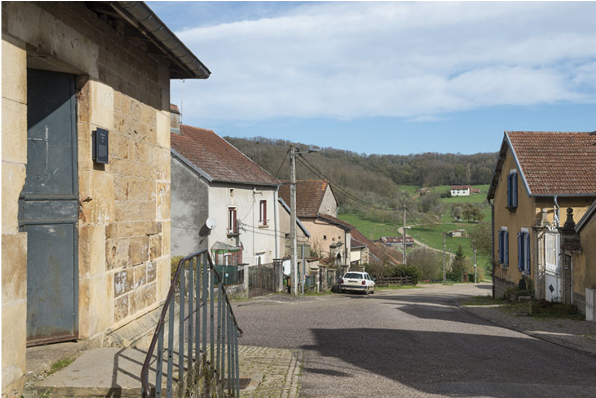
La rue du Vaux et la ferme de la Grande vigne en arrière-plan.