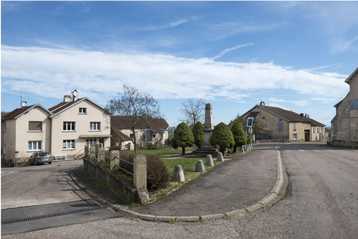
La place publique.