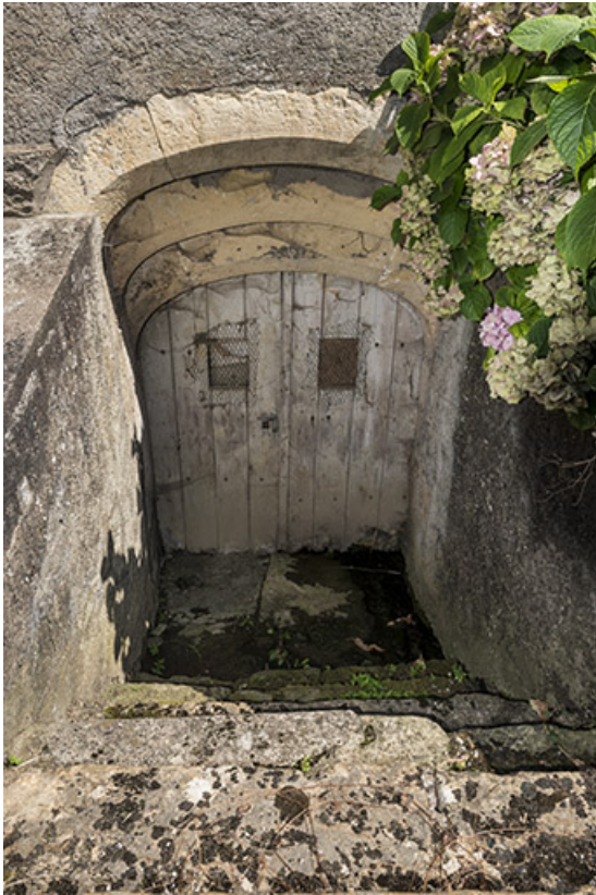
Entrée de cave.