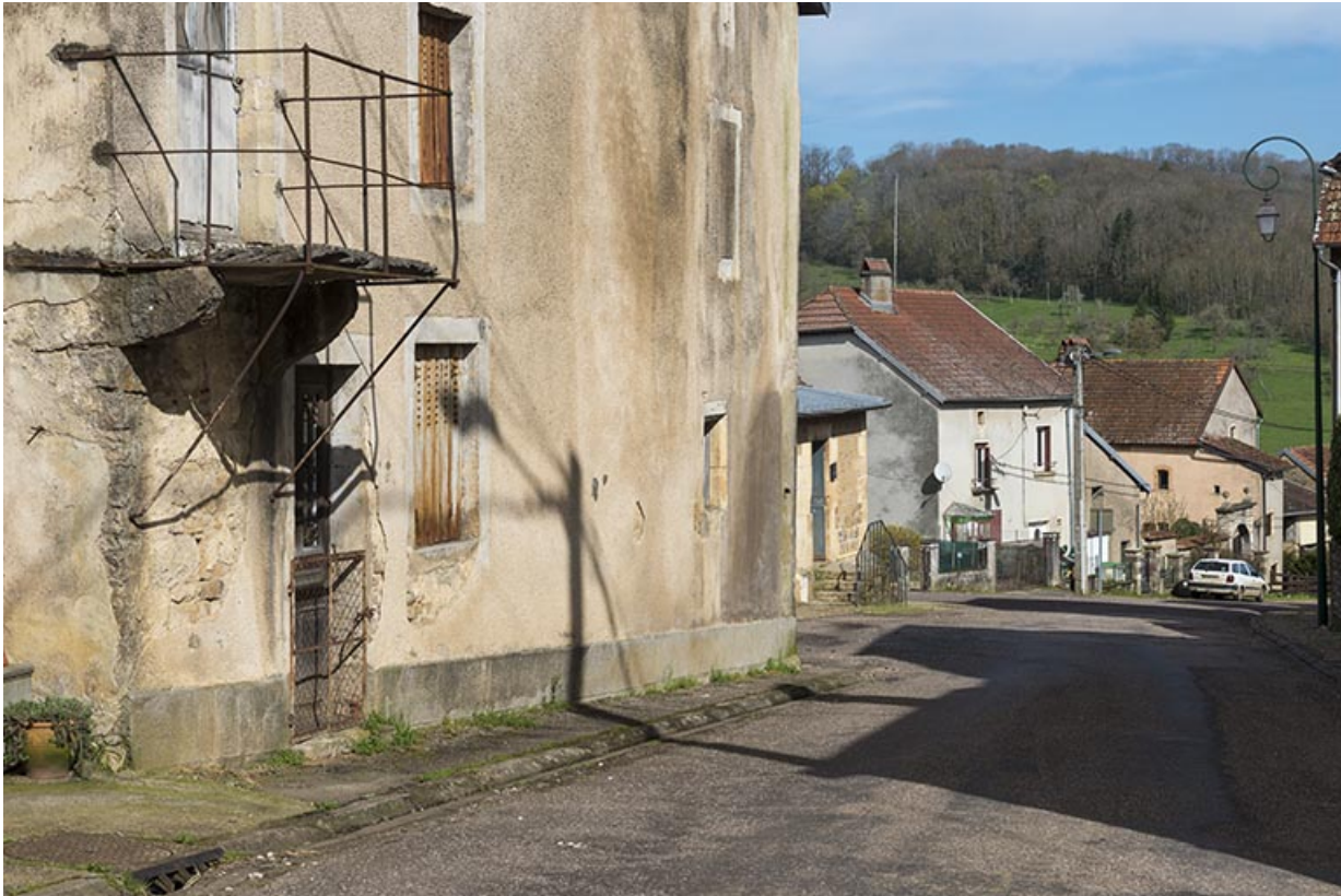
Rue du Vaux.