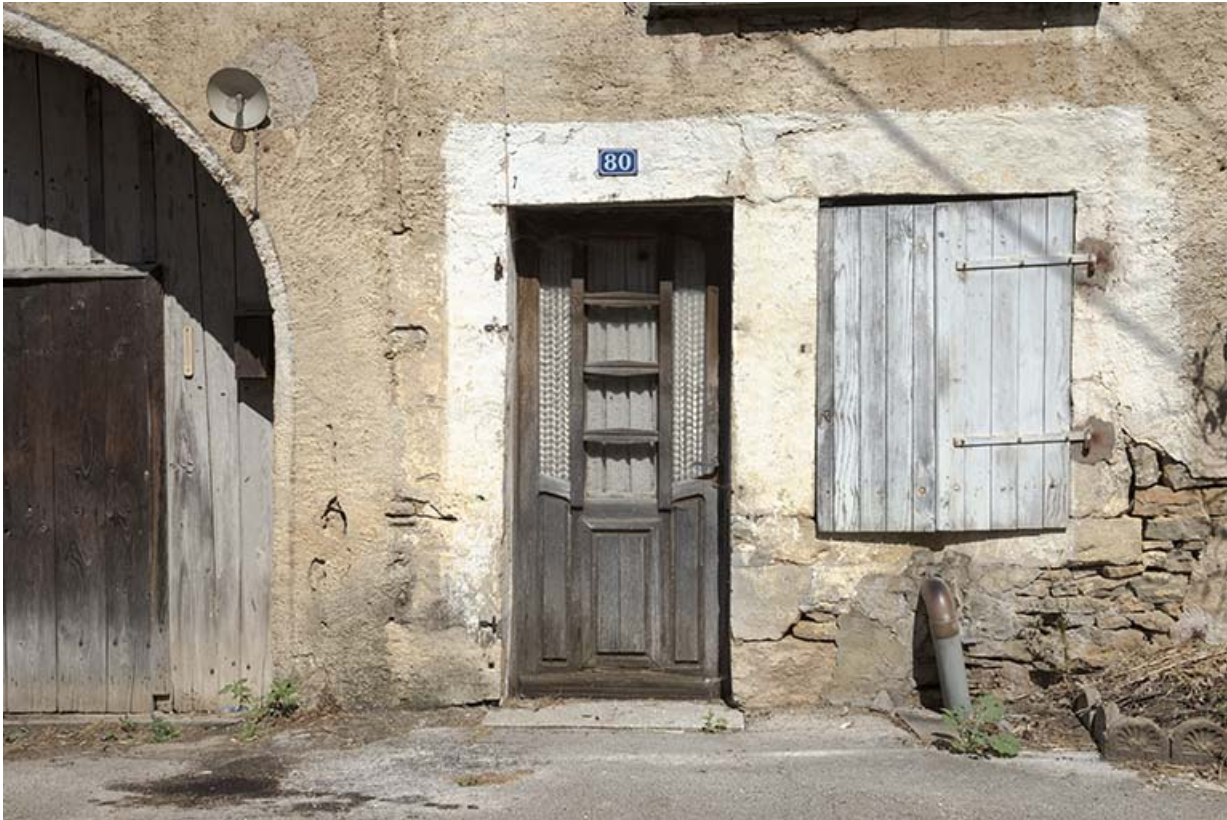
La porte donnant accès au logement de la ferme.