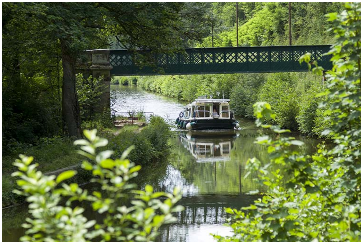
Vue sur la passerelle enjambant le canal sur lequel navigue un bateau de plaisance.