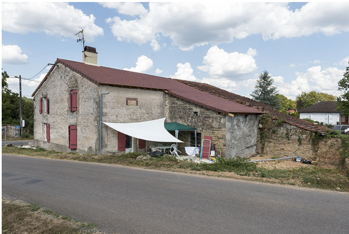
Vue de trois-quart depuis le sud de la maison située à l'angle de la rue Principale et de la route de Selles.