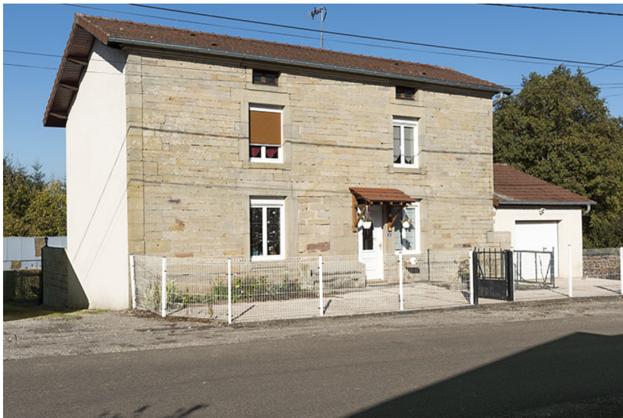
Vue de trois-quart sud-ouest de la maison, 14 rue Principale.