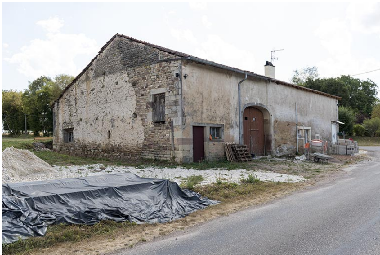
Vue de trois-quart de la maison située à l'angle de la rue Principale et de la route de Selles.