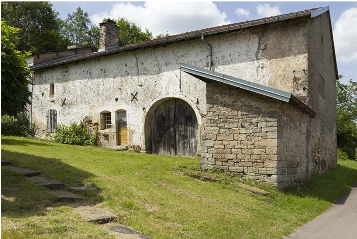
Ferme, perpendiculaire à la rue Principale (au 15.)