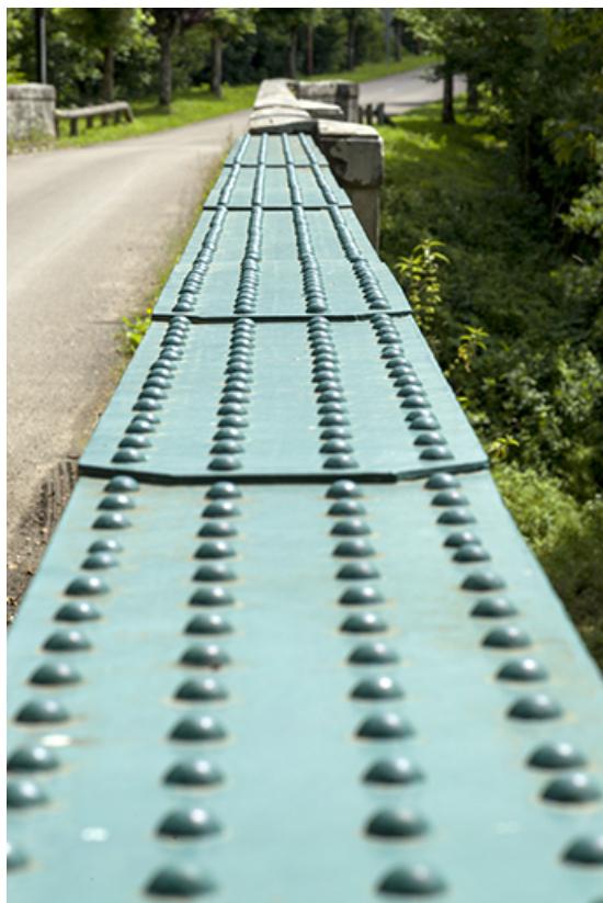
Détail de la rambarde de la passerelle.