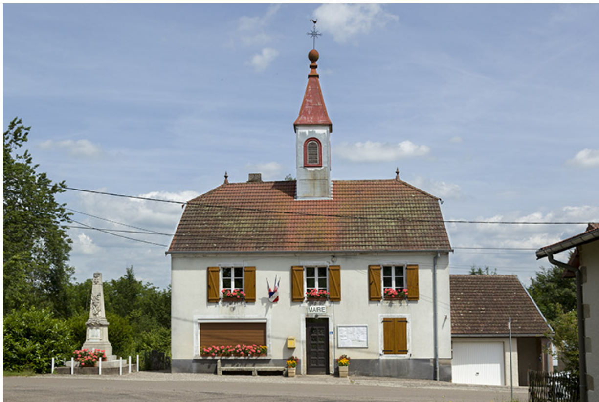
Mairie, ancienne école, ancienne maison commune, monument aux morts, vue de face. (date portée 1823.)