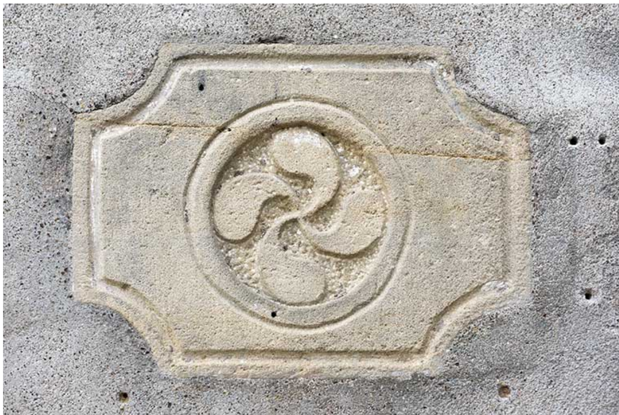
Détail sculpté de la façade de la ferme 9 rue Principale.