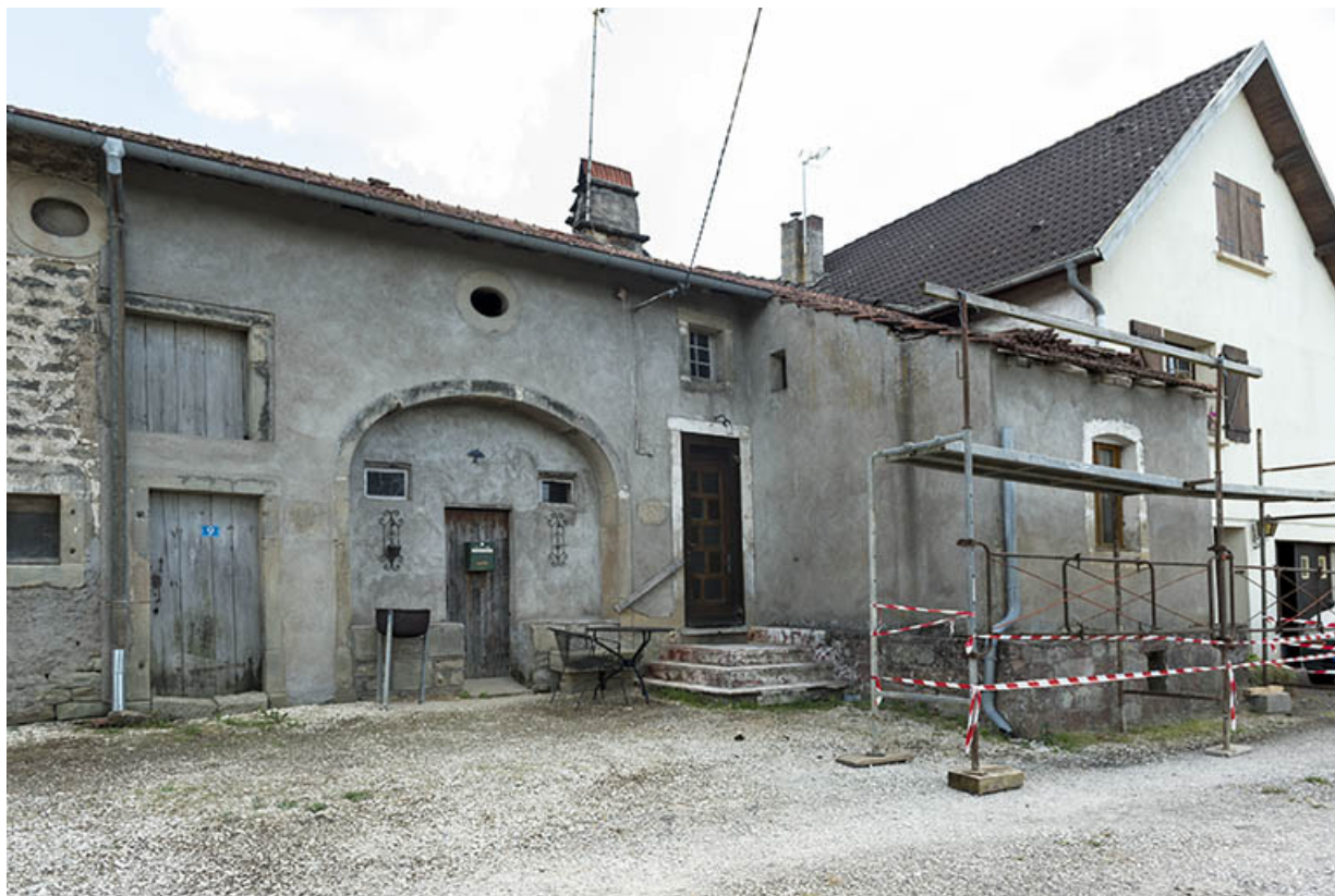
Vue de face de la ferme 9 rue Principale.