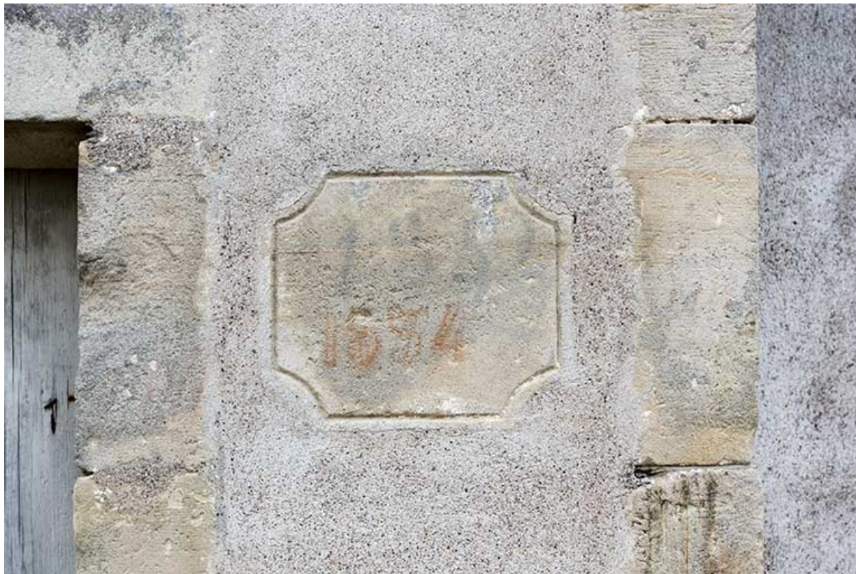
Détail de pierre de fondation de la façade de la ferme 9 rue Principale.