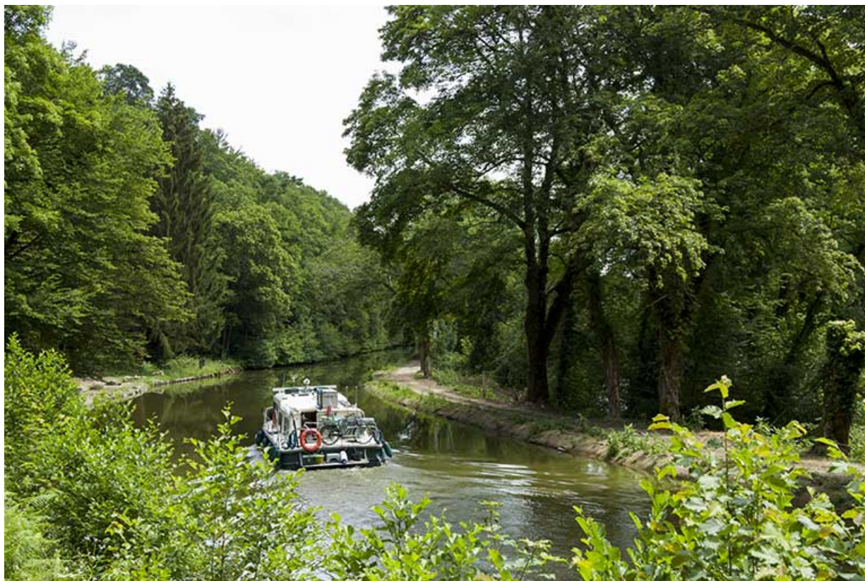
Vue sur le canal et un bateau de plaisance depuis la passerelle.