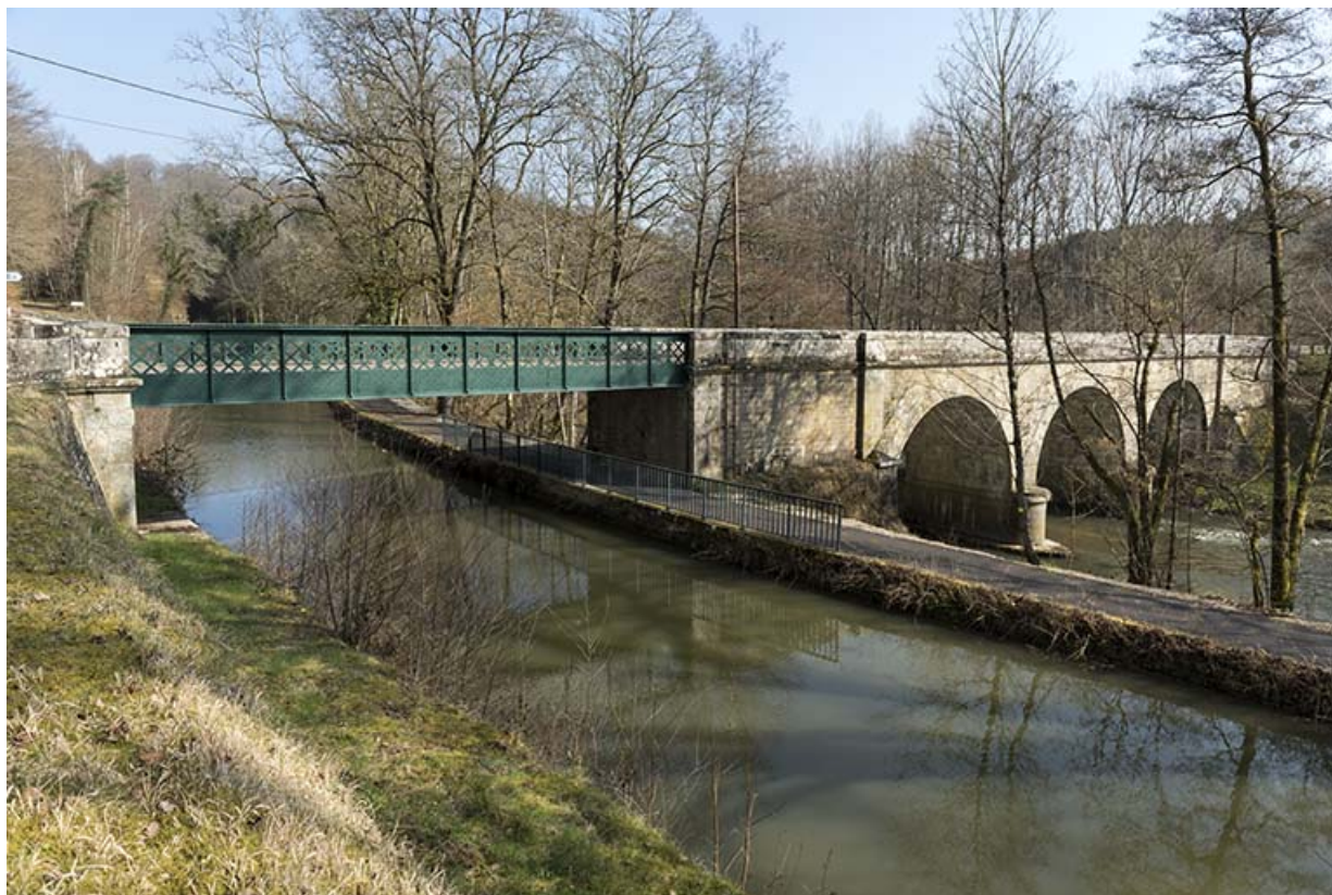
Depuis le sud-ouest, vue sur les deux ouvrages enjambant le canal des Vosges et le Coney.