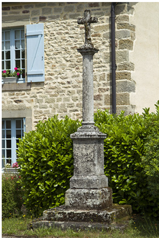
Croix. Vue de trois quart. Devant le 18 rue Principale.