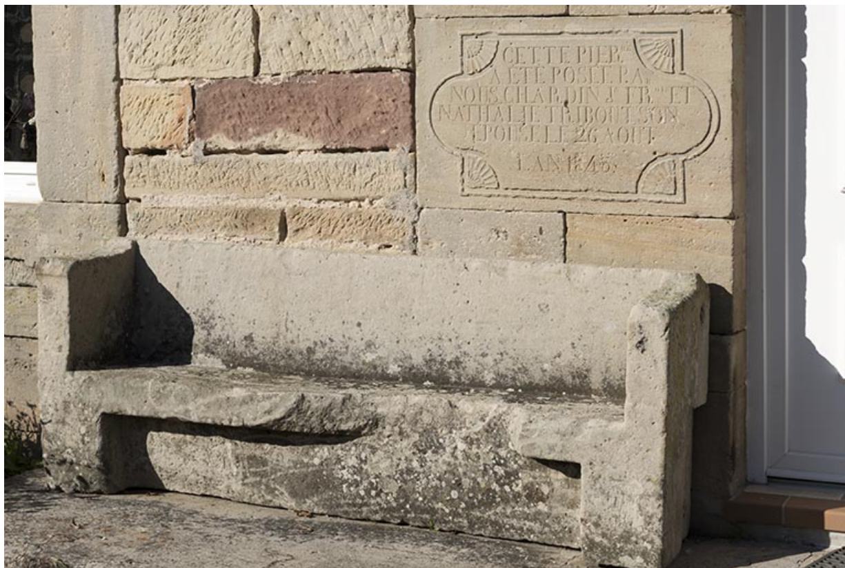
Détail de l'inscription de fondation (1845) et du banc devant la façade antérieure de la maison, 14 rue Principale.