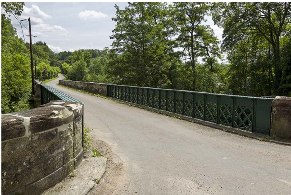
Vue de la passerelle depuis la route.