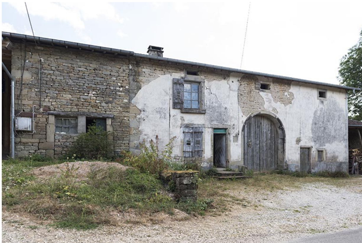
Vue de face de la ferme 29 rue Principale.