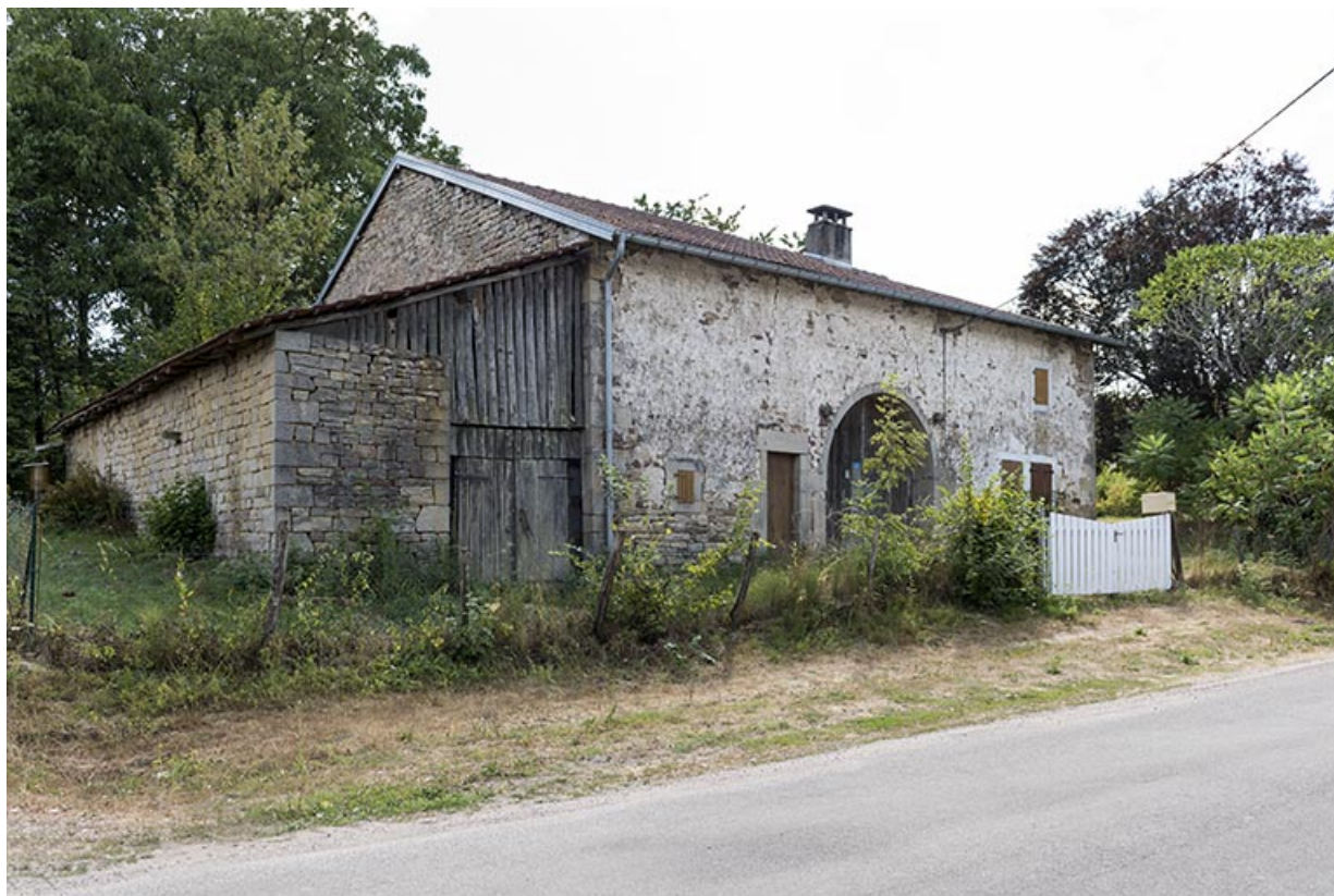
Vue de trois-quart de la maison située 3 rue Principale.