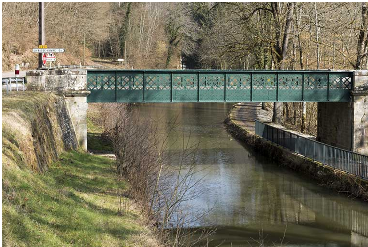
Vue sur la passerelle enjambant le canal.