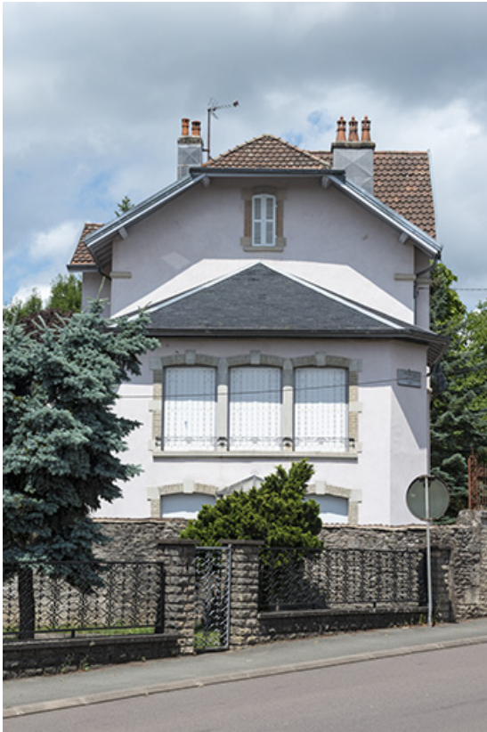
La façade sud, depuis le bas de la rue.

70, Port-sur-Saône, 10 avenue de la Gare