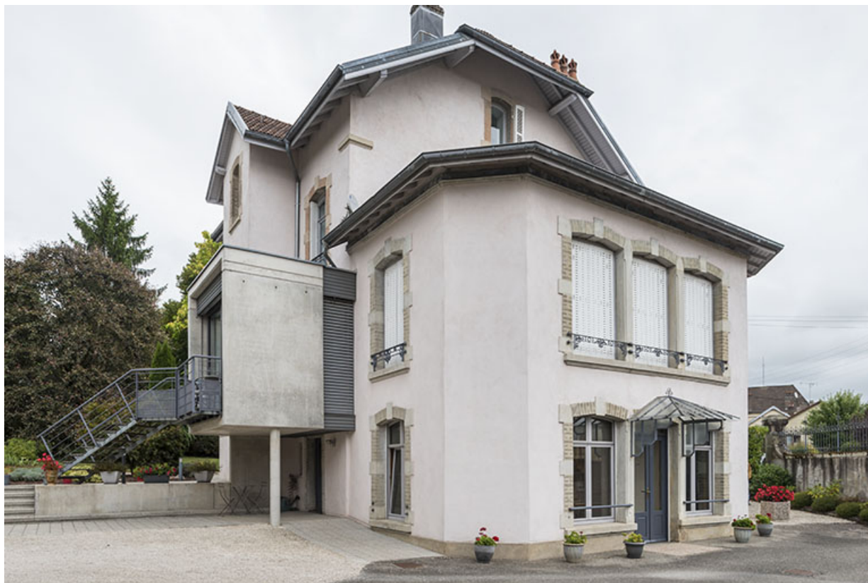
Le mur pignon sud avec l'agrandissement réalisé par la famille Petit.

70, Port-sur-Saône, 10 avenue de la Gare