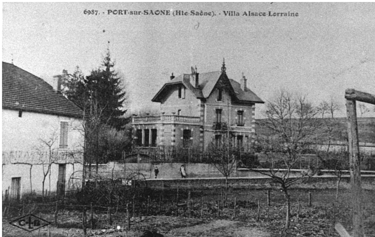
Villa Alsace-Lorraine, carte postale. 70, Port-sur-Saône, 10 avenue de la Gare