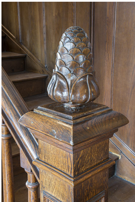
Boule en bois de départ de rampe.

70, Port-sur-Saône, 10 avenue de la Gare