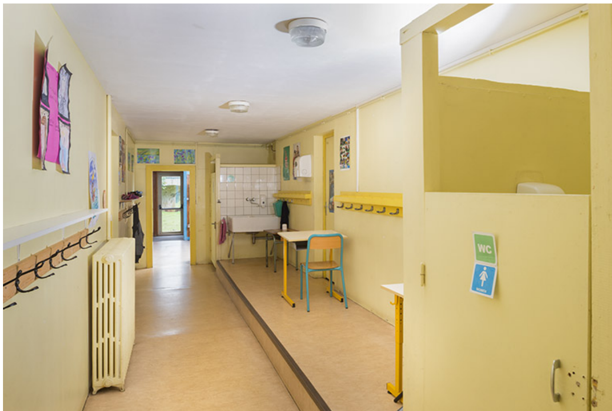
Couloir d'accès aux sanitaires.