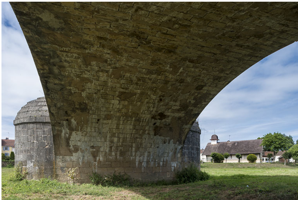
Le pont et l'école en arrière plan.