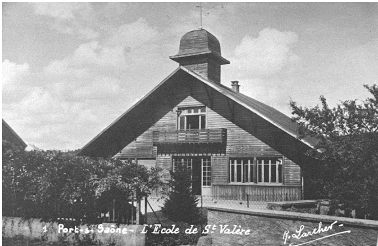
L'école Saint-Valère, carte postale.