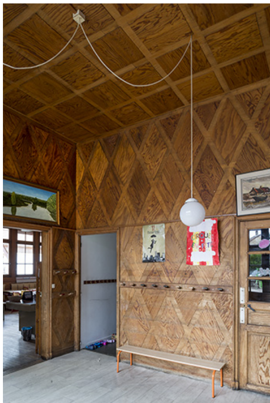
Le hall d'entrée.