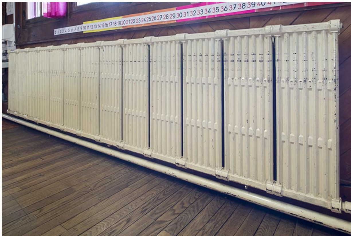
Les radiateurs d'une salle de classe.