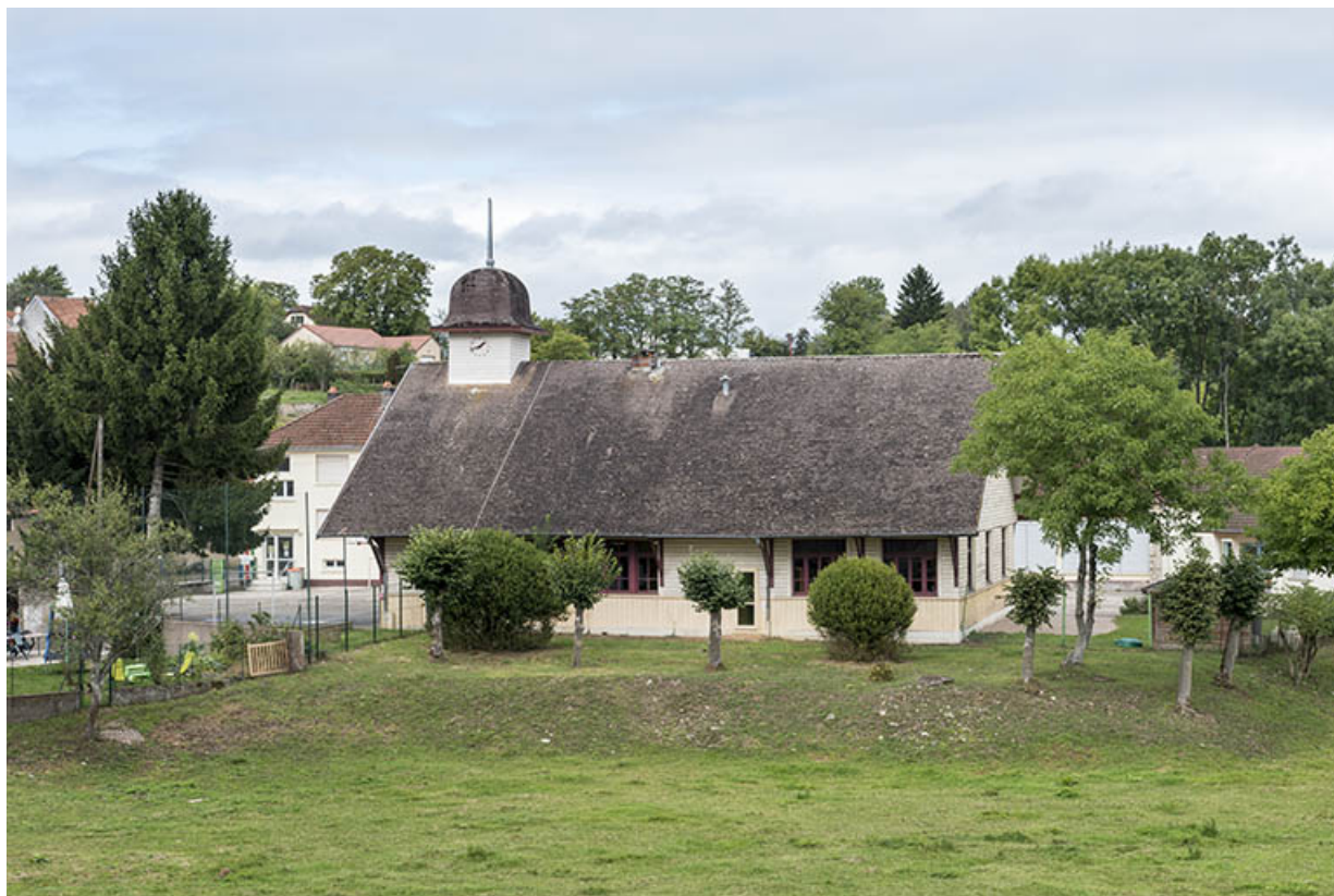
Vue depuis le pont.