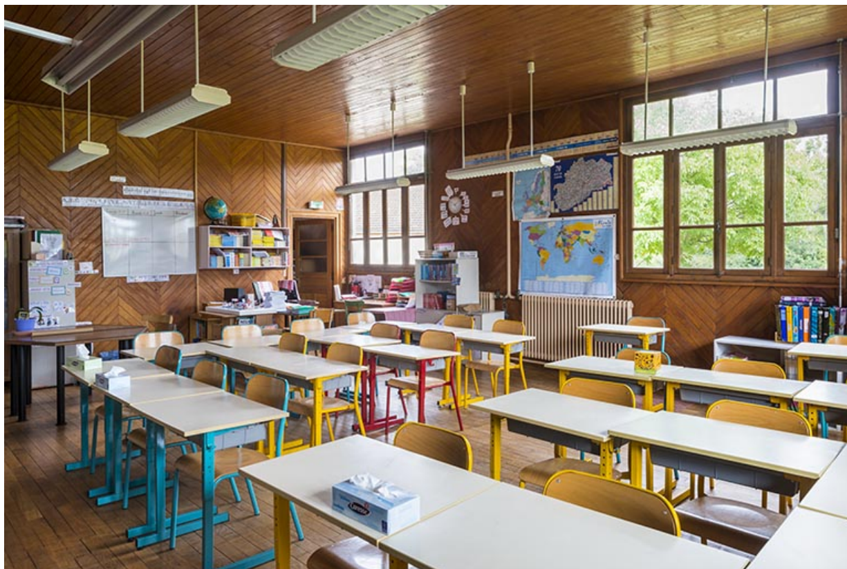
salle de classe.