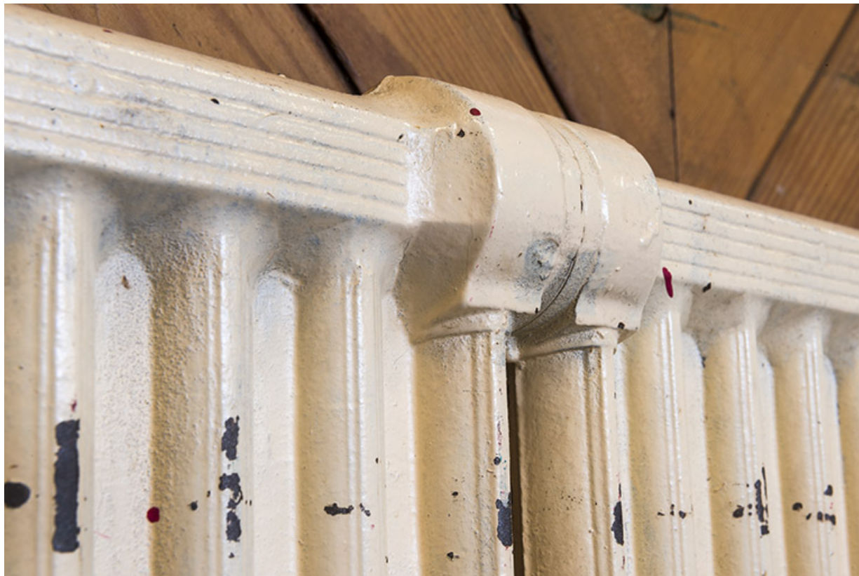
Détail d'un des radiateurs en fonte.