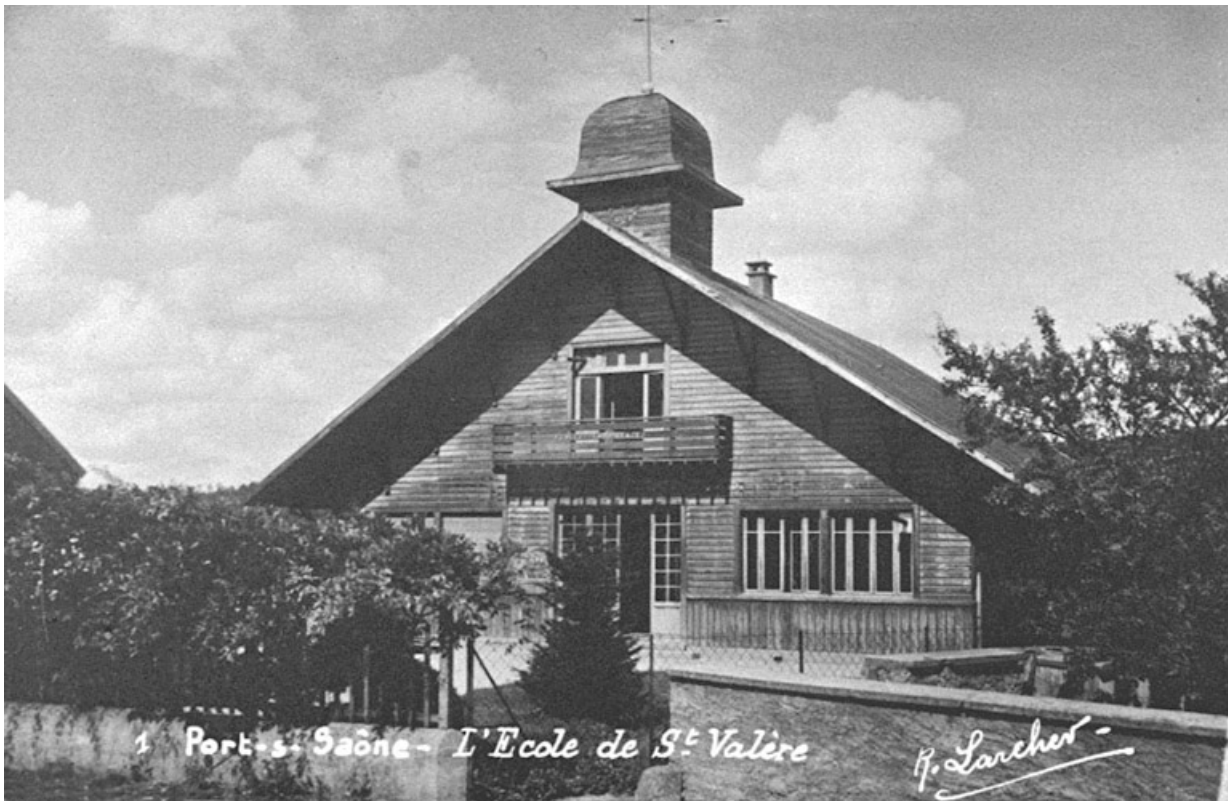
L'école Saint-Valère, carte postale.