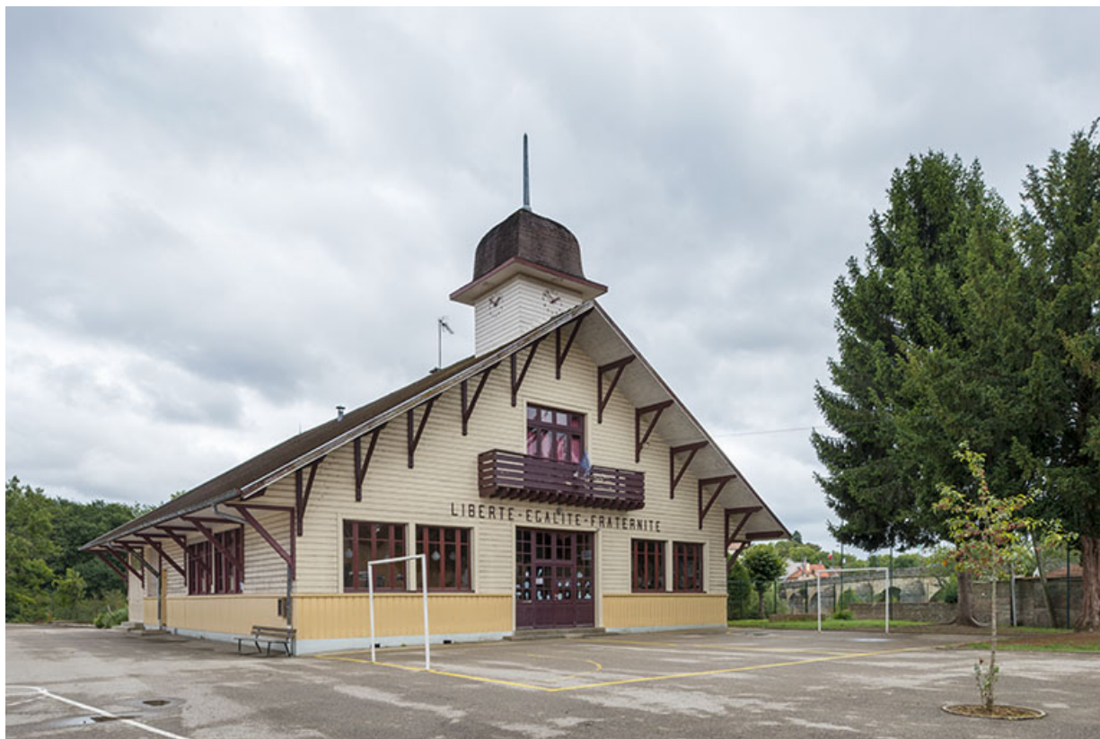
Vue de trois-quart. 70, Port-sur-Saône