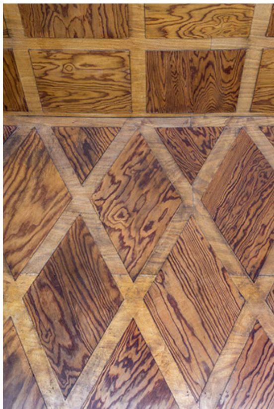
Hall d'entrée orné de marqueterie de bois.