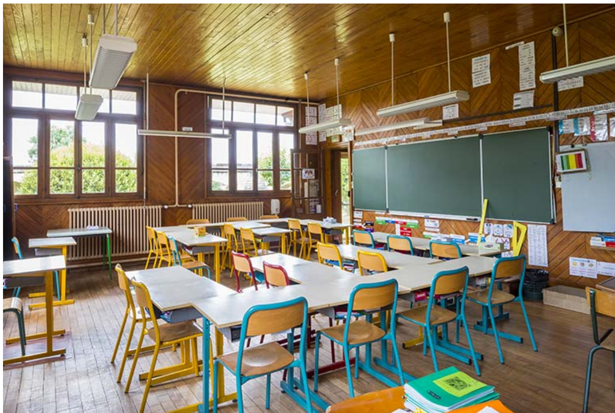
salle de classe.