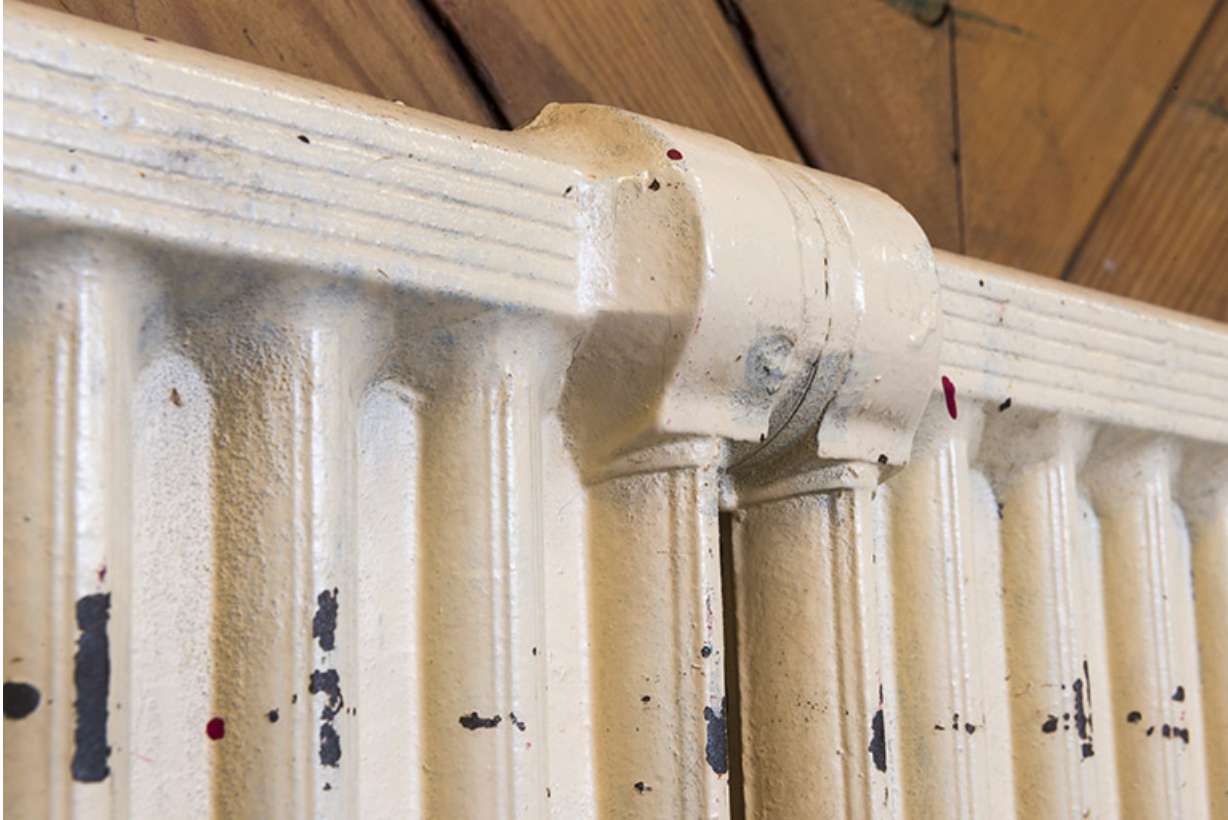
Détail d'un des radiateurs en fonte.