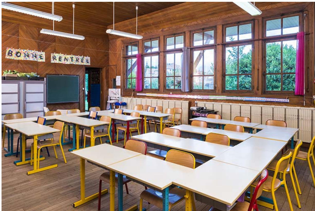
Salle de classe avec vue sur le pont. 70, Port-sur-Saône rue de Remaucourt