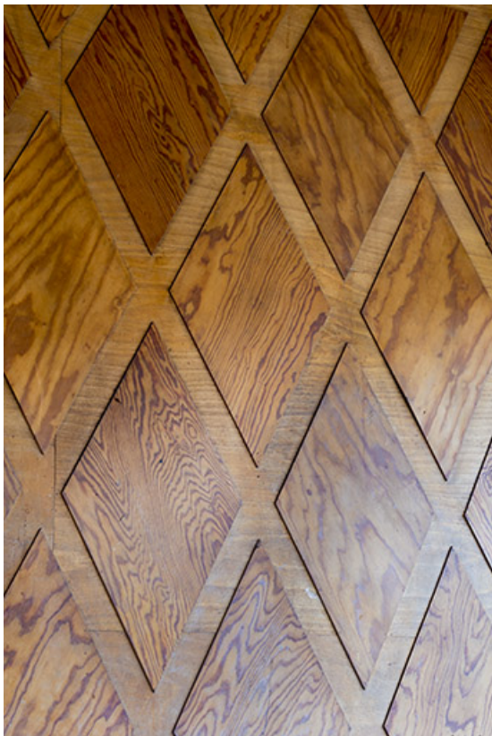
Détail des placages de bois.