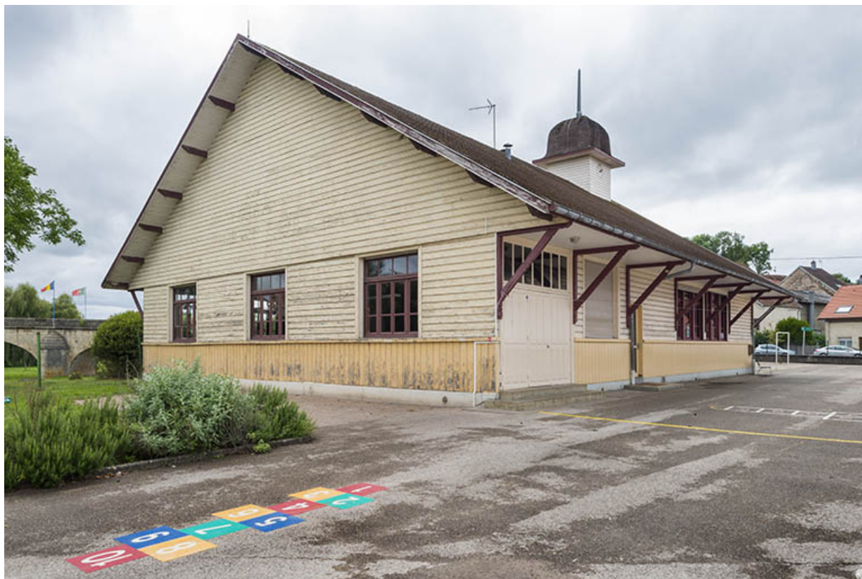
Vue depuis le fond de la cour.