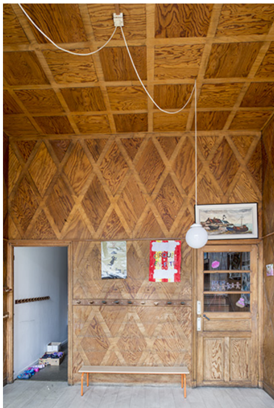
Le hall d'entrée, avec la porte d'accès à l'étage. 70, Port-sur-Saône rue de Remaucourt