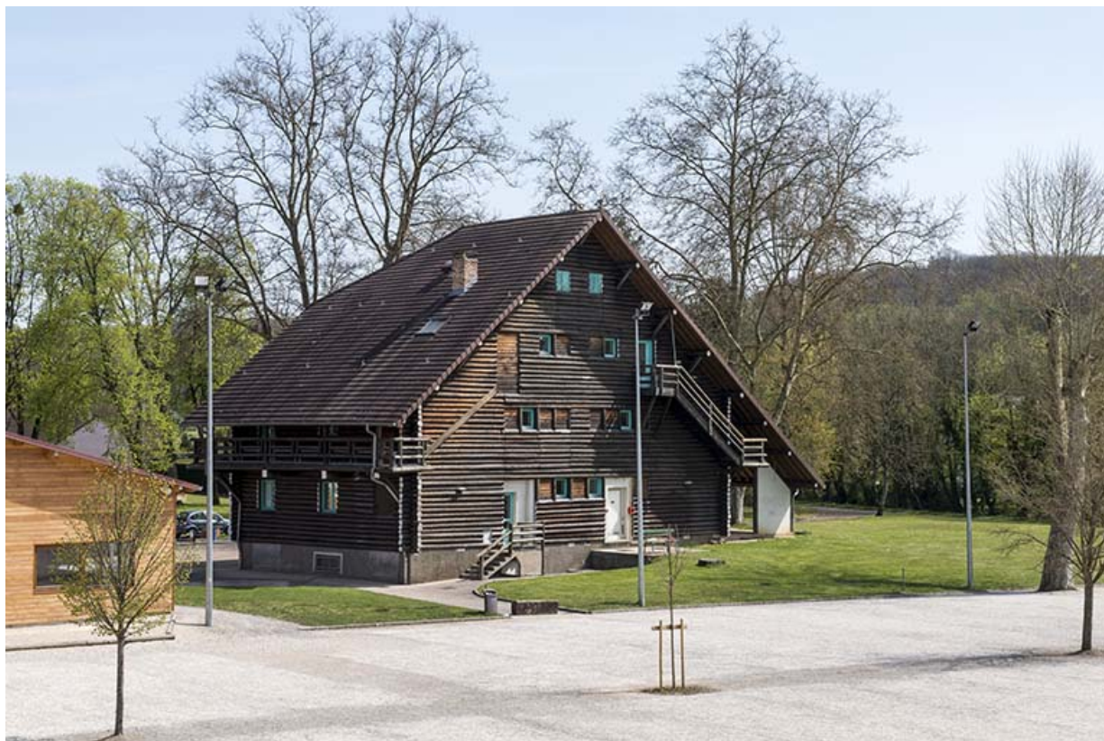
Façade postérieure, vue depuis le pont enjambeant le canal.