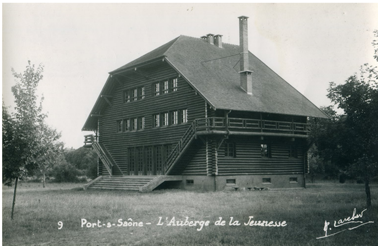
L'auberge de la Jeunesse, carte postale.