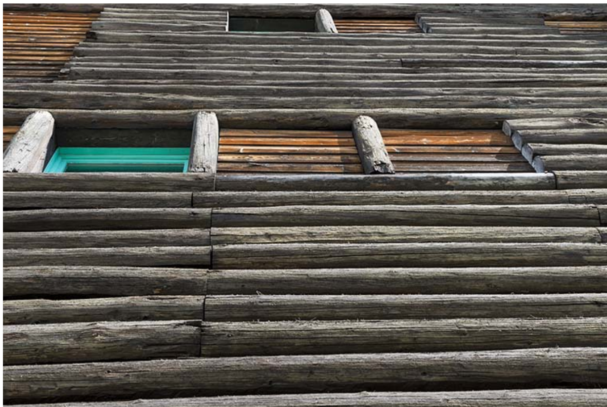
Le mur recouvert de demi-rondins de sapin.