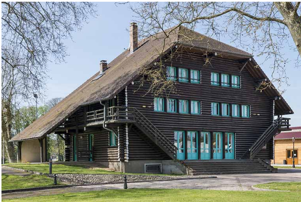
Vue d'ensemble. 70, Port-sur-Saône