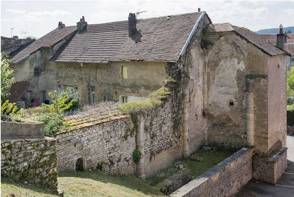
Ruines de l'ancienne église.