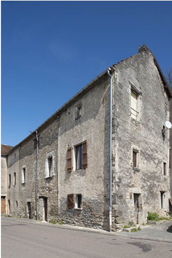
Vue de détail sur les ouvertures.