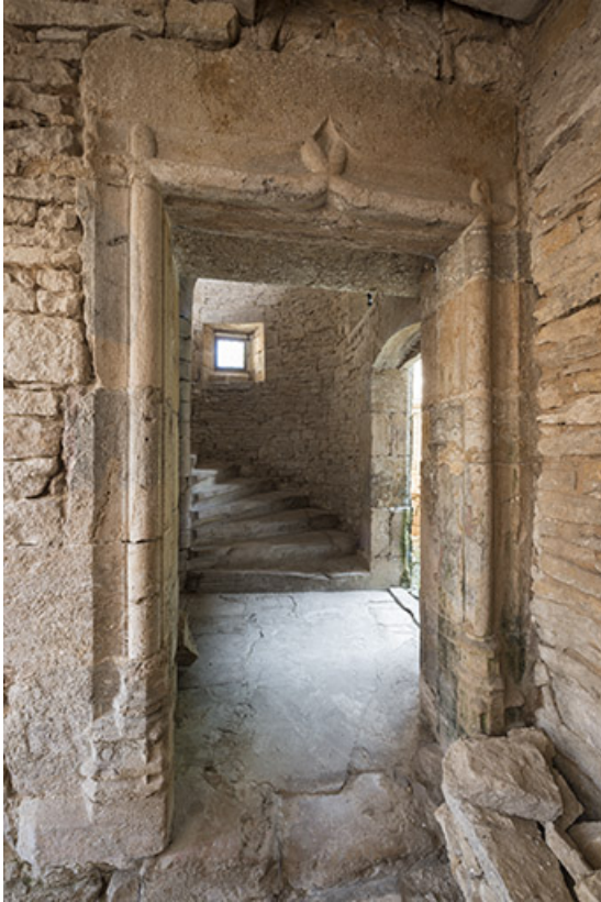
La porte d'accès à la tour, rez-de-chaussée. 70, Port-sur-Saône rue de l'Église