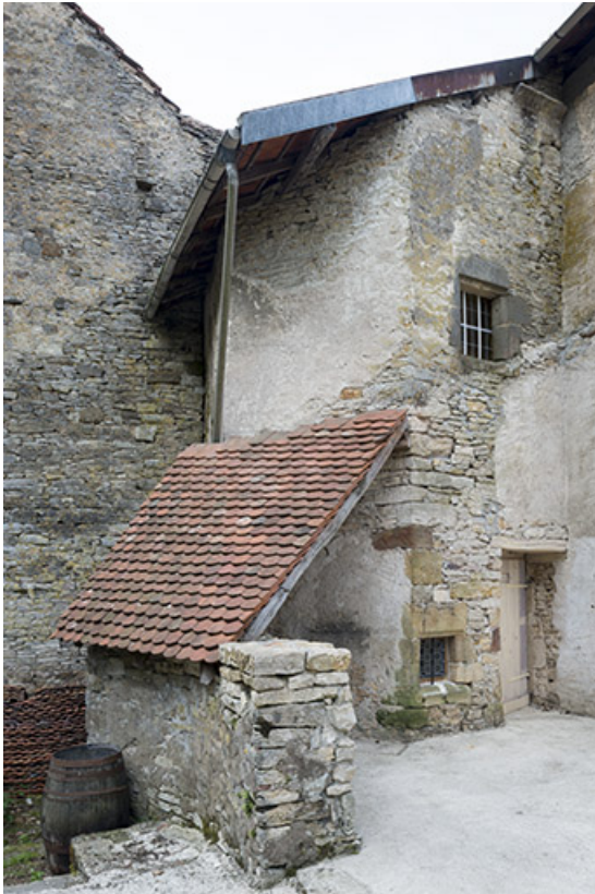
La tour depuis l'ancien cloître. 70, Port-sur-Saône rue de l' Église