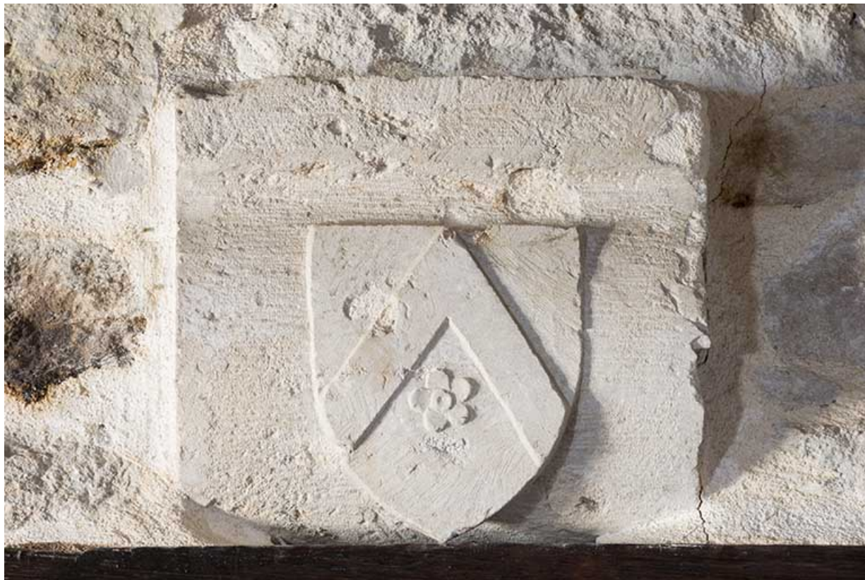
Blason situé au premier étage. 70, Port-sur-Saône rue de l'Église