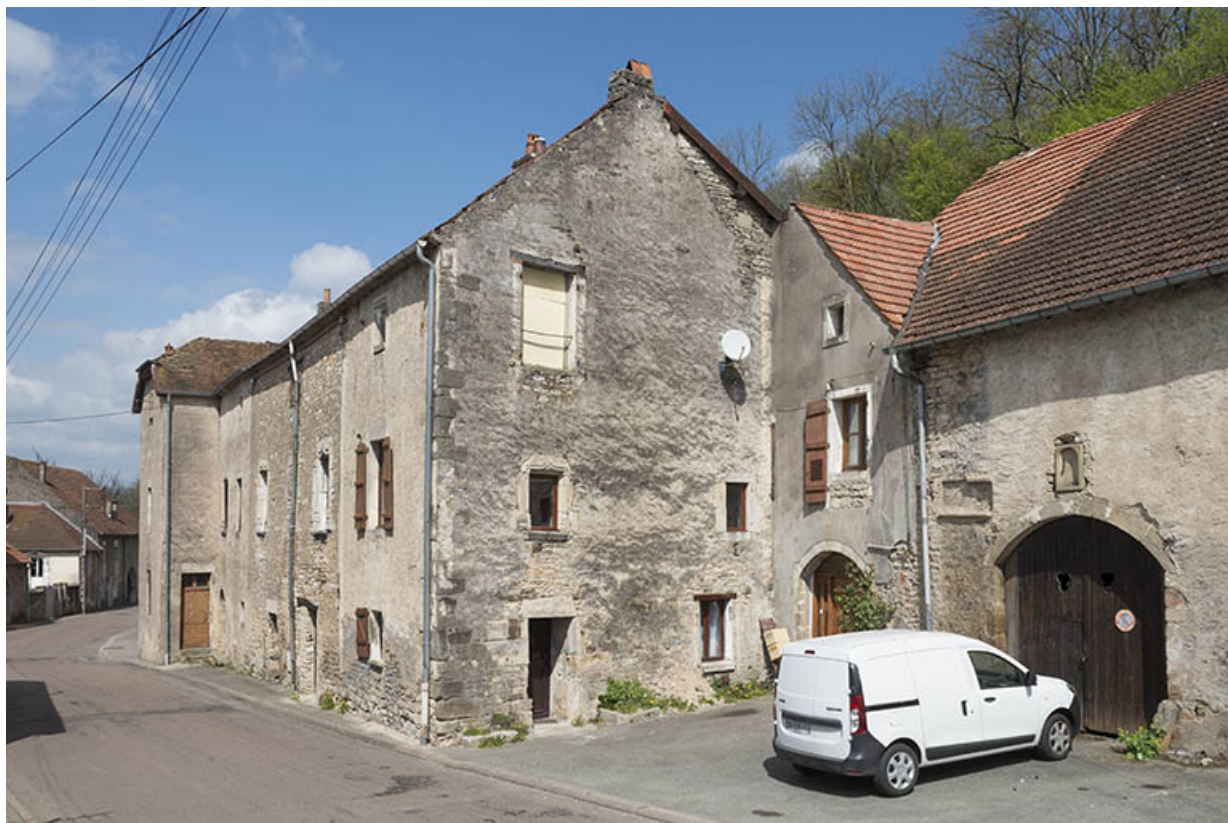
Vue d'ensemble depuis le haut de la rue.