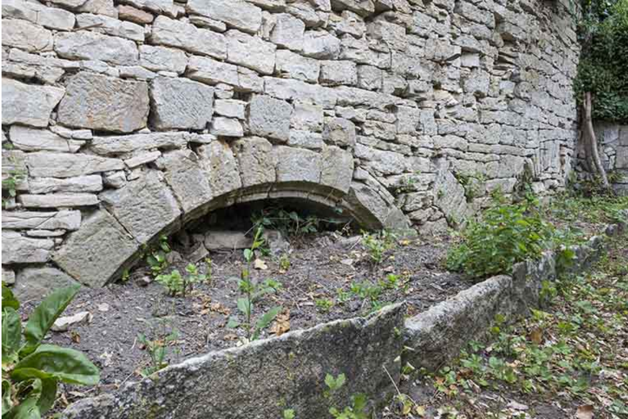
Voûte de l'ancienne galerie du cloître (?).