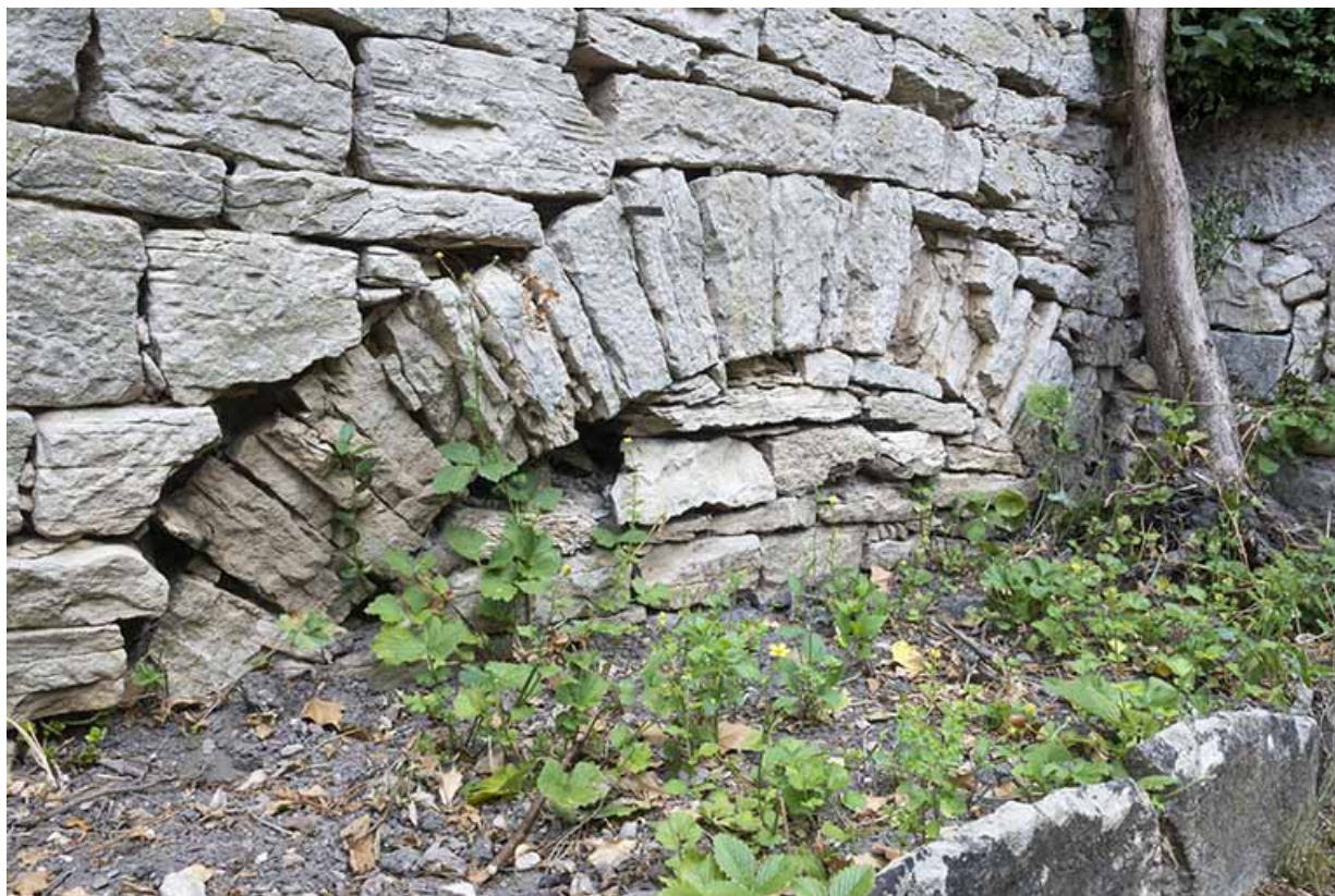
Détail sur la maçonnerie d'une voûte.