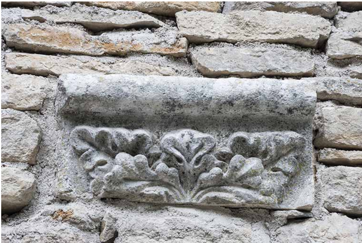
Fragment d'un chapiteau, façade côté cour. 70, Port-sur-Saône rue de l' Église