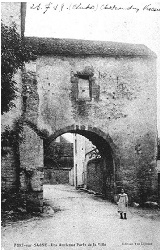
Ancienne porte de la ville, carte postale (1ère moitié 20e siècle). 70, Port-sur-Saône rue de l' Église