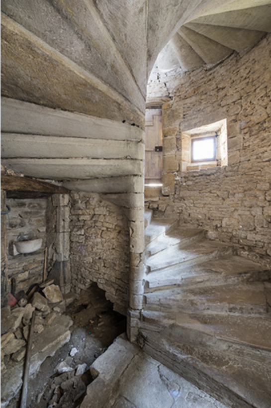
L'escalier, vue depuis le rez-de-chaussée.