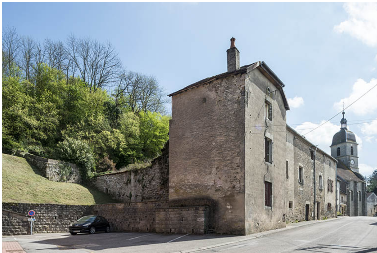
vue générale (depuis le nord) des bâtiments conventuels, rue de l'Eglise.