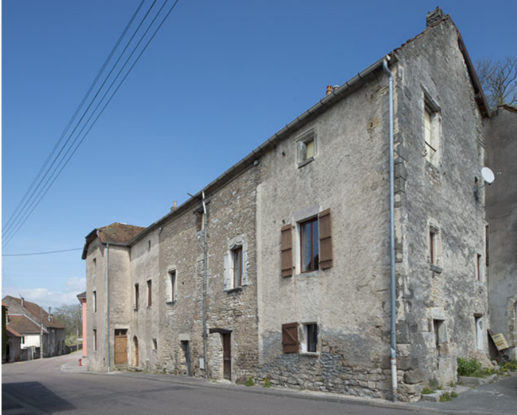
Vue générale de l'édifice depuis le Sud.