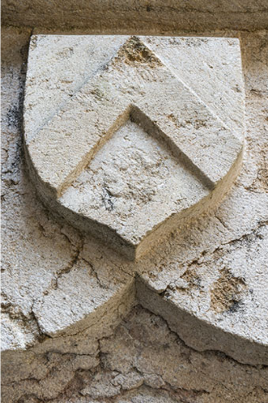
Blason situé au dessus de la porte d'accès à la tour depuis la cour intérieure. 70, Port-sur-Saône rue de l' Église