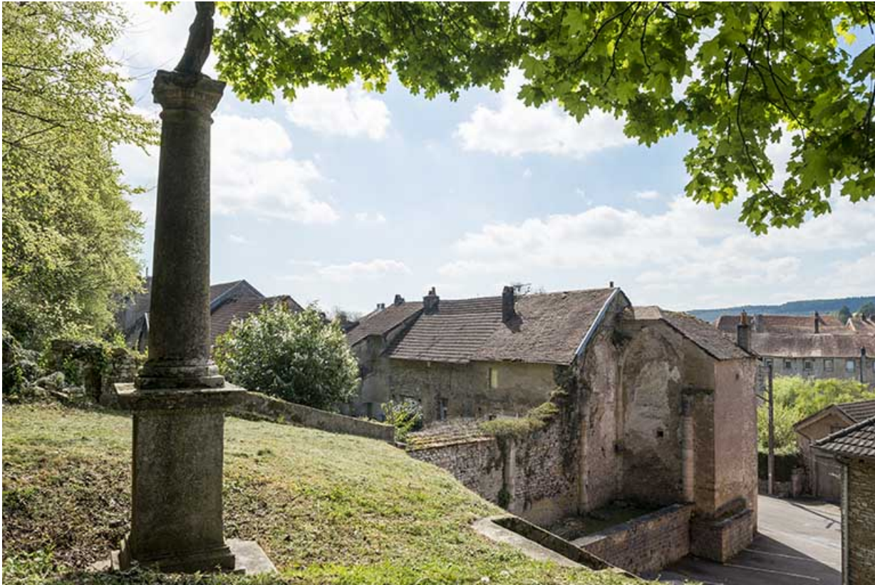
Vue d'ensemble du prieuré et de l'ancienne église.