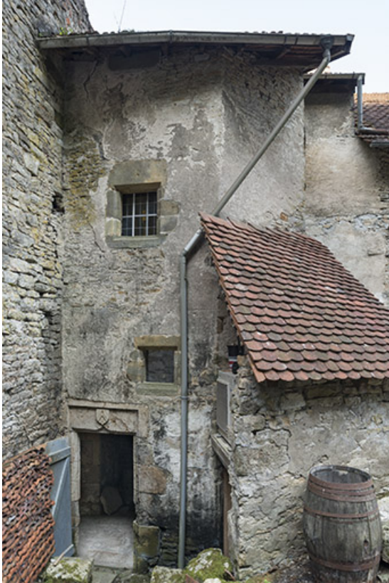
Tour comprenant l'escalier, côté cour.