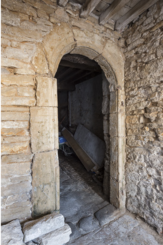
Porte d'accès à la grange, rez-de-chaussée. 70, Port-sur-Saône rue de l'Église