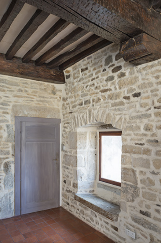
Détail sur le plafond à la française, premier étage. 70, Port-sur-Saône rue de l' Église