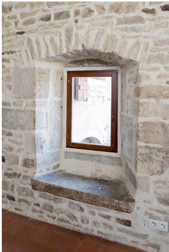
Fenêtre avec pierre à évier, premier étage.