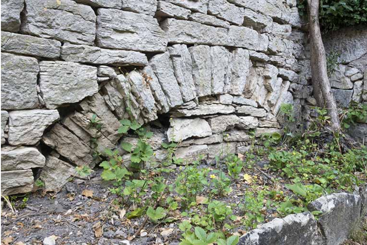
Détail sur la maçonnerie d'une voûte.