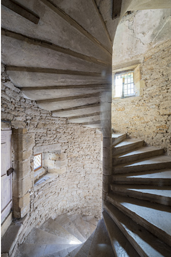
Escalier suspendu, vue depuis le premier étage. 70, Port-sur-Saône rue de l'Église