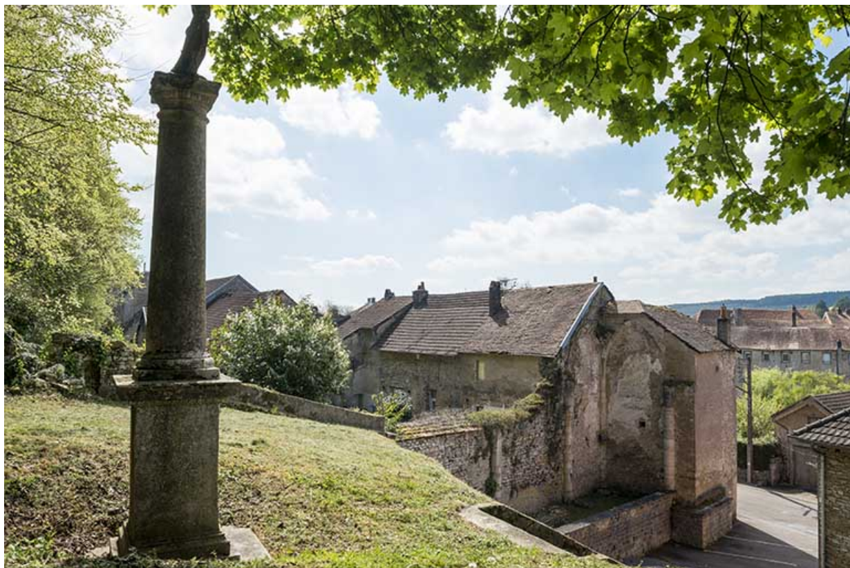
Vue d'ensemble du prieuré et de l'ancienne église.