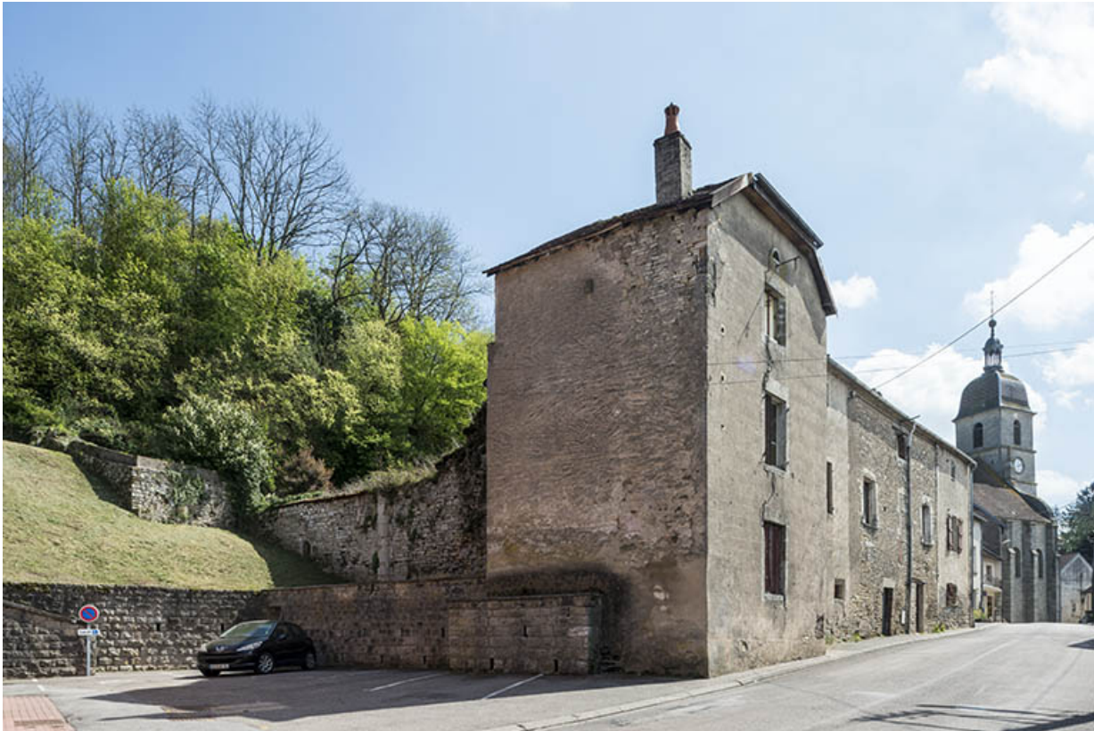
vue générale (depuis le nord) des bâtiments conventuels, rue de l'Église. 70, Port-sur-Saône rue de l'Église