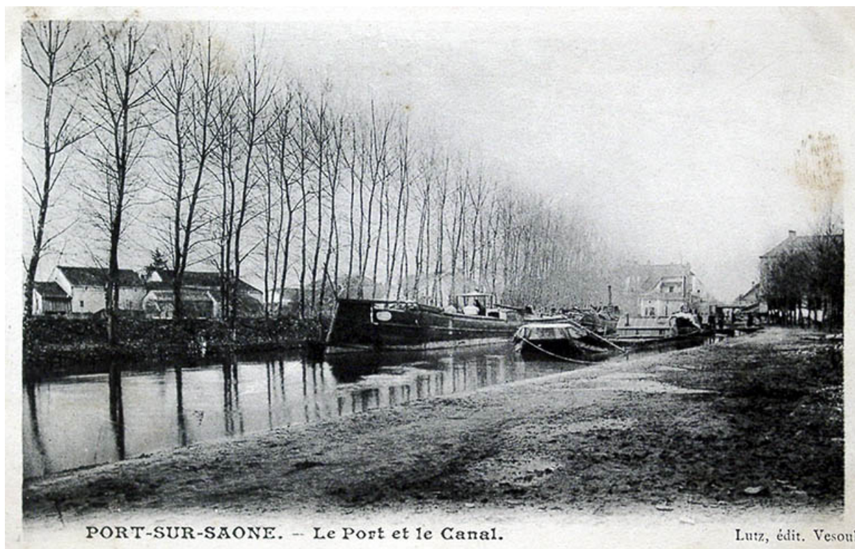
La canal et le port, carte postale