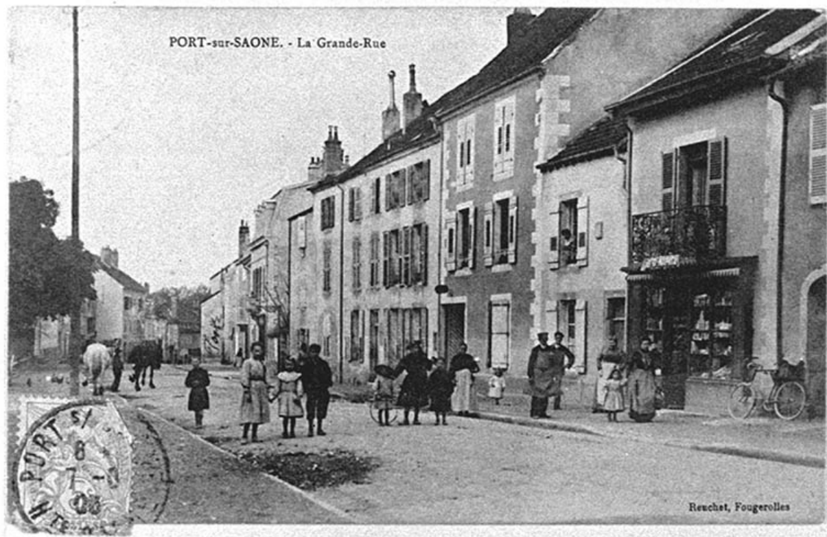
Rue principale, carte postale.