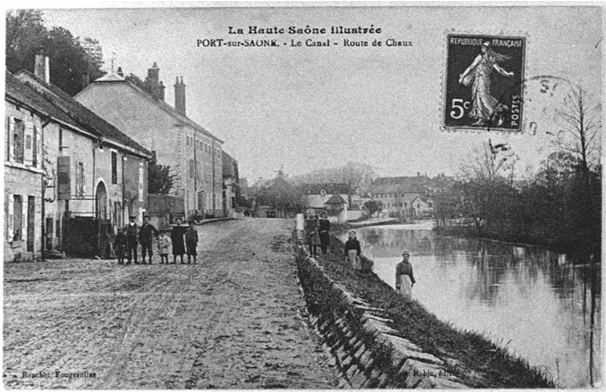
La route de Chaux et le bief, carte postale. 70, Port-sur-Saône