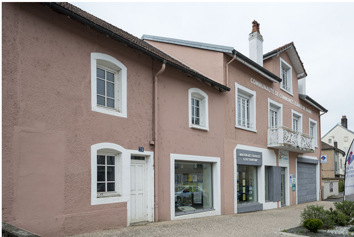
Ancienne station essence, actuellement bureaux de la communauté de communes. 70, Port-sur-Saône