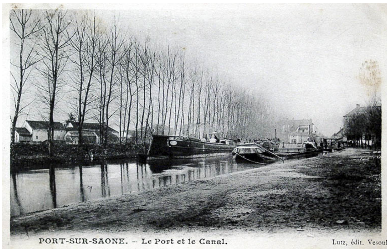
La canal et le port, carte postale