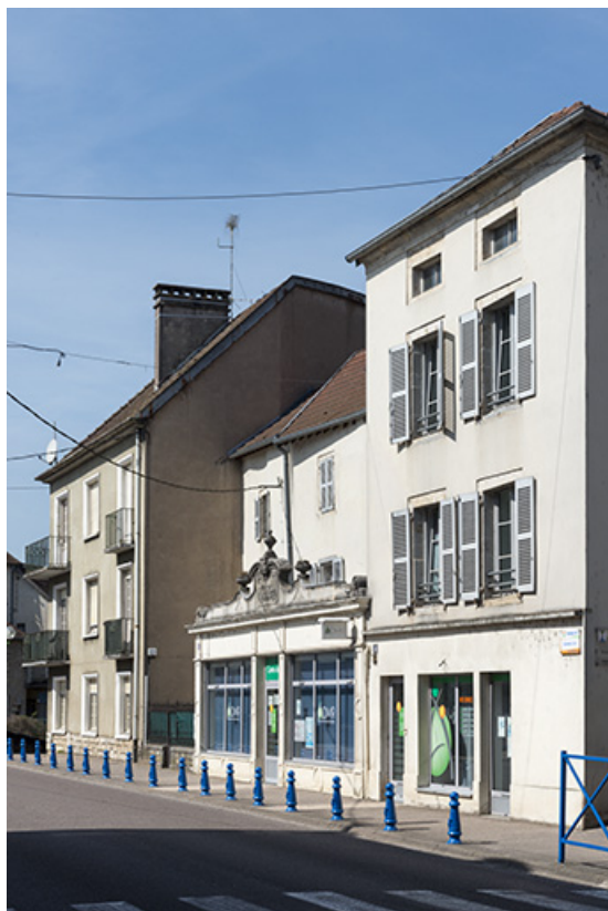
Immeubles le long de la rue principale.