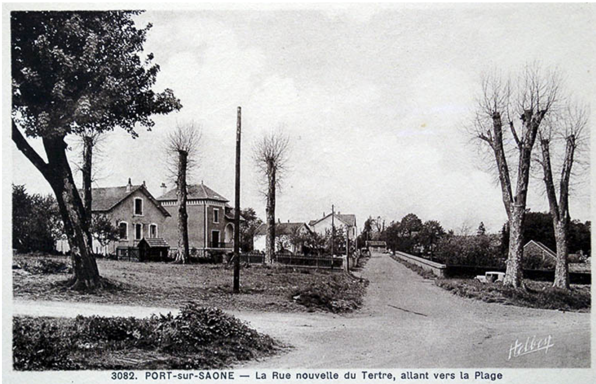
3082. PORT-sur-SAONE — La Rue nouvelle du Tertre, allant vers la Plage

La nouvelle rue du Tertre, carte postale.