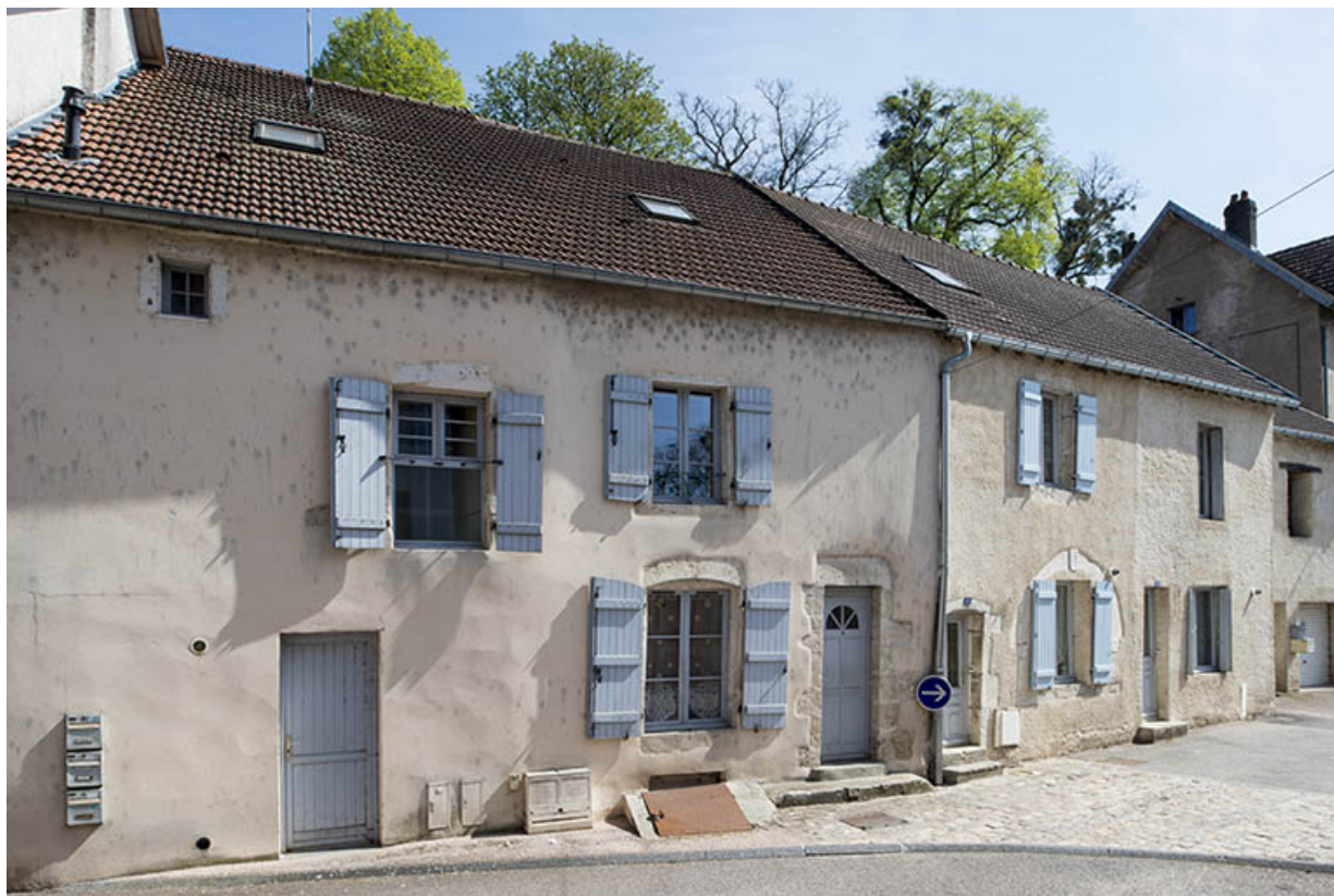
Maisons rue Jean Bogé.