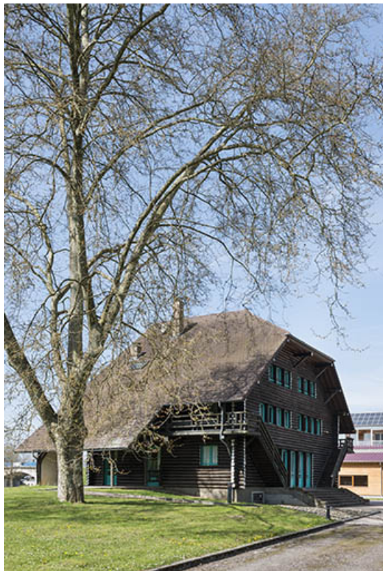
L'auberge de la jeunesse.