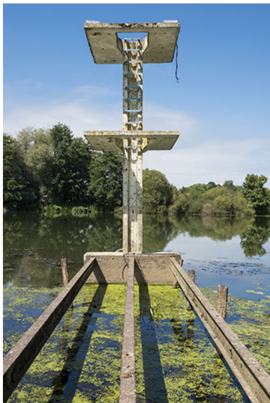
Le plongeur, vue de face.