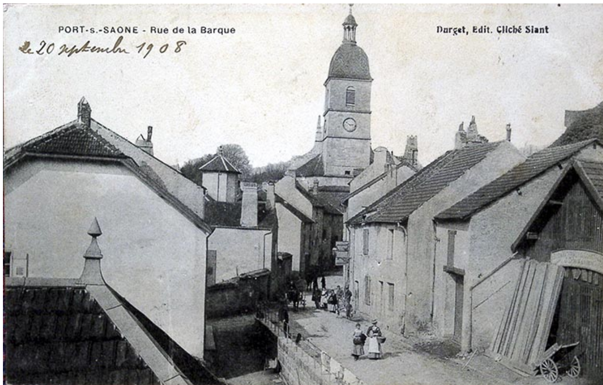
Rue de la barque vers 1908, carte postale. 70, Port-sur-Saône

Port-sur-Saône - Rue de la Barque. Carte postale éditée par Durget (cliché Siant), envoyée le 20 septembre 1908. Lieu de conservation : Collection particulière, Claude Colombier, Port-sur-Saône