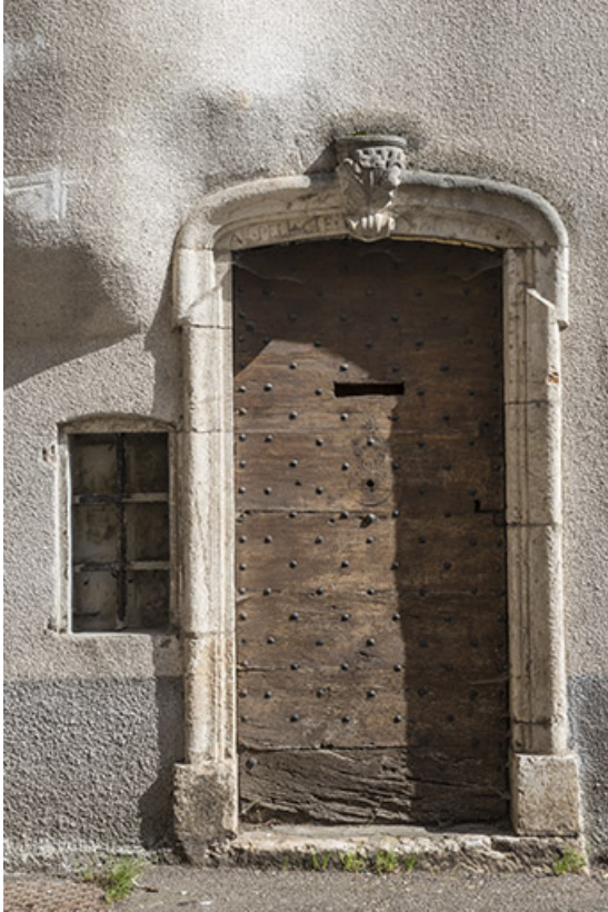
Porte avec linteau en arc surbaissé.