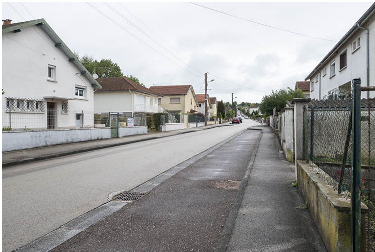
L'avenue de la Plage, vue générale.