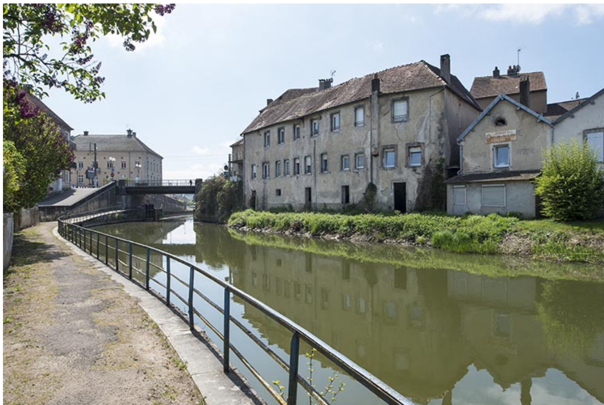
Le bief et l'île de l'ancien château.