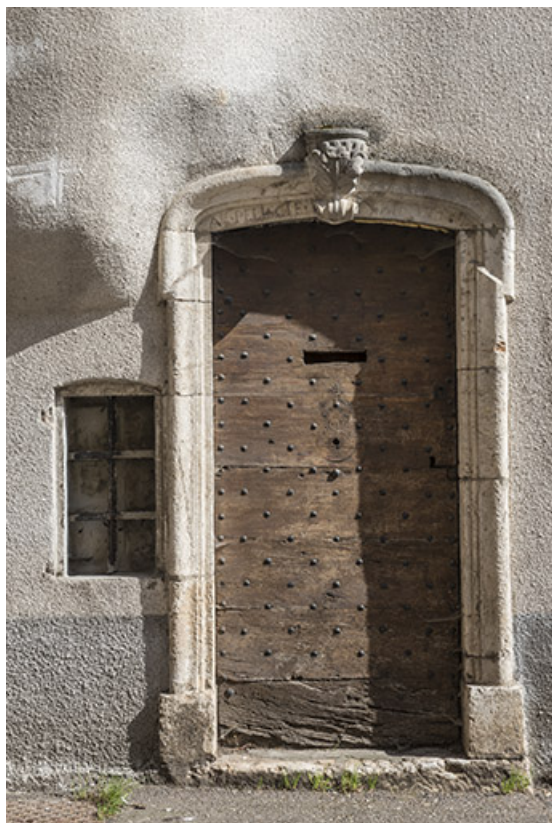
Porte avec linteau en arc surabaissé.