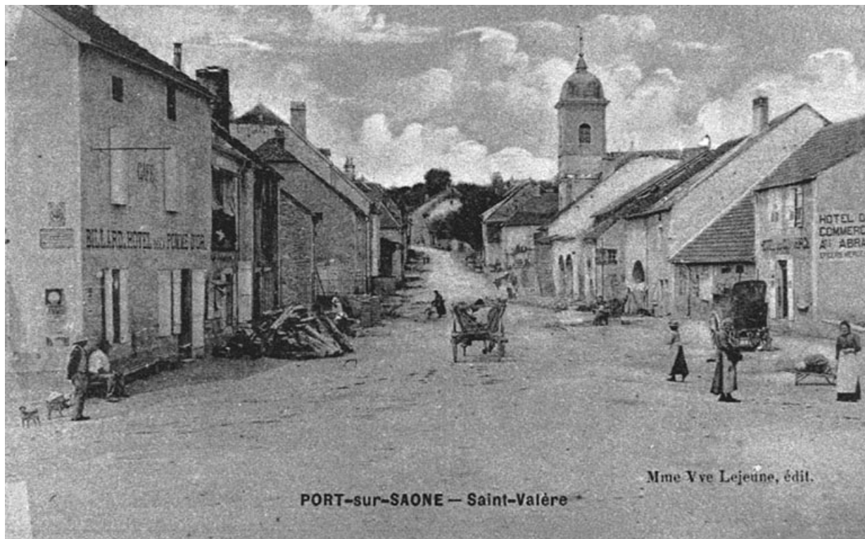
Saint-Valère, carte postale.