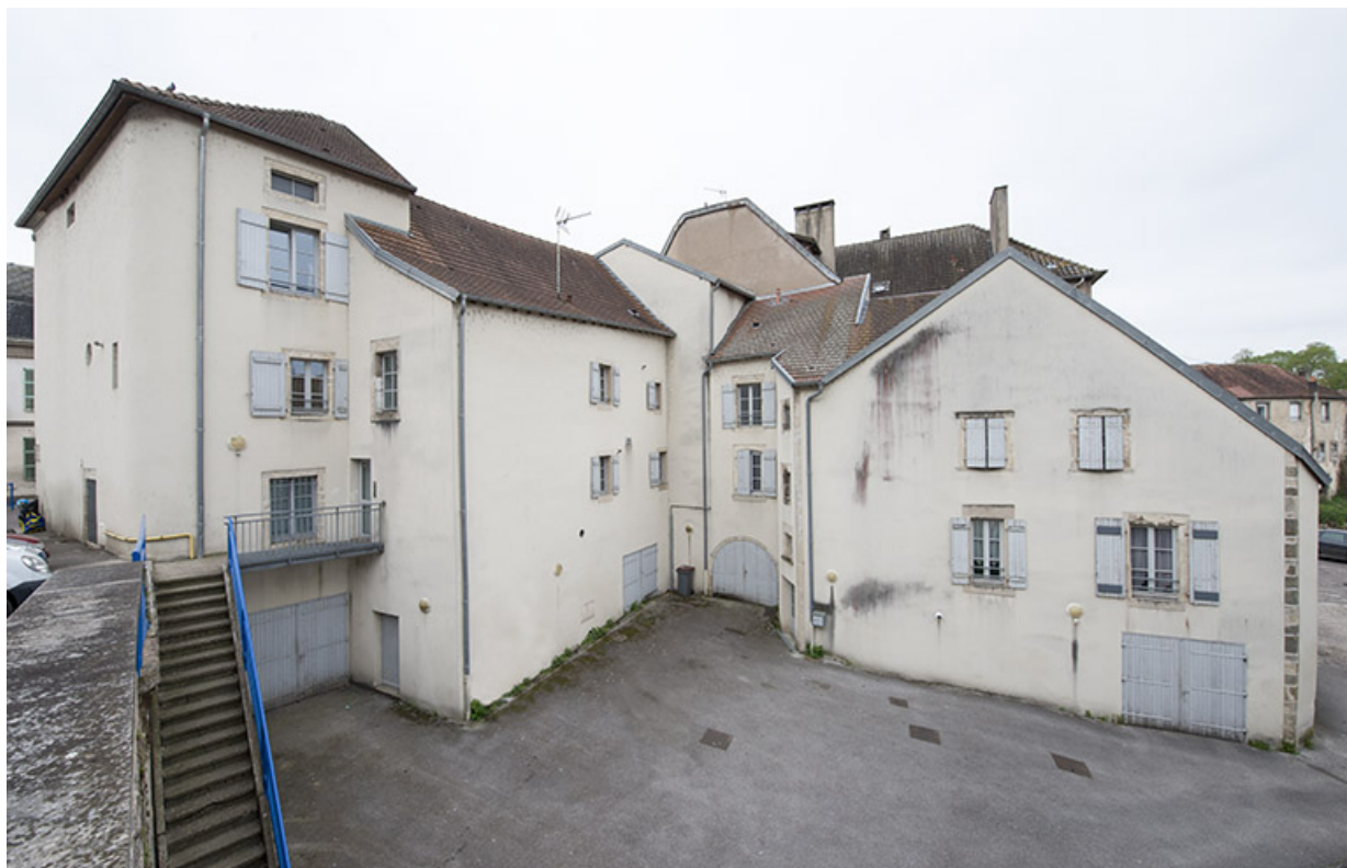
Maisons, île de l'ancien château.