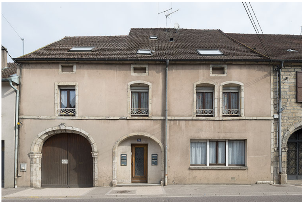
Maison transformée, rue François Mitterrand. 70, Port-sur-Saône