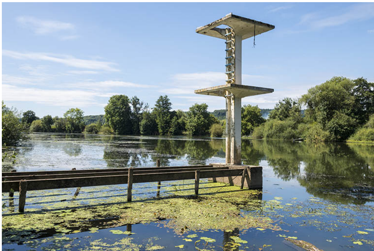
La saône et l'ancienne plage.