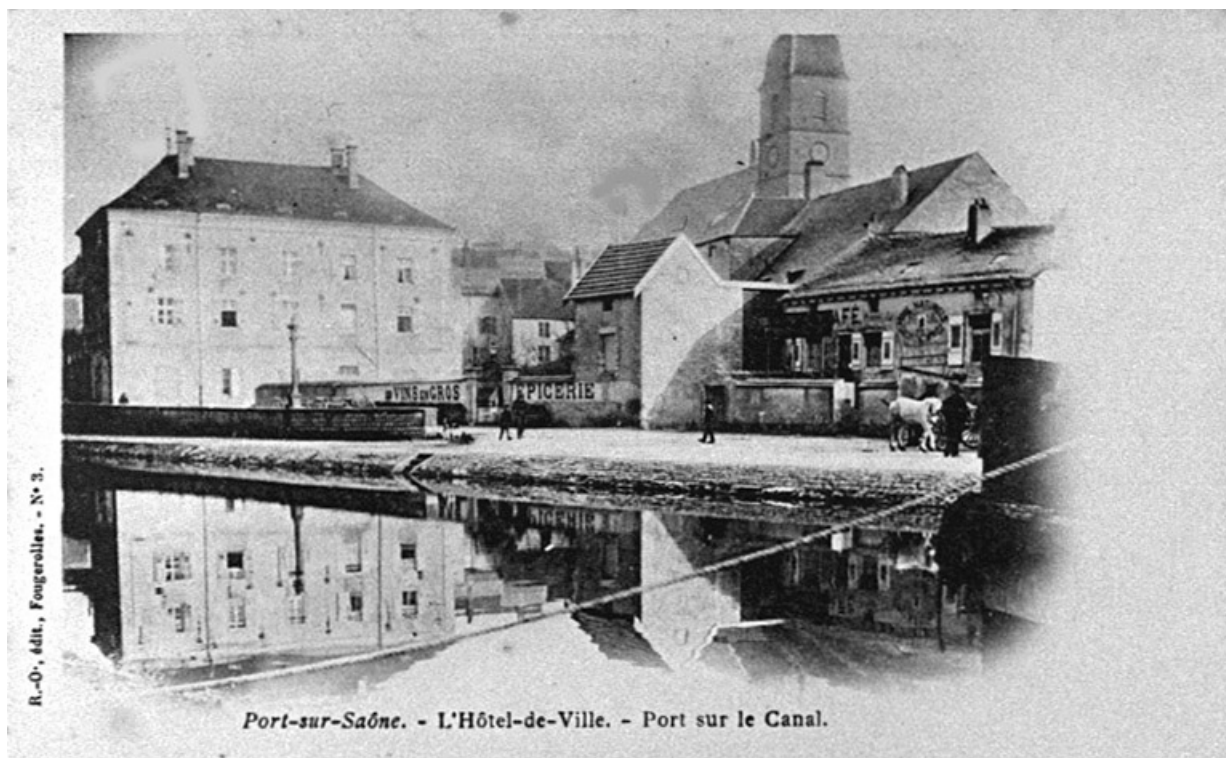
Le canal et l'Hôtel de ville, carte postale.