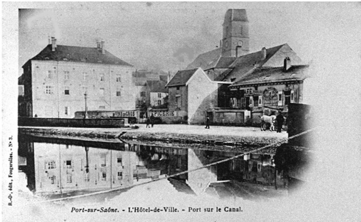
Le canal et l'Hôtel de ville, carte postale.