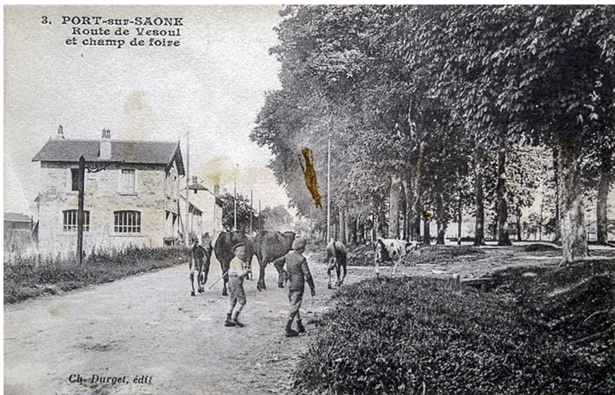
Le champ de foire, carte postale.