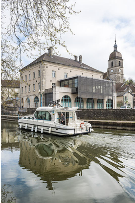
La dérivation avec l'hôtel de ville et l'église. 70, Port-sur-Saône