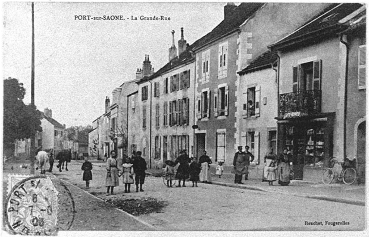
Rue principale, carte postale.