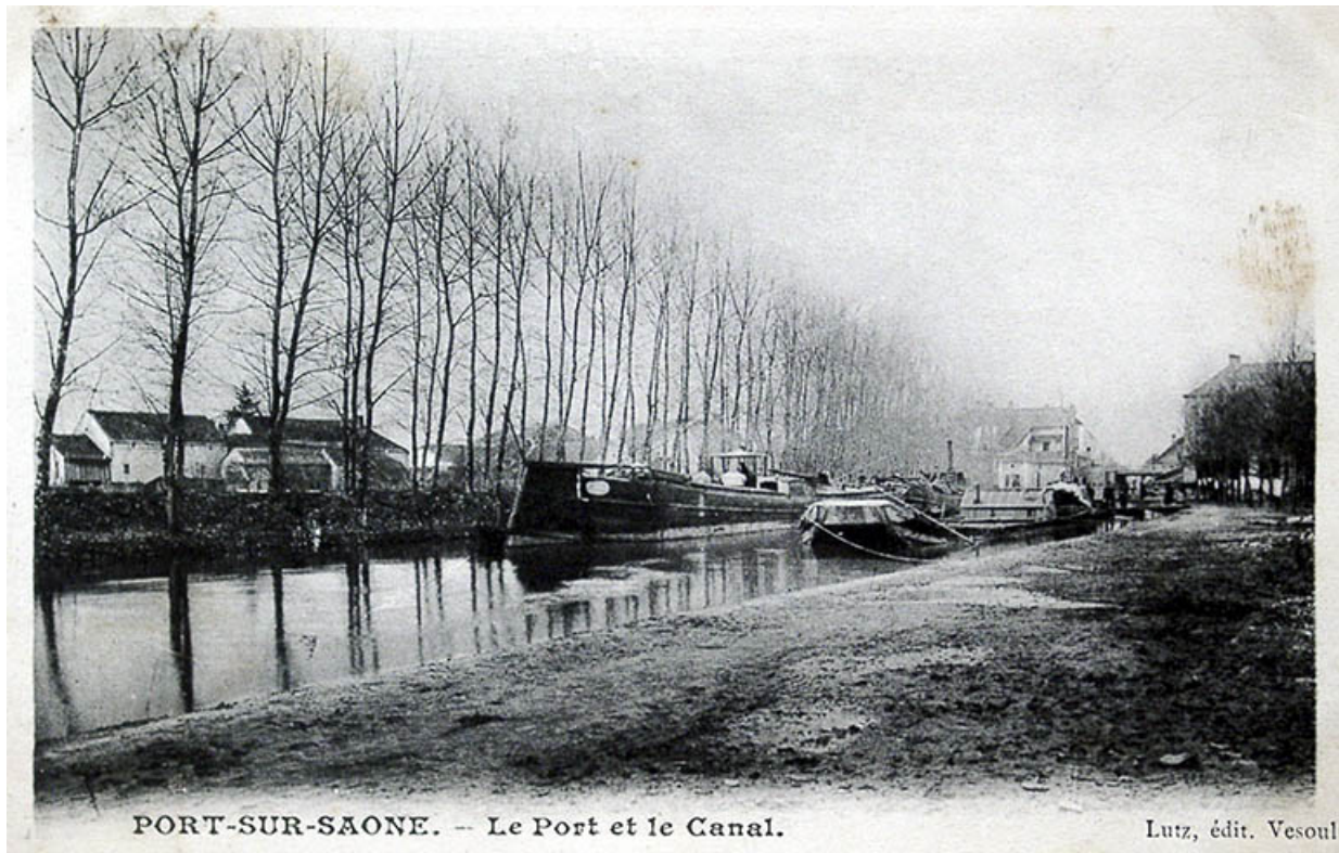
La canal et le port, carte postale