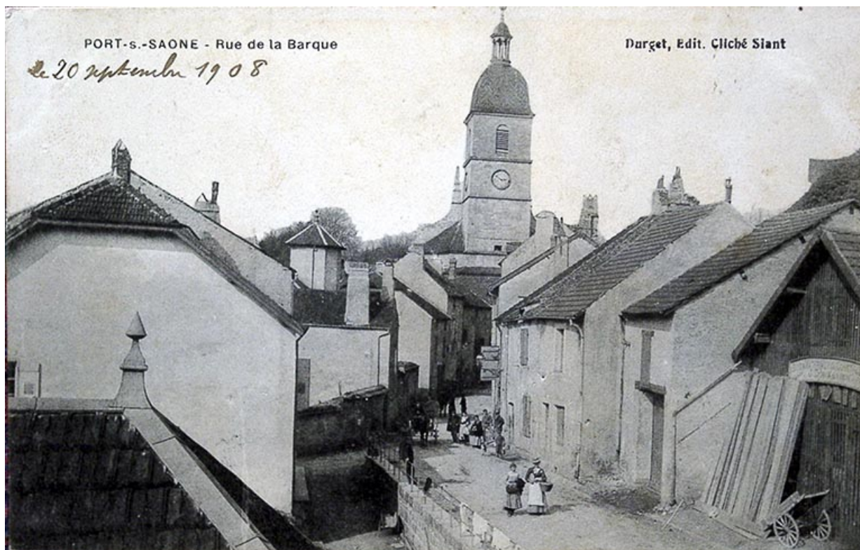
Rue de la barque vers 1908, carte postale. 70, Port-sur-Saône