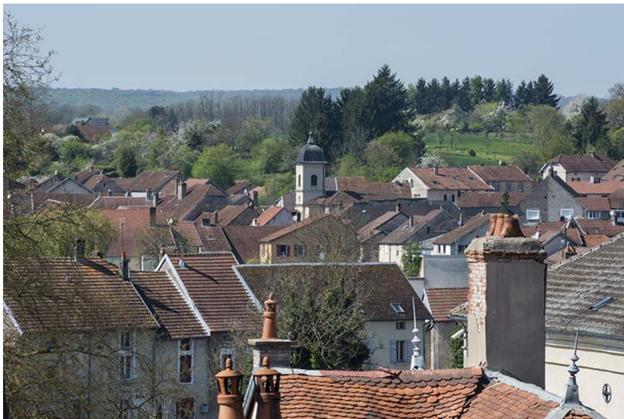
Port-sur-saône, vue des toits.