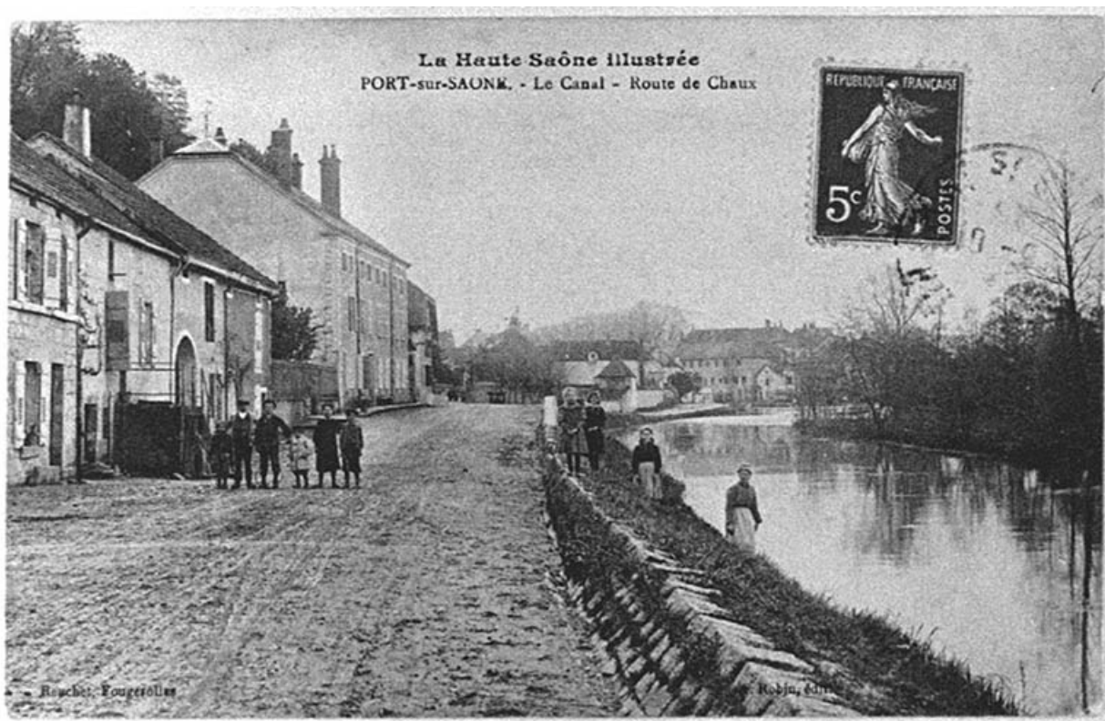
La route de Chaux et le bief, carte postale. 70, Port-sur-Saône