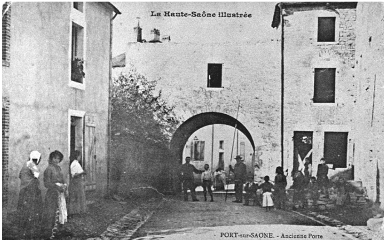
Ancienne porte située rue de l'Eglise, carte postale.