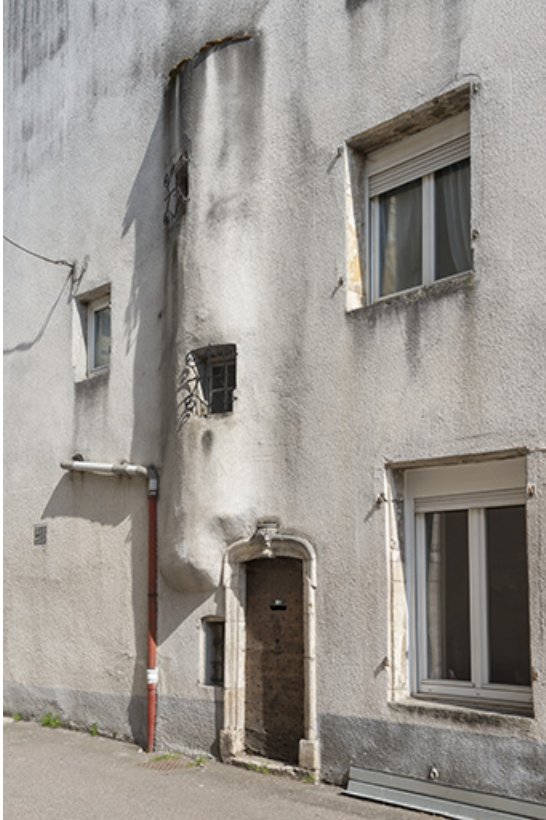
Maison à tour, rue Jean Bogé. 70, Port-sur-Saône