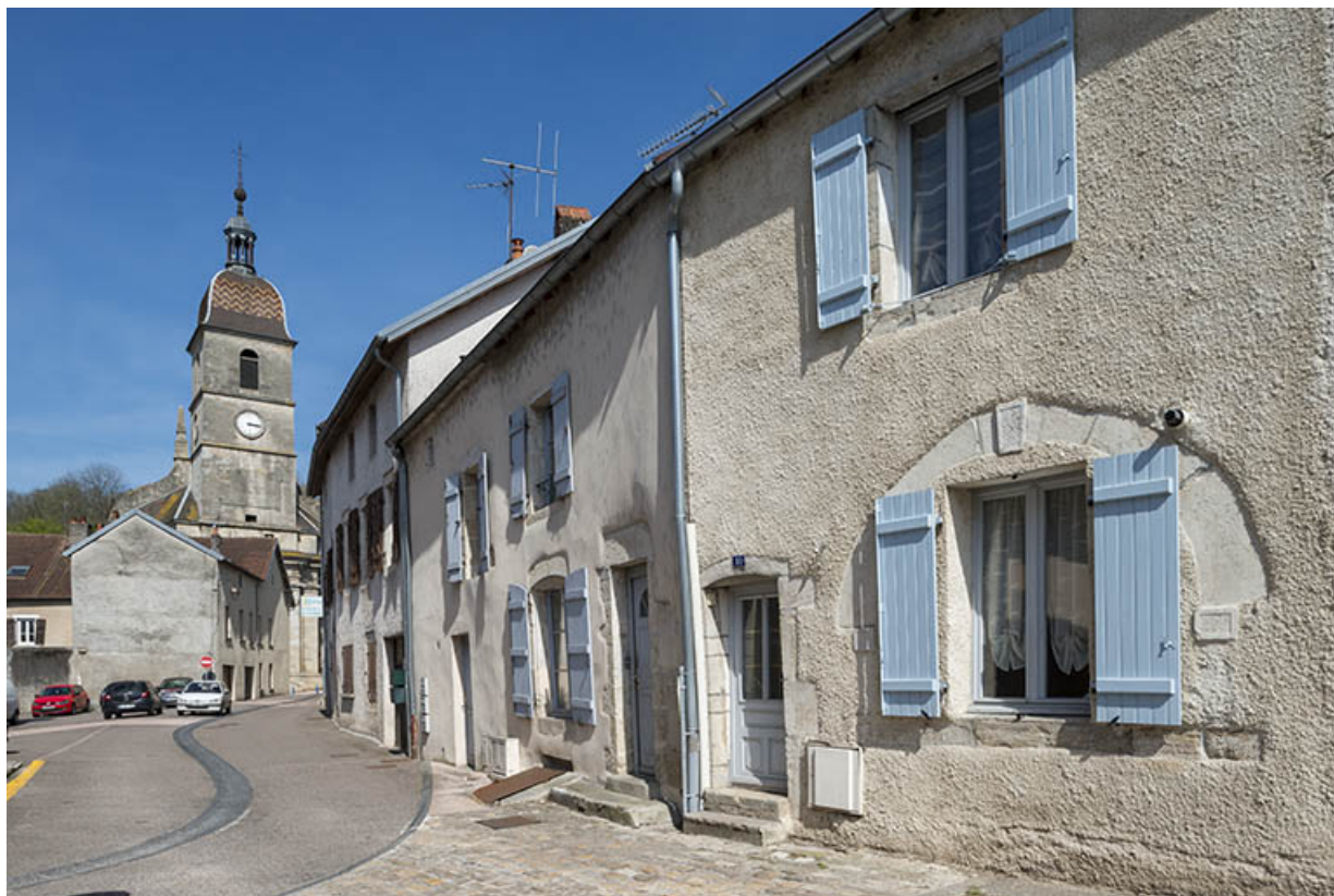
Rue Jean Bogé. 70, Port-sur-Saône