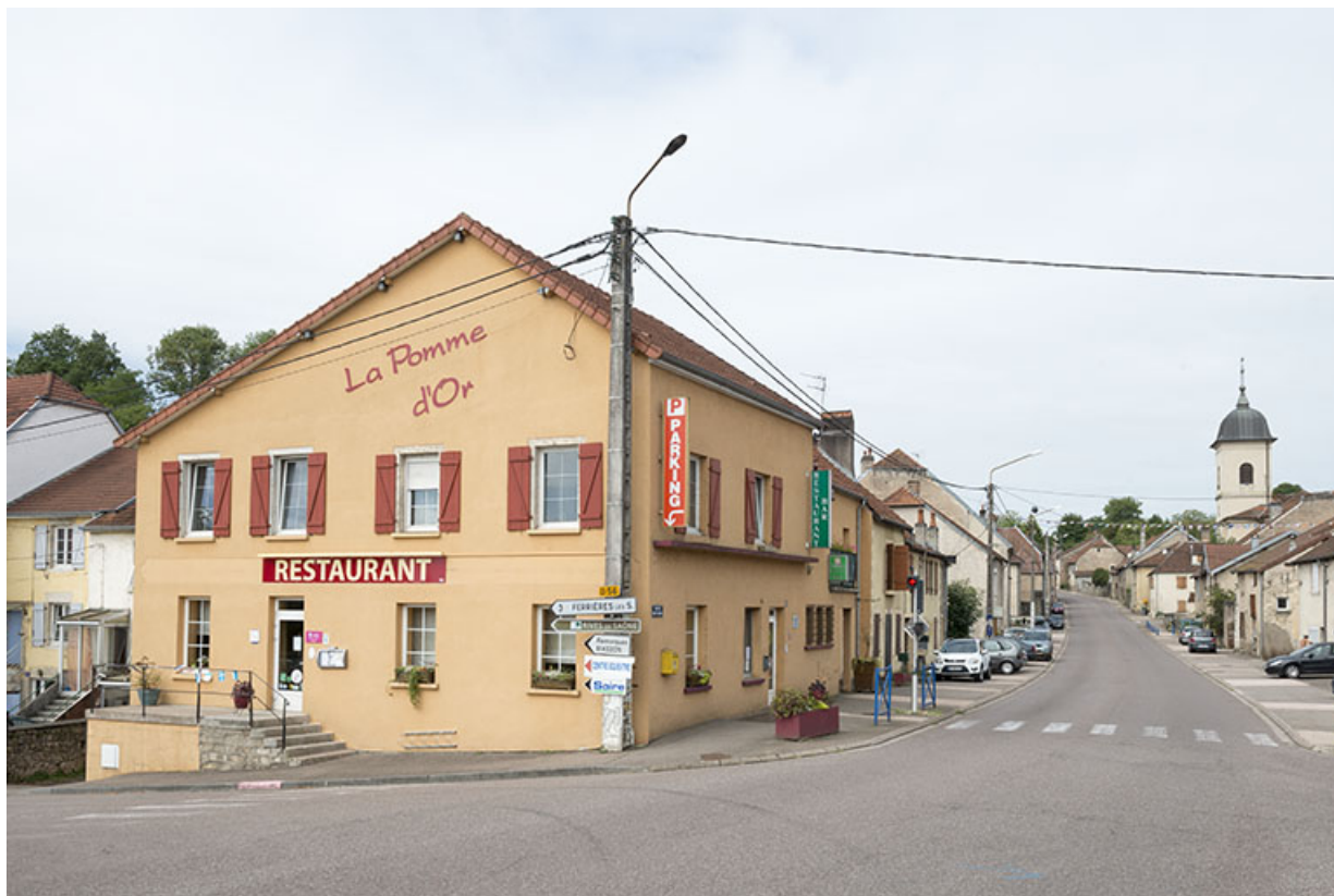
Rue de Saint-Valère. 70, Port-sur-Saône