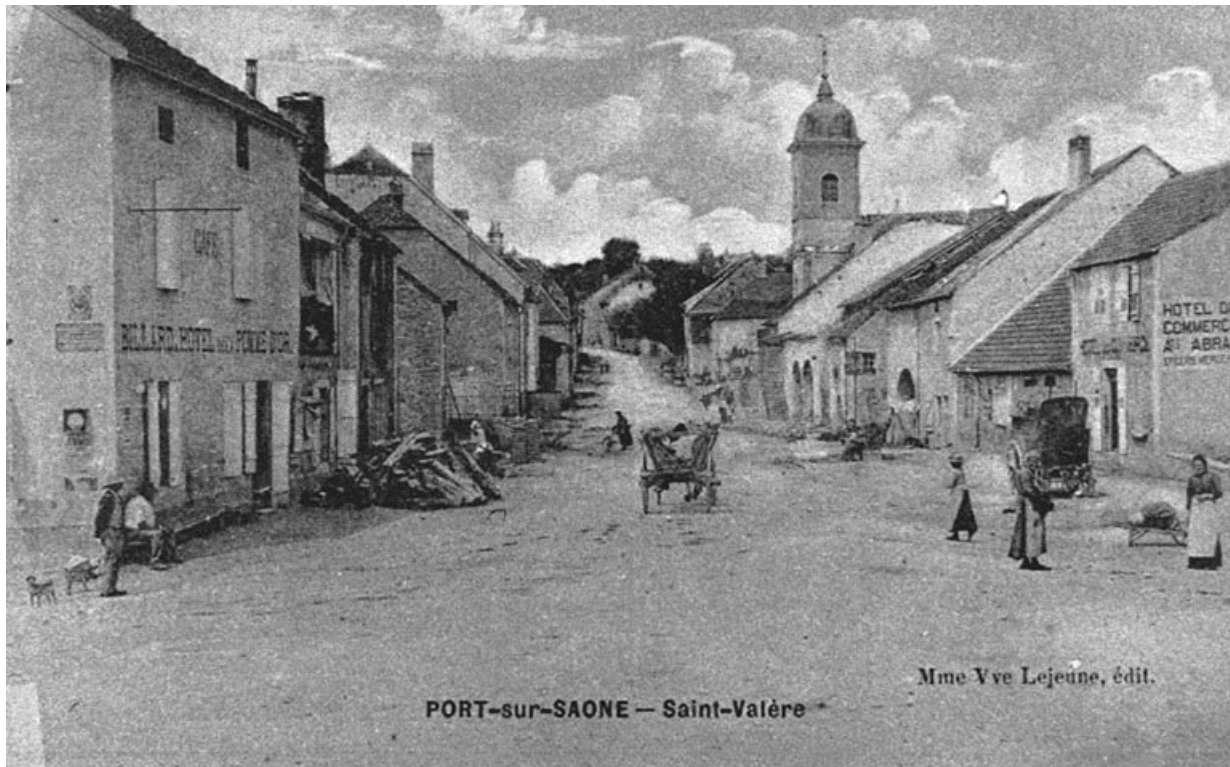
Saint-Valère, carte postale.