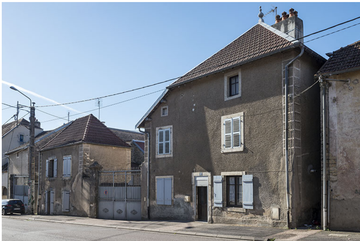
Ferme à Saint-Valère. 70, Port-sur-Saône