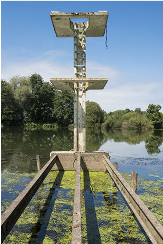
Le plongeur, vue de face.