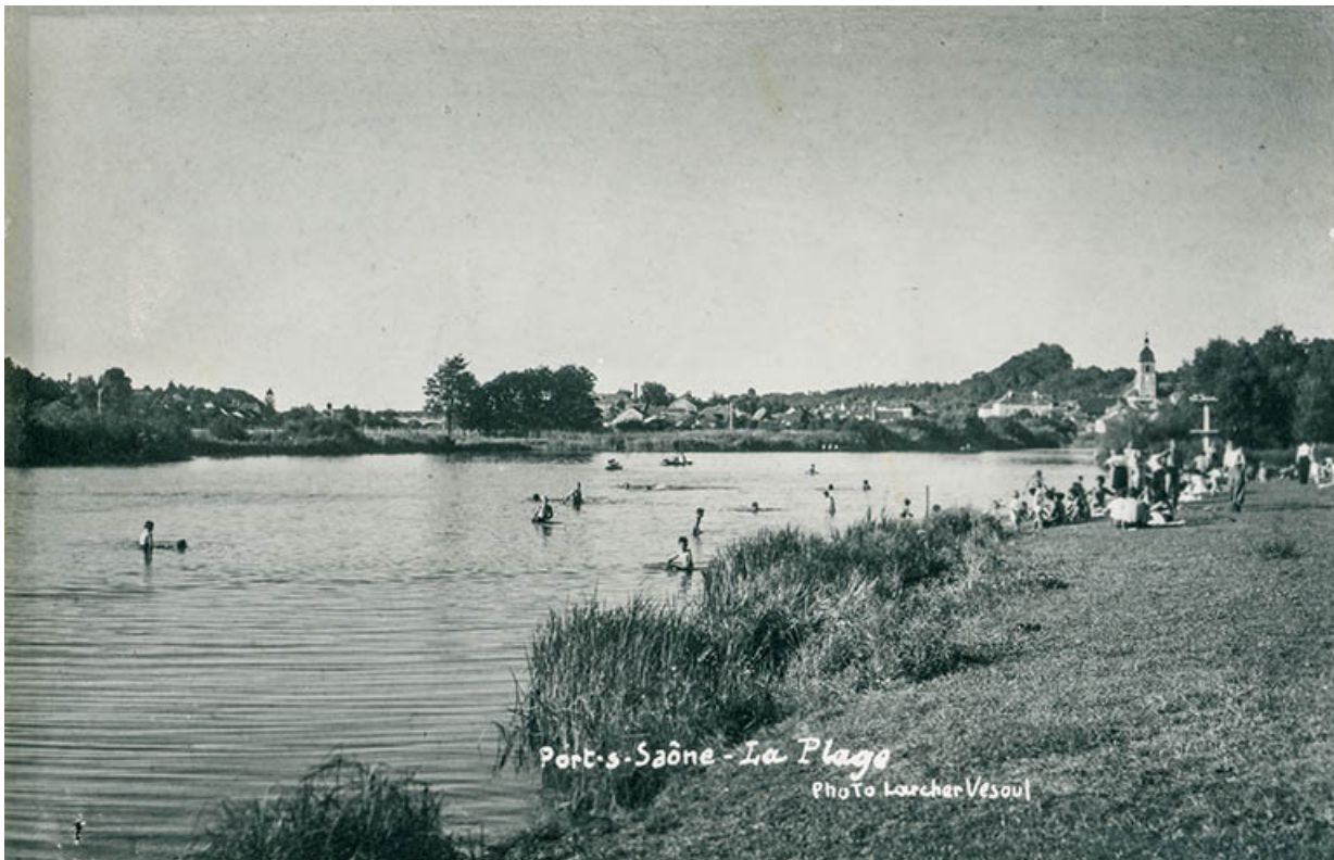
La plage, postale 70, Port-sur-Saône

Port-sur-Saône - La plage. Carte postale éditée par Larcher à Vesoul, 20e siècle.