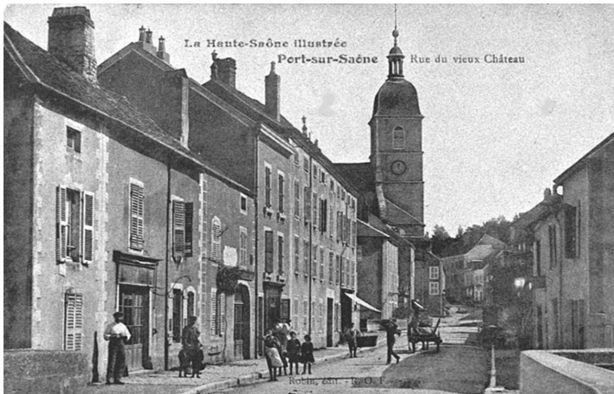
Rue du vieux château, carte postale.