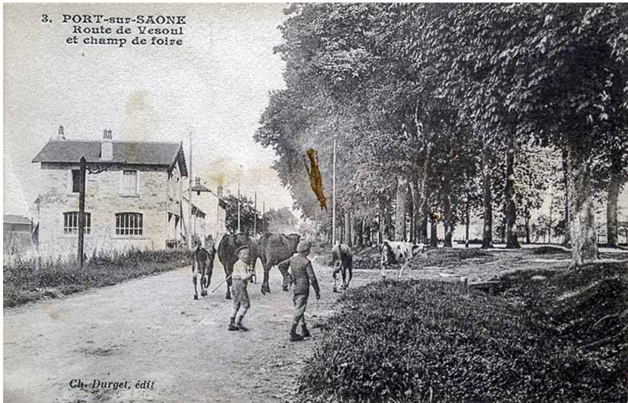
Le champ de foire, carte postale.