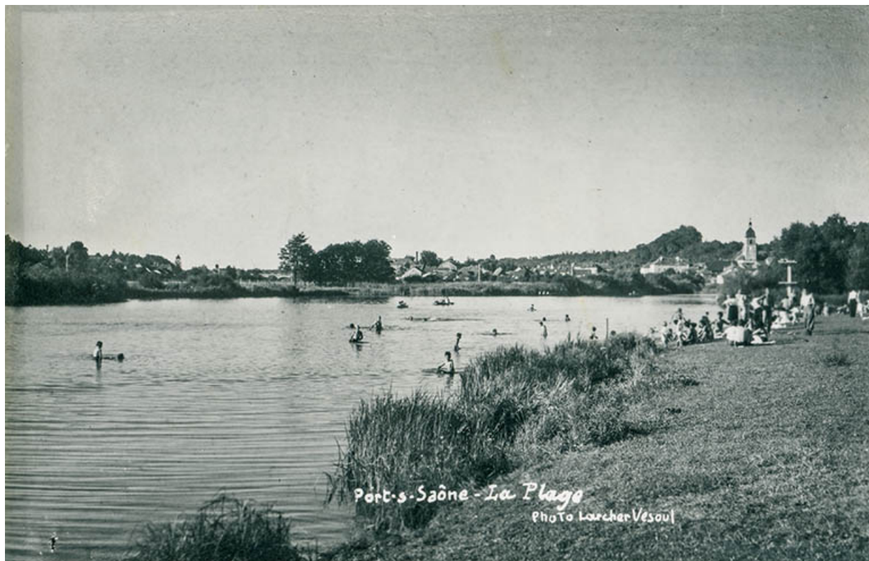
La plage, postale 70, Port-sur-Saône