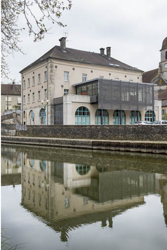
L'hôtel de ville.