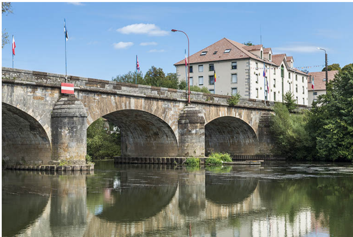
Le pont reliant Saint-Valère à l'île de la Rezelle. 70, Port-sur-Saône