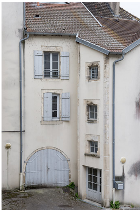
Détail d'une travée.