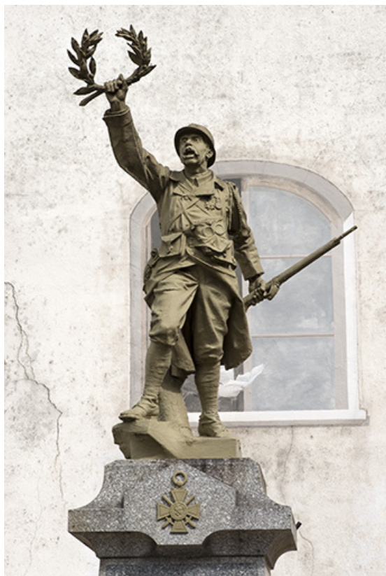
Détail du "poliu". 70, Port-sur-Saône