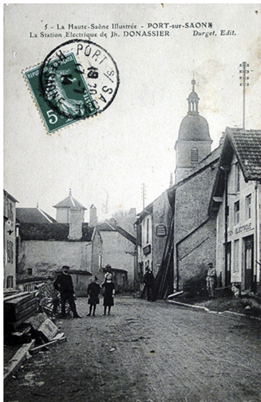
La rue de la Barque, actuelle rue Jean Bogé, carte postale. 70, Port-sur-Saône