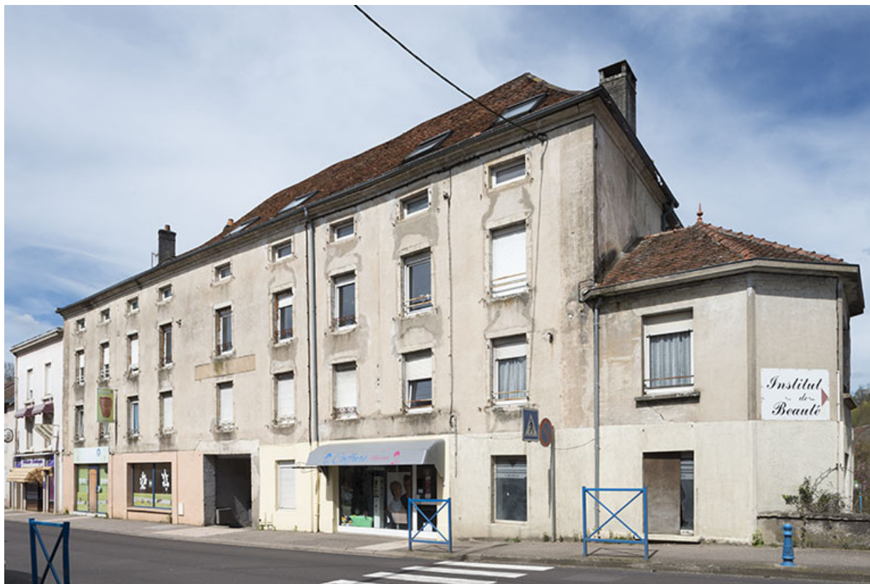
Ancienne gendarmerie, située rue François Mitterrand. 70, Port-sur-Saône