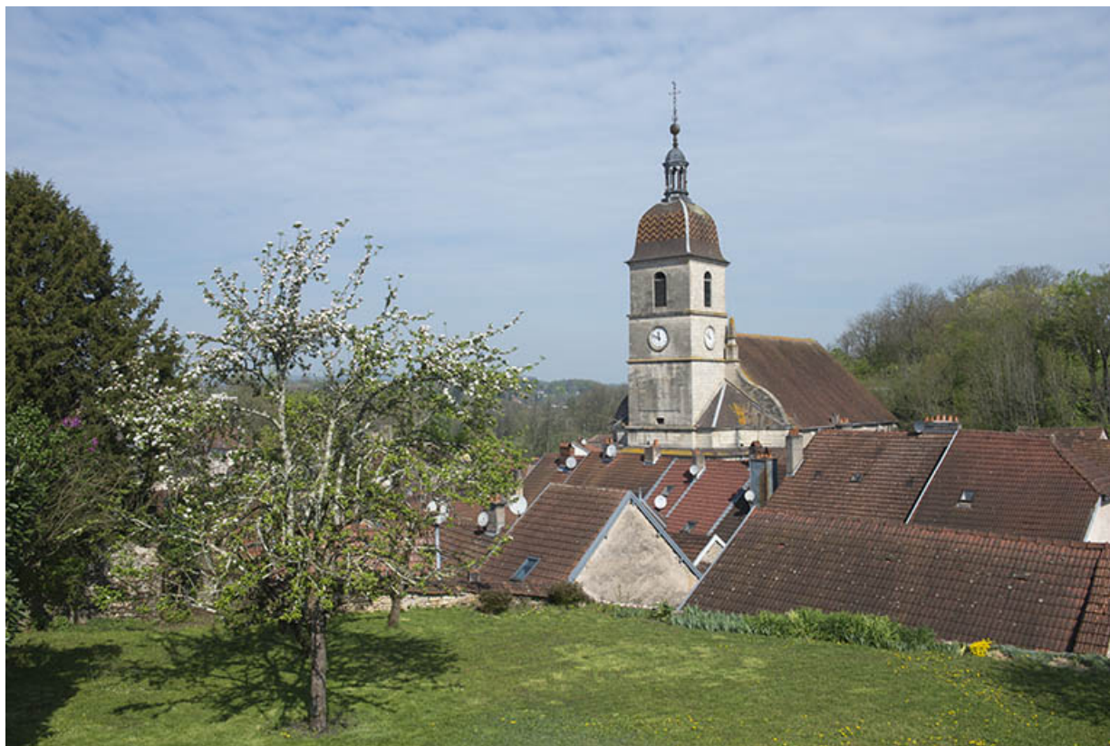
Le clocher de l'église.