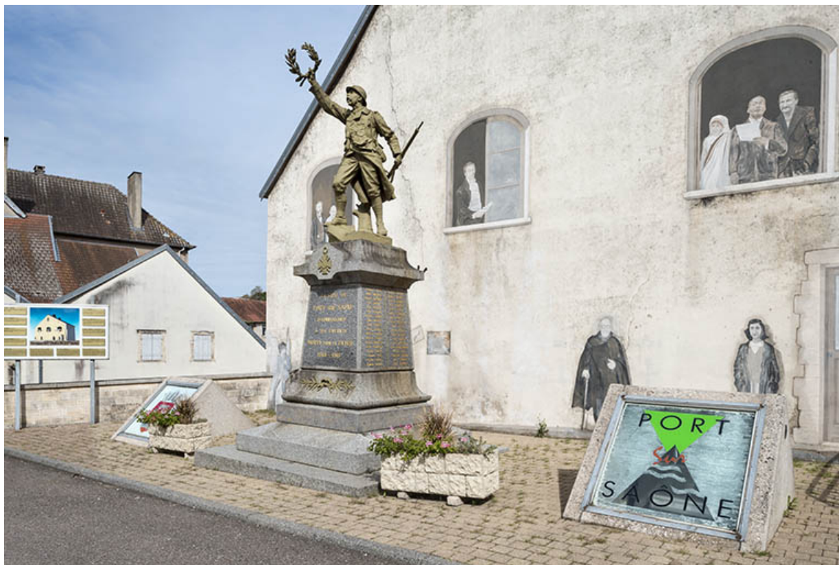
Le monument aux morts, place de l'église. 70, Port-sur-Saône