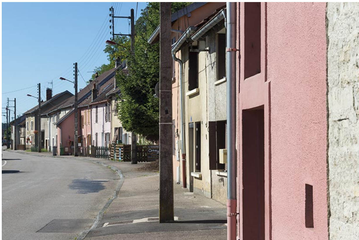
Rue du Magny. 70, Port-sur-Saône