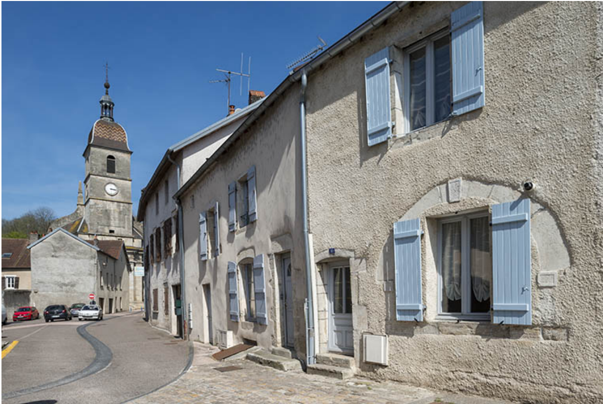
Rue Jean Bogé. 70, Port-sur-Saône