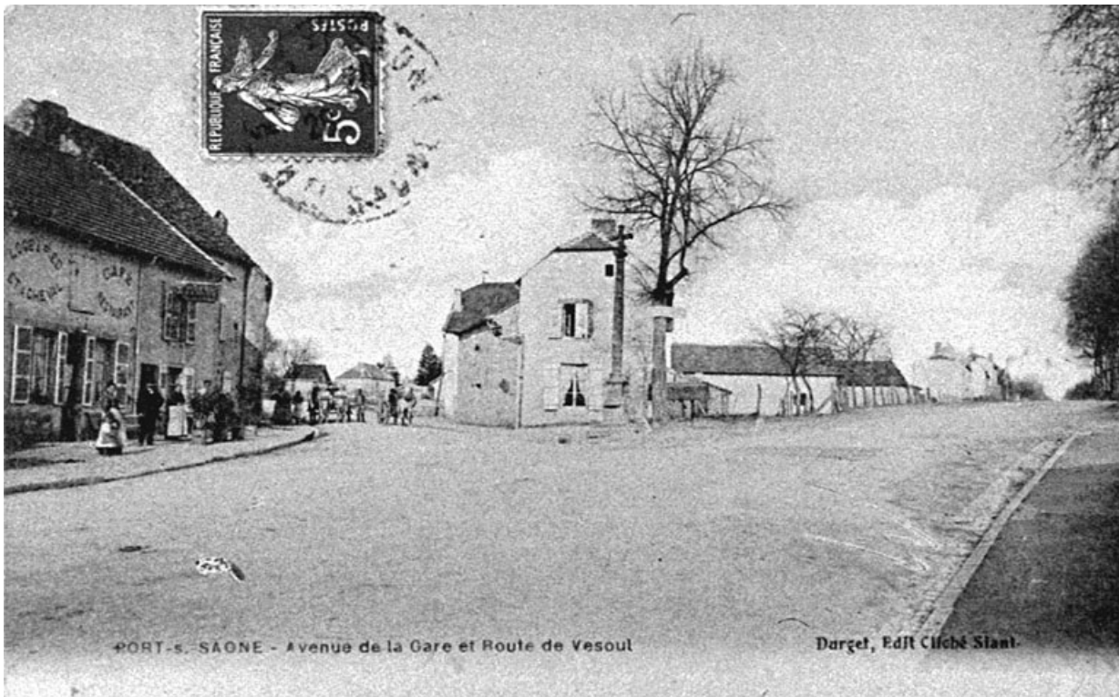
Le carrefour où est implantée la croix, carte postale. 70, Port-sur-Saône

Port-sur-Saône. Avenue de la Gare et route de Vesoul. Carte postale éditée par Dargel (cliché de Siant), 20e siècle. Lieu de conservation : Collection particulière, Claude Colombier, Port-sur-Saône