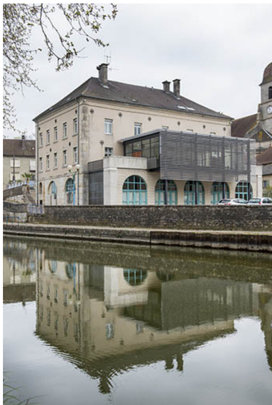
L'hôtel de ville.