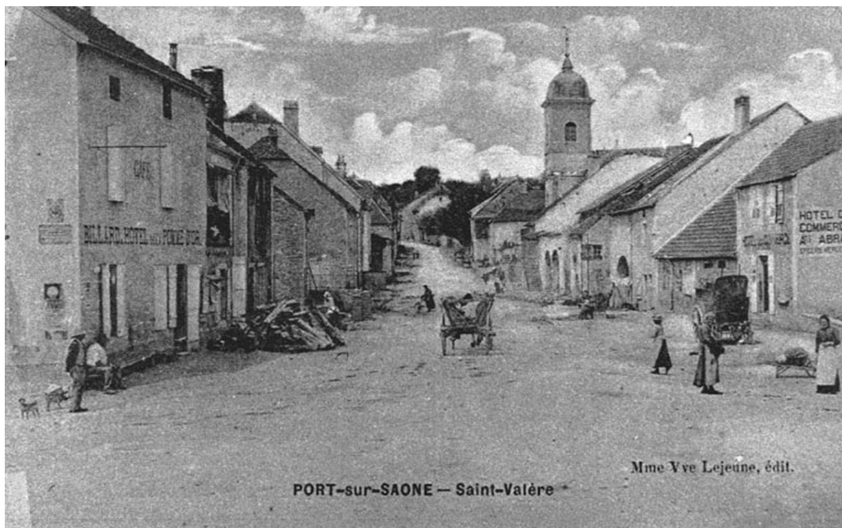
Saint-Valère, carte postale.