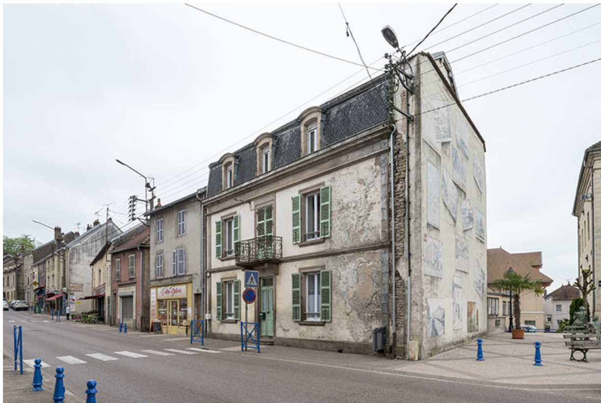
Maison 19e dans le bas de la rue François Mitterrand. 70, Port-sur-Saône