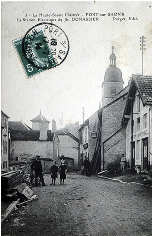
La rue de la Barque, actuelle rue Jean Bogé, carte postale. 70, Port-sur-Saône