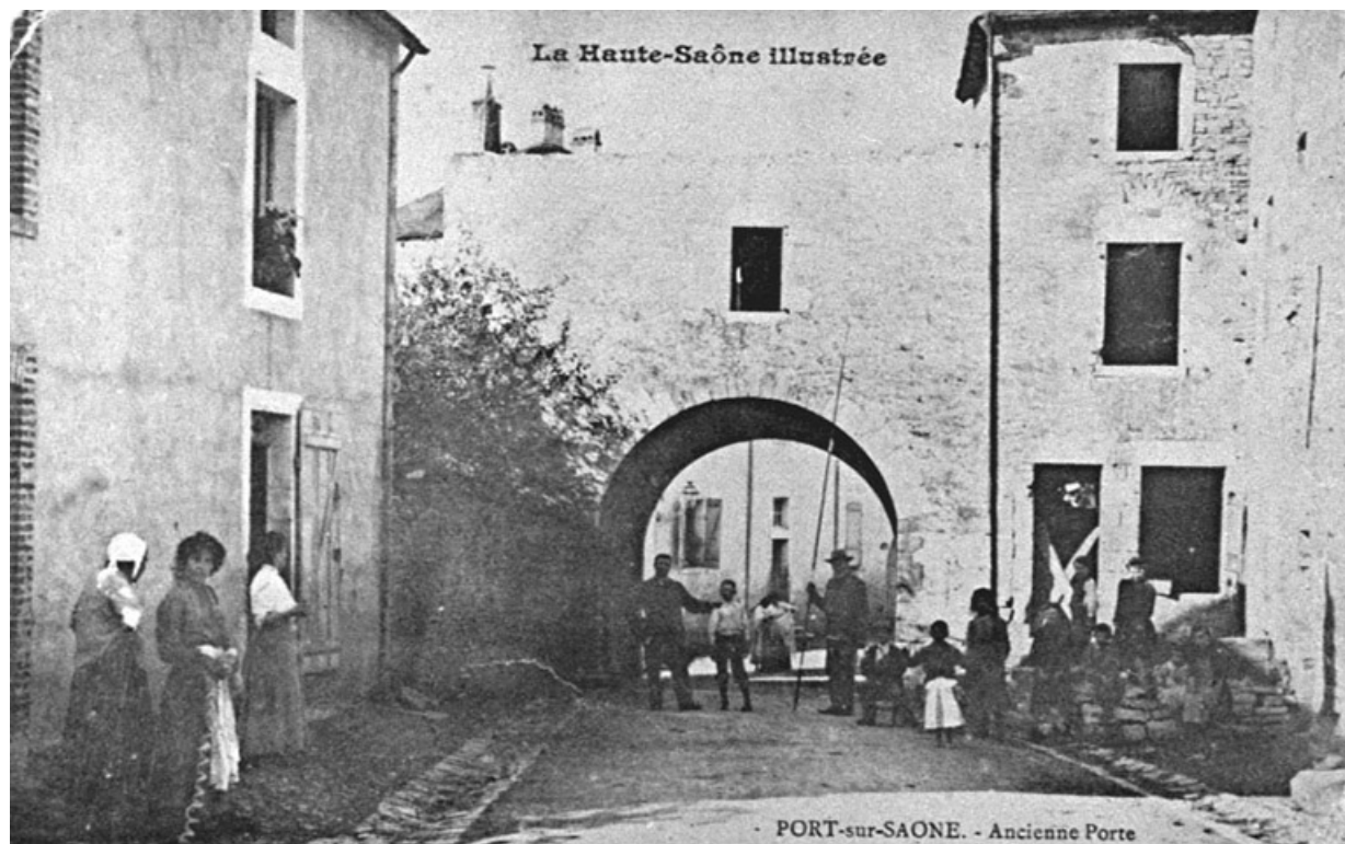
Ancienne porte située rue de l'Eglise, carte postale.