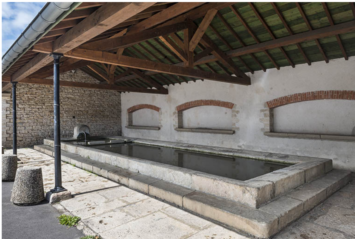
Le lavoir, Saint-Valère. 70, Port-sur-Saône