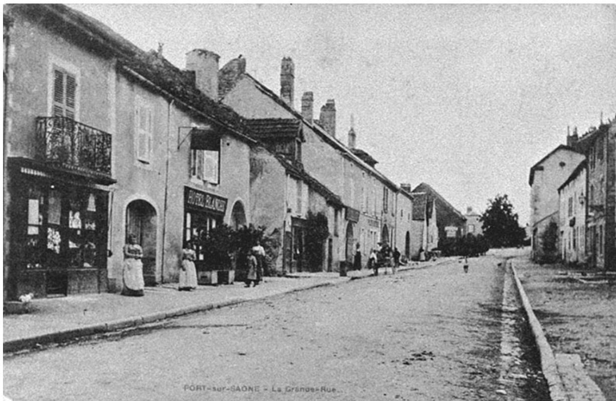
La Grande rue, carte postale.