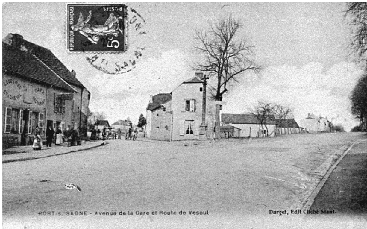
Le carrefour où est implantée la croix, carte postale.