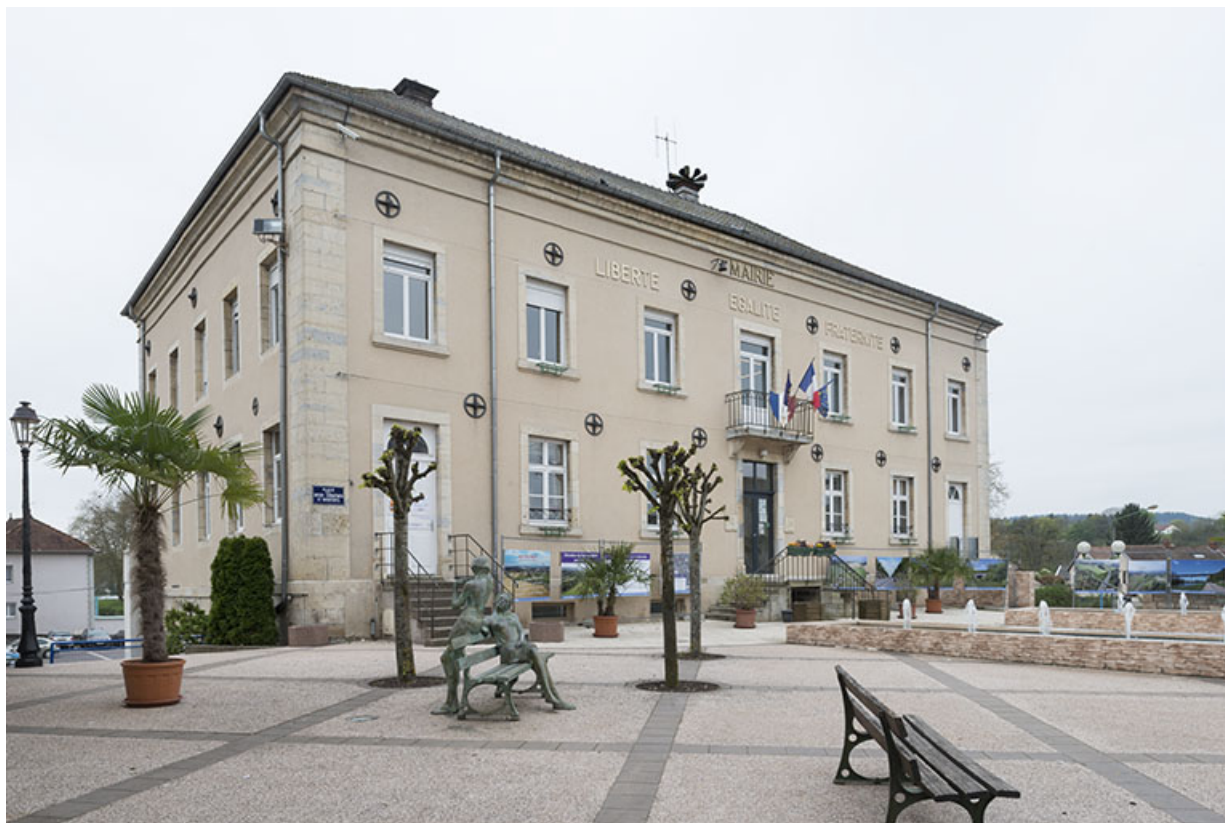
La façade principale de l'hôtel de ville.