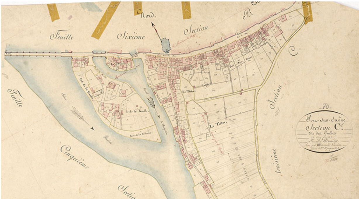
Plan de la ville extrait du plan cadastral (section c), 1828.