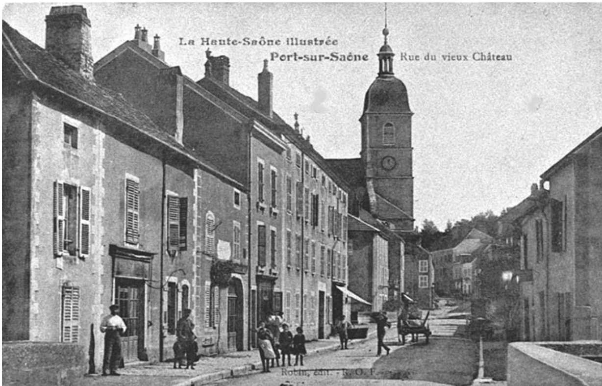
Rue du vieux château, carte postale.