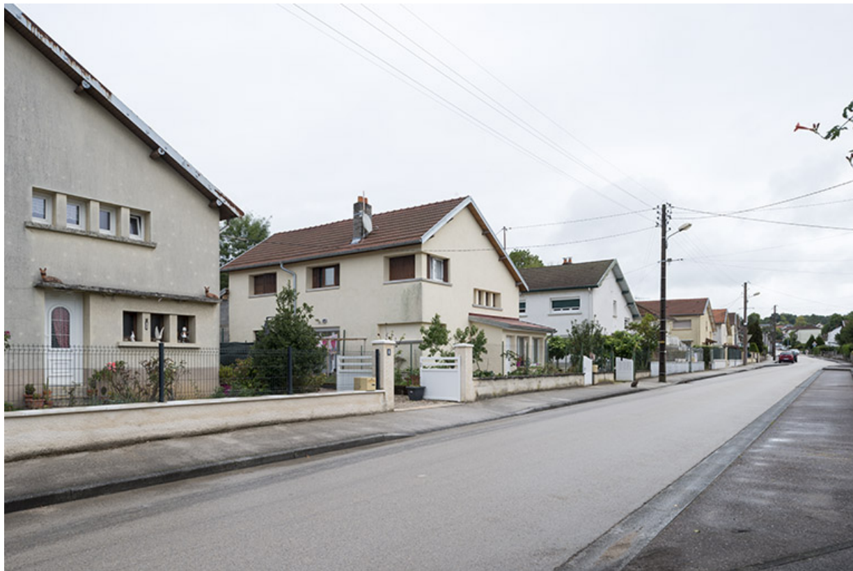
L'avenue de la Plage avec les pavillons Selam. 70, Port-sur-Saône