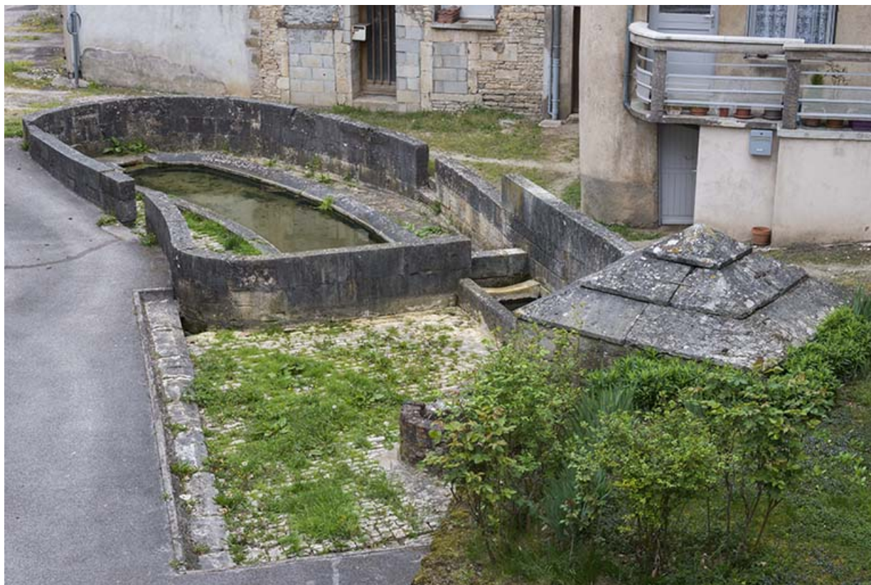
Le lavoir, rue de la Fontaine. 70, Port-sur-Saône