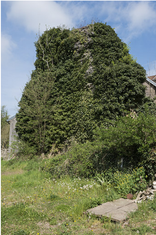
Ruines de l'ancien château.