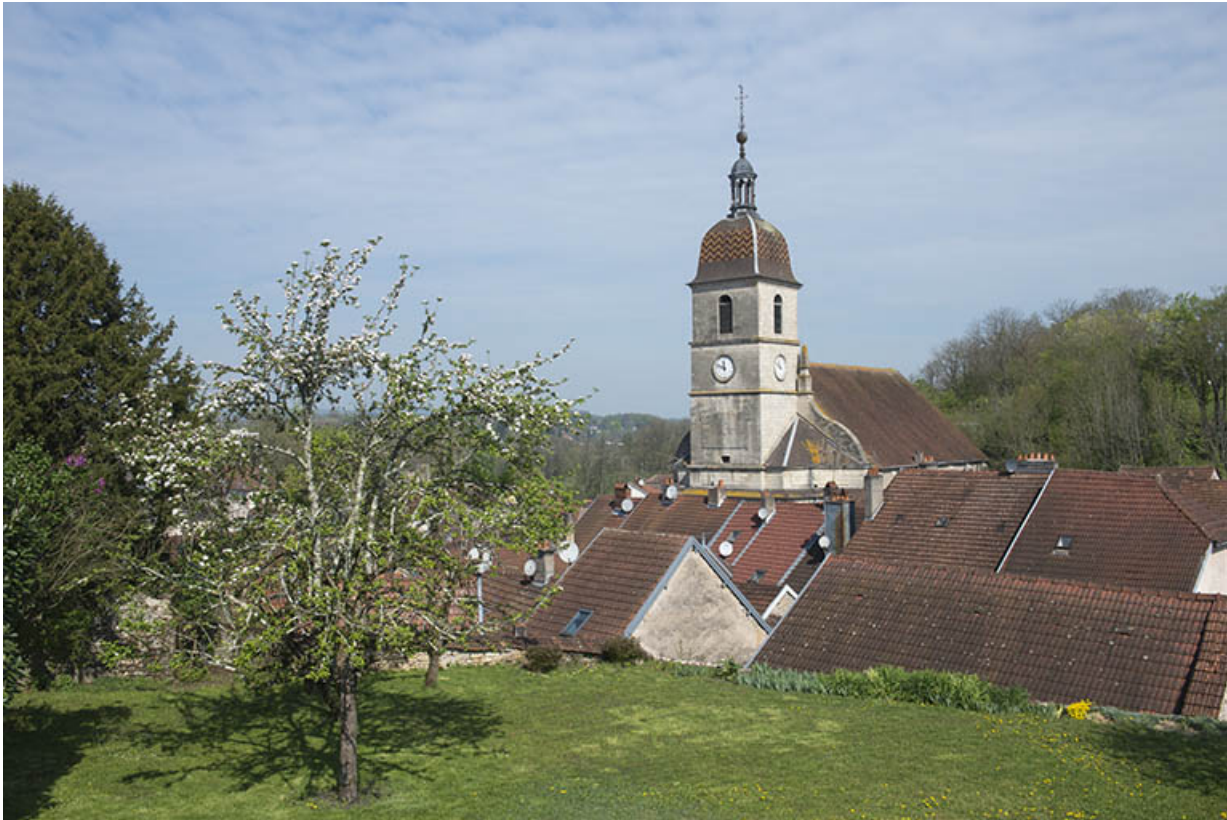
Le clocher de l'église.