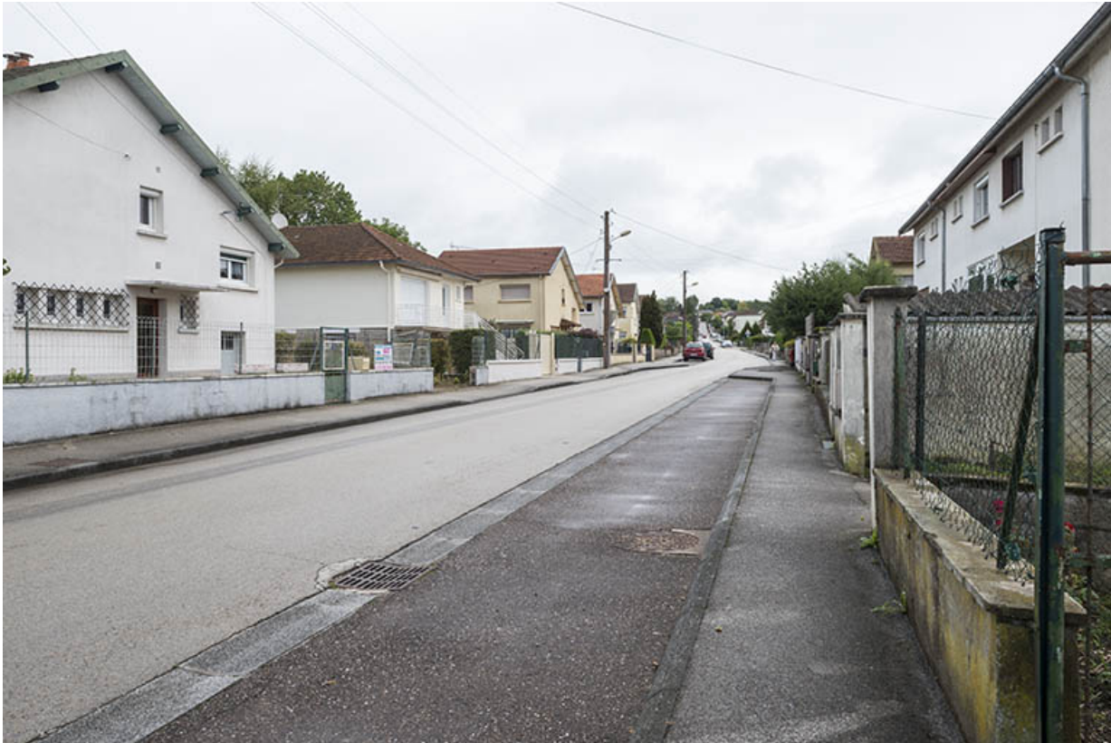
L'avenue de la Plage, vue générale.