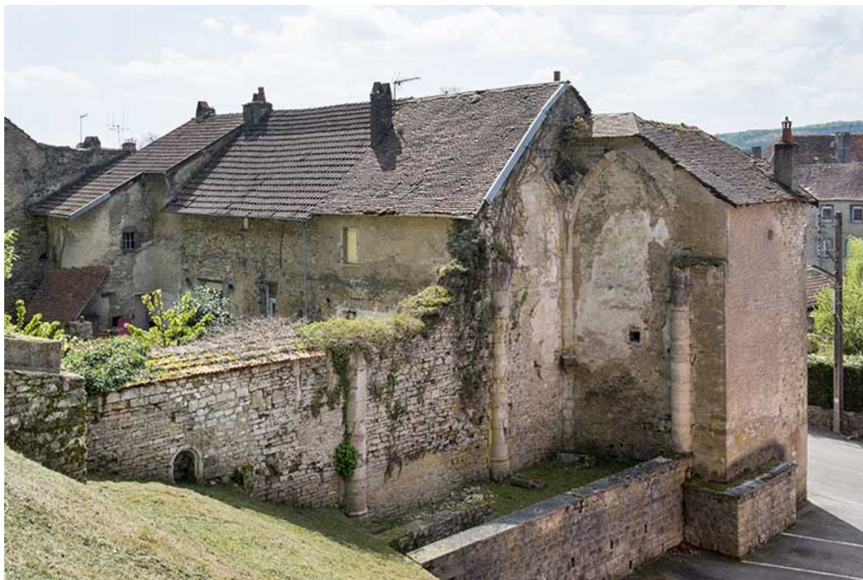
L'ancienne église et prieuré. 70, Port-sur-Saône