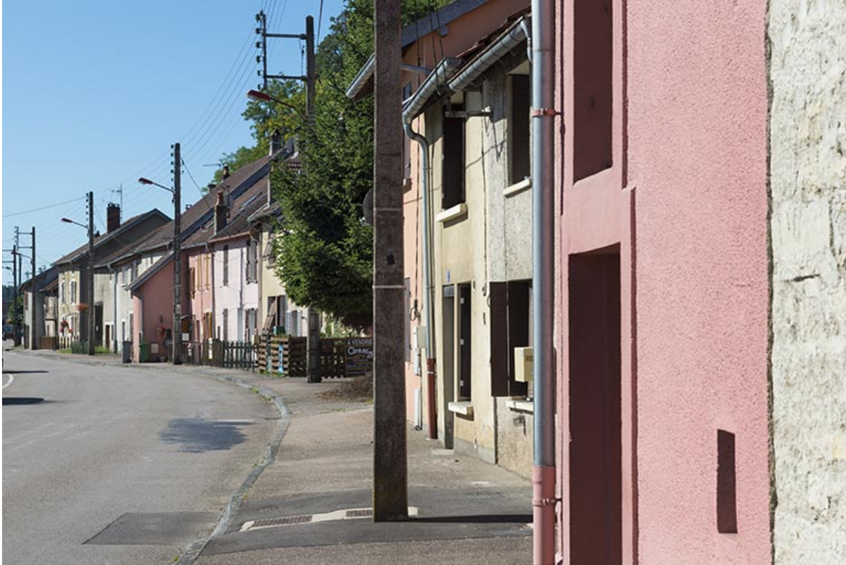
Rue du Magny. 70, Port-sur-Saône