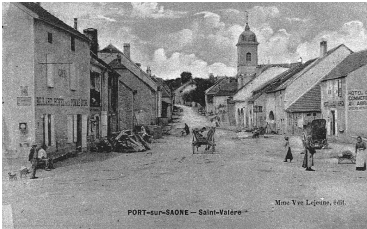
Saint-Valère, carte postale.