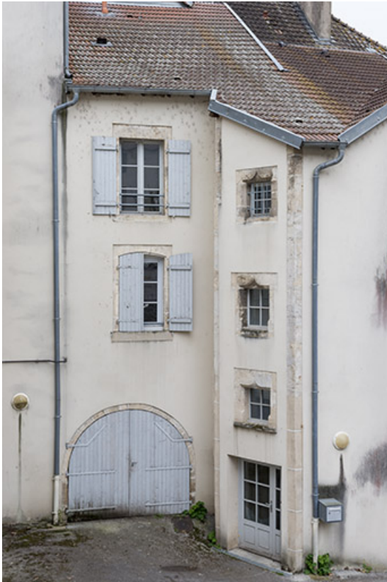
Détail d'une travée. 70, Port-sur-Saône