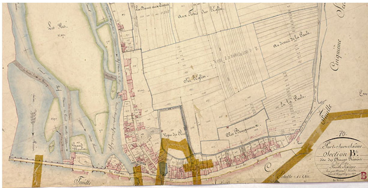
Plan de la ville extrait du plan cadastral (section B), 1828.