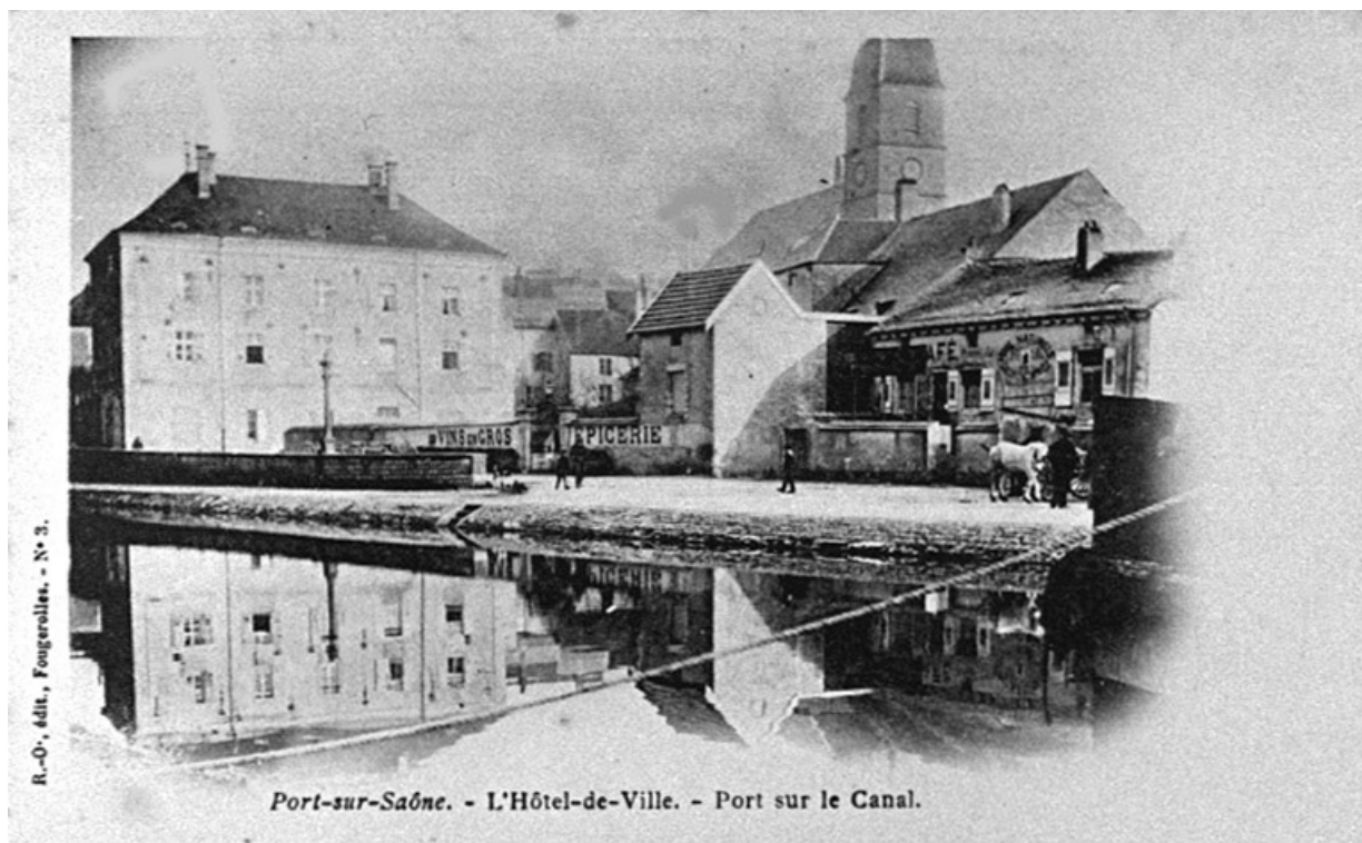
Le canal et l'Hôtel de ville, carte postale.