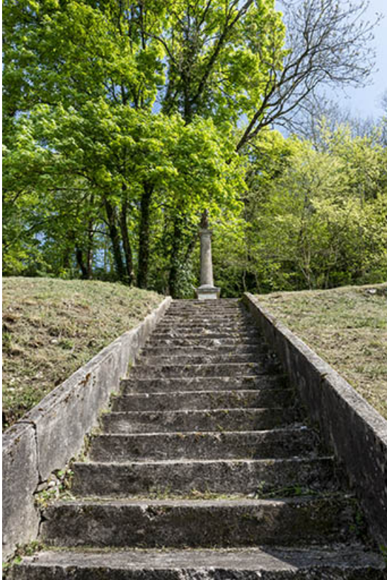
Escalier menant à une croix, ancien cimetière. 70, Port-sur-Saône