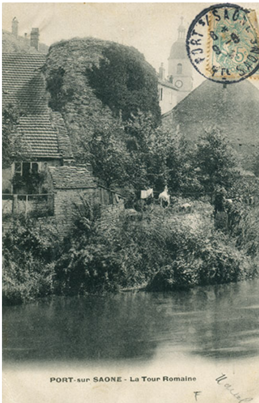
Ruines du château, carte postale.