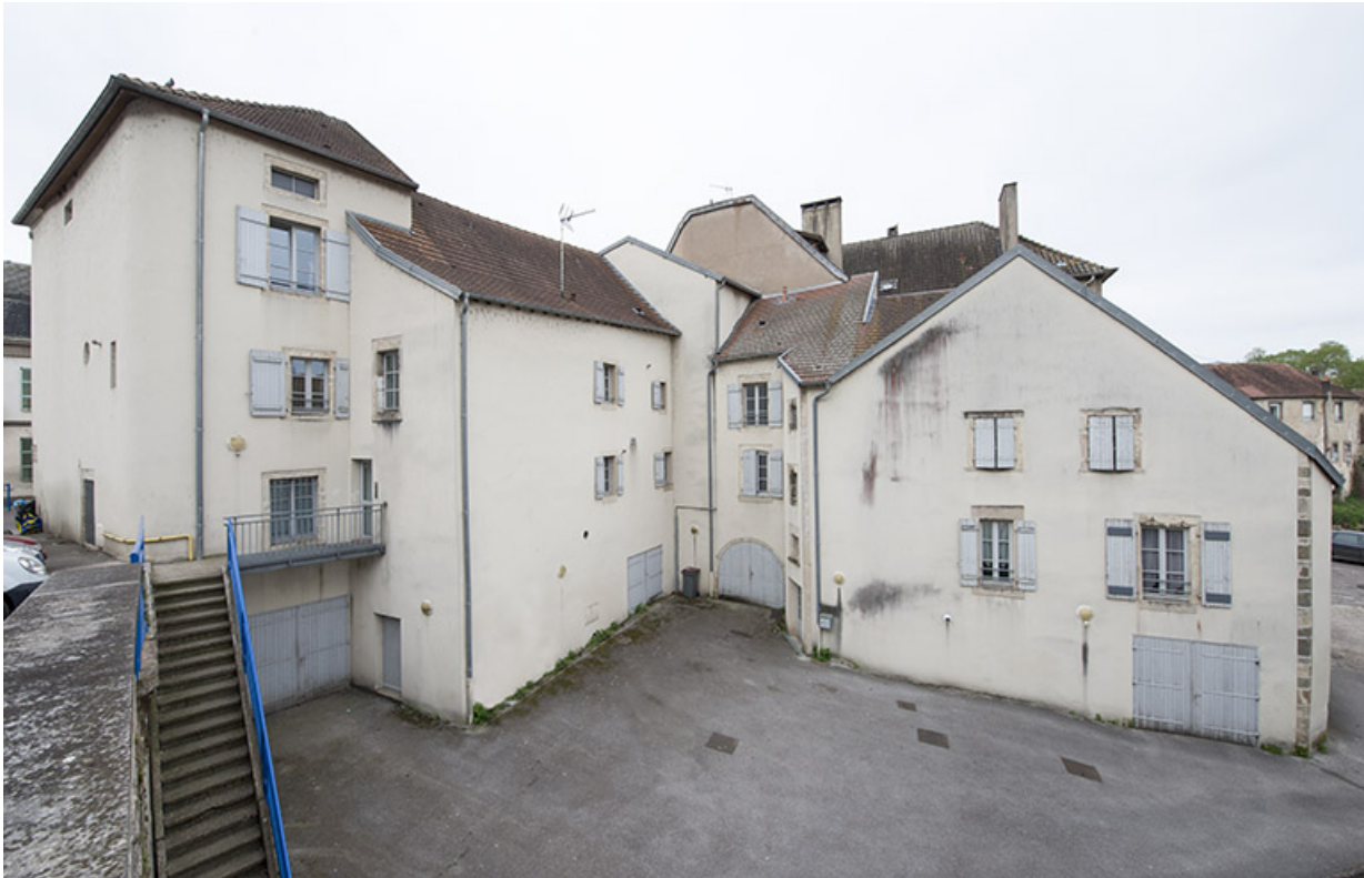
Maisons, île de l'ancien château.