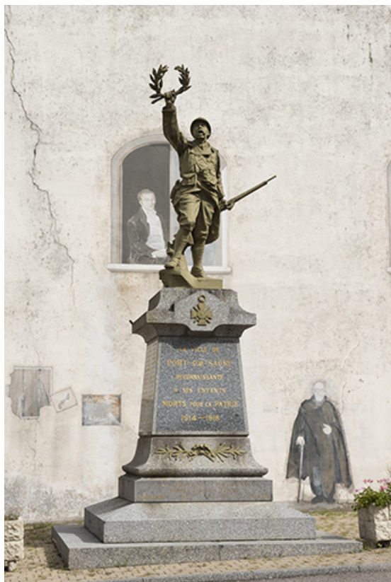
Vue d'ensemble du monument.