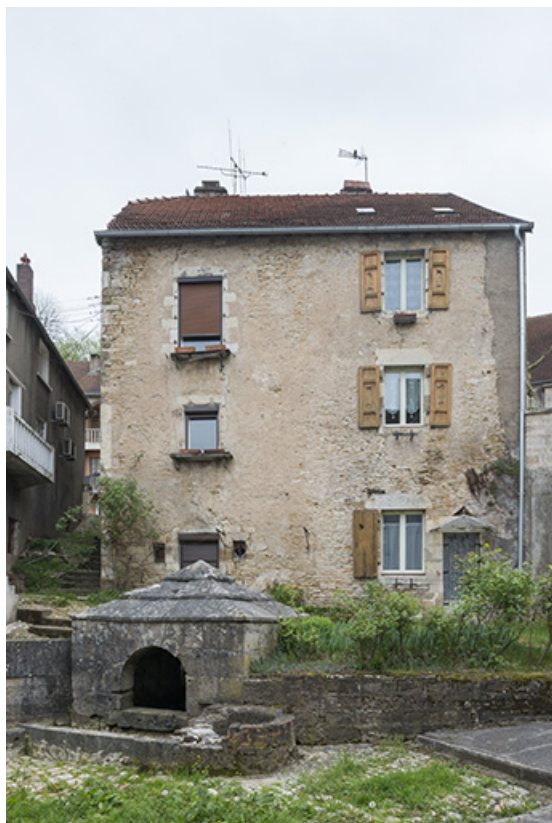
Le "vieux Port-sur-Saône", rue de la Fontaine. 70, Port-sur-Saône