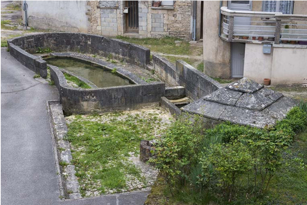
Le lavoir, rue de la Fontaine. 70, Port-sur-Saône