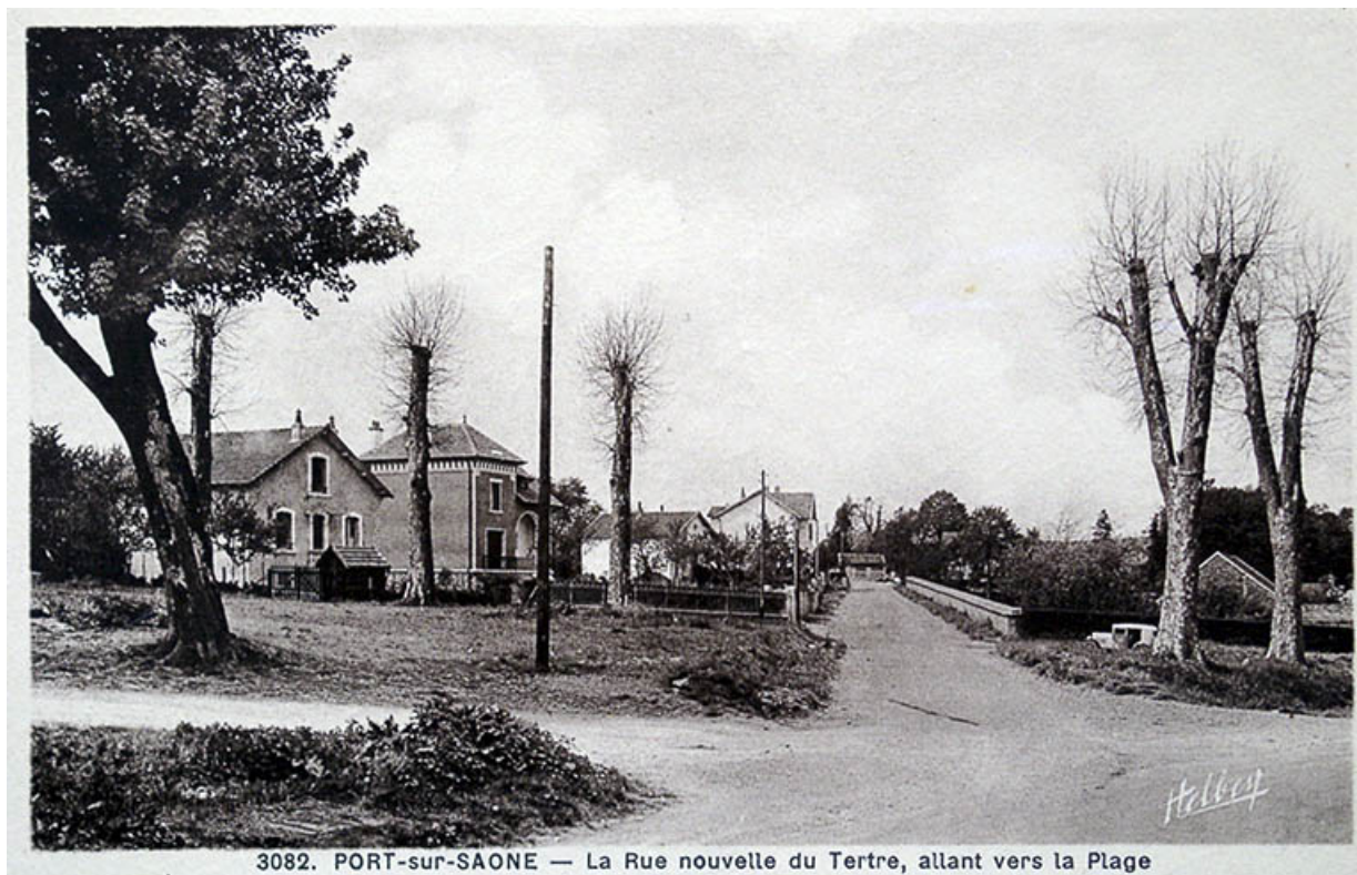
3082. PORT-sur-SAONE — La Rue nouvelle du Tertre, allant vers la Plage

La nouvelle rue du Tertre, carte postale.