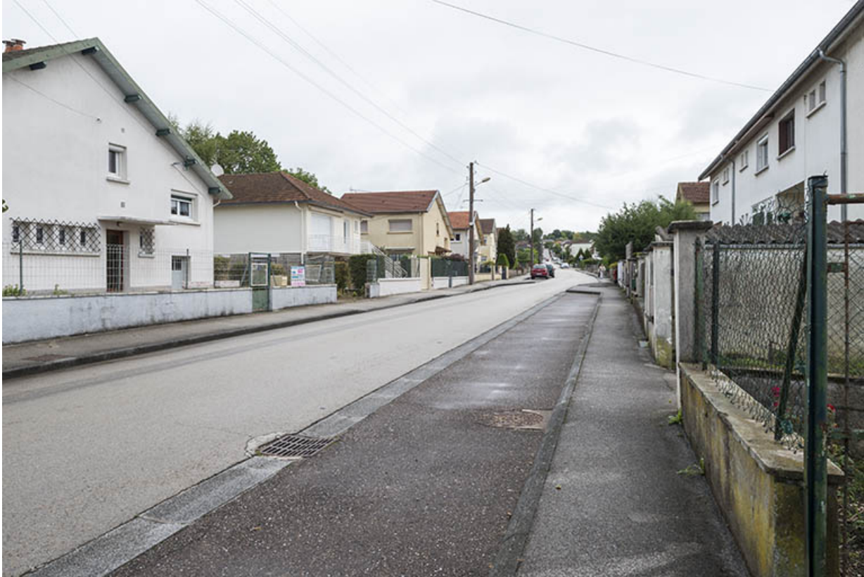
L'avenue de la Plage, vue générale.