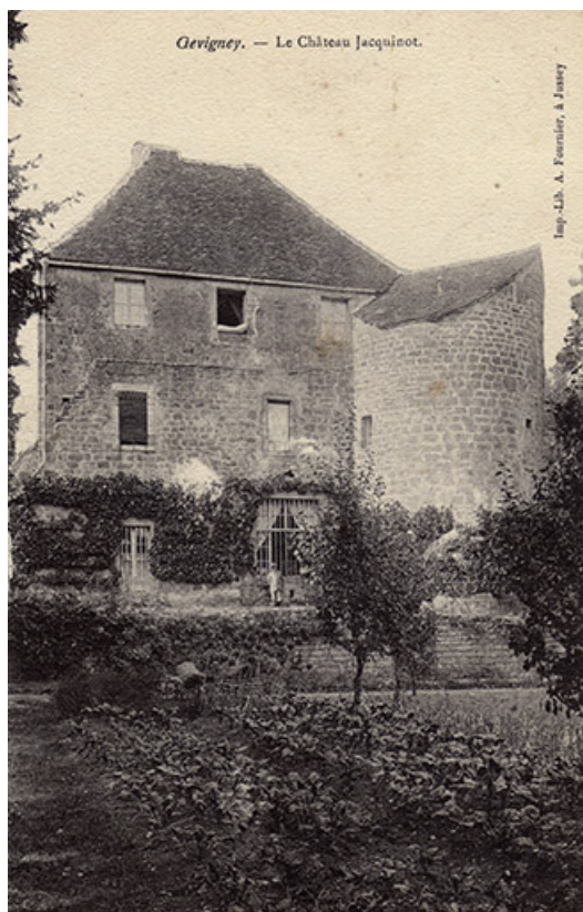
Le château, carte postale.