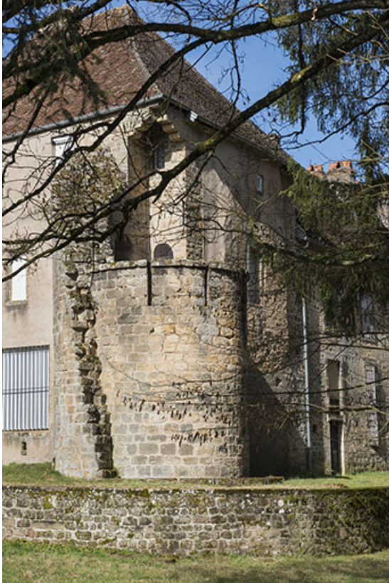
Tour "médiévale" subsistante.