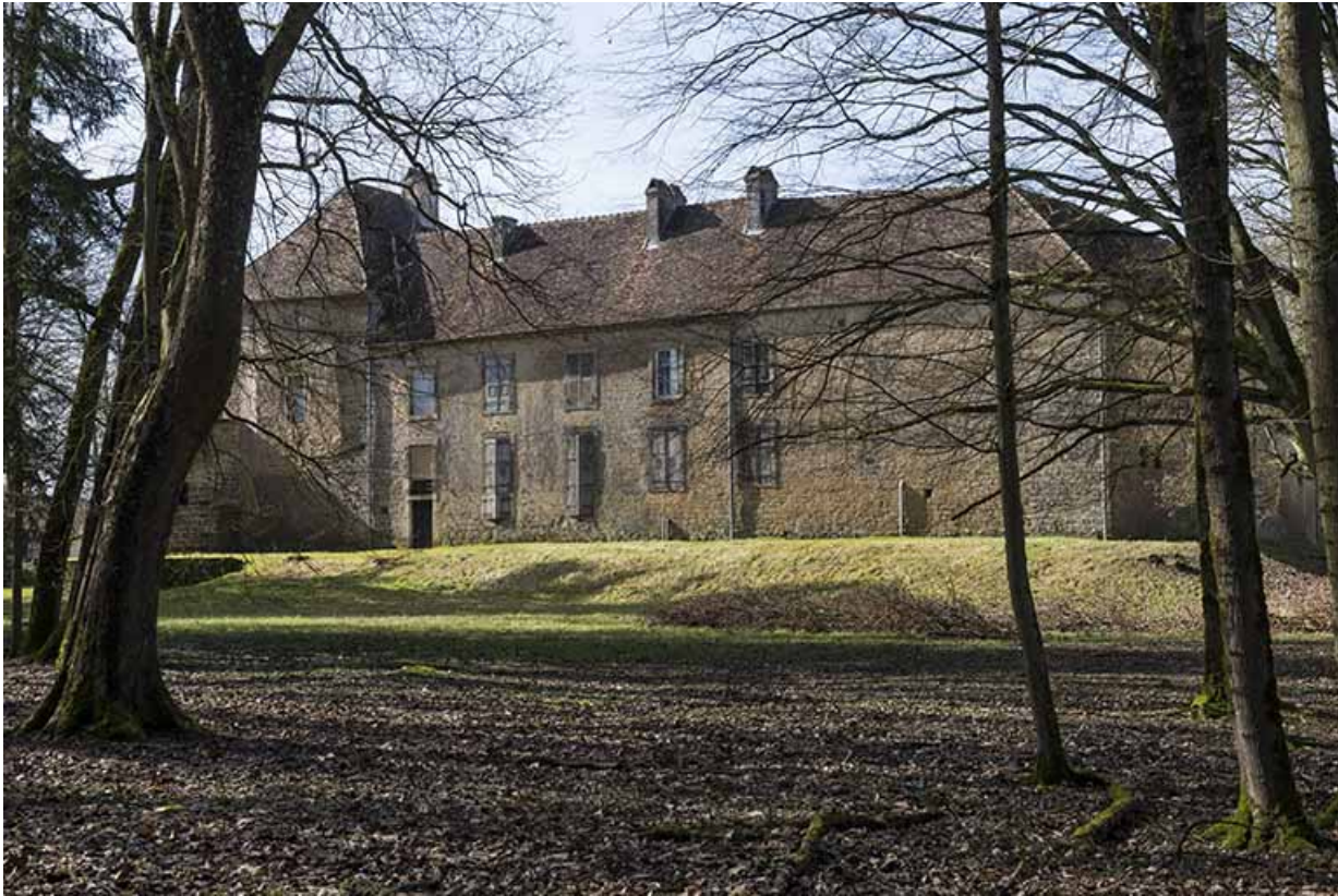
Façade Est du château.