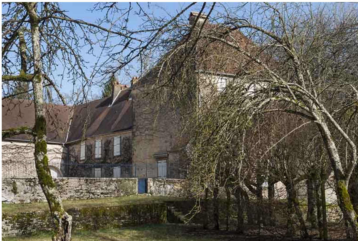
Partie donnant sur la cour intérieure de l'édifice.