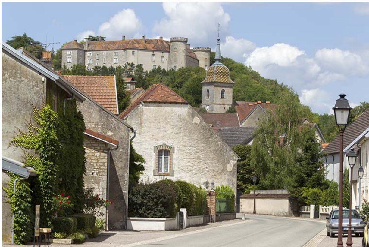
L'église paroissiale Saint-Pancrace, le château et vue partielle du village le long de la Grande Rue. 70, Ray-sur-Saône