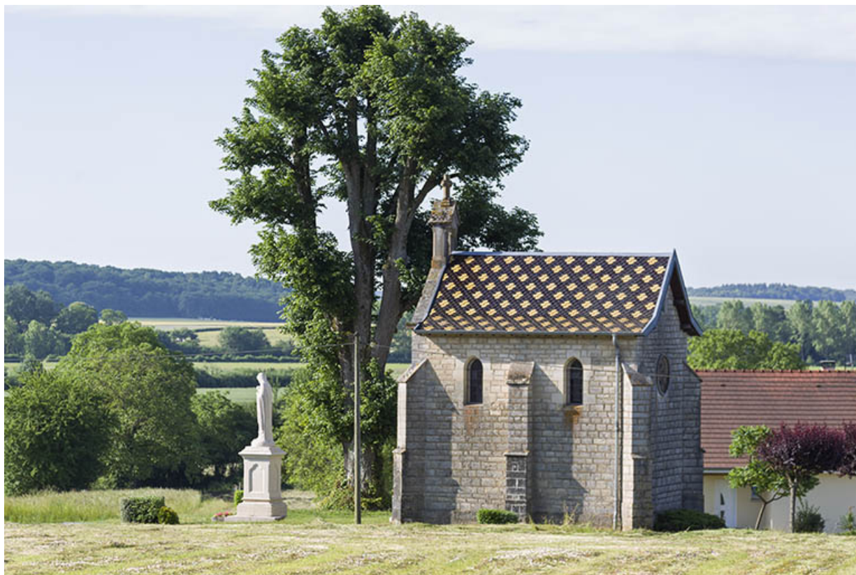
Vue générale de la chapelle Sainte-Anne et de la Vierge Libératrice de Ray.

70, Ray-sur-Saône rue Sainte-Anne, lieudit : Vignes Sainte-Anne