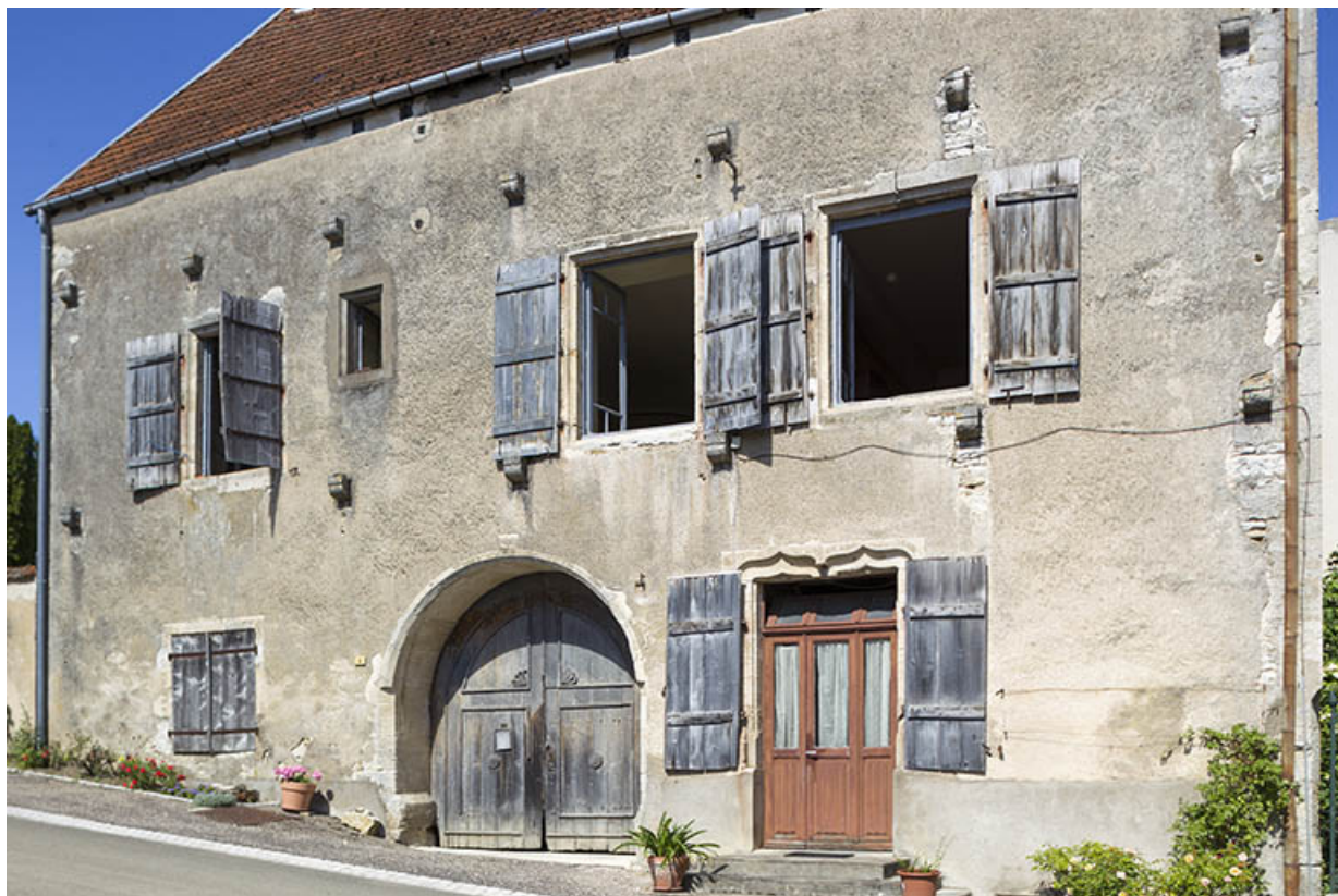
Demeure remarquable (dite du Chapitre), au 6 rue du Château, classée au titre des Monuments historiques. 70, Ray-sur-Saône, 6 rue du Château