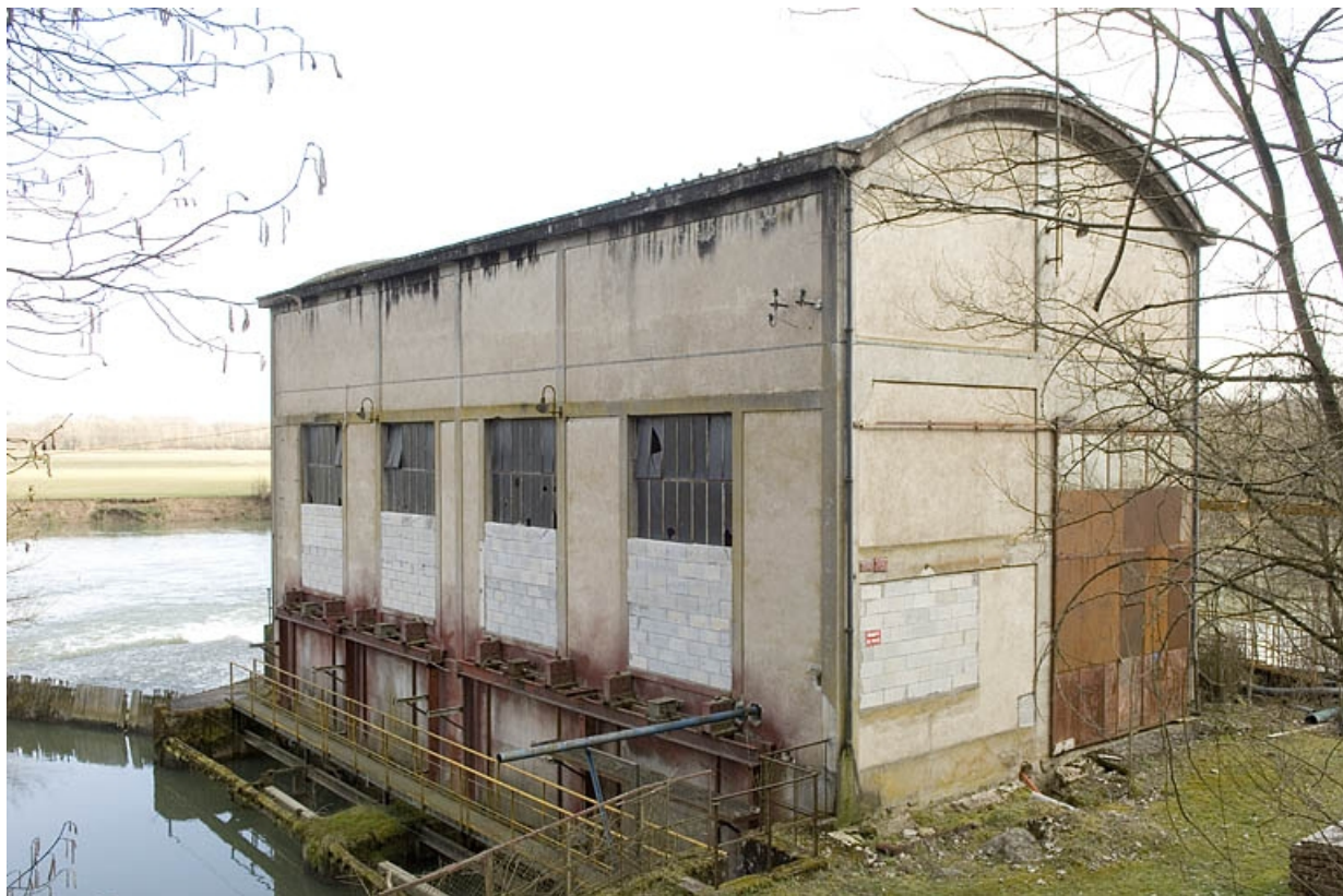
La centrale hydroélectrique vue depuis le nord. 70, Ray-sur-Saône rue du Moulin