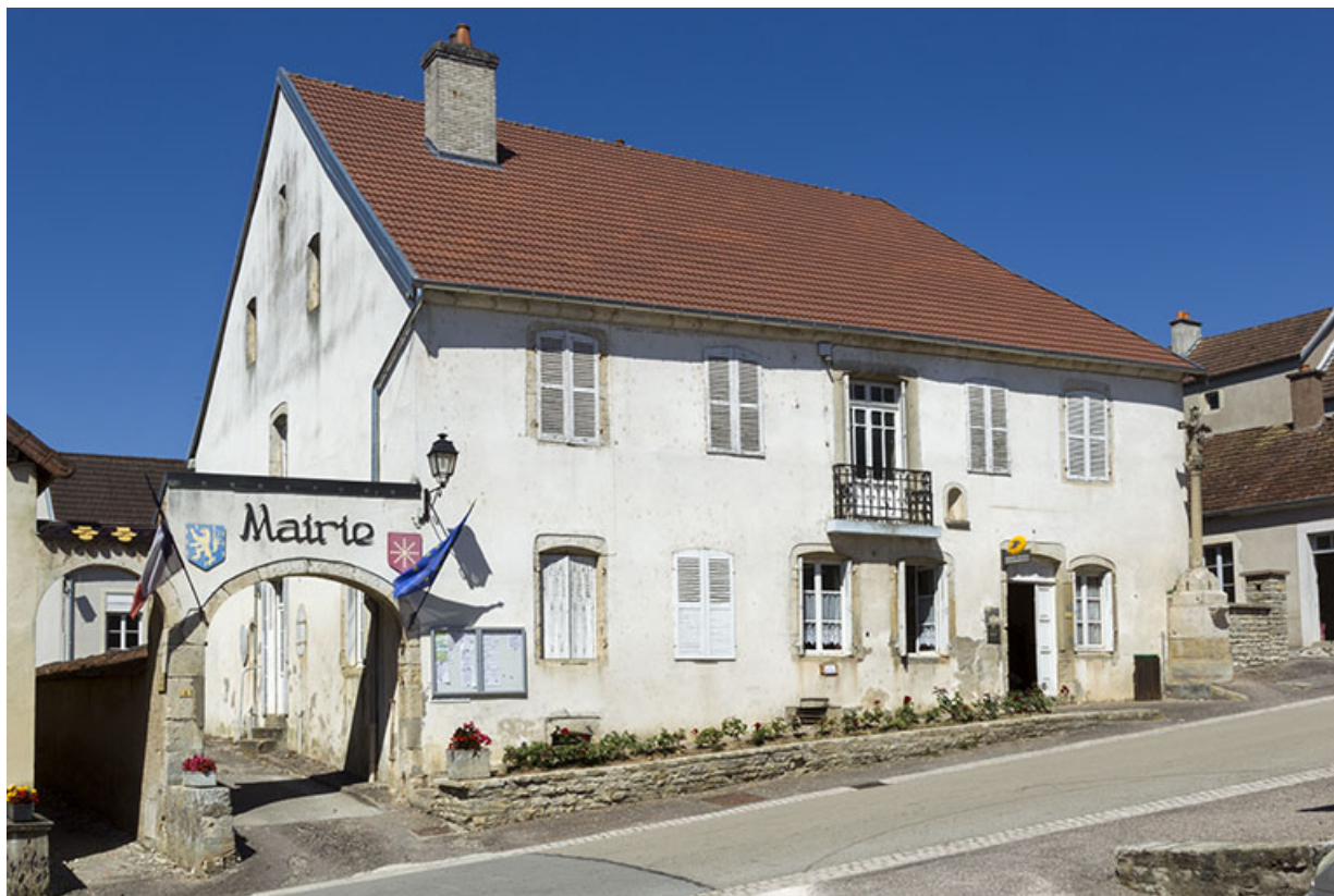
Façade antérieure, de trois quarts gauche.