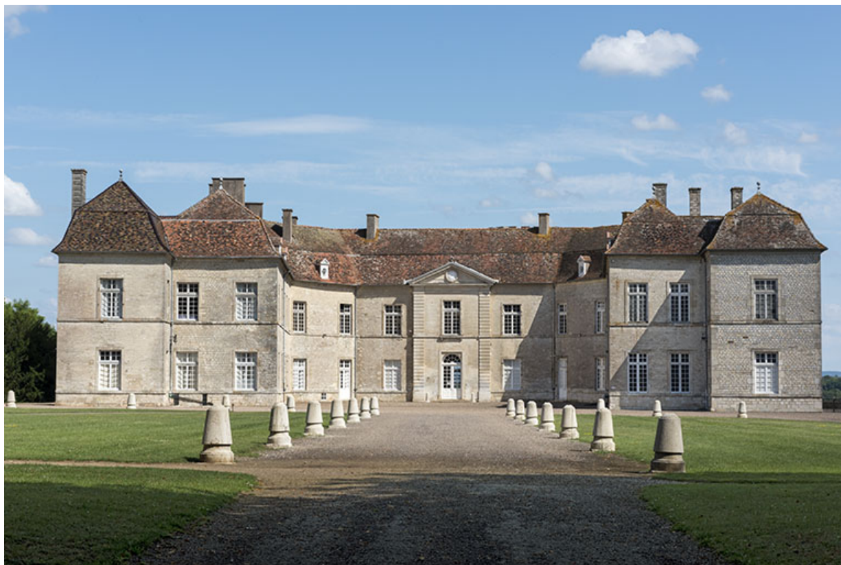
Vue générale sur la cour d'honneur (façade ouest). 70, Ray-sur-Saône