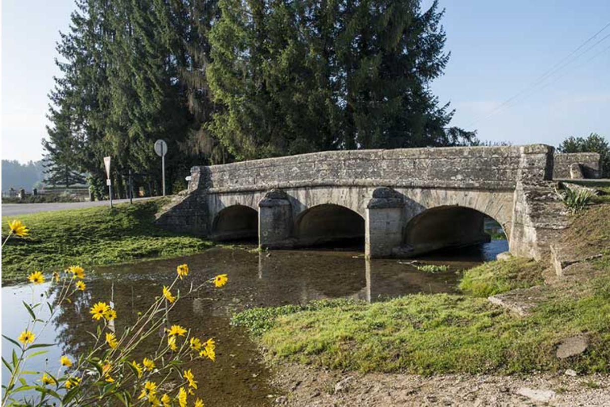
Vue depuis l'aval de la rivière.