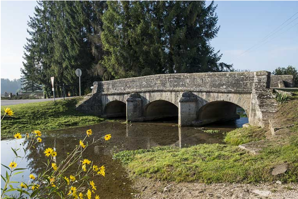
Vue depuis l'aval de la rivière.