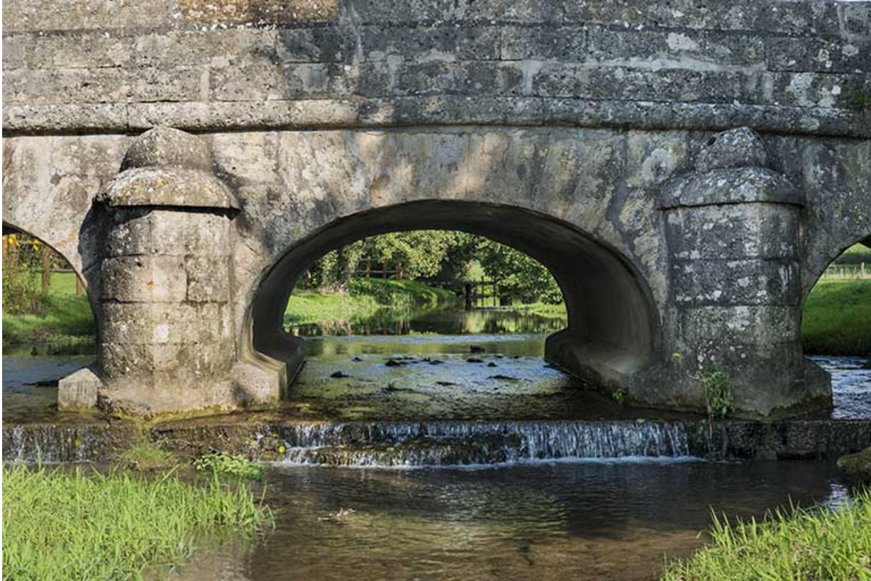
La voûte centrale.