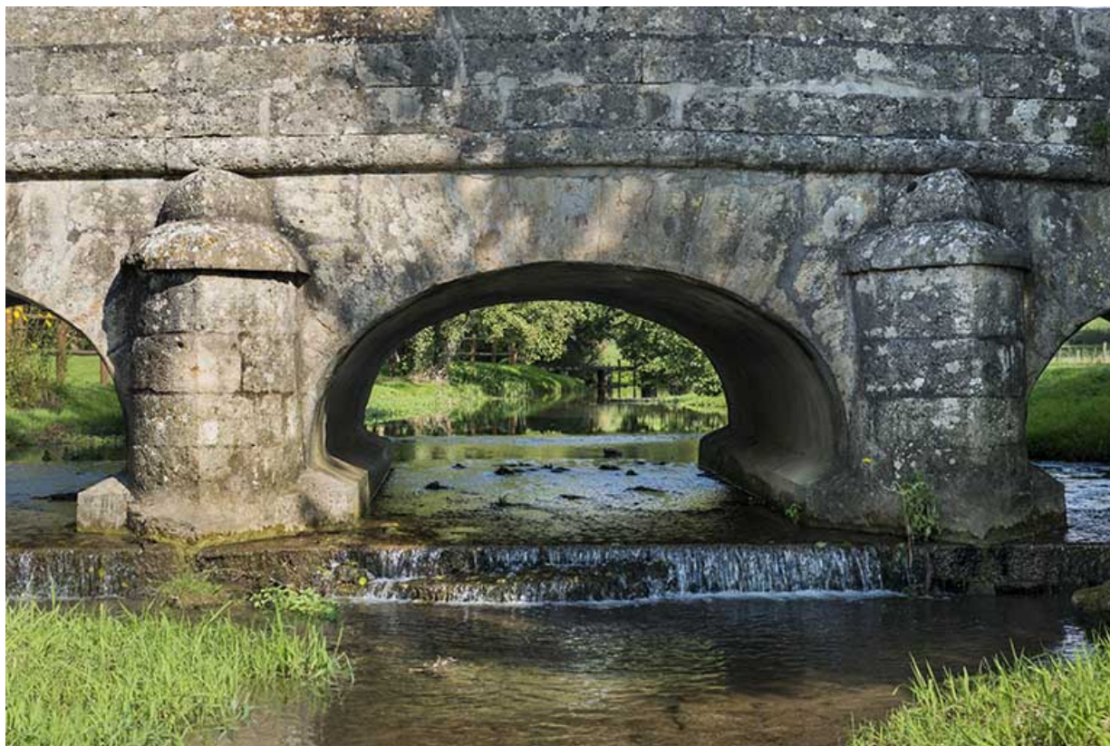
La voûte centrale.