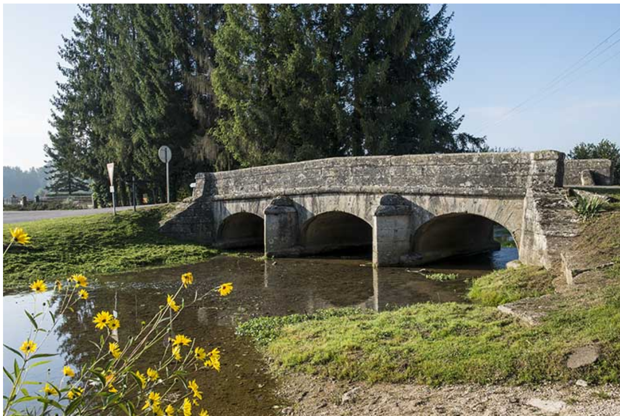
Vue depuis l'aval de la rivière.