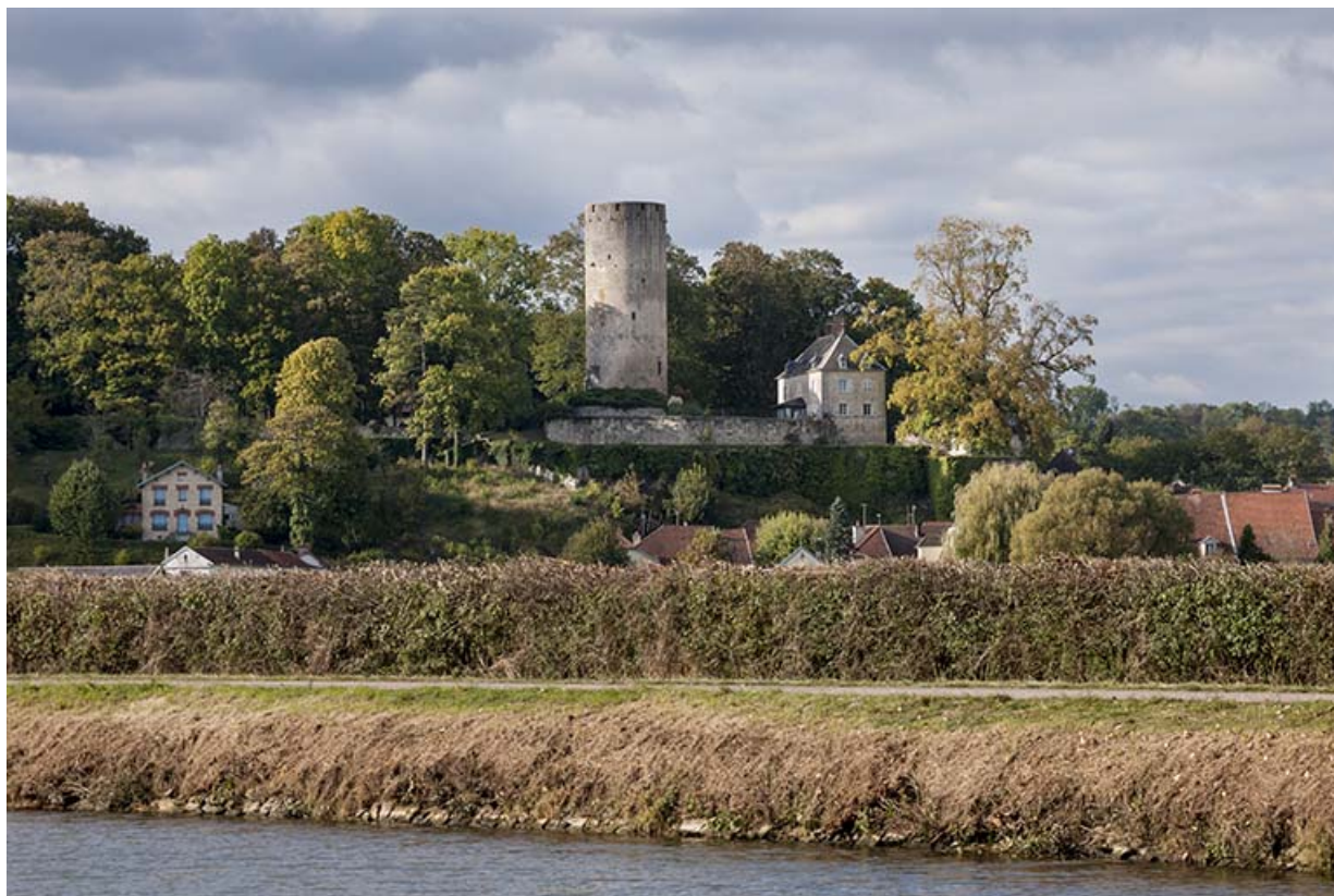
Le site du château, depuis la Saône.