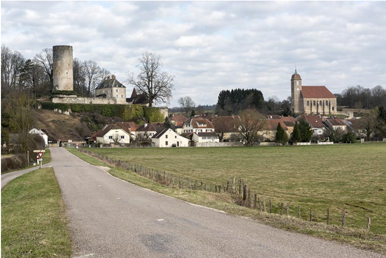
Vue générale du village, dominé par le château et l'église paroissiale. 70, Rupt-sur-Saône