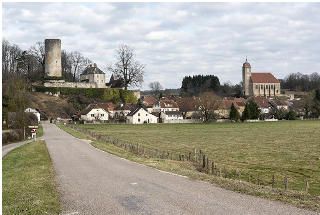
Vue générale du village, dominé par le château et l'église paroissiale. 70, Rupt-sur-Saône