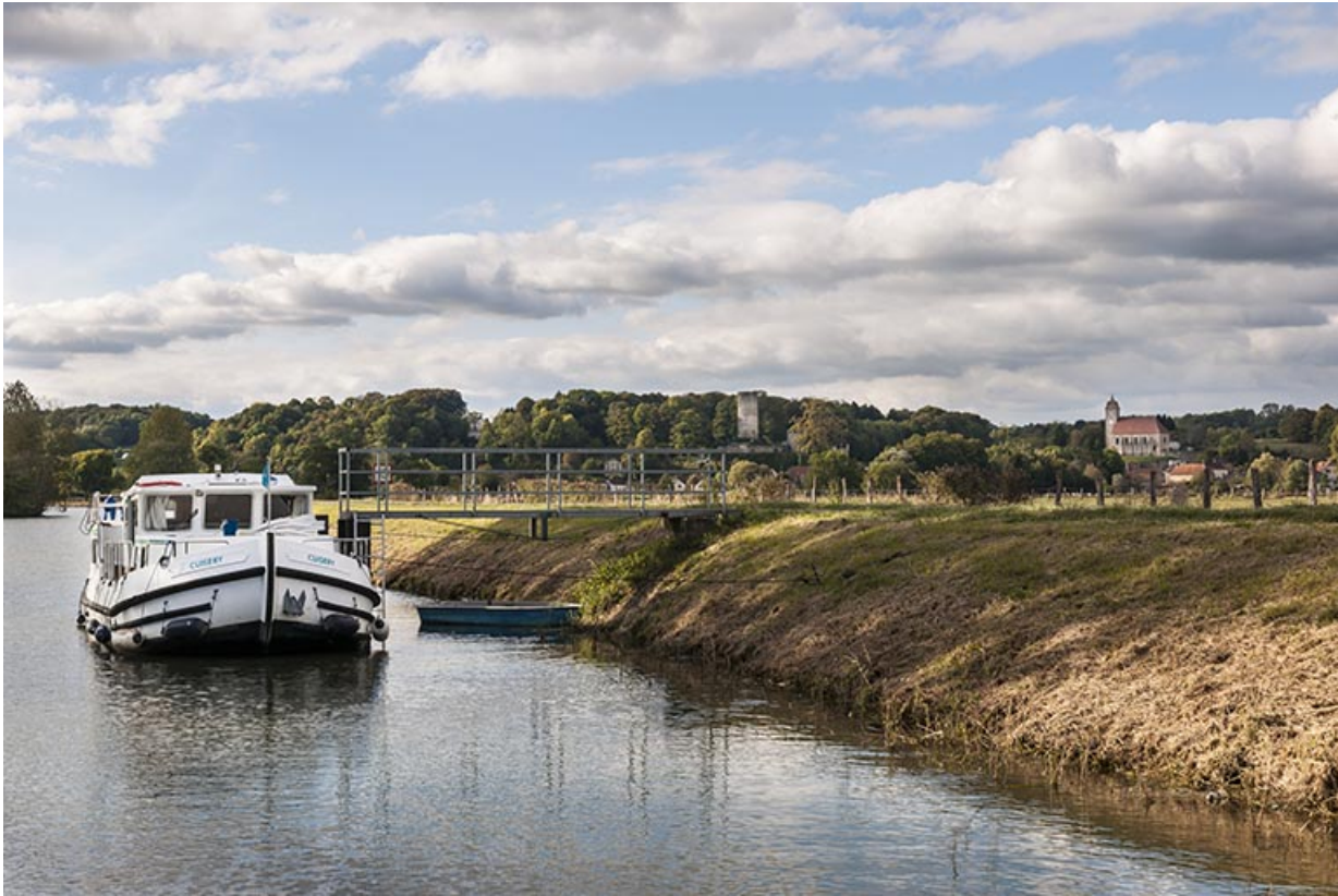
Ponton touristique sur la Saône.