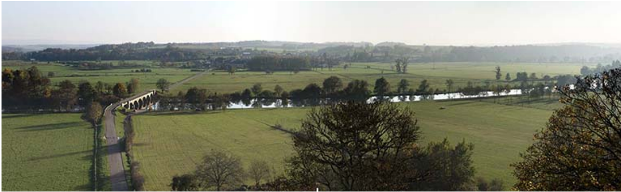
La Saône depuis le château.