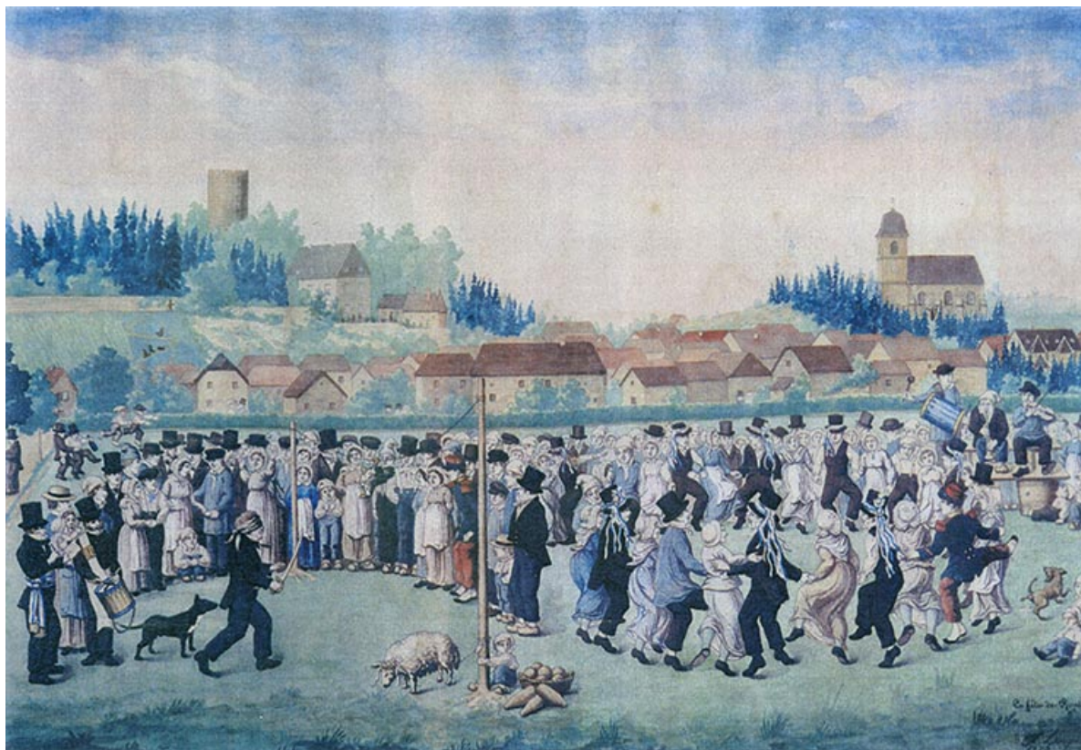
La fête de Rupt [vue générale depuis le sud], 1860. 70, Rupt-sur-Saône