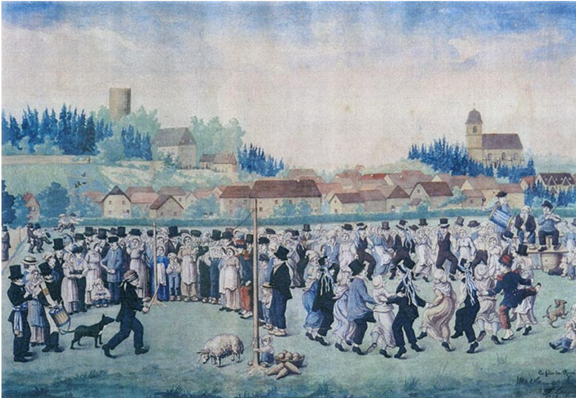
La fête de Rupt [vue générale depuis le sud], 1860. 70, Rupt-sur-Saône