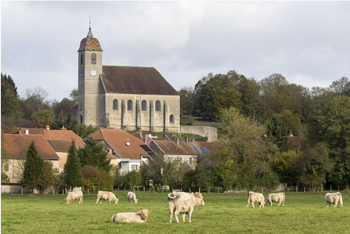
Vue générale en direction du Breuil.