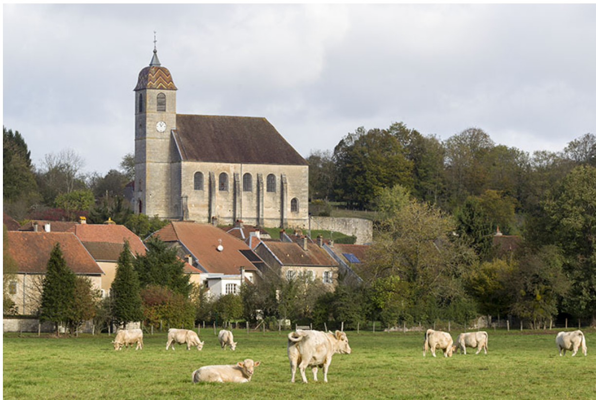
Vue générale en direction du Breuil. 70, Rupt-sur-Saône