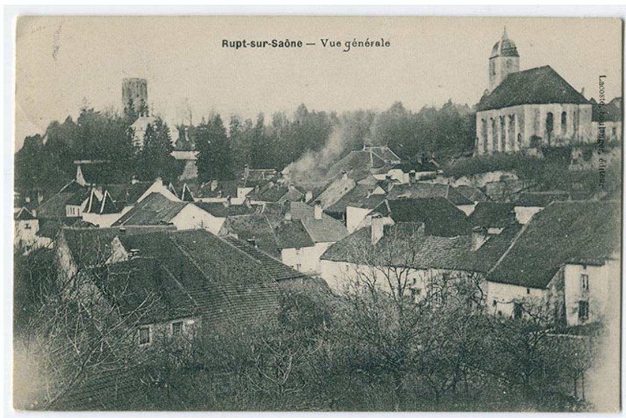
Rupt-sur-Saône - Vue générale, 1er quart 20e siècle. 70, Rupt-sur-Saône

Rupt-sur-Saône - Vue générale, carte postale, s.n., s.d. [1er quart 20e siècle], Lacoste boulanger éd. Lieu de conservation : Archives départementales de la Haute-Saône, Vesoul - Cote du document : 11 Fi 457/8