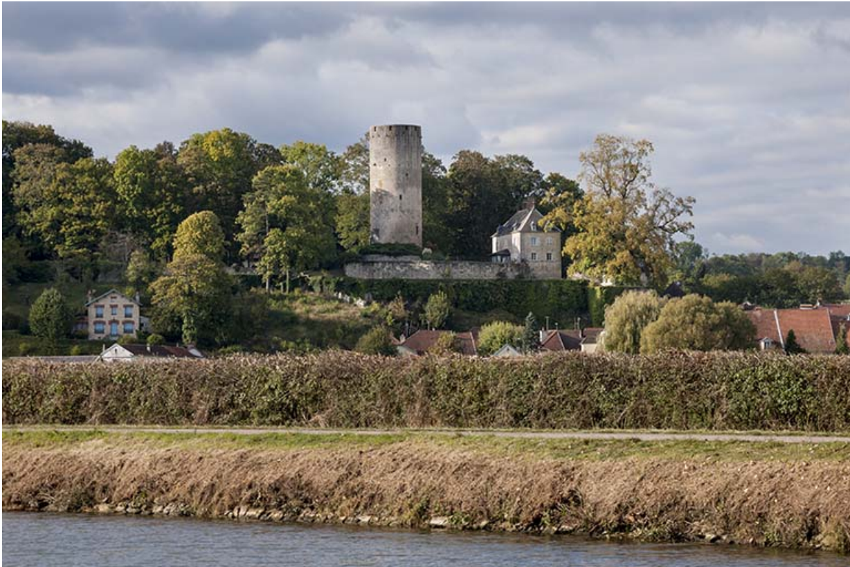
Le site du château, depuis la Saône.