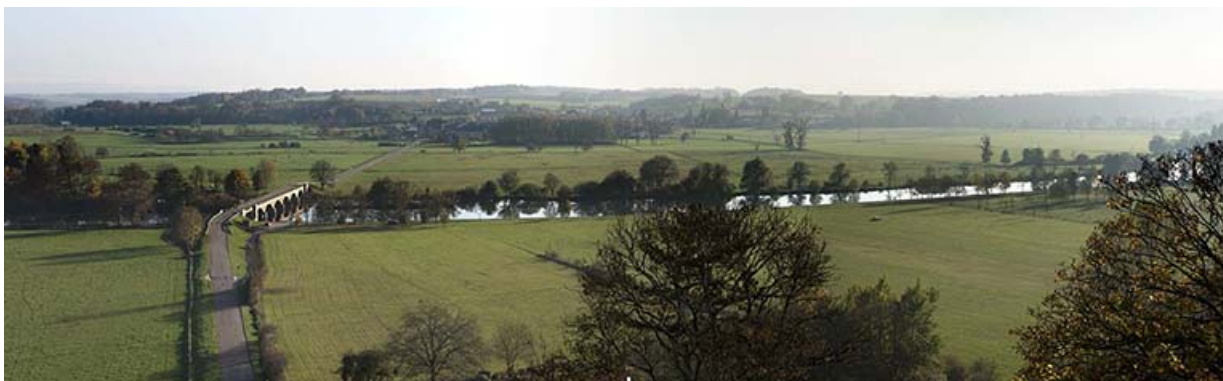
La Saône depuis le château.