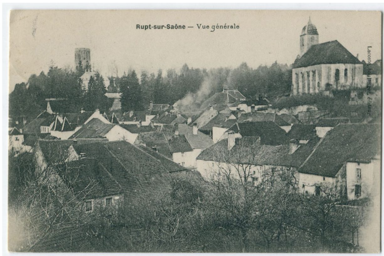
Rupt-sur-Saône - Vue générale, 1er quart 20e siècle. 70, Rupt-sur-Saône