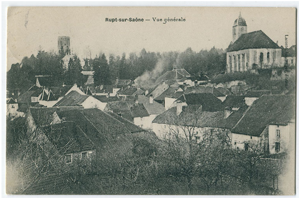
Rupt-sur-Saône - Vue générale, 1er quart 20e siècle. 70, Rupt-sur-Saône