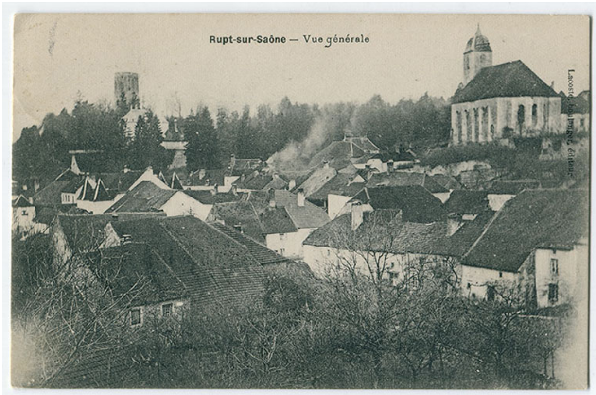
Rupt-sur-Saône - Vue générale, 1er quart 20e siècle. 70, Rupt-sur-Saône