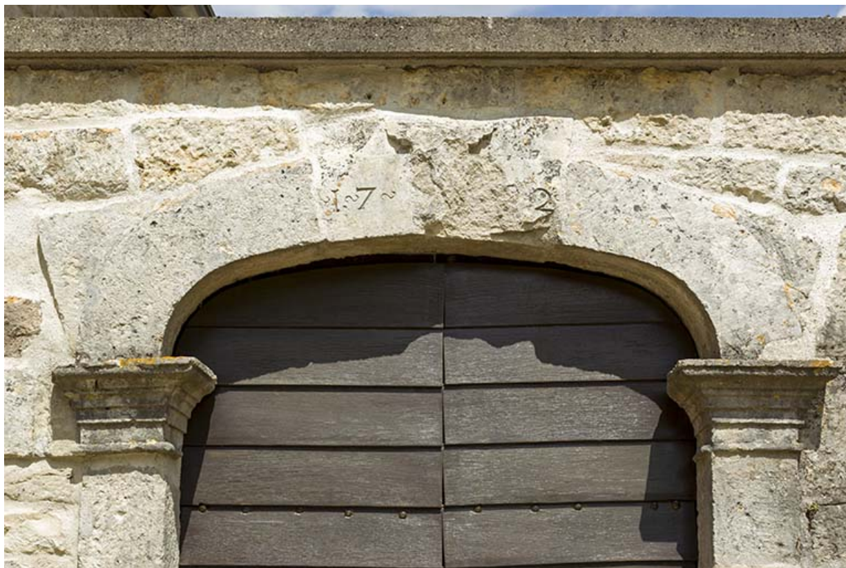
Détail : la date gravée sur le linteau du portail. 70, Rupt-sur-Saône