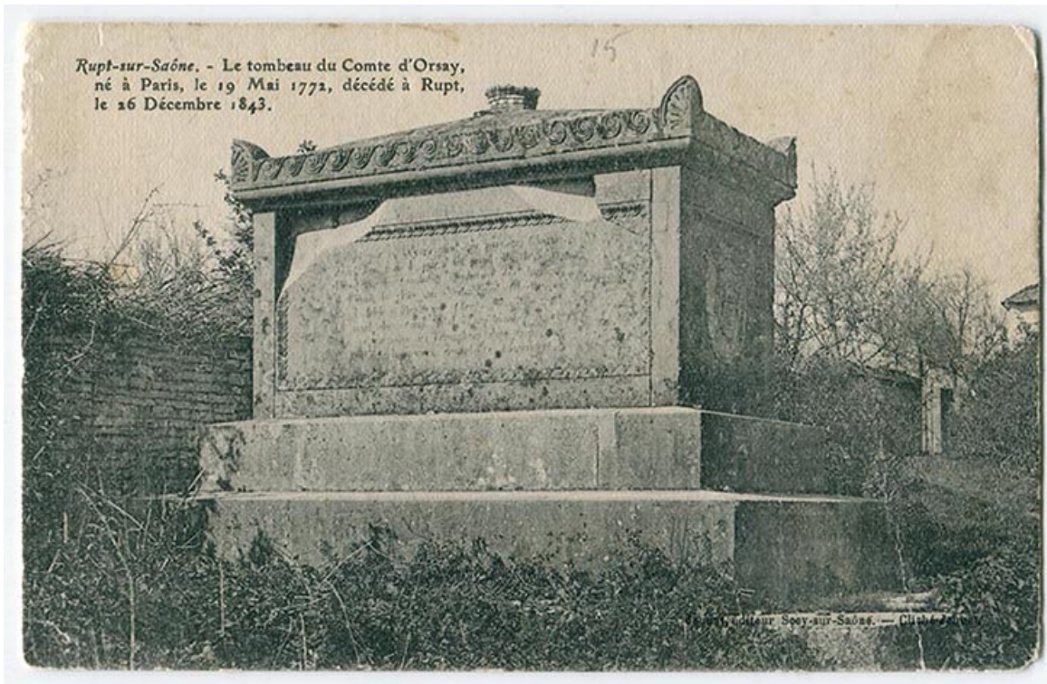
Rupt-sur-Saône. - Le tombeau du comte d'Orsay [...], fin 19e siècle ou 1ère moitié 20e siècle. 70, Rupt-sur-Saône