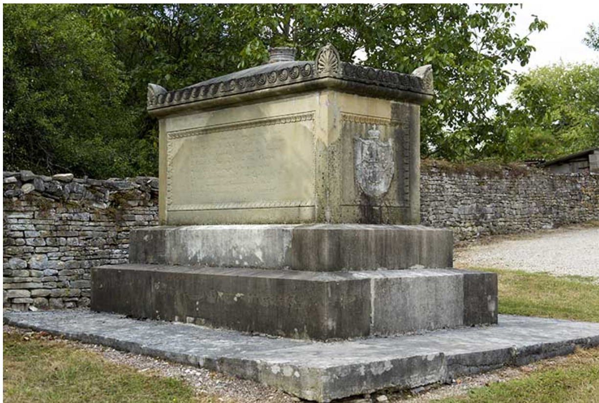
Vue générale de trois quart gauche (faces sud et ouest). 70, Rupt-sur-Saône