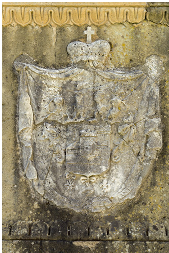
Les armoiries du comte Grimod d'Orsay. 70, Rupt-sur-Saône