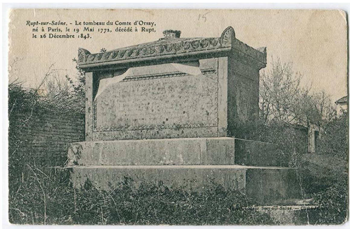
Rupt-sur-Saône. - Le tombeau du comte d'Orsay [...], fin 19e siècle ou 1ère moitié 20e siècle. 70, Rupt-sur-Saône