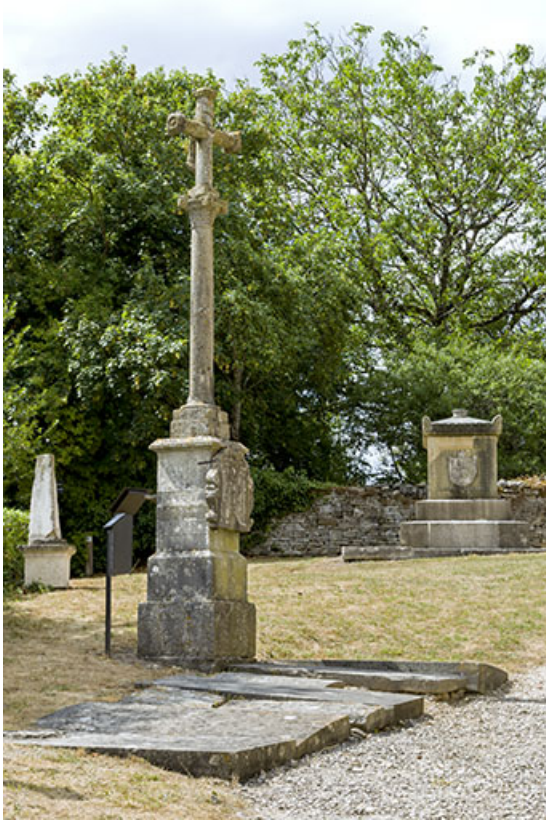
La croix, avec le tombeau du comte d'Orsay à l'arrière-plan, près de l'église. 70, Rupt-sur-Saône