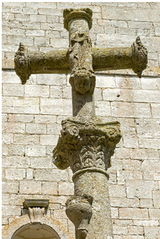
Statuette de la Vierge.