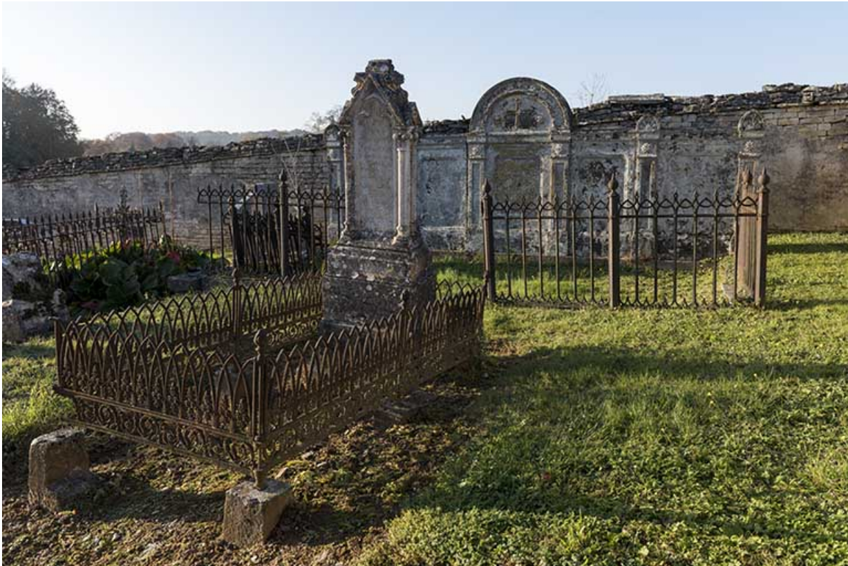
Vue partielle du cimetière.