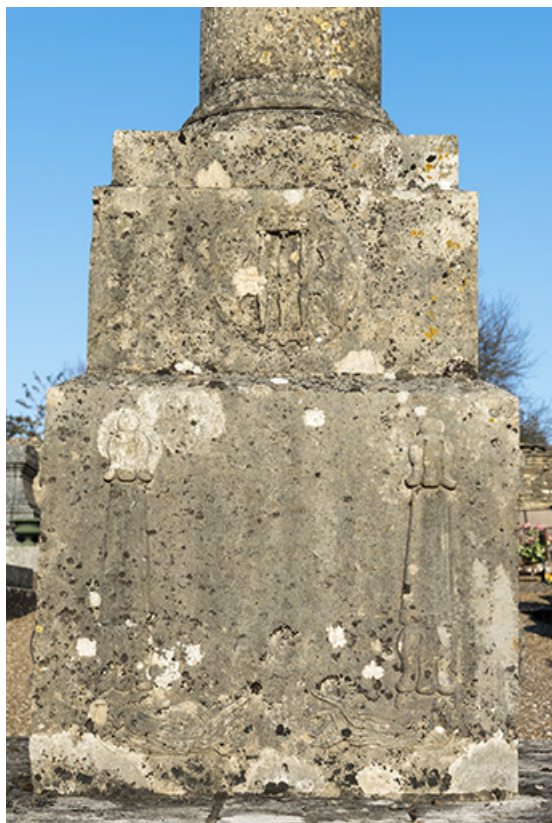
Détail de la croix du nouveau cimetière : décor du piédestal (torche renversée). 70, Rupt-sur-Saône