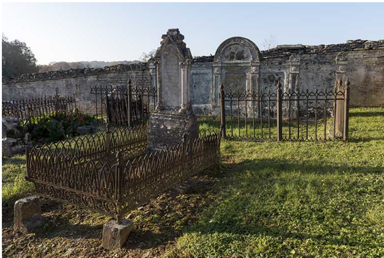
Vue partielle du cimetière.