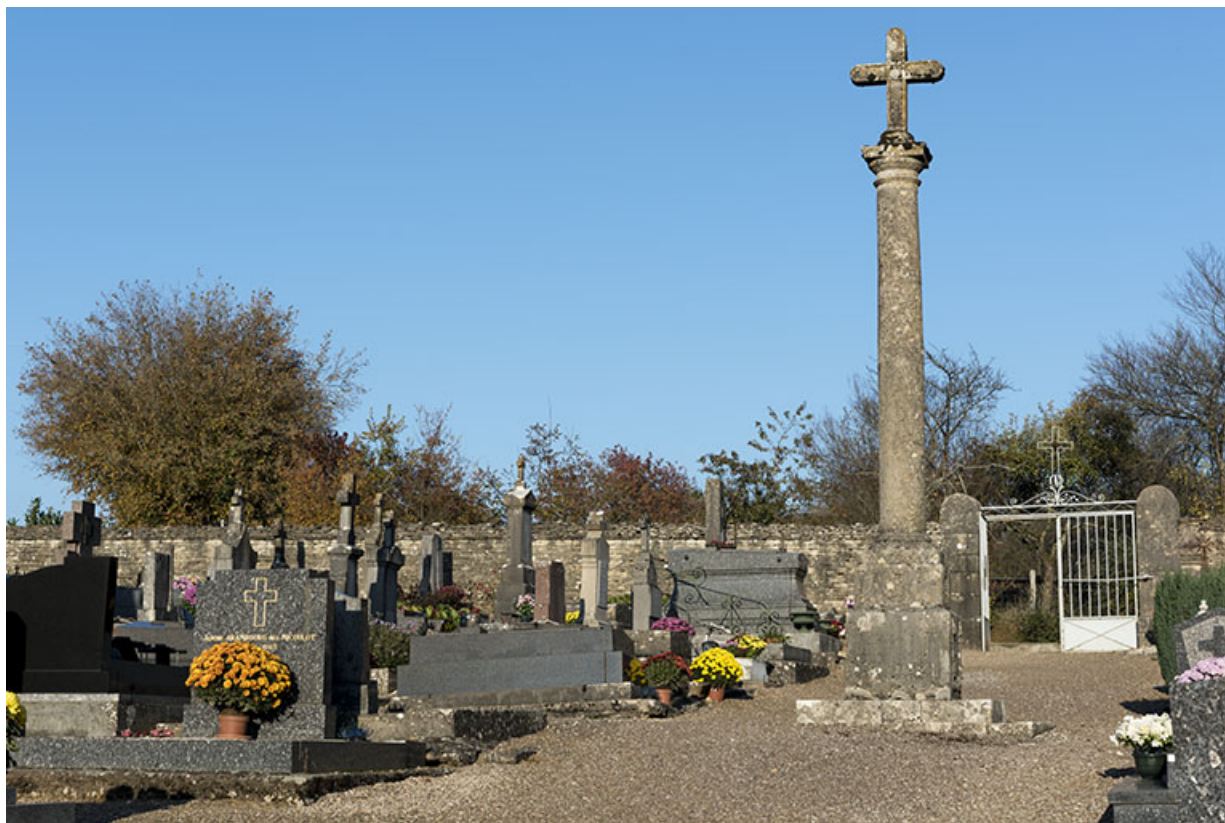
Vue générale de la croix du nouveau cimetière. 70, Rupt-sur-Saône