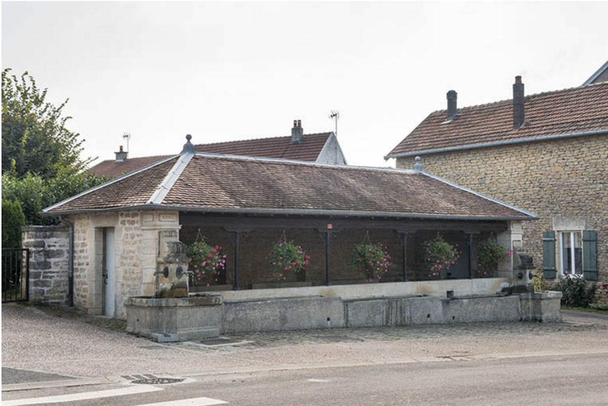
La fontaine-lavoir, Grande rue.