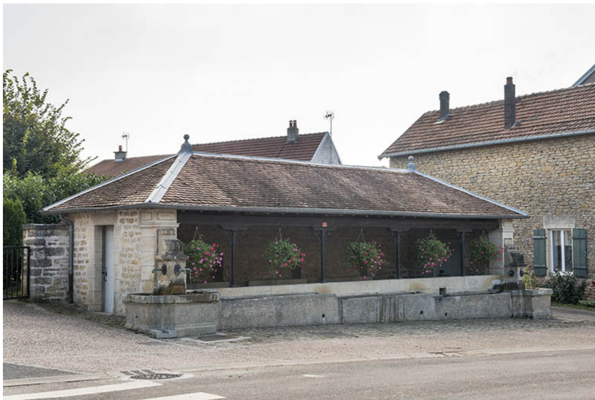
La fontaine-lavoir, Grande rue.