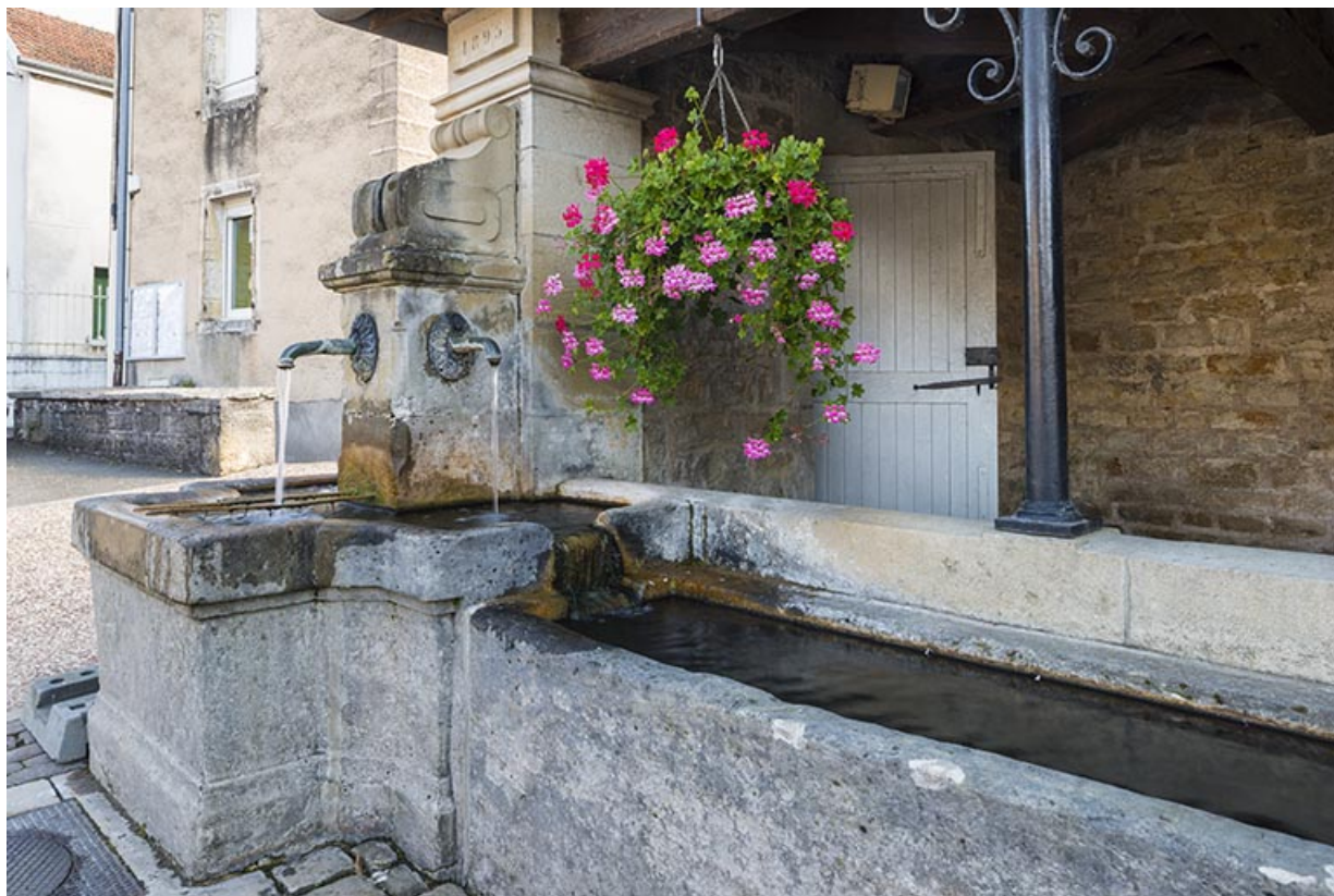
Une des fontaines et, en arrière-plan, la porte d'accès.