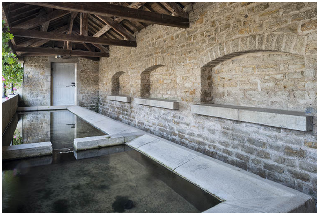
Le lavoir avec ses deux bassins.