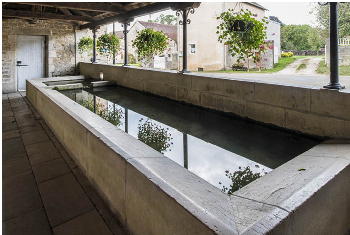
Le bassin à usage de lavoir.