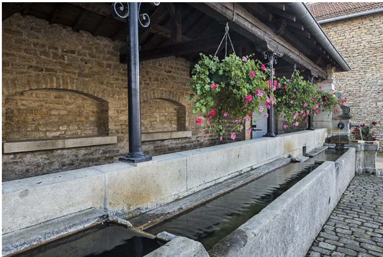
Les abreuvoirs et la colonne métallique.