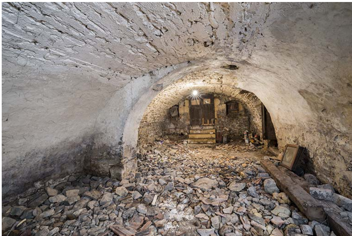
La plus grande cave de la maison, vue en direction de l'entrée de cave et des deux soupiraux donnant sur le jardin 70, Baulay, 32-34 Grande Rue