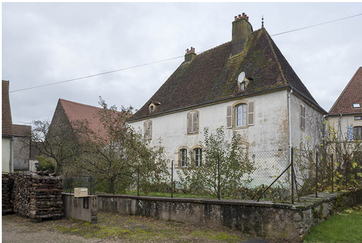
Façade arrière de la demeure, orientée à l'Est 70, Baulay, 32-34 Grande Rue