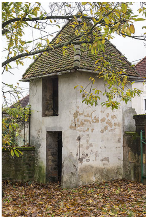
Le pigeonnier dépendant de la demeure