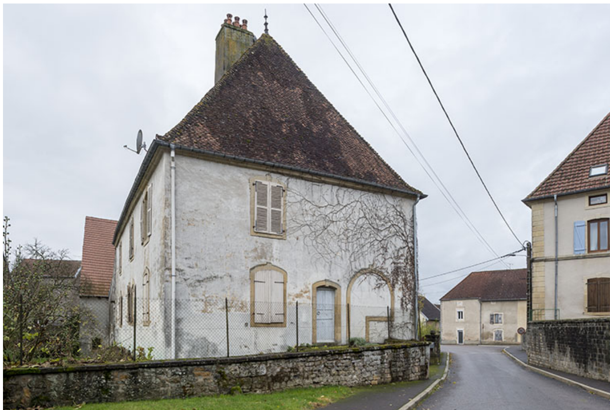
Vue de la demeure depuis le haut de la Grande rue. A droite, la mairie. 70, Baulay, 32-34 Grande Rue