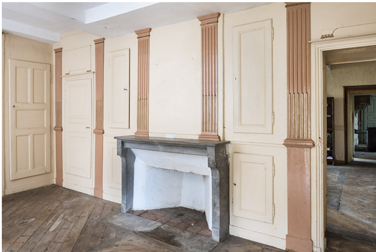
Couloir laissant deviner une enfilade de trois pièces. Système de placards internes 70, Baulay, 32-34 Grande Rue