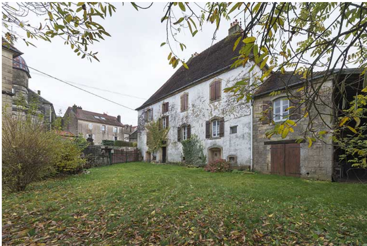
Vue de la demeure depuis le pigeonnier. Le presbytère est en face, de l'autre côté de la Grande rue.