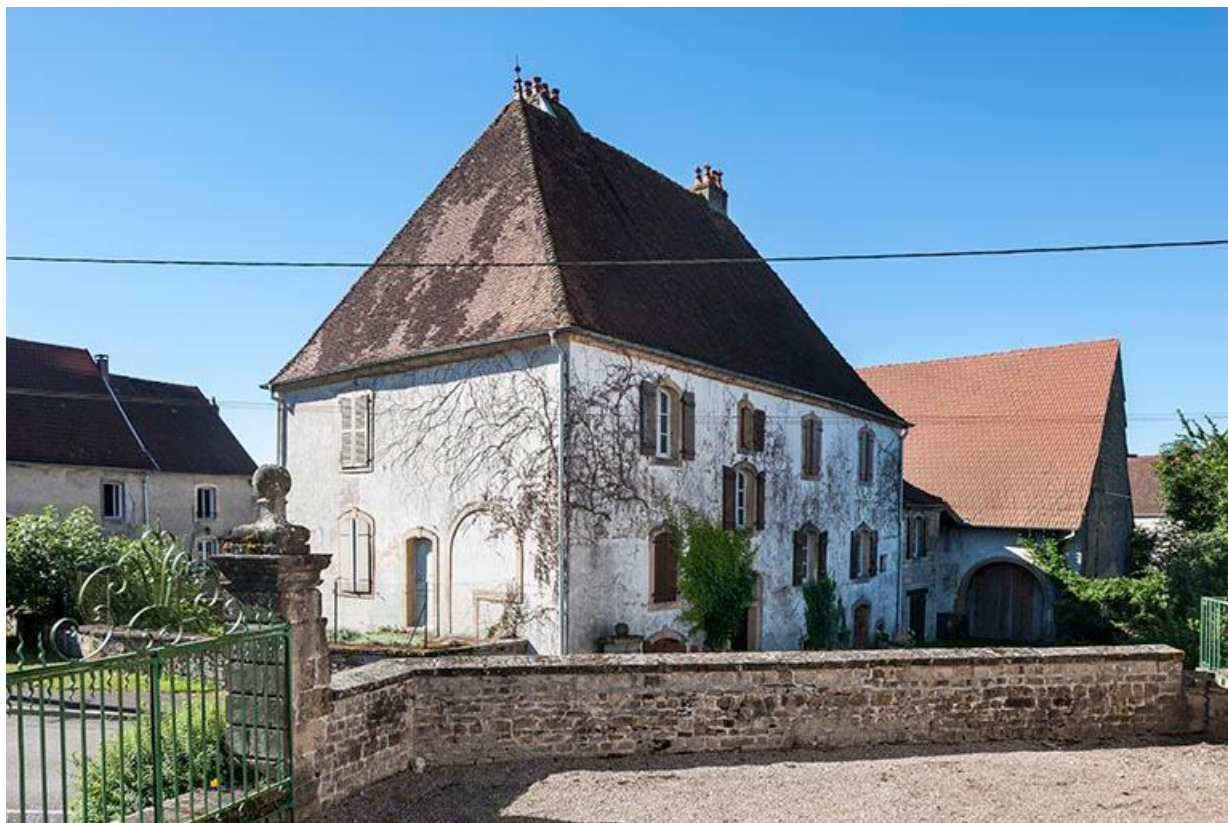
Vue de la demeure depuis l'avant-cour de la mairie.