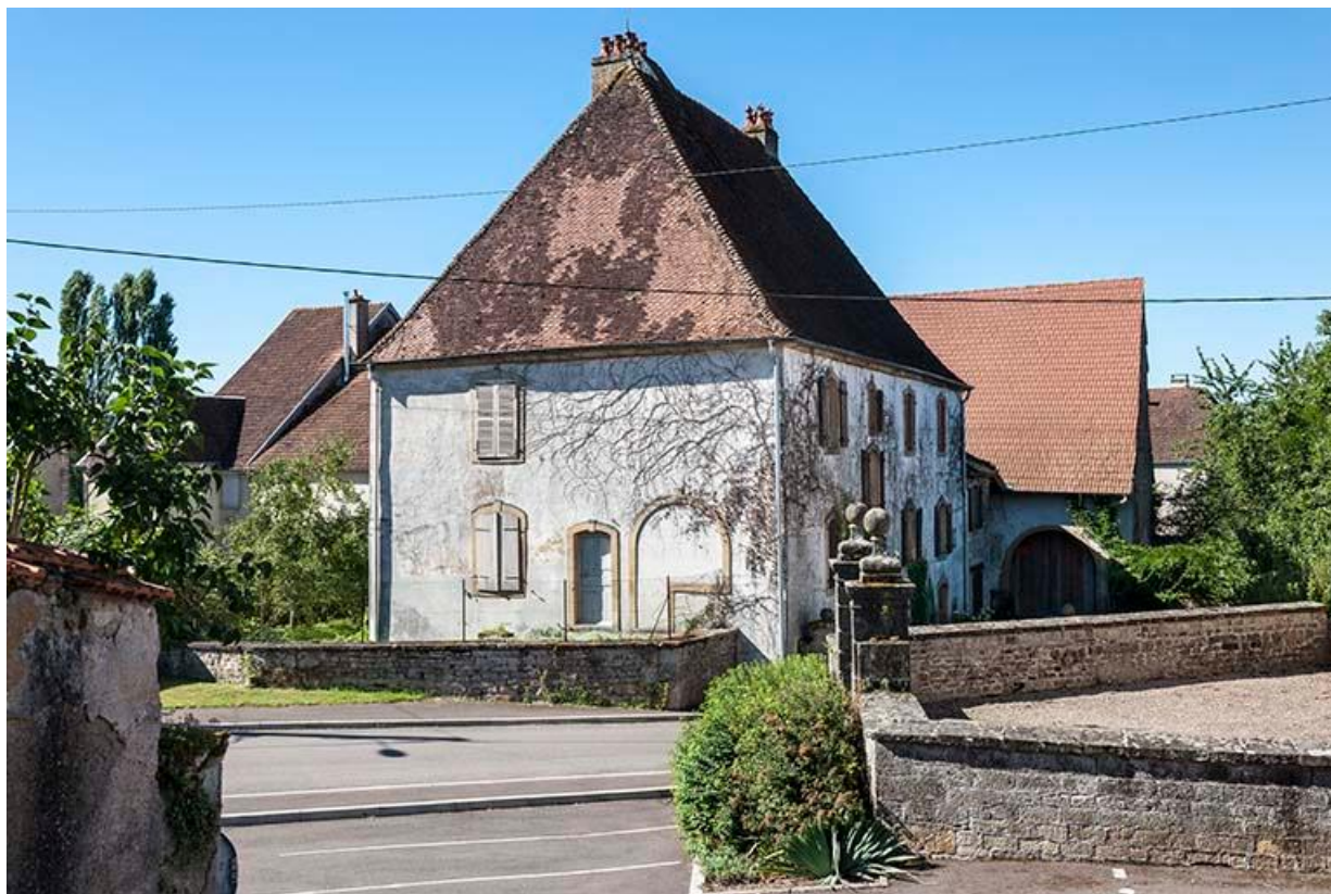
Vue de la demeure depuis la rue de l'Eglise.