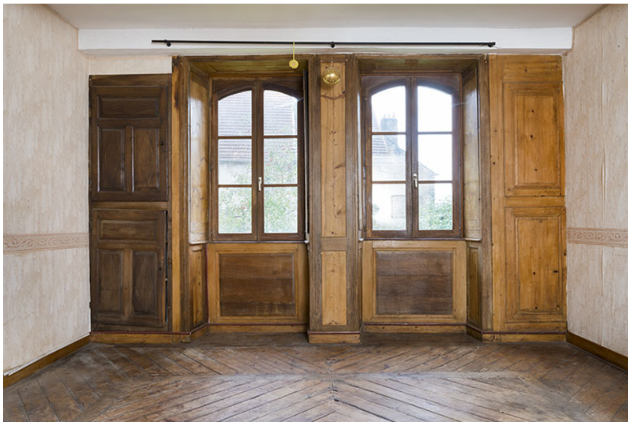
Détail des fenêtres ayant conservé leurs boiseries: plintes, encadrements, retours de fenêtres, volets intérieurs et placards 70, Baulay, 32-34 Grande Rue