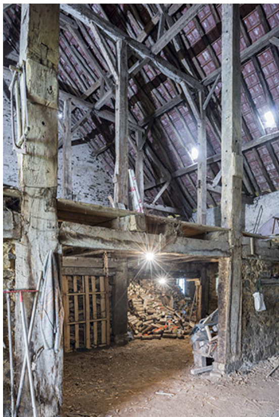
Détail des fermes de la charpente de la grange 70, Baulay, 32-34 Grande Rue