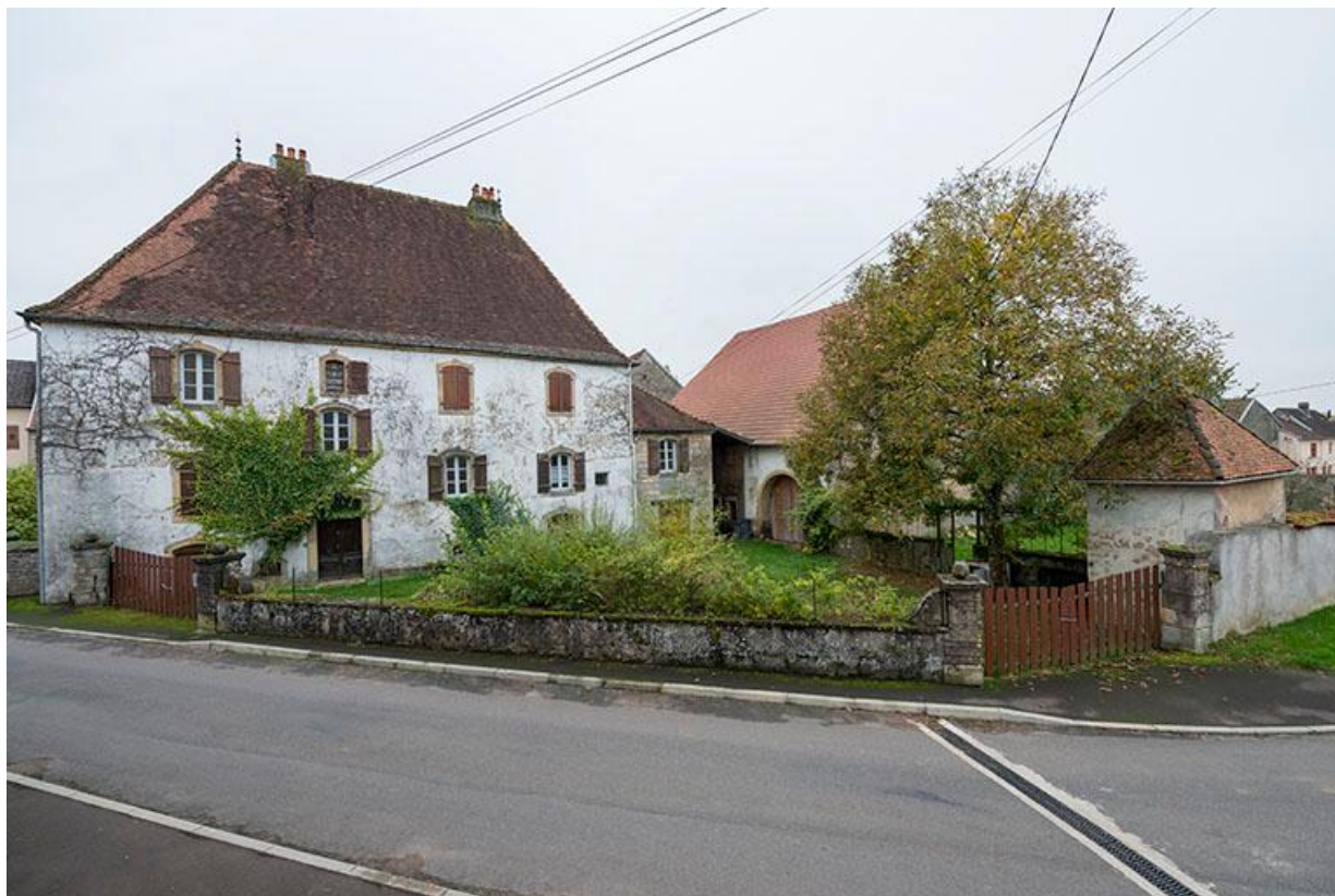
L'ensemble de la propriété, maison, grange, pigeonnier et mur de clôture, depuis la mairie. 70, Baulay, 32-34 Grande Rue