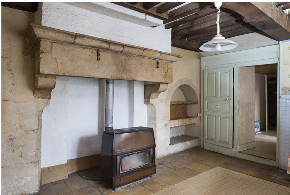
Cuisine avec plafond à la française, cheminée et potager