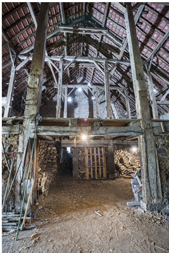
Grange, réserve de bois, grenier et écurie. Système de circulation circulaire autour du bûcher central 70, Baulay, 32-34 Grande Rue