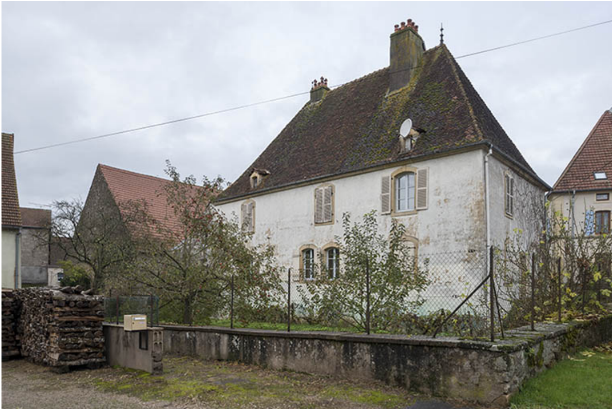
Façade arrière de la demeure, orientée à l'Est 70, Baulay, 32-34 Grande Rue