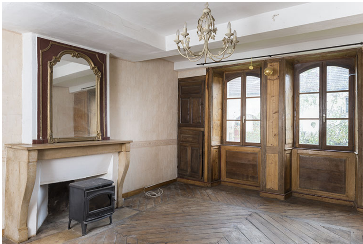
Boiseries encore en place dans un salon, encadrements de fenêtres, volets intérieurs et placards