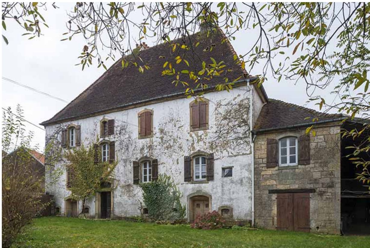
Vue de la demeure depuis le jardin de la propriété.