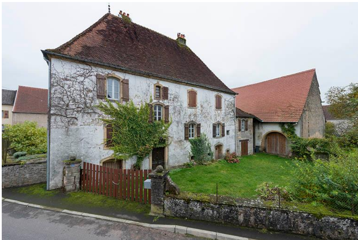
Vue de la demeure et de sa grange en retour d'équerre.