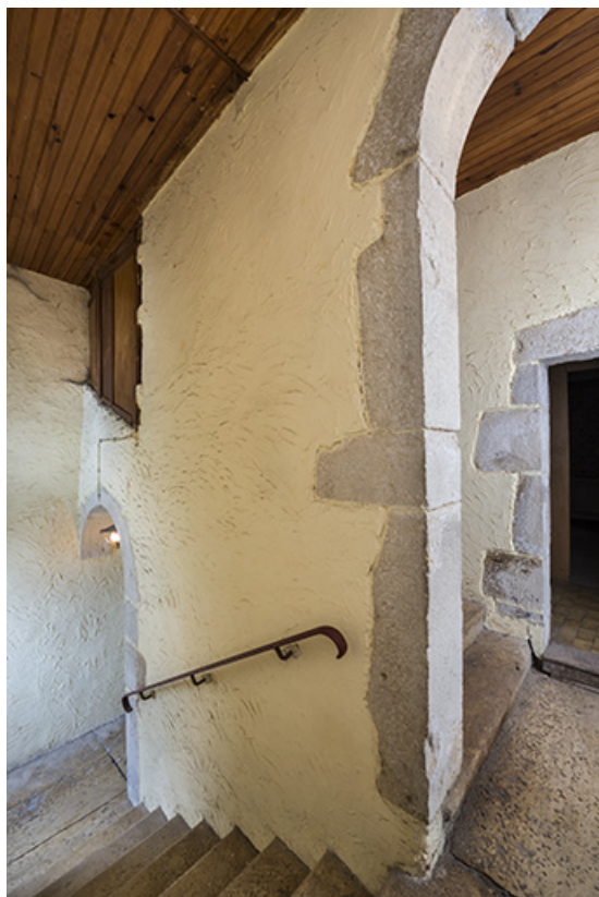
Escalier desservant le premier étage, le deuxième étage et le grenier 70, Baulay, 32-34 Grande Rue