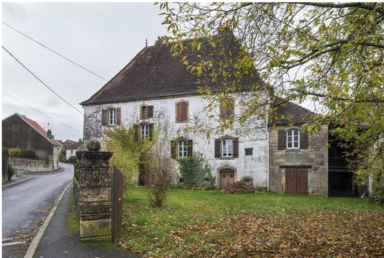
La demeure vue depuis le portail d'entrée