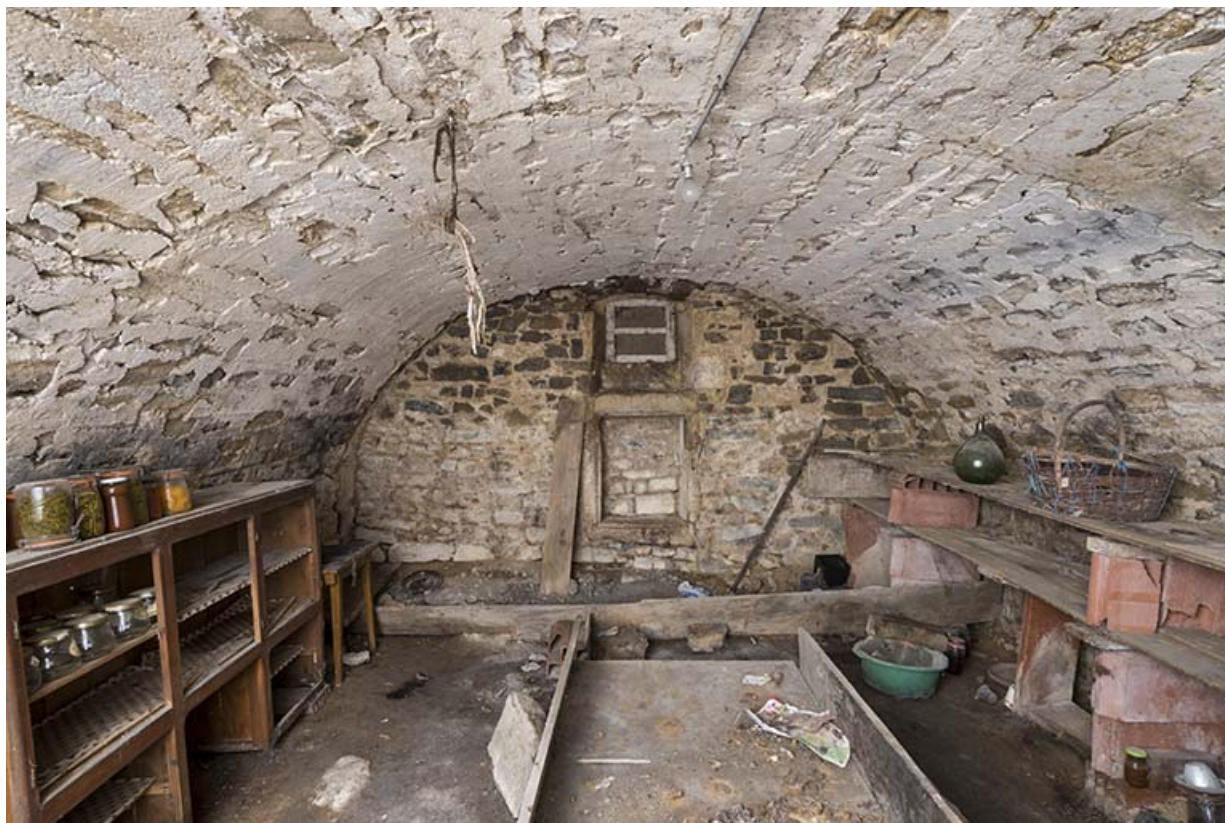
Vue de la cave médiane, dont l'entrée en façade est orientée à l'Est 70, Baulay, 32-34 Grande Rue