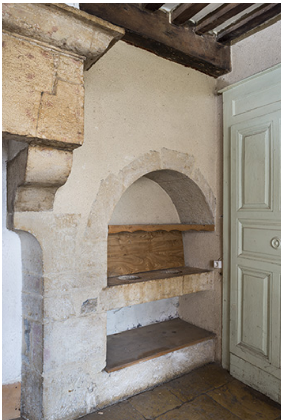
Potager, dans la cuisine de la demeure