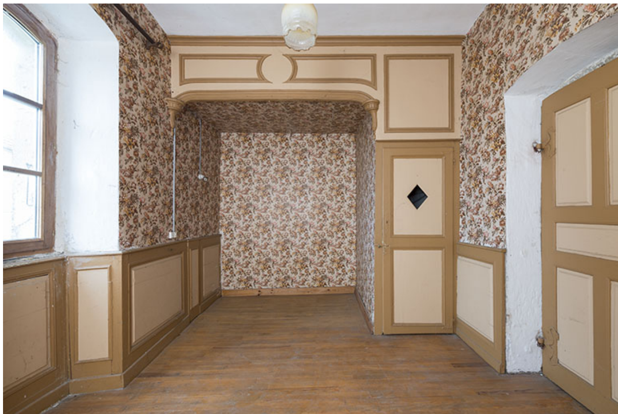
Chambre au premier étage, avec alcôve et ancien cabinet de toilette 70, Baulay, 32-34 Grande Rue