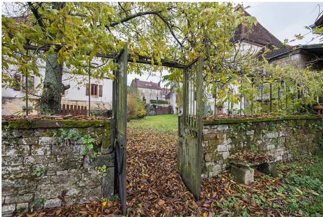
Le mur de clôture qui sépare le jardin d'agrément du jardin potager. 70, Baulay