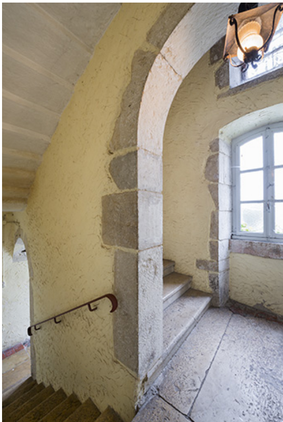
Escalier, palier entre le premier et le deuxième étage 70, Baulay, 32-34 Grande Rue