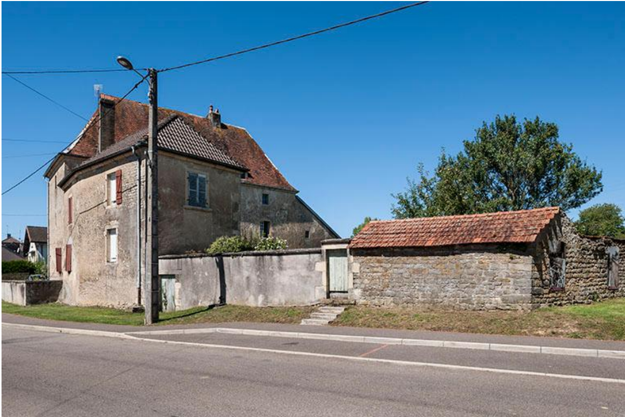
Ferme avec plan en L, 13 Grande rue. 70, Baulay