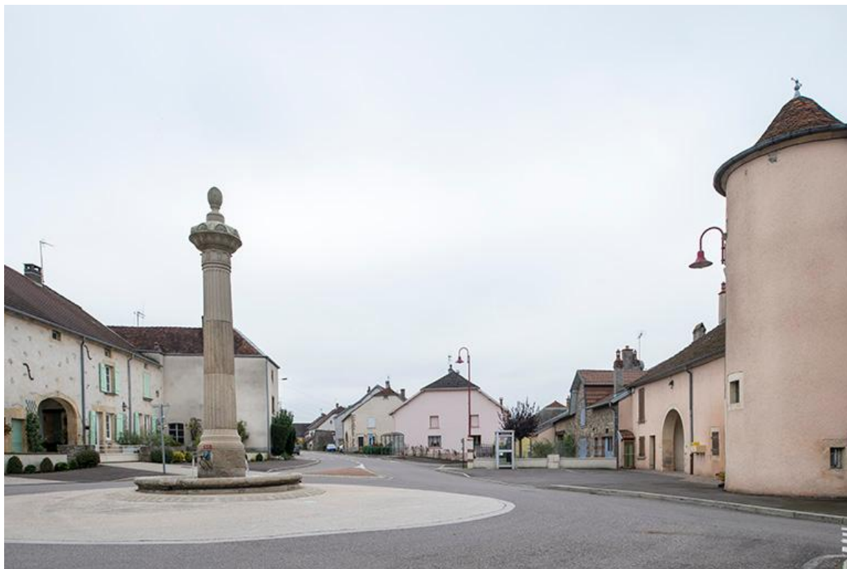
Place de la Résistance, maisons et fermes le long de la rue Grande. 70, Baulay