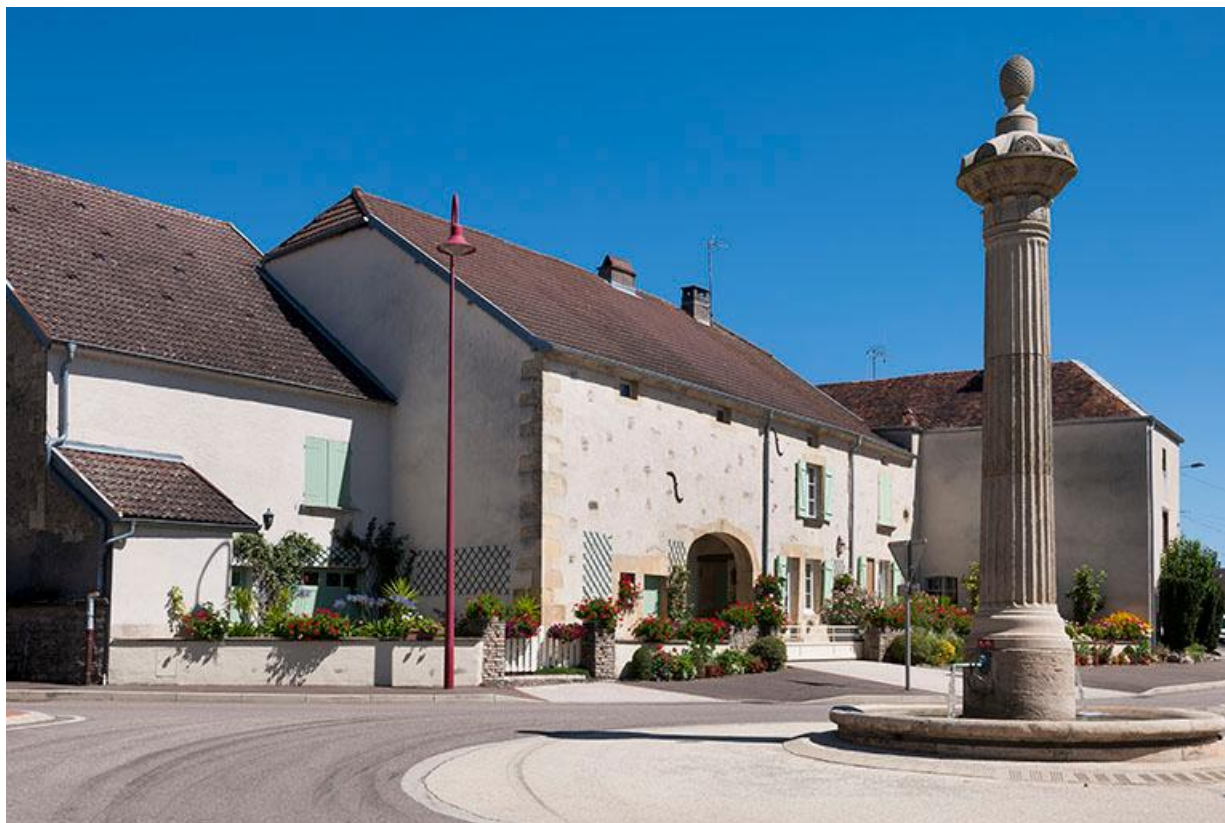
Place de la Résistance, fontaine-colonne et alignement de fermes dans la Grande rue. 70, Baulay