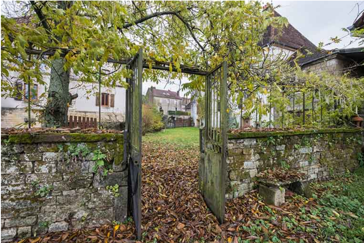
Le mur de clôture qui sépare le jardin d'agrément du jardin potager. 70, Baulay