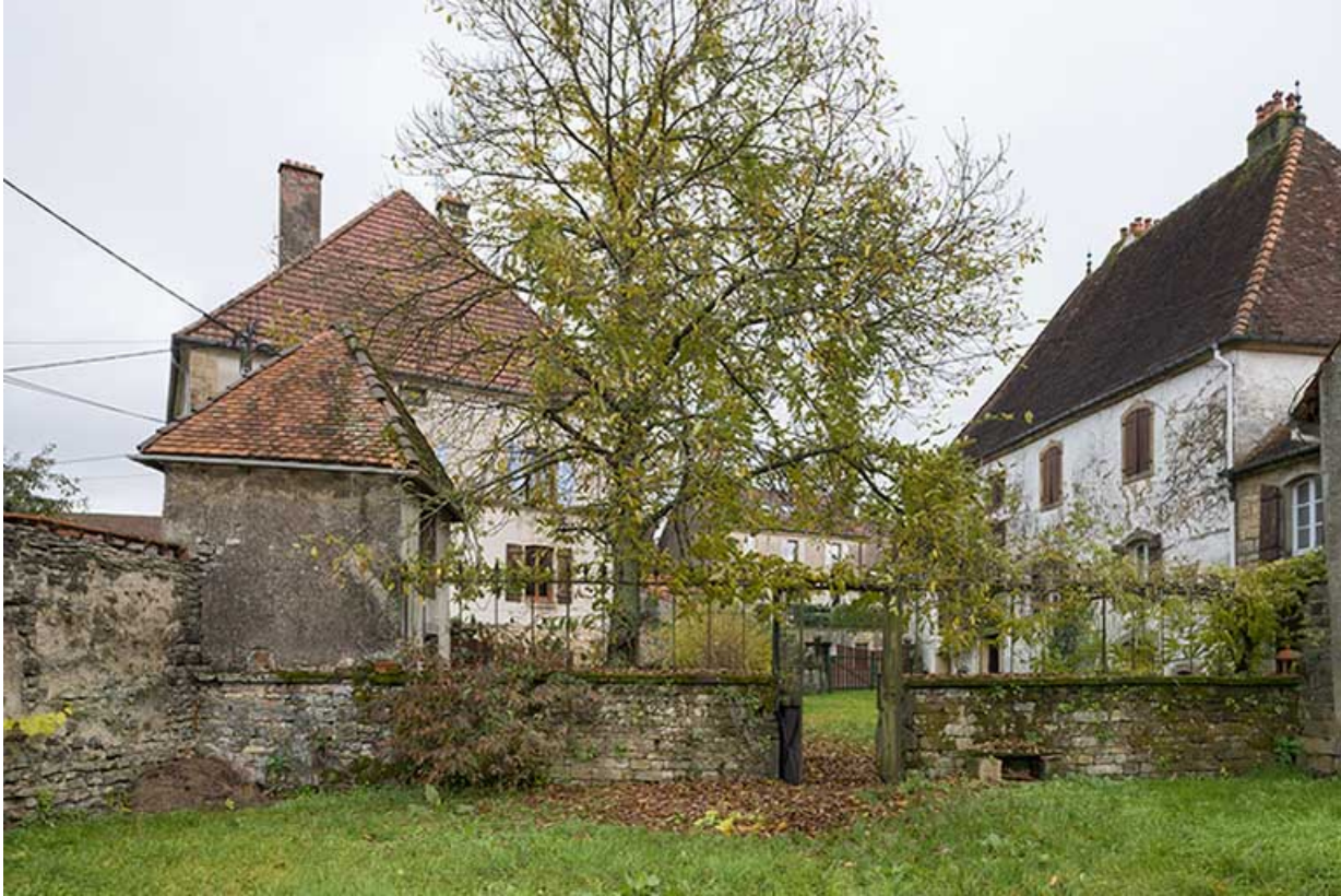
Vue de la demeure, du pigeonnier, de la mairie et du presbytère, depuis le jardin potager. 70, Baulay