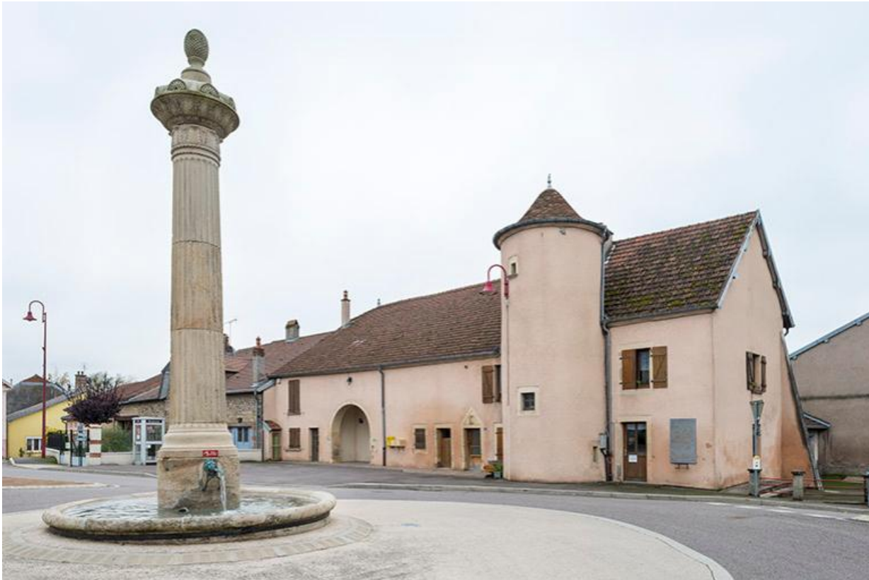
Place de la Résistance, fontaine-colonne et ancienne maison avec tourelle contenant un escalier-en-vis. 70, Baulay