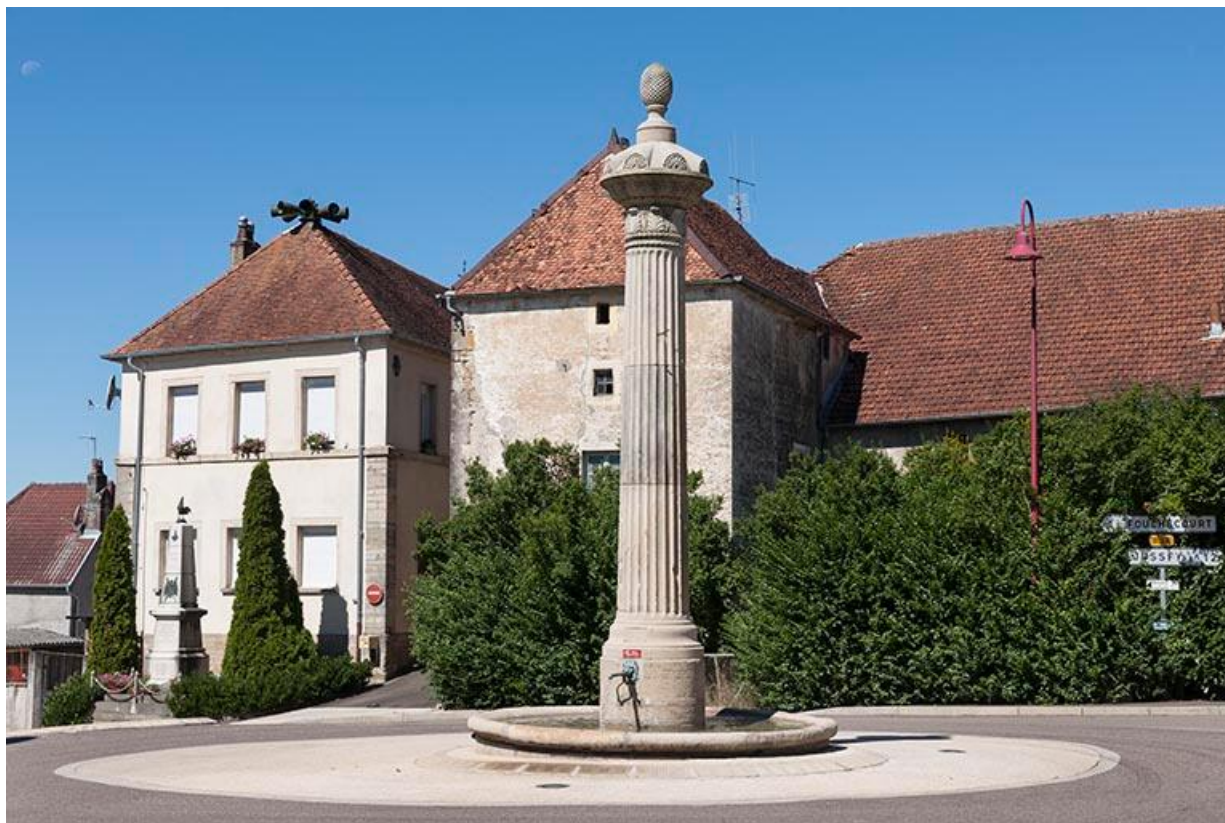
Place de la Résistance, fontaine-colonne, ancienne maison commune et école des garçons à gauche et ferme avec un plan en L à droite.