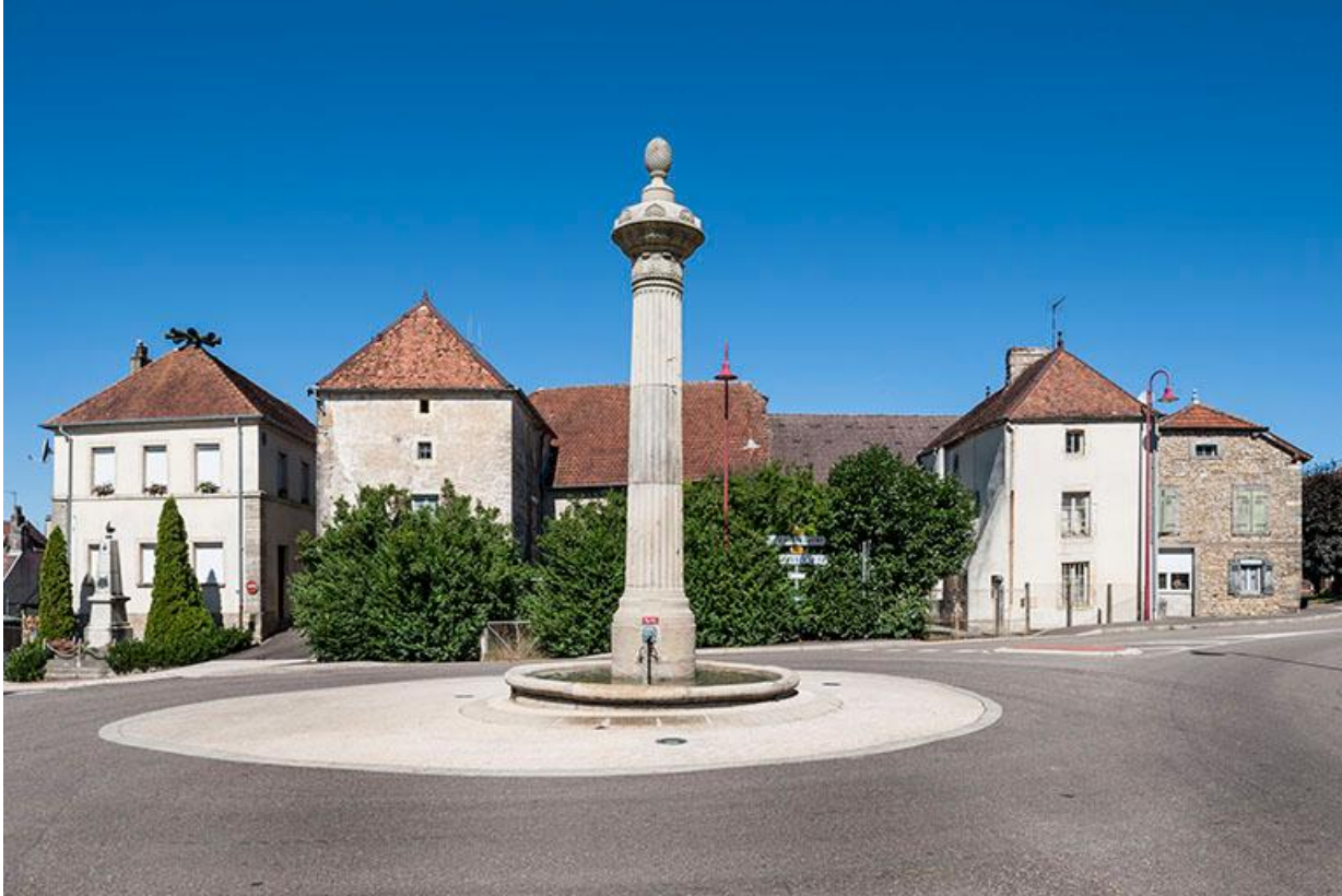
Place de la Résistance, fontaine-colonne. Alignement de maisons, ancienne maison commune, deux fermes en L symétriques. 70, Baulay