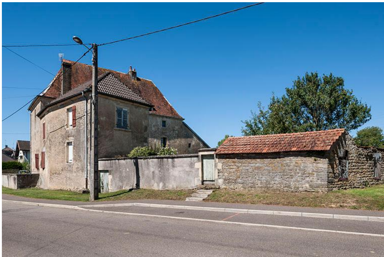
Ferme avec plan en L, 13 Grande rue. 70, Baulay