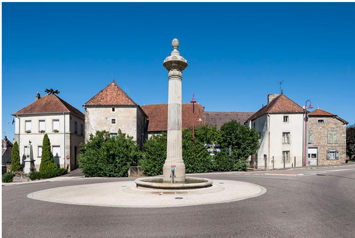
Place de la Résistance, fontaine-colonne. Alignement de maisons, ancienne maison commune, deux fermes en L symétriques. 70, Baulay