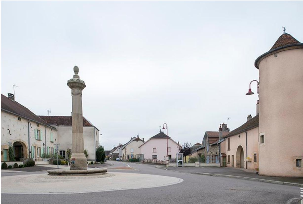
Place de la Résistance, maisons et fermes le long de la rue Grande. 70, Baulay