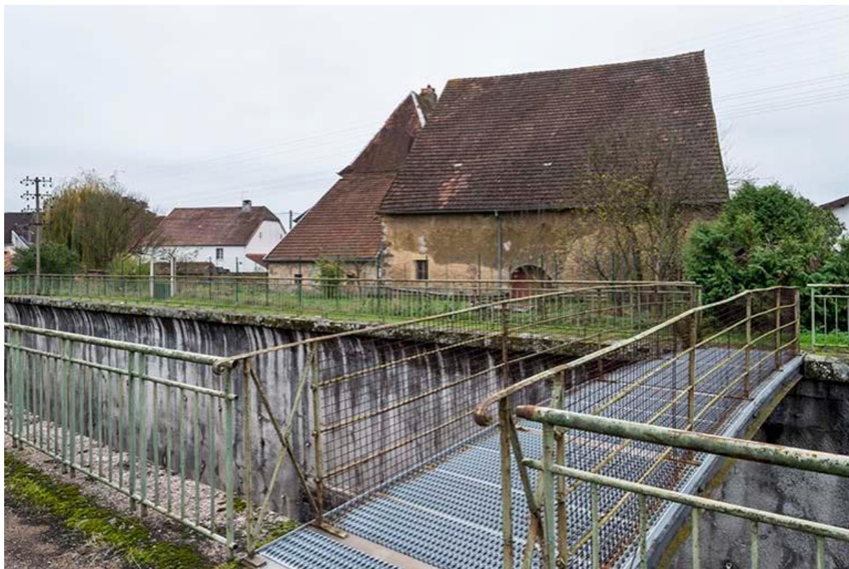
Ferme 13 Grande rue, vue depuis la voie ferrée appelée "la tranchée" de Baulay. 70, Baulay