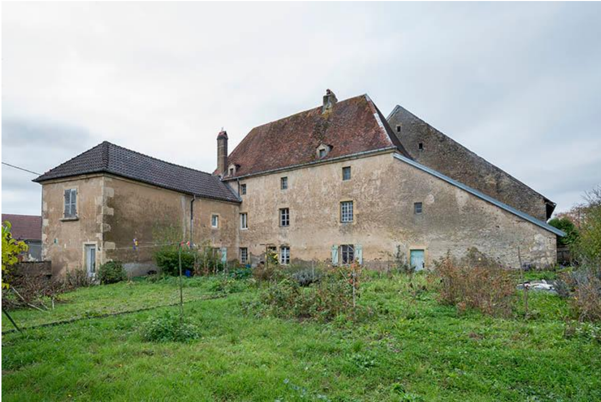
Ferme 13 Grande rue, vue depuis la voie ferrée. 70, Baulay