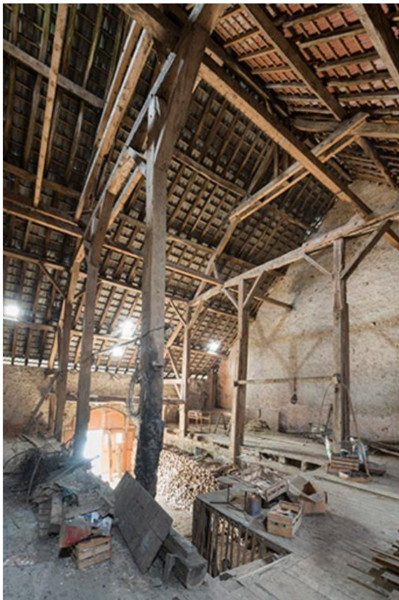
Charpente de la ferme, vue du grenier, 13 Grande rue. 70, Baulay