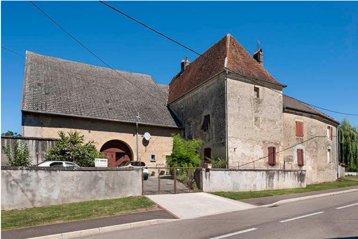
Ferme avec plan en L, 13 Grande rue. 70, Baulay