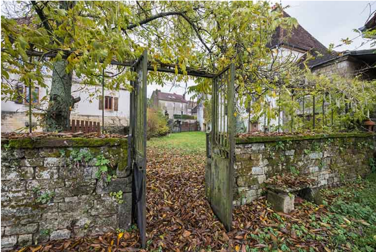
Le mur de clôture qui sépare le jardin d'agrément du jardin potager. 70, Baulay