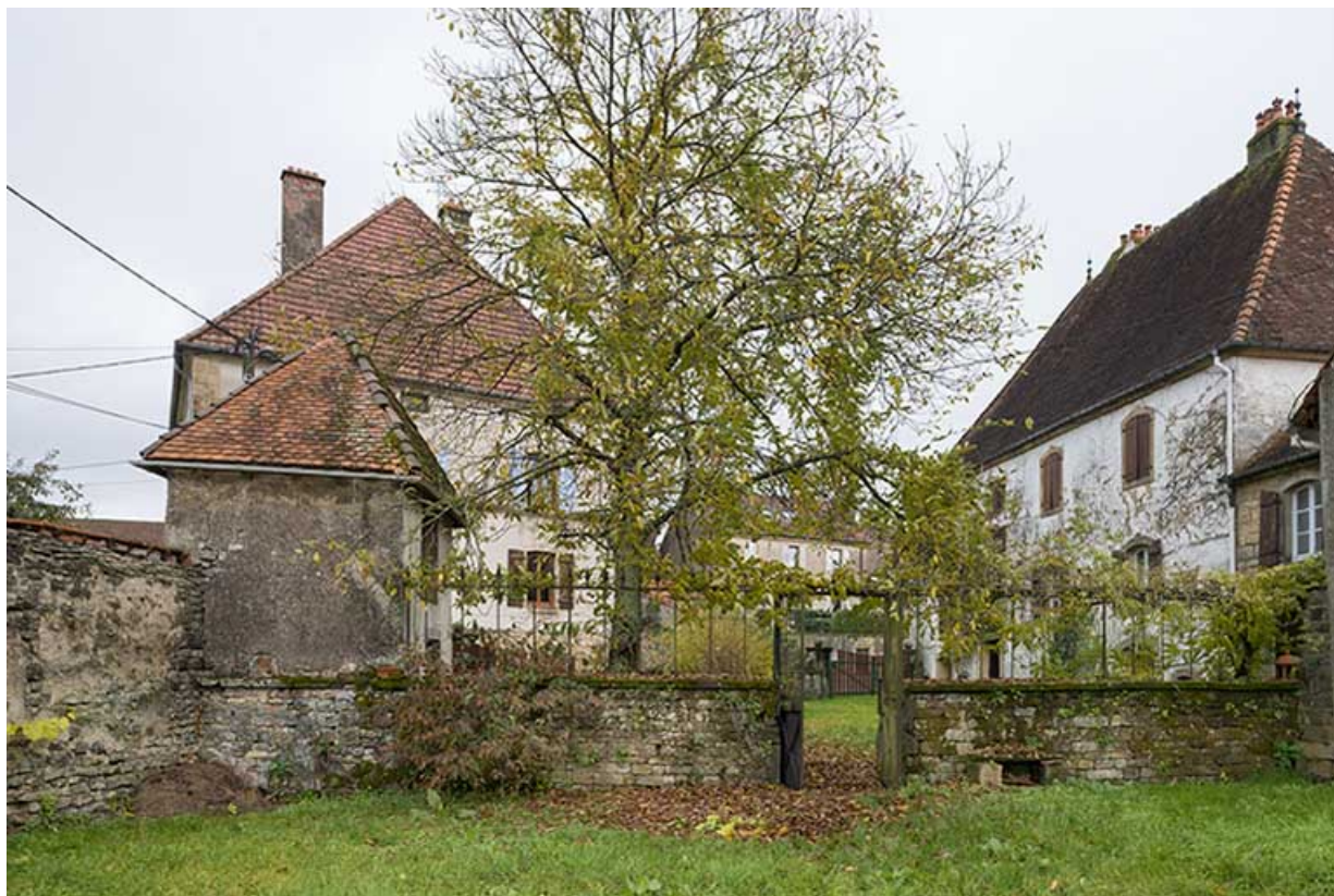
Vue de la demeure, du pigeonnier, de la mairie et du presbytère, depuis le jardin potager.