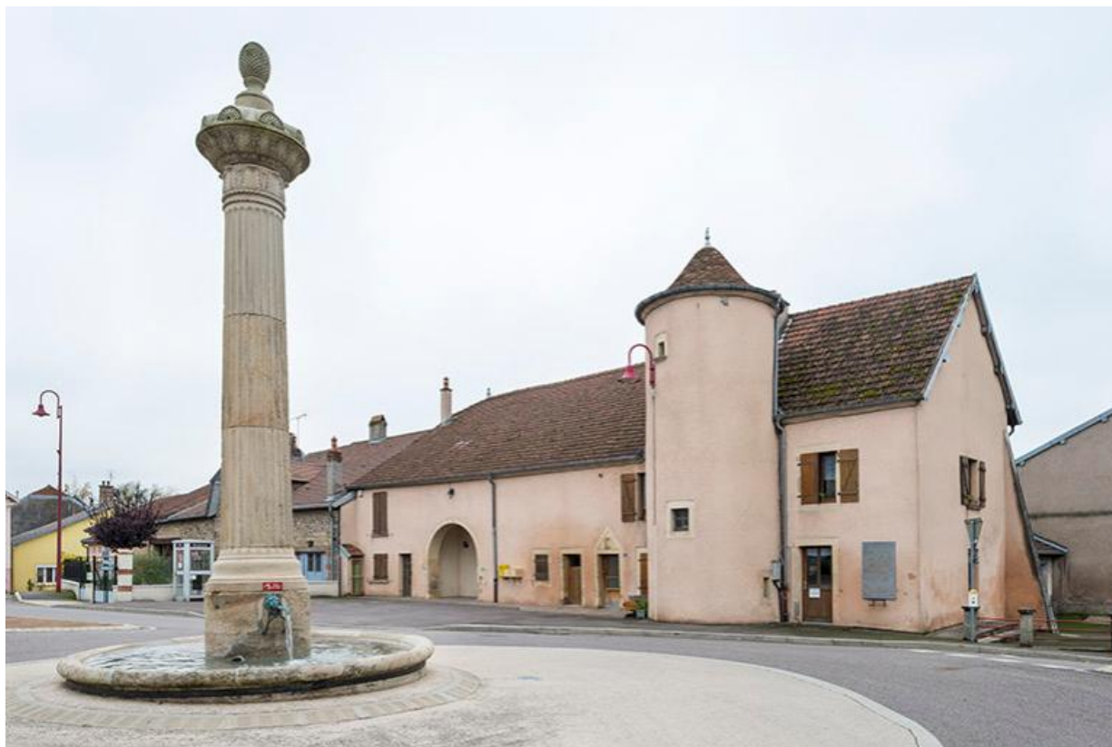
Place de la Résistance, fontaine-colonne et ancienne maison avec tourelle contenant un escalier-en-vis. 70, Baulay