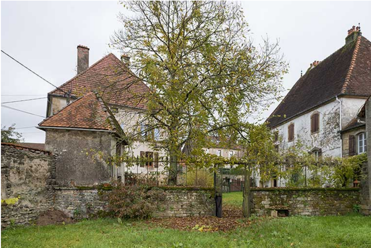
Vue de la demeure, du pigeonnier, de la mairie et du presbytère, depuis le jardin potager. 70, Baulay