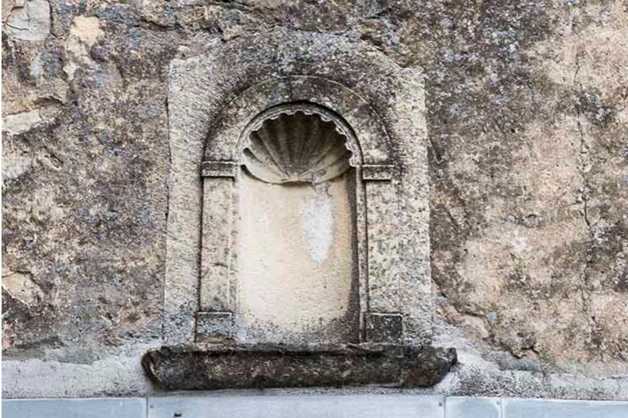
Niche située au-dessus de la porte d'entrée de l'habitation, 13 Grande rue. 70, Baulay