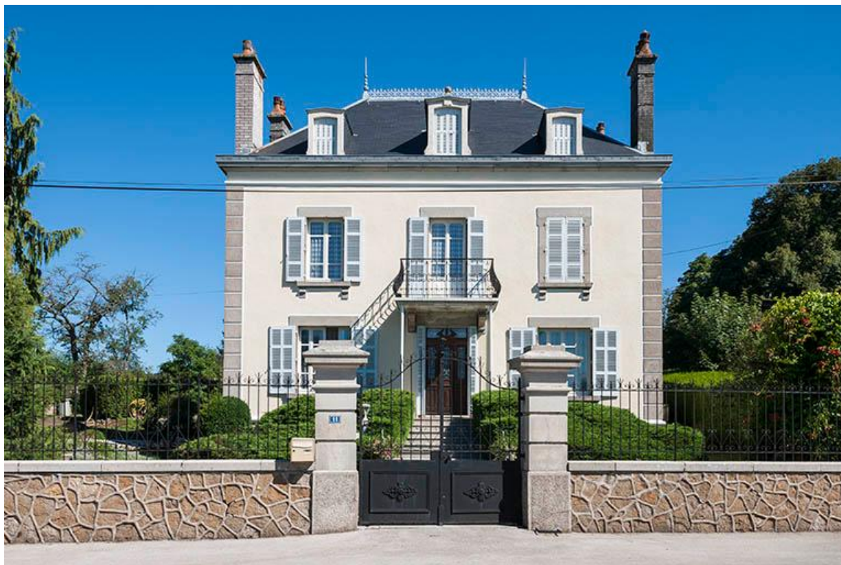
Demeure datant du 1er quart 20e siècle, Baulay.