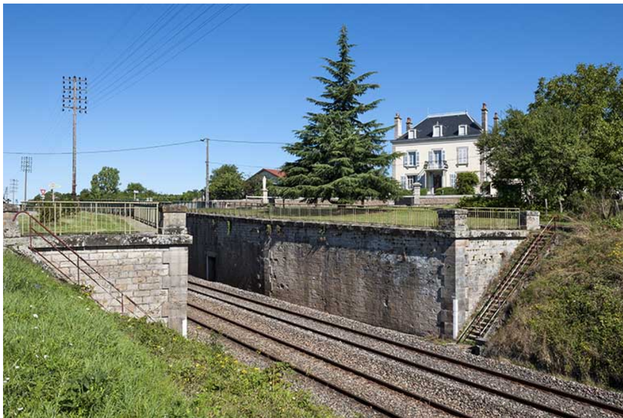
Voie ferrée traversant le village