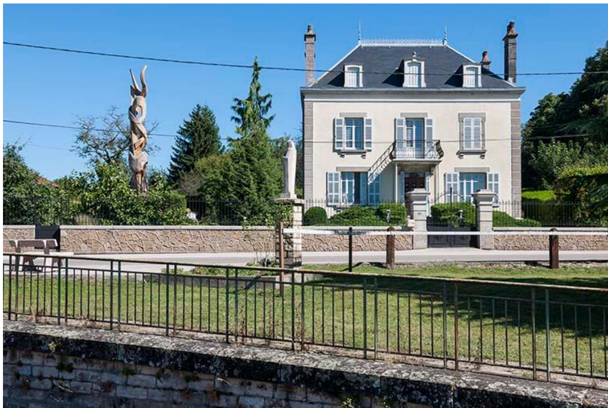
Maison 11 rue Grande vue depuis la voie ferrée.