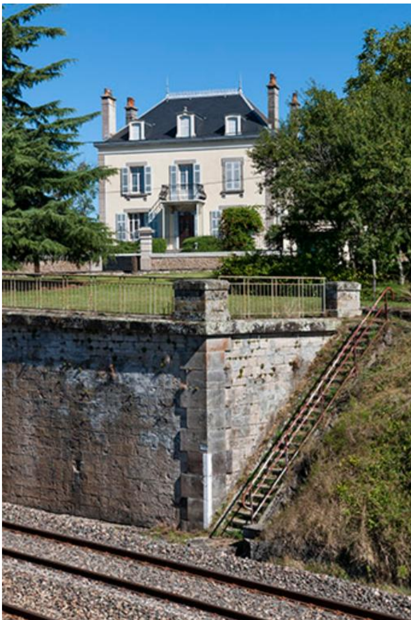
Maison 11 rue Grande, située de l'autre côté de la voie ferrée.