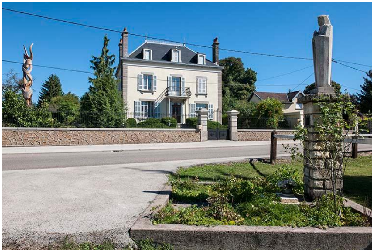
Maison vue depuis l'embranchement après la voie ferrée. Une statue de la Vierge se trouve sur l'îlot triangulaire, face à la maison. 70, Baulay, 11 Grande Rue