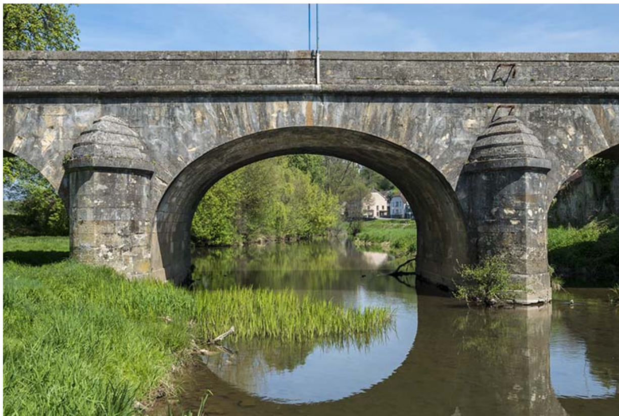
Détail de l'arche centrale.