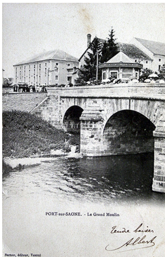
Le pont au niveau de l'île de la Rezelle, carte postale. 70, Port-sur-Saône

Port-sur-Saône - Le Grand Moulin. Carte postale éditée à Vesoul, 20e siècle.