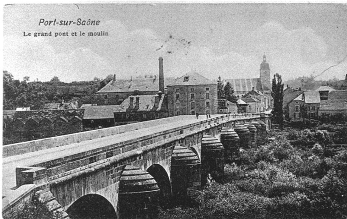
Le pont, carte postale. 70, Port-sur-Saône