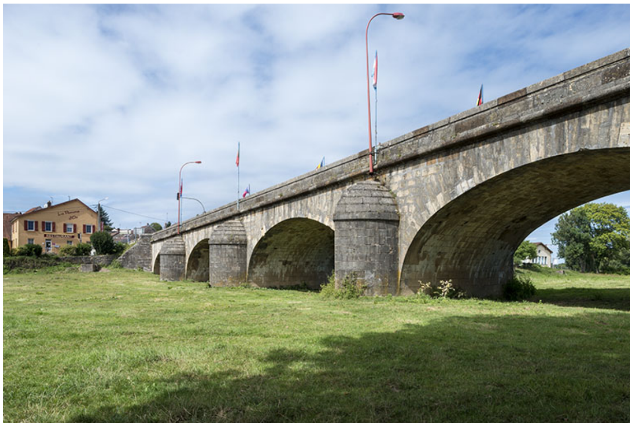
Vue depuis l'aval. 70, Port-sur-Saône