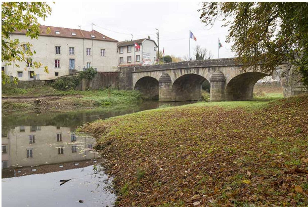
Le pont depuis l'amont. 70, Port-sur-Saône