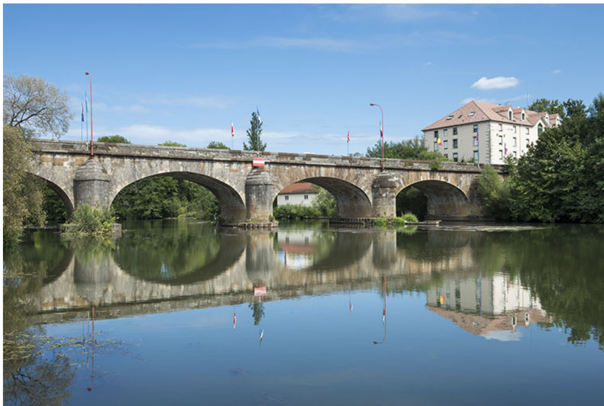
Le pont enjambant la Saône, Port-sur-Saône.