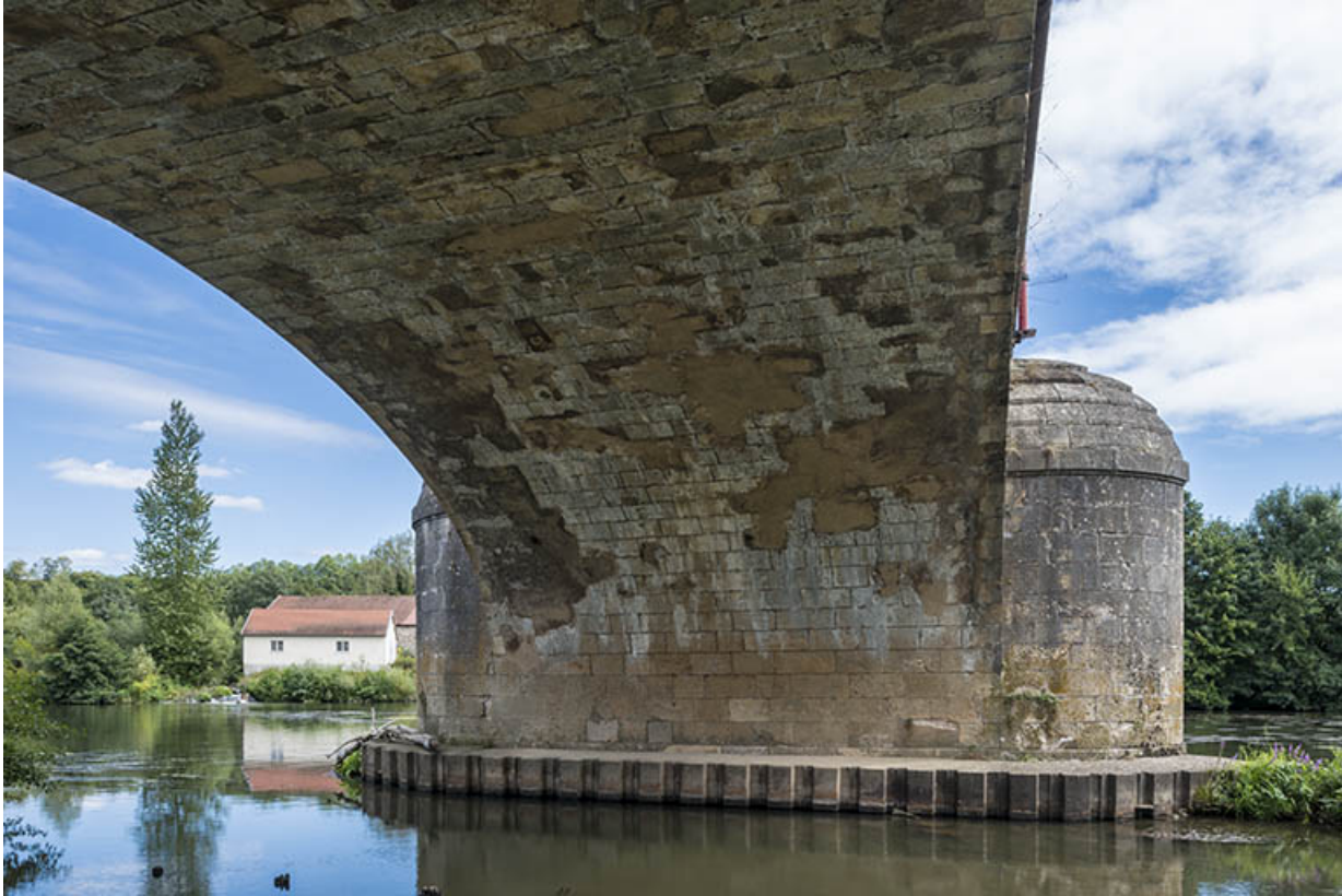
Détail sur la maçonnerie de l'édifice.