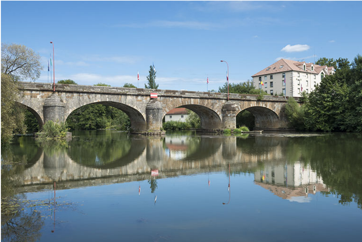
Le pont enjambant la Saône, Port-sur-Saône.