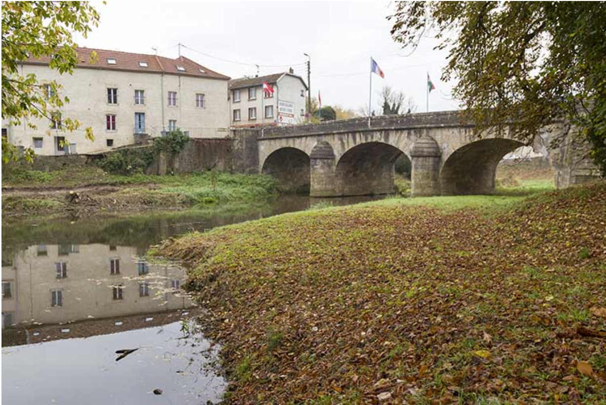
Le pont depuis l'amont. 70, Port-sur-Saône