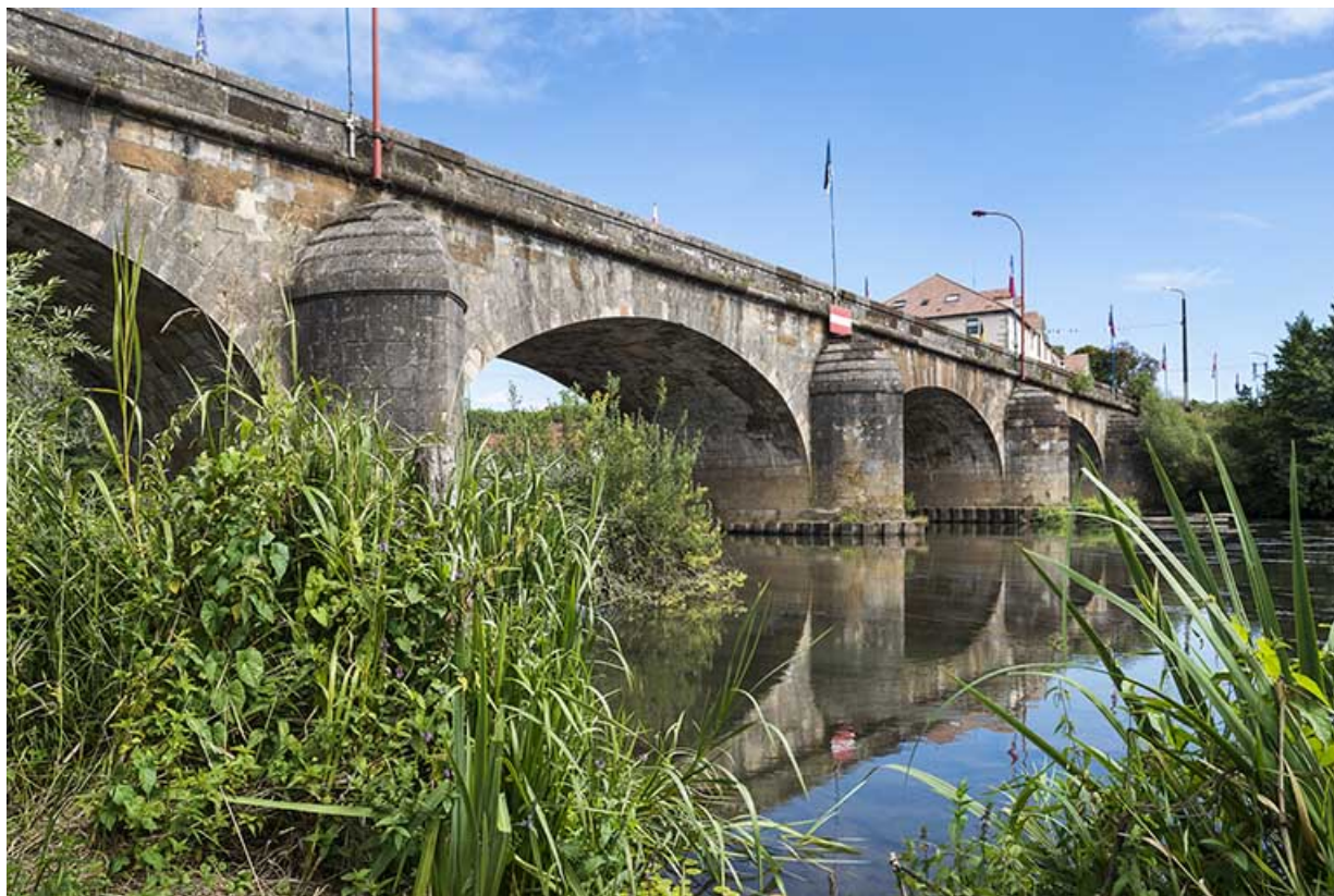
Le pont et la Saône. 70, Port-sur-Saône