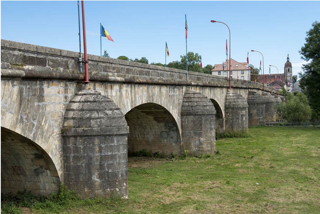
Le pont au niveau de Saint-Valère. 70, Port-sur-Saône