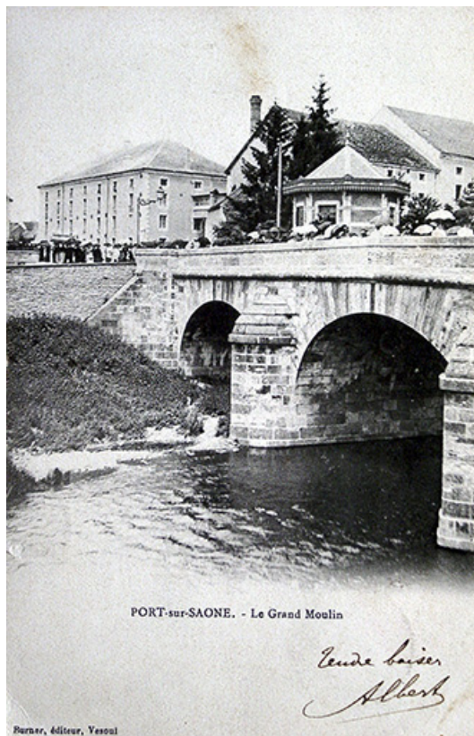
Le pont au niveau de l'île de la Rezelle, carte postale. 70, Port-sur-Saône