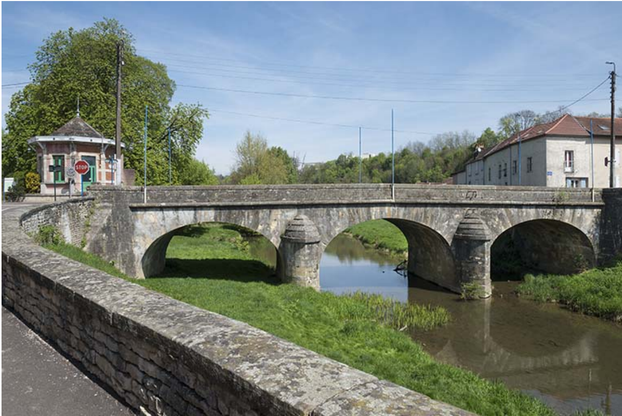
Le pont au niveau de la Rezelle.