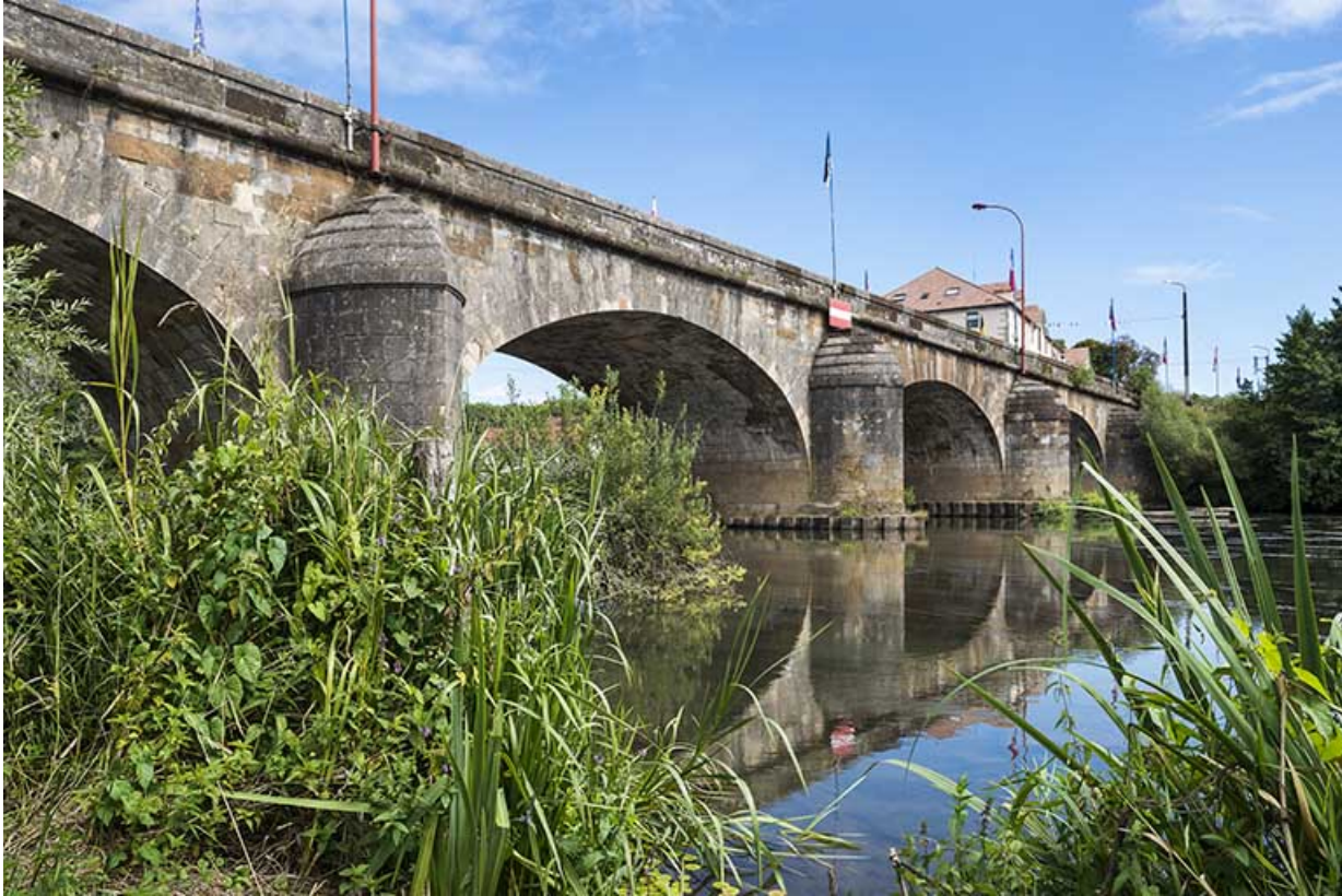
Le pont et la Saône.