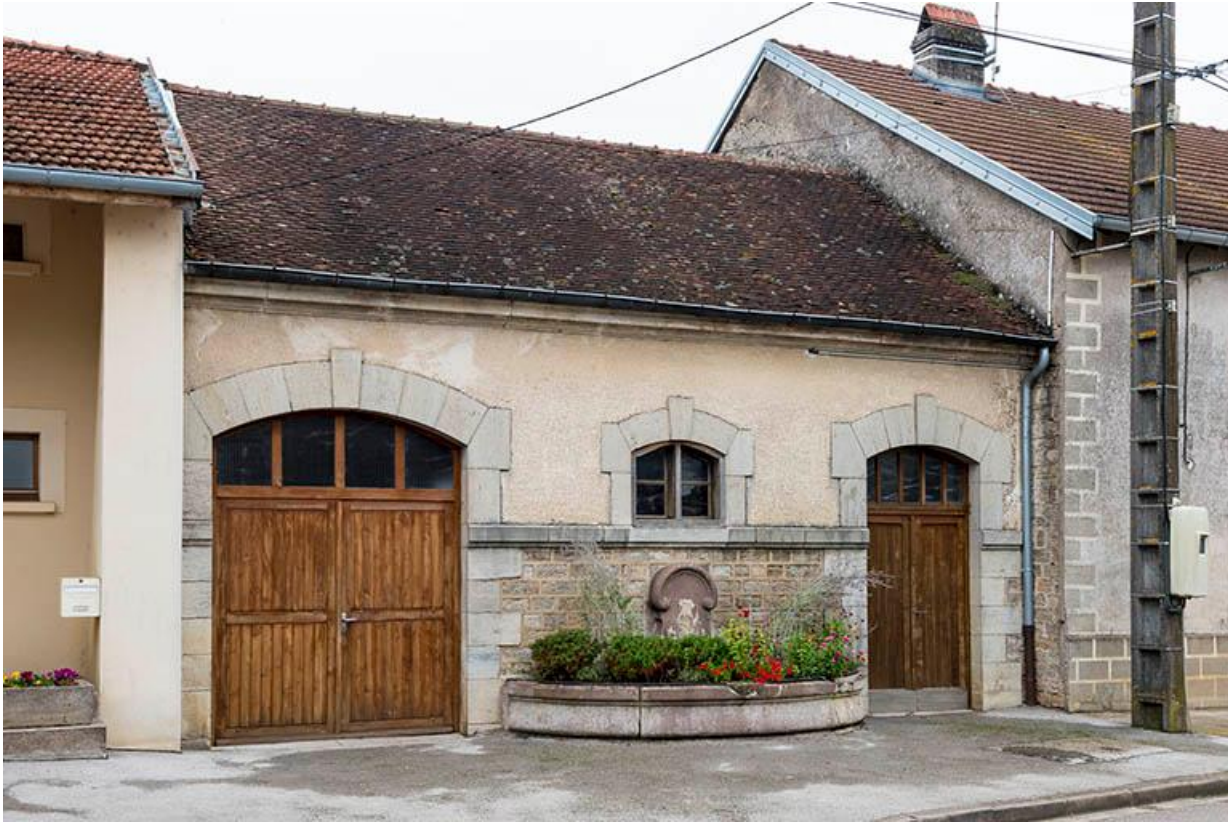
La façade sur rue du lavoir et remise de pompe à incendie, rue des Vignes 70, Baulay