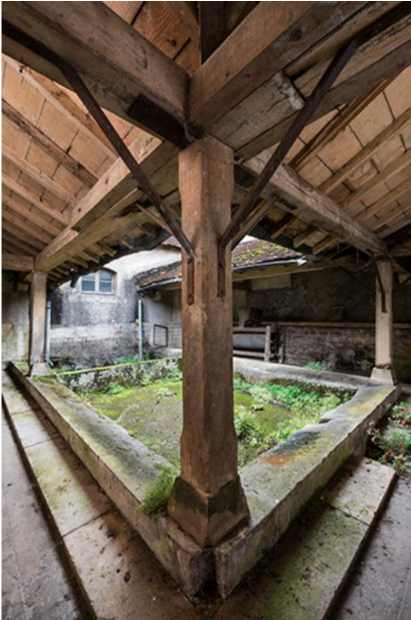
Le lavoir est sa galerie couverte