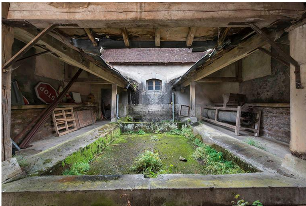
Le bassin du lavoir entouré de sa galerie couverte, dans le prolongement de la remise de pompe à incendie. 70, Baulay