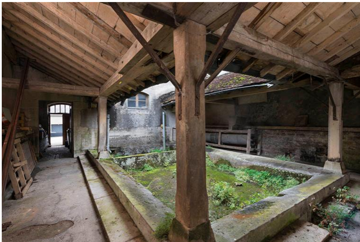
Porte ouvrant sur la rue et couloir desservant la remise de pompe à incendie et le lavoir. 70, Baulay