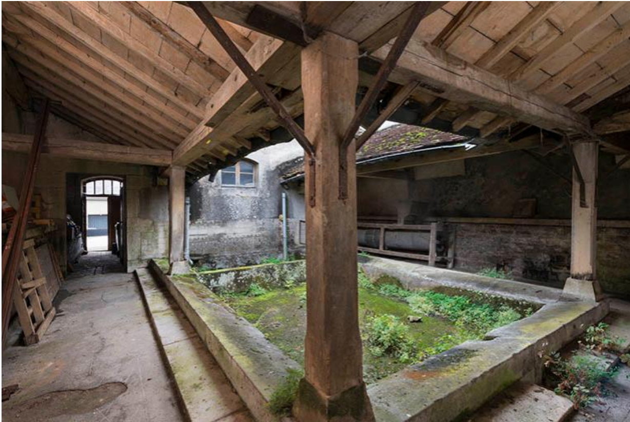
Porte ouvrant sur la rue et couloir desservant la remise de pompe à incendie et le lavoir. 70, Baulay