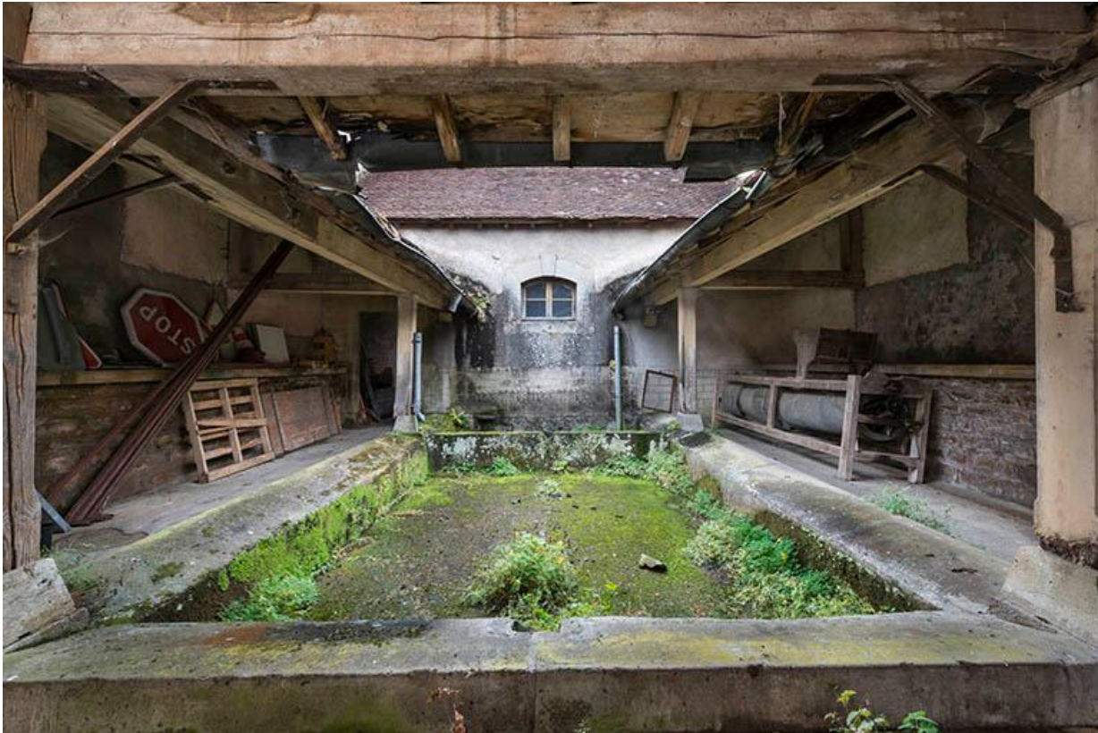
Le bassin du lavoir entouré de sa galerie couverte, dans le prolongement de la remise de pompe à incendie. 70, Baulay