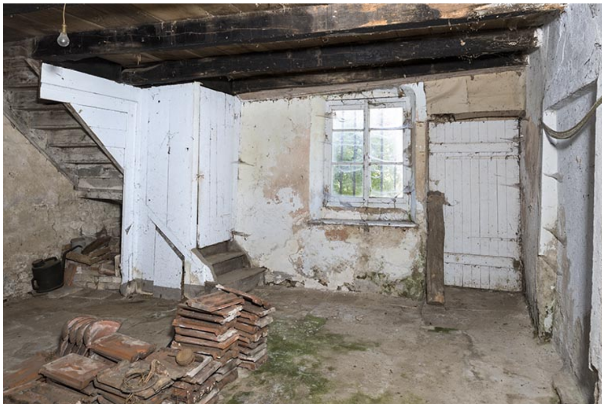
Intérieur : la cuisine en direction de l'entrée. 70, Rupt-sur-Saône rue de la Fontenotte