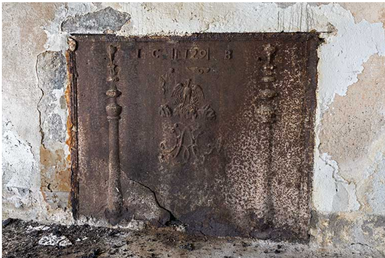
intérieur : la plaque de cheminée.