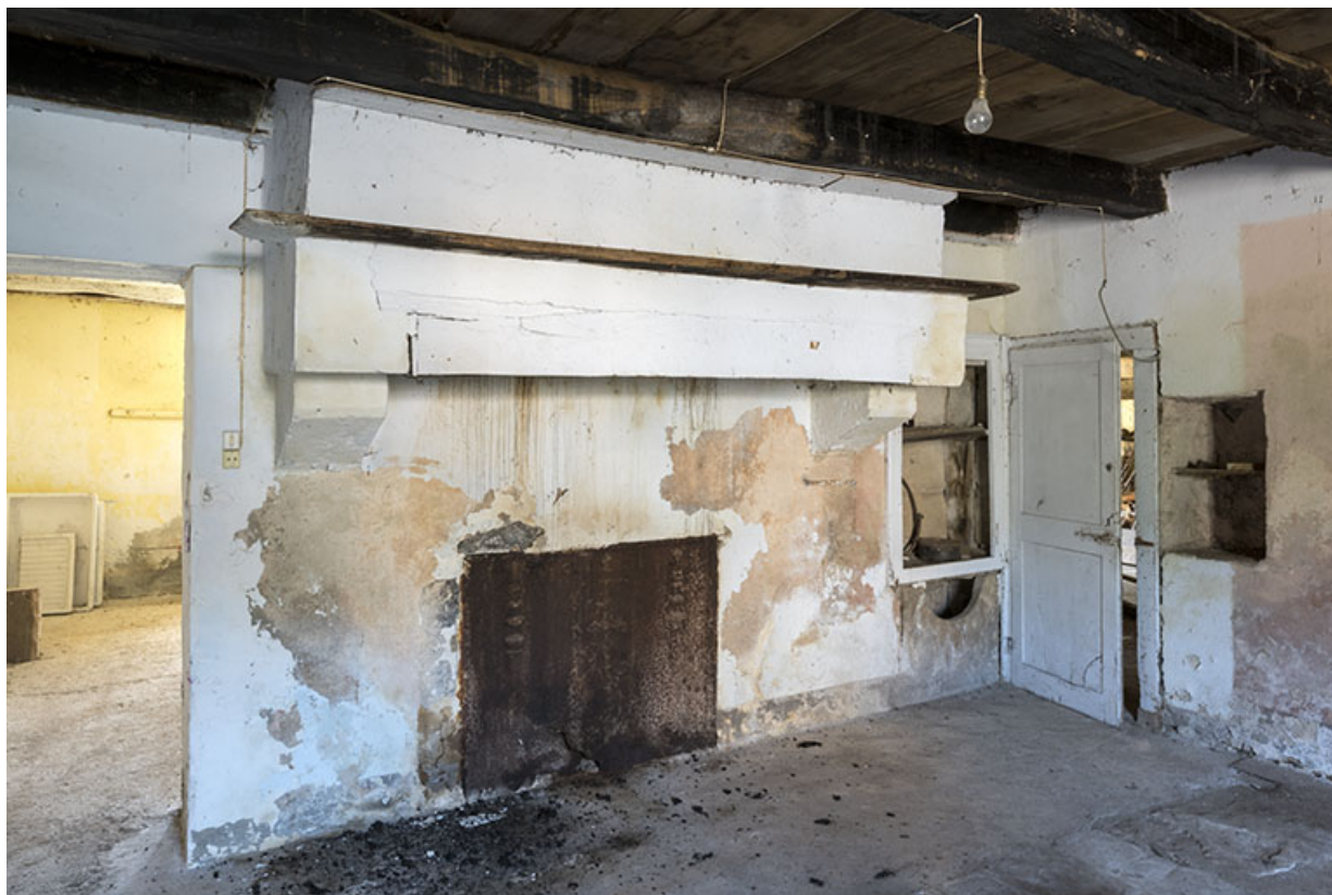
Intérieur : la cuisine depuis l'entrée.