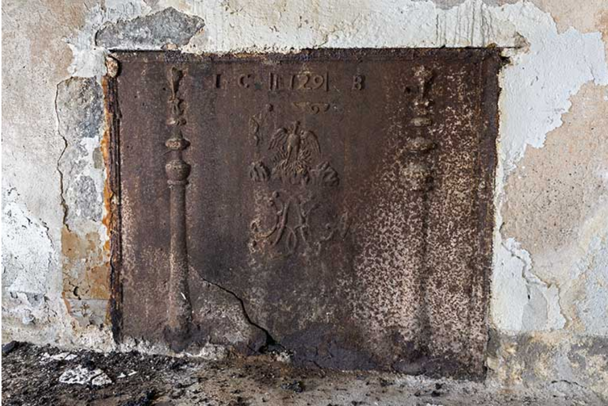
intérieur : la plaque de cheminée.