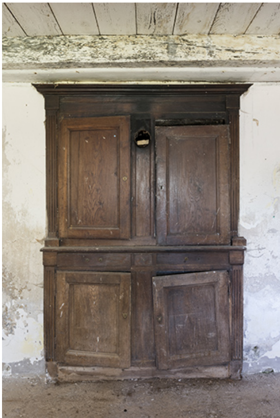
Intérieur, salle à manger : le buffet derrière la cheminée de la cuisine. 70, Rupt-sur-Saône rue de la Fontenotte