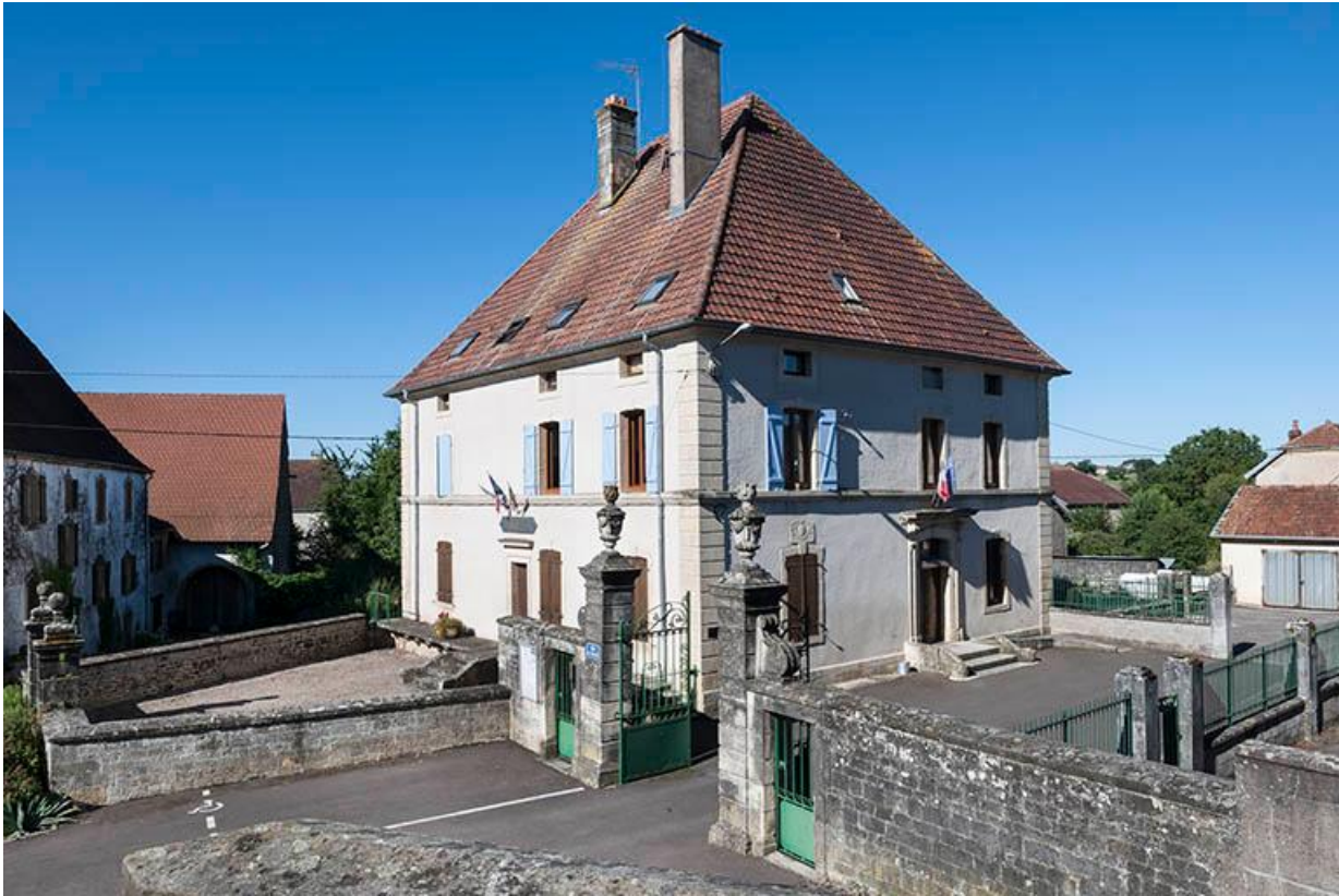
La maison Malapert, aujourd'hui la mairie, encadrée par son avant-cour, son jardin à l'arrière et la cour de l'école à droite. 70, Baulay, 2 rue de l' Église