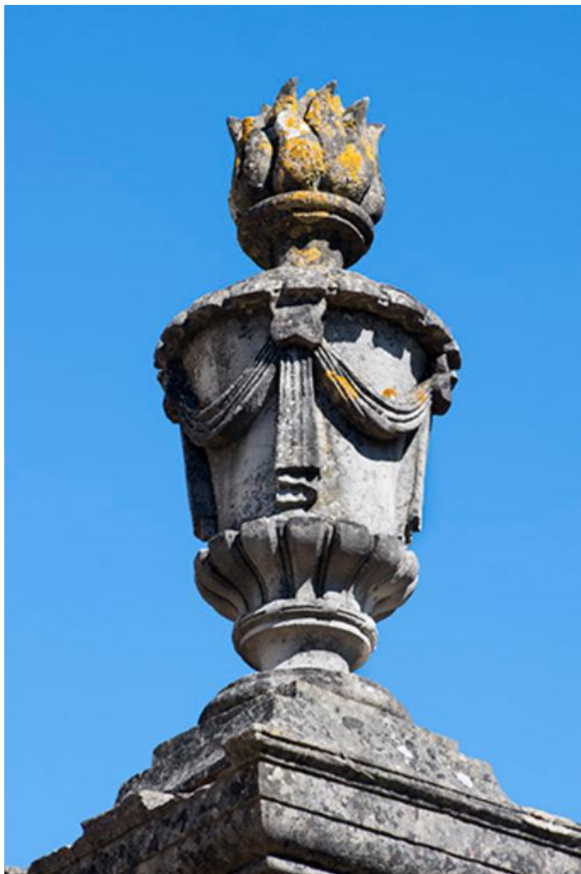
Détail d'un pot-à-feu décorant le mur de clôture de la mairie.