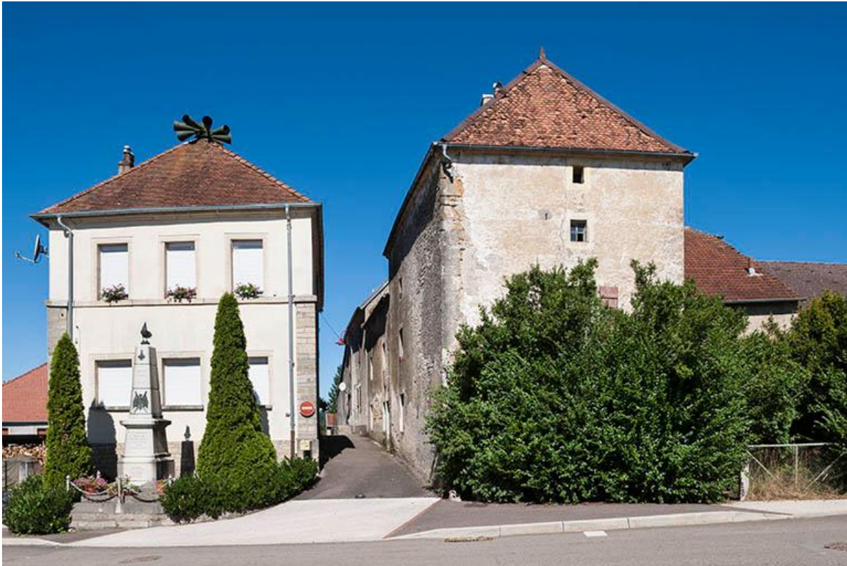
Ancienne maison commune: mairie et école des garçons de 1840 à 1935. Monument aux morts devant sa façade. 70, Baulay rue de l' Église