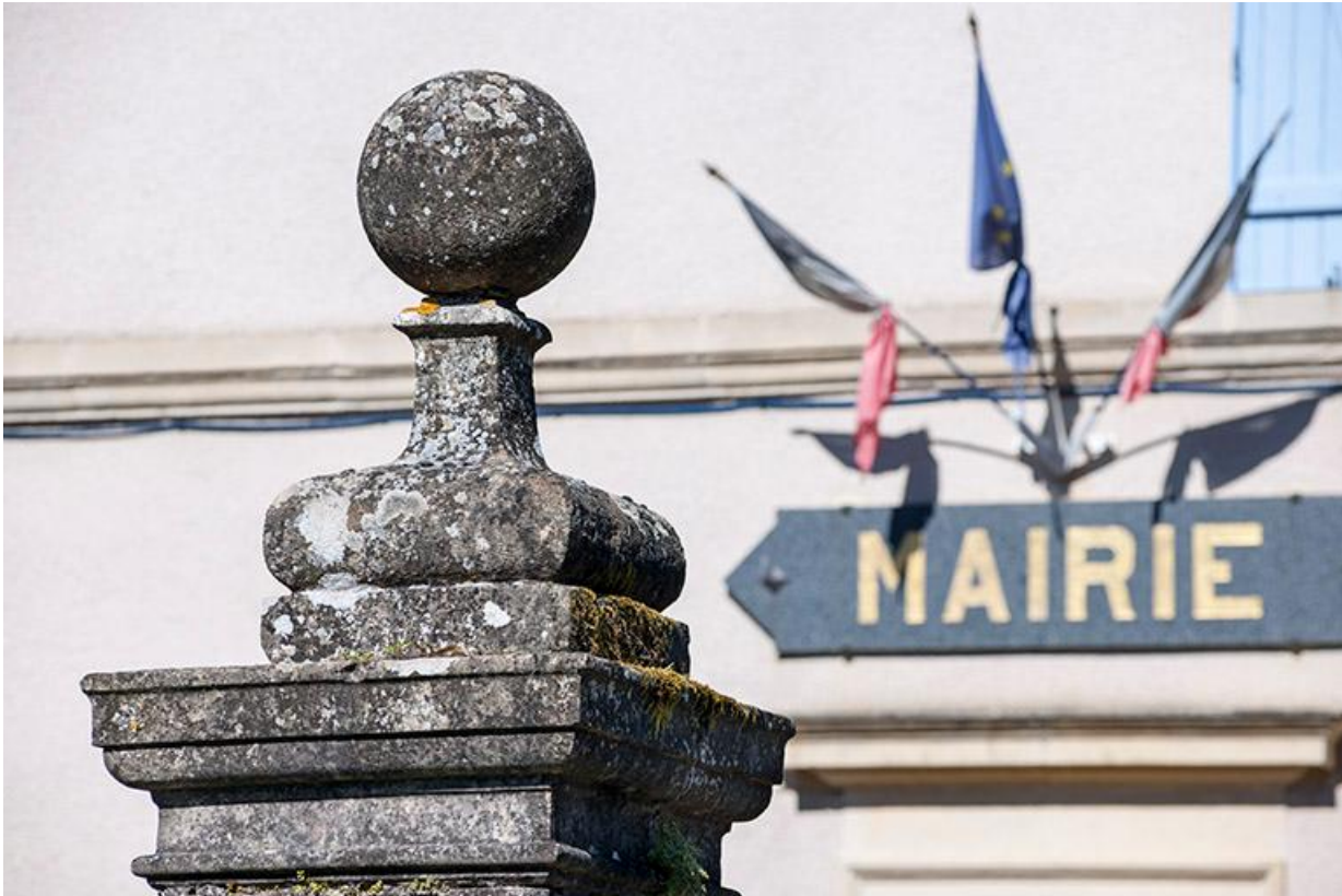
Détail du décor de l'avant-cour de la mairie.