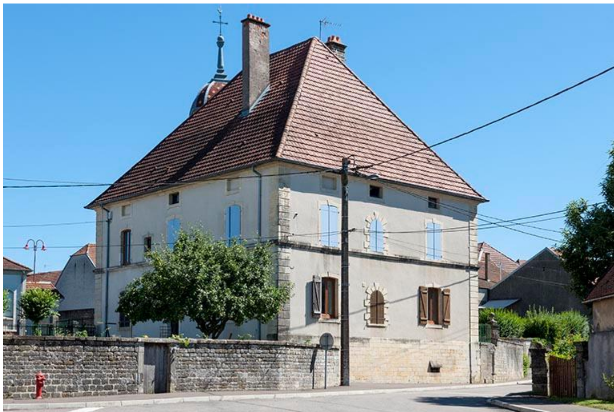
La maison Malapert, aujourd'hui la mairie, et son jardin, angle Sud-Ouest. 70, Baulay, 2 rue de l' Église