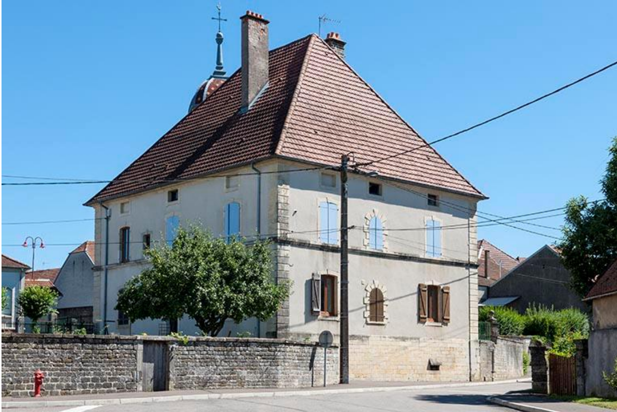
La maison Malapert, aujourd'hui la mairie, et son jardin, angle Sud-Ouest. 70, Baulay, 2 rue de l' Église