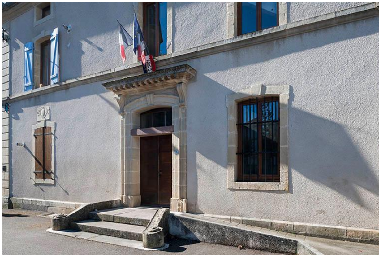
Entrée de la mairie, façade Nord.