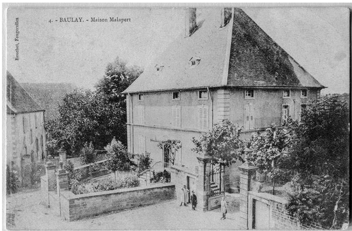
Maison Malapert, aujourd'hui mairie.