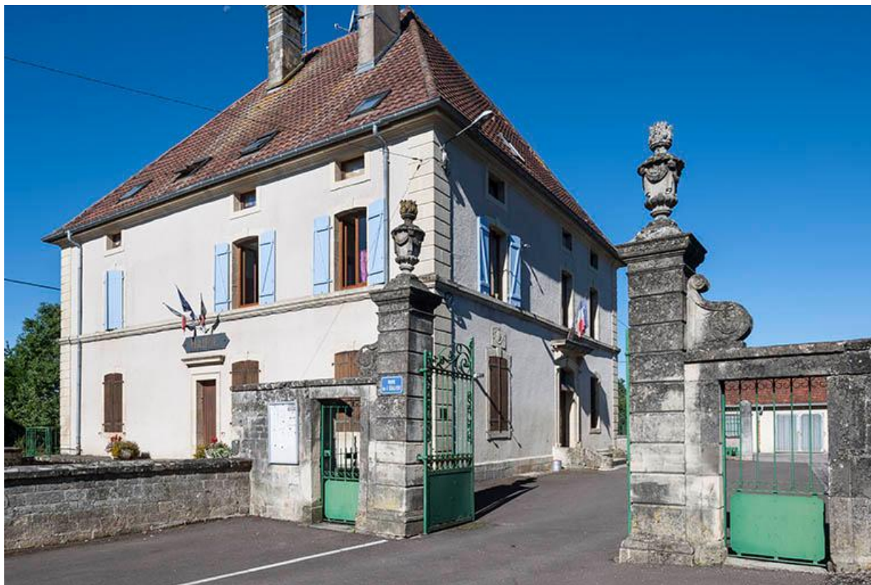
Mairie et son portail d'entrée, le décor et les murs de cloture hérités de la maison Malapert. 70, Baulay, 2 rue de l' Église