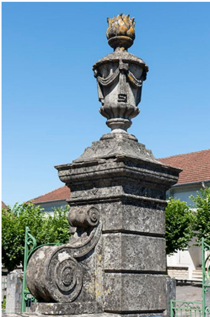
Détail du pilier du portail d'entrée de la mairie. Pot-à-feu et enroulement en volute décoratifs. 70, Baulay, 2 rue de l' Église