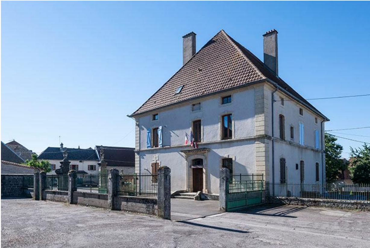
La mairie vue depuis la cour de récréation de l'école.