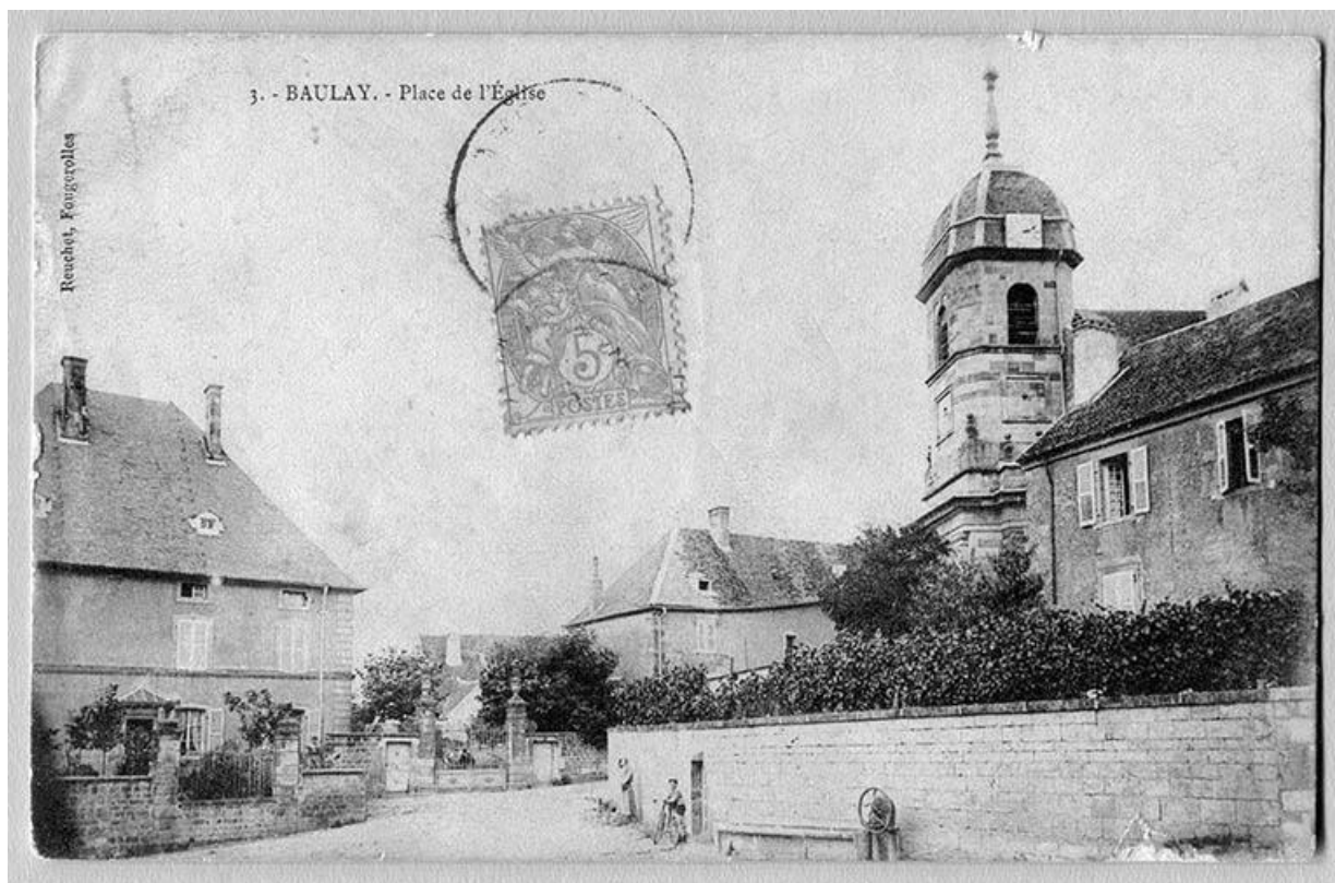
Vue de la maison Malapert et des propriétés bâties qui lui sont attachées, à côté de l'église, du presbytère et de sa fontaine. 70, Baulay