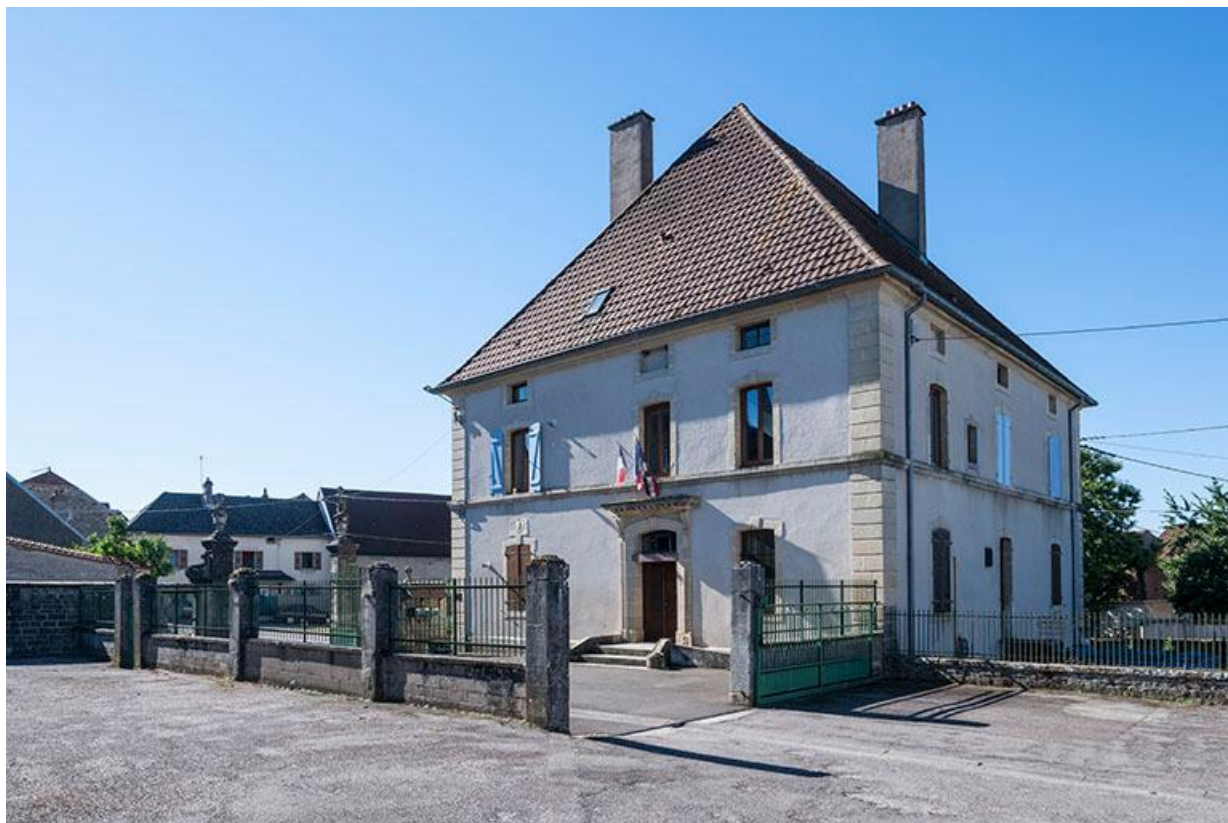
La mairie vue depuis la cour de récréation de l'école.