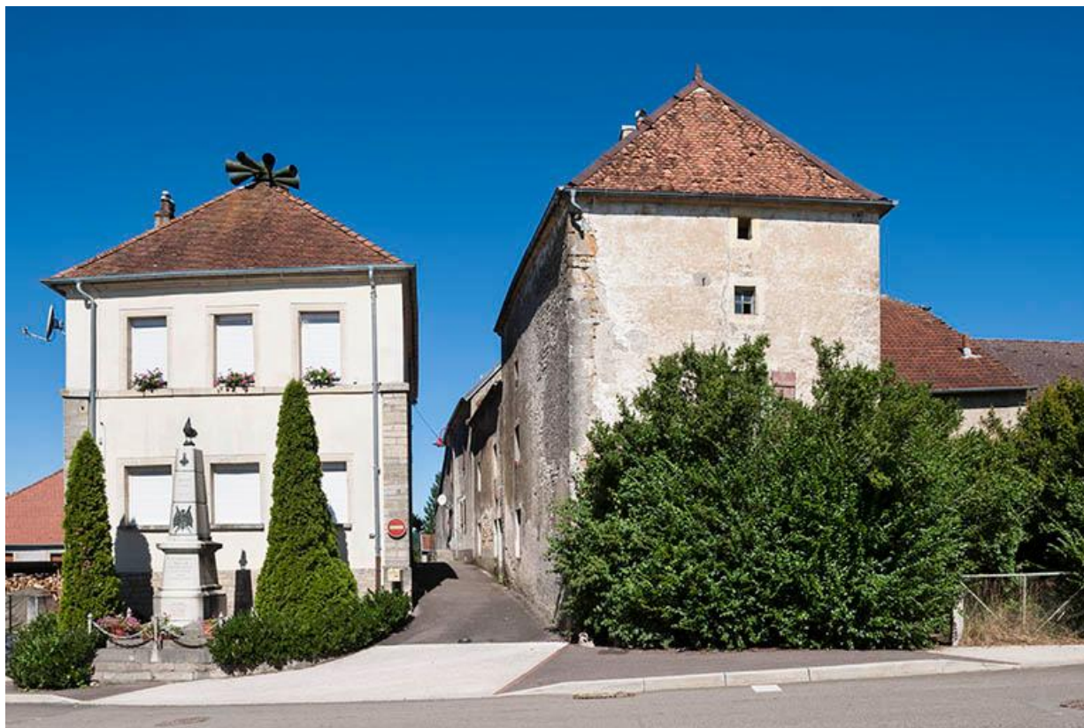
Ancienne maison commune: mairie et école des garçons de 1840 à 1935. Monument aux morts devant sa façade. 70, Baulay rue de l' Église