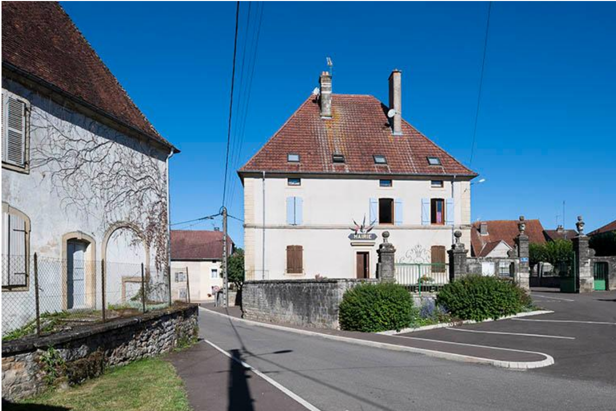
La maison Malapert, aujourd'hui la mairie, vue depuis la place de l'église. 70, Baulay, 2 rue de l' Église