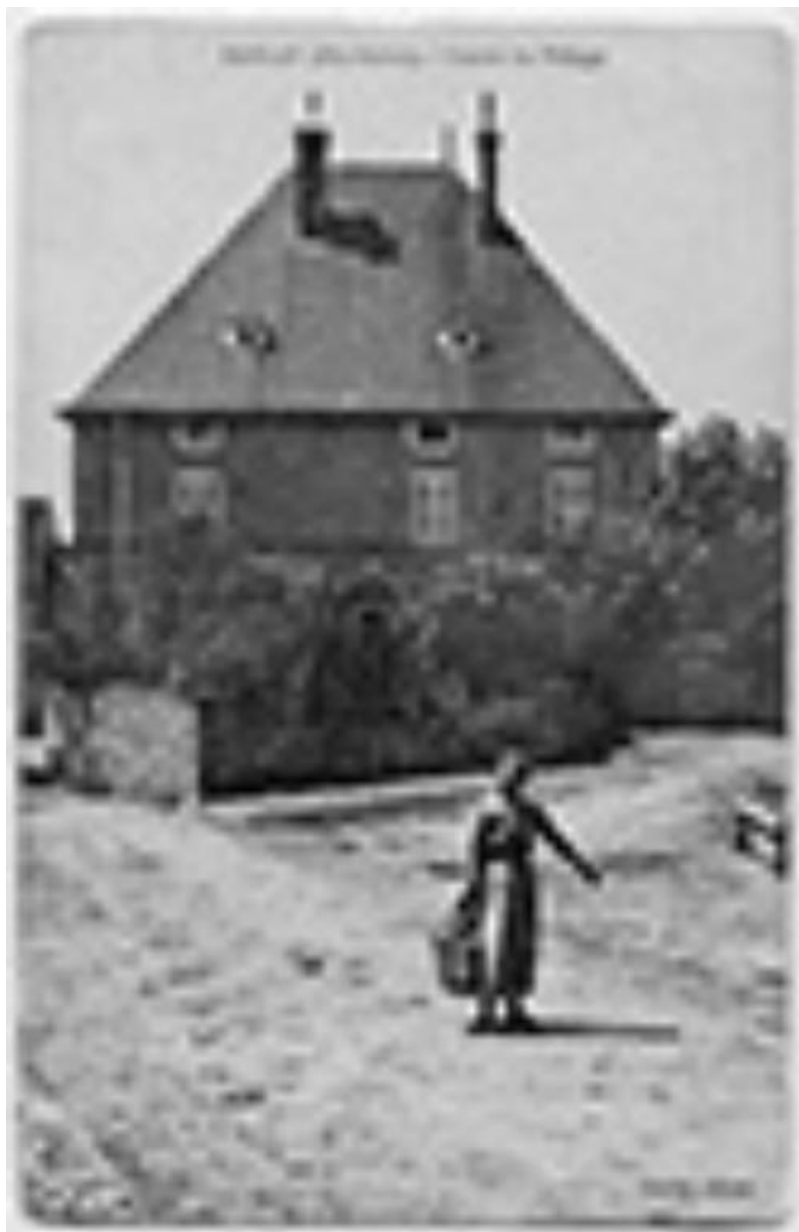
Vue du centre du village, place de l'église, devant la maison Malapert, aujourd'hui la mairie. 70, Baulay, 2 rue de l' Église