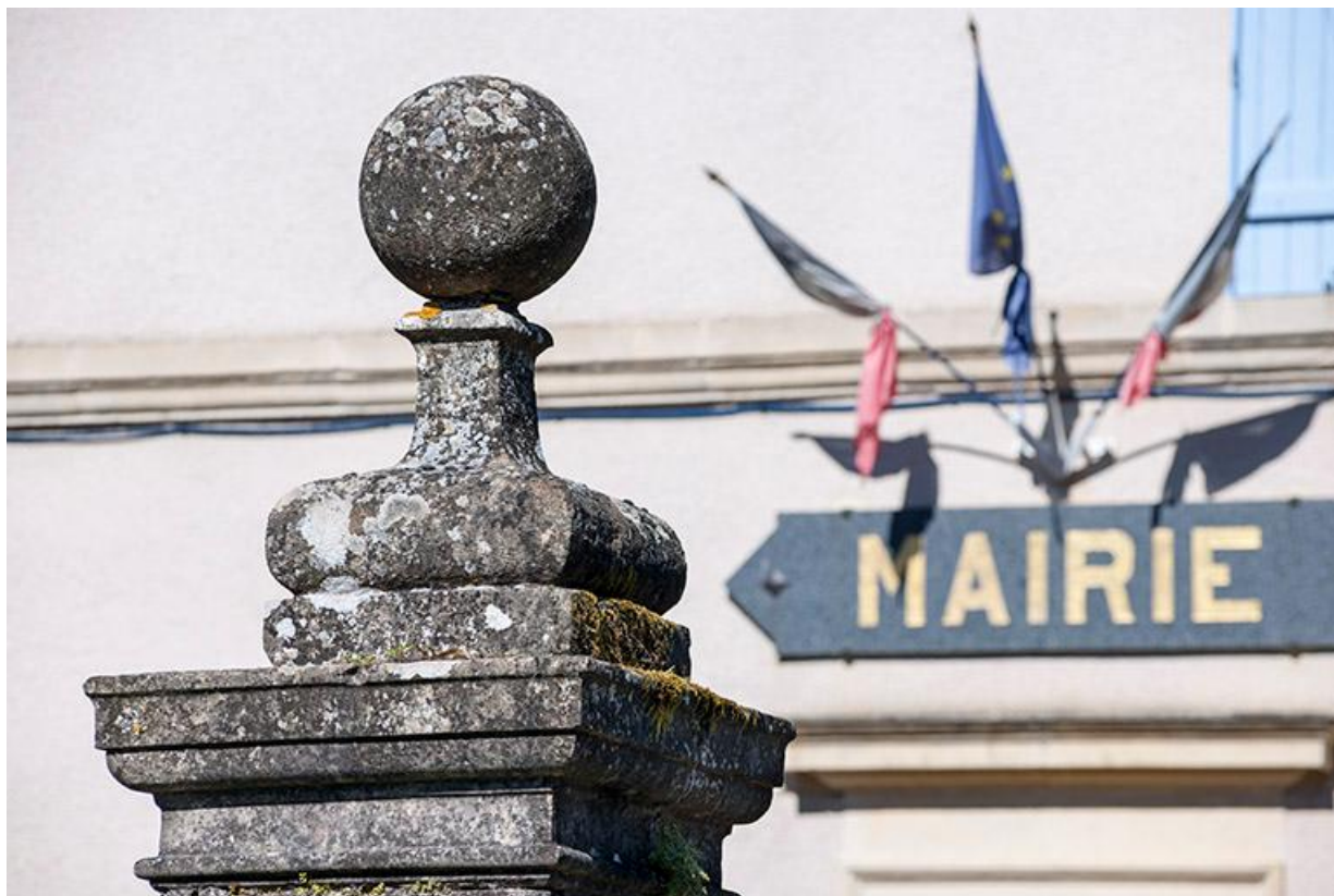
Détail du décor de l'avant-cour de la mairie. 70, Baulay, 2 rue de l' Église