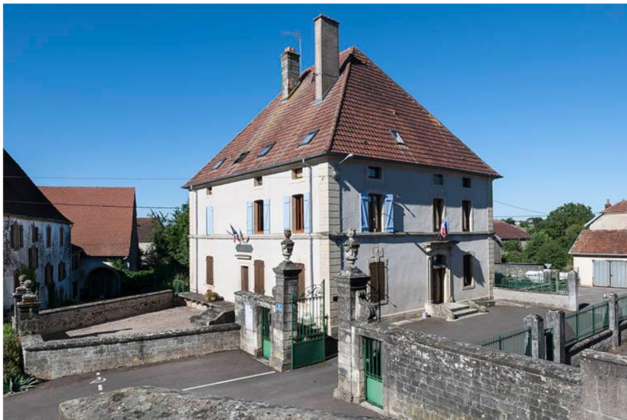
La maison Malapert, aujourd'hui la mairie, encadrée par son avant-cour, son jardin à l'arrière et la cour de l'école à droite. 70, Baulay, 2 rue de l' Église