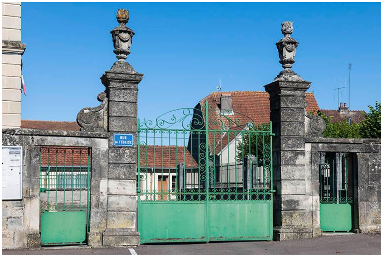
Portail d'entrée de la mairie.