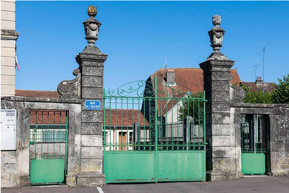
Portail d'entrée de la mairie.