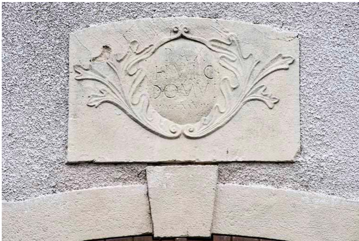
Plaque gravée avec inscription et datation: "Pax Hic Domui MDCCCXXVIII", sur le mur Nord de la mairie. 70, Baulay, 2 rue de l' Église