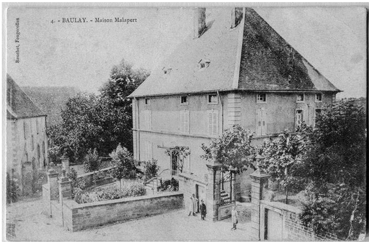
Maison Malapert, aujourd'hui mairie.