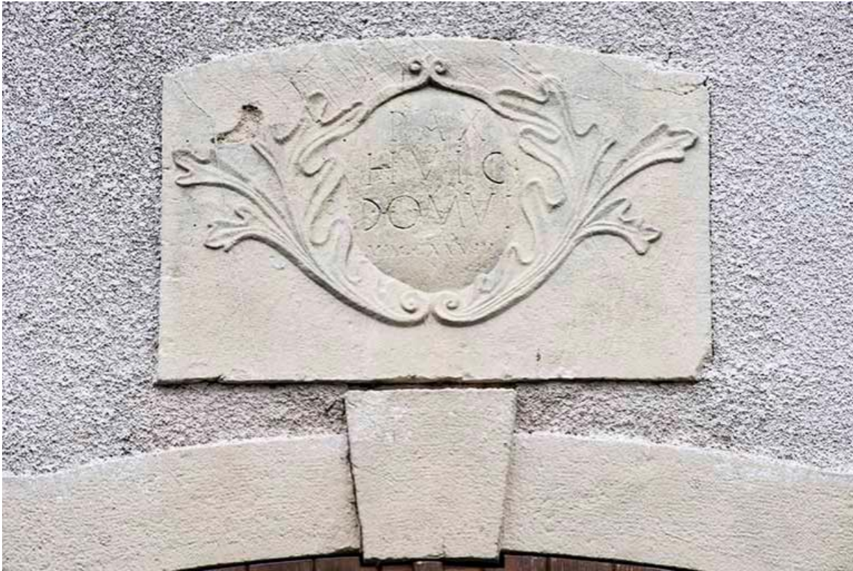
Plaque gravée avec inscription et datation: "Pax Hic Domui MDCCCXXVIII", sur le mur Nord de la mairie. 70, Baulay, 2 rue de l' Église