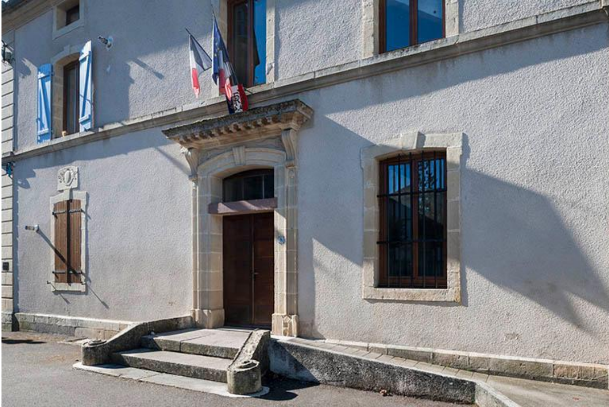
Entrée de la mairie, façade Nord.