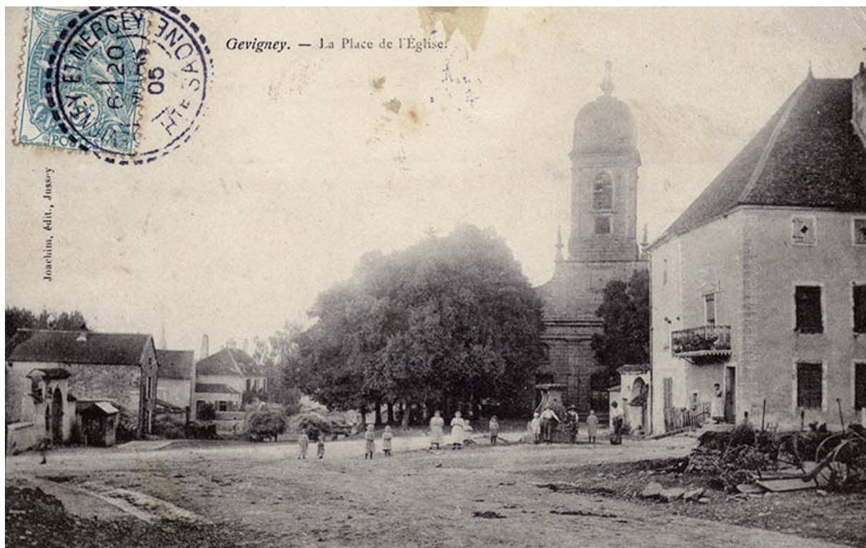
Place de l'église, carte postale (1905). 70, Gevigney-et-Mercey