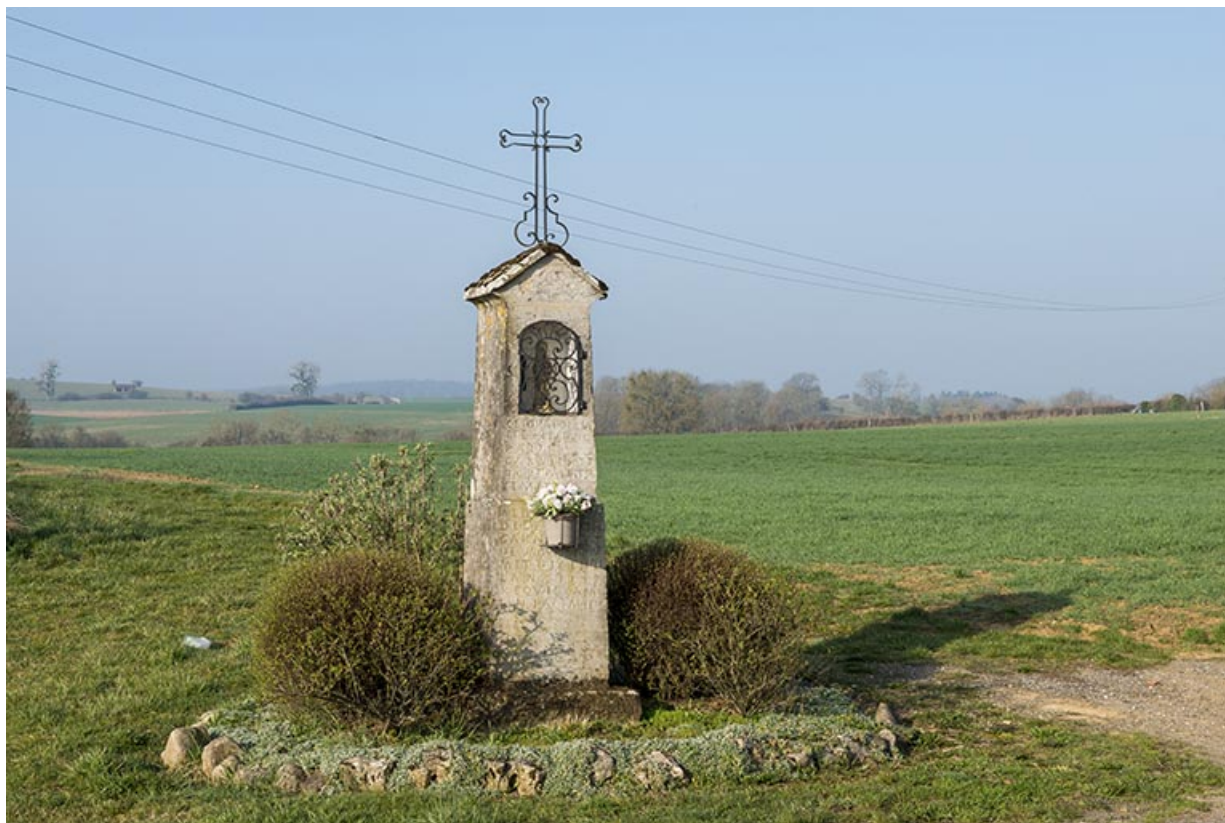
Oratoire situé à mi-chemin entre Gevigney et Mercey.