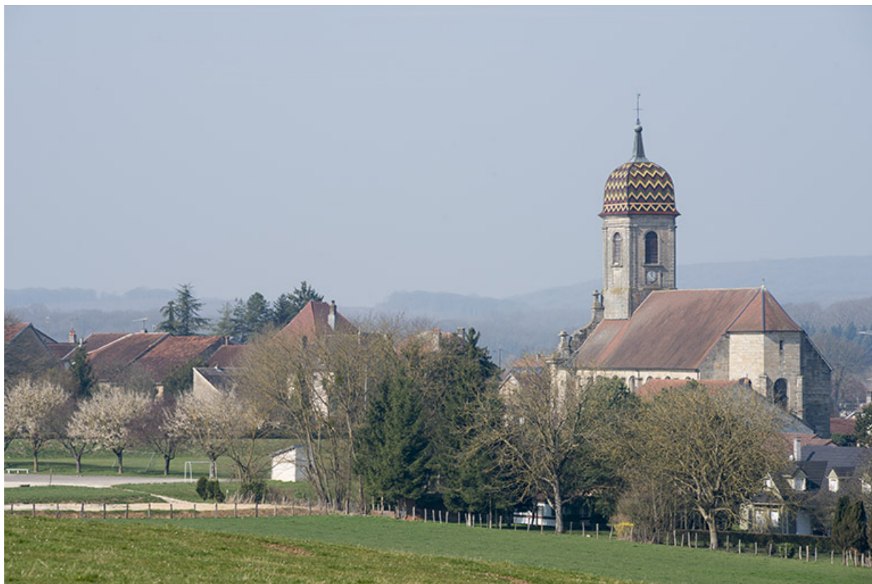
L'église de Gevigney-et-Mercey.