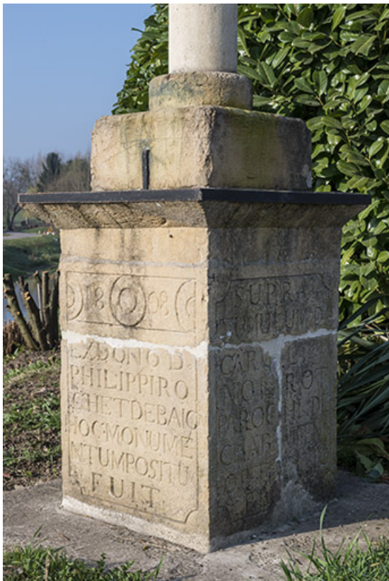
Détail du socle.