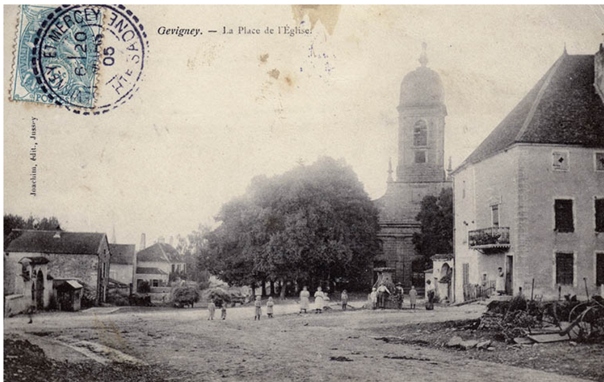
Place de l'église, carte postale (1905).