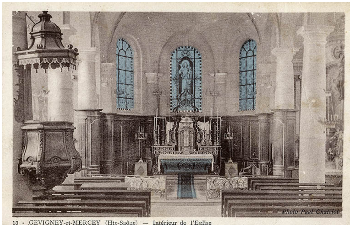
13 - GEVIGNEY-et-MERCEY (Hte-Saône) — Intérieur de l'Eglise