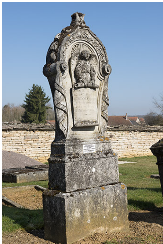
Stèle dans le cimetière.