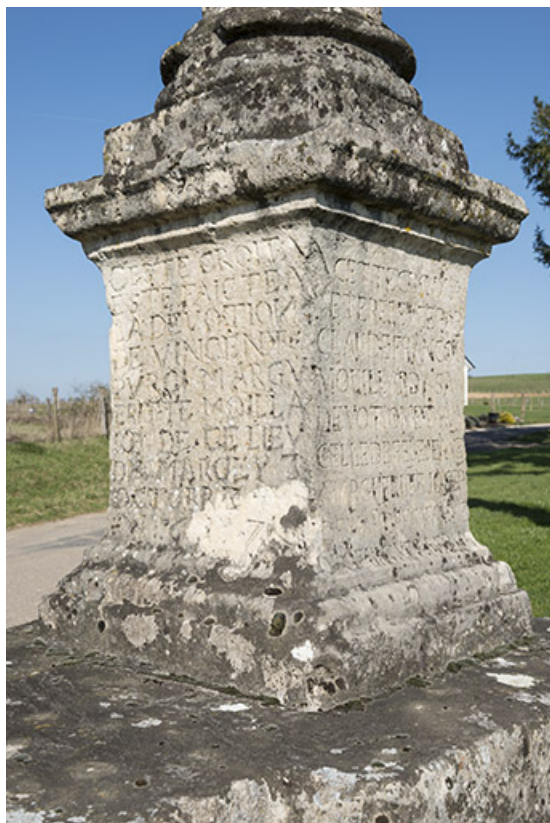
Détail sur les inscriptions.