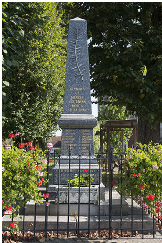
Le monument aux morts.