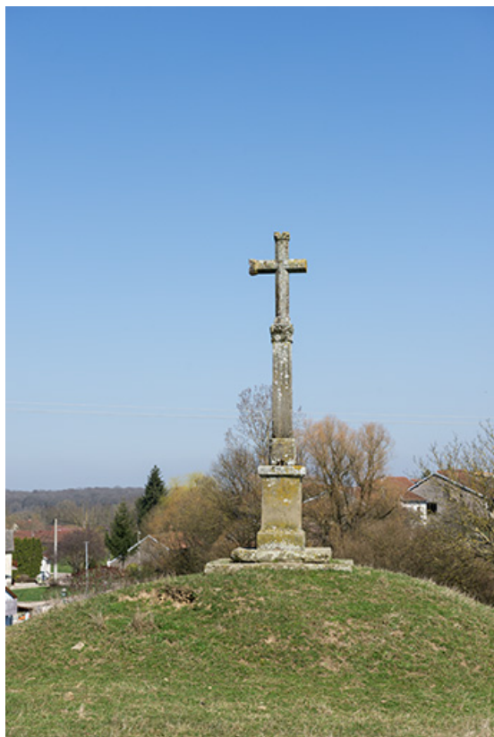
Croix près du village de Gevigney.