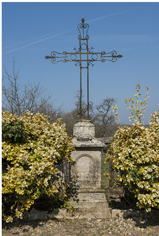
Croix avec socle en pierre et partie haute en fer forgé. 70, Gevigney-et-Mercey