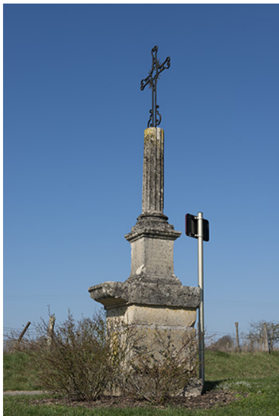
Croix de chemin à Mercey.