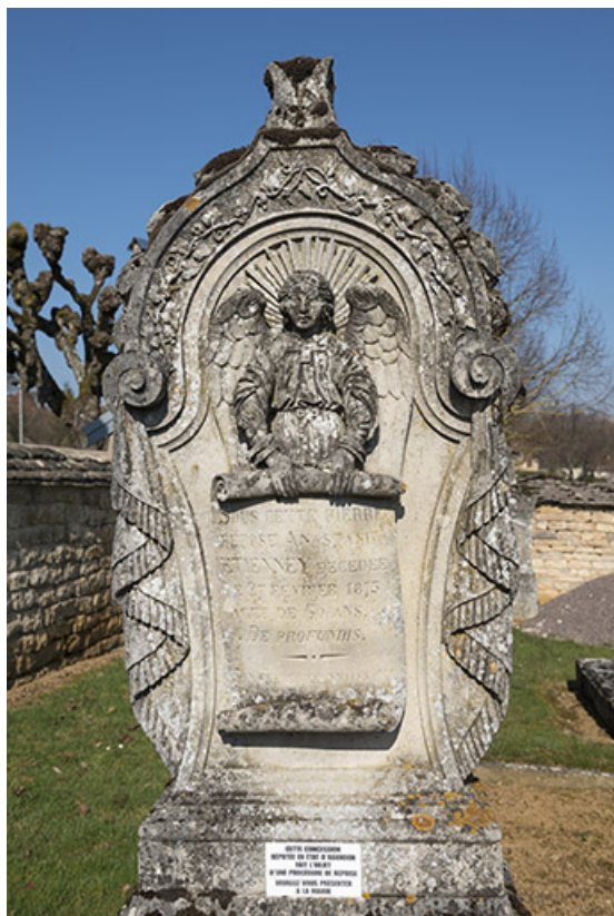
Détail de la stèle.