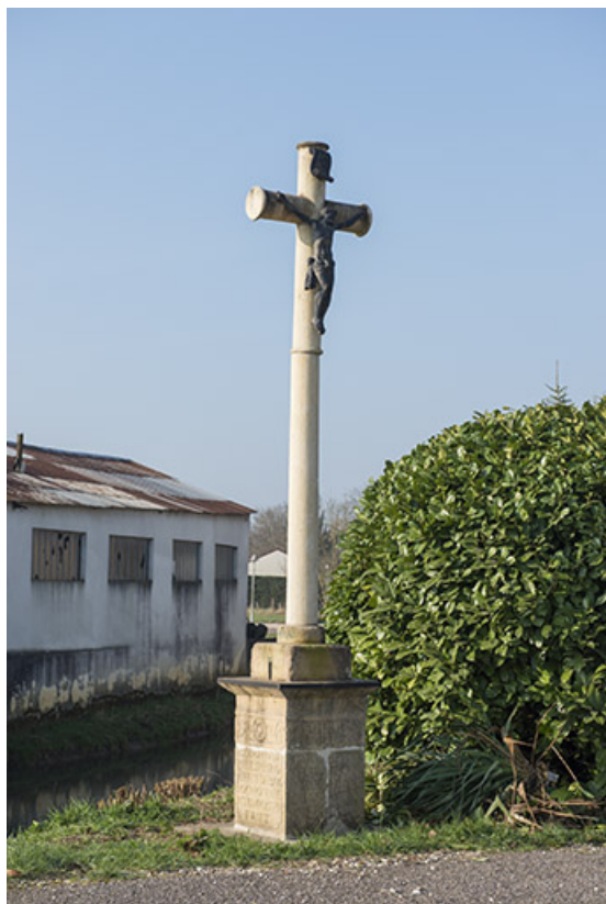
Croix de chemin.