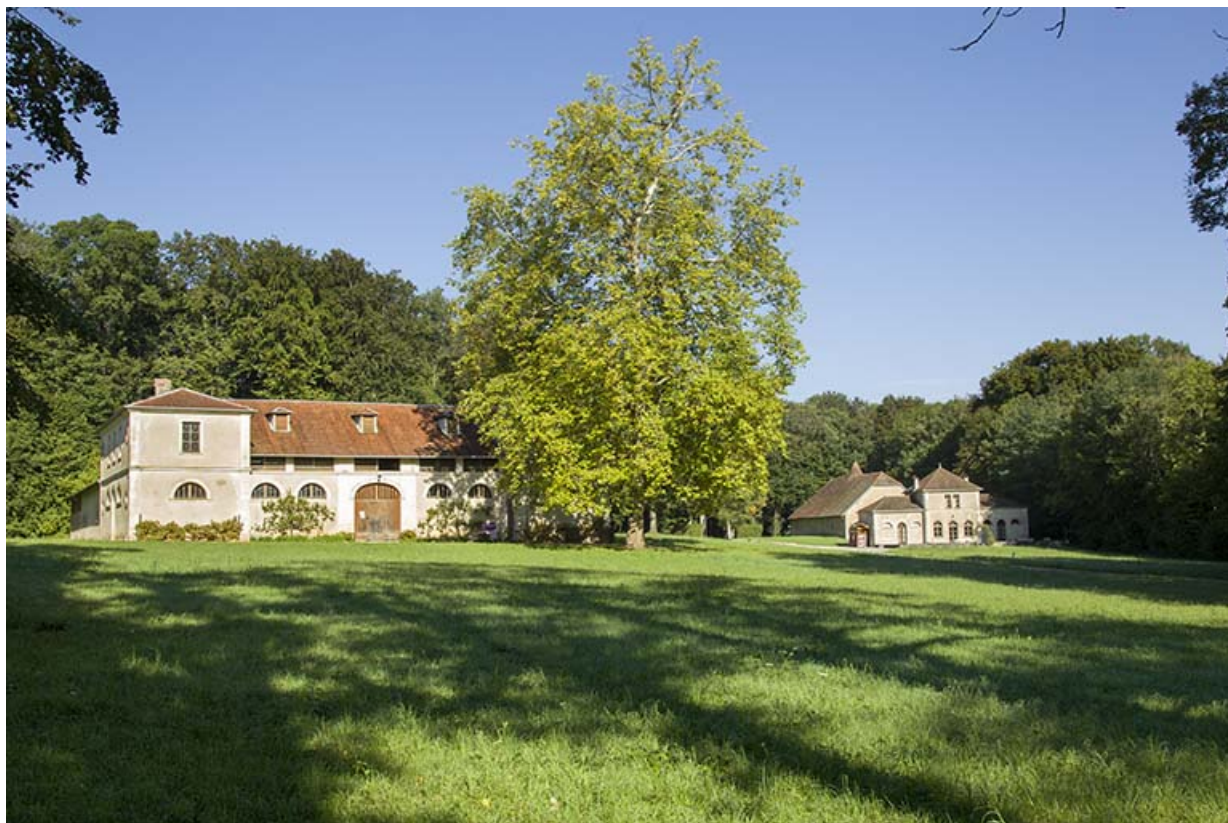
Vue générale de la ferme, du chenil et du cuvage depuis le parc.