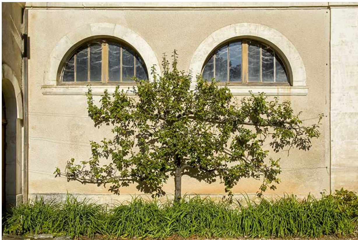
Détail de la façade antérieure au sud-est : deux baies en demi-cercle.