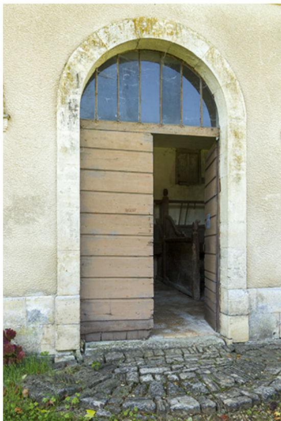
Ecurie, façade nord-est : la porte.