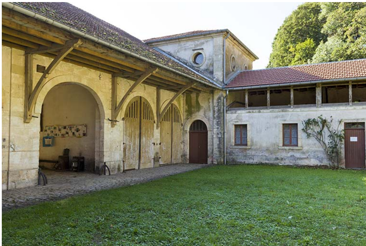
Revers du corps principal, angle sud.