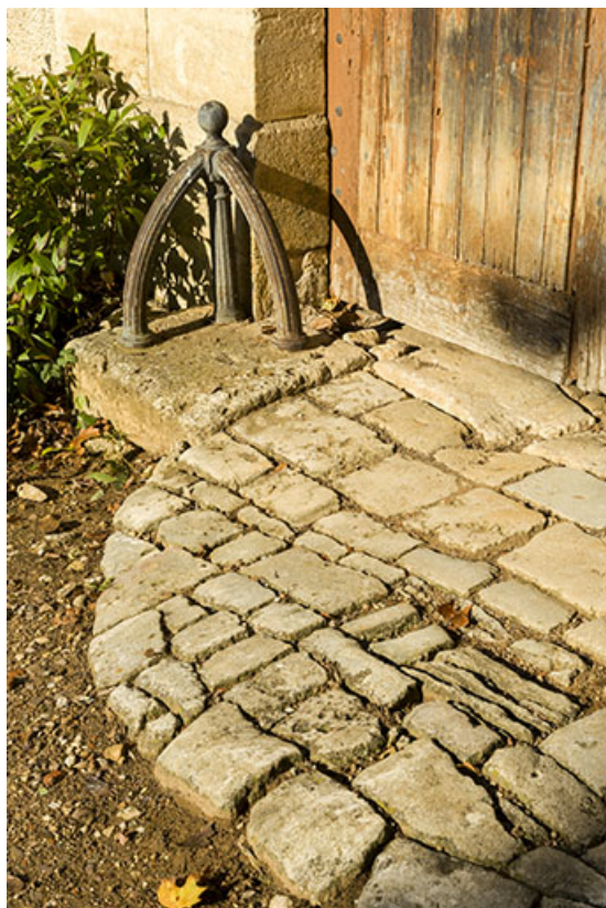
Travée du corps principal : détail du chasse-roue et du pavage.