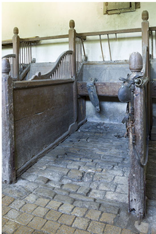
Intérieur de l'écurie : vue d'une stalle.