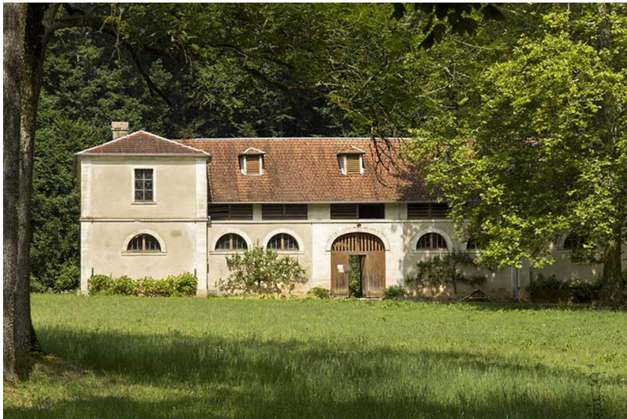
Façade antérieure de la ferme.