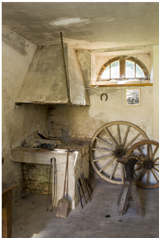
Aile sud-ouest : la forge.