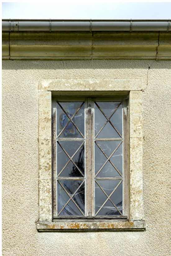
Etable, façade sud-ouest : détail d'une des baies du 1er étage.