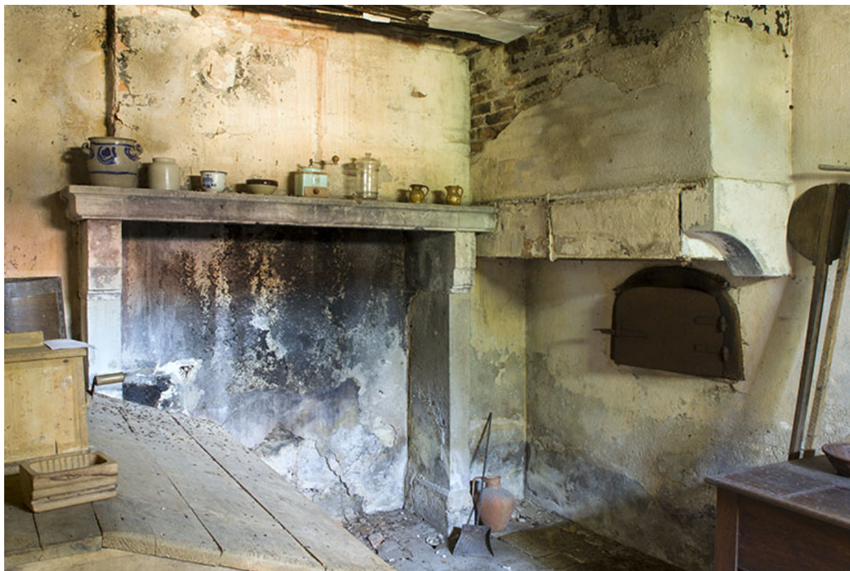
Aile sud-ouest : ancienne cuisine et son four à pain.