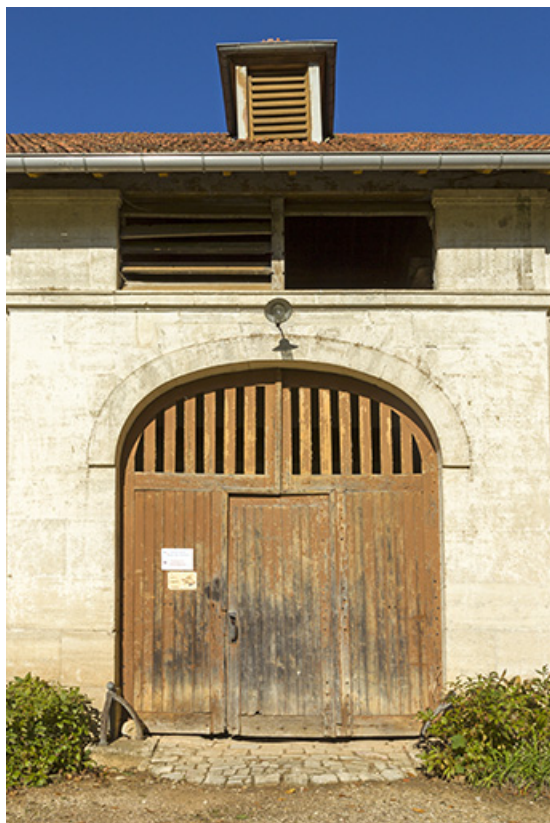
Détail de la façade antérieure au sud-est : la travée du porche.