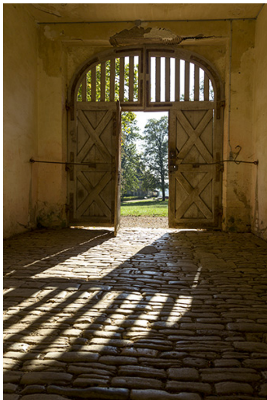
Le porche de la ferme depuis la cour.