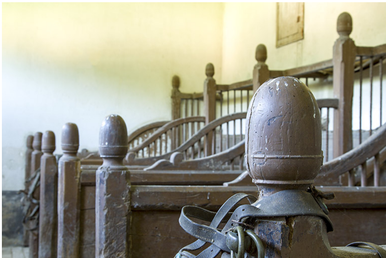
Intérieur de l'écurie : le décor des cloisons des stalles.