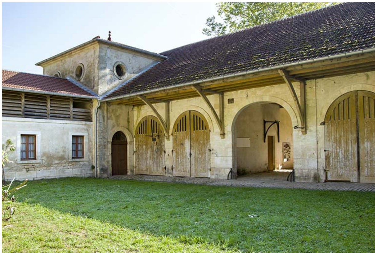
Revers du corps principal depuis la cour : angle est.