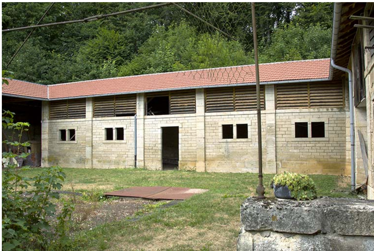
Vue générale de la bergerie, aile nord-ouest. 70, Rupt-sur-Saône, 5 rue de la Garenne