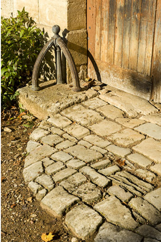
Travée du corps principal : détail du chasse-roue et du pavage.