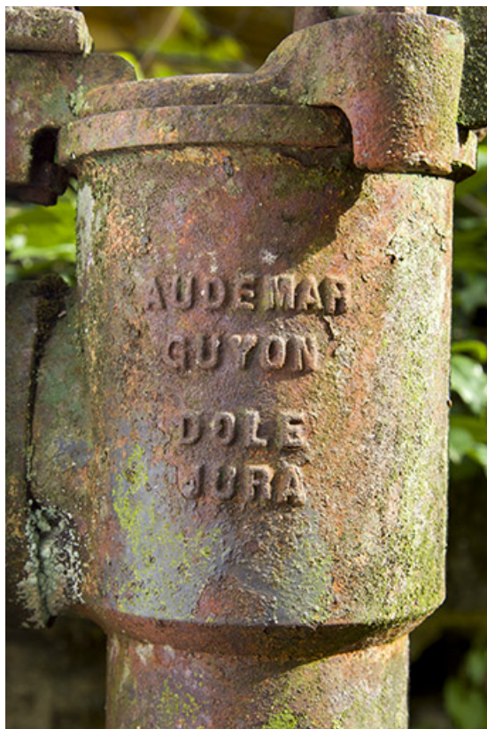
Pompe à eau : inscription concernant le fabricant (Audemar Guyon à Dole, Jura). 70, Rupt-sur-Saône, 5 rue de la Garenne