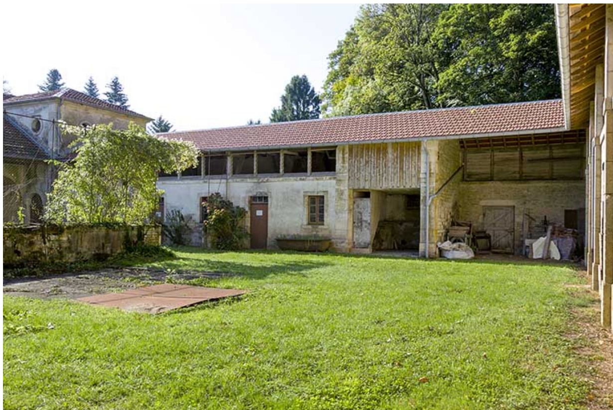
Vue générale de l'aile sud-ouest, côté cour.