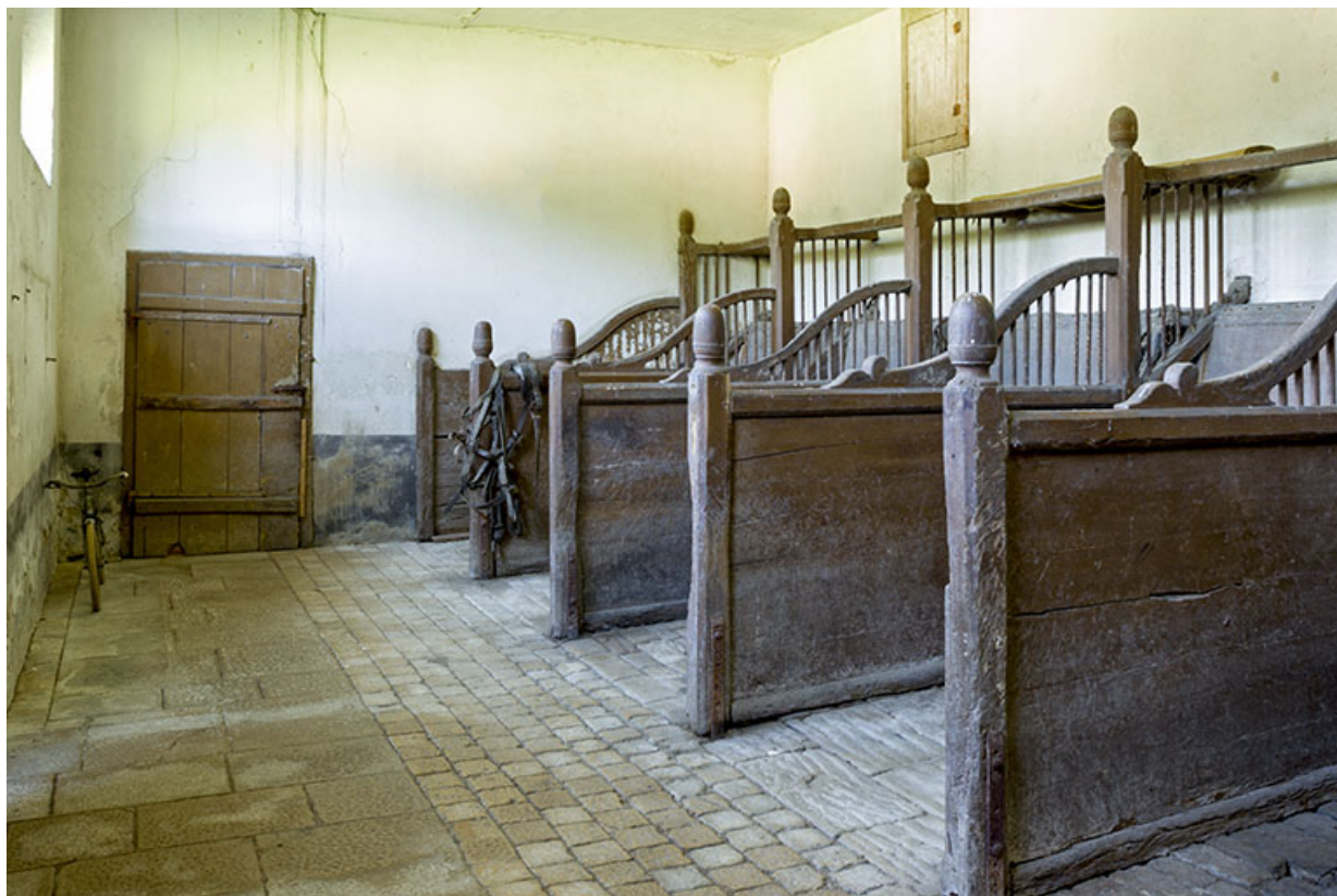
Intérieur de l'écurie : vue générale des stalles.