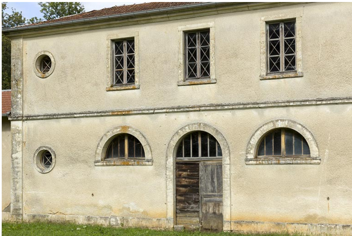
Etable : vue générale de la façade sud-ouest.