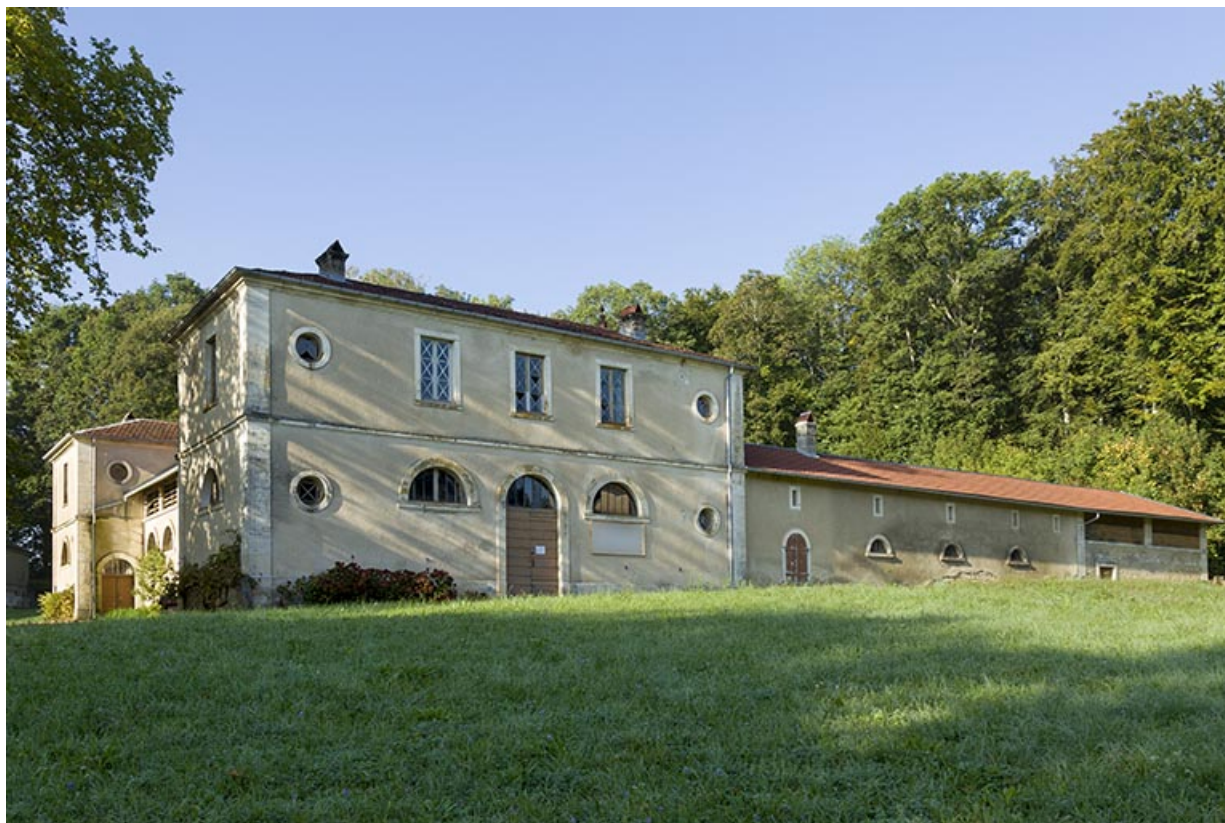
Ecurie : façade nord-est.