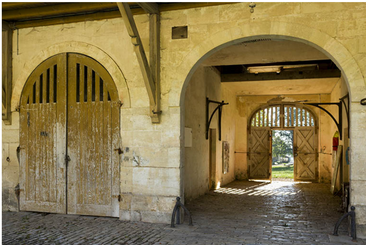
Revers du corps principal depuis la cour : le porche et le passage couvert. 70, Rupt-sur-Saône, 5 rue de la Garenne