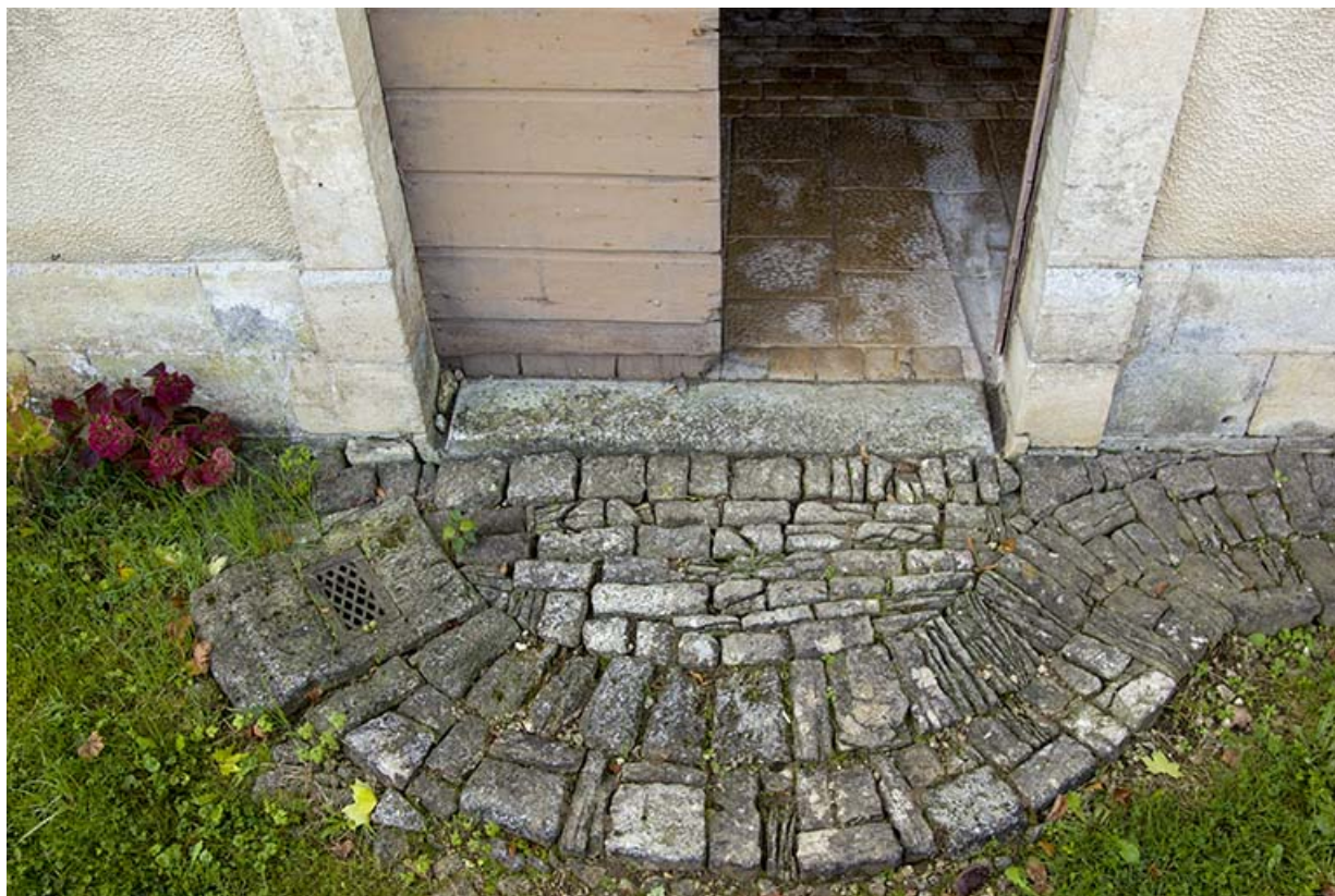
Ecurie, façade nord-est : le pavement devant la porte.