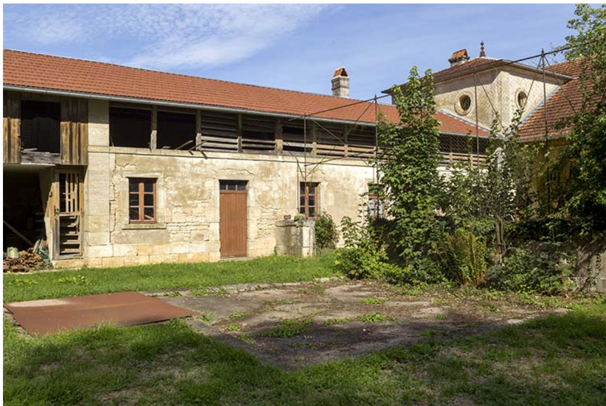
Aile nord-est depuis la cour : ancien logis des fermiers.