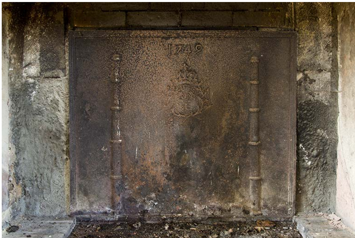
Plaque de cheminée en réemploi portant la date 1749 et des armoiries (non identifiées).