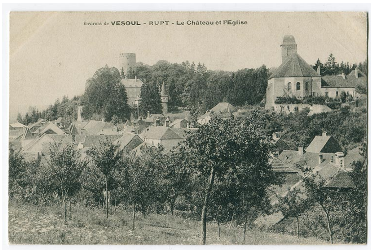
Environs de Vesoul - Rupt - Le château et l'église, 4e quart 19e siècle ou 1er quart 20e siècle ? 70, Rupt-sur-Saône, 5 rue de la Garenne