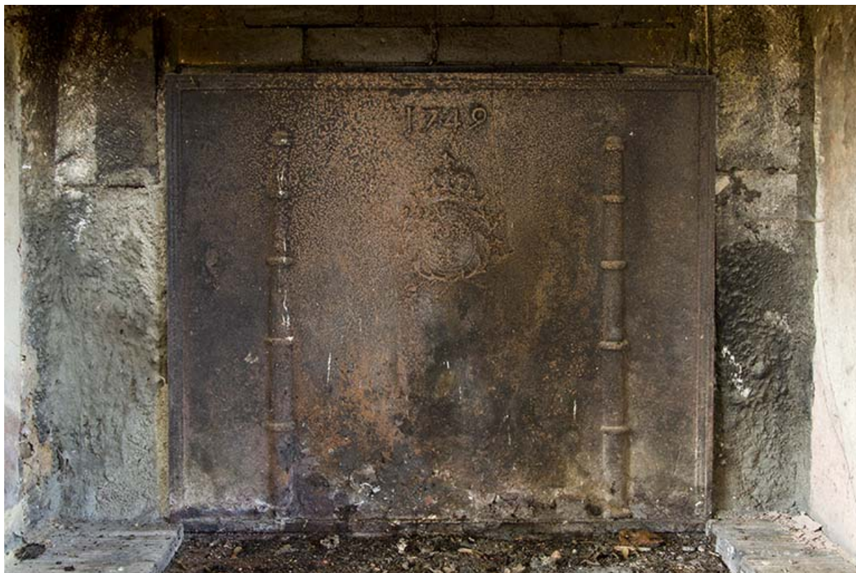
Plaque de cheminée en réemploi portant la date 1749 et des armoiries (non identifiées).