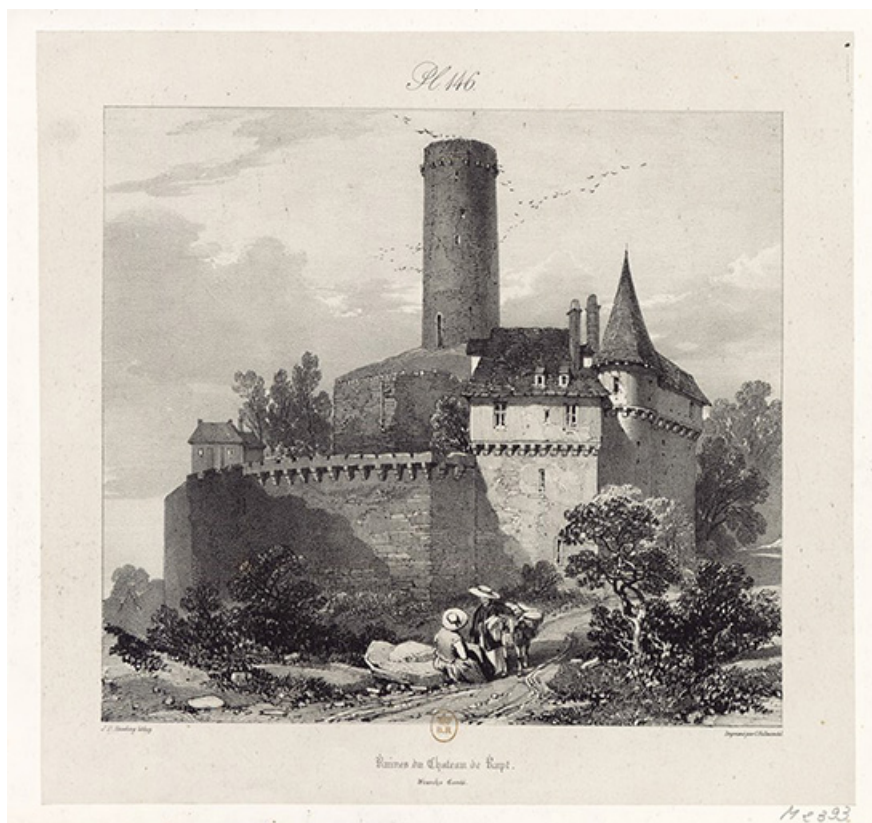
Ruines du château de Rupt. Franche-Comté, 1825.