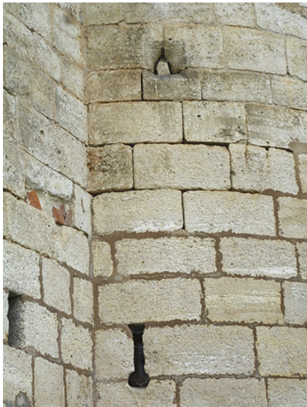
Canonnière du 15e siècle à la base de la tourelle exposée au nord-est. 70, Rupt-sur-Saône, 5 rue de la Garenne