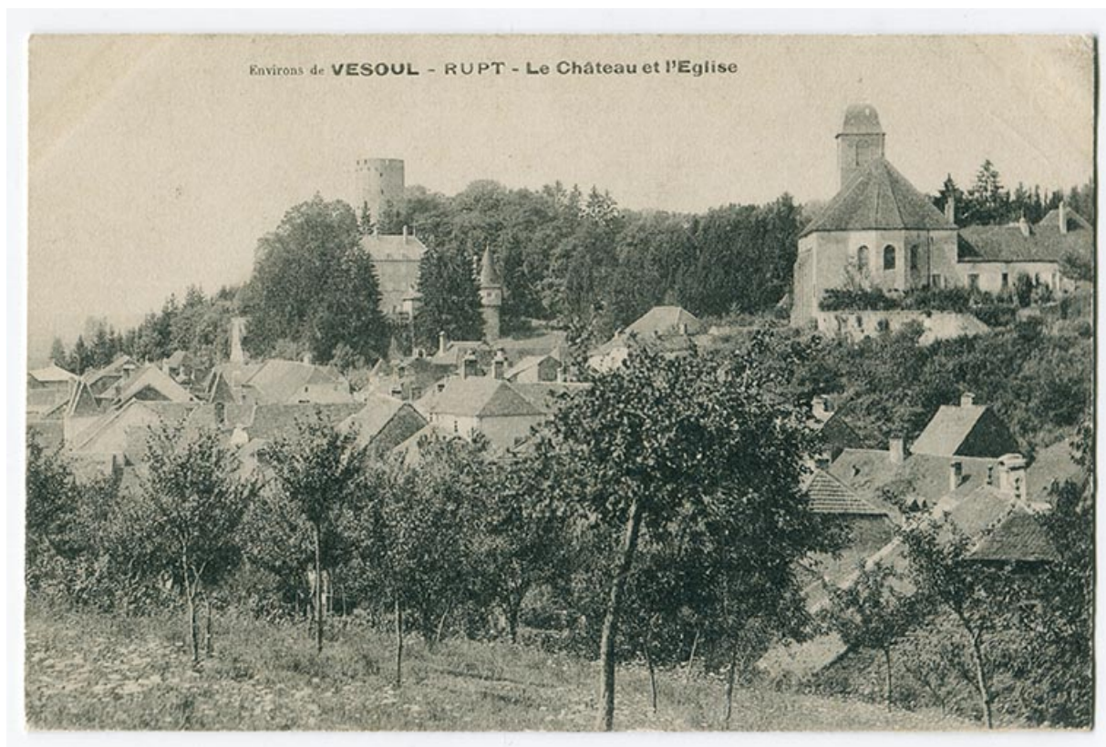
Environs de Vesoul - Rupt - Le château et l'église, 4e quart 19e siècle ou 1er quart 20e siècle ?