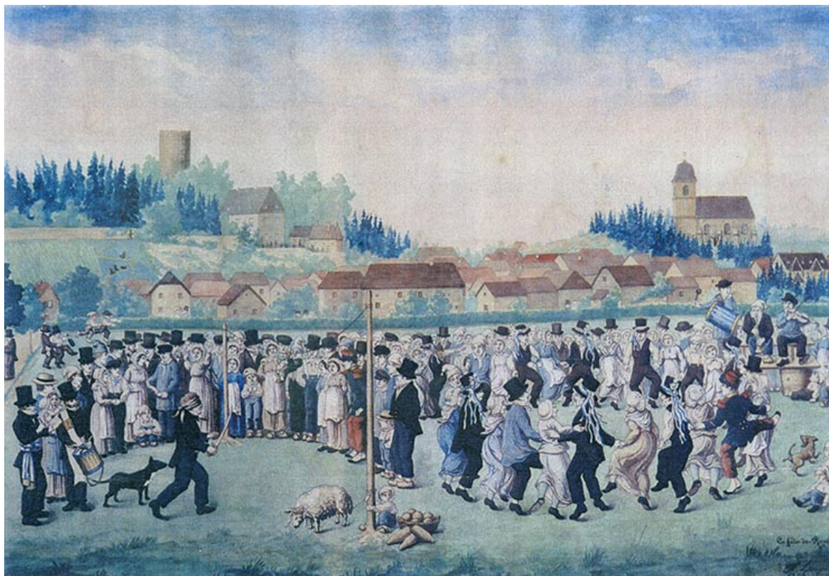
La fête de Rupt [vue générale depuis le sud], 1860. 70, Rupt-sur-Saône