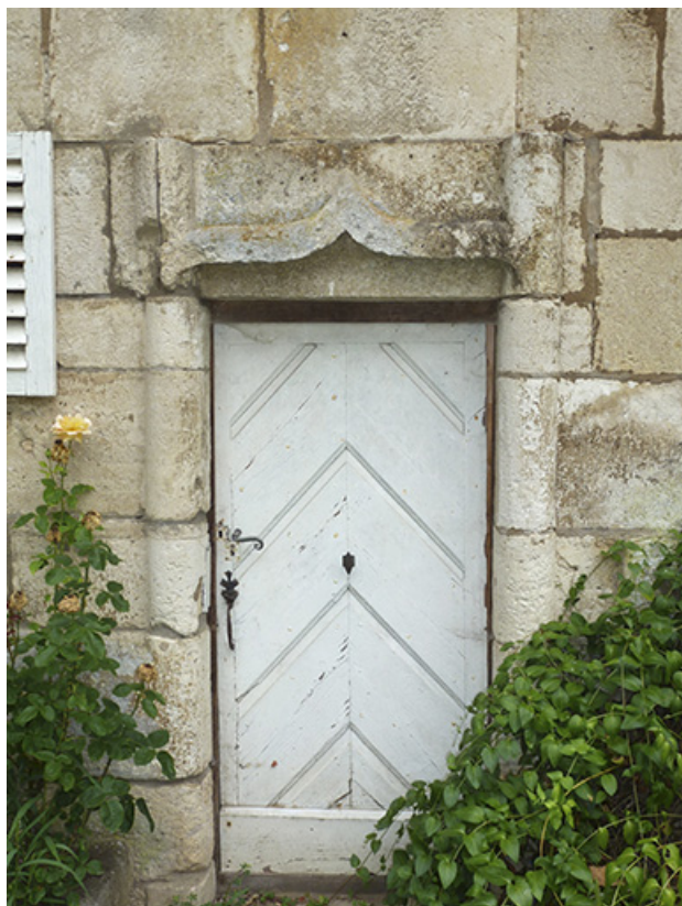
Détail : la porte ouvrant sur l'escalier en vis.