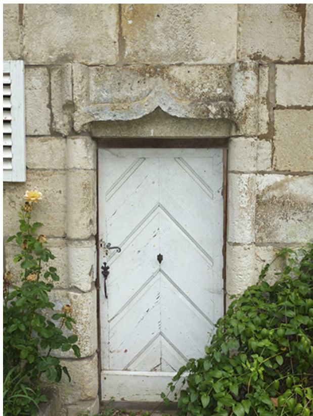
Détail : la porte ouvrant sur l'escalier en vis.