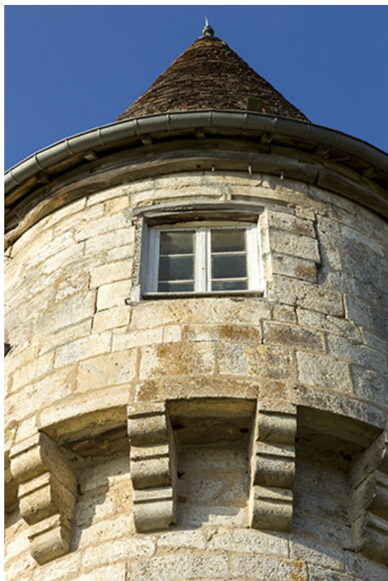
Détail : la tourelle.