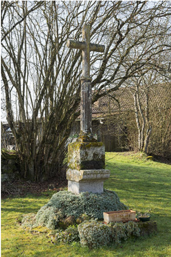
Croix de chemin.