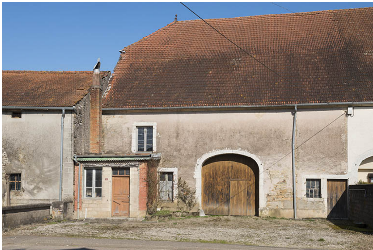
Ferme, rue principale.