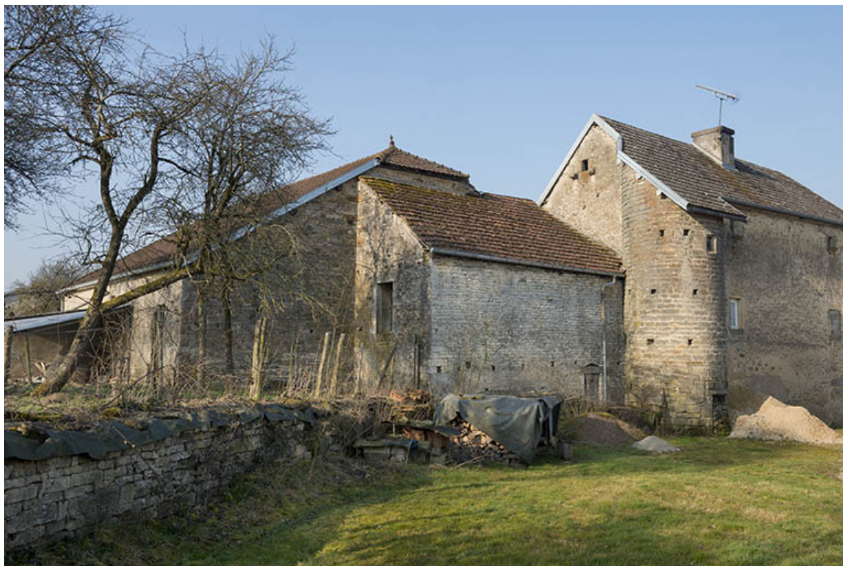
Façade postérieure de la ferme avec une tour contenant un escalier. 70, Gevigney-et-Mercey