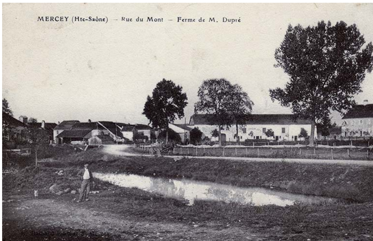
La ferme de l'ancienne château de Mercey, carte postale.