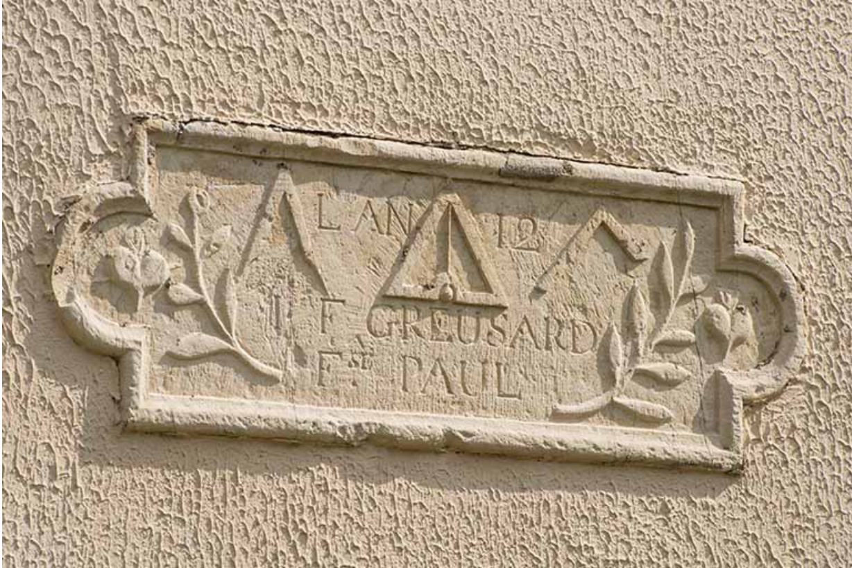
Pierre de fondation d'une ferme, rue du Mont.