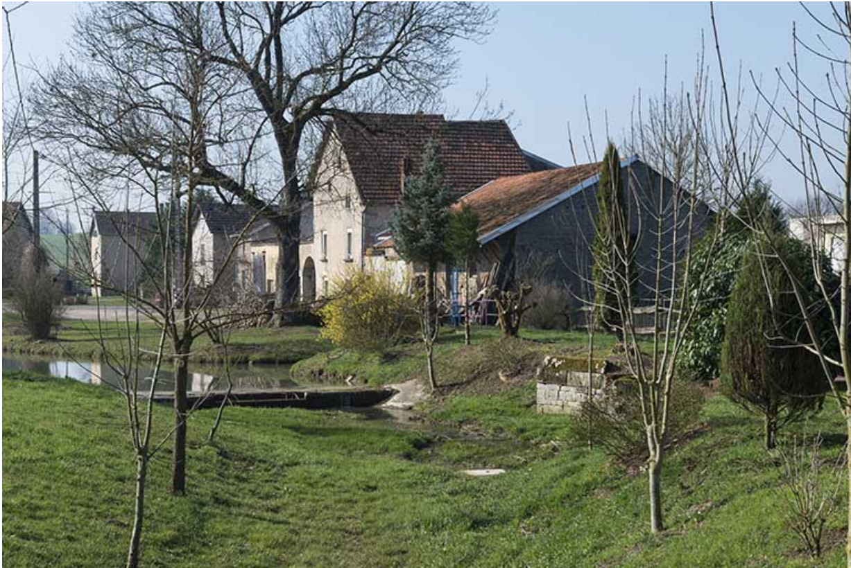
Maisons, rue du Mont. 70, Gevigney-et-Mercey