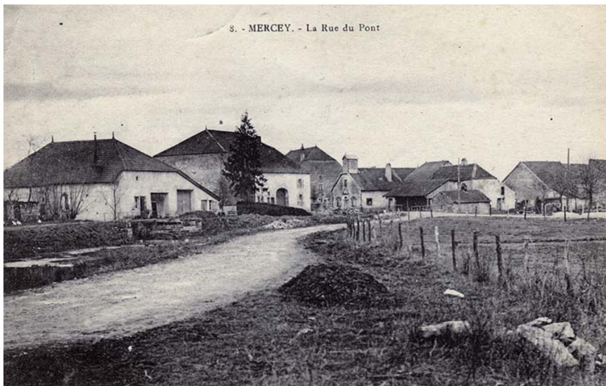
La rue du Mont, carte postale. 70, Gevigney-et-Mercey