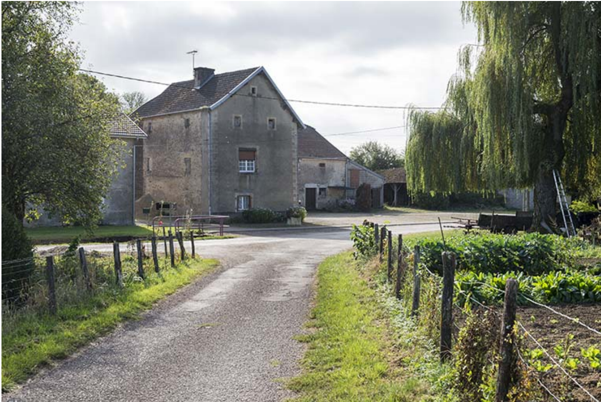
Vue depuis la rue de la Charlotte.