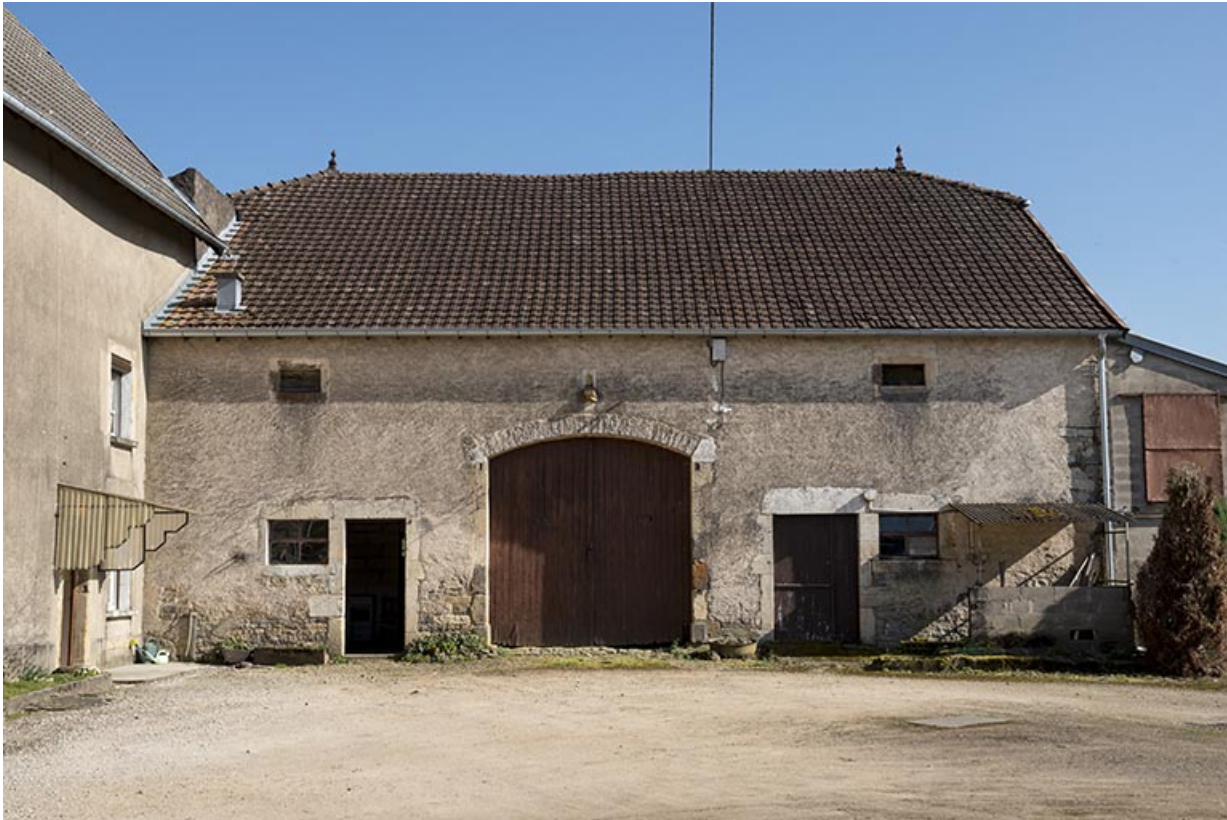
La grange attenante à la ferme.