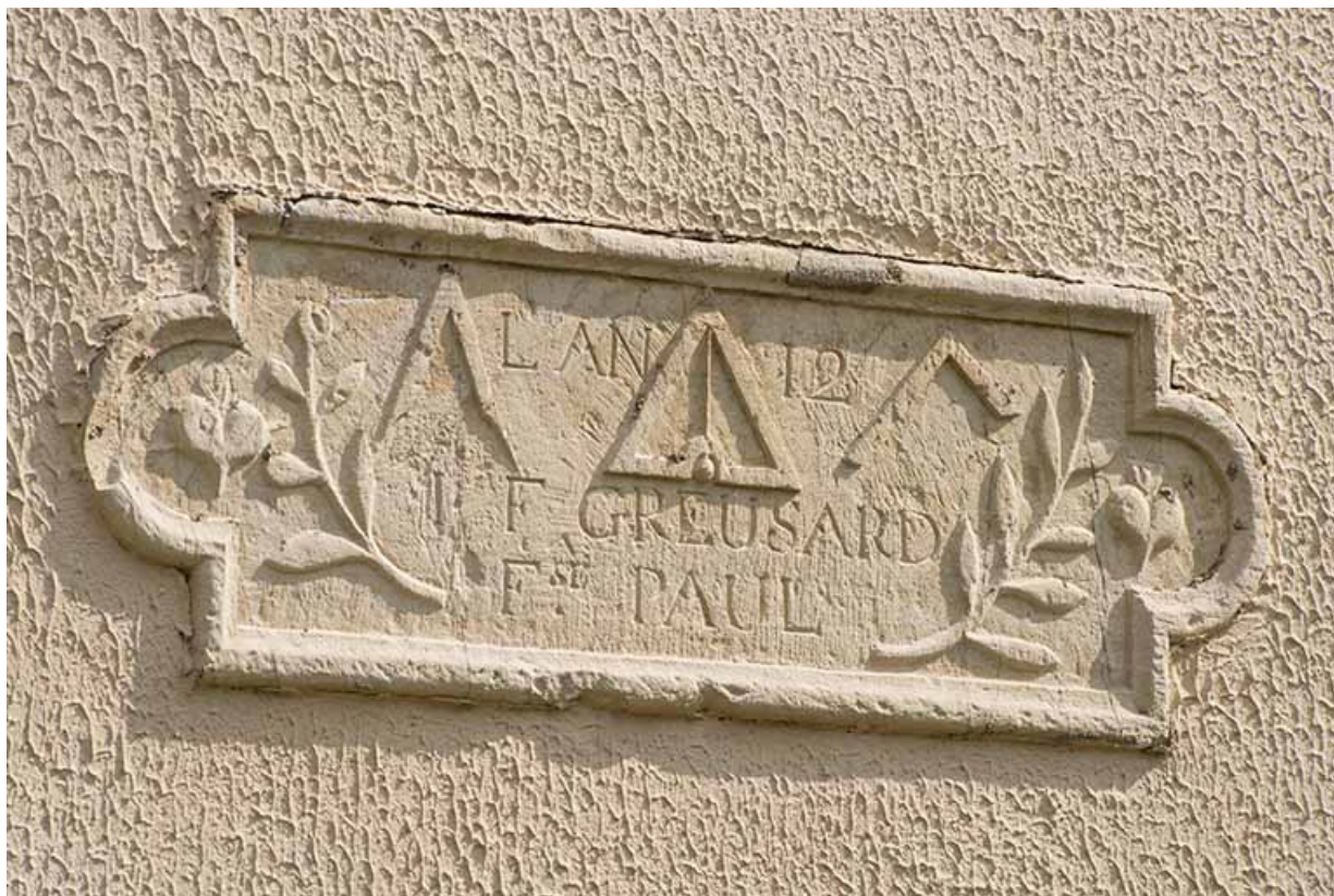
Pierre de fondation d'une ferme, rue du Mont. 70, Gevigney-et-Mercey