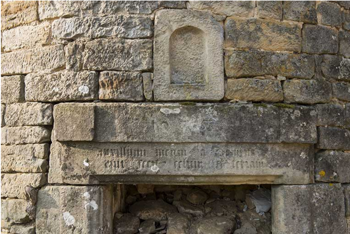
Niche située au bas de la tour.