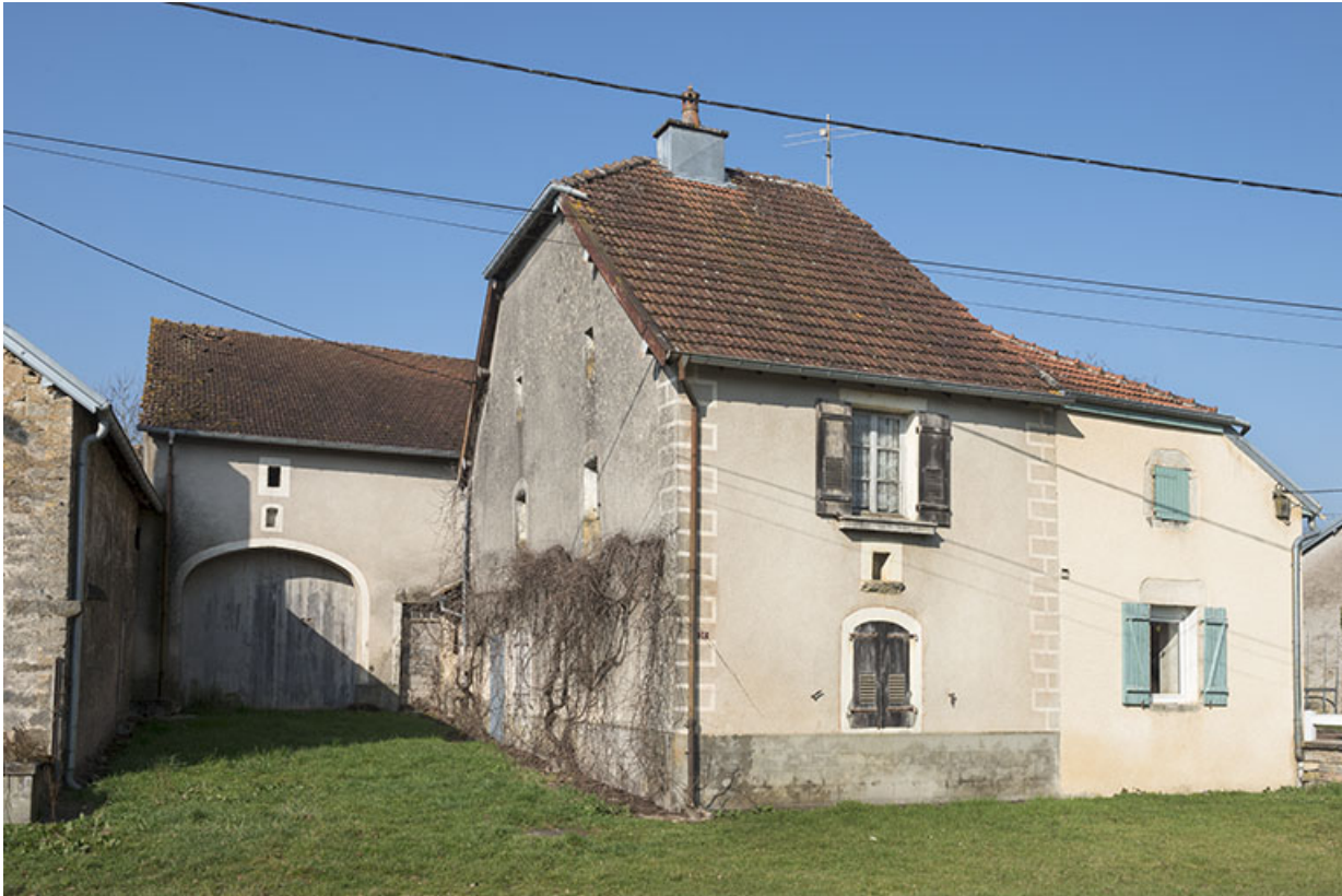
Ferme avec grange en retrait de la rue.