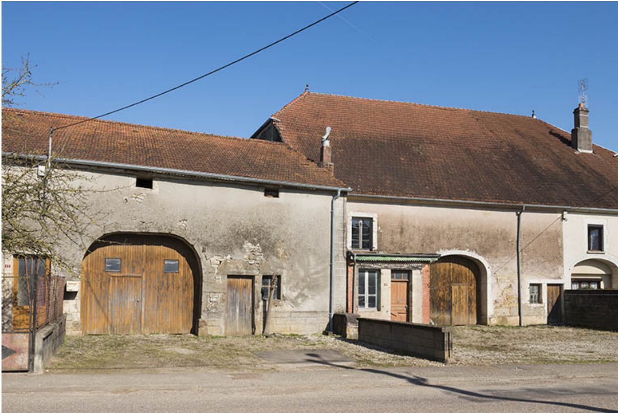
Fermes avec portes de grange.