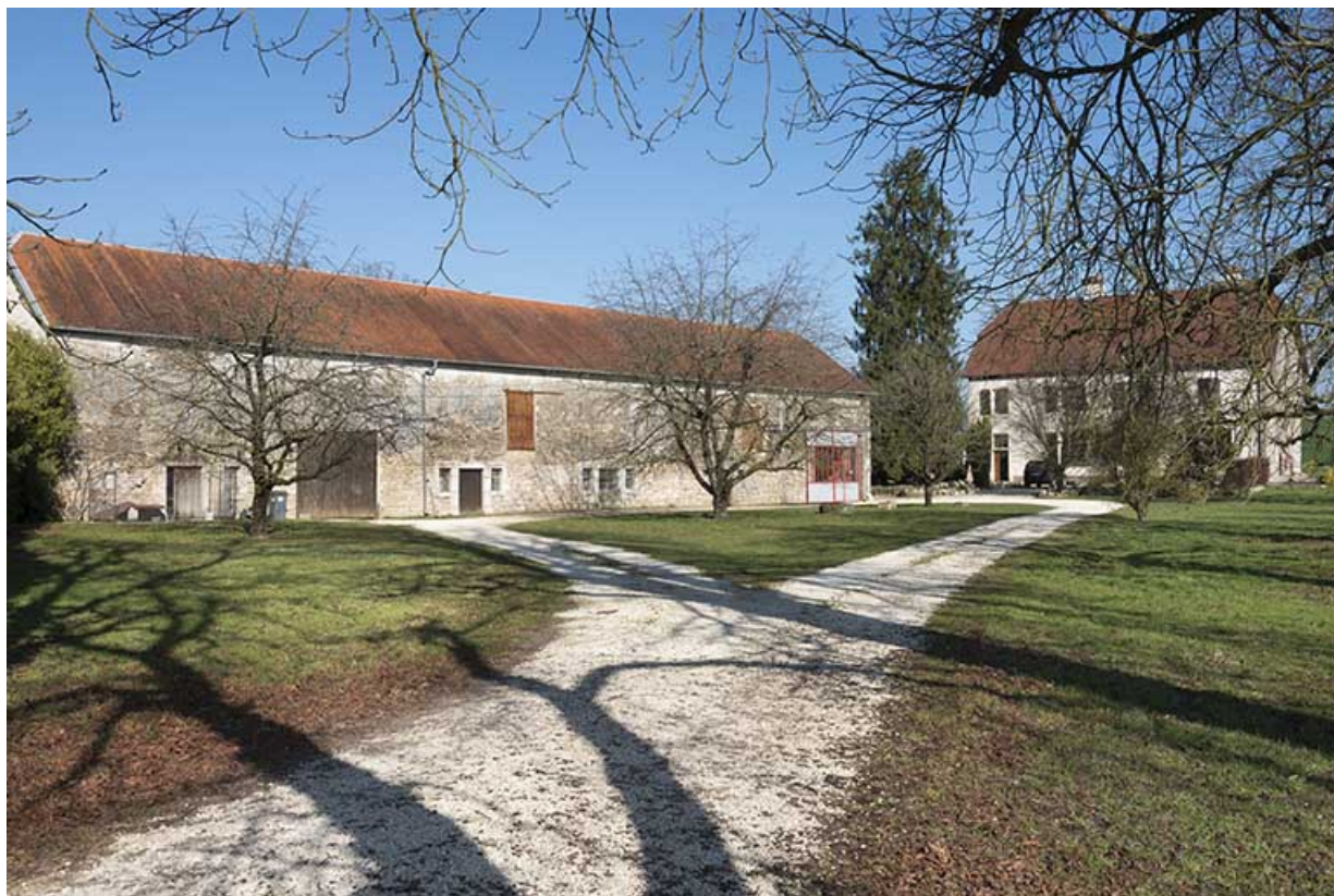
Site de l'ancien château reconstruit au 18e siècle.