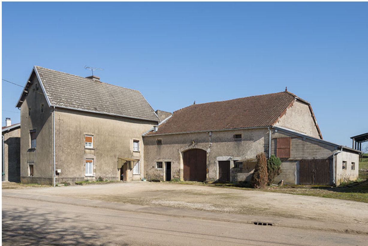
Ferme, rue de la Ruotte. 70, Gevigney-et-Mercey