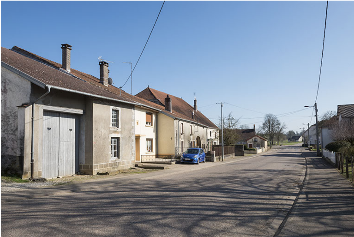
La rue principale.