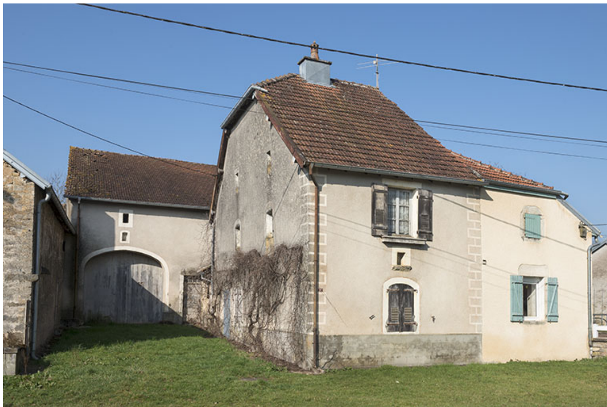
Ferme avec grange en retrait de la rue.