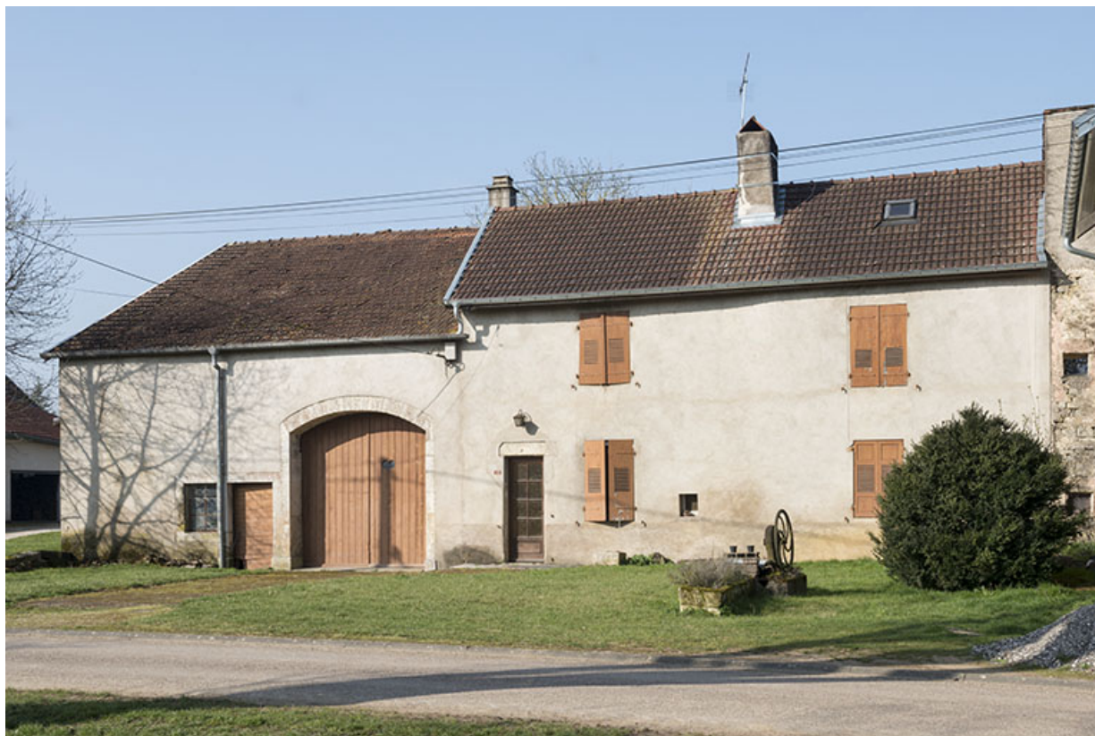
Ferme, rue du Mont. 70, Gevigney-et-Mercey