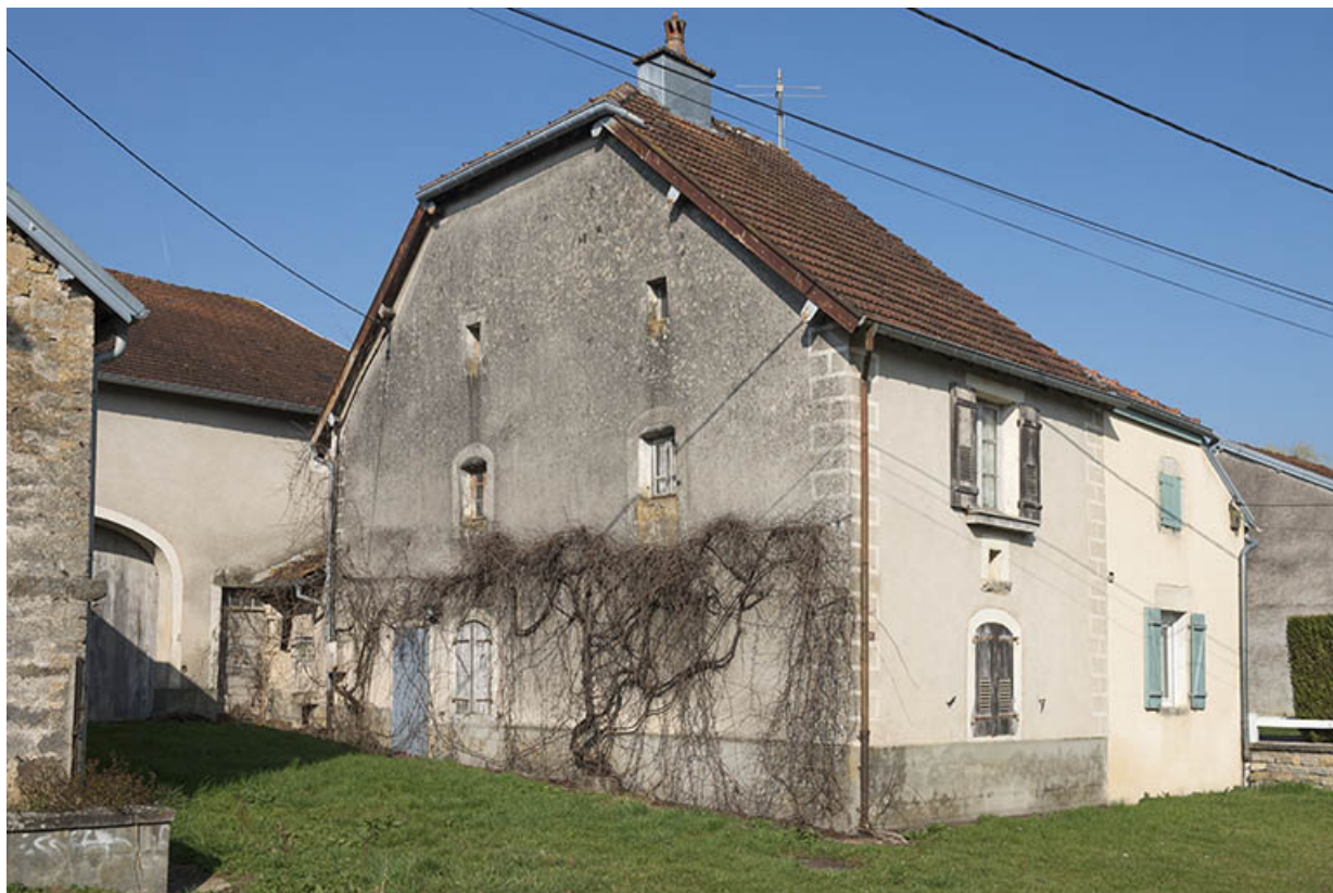
Vue sur l'usoir et la partie habitation.