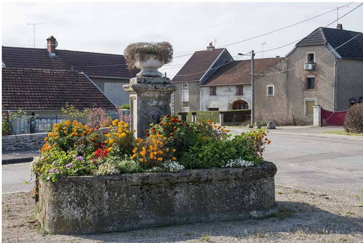
La fontaine à l'entrée de Mercey.