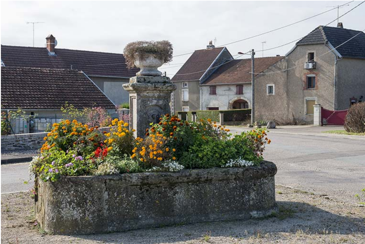
La fontaine à l'entrée de Mercey.