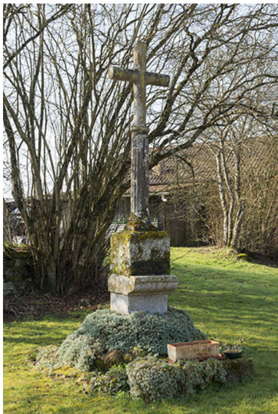
Croix de chemin.