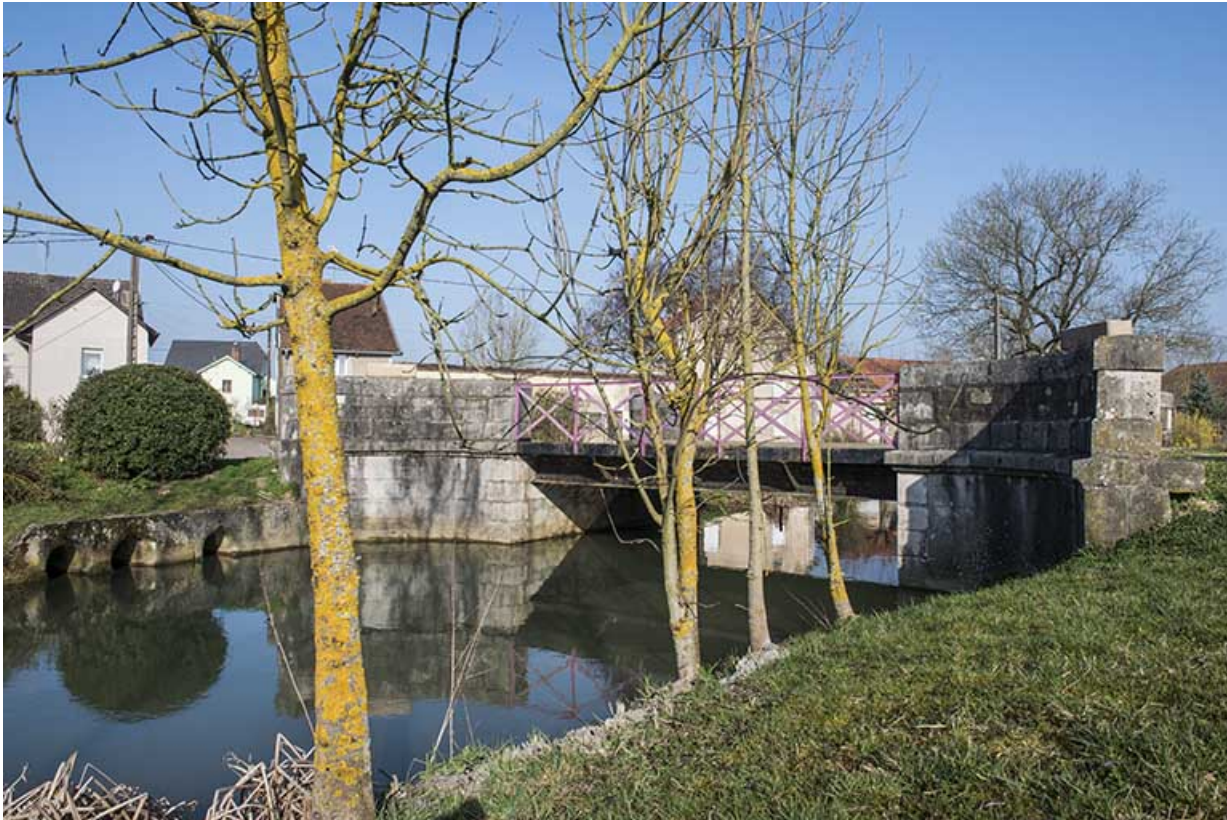
Le pont enjambant le ruisseau.