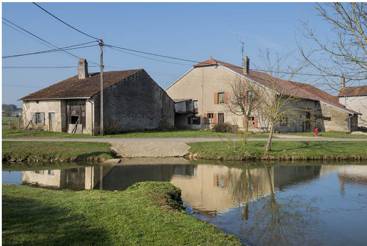
Ferme, rue du Mont.