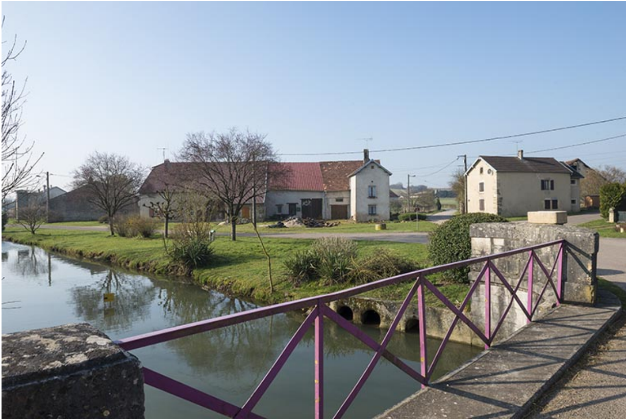
Mercey et le ruisseau Boncourt.