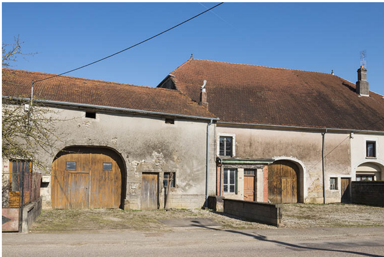
Ferme avec portes de grange.