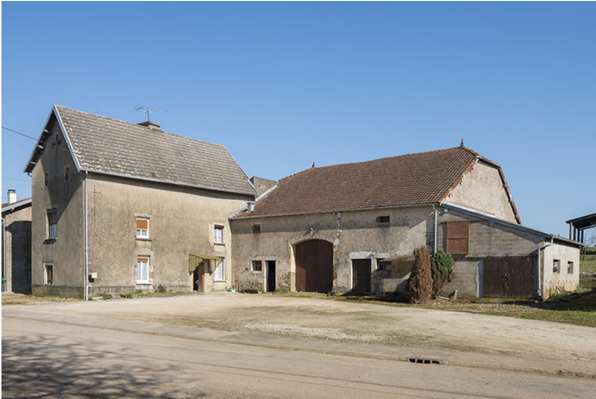
Ferme, rue de la Ruotte.