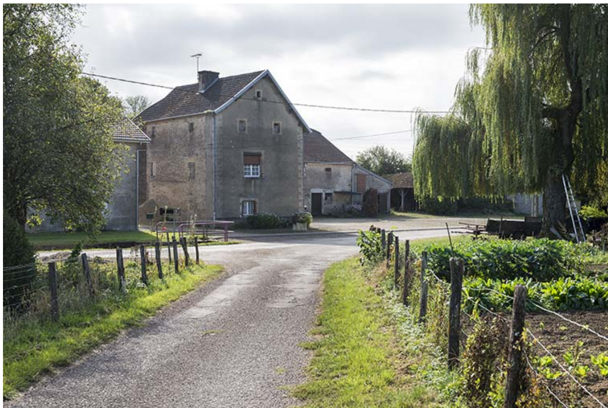
Vue depuis la rue de la Charlotte.