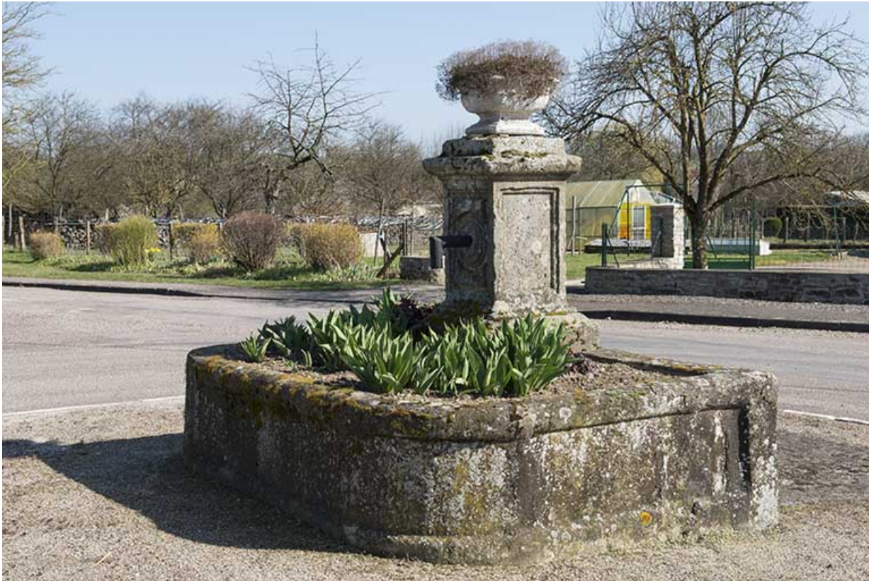
Le bassin maçonné de la fontaine.