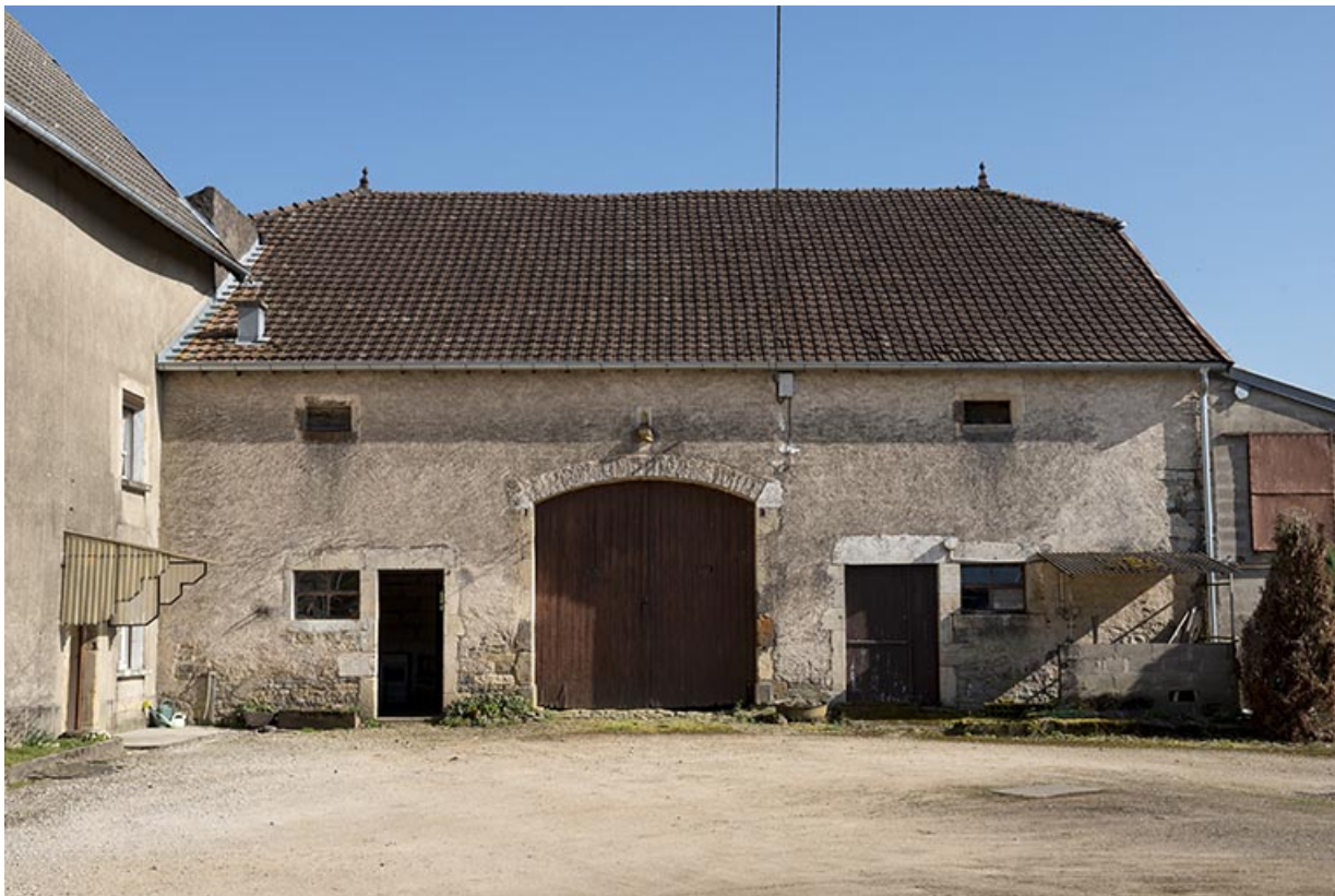
La grange attenante à la ferme.