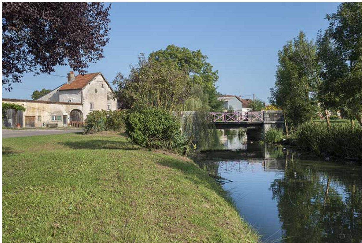
Le ruisseau Boncourt.