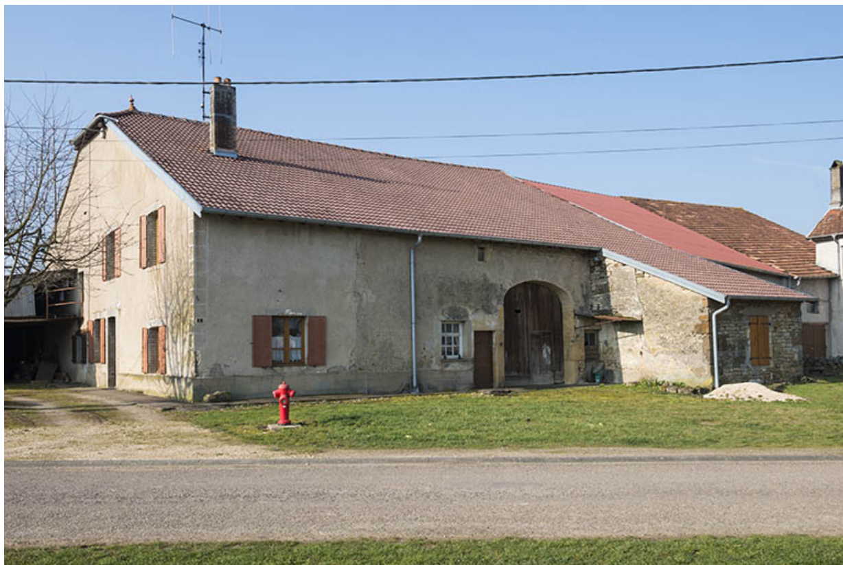
Ferme, rue du Mont.