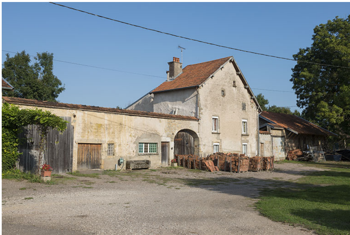
Maison d'une probable ancienne tuilerie.