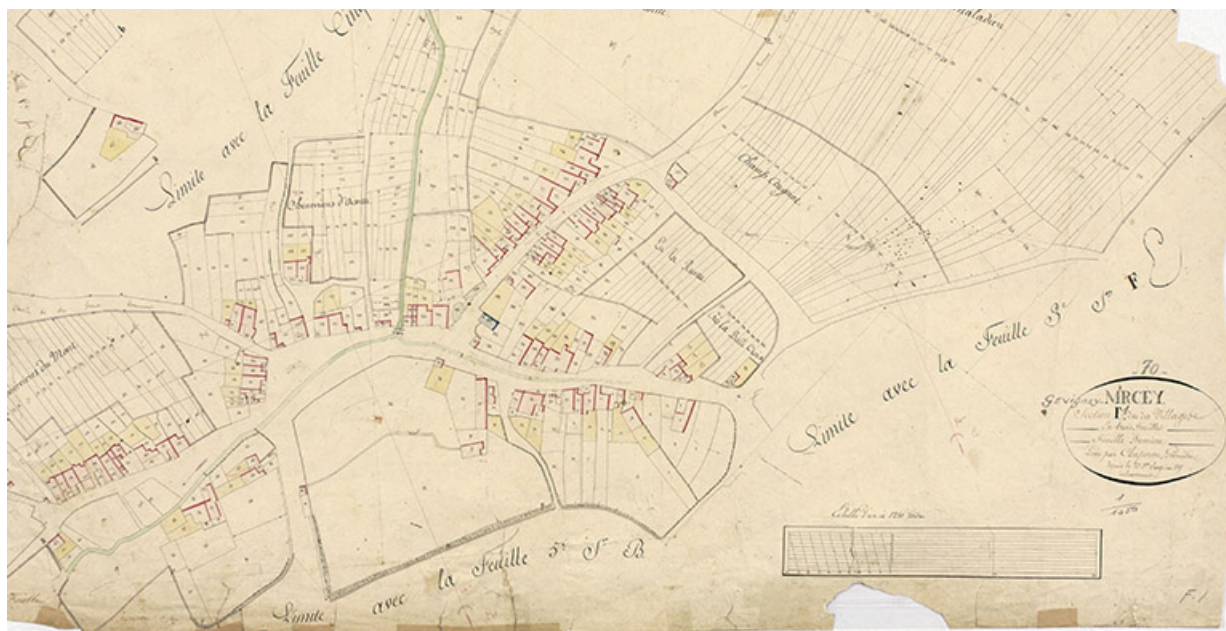
Plan du village extrait du plan cadastral, 1826.