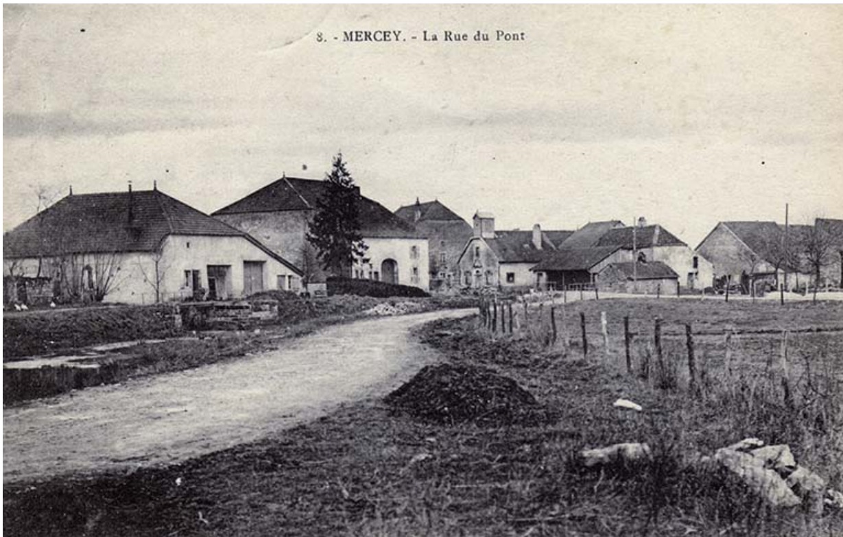
La rue du Mont, carte postale. 70, Gevigney-et-Mercey

Mercey - La rue du Pont, carte postale, sd. Lieu de conservation : Collection particulière