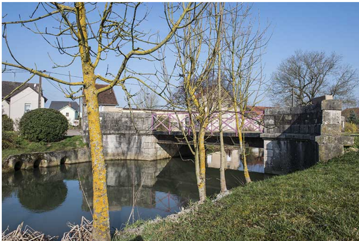
Le pont enjambant le ruisseau.