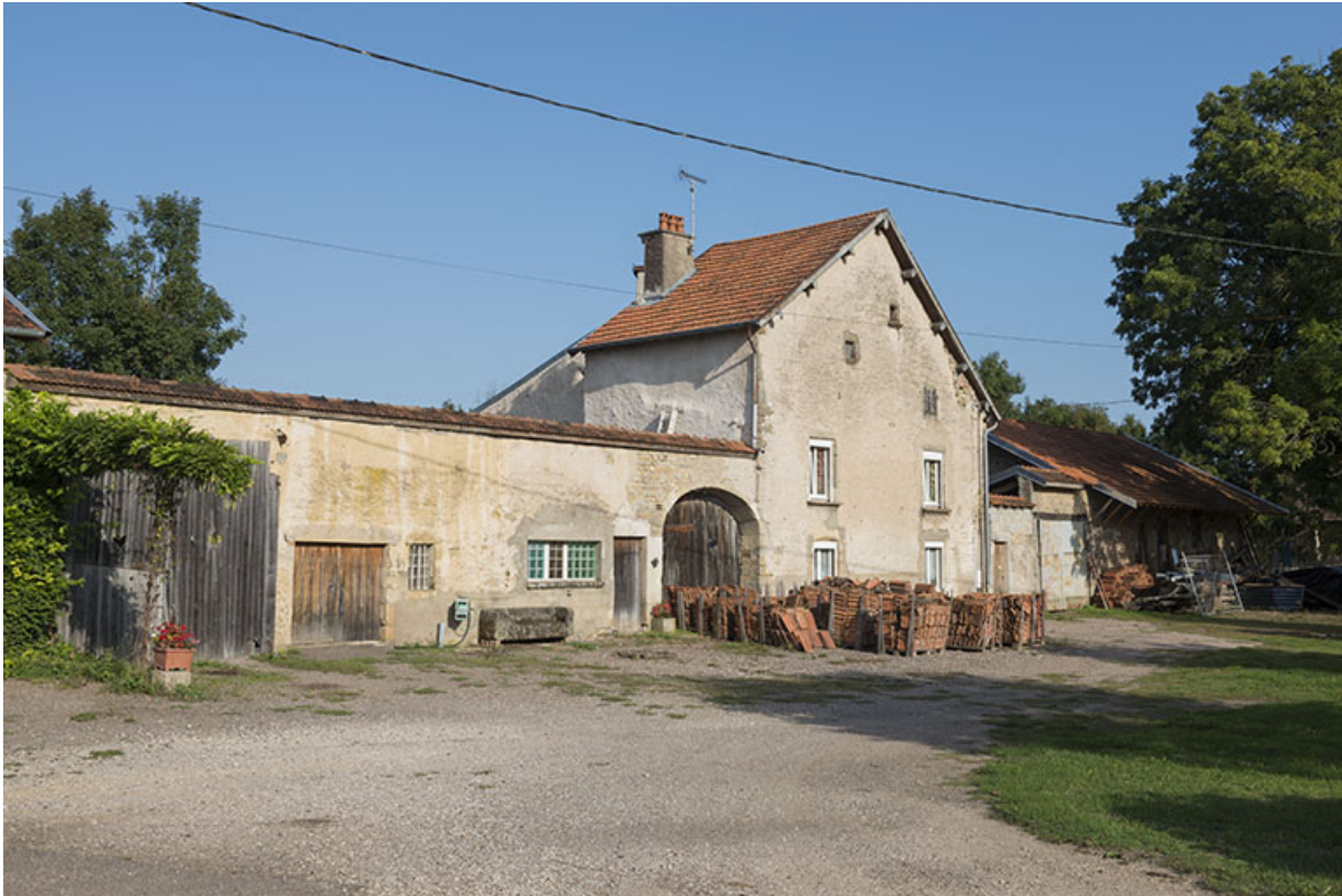
Maison d'une probable ancienne tuilerie.