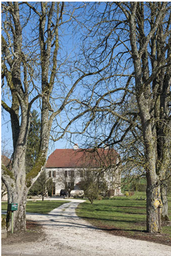
La demeure abritant l'ancien château.