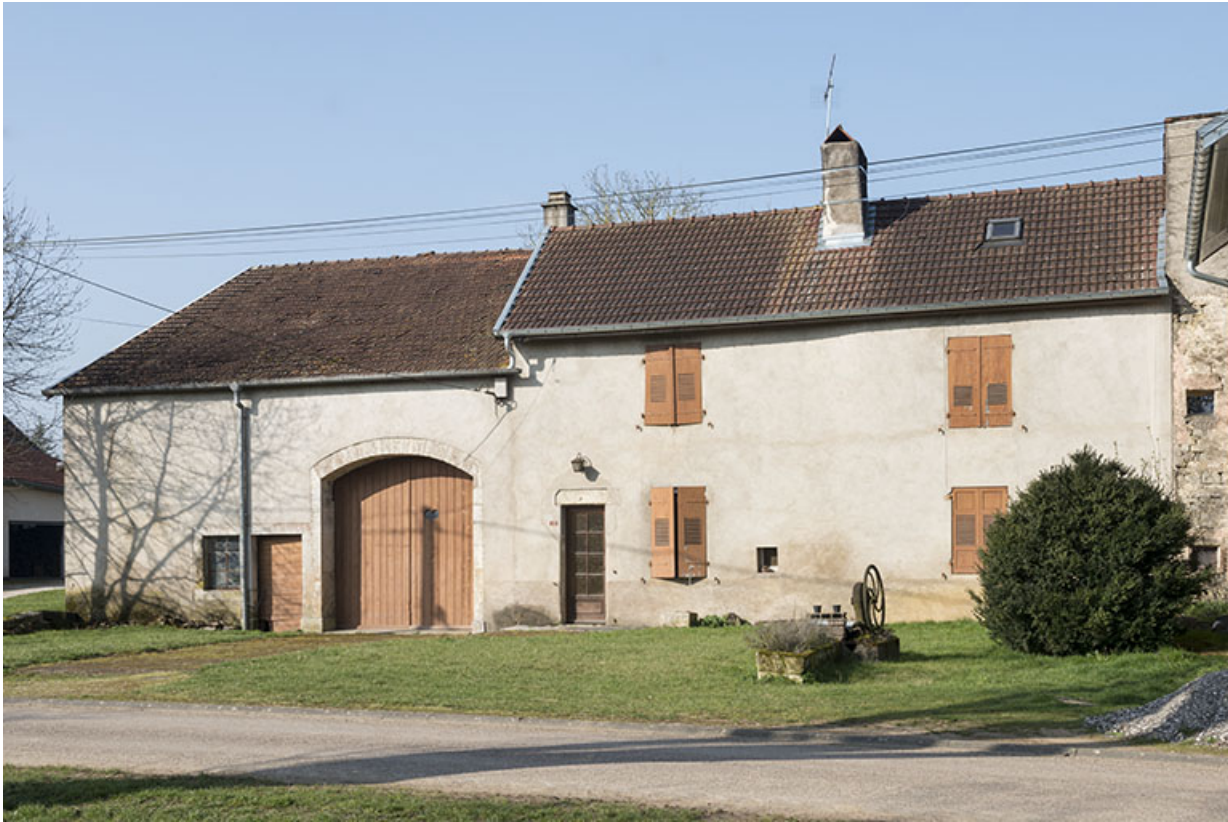
Ferme, rue du Mont.