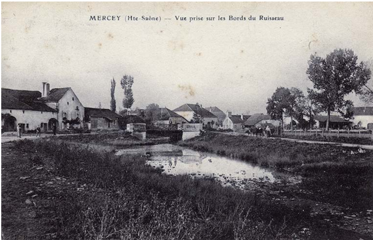
La rue du Mont et le ruisseau, carte postale.