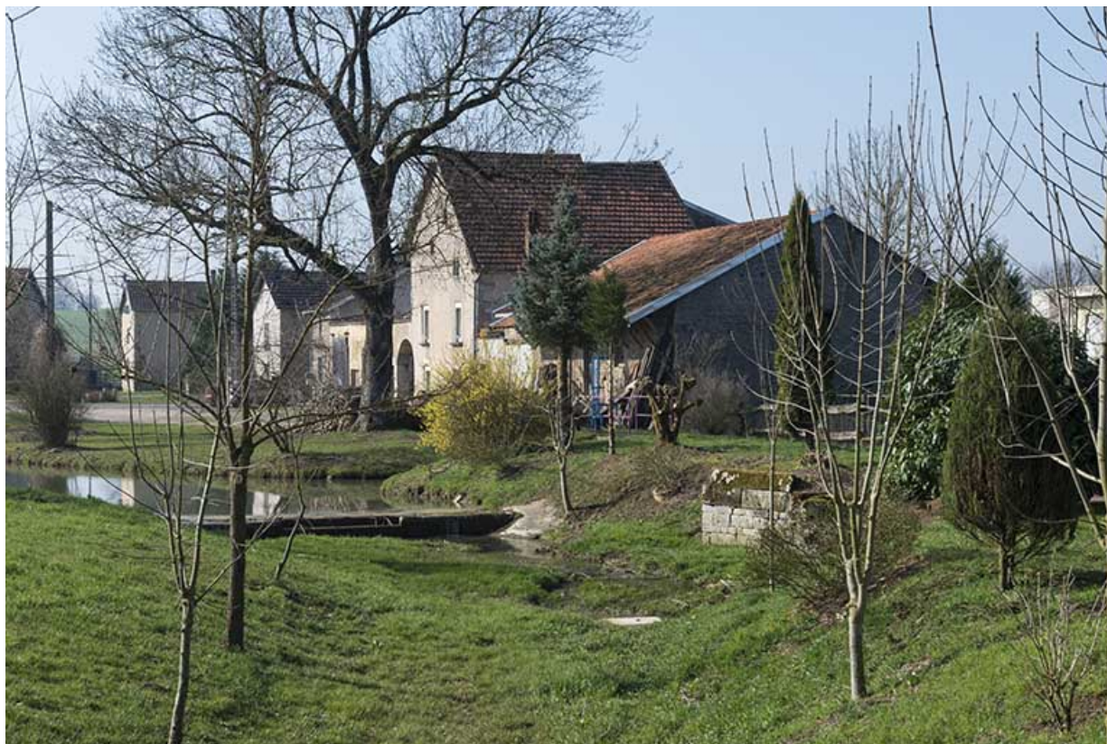
Maisons, rue du Mont. 70, Gevigney-et-Mercey