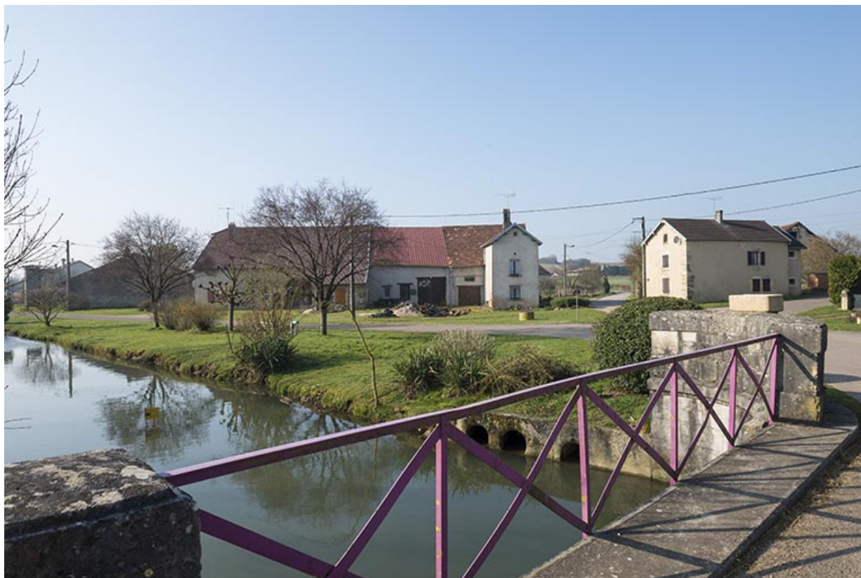
Mercey et le ruisseau Boncourt.