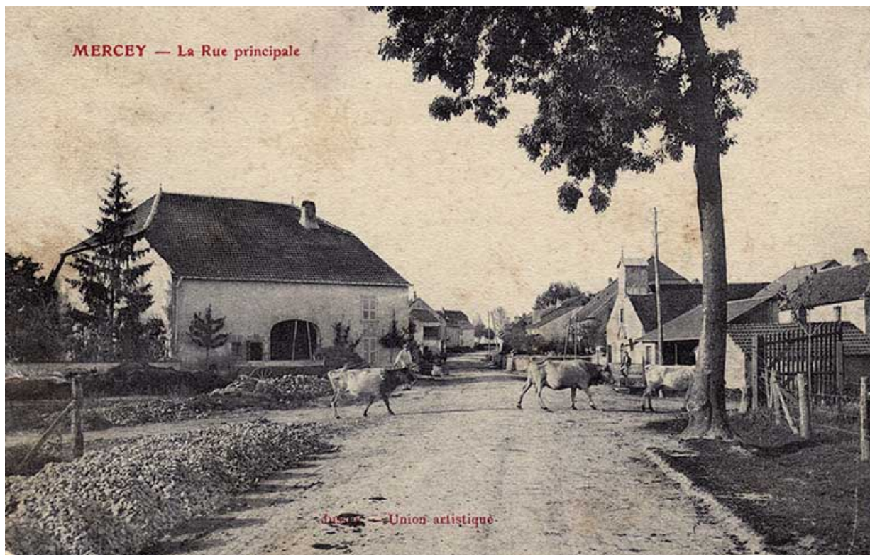
La rue principale de Mercey, carte postale. 70, Gevigney-et-Mercey