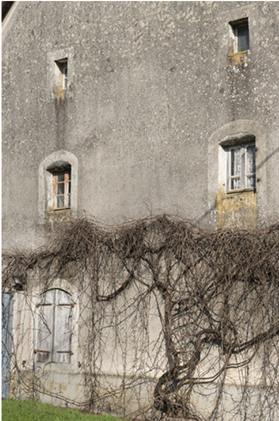
Détail des baies.