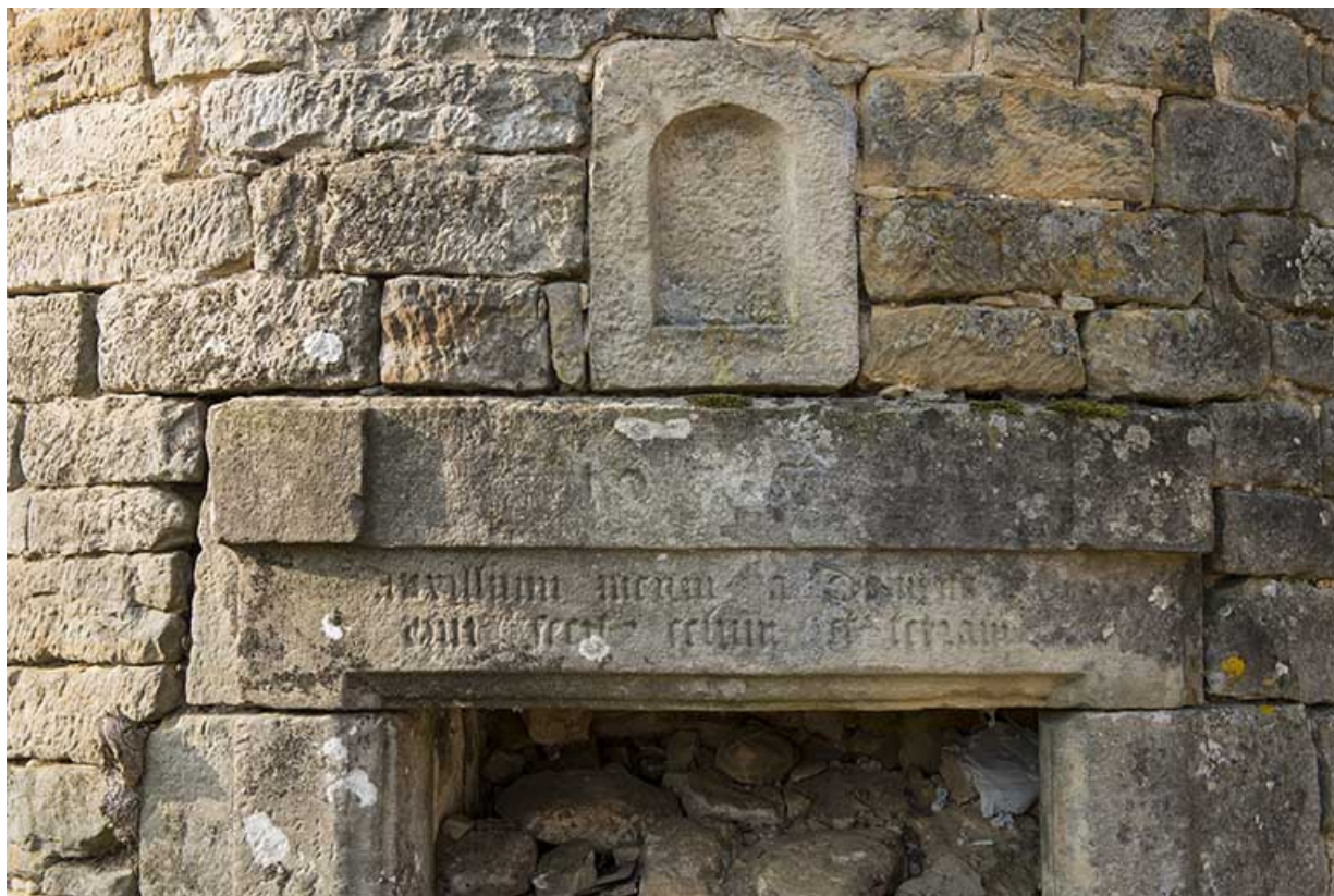
Niche située au bas de la tour.