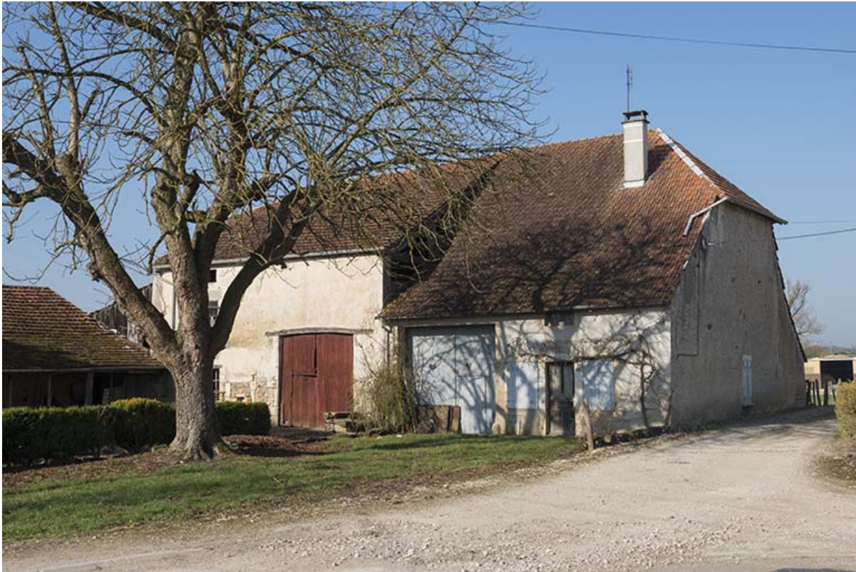
Ferme à Mercey.