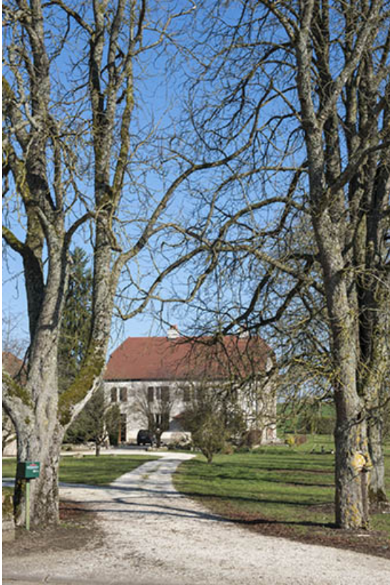
La demeure abritant l'ancien château.