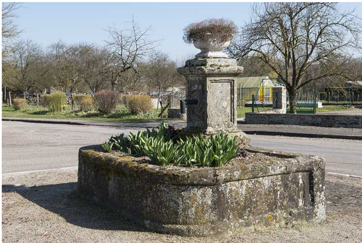
Le bassin maçonné de la fontaine.