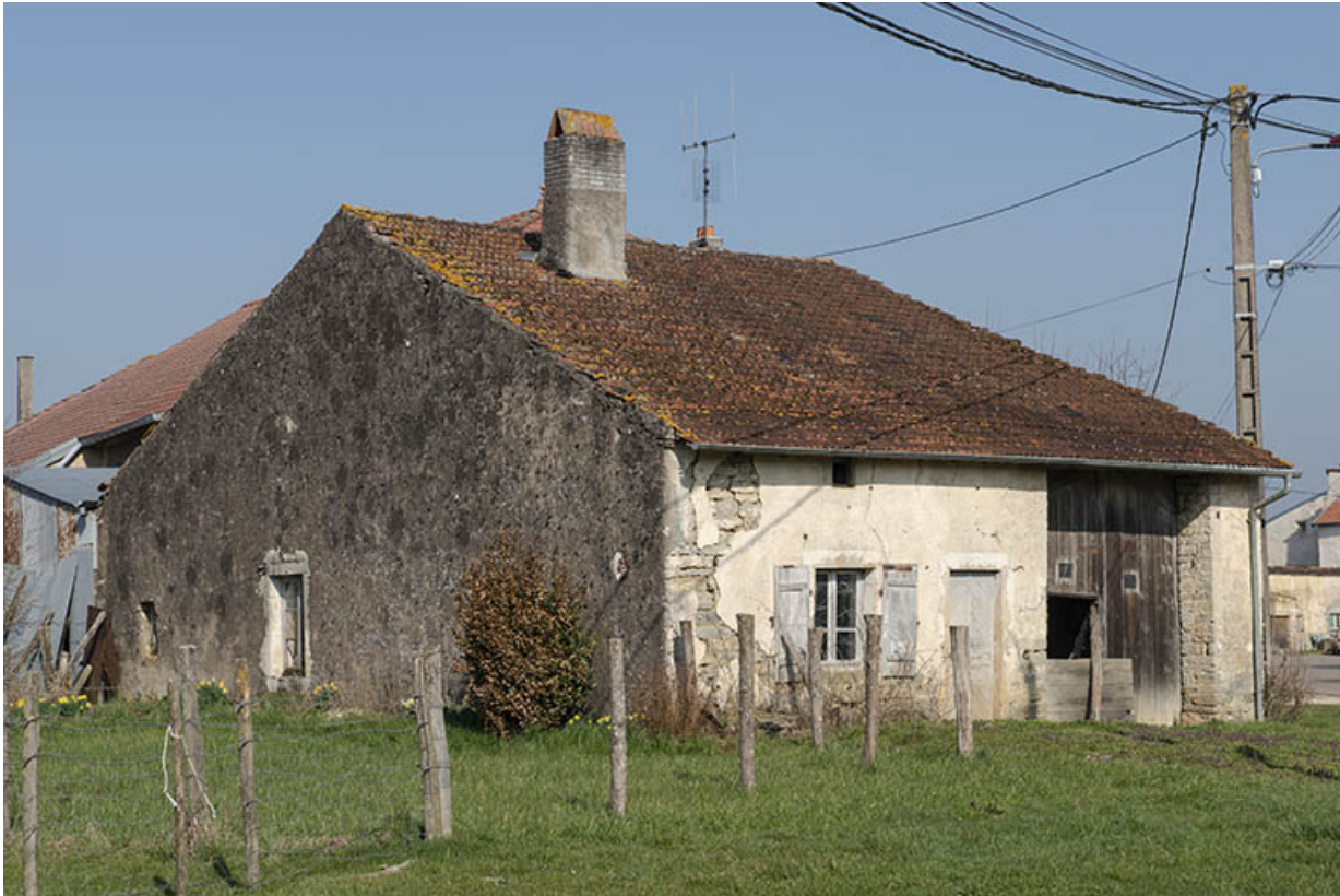
Maison à Mercey.