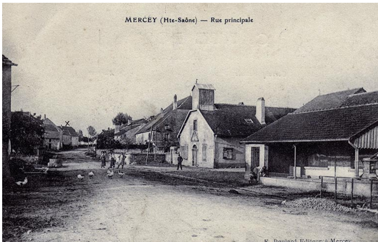
La rue principale de Mercey avec sa chapelle, carte postale. 70, Gevigney-et-Mercey