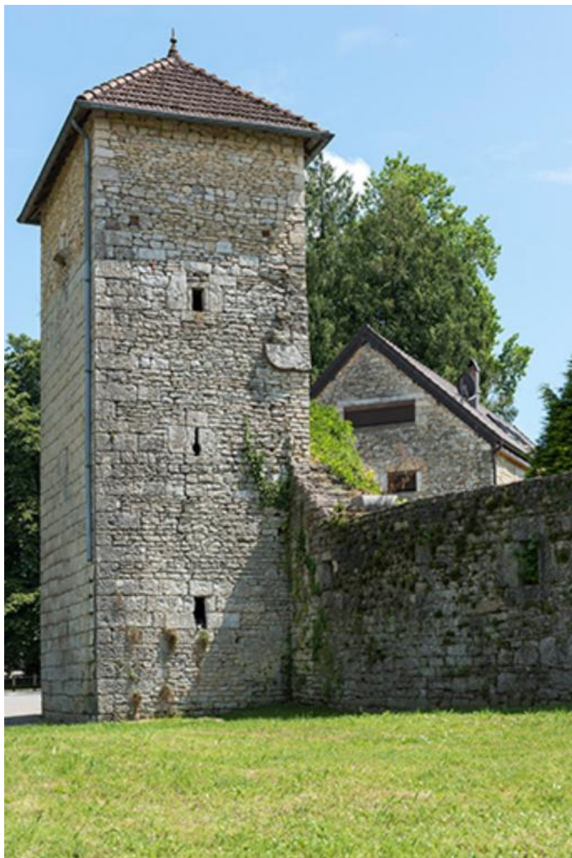
Tour le long du mur d'enceinte de la basse-cour