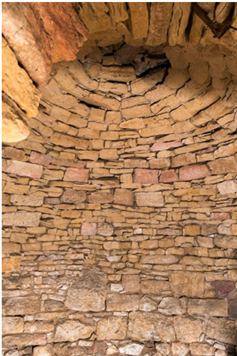
Vue intérieure de la voute de la glacière, située à côté du mur nord de l'ancienne écurie 70, Chemilly, lieudit : La Côte