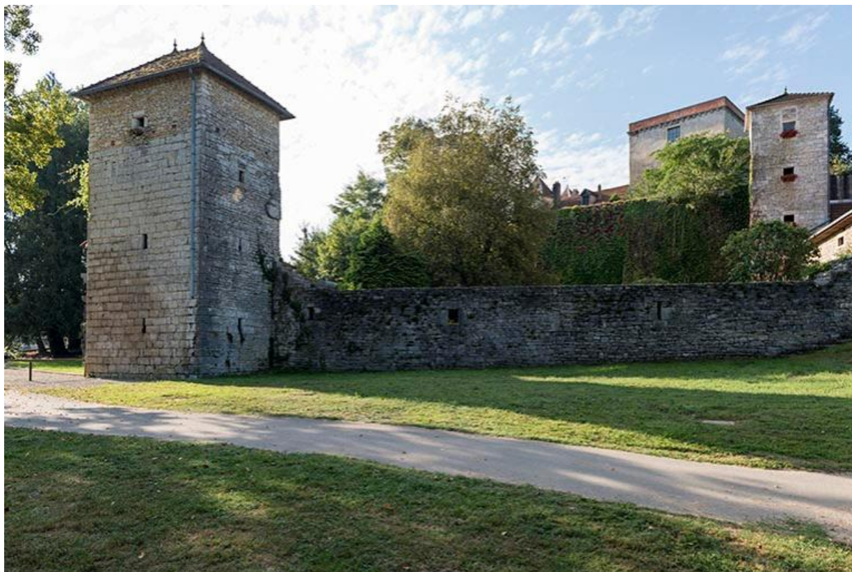
Vue d'ensemble du château depuis la véloroute