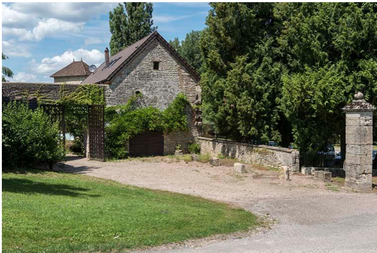
Vue de l'entrée dans la basse-cour et accès aux anciens communs du château 70, Chemilly, lieudit : La Côte