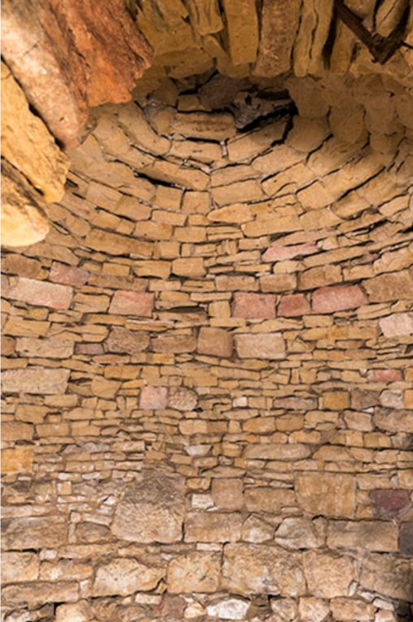
Vue intérieure de la voute de la glacière, située à côté du mur nord de l'ancienne écurie 70, Chemilly, lieudit : La Côte