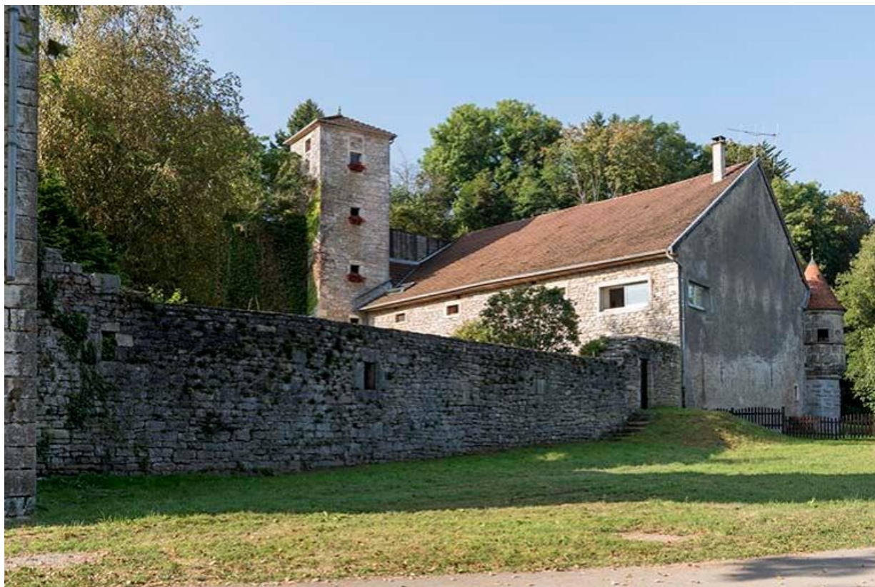
Vue des bâtiments de l'ancienne écurie du château et du mur d'enceinte de la basse-cour 70, Chemilly, lieudit : La Côte