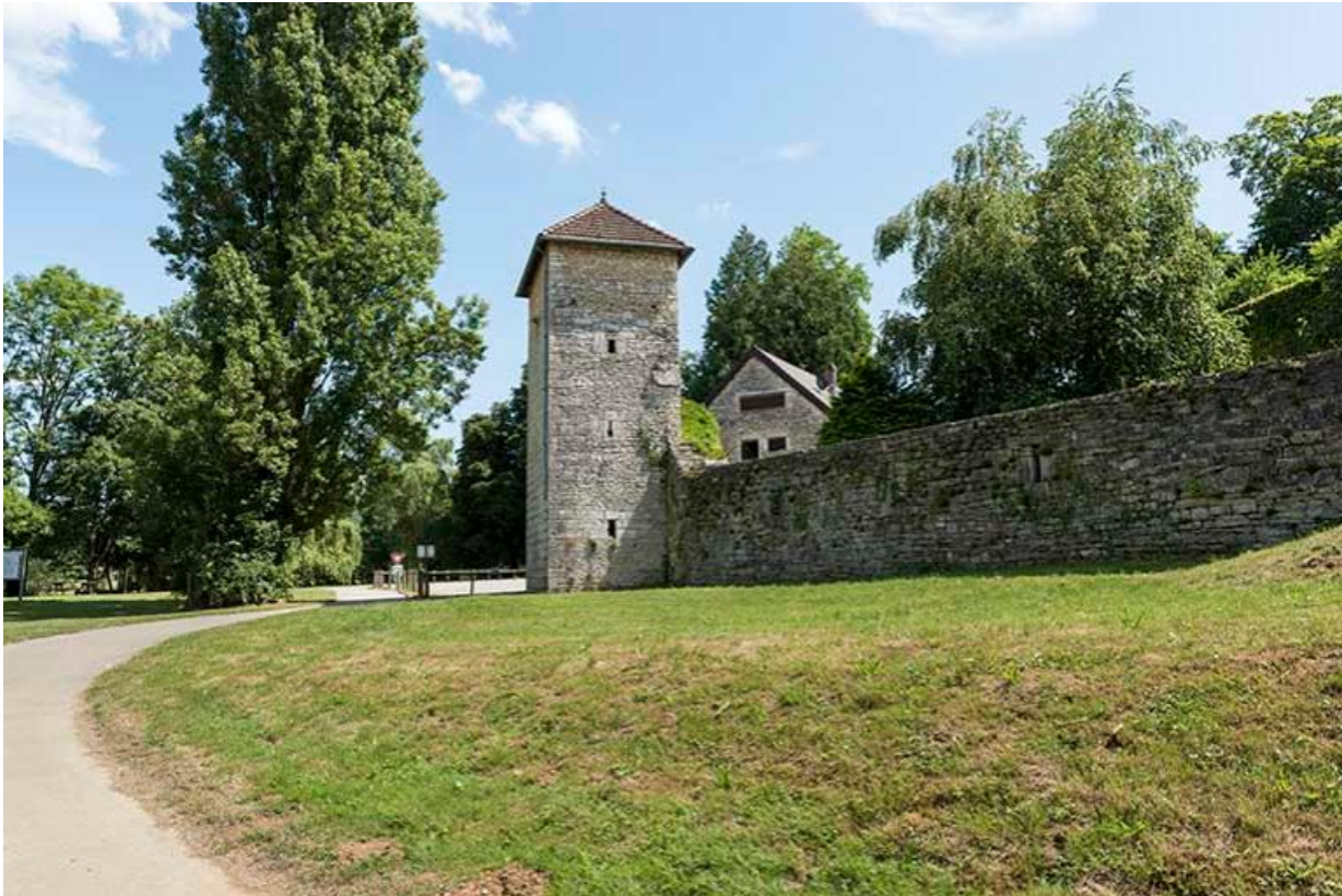
Vue de la tour le long du mur d'enceinte de la basse-cour, depuis la véloroute 70, Chemilly, lieudit : La Côte