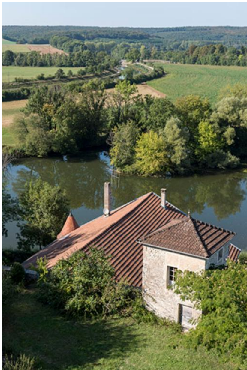
Vue des bâtiments de la basse-cour en bordure de Saône