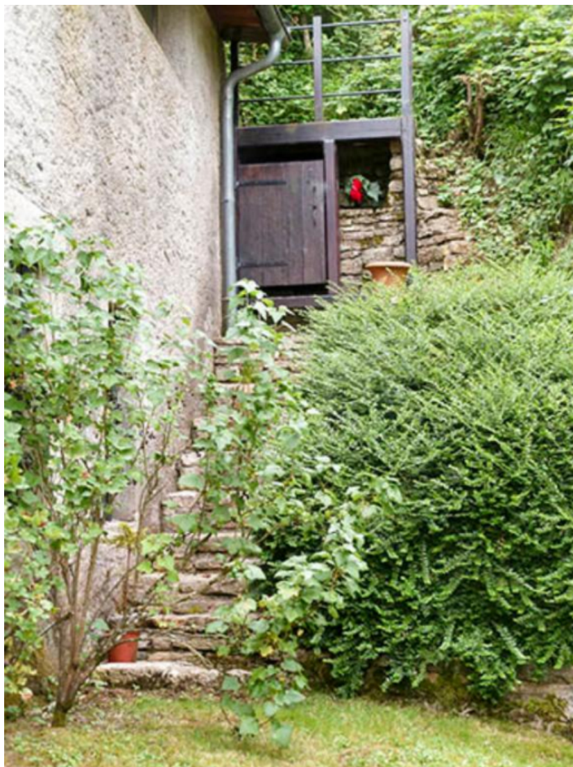
Accès et entrée de la glacière, côté Ouest de l'ancienne écurie.