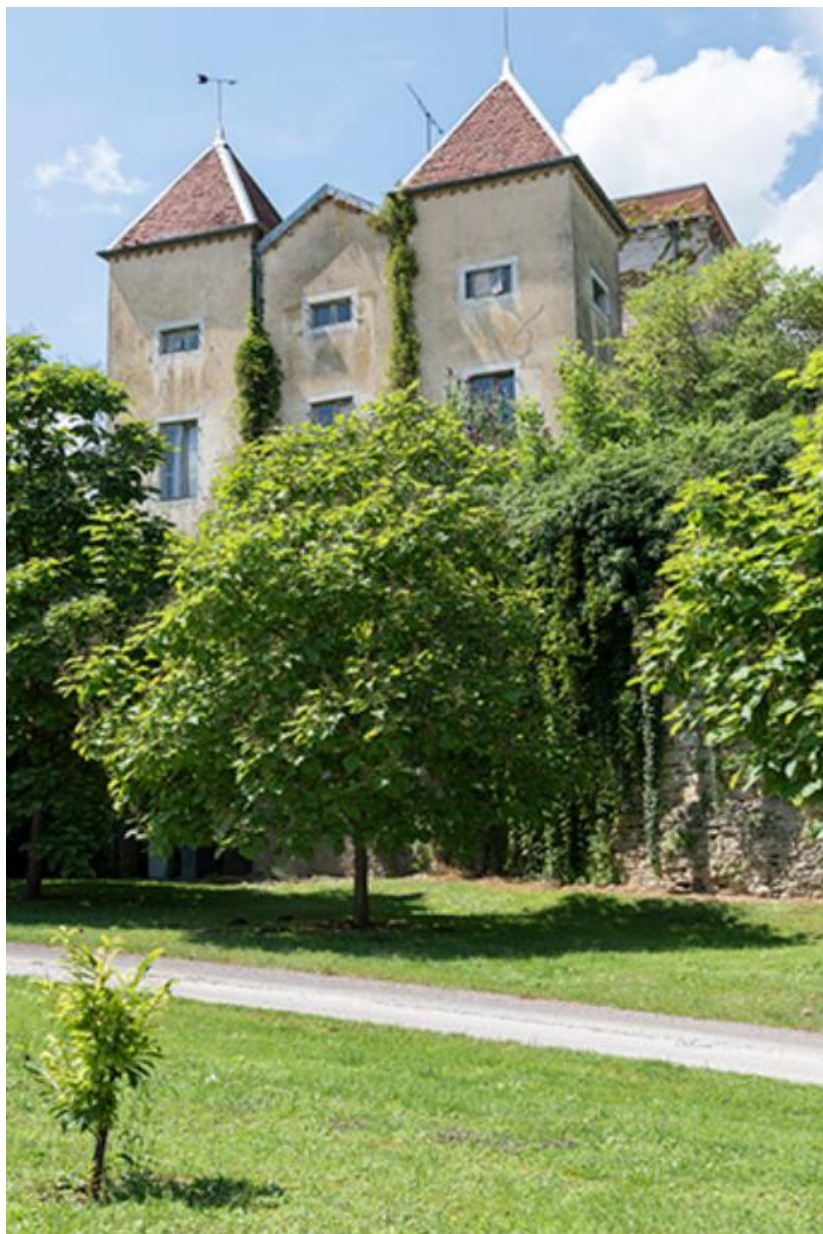
Les deux tours du château et la rue du château au premier plan.