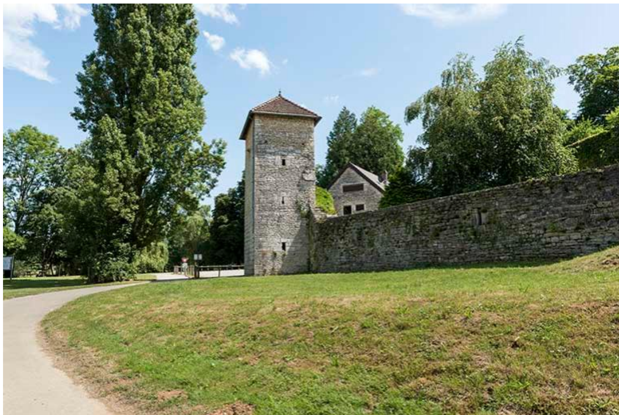
Vue de la tour le long du mur d'enceinte de la basse-cour, depuis la véloroute 70, Chemilly, lieudit : La Côte