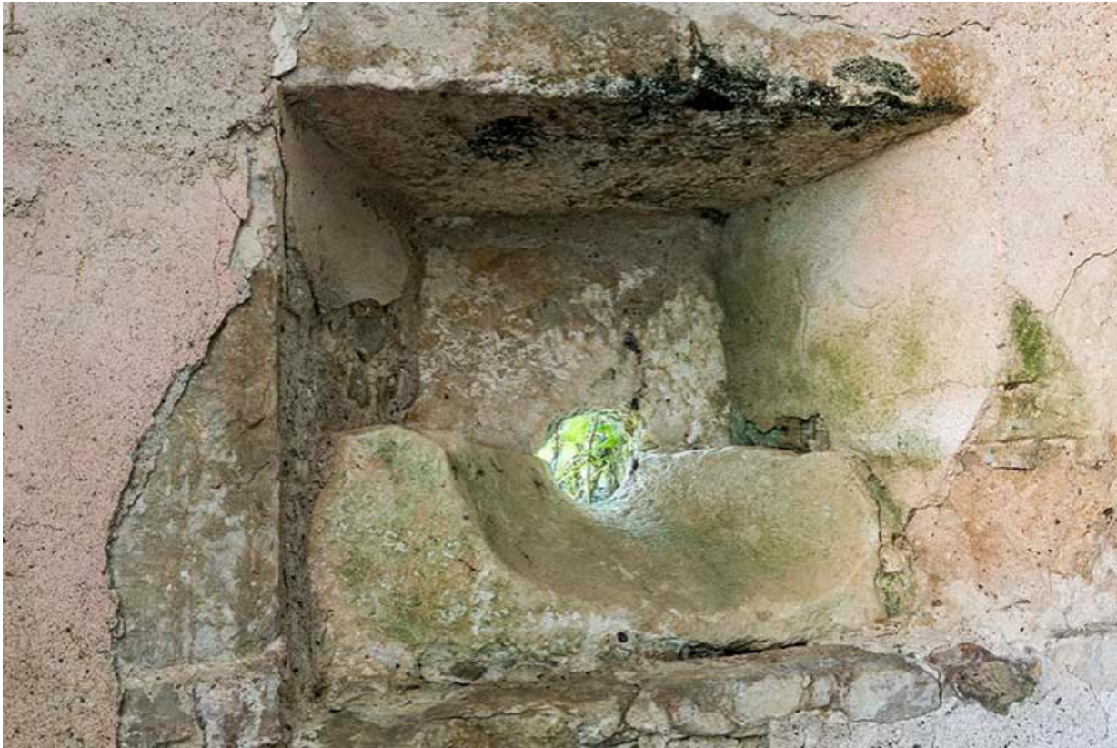
Tour sur le mur d'enceinte entre les deux cours, détail intérieur d'une meurtrière 70, Chemilly, lieudit : La Côte