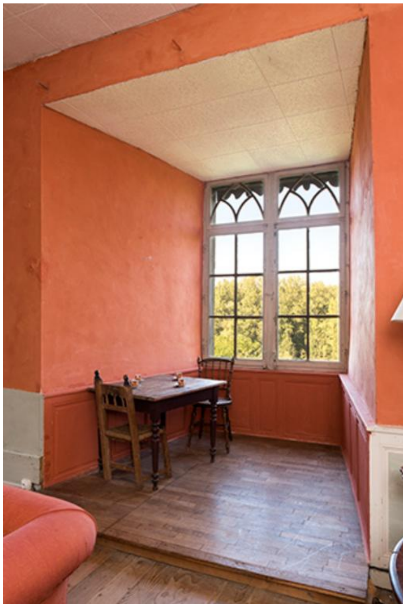
Chambre à l'étage du donjon, fenêtre donnant sur la cour haute et la Saône. 70, Chemilly, lieudit : La Côte