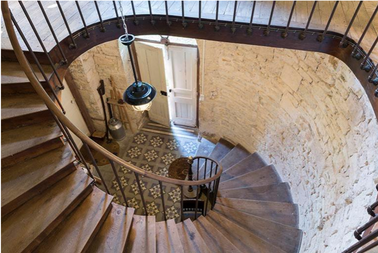
Escalier au rez-de-chaussée du logis central du château.