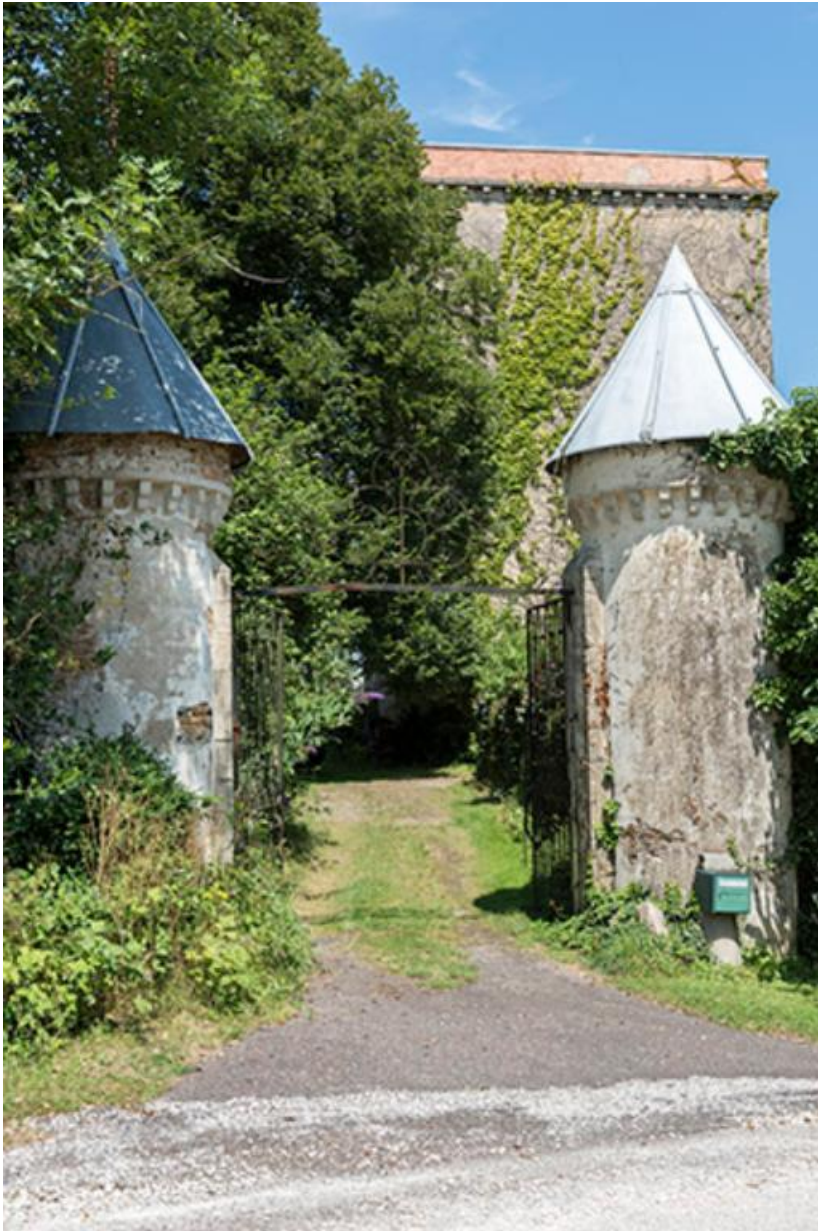
Tourelles et portail d'entrée au château.