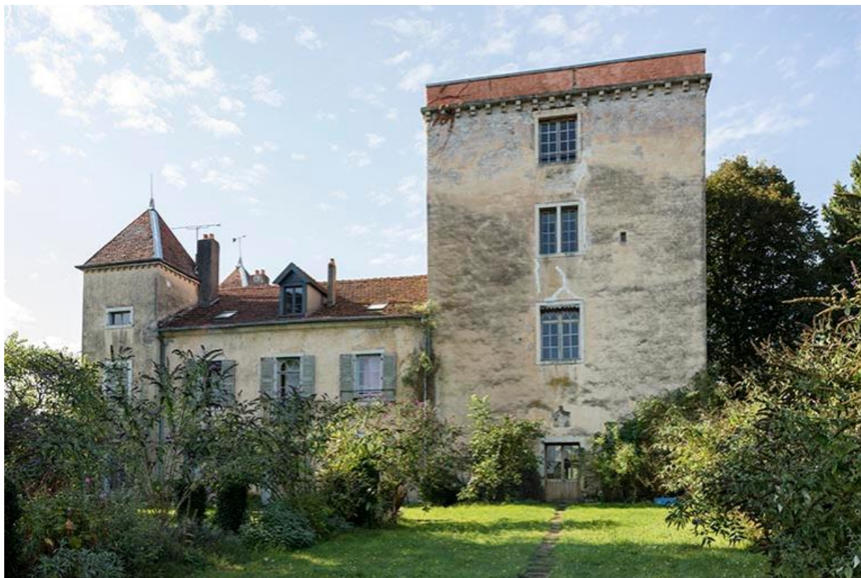
Le château et son jardin, depuis la cour haute 70, Chemilly, lieudit : La Côte