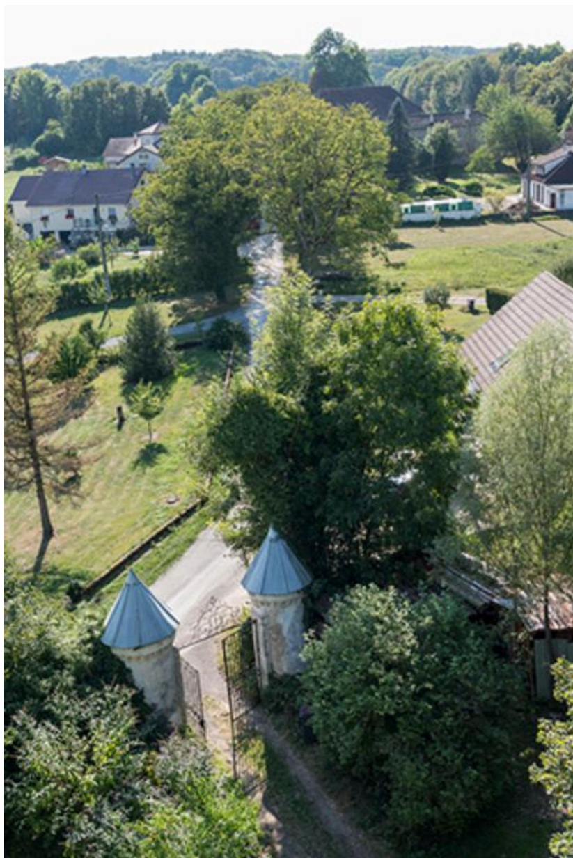
Portail d'entrée au château, situé rue du château, à l'Ouest, en direction de l'ancien couvent. 70, Chemilly, lieudit : La Côte