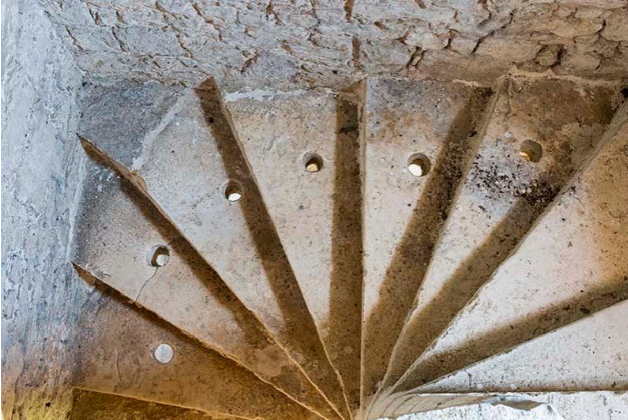
Vue de l'escalier intérieur de la tour sur le mur d'enceinte entre les deux cours, détail de l'emmarchement menant au pigeonnier 70, Chemilly, lieudit : La Côte