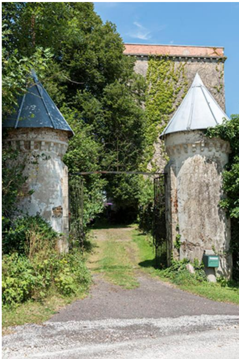
Tourelles et portail d'entrée au château.