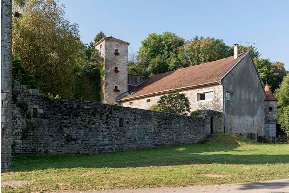
Vue des bâtiments de l'ancienne écurie du château et du mur d'enceinte de la basse-cour 70, Chemilly, lieudit : La Côte