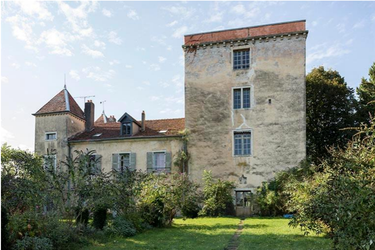
Le château et son jardin, depuis la cour haute 70, Chemilly, lieudit : La Côte