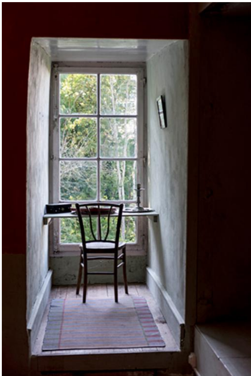
Chambre à l'étage du donjon du château, bureau aménagé dans l'épaisseur du mur. 70, Chemilly, lieudit : La Côte