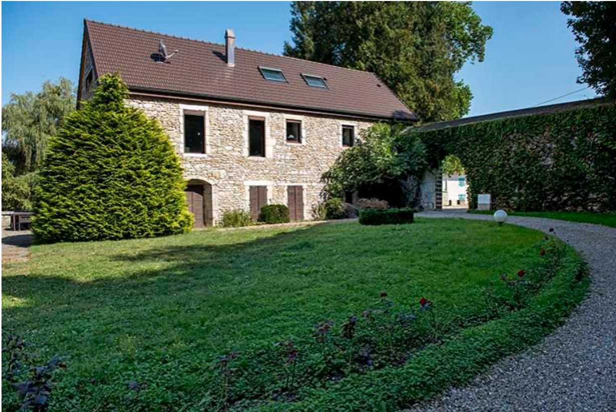
Vue de la basse-cour et de l'un des bâtiments des anciens communs