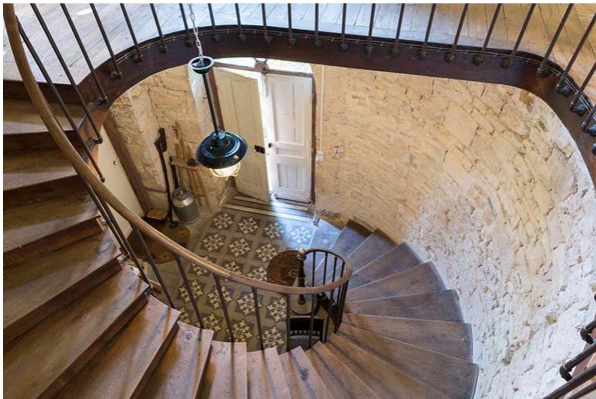
Escalier au rez-de-chaussée du logis central du château.