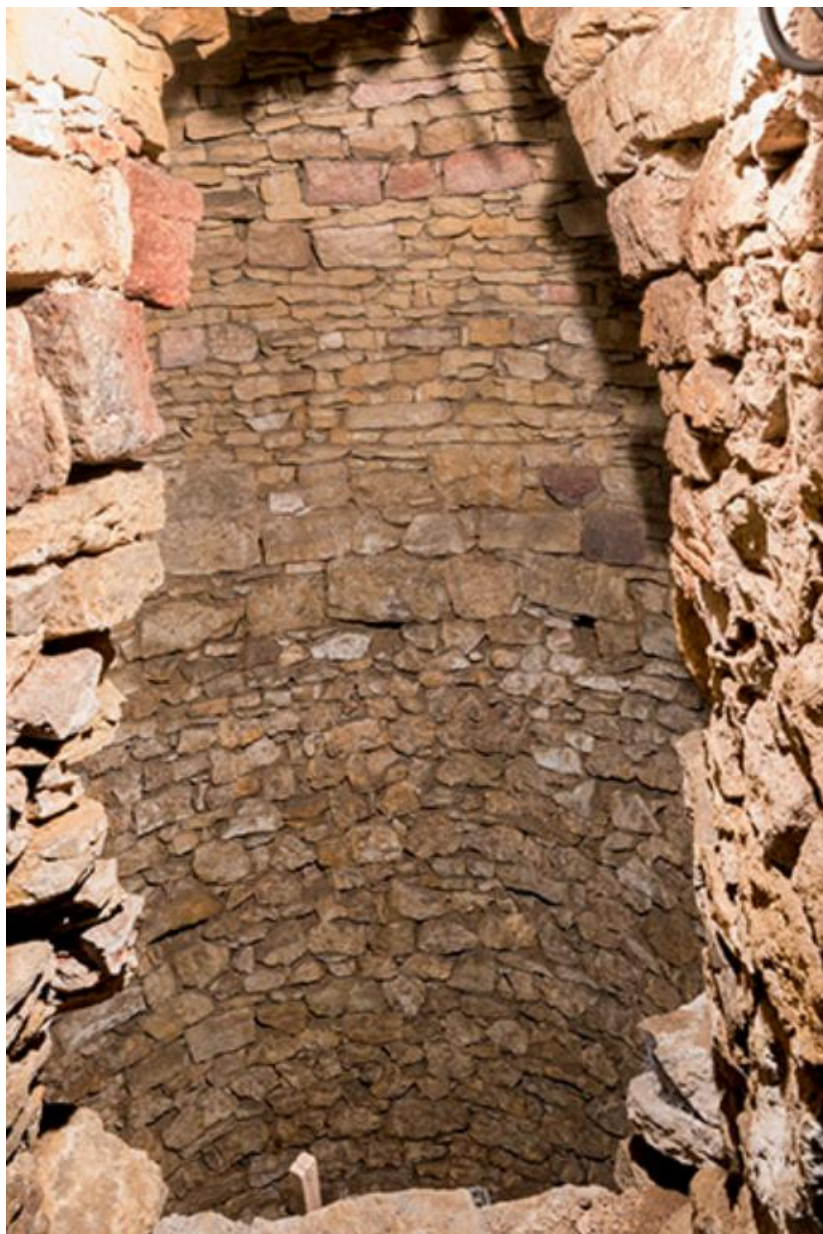
Vue intérieure de la glacière située à côté la façade nord de l'ancienne écurie 70, Chemilly, lieudit : La Côte