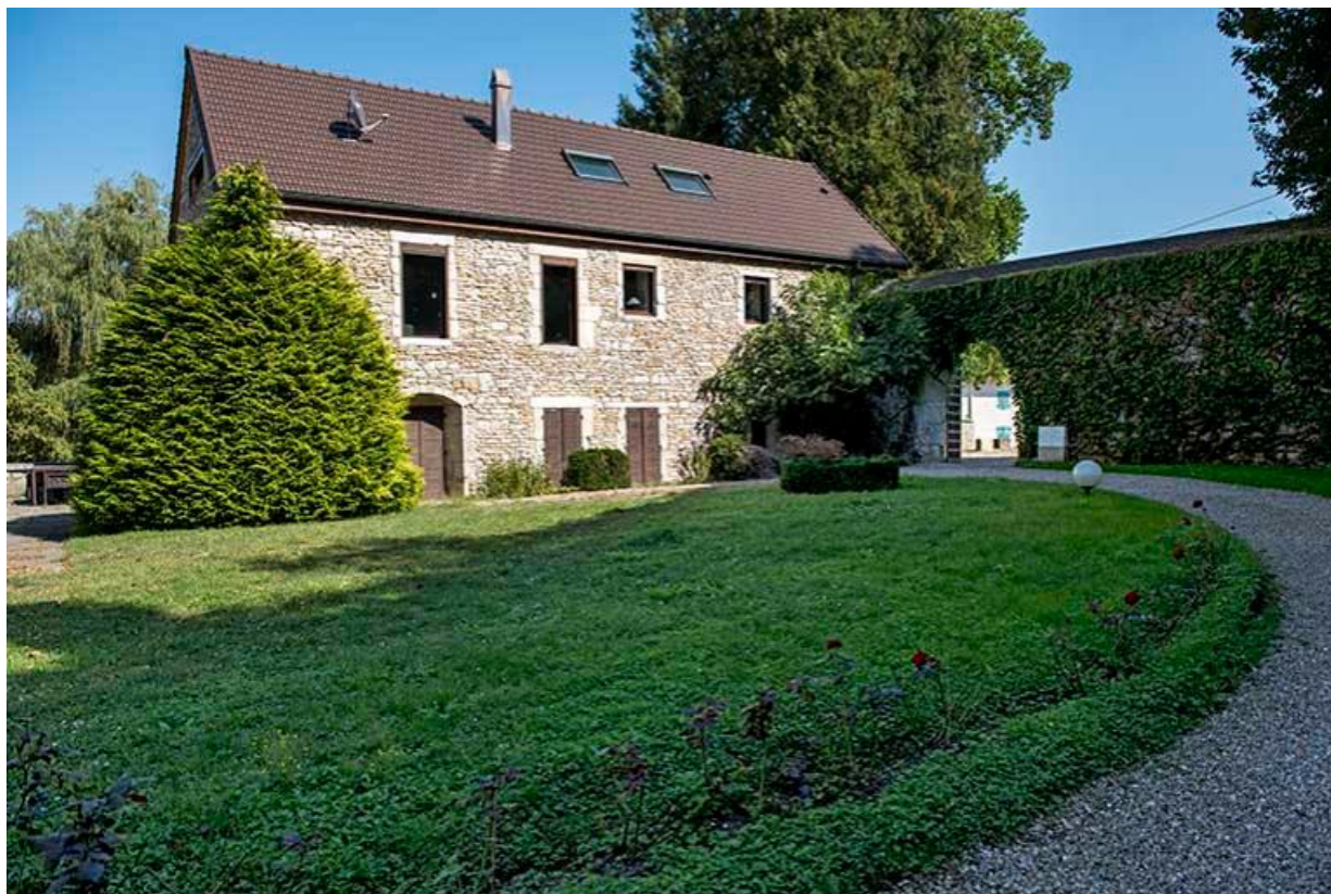
Vue de la basse-cour et de l'un des bâtiments des anciens communs