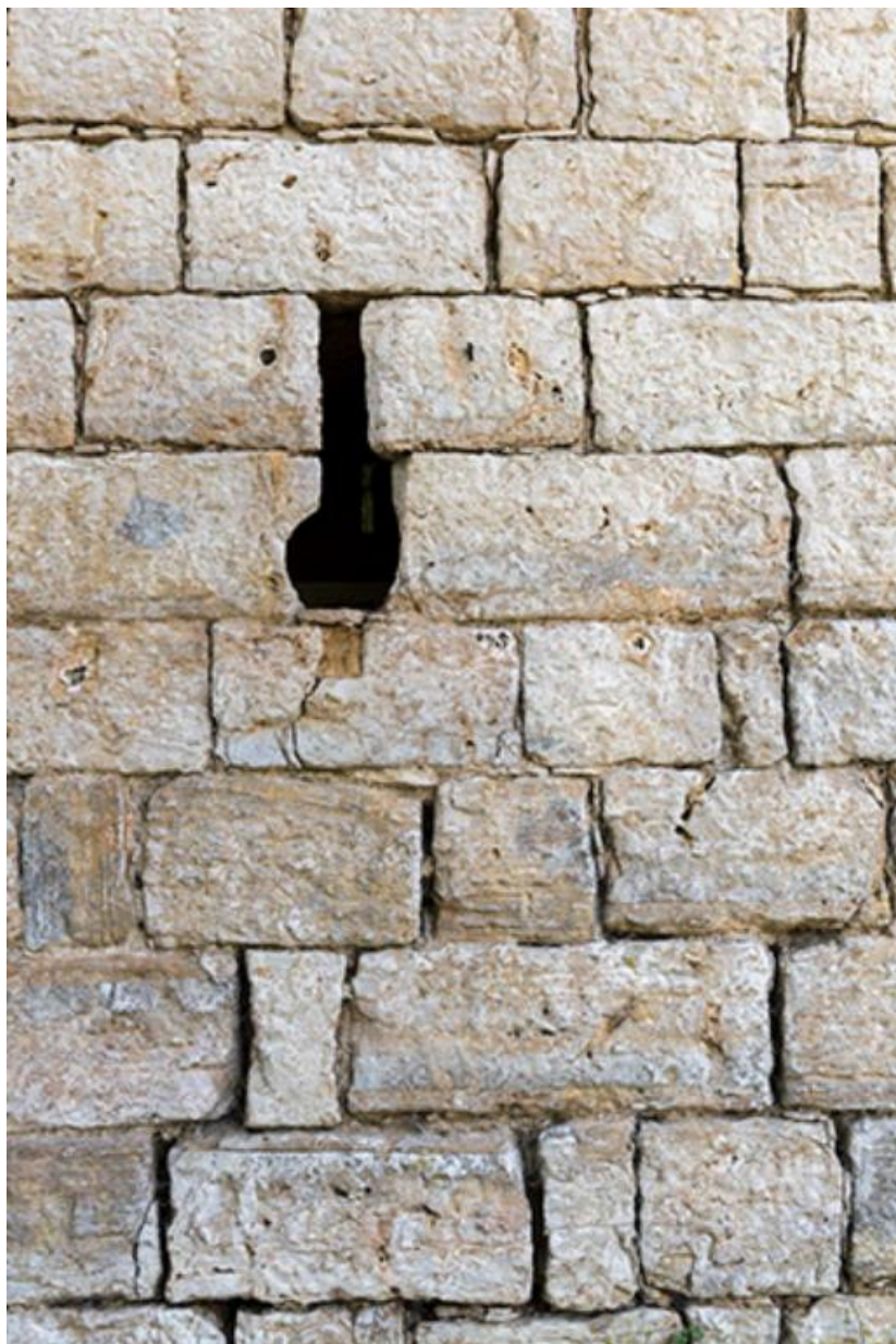
Détail d'une meurtrière de la tour, le long du mur d'enceinte de la basse-cour 70, Chemilly, lieudit : La Côte