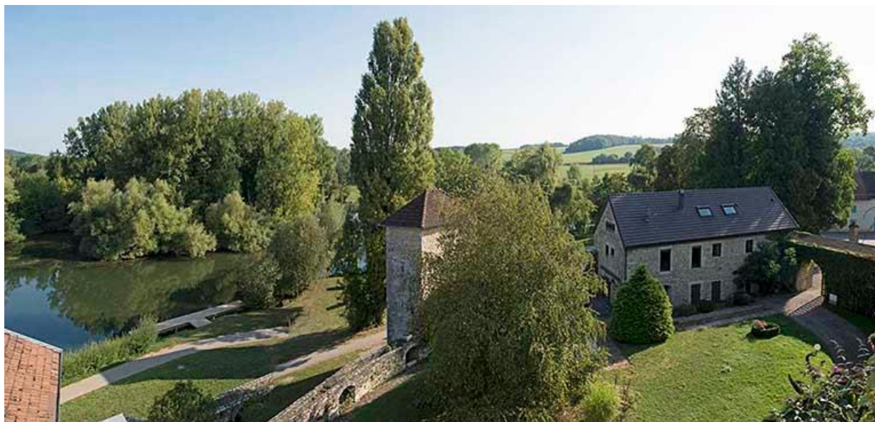
Vue des communs dans la basse-cour et de la véloroute le long de la Saône 70, Chemilly, lieudit : La Côte