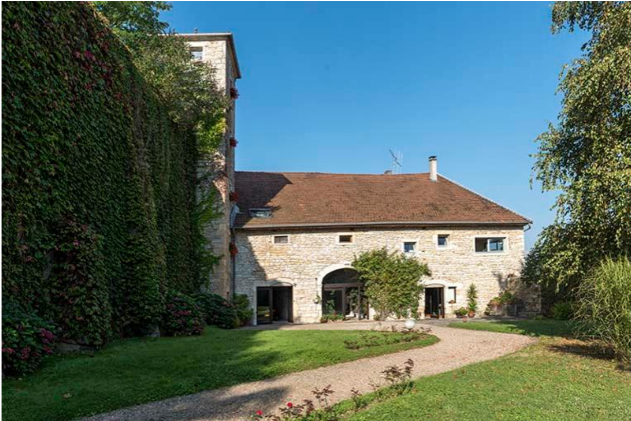
Vue de l'ancienne écurie du château et tour sur le mur d'enceinte entre les deux cours 70, Chemilly, lieudit : La Côte