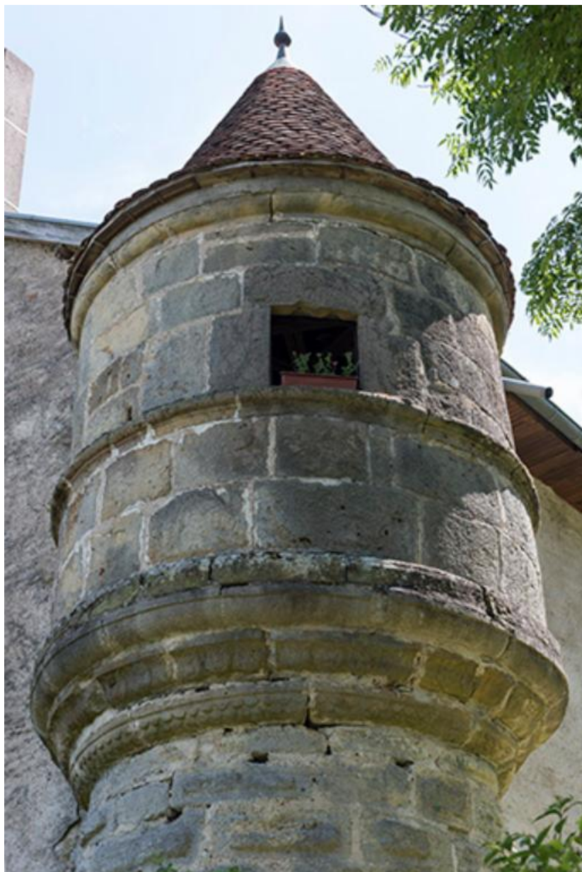
Détail de l'échauguette de l'ancienne écurie