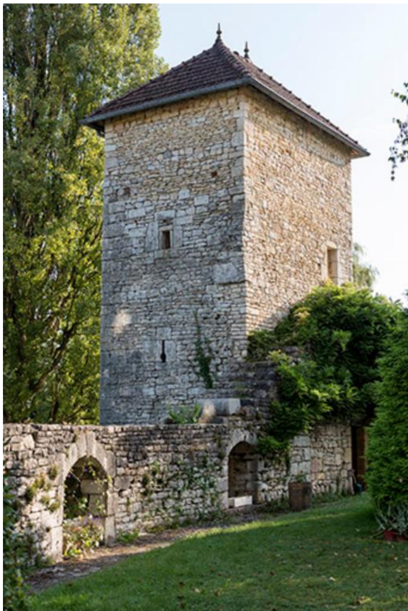
Tour le long du mur d'enceinte, vue depuis la basse-cour