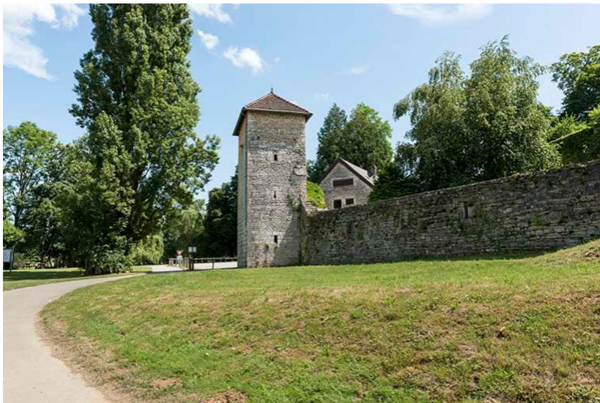
Vue de la tour le long du mur d'enceinte de la basse-cour, depuis la véloroute 70, Chemilly, lieudit : La Côte