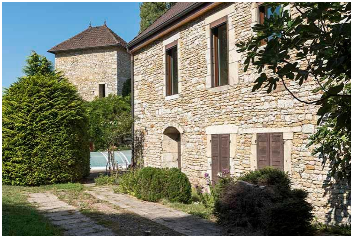
Vue des anciens communs du château et de la tour sur le mur d'enceinte