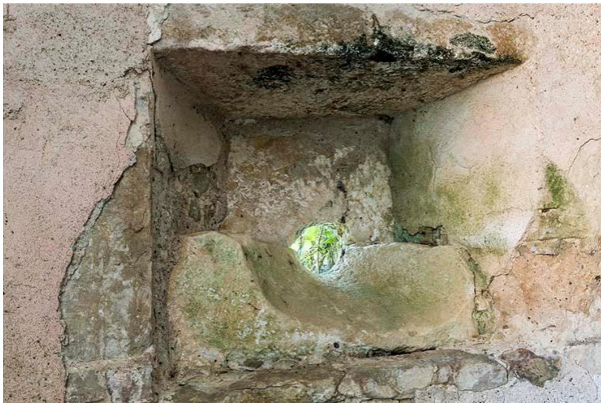
Tour sur le mur d'enceinte entre les deux cours, détail intérieur d'une meurtrière 70, Chemilly, lieudit : La Côte