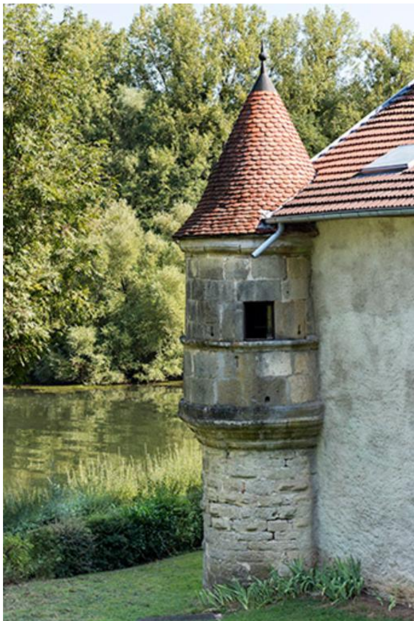
L'échauguette de l'ancienne écurie