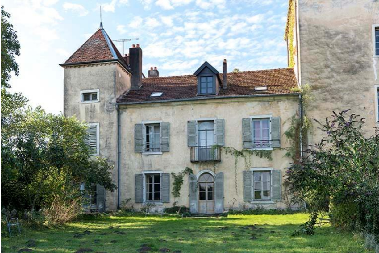
Le corps central du logis et la tour Sud-Est, depuis la cour haute 70, Chemilly, lieudit : La Côte