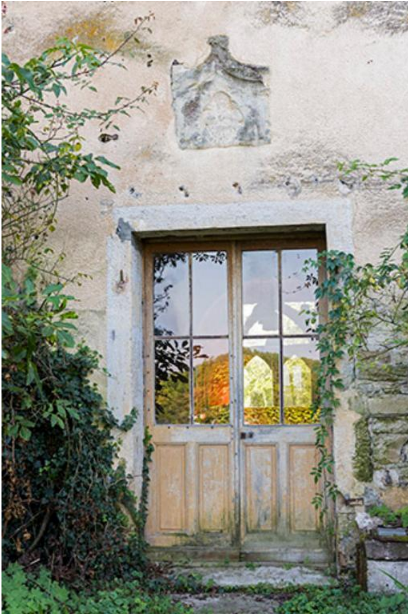
Entrée au rez-de-chaussée du donjon, côté Nord-Est