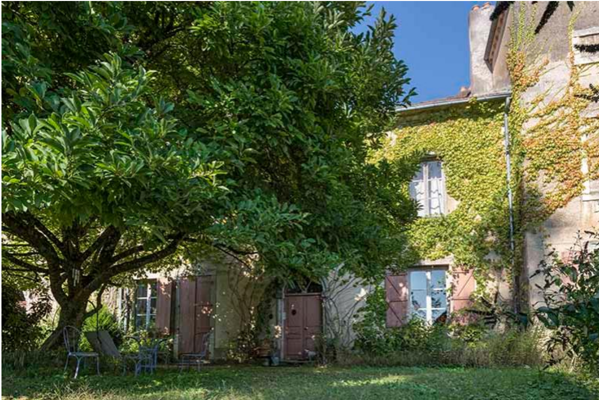
Aile du château et jardin, côté Sud-Ouest