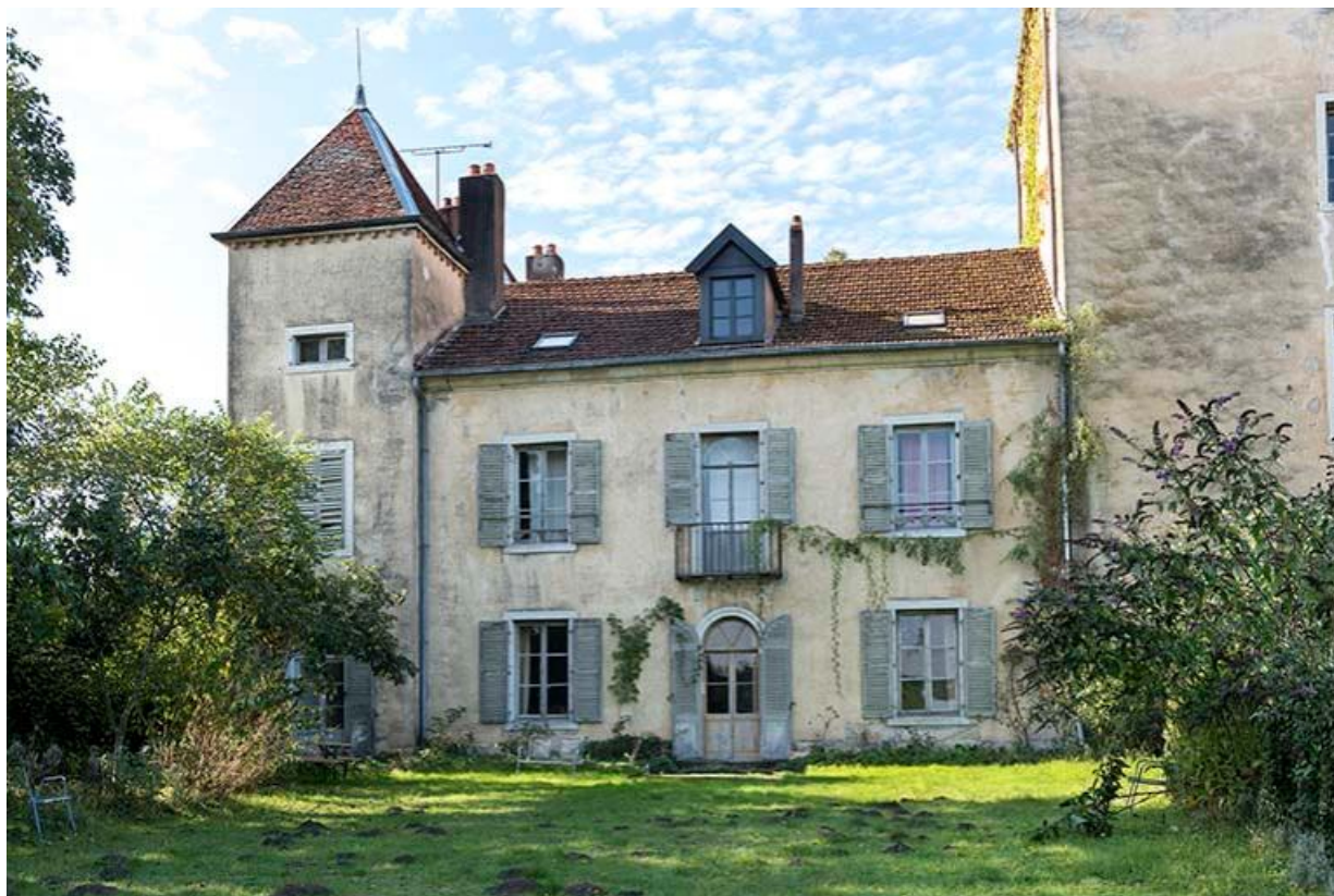
Le corps central du logis et la tour Sud-Est, depuis la cour haute 70, Chemilly, lieudit : La Côte