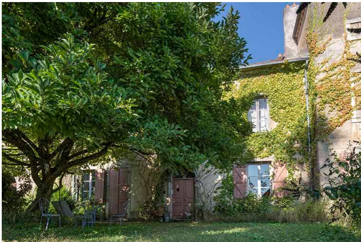
Aile du château et jardin, côté Sud-Ouest 70, Chemilly, lieudit : La Côte