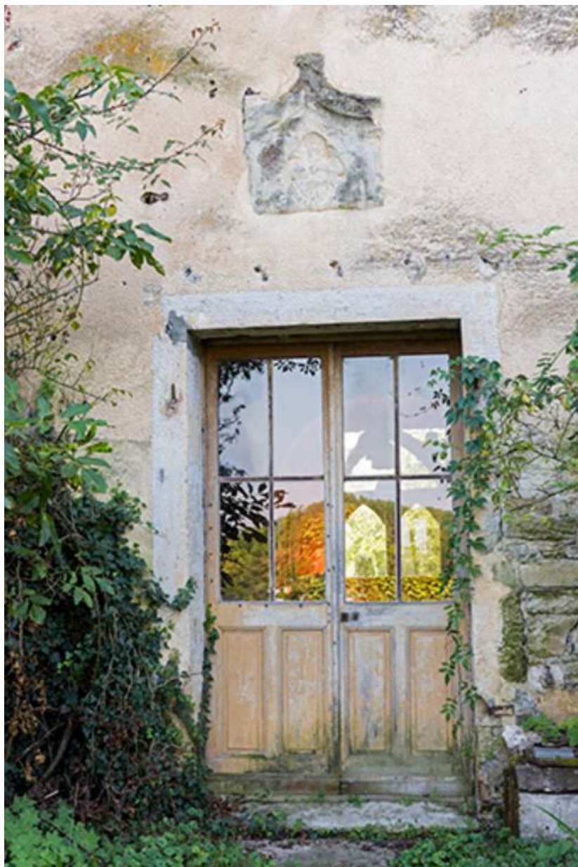
Entrée au rez-de-chaussée du donjon, côté Nord-Est