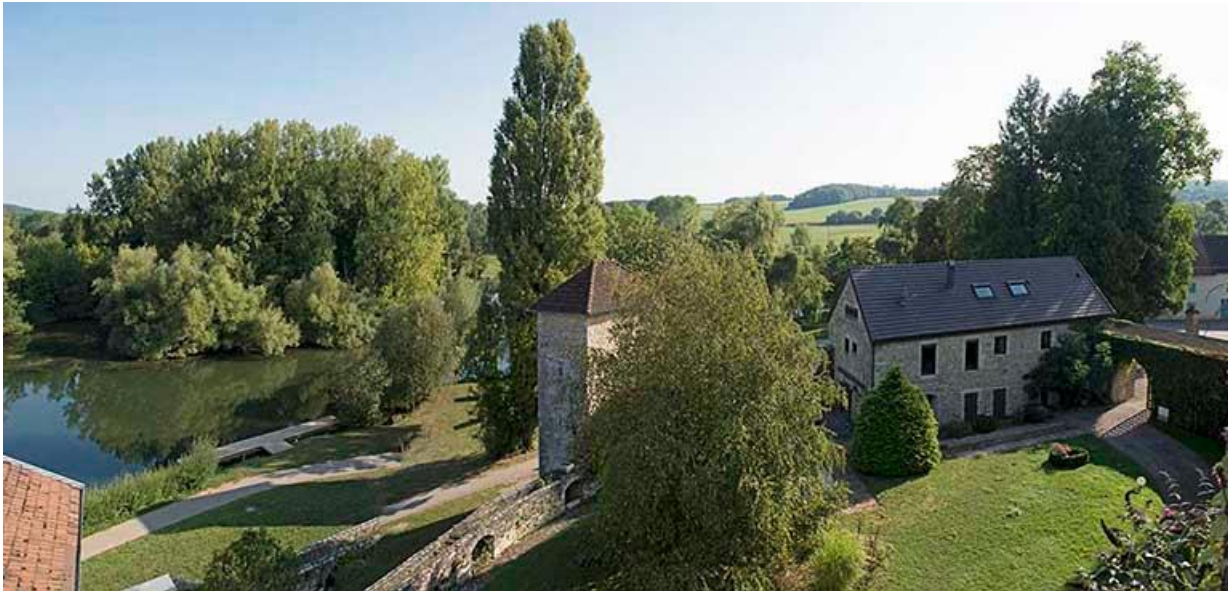
Vue des communs dans la basse-cour et de la véloroute le long de la Saône 70, Chemilly, lieudit : La Côte