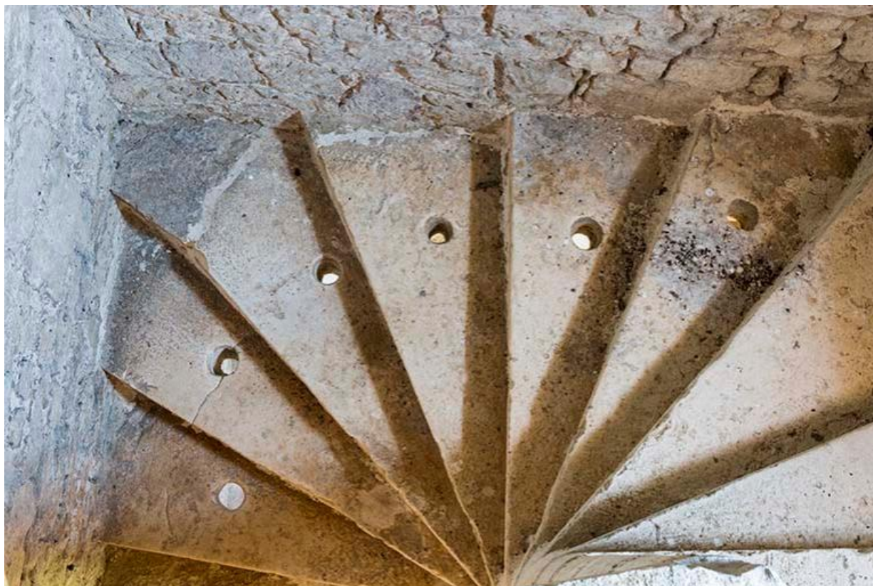
Vue de l'escalier intérieur de la tour sur le mur d'enceinte entre les deux cours, détail de l'embranchement menant au pigeonnier 70, Chemilly, lieudit : La Côte