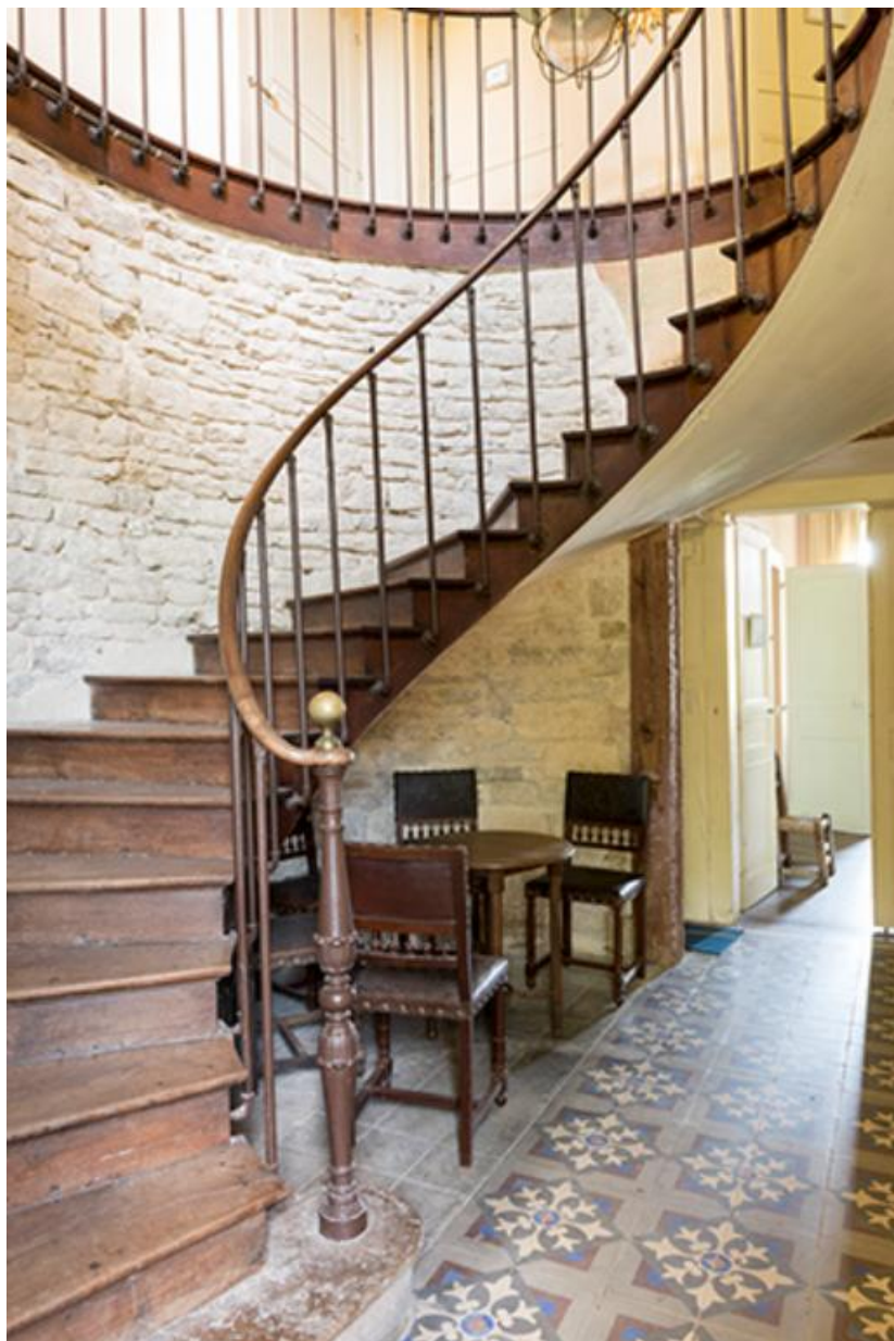
Escalier du rez-de-chaussée du corps de logis central du château.