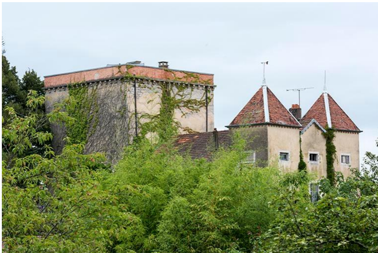
Le donjon et son toit terrasse, le logis et les deux tours