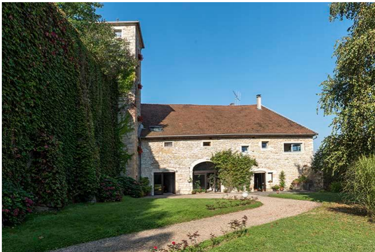
Vue de l'ancienne écurie du château et tour sur le mur d'enceinte entre les deux cours 70, Chemilly, lieudit : La Côte