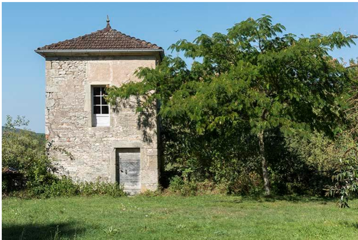
Sommet de la tour de la basse cour, pigeonnier, donnant sur la cour haute. 70, Chemilly, lieudit : La Côte