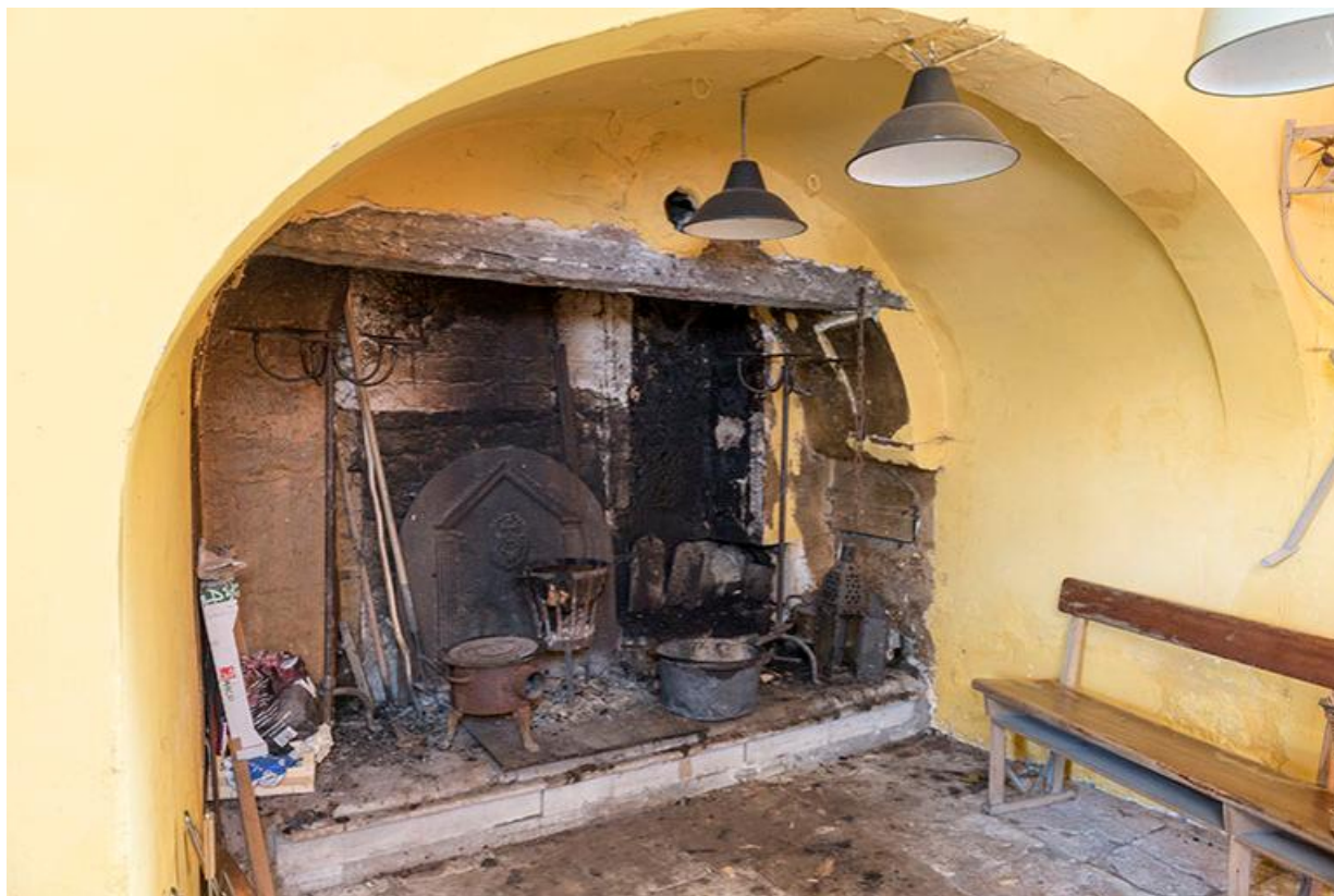
Cheminée et four à pain, rez-de-chaussée du donjon.