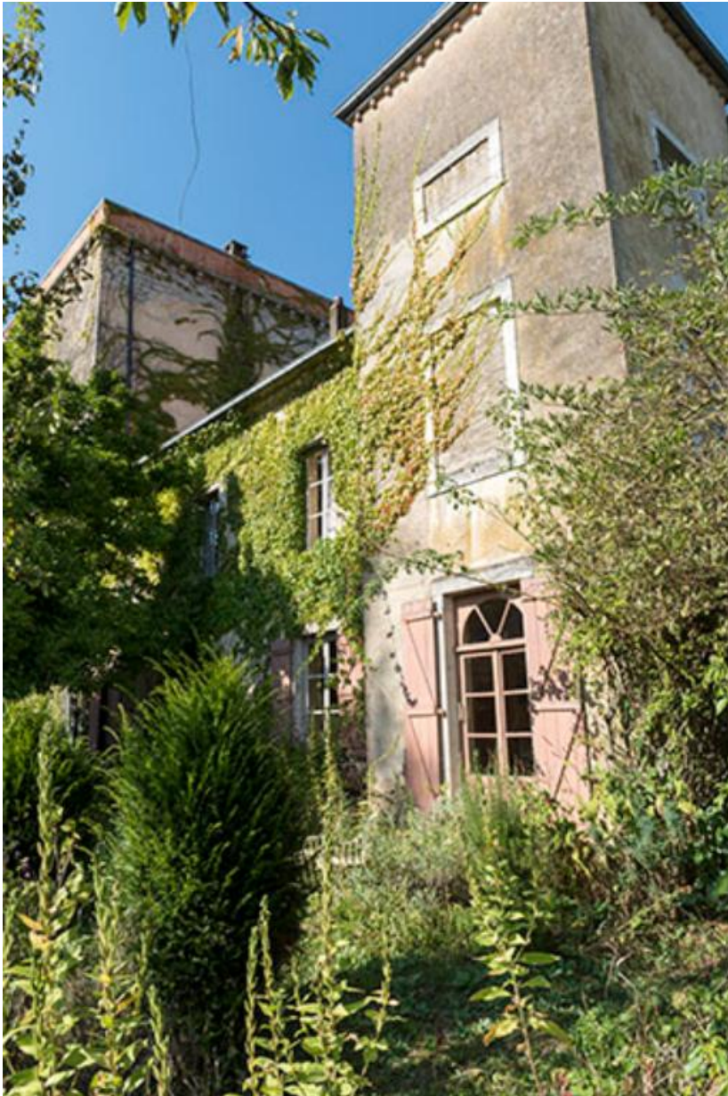
Aile du château côté Sud-Ouest