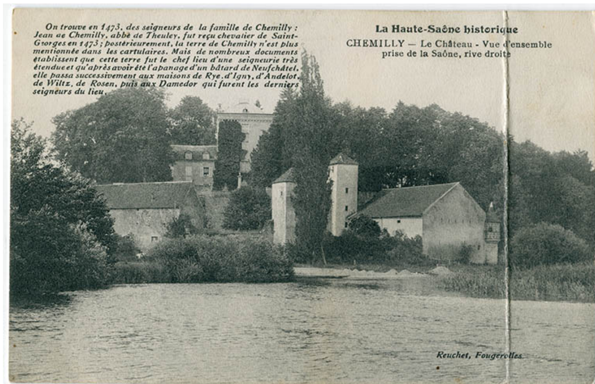
Vue d'ensemble du château, prise depuis la Saône.