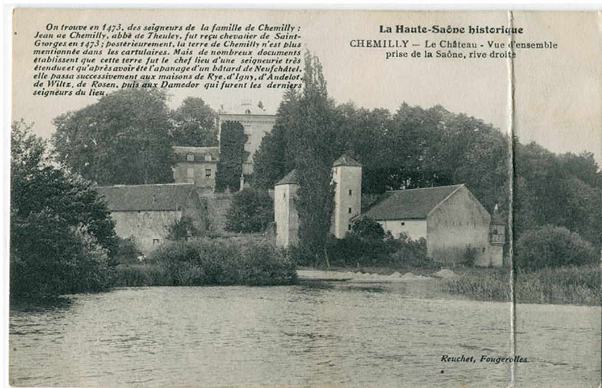
Vue d'ensemble du château, prise depuis la Saône.