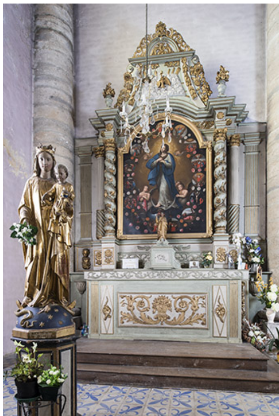
Autel latéral ouest.