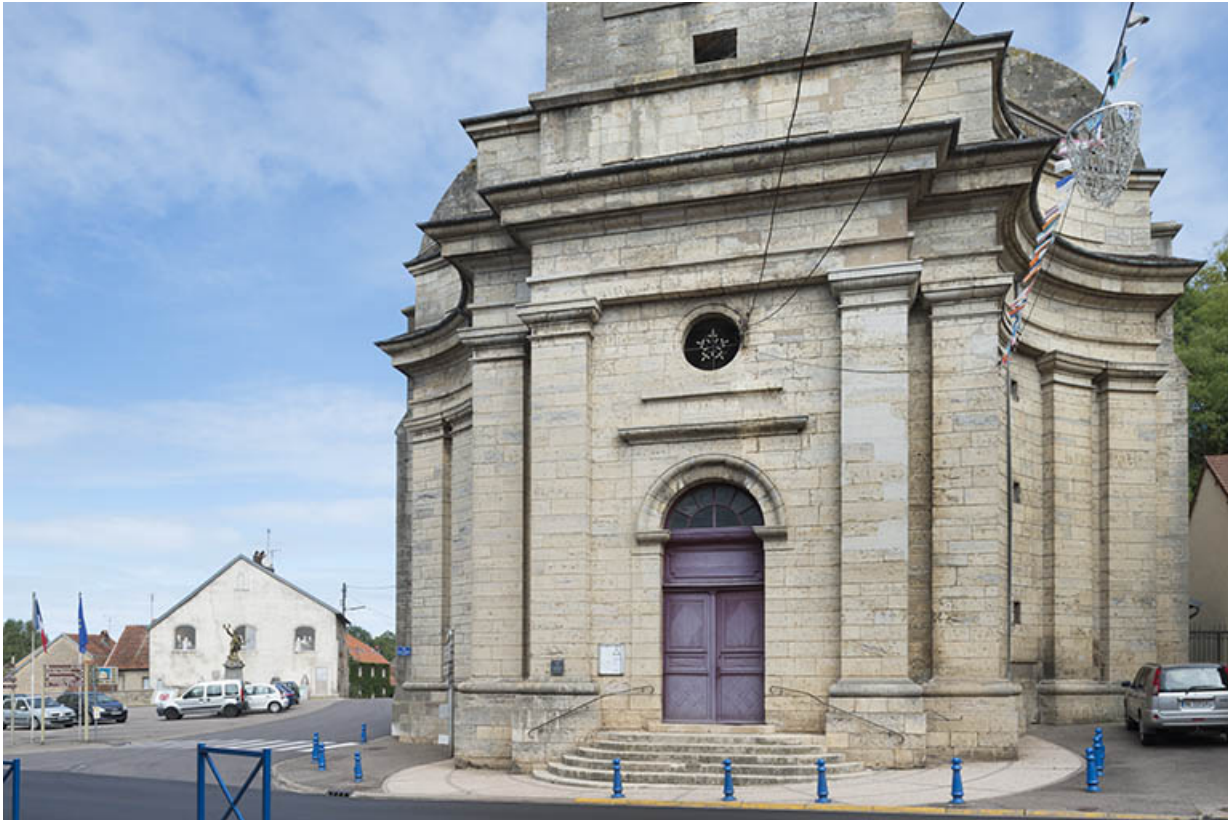
Vue de trois-quart, avec la place accueillant le monument aux morts en arrière plan. 70, Port-sur-Saône Grande Rue