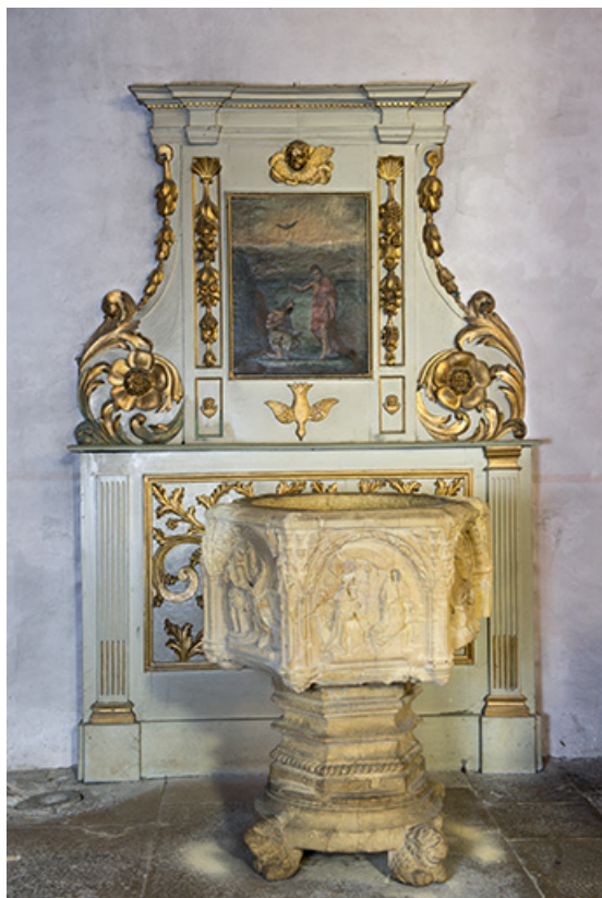
Retable des fonts baptismaux. 70, Port-sur-Saône Grande Rue