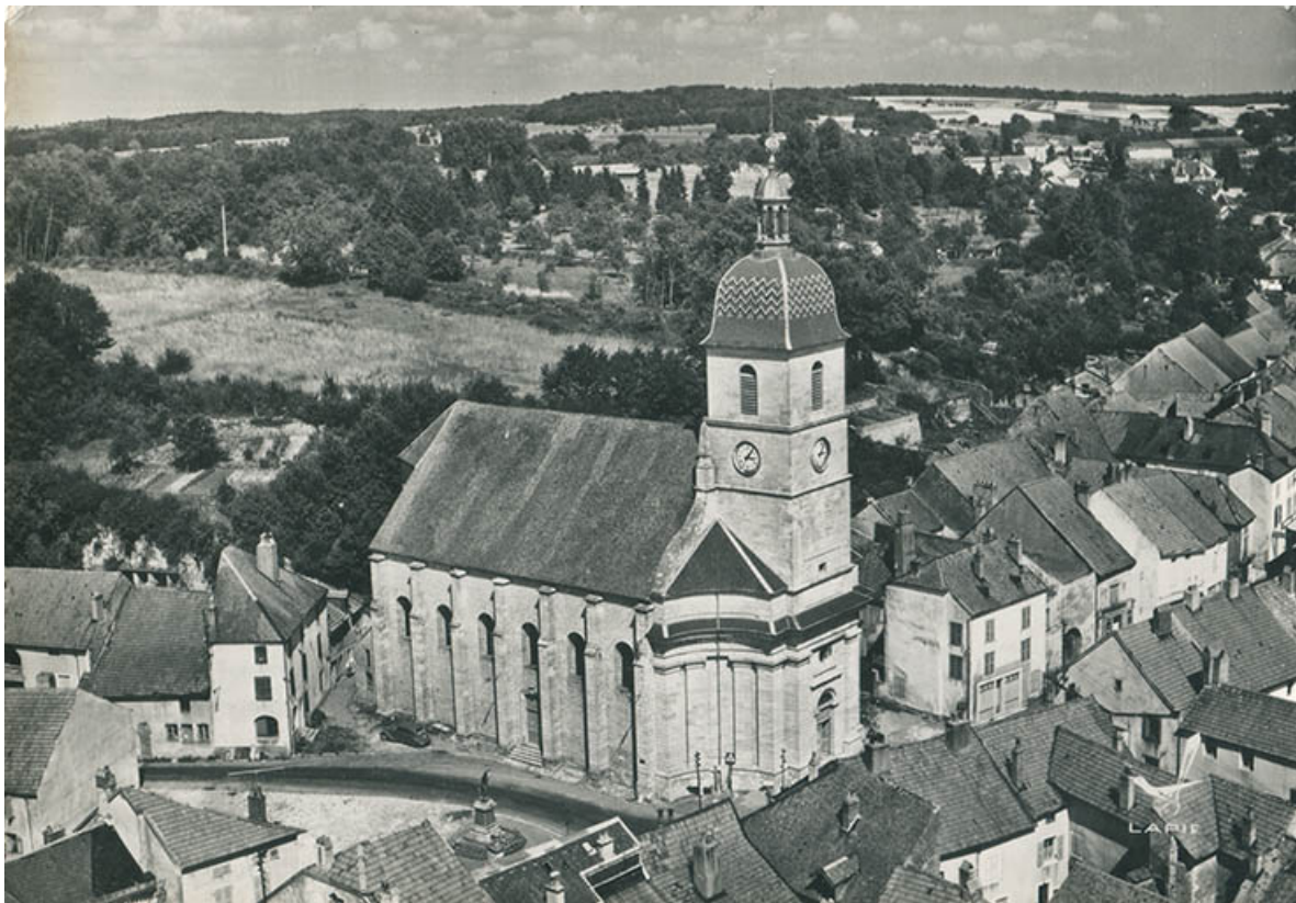
Eglise vue du ciel, carte postale. 70, Port-sur-Saône Grande Rue