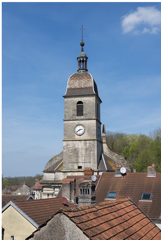
Le clocher avec son toit à l'impérial.