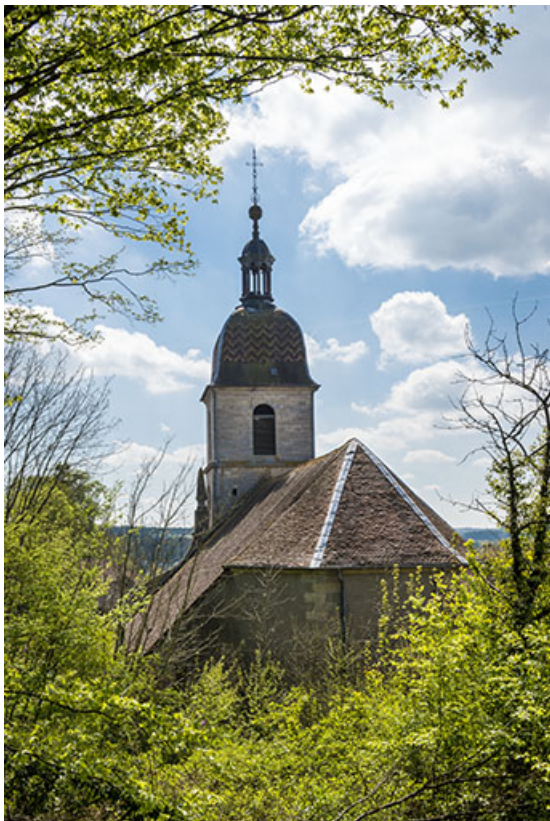
Vue depuis l'ancien cimetière. 70, Port-sur-Saône Grande Rue