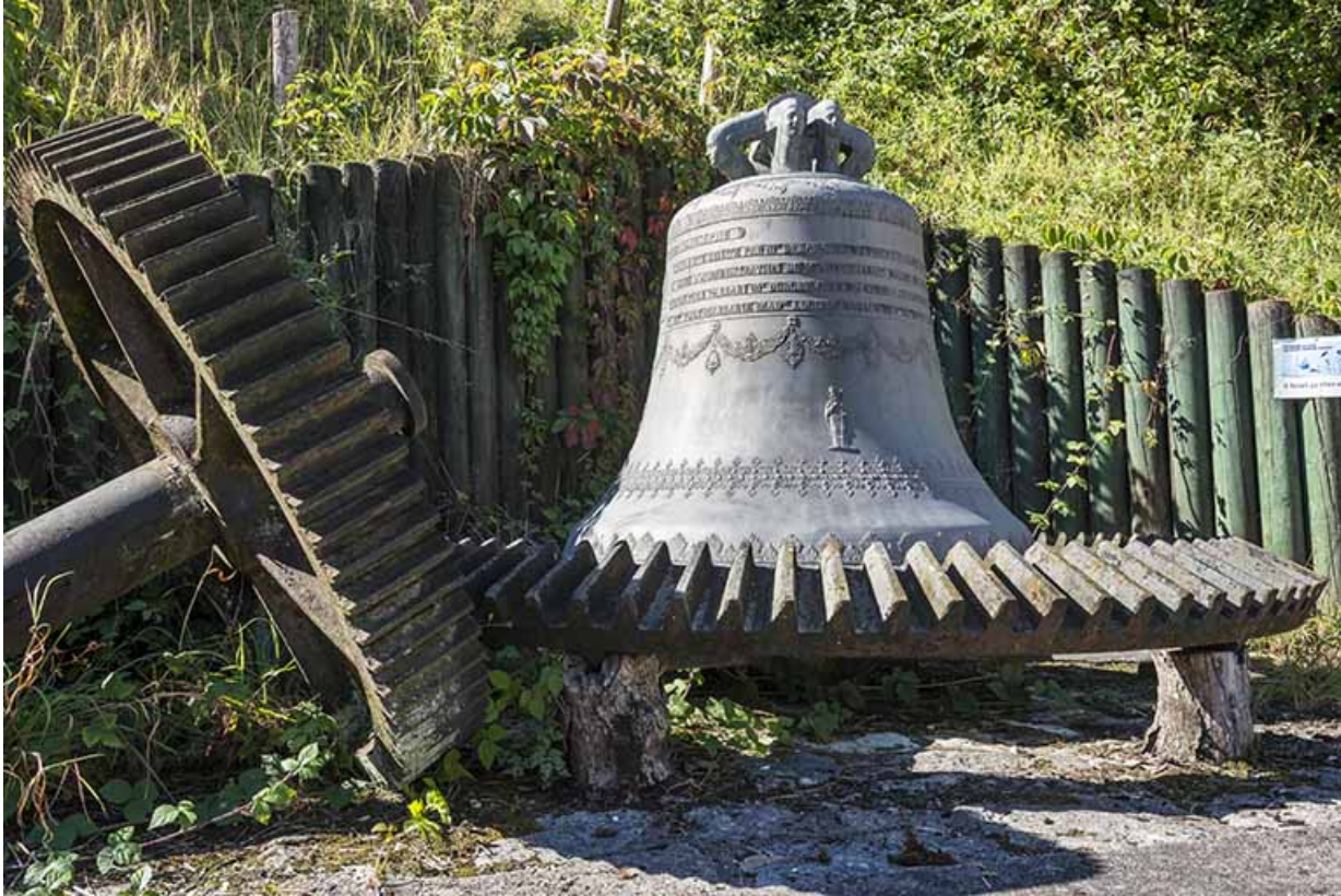
cloche située derrière l'immeuble Madiot. 70, Port-sur-Saône Grande Rue