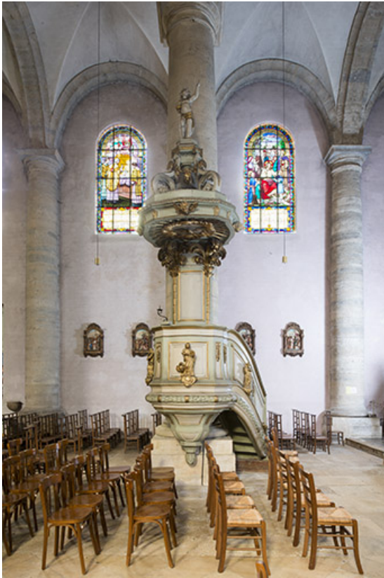
La chaire surmontée de son abat-voix. 70, Port-sur-Saône Grande Rue