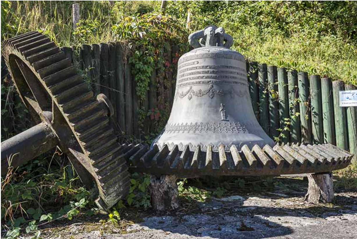
cloche située derrière l'immeuble Madiot. 70, Port-sur-Saône Grande Rue