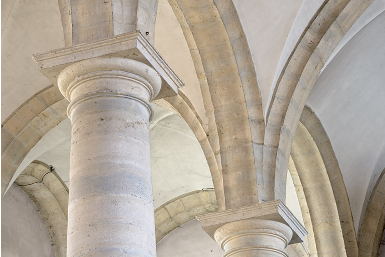
Détail d'une colonne et de son chapiteau. 70, Port-sur-Saône Grande Rue