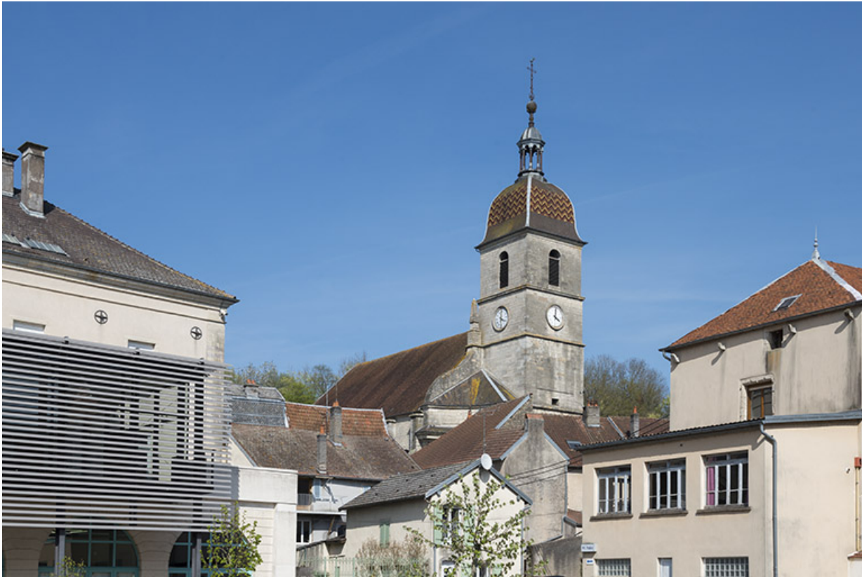
L'église depuis la place située derrière la mairie. 70, Port-sur-Saône Grande Rue