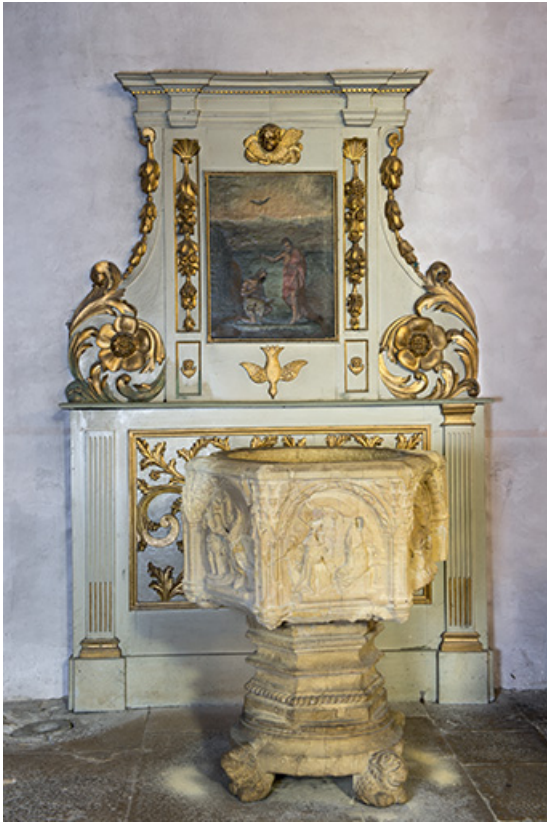
Retable des fonts baptismaux. 70, Port-sur-Saône Grande Rue