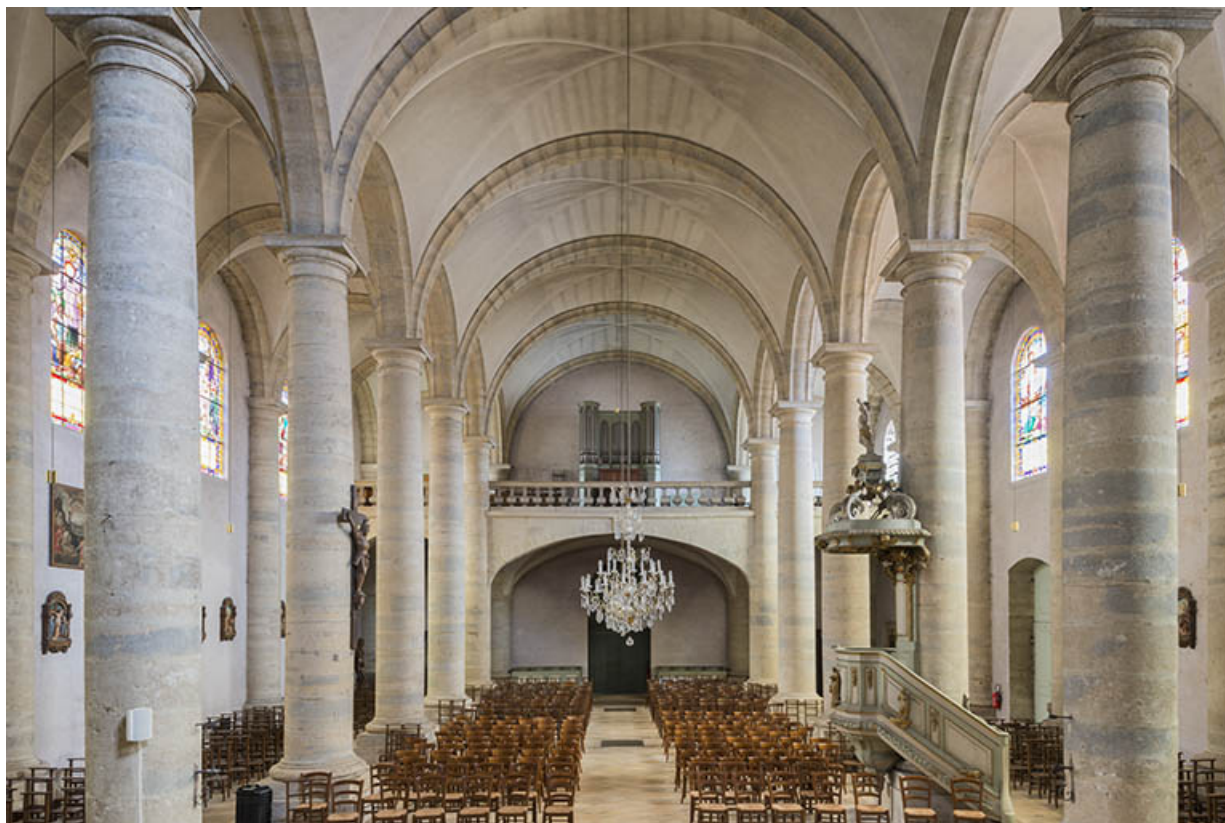
Vue générale de l'église de type halle.