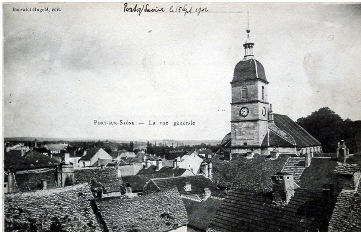
Le clocher de l'église, carte postale.