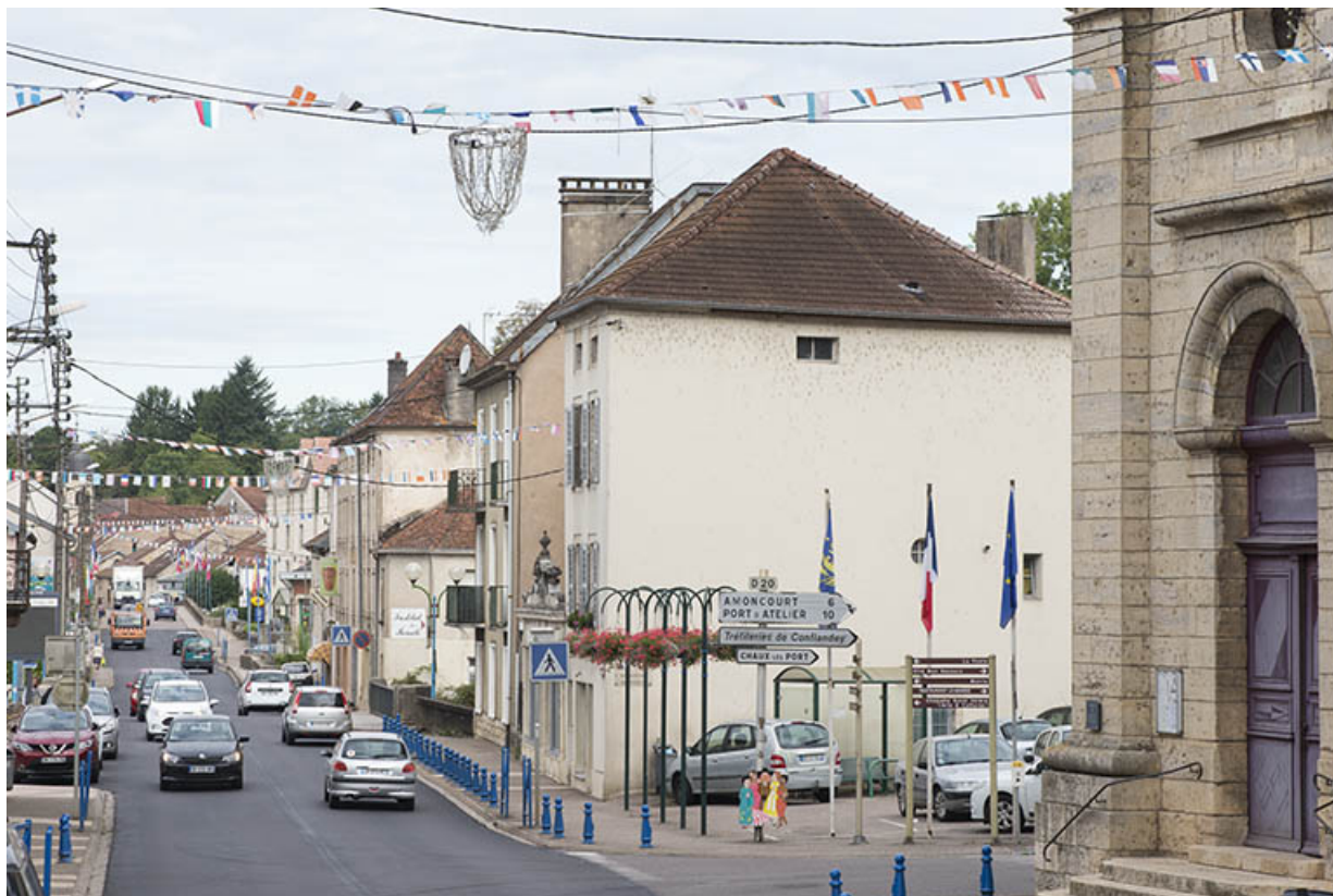
La rue principale depuis l'église. 70, Port-sur-Saône