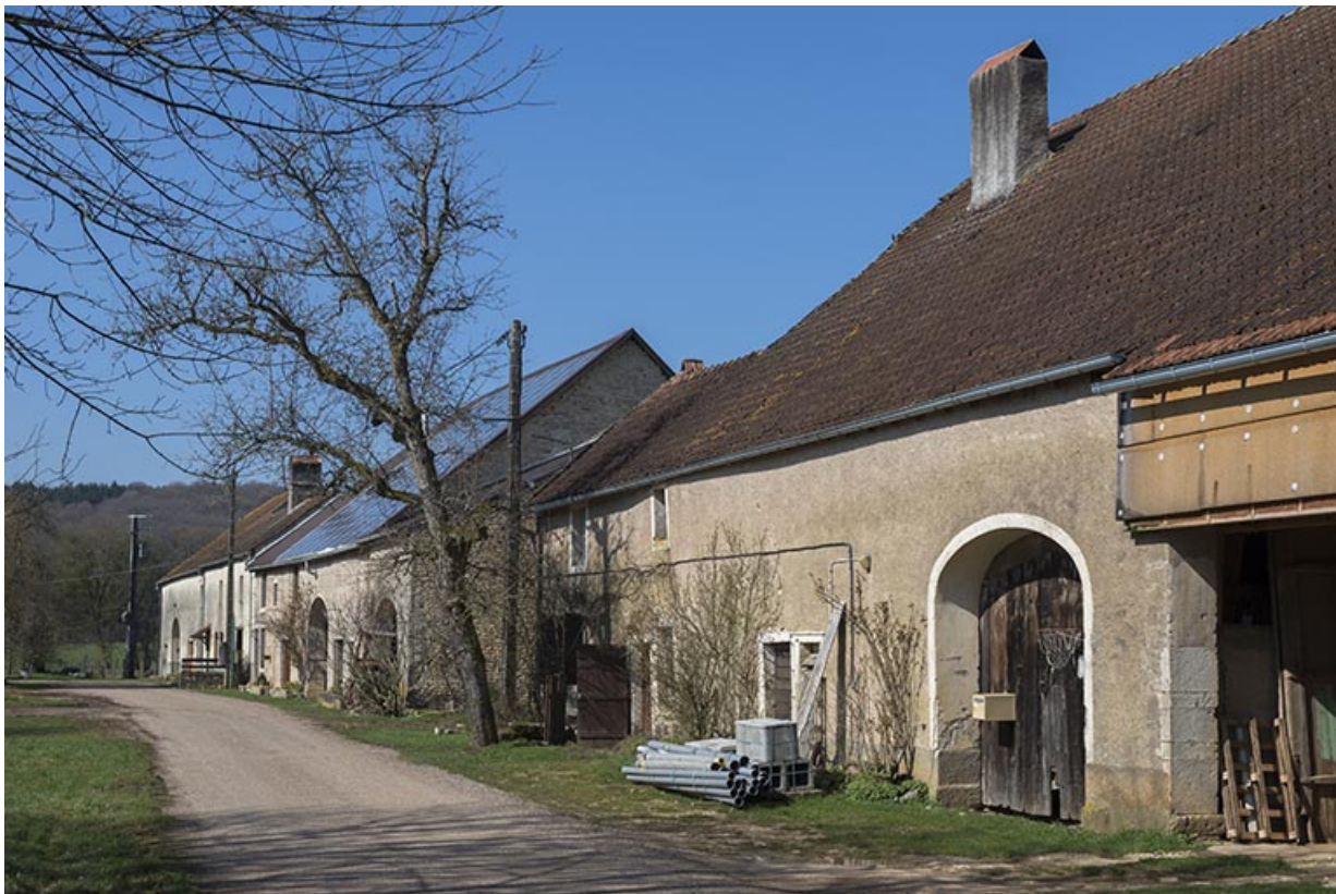
Ferme situés au hameau des Arpents.