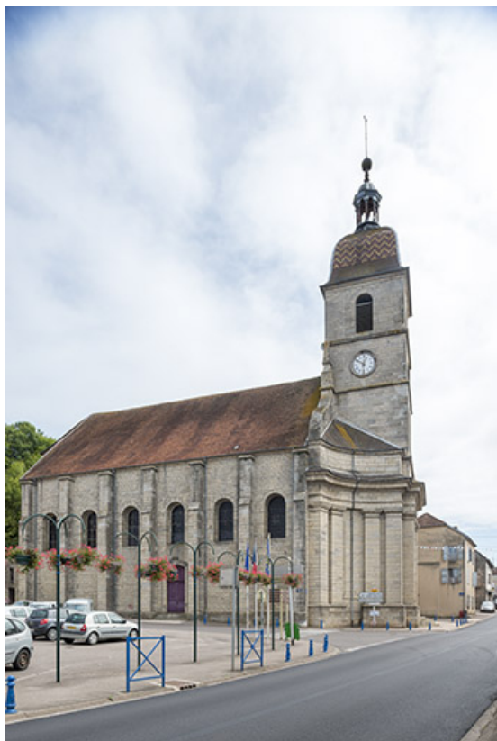
Vue d'ensemble de l'église Saint-Etienne. 70, Port-sur-Saône