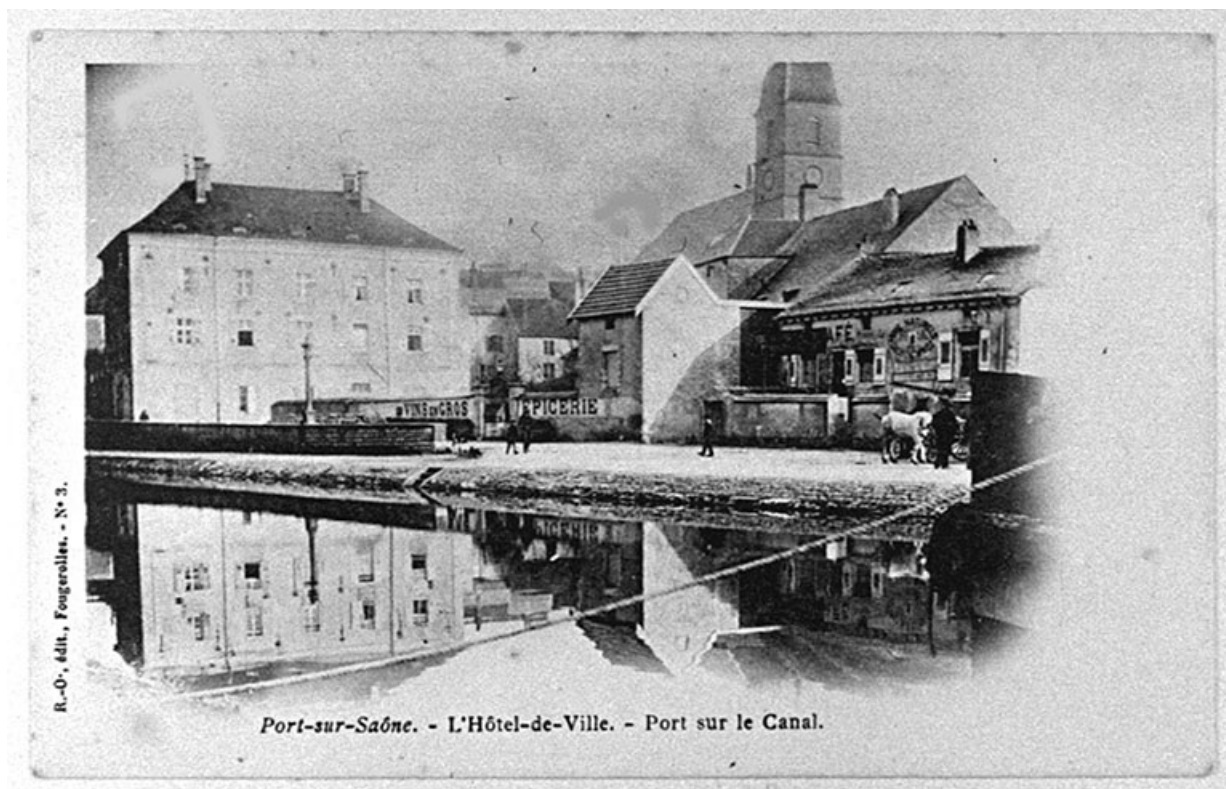
L'hôtel de ville et le port, carte postale.