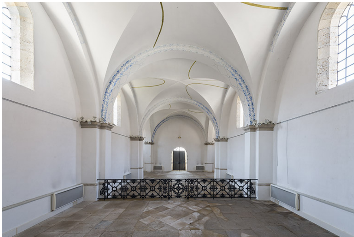
Vue générale de l'intérieur de la chapelle Saint-Valère. 70, Port-sur-Saône