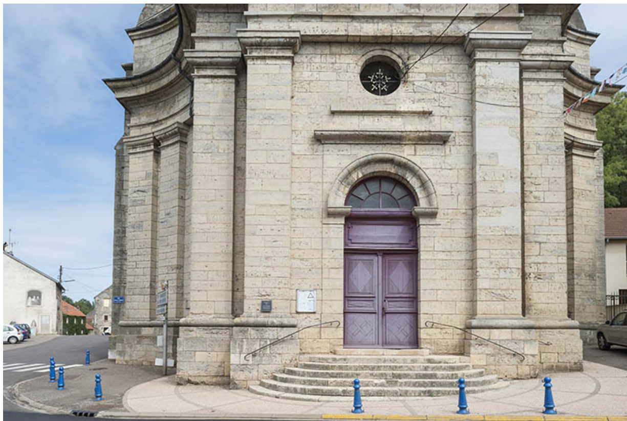
Le portail de l'église paroissiale.