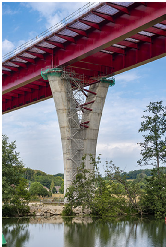
Le viaduc de la déviation de Port-sur-Saône en construction. 70, Port-sur-Saône