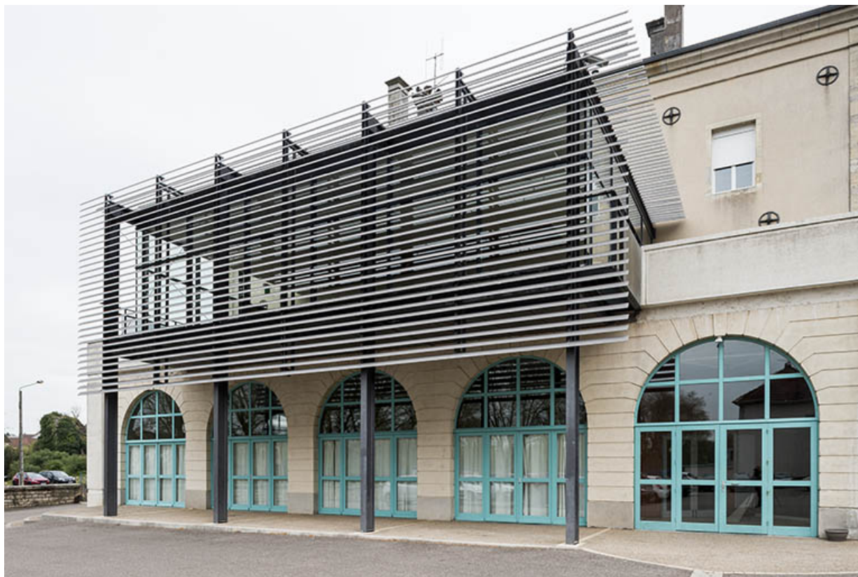
Façade postérieure de l'hôtel de ville. 70, Port-sur-Saône