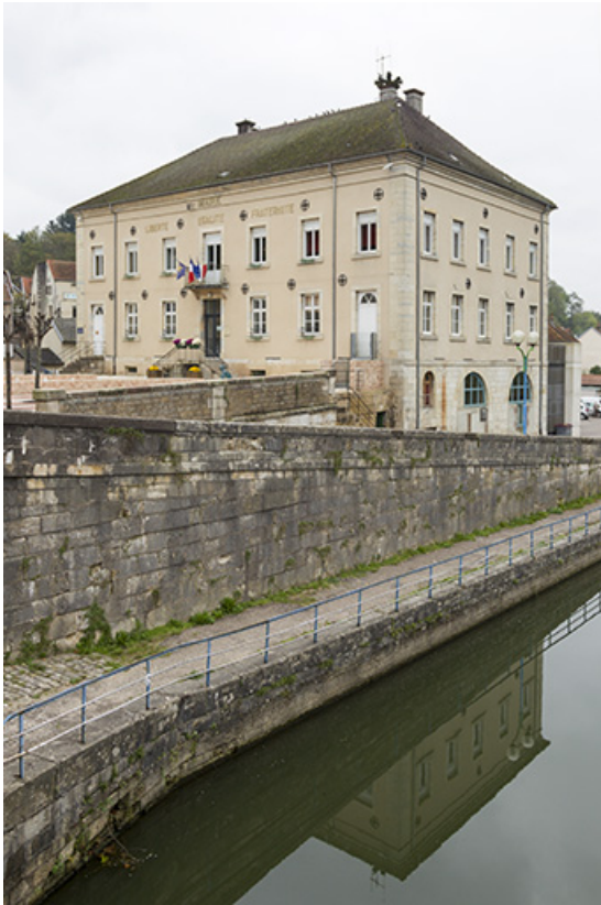
L'hôtel de ville et le bief.