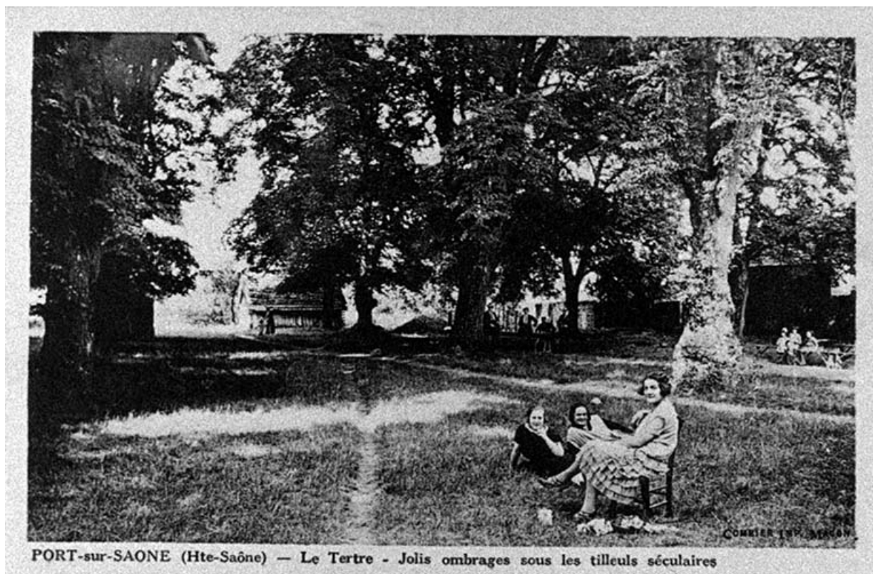
Le parc du Tertre, carte postale.