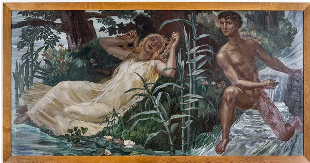
Tableau " La Saône et le Doubs" d'A. Decaris, mairie de Port-sur-Saône. 70, Port-sur-Saône