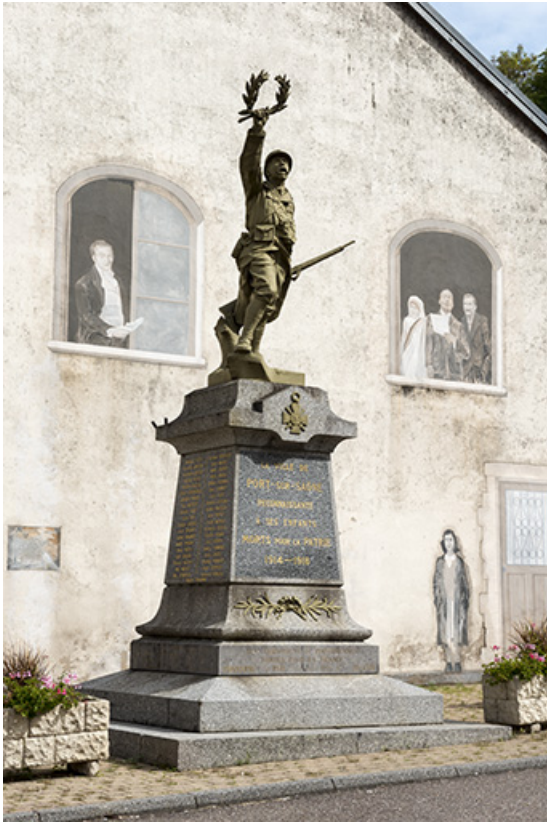
Le monument aux Morts, place de l'église. 70, Port-sur-Saône