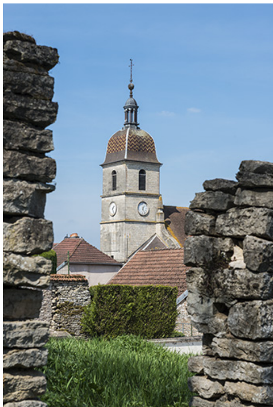
le clocher, vue depuis le Tertre.