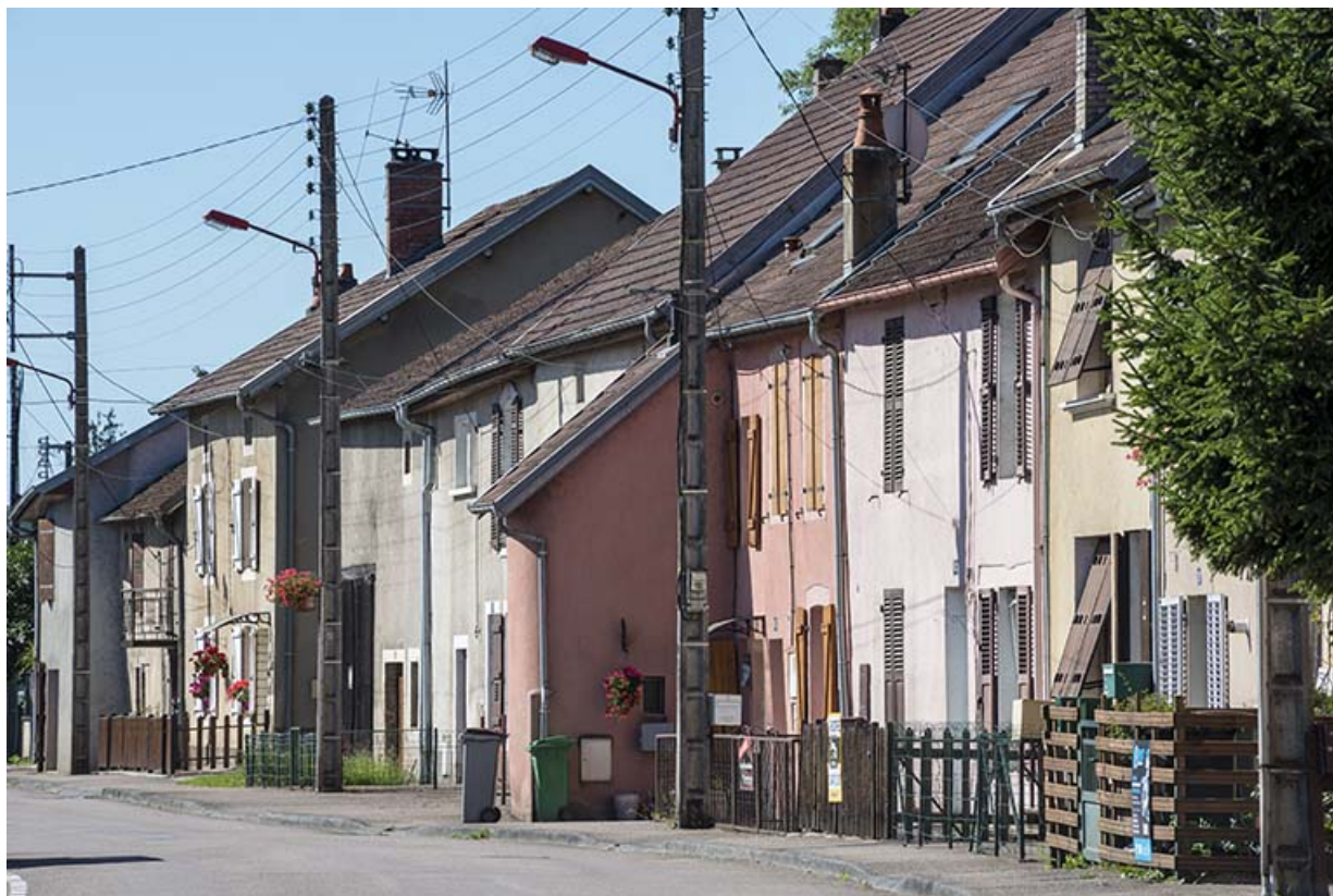
Maisons et anciennes fermes, rue du Magny. 70, Port-sur-Saône