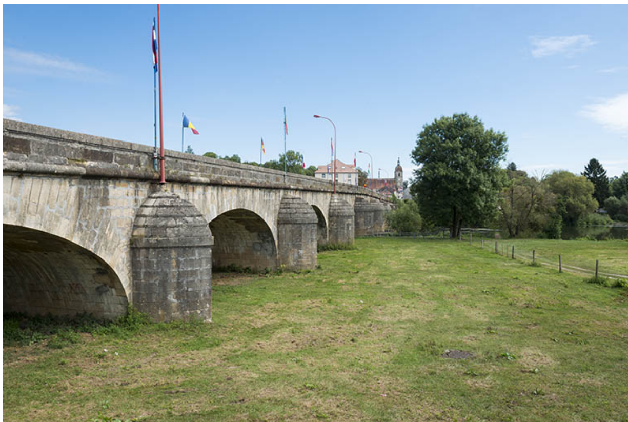
Le pont en pierre. 70, Port-sur-Saône