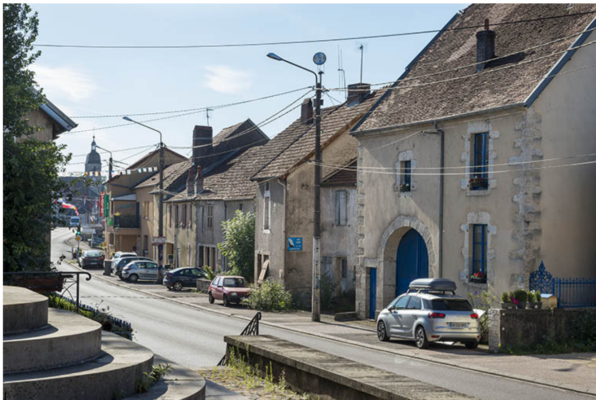
La rue Saint-Valère. 70, Port-sur-Saône