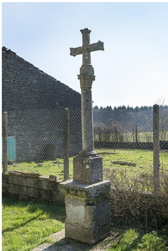
Croix située au hameau des Arpents.