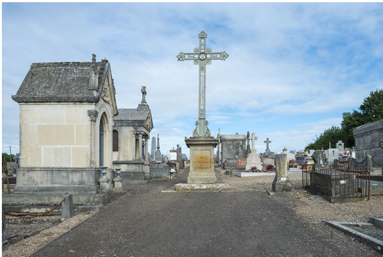
Le cimetière, allée principale. 70, Port-sur-Saône