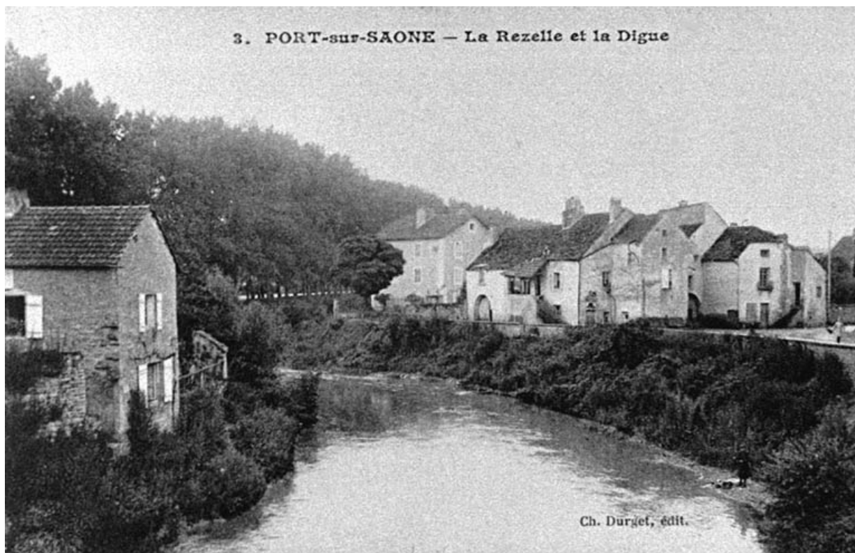
L'île de la Rezelle, carte postale. 70, Port-sur-Saône