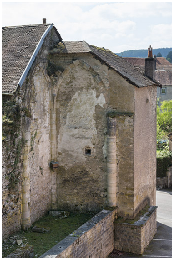
Vestiges de l'ancienne église, rue de l'Eglise. 70, Port-sur-Saône