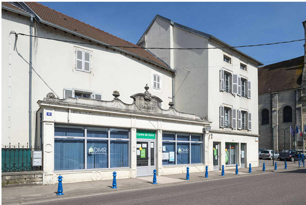
Ancien magasin "le Progrès", rue F.Mitterrand. 70, Port-sur-Saône