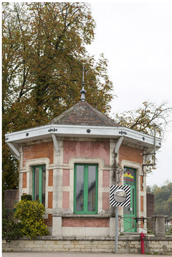
Le kiosque près des Grands moulins.