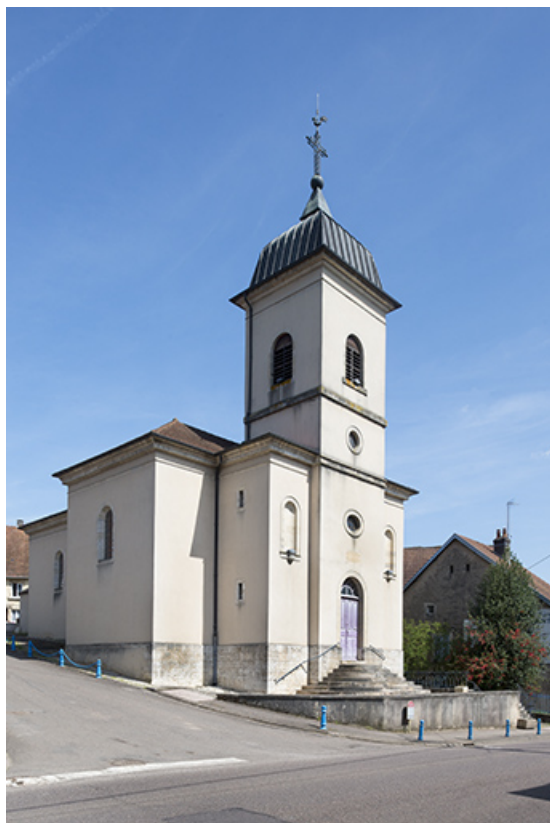
La chapelle depuis la rue Saint-Valère. 70, Port-sur-Saône