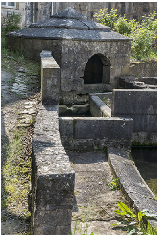
Le lavoir, rue de la Fontaine. 70, Port-sur-Saône