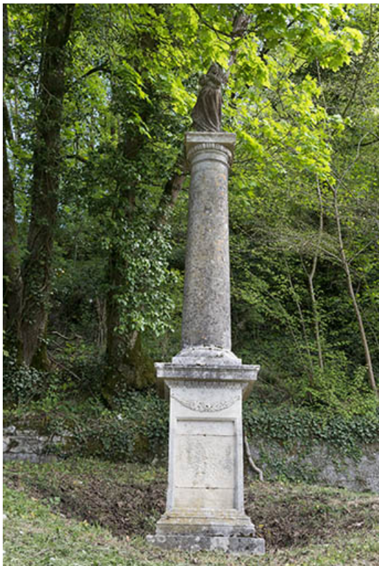
Croix située à l'ancien cimetière, rue de l'Eglise. 70, Port-sur-Saône