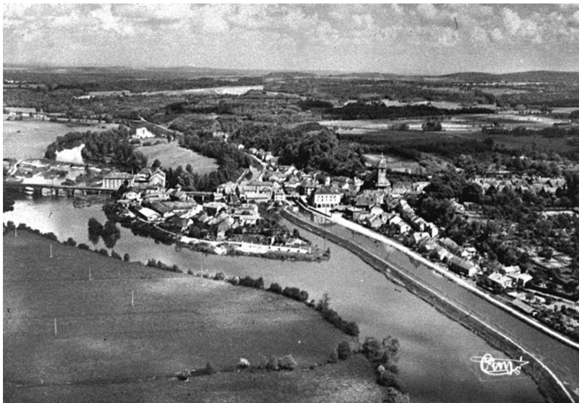
Vue aérienne de Port-sur-Saône, carte postale.