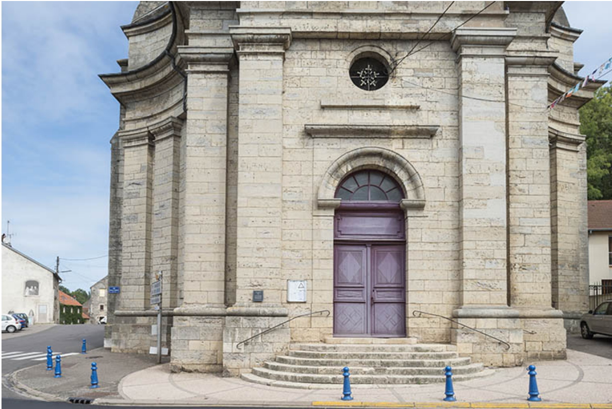
Le portail de l'église paroissiale. 70, Port-sur-Saône