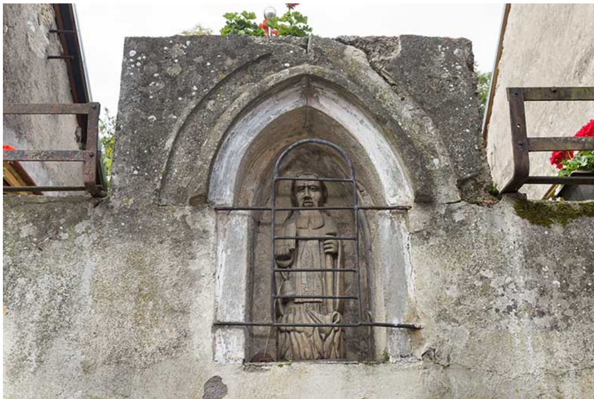
Statue représentant Saint-Antoine.