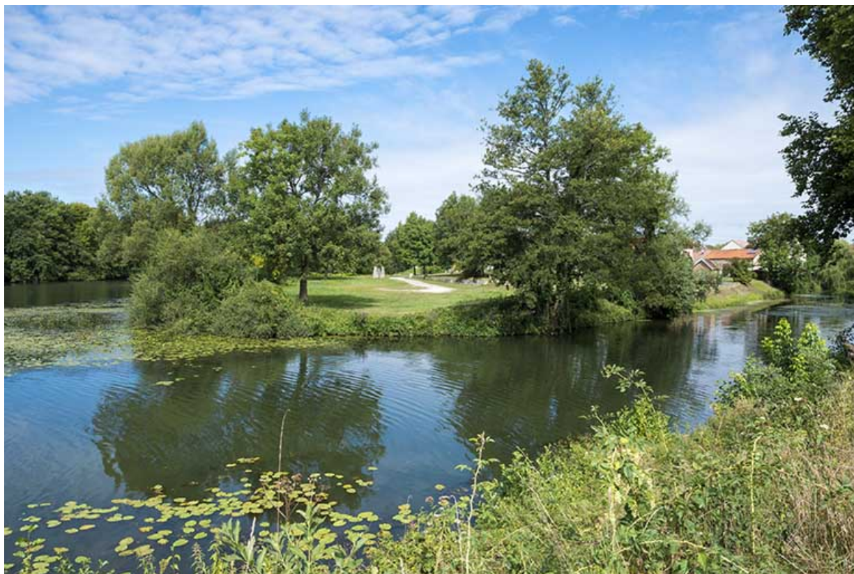
L'île de la Rezelle, vue depuis la digue. 70, Port-sur-Saône