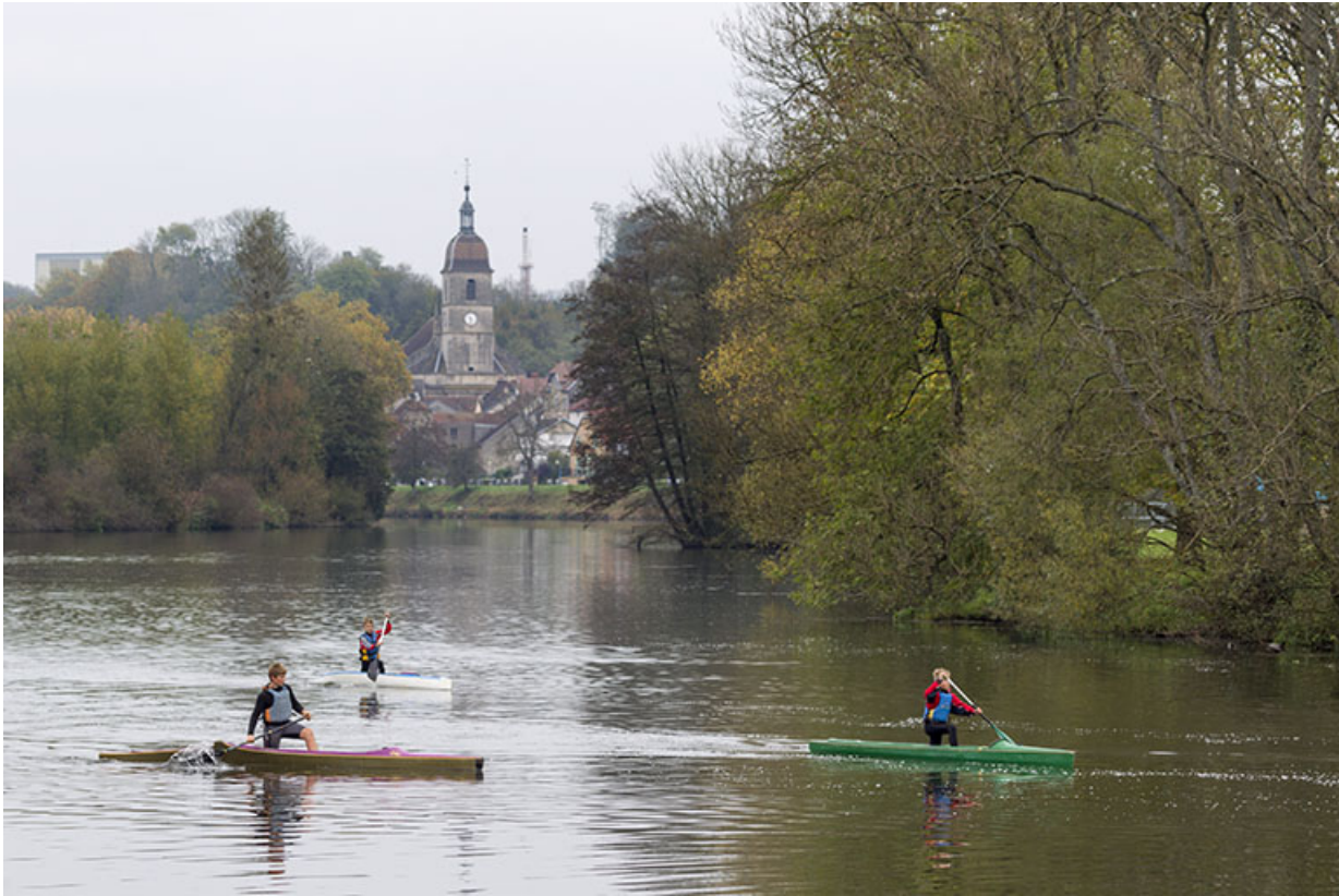
La saône et l'église Saint-Etienne de Port-sur-Saône. 70, Port-sur-Saône