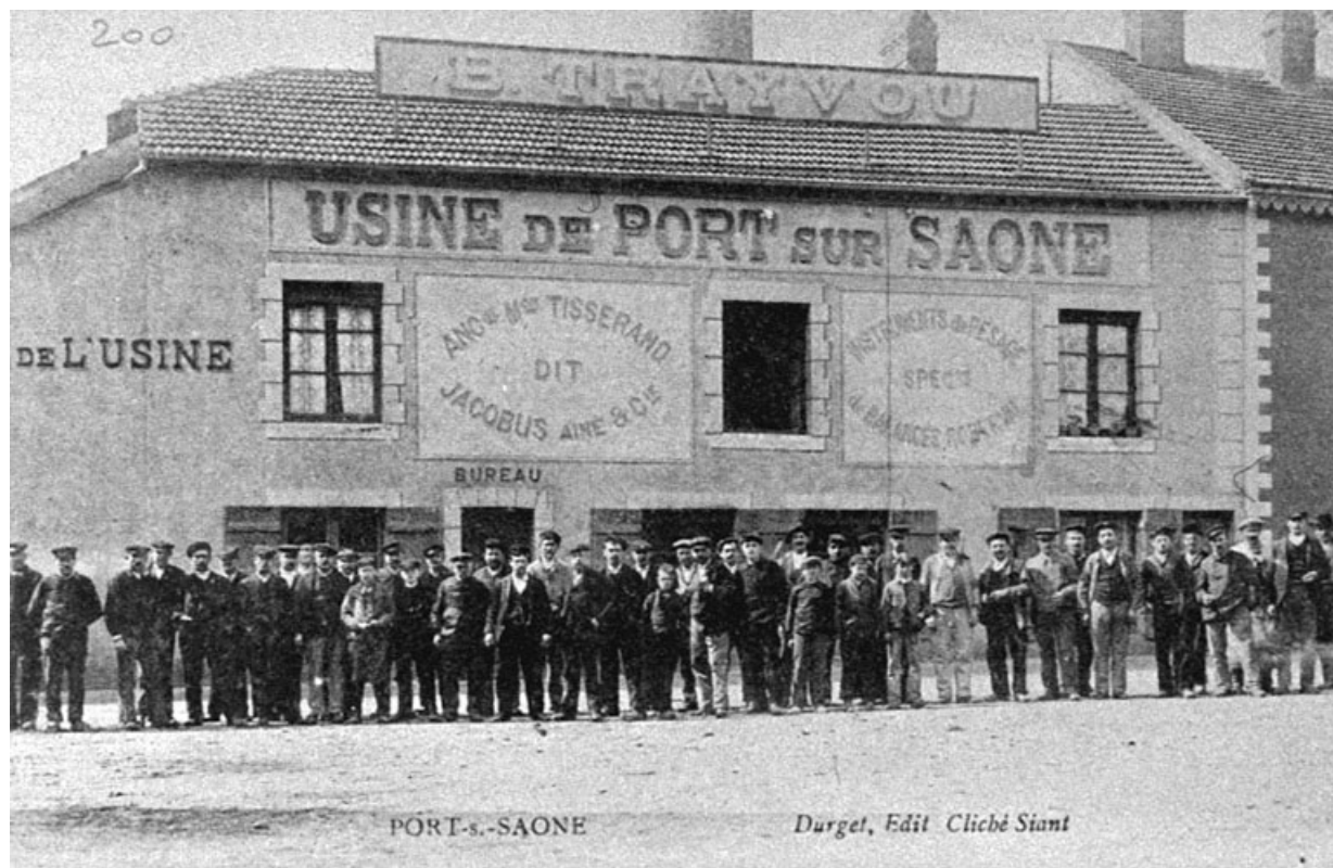
L'usine Trayvou, carte postale.