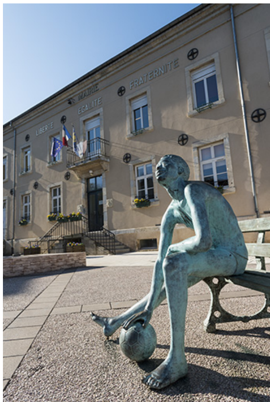
Façade principale de la mairie.