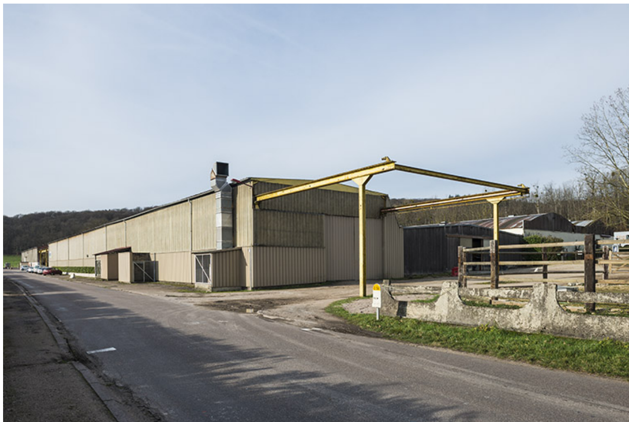
Hangar de la société Selam, route de Ferrières. 70, Port-sur-Saône