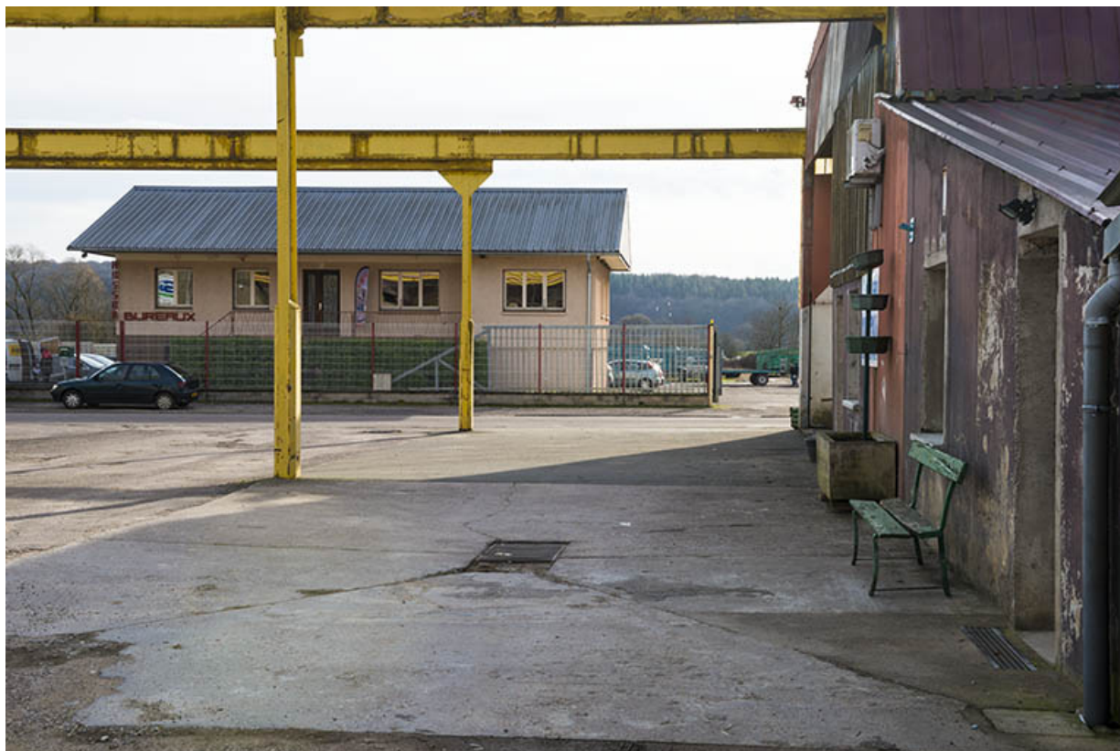
Les anciens bureaux de la société Selam, route de Ferrières. 70, Port-sur-Saône