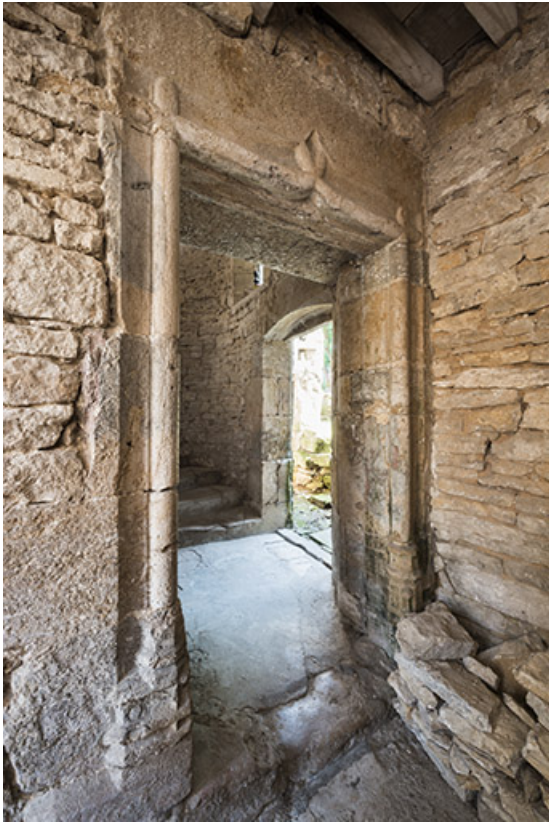
Porte d'accès vers l'escalier de l'ancien prieuré. 70, Port-sur-Saône