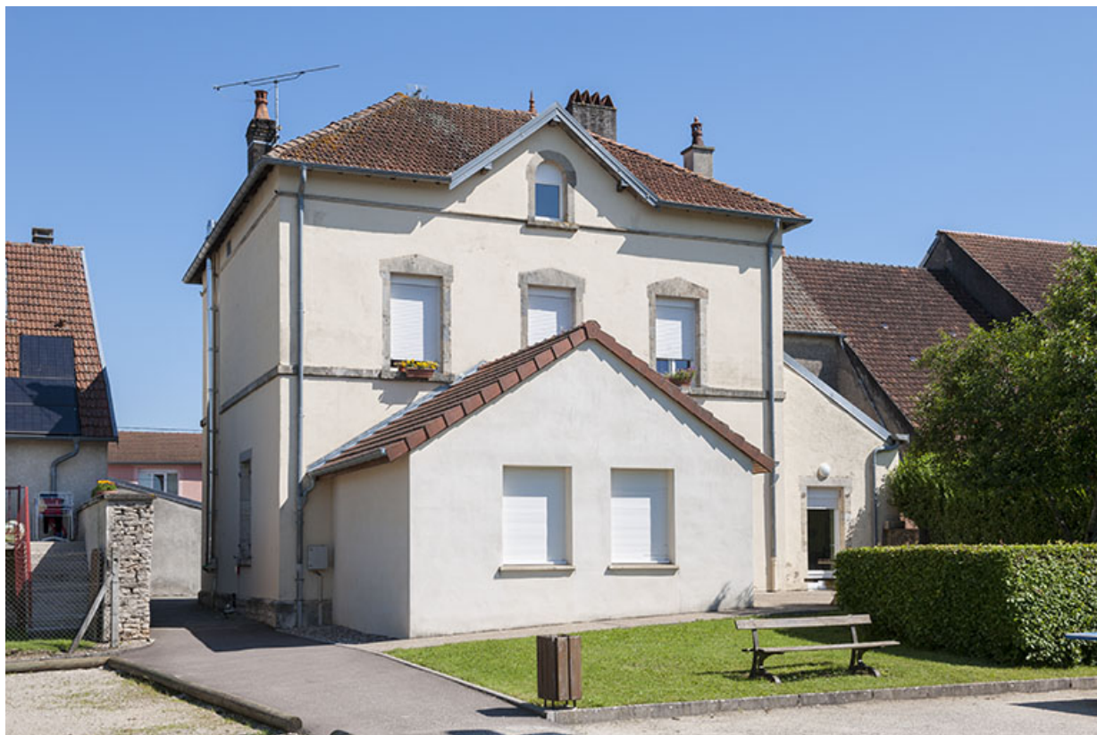
Façade postérieure avec l'agrandissement contemporain.