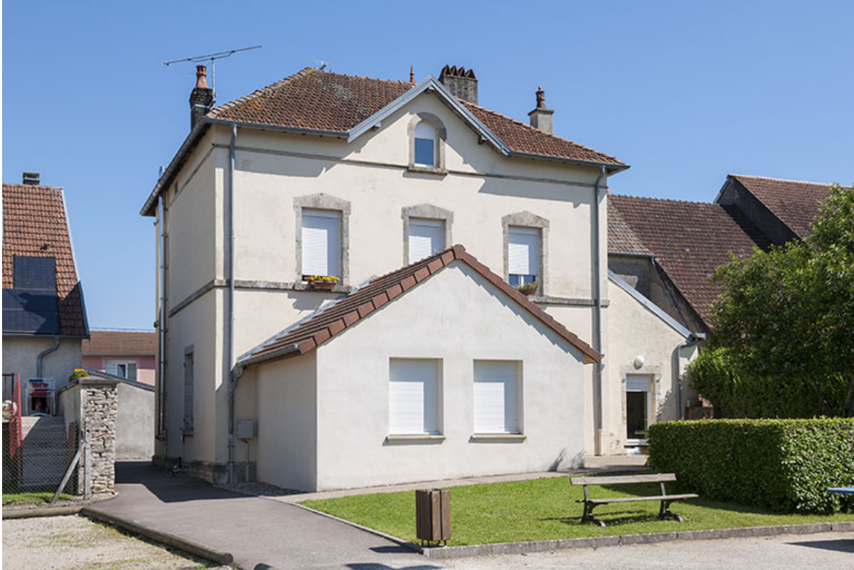
Façade postérieure avec l'agrandissement contemporain.