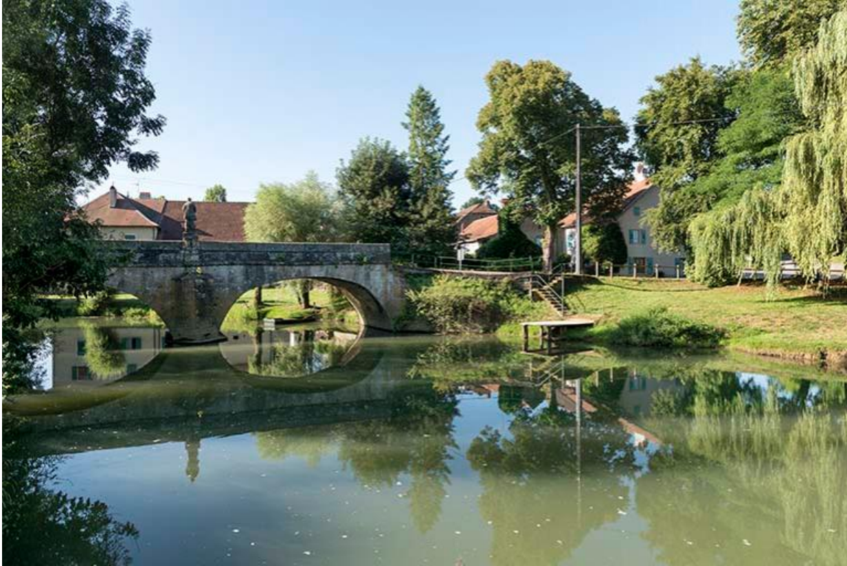
Vue d'ensemble du pont et de la statue de dos 70, Chemilly