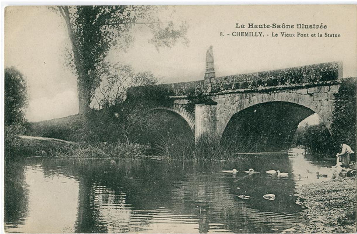
Le pont et la statue de Chemilly