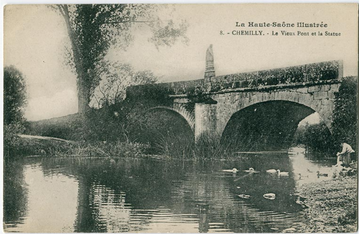
Le pont et la statue de Chemilly 70, Chemilly