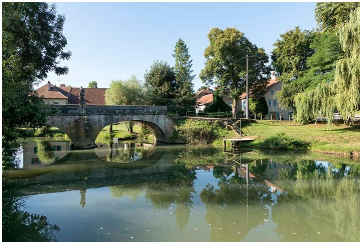
Vue d'ensemble du pont et de la statue de dos 70, Chemilly