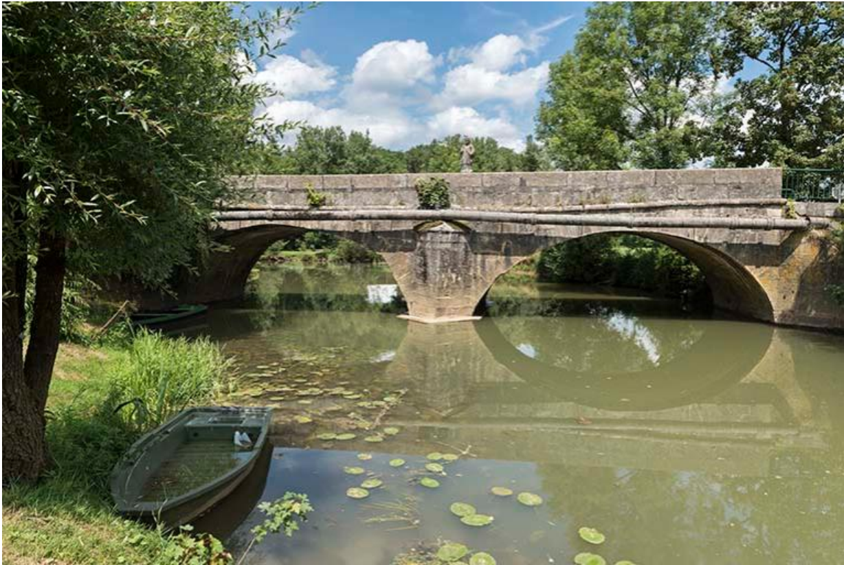
Pont sur le Durgeon