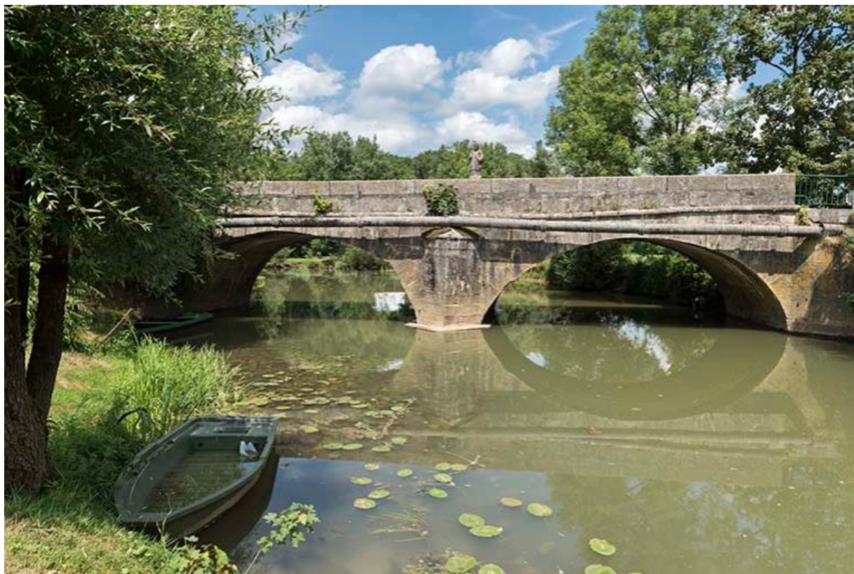
Pont sur le Durgeon