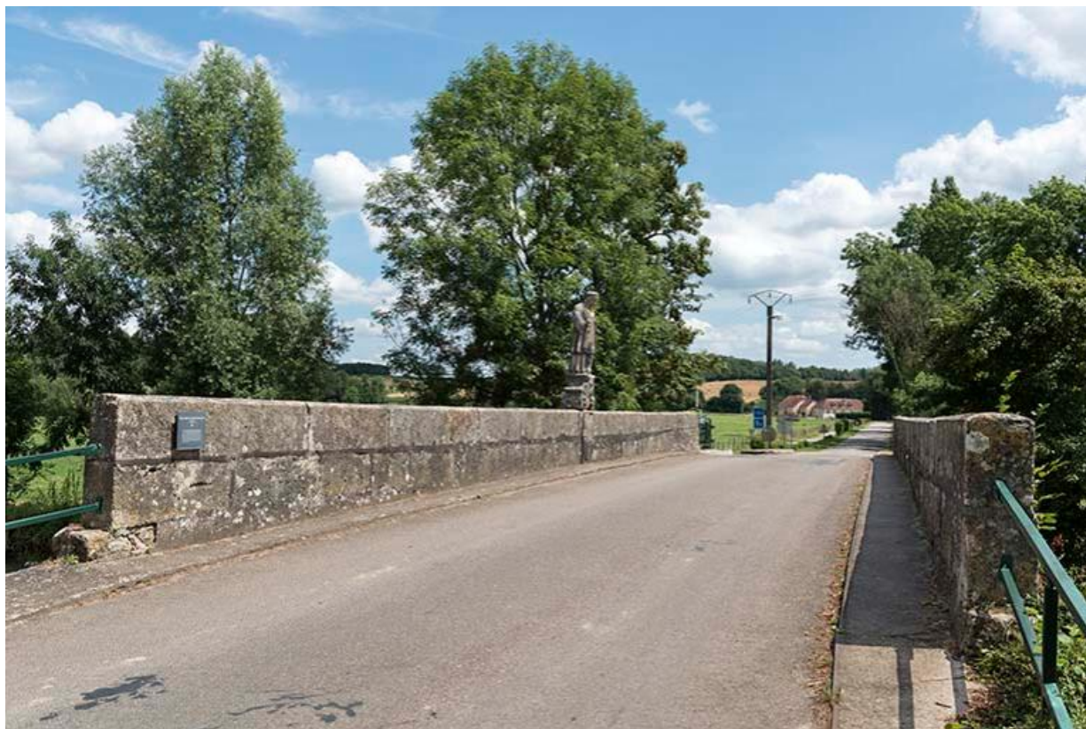
Vue d'ensemble du pont et de la statue 70, Chemilly