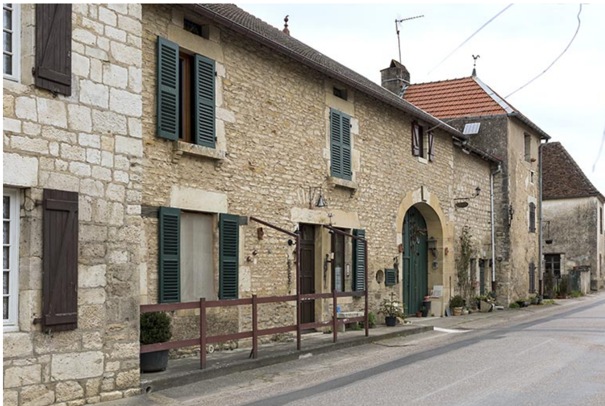
Vue générale de trois quarts gauche. 70, Rupt-sur-Saône