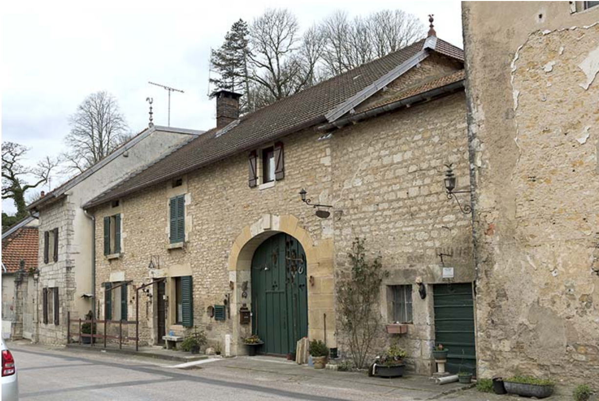
Vue générale de trois quarts droite.